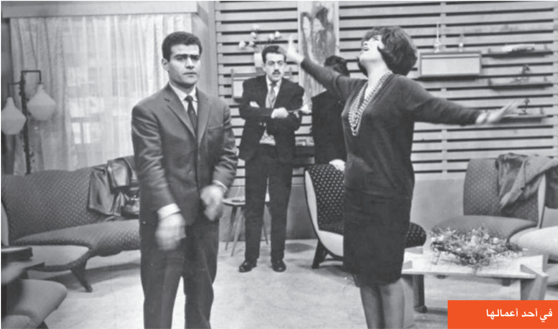
في أحد أعمالها

لو لم توافق والدتي لما كان باستطاعتي دخول عالم الفن... وأبي لم يكن يمتلك الكلمة الأولى