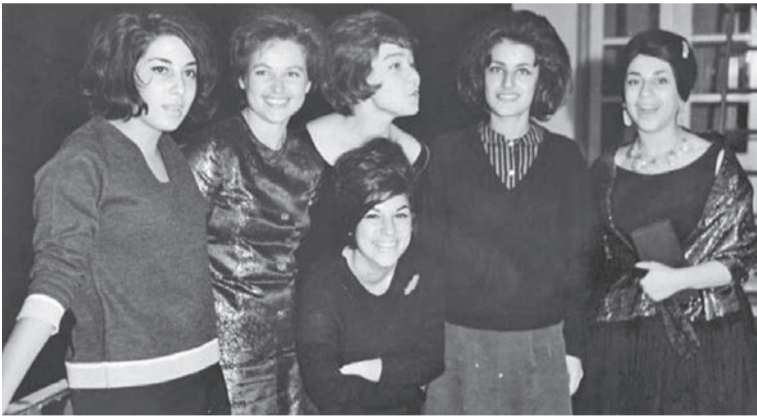
... في شباعها

عندما تسأل عن فنانة وممثلة سورية قديرة فأول اسم يلتمع على جدران الذاكرة هو «منى واصف». وعندما تسأل عنها فإن أول ما يخطر في البال الشام ودمشق العاصمة وكل هوى سوري من الشمال إلى الجنوب. منى والشام في تمامه ومحبة لا يُفترق أي منهما بها. ثم يبدأ مباشرة شريط الذكريات عند كل جيل، بدءاً من الأبيض والأسود إلى الملون إلى الشاشة العالية الدقة. من صرخة منيرة في «أسعد الوراق»، إلى الأم المثالية في «أمهات»، إلى المرأة الهيبية ناهد (أم جيل)... وما زال العطاء والطموح مستمرين. تكمل اليوم حوارنا مع النجمة منى واصف، وما زلنا في سنوات النضرة الأولى وعلاقتها بوالدها.