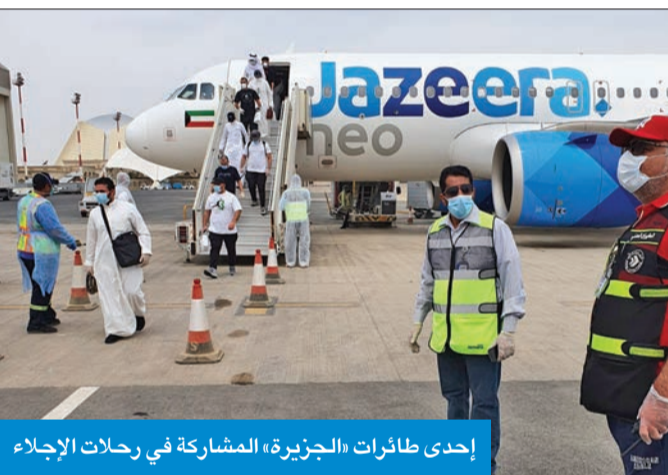
إحدى طائرات «الجزيرة» المشاركة في رحلات الإجلاء

أعلنت شركة طيران الجزيرة أنها أعادت أكثر من 6800 مواطن على متن حوالي 60 رحلة إجلاء، قامت بتنفيذها بين 25 مارس و10 مايو، دعماً للجهود التي تقوم بها الكويت لإعادة جميع المواطنين العالقين خارج البلاد بسبب أزمة فيروس كورونا.