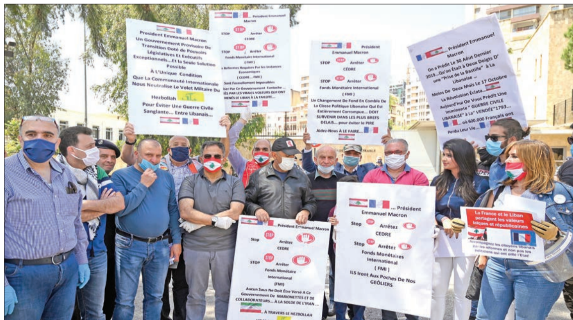
تظاهرة أمام السفارة الفرنسية في بيروت تطالب باريس بوقف دعم الحكومة معتبرين أنها تتبع إيران وحزب الله