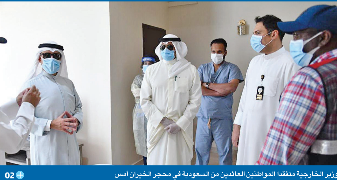
وزير الخارجية متفقد المواطنين العائدين من السعودية في محجر الخيران أمس