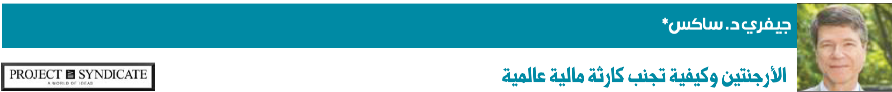
جيفري د. ساكس*