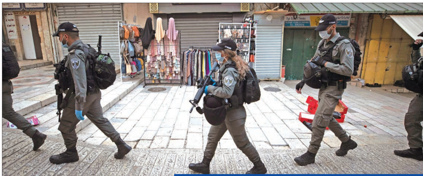
دورية لحرس الحدود الإسرائيلي في القدس القديمة مساء أمس الأول (أي بي إيه)

السيادة الإسرائيلية لتشمل المستوطنات اليهودية وغور الأردن في الضفة الغربية، وهو ما جرى بحثه في إطار خطة ترامب للسلام في الشرق الأوسط المعروف باسم «صفقة القرن»، التي حذر الفلسطينيين من أنها ستقتل آمال إحلال السلام على المدى البعيد.