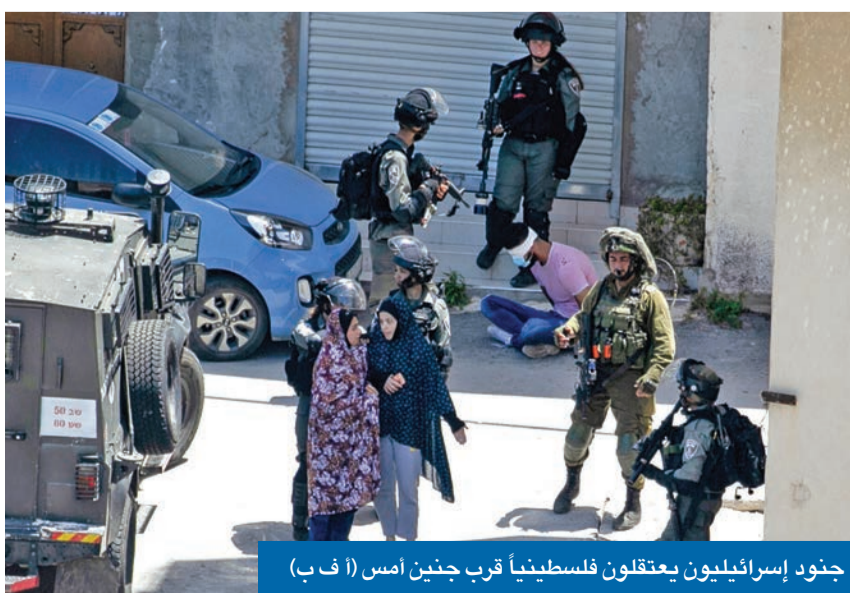
جنود إسرائيليون يعتقلون فلسطينياً قرب جنين أمس

في أول زيارة خارجية له منذ تفشي «كورونا»، يصل اليوم إلى إسرائيل وزير الخارجية الأميركي مايك بومبيو، وذلك عشية أداء حكومة بنيامين نتنياهو وبيني غانتس اليمين منهيّة أطول أزمة سياسية في تاريخ الدولة العبرية. وفي حين يُتخَطَّر أن تركز الزيارة على نية إسرائيل ضم مناطق بالضفة الغربية في خطوة قد تزيد العراقيل أمام خطة «صفقة القرن» التي أطلقها الرئيس الأميركي دونالد ترامب، أعلن الجيش الإسرائيلي أمس مقتل جندي