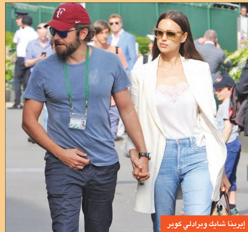
إيرينا شايك وبرادلي كوبر

الموضوع، خصوصاً أن صورة التقطتها كاميرات عدسات المصورين البارائزي، في فرنسا، حيث ظهر كوبر على طاولة الغداء، مع شخص ذي شعر أشقر رمادي طويل، ظن البعض أنها قد تكون ليدى غاغا، نسبة لتسريحة الشعر. لكن تقارير اعلامية، بينت أن هوية "السيدة" التي ظهرت في الصورة، هي للفنان الإيرلندي جوجي، الذي صادف أن تسريحة شعره تشبه تسريحة غاغا وهذا ما وضحه أحد الأشخاص، في "بوست" نشره على إحدى صفحاته على مواقع التواصل الاجتماعي.