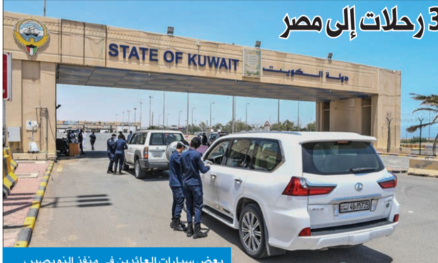
بعض سيارات العائدين في منفذ النويصيب

340 بنغلادشياً غادروا أمس... و3 رحلات إلى مصر