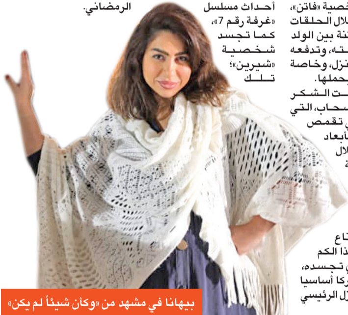
بيهاننا في مشهد من «وكان شيئاً لم يكن»

الفنانه اللبنانية التي تزوج كويتياً طعماً في ثروتها، مترقبة استئناف تصوير المسلسل بعد انتهاء أزمة كورونا، إن توقف العمل بهما، مما حال دون خوضهما السياق الرضائي.