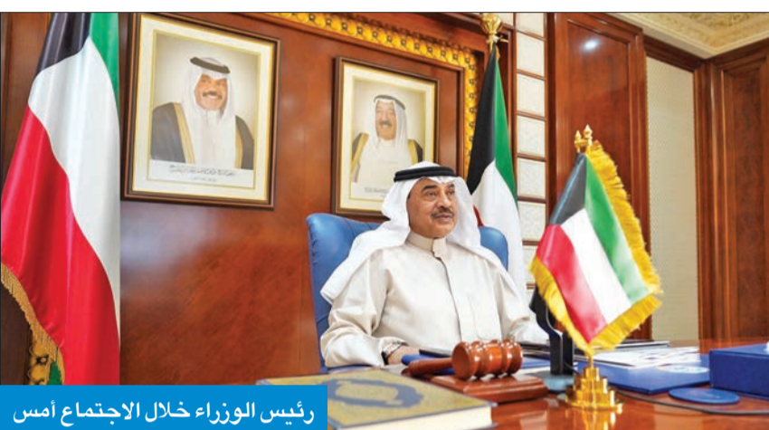
رئيس الوزراء خلال الاجتماع أمس

ومن جانب آخر، قدم وزير النفط وزير الكهرباء والماء خالد الفاضل وزيراً للكهرباء وأصبح على قطاع الكهرباء والماء في مواجهة فصل الصيف، معنياً عن شكره للجهود المخلصة التي يقومون بها في سبيل أداء مهامهم وواجباتهم.