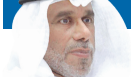
د. محمد المقاطع

في حادث مؤلم، عثر على طيبة من ولاية جورجيا أميركية مبيتة في حفرة، بعد أن هاجمتها مجموعة من الكلاب. وتم العثور على الطيبة ناسية شو، 62 سنة، جثة هامة على جانب طريق في بلدة ليون الصغيرة، جنوب شرقي مدينة أتلانتا، في الساعات الأولى من يوم الخميس الماضي. وقالت موقع روسيا اليوم