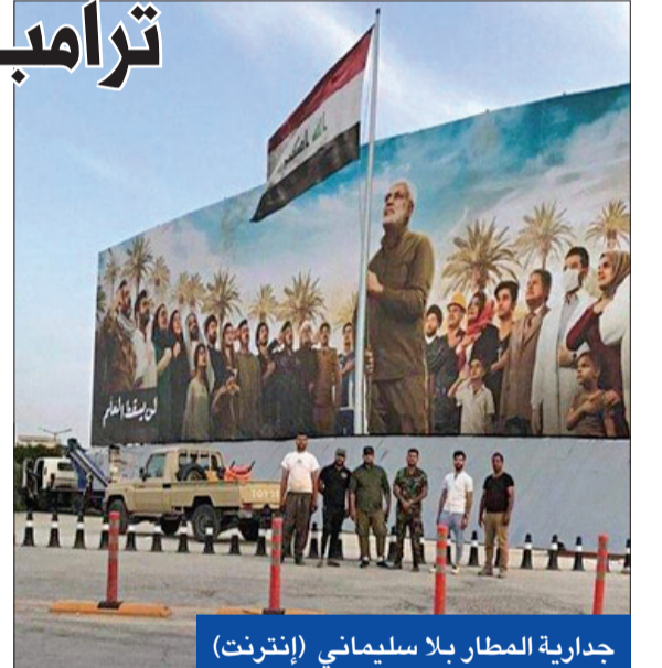
جدارية المطار بلا سليمان

تلقى رئيس الوزراء العراقي مصطفى الكاظمي، أمس الأول، دعماً مهماً من الرئيس الأميركي دونالد ترامب "شجعه فيه على تلبية مطالب الشعب العراقي في الإصلاح وإجراء انتخابات وطنية شرعية مبكرة". وقال نائب المتحدث باسم البيت الأبيض جود ديري، في بيان، إن ترامب أجرى اتصالاً هاتفياً هنا فيه الكاظمي على منح الثقة لحكومته من قبل مجلس النواب، وأكد الاهتمام المشترك مع العراق بتحقيق الهزيمة الدائمة لتنظيم "داعش"، ودعم الولايات المتحدة له في مواجهة انتشار فيروس كورونا. وفيما أكد الرئيس الأميركي أن "العراق بلد قوي ومهم، ويمتلك دوراً مركزياً في المنطقة وفي تحقيق الاستقرار الإقليمي والدولي"، وعد الكاظمي بأنه سيحرص على إقامة أفضل العلاقات مع الولايات المتحدة. من جهة ثانية، أظهرت وثائق صادرة عن مكتب الكاظمي أمس قرارات بتكليف عدد من الوزراء للحقائب الشاغرة بالوكالة إلى حين تسمية مرشحين لها.