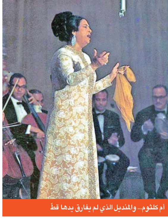
أم كلثوم... والمنديل الذي لم يفارق يدها قط

عرفت نجاه طريق الاحتراف منذ كانت في السابعة من عمرها، وتحولت الطفلة الصغيرة إلى أيقونة فنية في منتصف الأربعينيات من القرن الماضي، وأطلق عليها «عجزة القرن العشرين». وتعددت أسرتها بنظام صارم لتدريبها على الغناء، وباتت ممنوعة من اللعب مثل أقرانها، وأدهشت جمهور الحفلات بموهبتها في تقليد أم كلثوم.