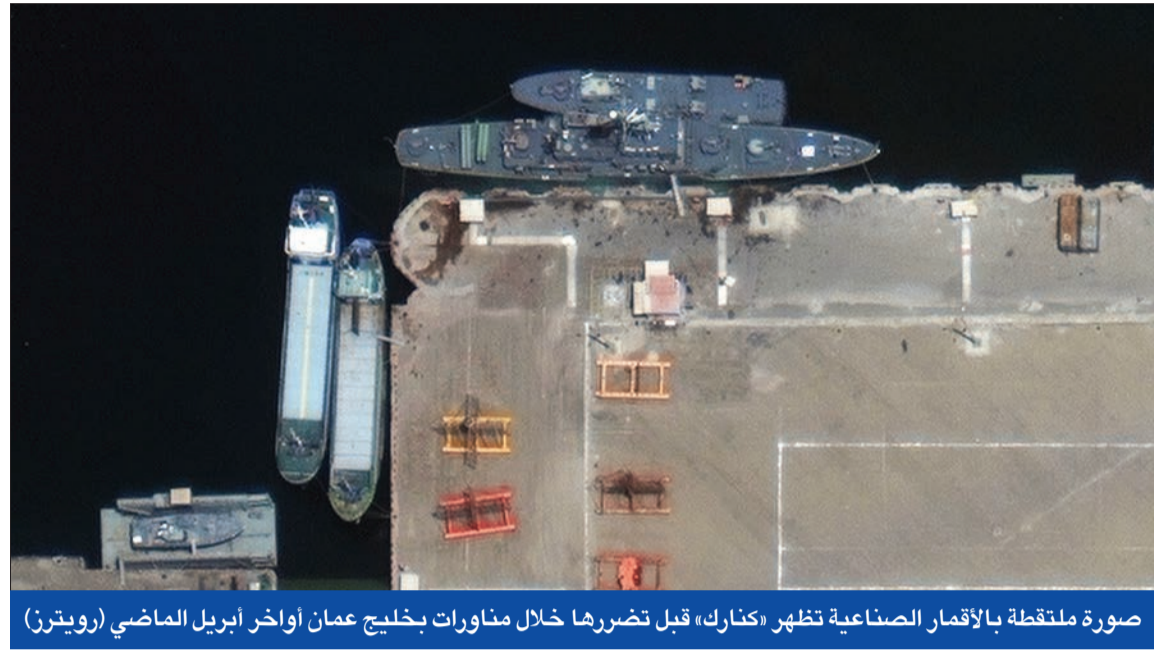
صورة ملتقطة بالأقمار الصناعية تظهر «كنارك» قبل تضررها خلال مناورات خليج عمان أواخر أبريل الماضي

● سجل حول السجناء بين طهران وواشنطن ● تشييع ضحايا «كنارك» ولاريجاني يطالب بتحقيق شفاف