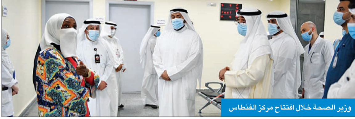
وزير الصحة خلال افتتاح مركز الفنتاس