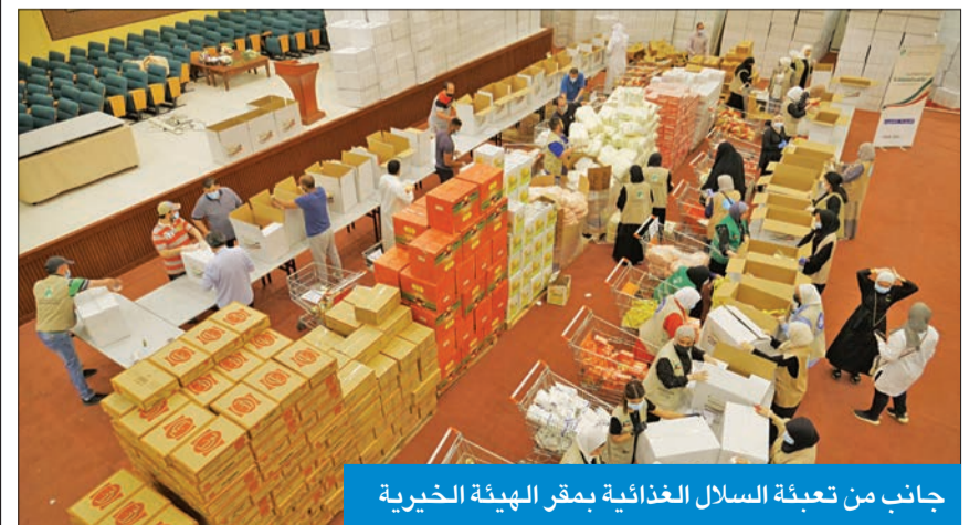
جانب من تعبئة السلال الغذائية بمقر الهيئة الخيرية