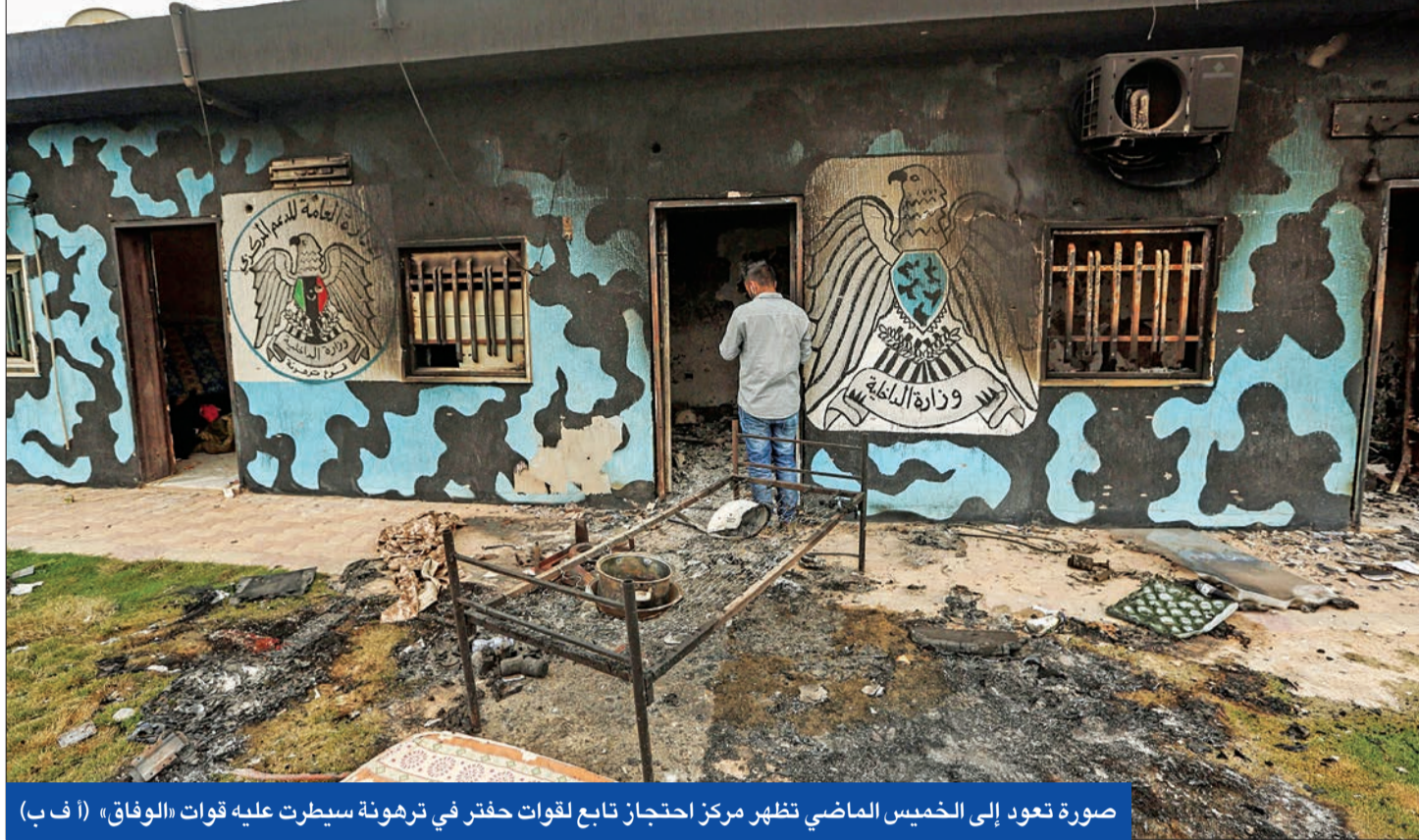
صورة تعود إلى الخميس الماضي تظهر مركز احتجاز تابع لقوات حفتر في ترهونة سيطرت عليه قوات «الوفاق»

فيما بدأ أنه رد على المبادرة الجزائرية. أعلنت حكومة «الوفاق» الليبية موافقتها على الدخول في حوار مع منافسيها شرق ليبيا، بينما تعثر اجتماع روسي - تركي كان مقرراً أمس حول ليبيا. فيما بدأ أنه رد على المبادرة الجزائرية. أعلنت حكومة «الوفاق» الليبية موافقتها على الدخول في حوار مع منافسيها شرق ليبيا، بينما تعثر اجتماع روسي - تركي كان مقرراً أمس حول ليبيا.