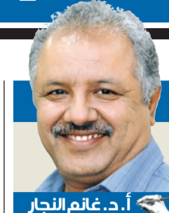
أ.د. غانم النجار