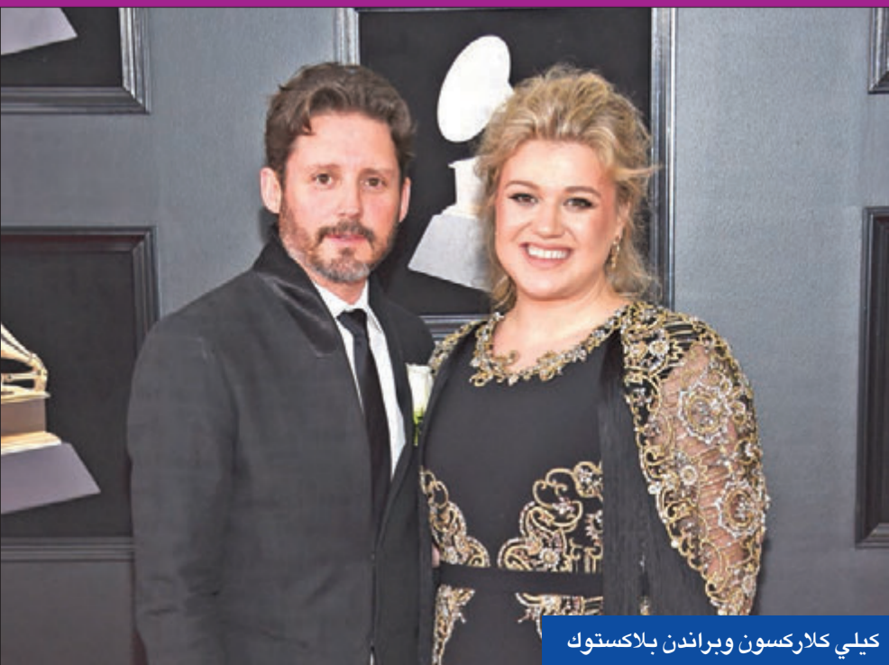
كيلي كلاركسون وبرانندن بلاكستوك

ضغط الاستمرار بتقديم الأغاني ولكنها أرادت أن تجرب أمراً مختلفاً فلم تستع بالفرق نفسه من المؤلفين كما كان الأمر عليه سابقاً، واعتمدت بشكل أكبر على الأغاني التي شاركت في كتابتها. وأدت النتيجة إلى صراع مع كليف دافيس حول اليوم My December عام 2007، وذلك بعد اقتراحه وجوب إعادة العمل عليه، حيث أبدى دافيس مخاوفه بشأن عدم وجود أغان ناجحة في هذا الألبوم، كما أشار البعض إلى أن الانطباع العام عن الألبوم كان سلبياً.