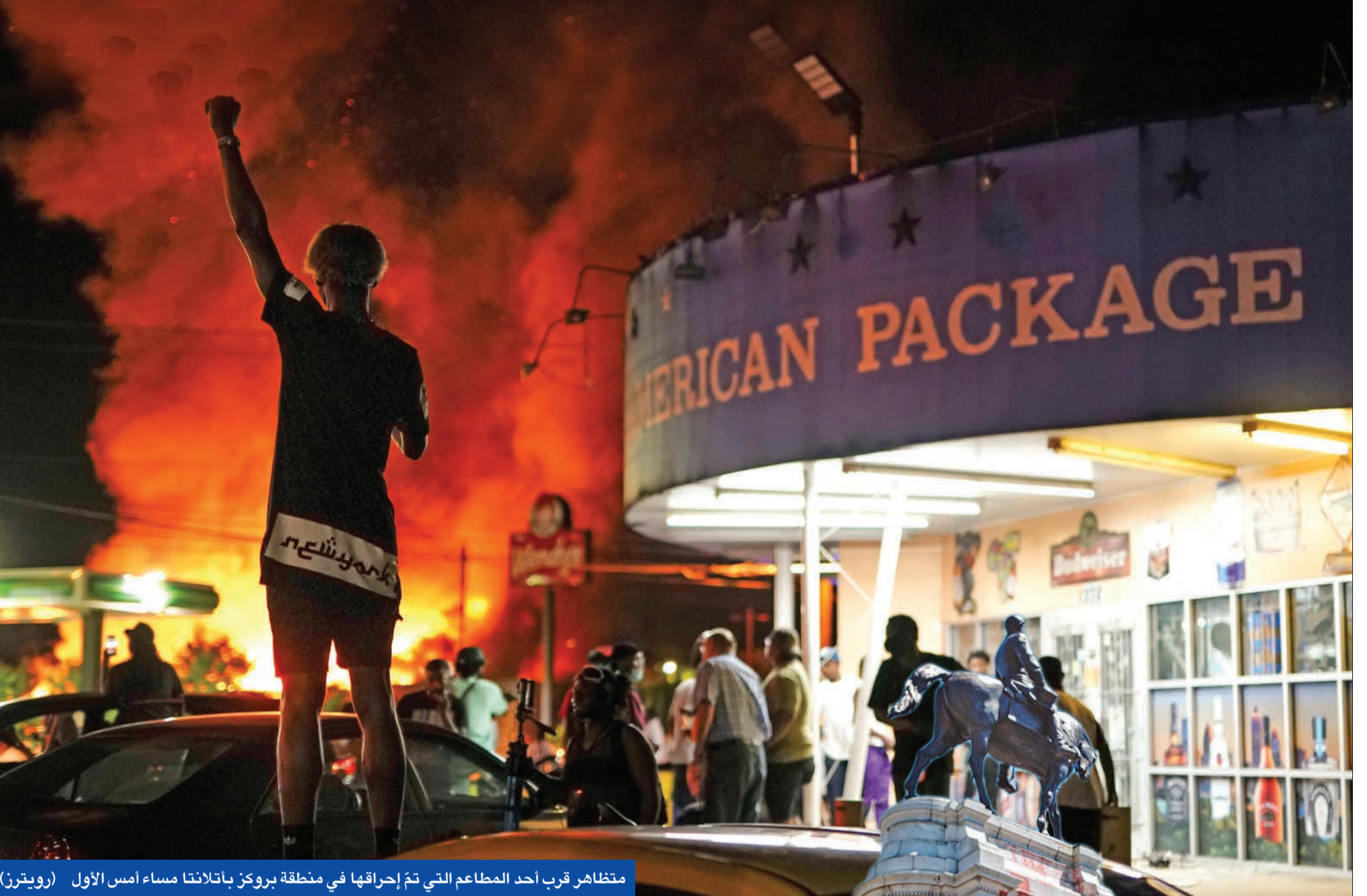
مظاهر قرب أحد المطاعم التي تم إحراقها في منطقة بروكز باتلانتا مساء أمس الأول

مع امتداد التظاهرات على مقتل الأميركي الأسود جورج فلويد، اختناقاً تحت ركلة الشرطي الأبيض ديريك شوفاين في مينيابوليس، إلى مختلف دول العالم، اندلعت احتجاجات عنيفة بمدينة أتلانتا، في أعقاب إطلاق الشرطة النار على شاب أسود، خلال محاولته الفرار من الاعتقال.