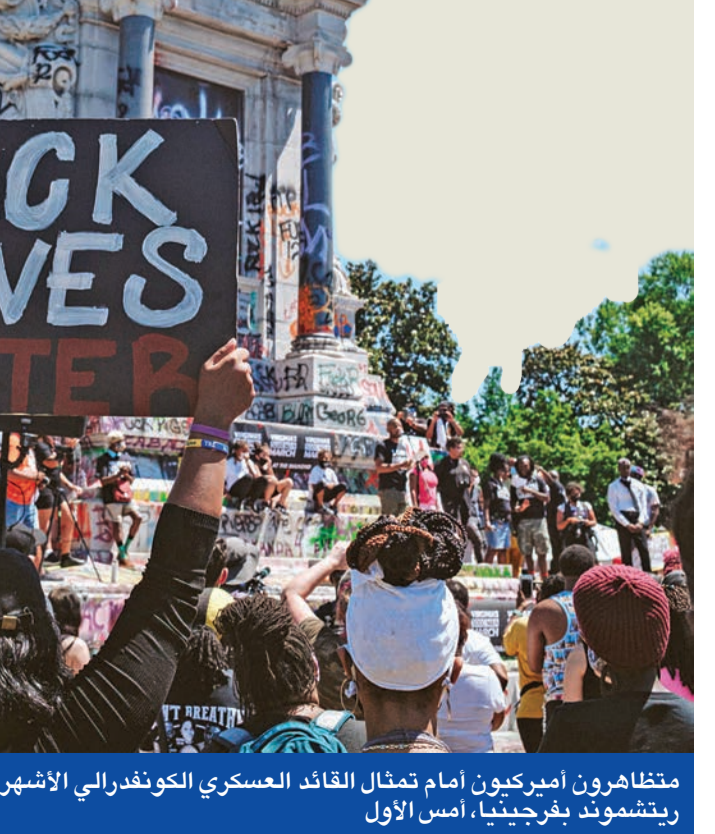
متظاهرون أميركيون أمام تمثال القائد العسكري الكونغرالي الأشهر روبرت أي لي، في مدينة ريتشموند بفرجينيا، أمس الأول

وسلط الجدل حول إرث العبودية والاستعمار وعنق البيض ضد الشعوب الملونة، آثاره الاحتجاجات الأميركية على العنصرية وعنق الشرطة، توصلت حملة تخريب وإسقاط تماثيل لزعماء سابقين وجنرالات من الولايات المتحدة، مروراً ببريطانيا، ووصولاً إلى أستراليا. وبعد تخريب وإزالة عدة تماثيل لمكتشف أميركا كريستوفر كولومبوس، وهدم تمثال لرئيس الولايات الكونغرالية، جيفرسون ديفيس، خلال الحرب الأهلية الأميركية، والملك ليوبولد الثاني في بلجيكا، وتاجر الرقيق إدوارد كولستون في بريستول، وغيرهم، قام متظاهرون أميركيون أمس الأول بتحطيم تمثال «مالك العبيد» جون ماكدونو في نيو أورليانز، ونقلوه على متن شاحنة إلى نهر المسيسيبي،