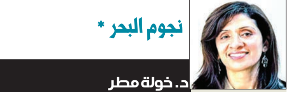
نجوم البحر *