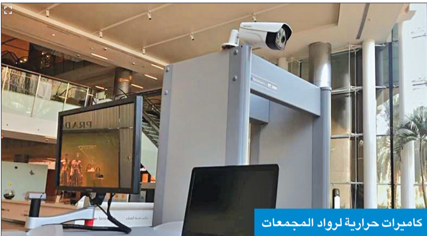
كاميرات حرارية لرواد المجمعات

بدوره، استعد مجمع 360 التجاري لاستقبال الرواد والزائرين للمحال والمطاعم والمقاهي برسالة ترحيب مفادها «سلامتكم أولويتنا»، حيث تم وضع اللوحات الإرشادية الكبيرة التي تحت على الالتزام بالإجراءات الوقائية والاحترازية أمام بوابات المجمع وبكل أروقتة التي ستدب بها الحياة من جديد بدءاً من غد. والالتزام بالإجراءات التي حددها مجلس الوزراء، اشترطت شركة التمدين العقارية المالكة للمجمع خضوع الزوار لكاميرات حرارية تقيس الحرارة عند بوابات الدخول، كما تم وضع نقاط على أرضيات المجمع رسمت عليها أماكن وقوف الأشخاص أثناء الانتظار أمام المجمع وأمام المحال والسلالم بمسافة لا تقل عن مترين، ونقاط أخرى حددت فيها