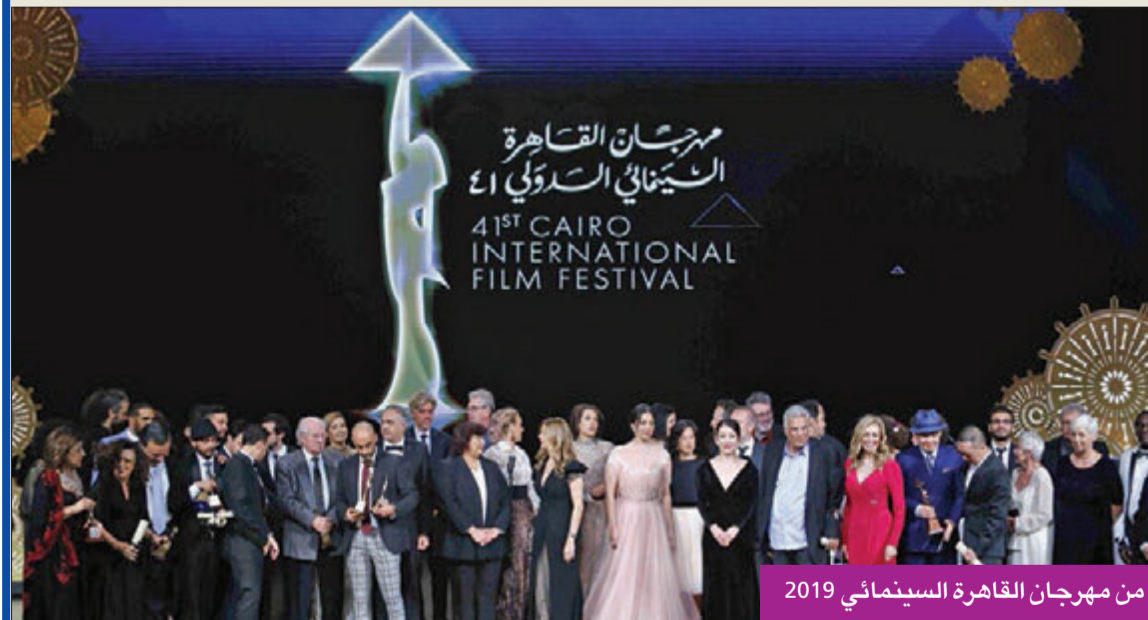
من مهرجان القاهرة السينمائي 2019

«القاهرة» و«الجونة» و«القومي» تستعد و«الإسكندرية» و«الإسماعيلية» يترقبان