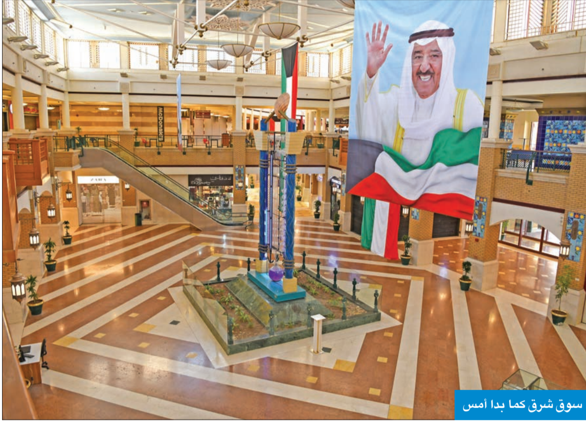
سوق شرق كما بدا أمس