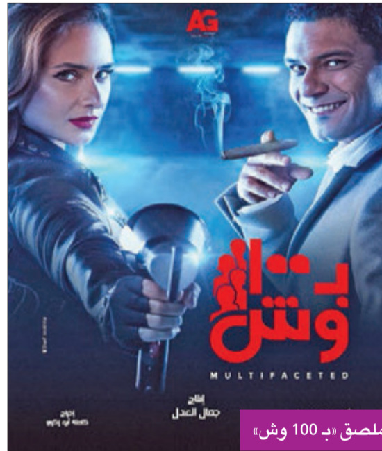
ملصق «ب 100 وش»

- قدمت شخصية «عمر» الذي يسكن بمنطقة الزمالك ويحترف النصب ويعترف على «سكر» التي قدمتها النجمة نيللي كريم وينصب عليها حتى يلتقيا وتبدأ الأحداث، فعمل هنا له صفات جعلت الفعالية ثرية من حيث الغرور وطريقة الكلام وحتى