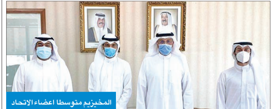
المخيزيم متوسلا أعضاء الاتحاد

السماح لطلبة اللغة بالتمديد لفصل دراسي إضافي