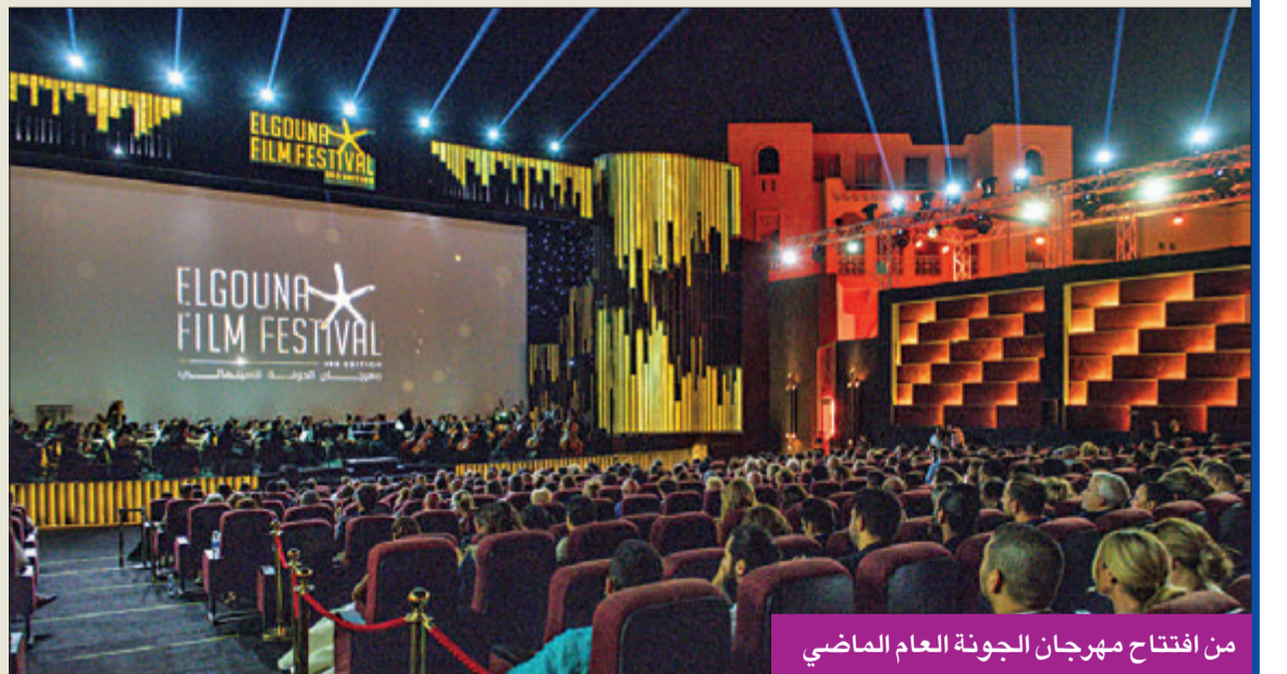
من افتتاح مهرجان الجونة العام الماضي

دورته الأولى التي كان مقرراً إقامتها الصيف الحالي للعام المقبل في موعد لاحق من العام الحالي، تجنباً للتضارب مع مواعيد مهرجانات أخرى، فضلاً عن تراجع عدد من الرعاية الداعمين لإقامة المهرجان الوليد من داخل مصر وخارجها.