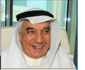
عبدالله بن مبارك*

مثل المجتمعات الأخرى، وقف مجتمع الكويت على ما تركته «كورونا» من آثار ومن غير، بعضها مزعج كلف الكويت الكثير من الخسائر، لكن بعضاً منها فتح الأعين على وقائع مخفية، ليست مريحة وفيها مخاطر على المجتمع، ومنها ما وفر دروساً ربما تستفيد منها الكويت: أولاً: لم أتصور، ولا غيري تصور، حجم المفترقات الداخلية ونوعية المتفجرات، التي كانت ساكنة لكنها قابلة للاشتعال وقادرة على تدمير أعمدة السكنية والاطمئنان في الكويت! اكتشفنا الحجم الهائل من العمالة الهامشية، التي استحضرتها كتائب تجار البشر بدعم من نافذين ومن مؤتمنين في الأجهزة الأمنية، ولم أكن شخصياً أتصور الأعداد المربكة المخالفة للقانون الإقامة، ومن عناصر كثيرة تعمدوا إضاعة وثائقهم، لكي تتورط الكويت في بقائهم.