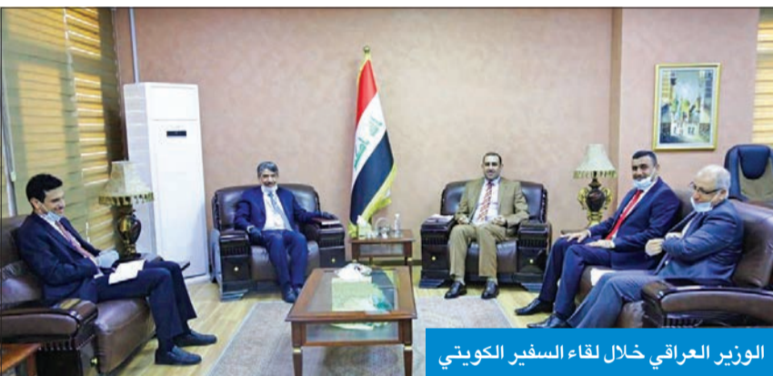
الوزير العراقي خلال لقاء السفير الكويتي

الوزير النجم دعا الشركات الكويتية إلى الاستفادة من الفرص الاستثمارية في بلاده