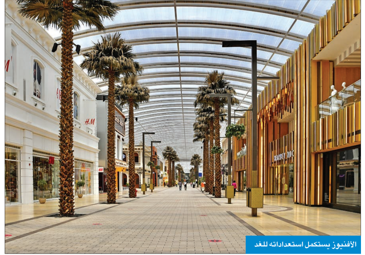
الافتقار يستكمل استعداداته للغد