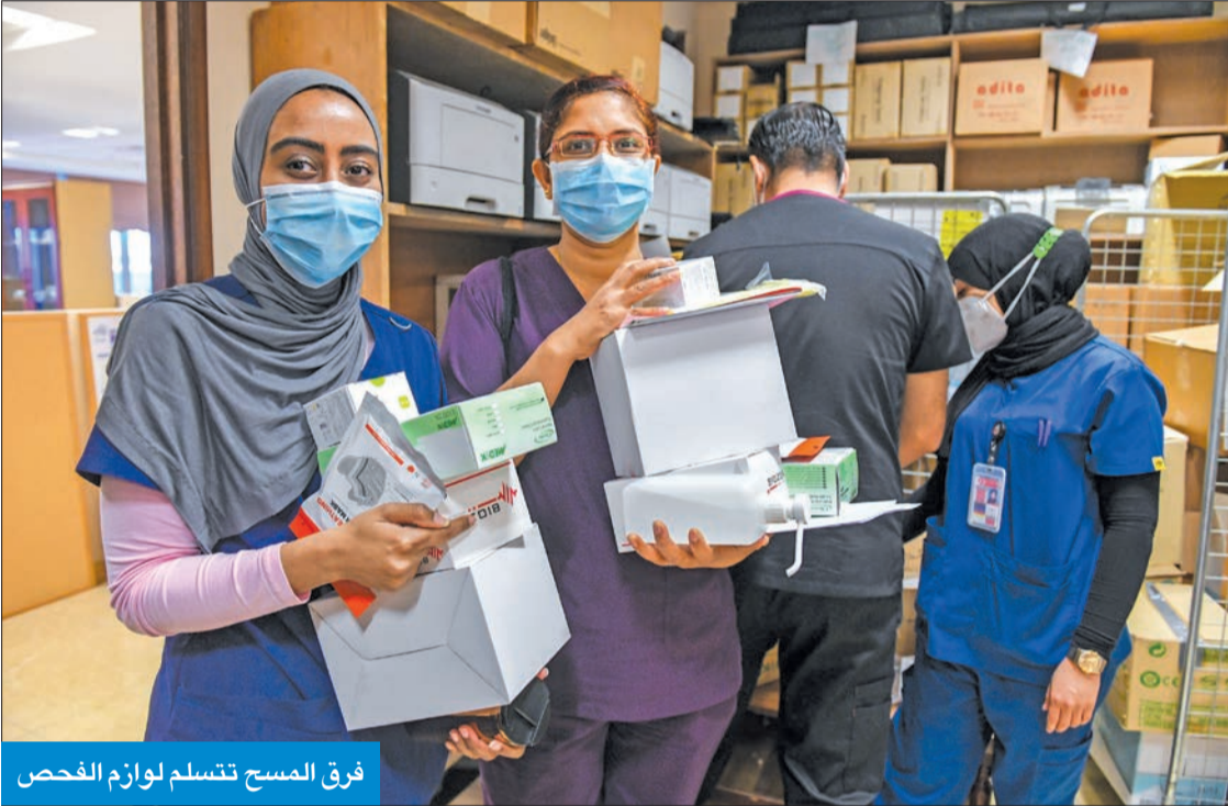
فرق المسح تتسلم لوازم الفحص

وكانت الفرق نفسها أخذت مسحات مماثلة في محافظتي حولي والفروانية، ومن المقرر أن تواصل عملها يومياً ليشمل سائر المحافظات.