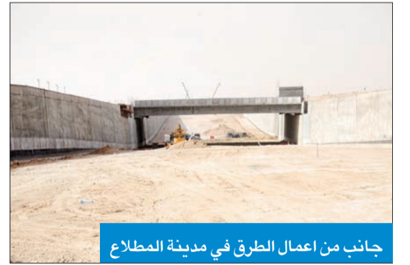
جانب من أعمال الطرق في مدينة المطالع

وقال الغريب، في تصريح لـ «الجريدة»، إن الشركة الصينية المنفذة للبنى التحتية في مدينة المطالع التي تضم 18519 قسيمة سكنية، على تواصل مع المؤسسة العامة