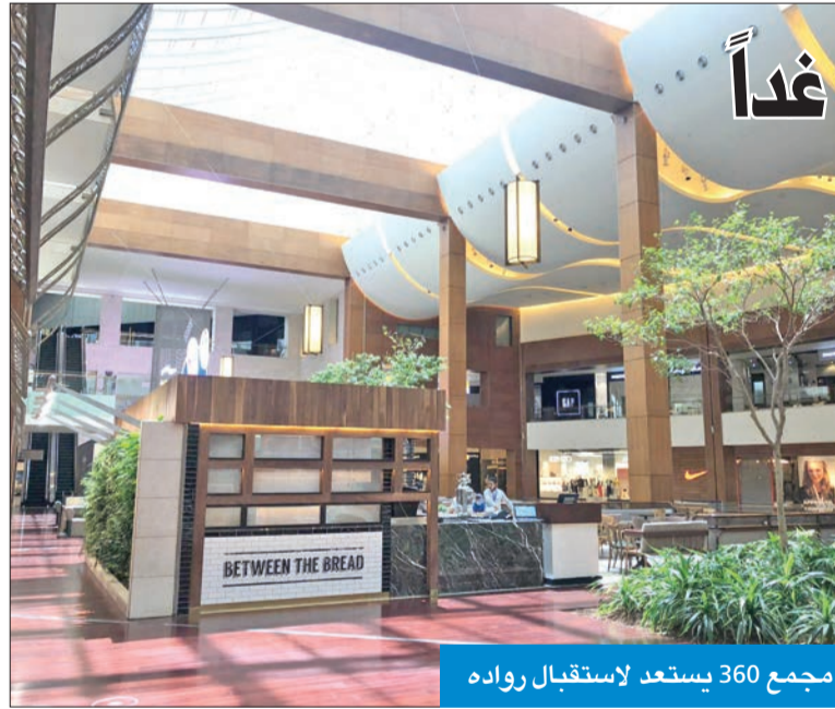
مجمع 360 يستعد لاستقبال رواده

حدد دليل سياسات وإجراءات وقواعد العودة التدريجية للعمل في الجهات الحكومية، الذي أصدره ديوان الخدمة المدنية، بناءً على تعليمات مجلس الوزراء والجهات الصحية، 7 فئات معفاة من مرحلة العودة للدوام في الجهات الحكومية، التي ستعاود العمل غداً بطاقة 30 في المئة من موظفيها فقط. ومنح الدليل جهة العمل