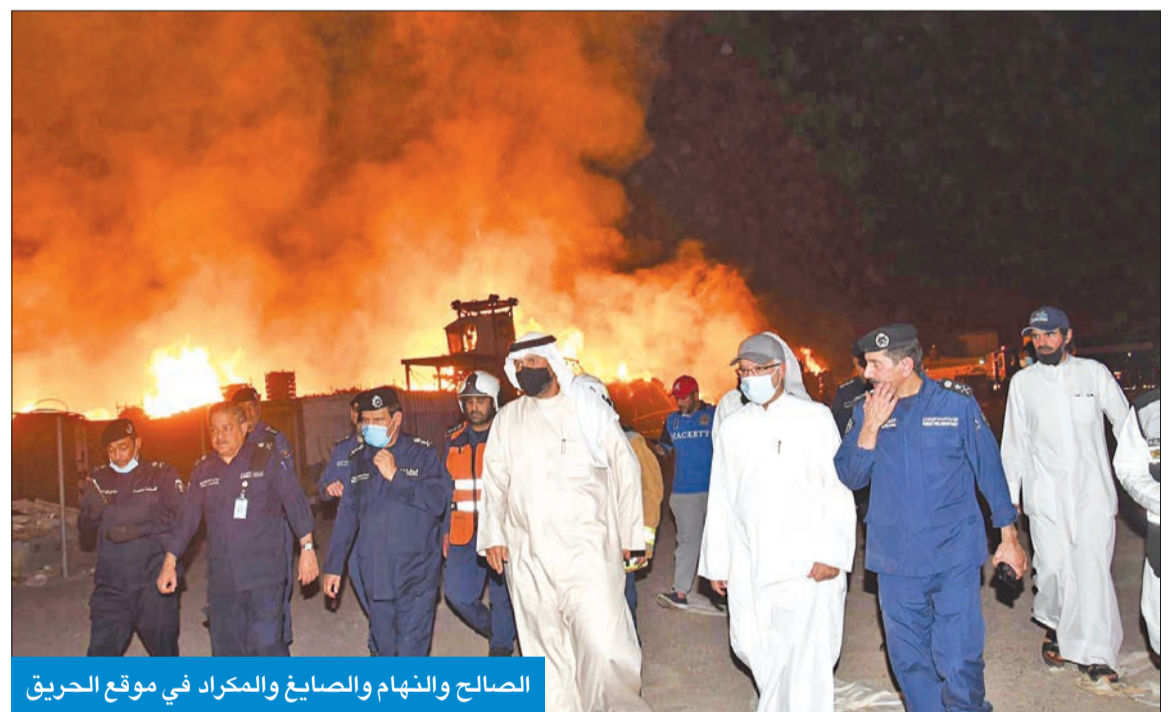
الصالح والنهام والصايغ والمكراد في موقع الحريق

نشب حريق هائل، مساء أمس، في مستودع للأخشاب بمنطقة غرب ميناء عبدالله، أسفر عن أضرار مادية اشتملت على كميات كبيرة من الأخشاب، وأكثر من 3000 سيارة جديدة وبضائع متنوعة وأصباغ. وقالت الإدارة العامة للإطفاء إنها سيطرت على حريق كبير اندلع في مستودع مكشوف للأخشاب بموقع تابع لمؤسسة الموانئ في منطقة غرب ميناء عبدالله، تبلغ مساحته الإجمالية مليون متر مربع. وبعث صاحب السمو أمير البلاد الشيخ صباح الأحمد، ببرقيات شكر إلى رئيس الحرس الوطني سمو الشيخ سالم العلي، ونائب رئيس الحرس الشيخ مشعل الأحمد، ورئيس مجلس الوزراء سمو الشيخ صباح الخالد، ونائب رئيس مجلس الوزراء وزير الداخلية وزير الدولة لشؤون مجلس الوزراء أنس الصالح، ونائب رئيس مجلس الوزراء وزير الدفاع الشيخ أحمد المنصور، والمدير العام للإدارة العامة