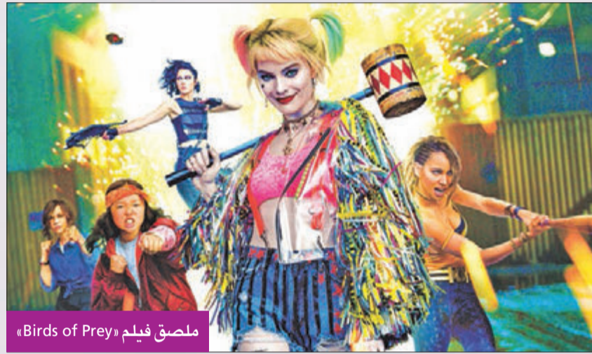
ملصق فيلم «Birds of Prey»

وكانت روبي ترشحت لجائزة الأوسكار لعام 2019 كأفضل ممثلة مساعدة عن دورها في فيلم "بومبشيل" (Bombshell)، بمشاركة أشهر نجومات هوليوود نيكول كيدمان وتشارليز ثيرون، والمسئوحى من قصة حقيقية حدثت في أروقة قنوات فوكس التلفزيونية.