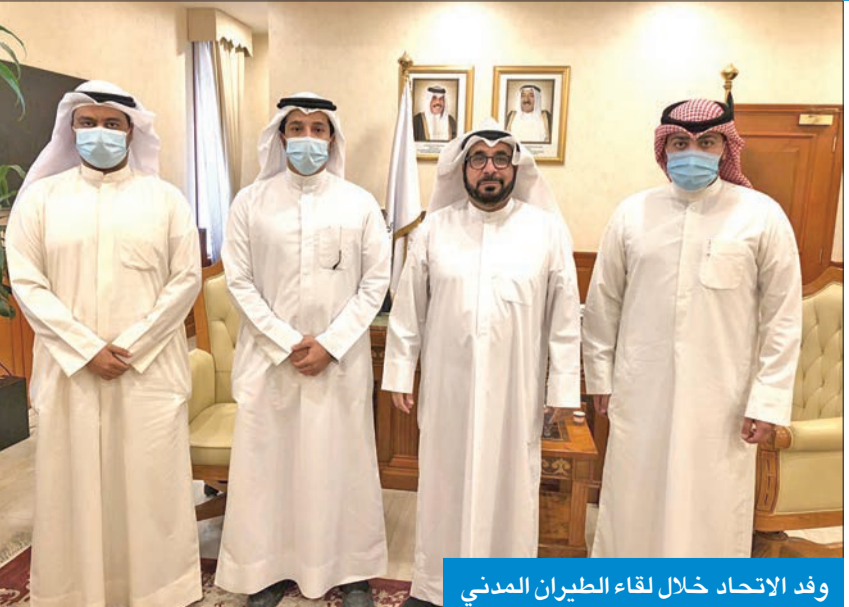
وفد الاتحاد خلال لقاء الطيران المدني