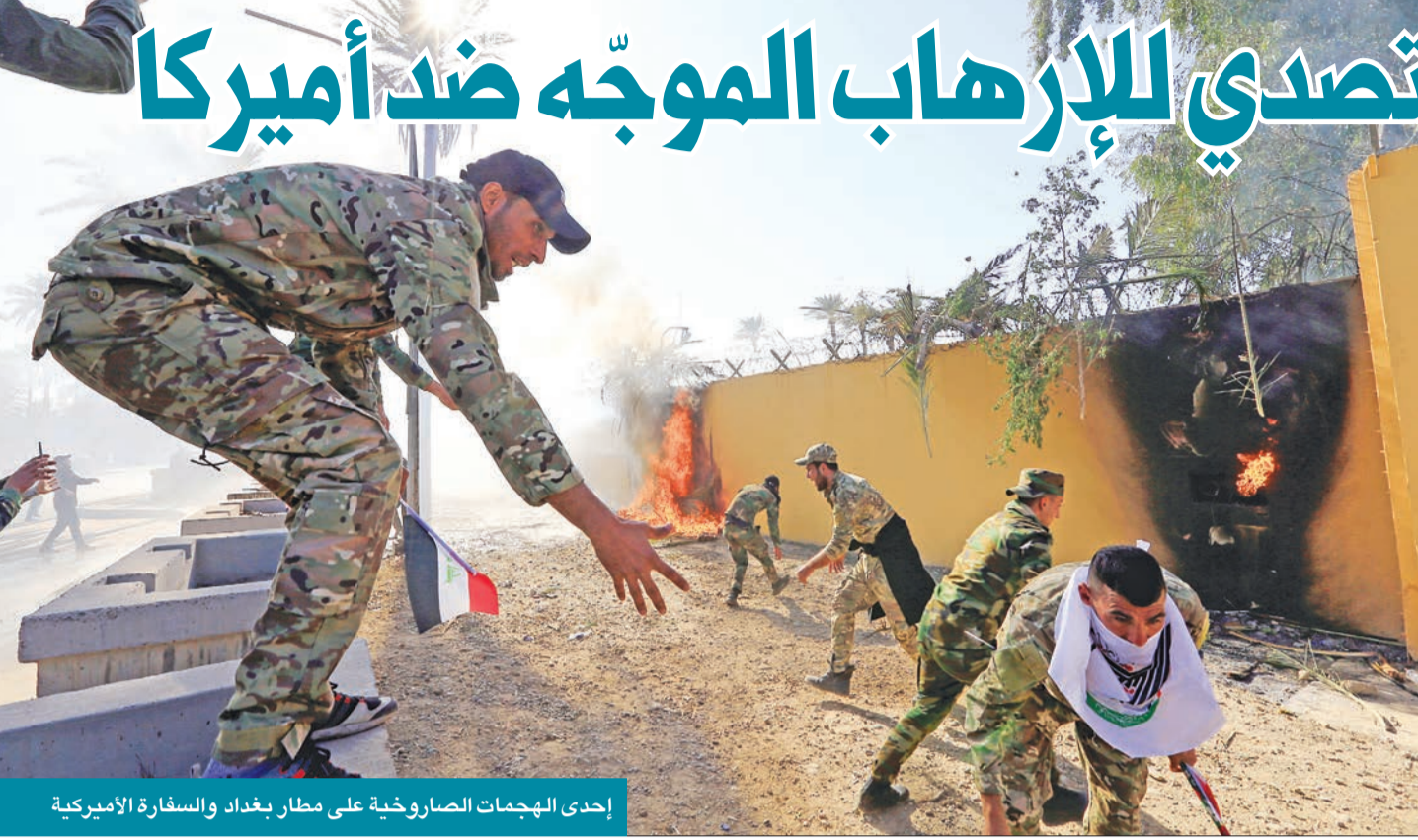
إحدى الهجمات الصاروخية على مطار بغداد والسفارة الأميركية