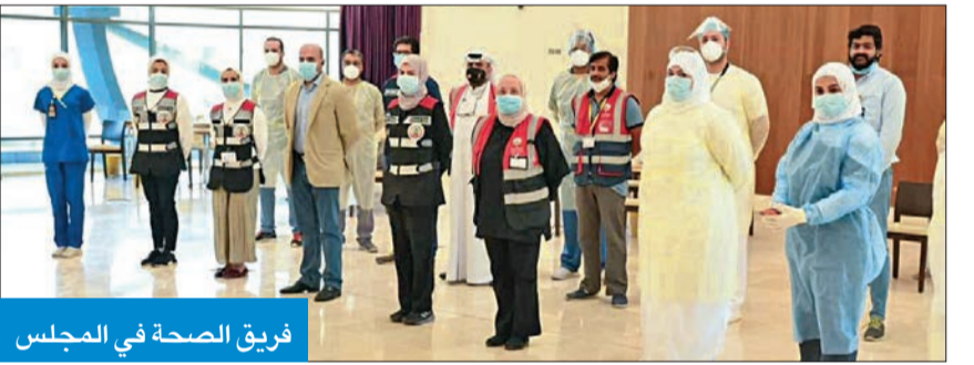
فريق الصحّة في المجلس

خضوعاً للمسحات الطبية والنتائج خلال 24 ساعة على هواتفهم