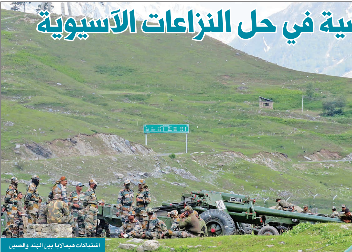
اشتباكات هيمالايا بين الهند والصين

موسكو لا تملك خياراً آخر غير دعم الهند وتلبية طلبها في الإسراع بتسليم الأسلحة الروسية إليها في أقرب وقت ممكن