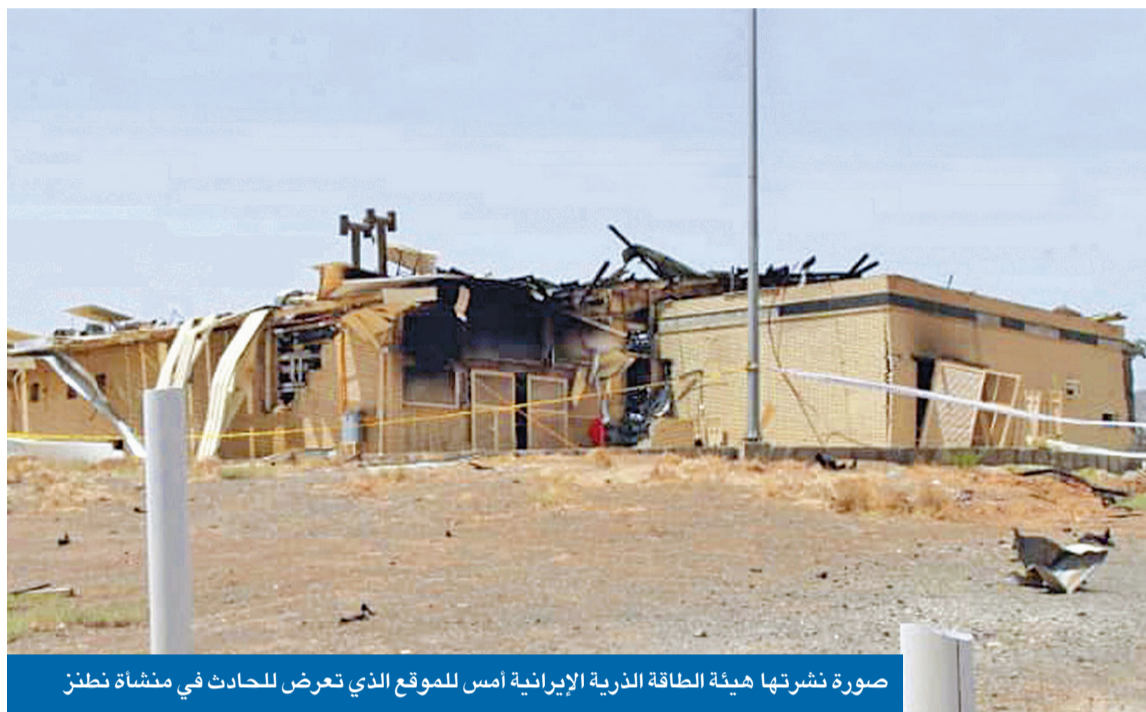
صورة نشرتها هيئة الطاقة الذرية الإيرانية أمس للموقع الذي تعرض للحادث في منشأة نطنز

أفقدنا طهران 80% من مخزون غاز UF6 الضروري لتخصيب اليورانيوم