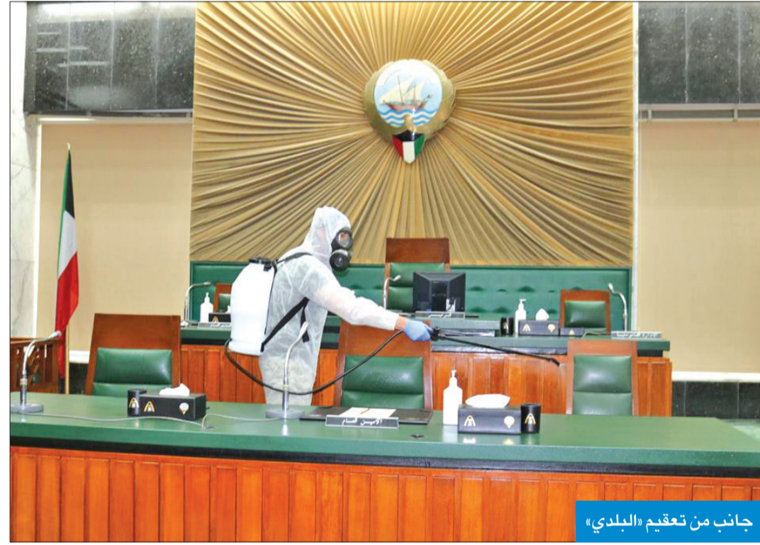
جانب من تعقيم «البلدي»

وأشارت إلى أن أعمال اللجنة الوطنية تتمثل في تنفيذ وضع ومتابعة الخطط السنوية لمواصفات القطاع، وتحديث المواصفات القياسية التي تقع ضمن مجال عمل اللجنة الوطنية، والتي مر عليها أكثر من 5 سنوات، مضيفة: وأيضاً متابعة تنفيذ البرنامج