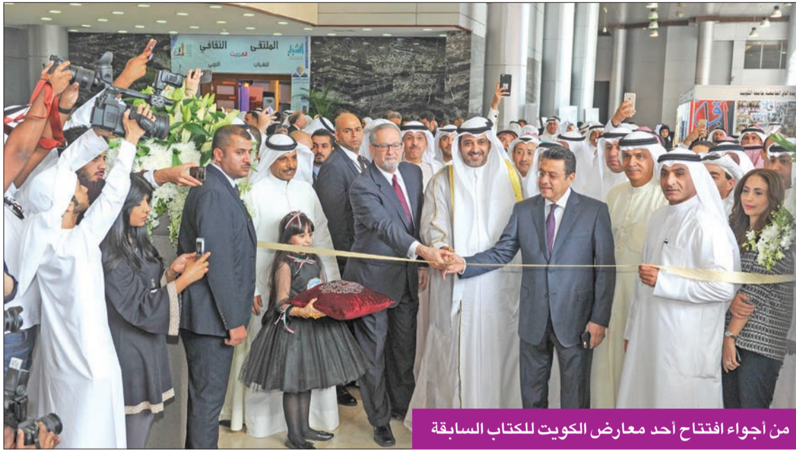
من أجواء افتتاح أحد معارض الكويت للكتاب السابقة