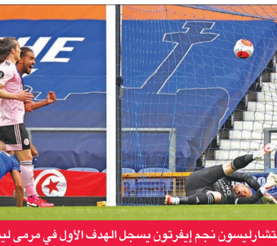
ريتشارليسون نجم إيفرتون يسجل الهدف الأول في مرعى ليستر

متتاليتين، عندما عمق جراح مضيفه نوريتش سيتي صاحب المركز الأخير بالفوز عليه برعاية نظيفة، بينها