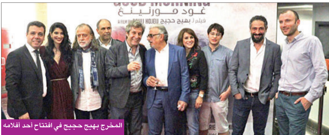
المخرج بهيج حجيج في افتتاح أحد أفلامه

وتعمل جمعية تيرو للفنون على برمجة العروض السينمائية الفنية والتعليمية للأطفال والشباب، وتقديم السينما لأي فخرج يريد عرض فيلمه بالمجان، وإلى نسج شبكات تبادلية مع مهرجانات في الخارج وفتح فرصة للمخرجين الشباب لعرض أفلامهم، وتعريف الجمهور بتاريخ السينما المحلية والعالمية، إضافة إلى اللامركزية في العروض عبر "باص الفن السلام" للعرض الجوال، وتعمل على فتح منصات ثقافية في لبنان، من "سينما الحمرا" في مدينة صور و"سينما ستارز" في مدينة النبطية و"سينما ريفولي" التي تحولت إلى المسرح الوطني اللبناني، أول مسرح وسينما مجانية في لبنان، منصة ثقافية حرة ومستقلة ومجانية شهدت على إقامة الورش والمهرجانات المسرحية والسينمائية والموسيقية من مهرجان صور الموسيقي الدولي ومهرجان لبنان الموسيقي للرقص المعاصر والحكواتي ومونودراما المرأة ومهرجان أيام فلسطين الثقافية، ومهرجان تيرو الفني، ومهرجان شوف لبنان بالسينما.