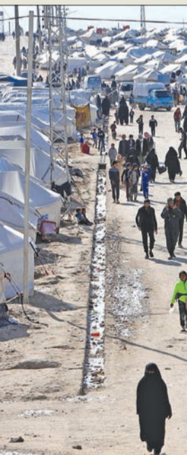
مخيم الهول نقطة تجمع للمتشددين من مقاتلي «داعش»

شكلت نساء «داعش» لجانا سرية داخل المخيم لمتابعة الحياة الشخصية لسكان المخيم لمعرفة مدى ما إذا كانوا منتمين بأفكار التنظيم أم لا، كما شكلت خلايا تنظيم «داعش» ما يسمى جهاز الحسبية أو (الشرطة الإسلامية) داخل المخيم، والذي يتكون أغلب عناصره من النساء الأجنيات. بالإضافة إلى ذلك، صارت حوادث العنف داخل المخيم شائعة، حيث سجل المخيم العديد من أحداث العنف المرتبطة بالتحرف، ففي أغسطس عام 2019 قامت بعض النساء الأجنيات بقتل امرأة من الجنسية الإندونيسية داخل خيمتها بسبب عدم التزامها بالقواعد التي فرضتها نساء تنظيم داعش في المخيم، كما أن حوادث الطعن مستمرة بشكل يومي من قبل الأطفال والمراهقين أو ما يعرفون بأشبال الخلافة لكل من يخالف قواعد تنظيم داعش داخل المخيم، وعلى الرغم من خطورة الوضع داخل المخيم والحاجة الماسة لإحتوائه وإعادة تأهيل العناصر المتطرفة فيه، فإن هناك عدة عوامل حالت دون السيطرة على حوادث العنف والتطرف داخله، منها ضعف وفقر البنية التحتية من خدمات معيشية وتعليمية، ونقص الدعم المحلي والدولي، وغياب أي برامج شاملة لإعادة تأهيل المقيمين في المخيم وخصوصا للأطفال. خلال الأشهر القليلة الماضية، ساهم التوغّل العسكري التركي الأخير في سورية في خلق ظروف مواتية لإعادة إحياء التنظيم، حيث بدأت تركيا توغّلها في سورية في أواخر العام الماضي بهدف إنشاء «منطقة آمنة» على الحدود داخل أراضي قوات سورية الديمقراطية، وذلك بعد تلقيها الضوء الأخضر من قبل الرئيس الأميركي ترامب. ومنذ شن الهجوم التركي على سورية في