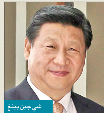
شي جين بينغ