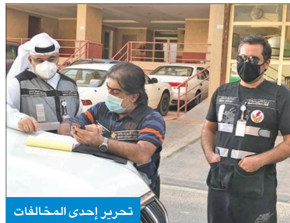
تحرير إحدى المخالفات

دشتي لـ الجريدة: شكاوى بقطع التيار عن العاجزين عن دفع الإيجار