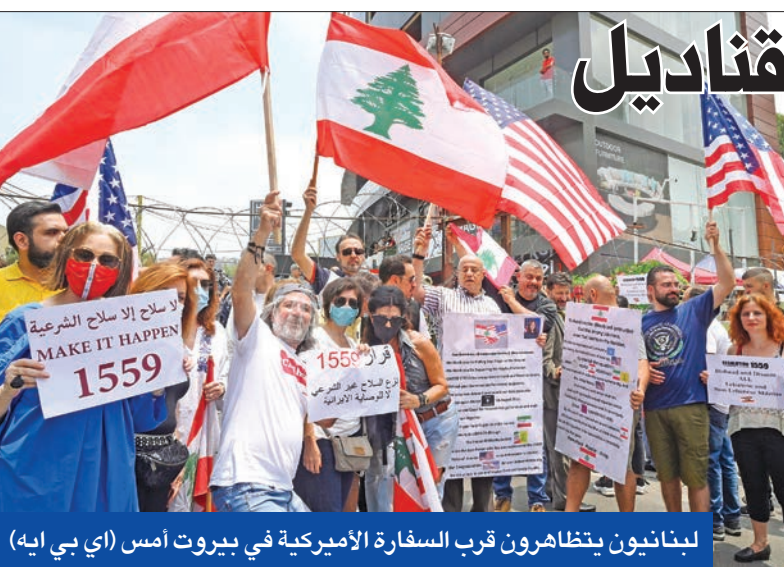
لبنانيون يتظاهرون قرب السفارة الأميركية في بيروت أمس

وهي تتضمن، حسب ما كشف أحد المشاركين في التحرك، مطالبة للولايات المتحدة بتفنيذ القرار 1559 ونزع السلاح غير الشرعي. ورفعت الاعلام اللبنانية والأميركية في هذا التحرك، وكذلك اللافتات. وعزّدت السفارة الأميركية في لبنان على حسابها على "تويتتر"، أمس، قائلة: "شكراً للمجموعة من اللبنانيين التي جعلت يوم استقلالنا مليزاً وعزّت خلال التجمع عن تقديرها للولايات المتحدة على شراكتها ودعمها المستمرة لتحديات لبنان الأمنية والإنسانية والتنمية".