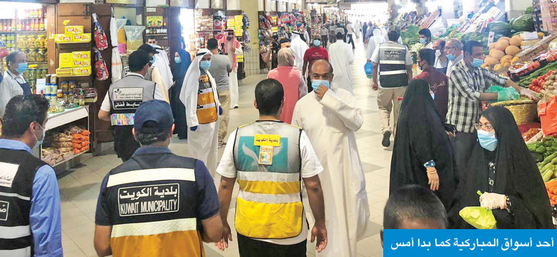
أحد أسواق المباركية كما بدأ أمس

صفر لـ الجريدة: إنذار إدارة السوق لتلافي المخالفات والالتزام بالاحترازمات