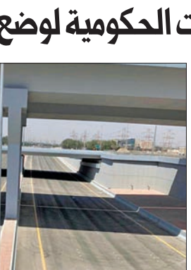
نفق شارع الغوص

الطرق للمناطق السكنية على جانب هذا الطريق، وتخفيف الازدحام المروري على طريق الفحيحيل السريع والطرق الرئيسية الراجعة معه، حيث يتم تطويره ابتداءً من منطقة بيان شمالاً، وعلى امتداد طريق الفحيحيل مؤدياً إلى الدائري السادس.