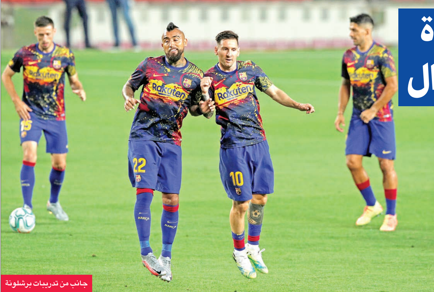
جانب من تدريبات برشلونة

عدد انتصاراته منذ عودة المنافسات بعد أكثر من ثلاثة أشهر من الإيقاف بسبب فيروس كورونا المستجد، إلى خمسة مقابل تعادلين، ليحصد مركزه الثالث الذي يسهم له بالمشاركة في دوري أبطال أوروبا في الموسم المقبل، برصيد 62 نقطة، في حين تعقدت مهمة مايوركا في البقاء ضمن مصاف الدرجة الأولى أكثر بنجم رصيده عند 29 نقطة.