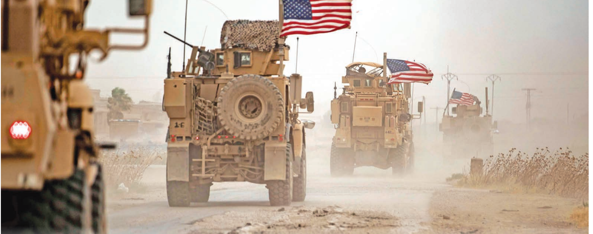
دورية أميركية في حقل الرميلان النفطي بمنطقة الحسكة السورية (ا ف ب)

● 44 قتيلاً بمعارك بين القوات السورية و«داعش» في «البادية» ● اقتتال بين فصائل أنقرة بالرقعة