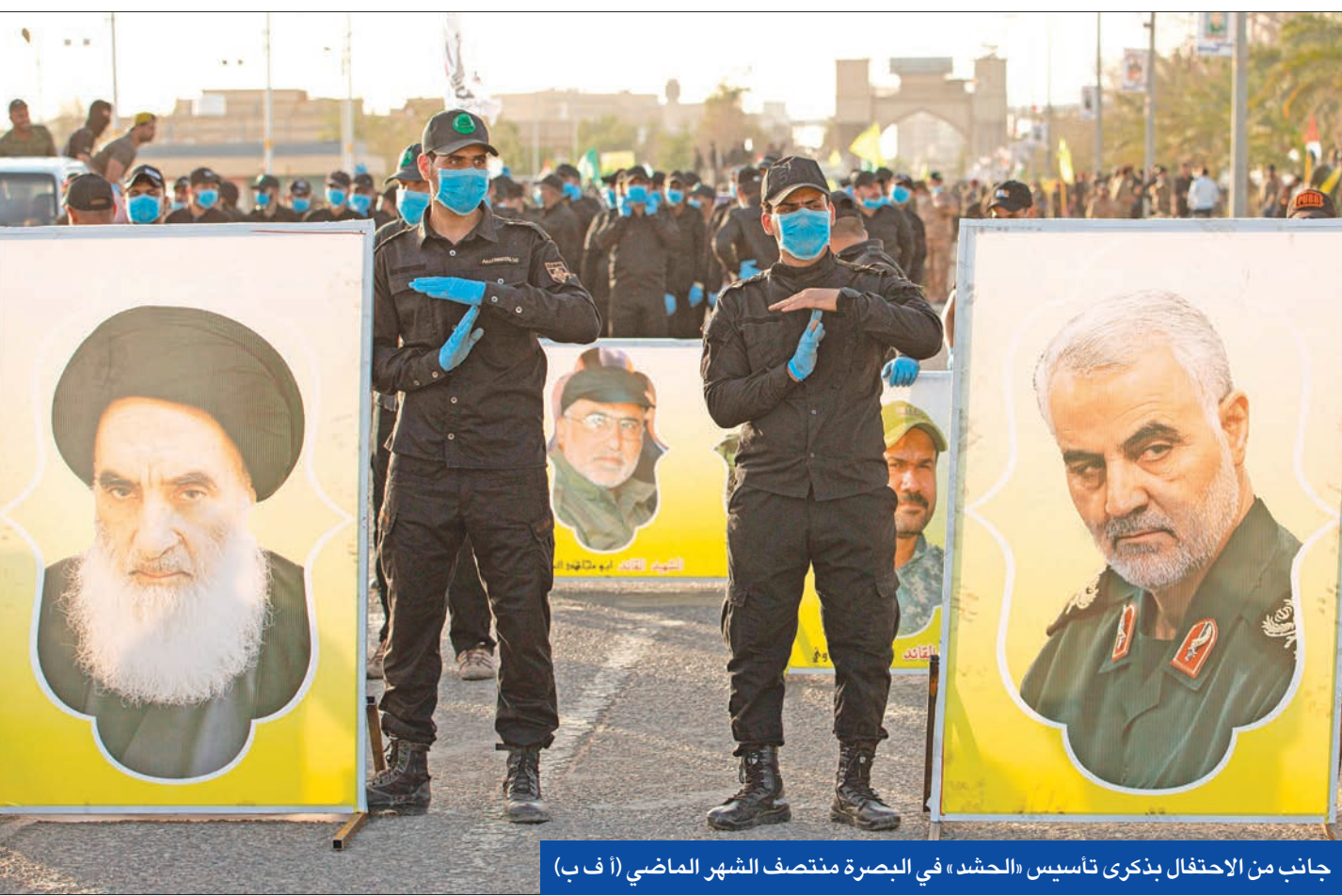
جانب من الاحتفال بذكرى تأسيس «الحشد» في البصرة منتصف الشهر الماضي

عين الأعرجي الذي يحتفظ بعلاقة «مميزة» مع الرياض وطهران مستشاراً للأمن القومي