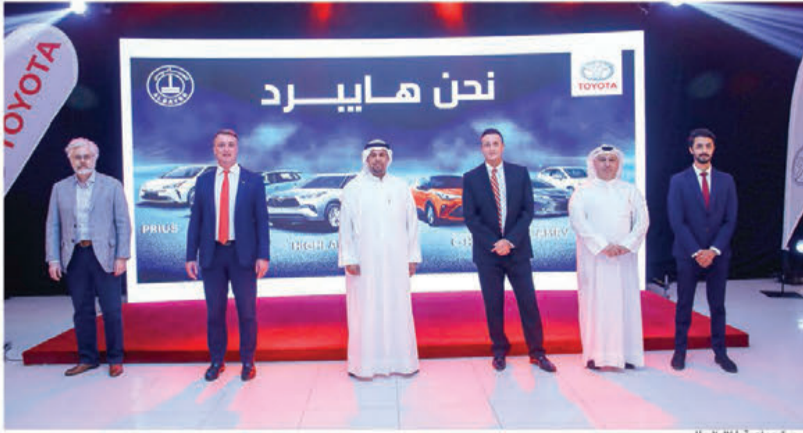
صورة جماعية خلال حفل