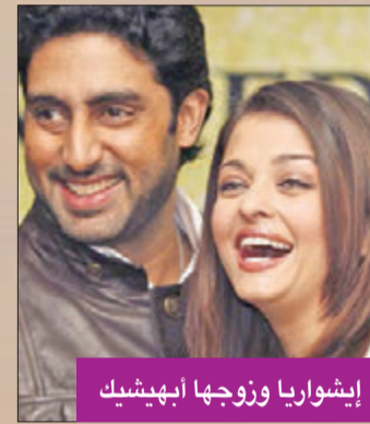
إيشواريا وزوجها أبهيشيك

راي ويحترمها، لاسميا أنهما تعارفا خلال تصوير فيلم Hum Dil Del Chuke Sanam.