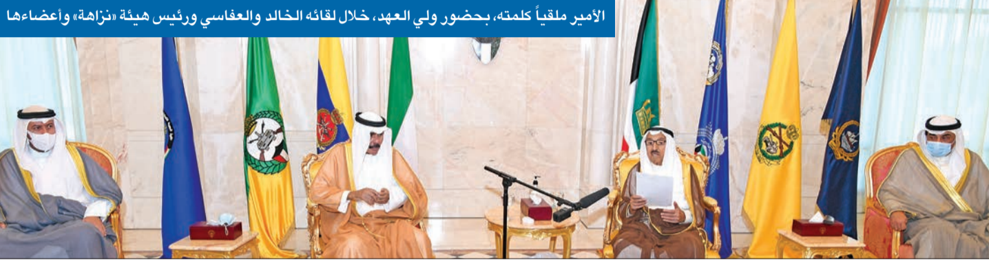
الأمير ملقياً كلمته، بحضور ولي العهد، خلال لقائه الخالد والعفاسي ورئيس هيئة «نزاهة»، وأعضاءها

سموه دعا «نزاهة» إلى التصدي لإساءات بعض وسائل الإعلام والتواصل وحملاتها الظالمة ضد البلاد