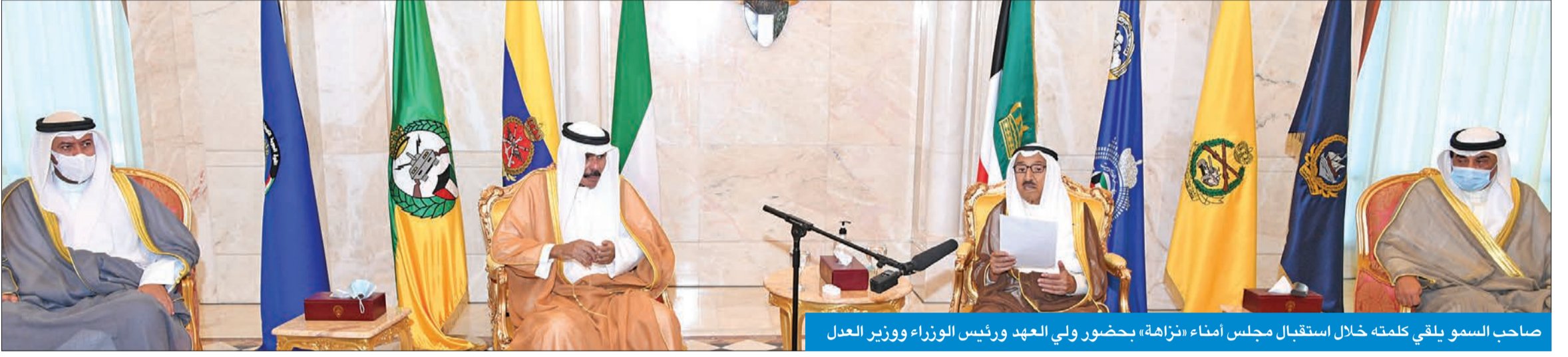
صاحب السمو يلقي كلمته خلال استقبال مجلس أمناء «نزاهة» بحضور ولي العهد ورئيس الوزراء ووزير العدل

سموه استقبل رئيس وأعضاء الهيئة لأداء اليمين القانونية أمامه بمناسبة تسلمهم مهامهم