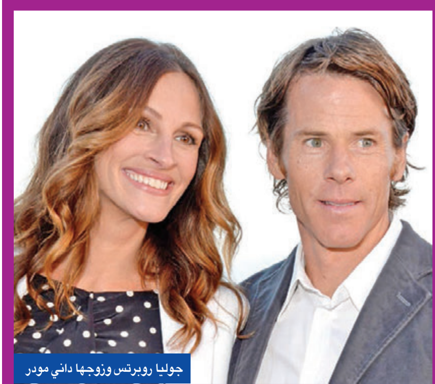
جوليا روبرتس وزوجها داني مودر

يقدم محبو السينما والمسرح حفل وداع لمسرح لاسكالا في العاصمة التايلاندية (بانكوك)، الذي سينتهي نشاطه في أعقاب وباء فيروس كورونا. وكان المسرح، المشيد منذ 50 عاماً، يحافظ طوال العقد الماضي للمحافظة على ربحيته، وسط منافسة من وسائل الإعلام الجديدة، وزيادة تكاليف إيجار الأرض التي بُني عليها. ووجه وباء كورونا والقيود على الحركة التي فرضت للحد من انتشاره آخر ضربة إلى المسرح، الذي يقع في قلب بانكوك. ويتوقع أن يشهد الاقتصاد التايلاندي انكماشاً هذا العام، بمعدل أكبر من أي اقتصاد آخر في دول جنوب شرق آسيا. وتشمل آخر العروض أفلاماً إيطالية، وأخرى وثائقية تايلاندية، وبيعت 3000 تذكرة للزوار الراغبين في القيام بزيارة أخيرة إلى المسرح، الذي يُعد آخر مبنى مسرحي من نوعه في المدينة. (رويترز)