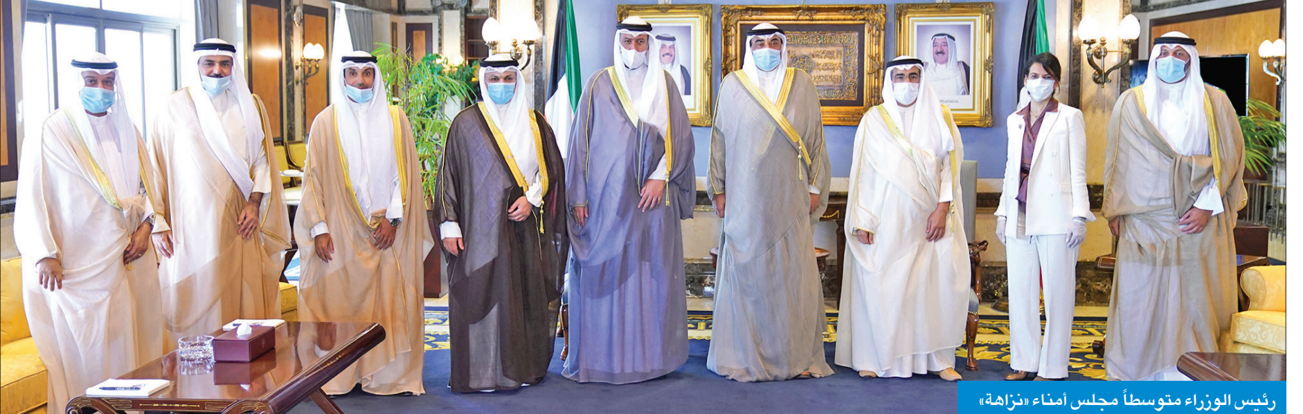
رئيس الوزراء متوسطاً مجلس أمناء «نزاهة»

وقال سموه إن الحكومة لن تالو جهداً في تسخير جميع إمكاناتها بالتعاون والمساندة مع كافة قطاعات الدولة لتعزيز مبادئ النزاهة والشفافية ومحاربة الفساد، معرباً عن تمنياته لرئيس وأعضاء المجلس بالتوفيق والسداد وثقته بهم لما يمتلكون من خبرة وكفاءة وتجربة تعينهم في أداء مهامهم الجديدة.