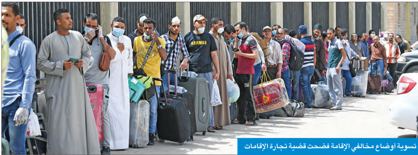
تسوية اوضاع مخالفين الإقامة فضحت قضية تجارة الإقامة

تراخيص أكثر من 1200 شركة ومؤسسة من قبل وزارة التجارة، بناء على توصيات الإدارة العامة لمباحث الإقامة، مشيراً إلى أن وقف الرخص جاء بعد تحريات أجراها رجال المباحث حول نشاط أصحابها في عمليات الاتجار بالإقامة. وكشف أن رجال المباحث لديهم بيانات أكثر من 160 ألف مخالف لقانون الإقامة والشركات المسجلين عليها، فضلاً عن توافر معلومات جديدة لأكثر من 25 ألف