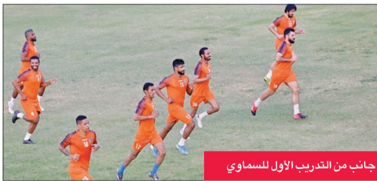
جانب من التدريب الأول للسماوي