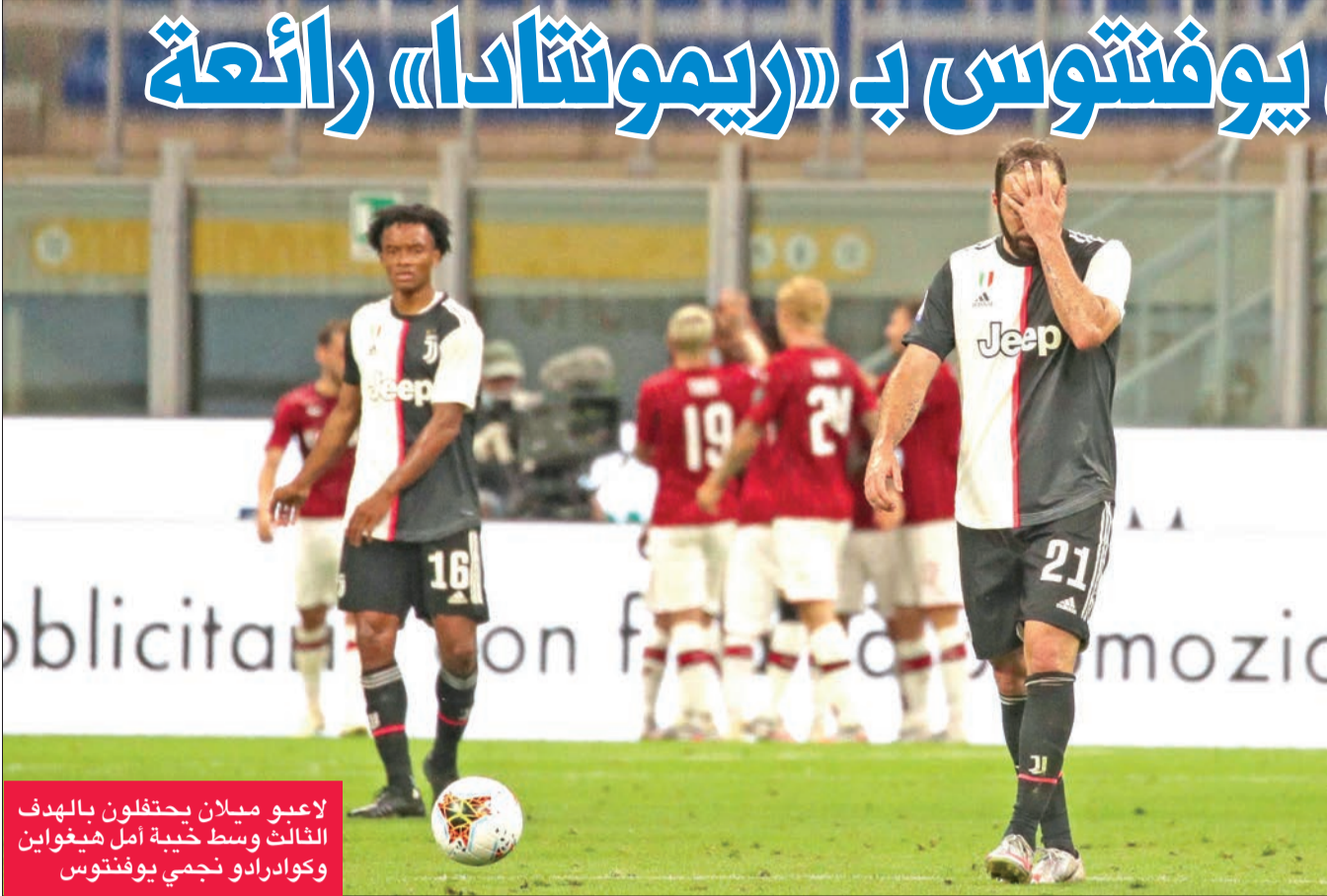
لاعبو ميلان يحتفلون بالهدف الثالث وسط خيبة أمل هغوواين وكوادرادو نجمي يوفنتوس