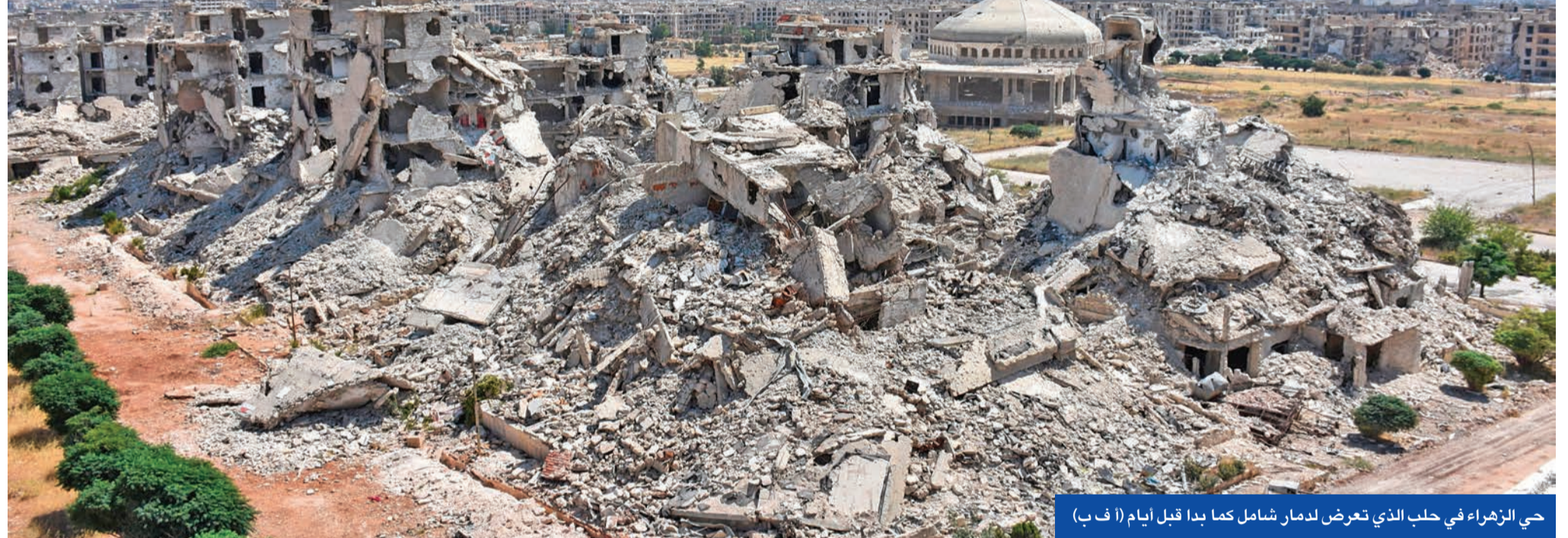
حي الزهراء في حلب الذي تعرض لدمار شامل كما بدا قبل أيام