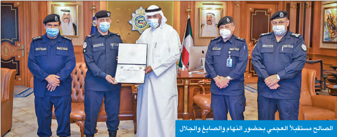
الصالح مستقبلاً العجمي بحضور النهام والصايغ والجال

أكد نائب رئيس مجلس الوزراء وزير الداخلية وزير الدولة لشؤون مجلس الوزراء انس الصالح أن رجال الأمن المتميزين يحظون بكل تقدير واهتمام من المؤسسة الأمنية، مثنياً الجهود التي قام بها الوكيل أول عبدالمحسن العجمي ويقلته وتفانيه في أداء واجبه المكلف به. جاء ذلك وفق بيان صحافي للإدارة العامة للعلاقات والإعلام الأمني بالوزارة، أمس الأول، خلال استقبال الوزير الصالح في مكتبه بمقر «الداخلية» الوكيل أول العجمي من مرتبات قطاع المرور والعمليات بعد تماثله للشفاء وعودته إلى العمل نتيجة تعرضه في وقت سابق لحادث أثناء القيام بمهام عمله. من جانبه، تقدم العجمي بالشكر للقيادة العليا بالوزارة على اهتمامهم الدائم وحرصهم على سلامة وصحة أبناء المؤسسة الأمنية. حضر اللقاء وكيل «الداخلية» الفريق عصام النهام ووكيل الوزارة المساعد لشؤون المرور والعمليات اللواء جمال الصايغ ومدير إدارة مرور محافظة مبارك الكبير العميد إبراهيم الجلال.