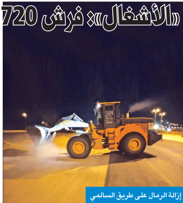
إزالة الرمال على طريق السالمي

أعلنت وزارة الأشغال العامة فرش 83720 متراً مربعاً من الأسفلت في شبكة الطرق الداخلية خلال أسبوع، من 27 يونيو حتى 7 يوليو الجاري. وذكرت «الأشغال»، في بيان، أن المناطق التي شملتها أعمال إصلاح الطرق تمثلت في الجهراء القديمة قطعة 2، وسعد العبدالله قطعة 1، ومواقع متعددة من الأندلس وصباح الناصر والرميثة، وصباح السالم قطعة 1 ومبارك الكبير قطعة 4، إضافة إلى مواقع متعددة في منطقة جابر العلي. وأشارت إلى أنها تلقت خلال نفس الفترة الزمنية، عبر مواقع التواصل المختلفة، 681 شكوى، أنجزت منها 586، وجار العمل على 95. في سياق متصل، أعلنت الهيئة العامة للطرق والنقل البري مواصلة أعمال إزالة الرمال على طريق السالمي، ضمن مشروع إنشاء وإنجاز