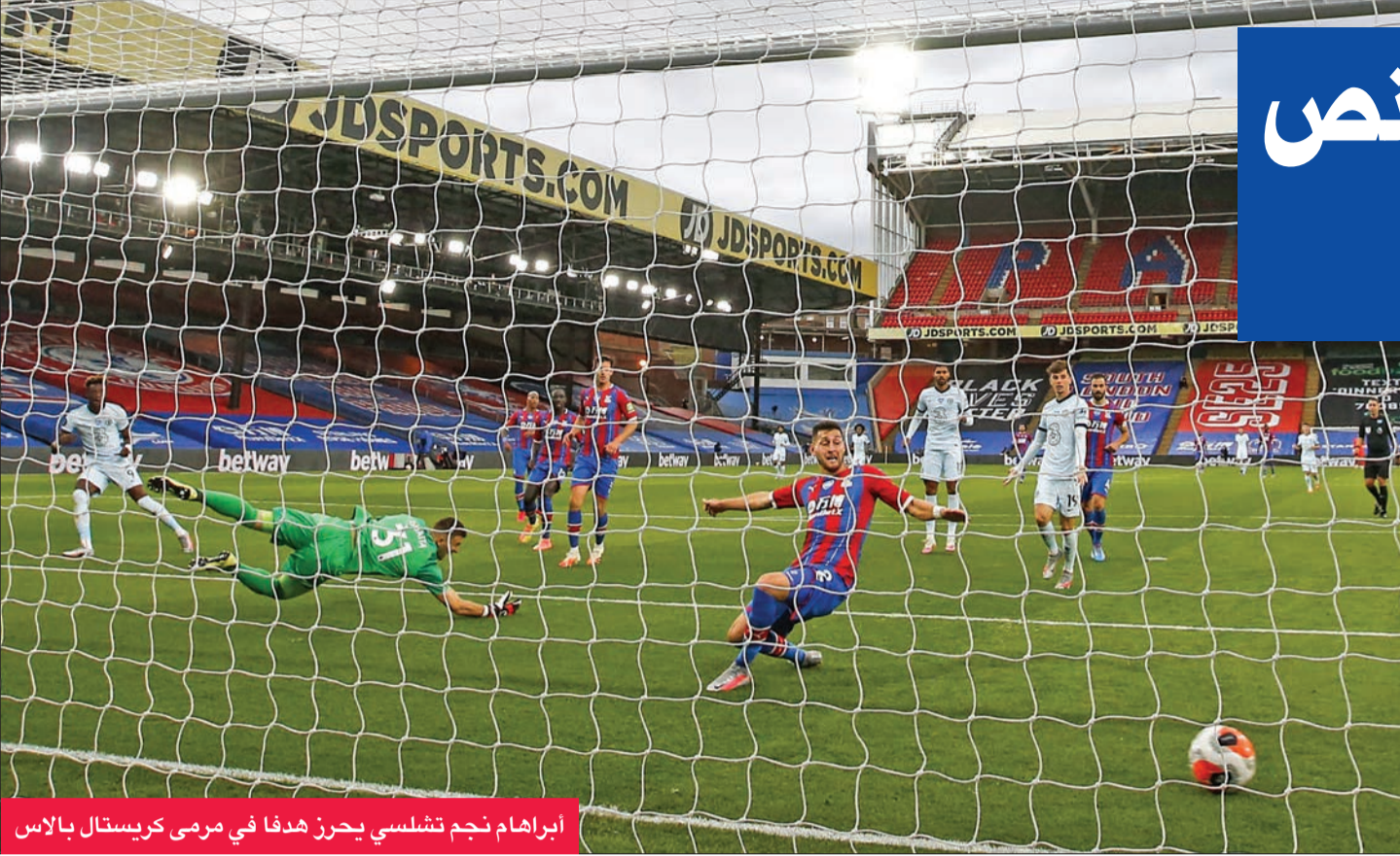
أبراهام نجم تشلسي يحرز هدفا في مرمرى كريستال بالاس