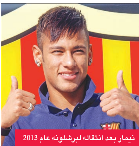
نيمار بعد انتقاله لبرشلونة عام 2013

أقرّ نادي سانتوس البرازيلي أنه سحّرتهم الهزيمة التي تعرض لها أمام العدة الرياضية بخصوص انتقال لاعبه السابق نيمار لصفوف برشلونة عام 2013، لكنه دعا الأخير لأن يحذو حذو ريبال مدريد بخصوص "الشفافية" إذا ما أراد التعاقد مع أي من لاعبيه مستقبلا.