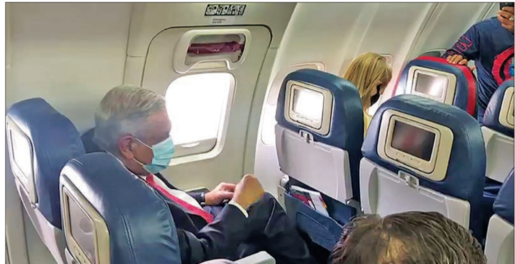
الرئيس المكسيكي في طريقه لواشنطن على متن طائرة تجارية أمس الأول

مكتب التحقيقات الفدرالي FBI، كريستوفر راي، أمس الأول، من أن الصين تقود عمليات استخبارية واسعة النطاق تشمل الدفع باتجاه خيارات تناسبها في الانتخابات الرئاسية، مبيناً أنها تعمل «بلا هوادة» لإيجاد «وسطاء» الأول من رئاسته، مبيناً أن «الأميركيين يكونون أكثر أماناً عندما تلتزم أميركا بتعزيز الصحة وتأكيد ريادتها العالمية».