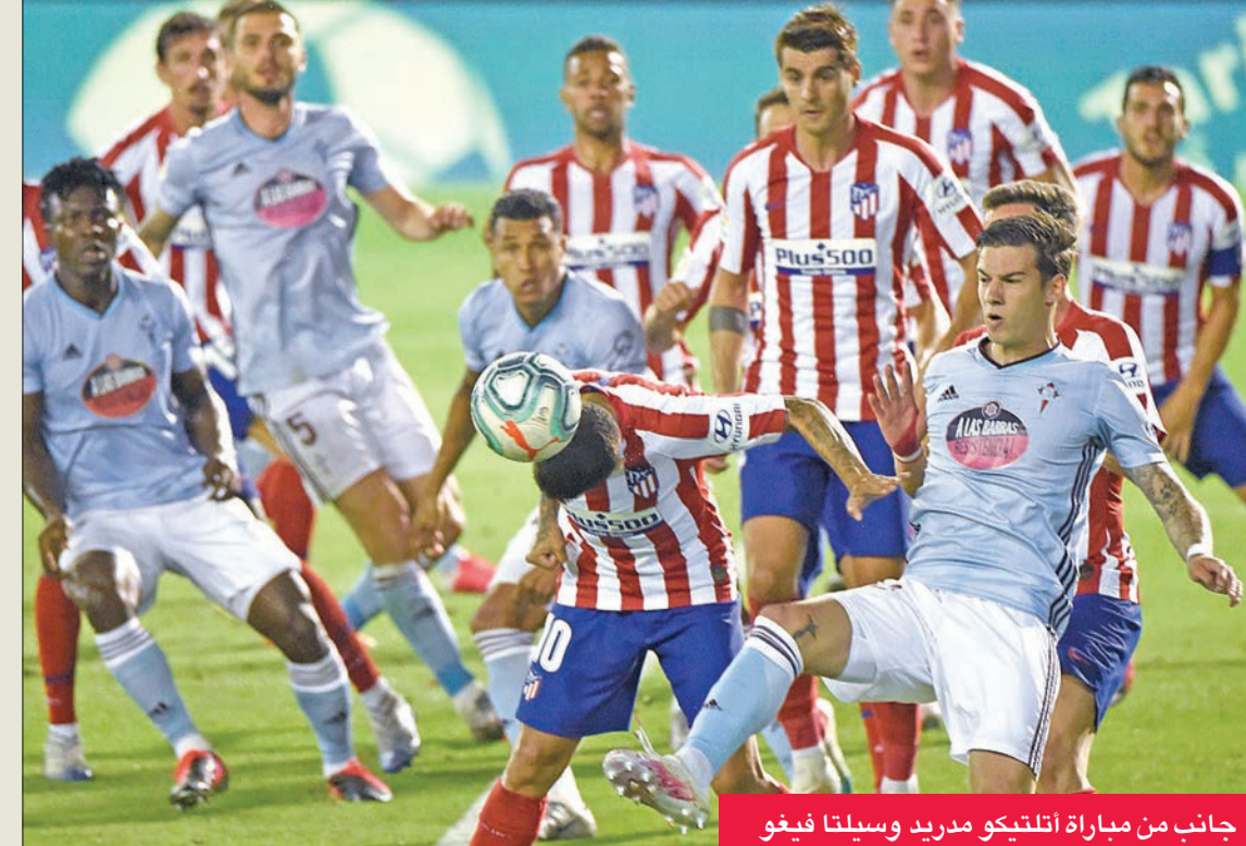
جانب من مباراة أتلتيكو مدريد وسيلتا فيغو

وتقام اليوم ثلاث مباريات تجمع بين إيبار وليغانيس، وريال مايوركا وليفانتي، وأتلتيك بلباو وإشبيلية. وتختتم الجمعة بمباراتي ريال سوسيداد مع غرناطة، وريال مدريد المتصدر مع الأفيس.