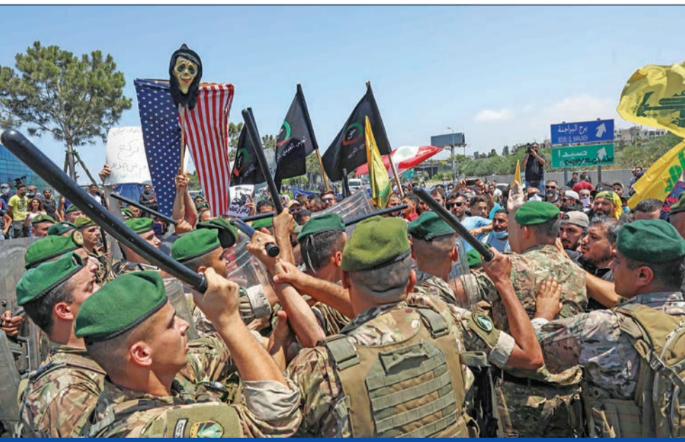
عناصر من الجيش تحاول إبعاد أنصار حزب الله الذين قطعوا طريق المطار احتجاجاً على زيارة ماكنزي

والتقى ماكنزي رئيس الجمهورية العماد ميشال عون في القصر الجمهوري في بعبدا، وأكد أهمية