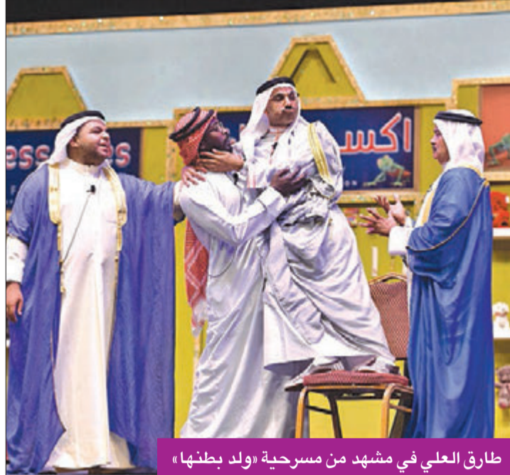
طارق العلي في مشهد من مسرحية «ولد بطنها»