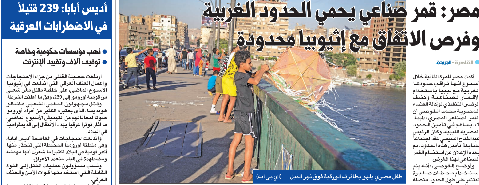
طفل مصري يلهو بطائرته الورقية فوق شهر النيل