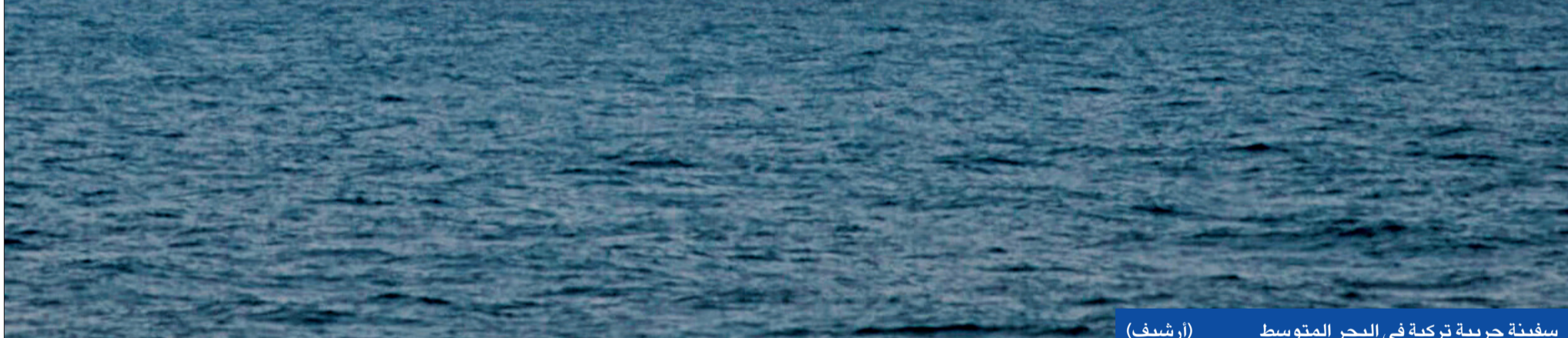
سفينة حربية تركية في البحر المتوسط (أرشيف)

وشدد وزير الخارجية المصري سامح شكري خلال اتصال هاتفى مع نظيره البريطاني دومينيك راب، على خطورة أي تدخلات أجنبية غير شرعية في ليبيا، منوهاً بضرورة احتواء الأزمة والعمل نحو التوصل إلى حل سياسي شامل يضمن استعادة الدولة