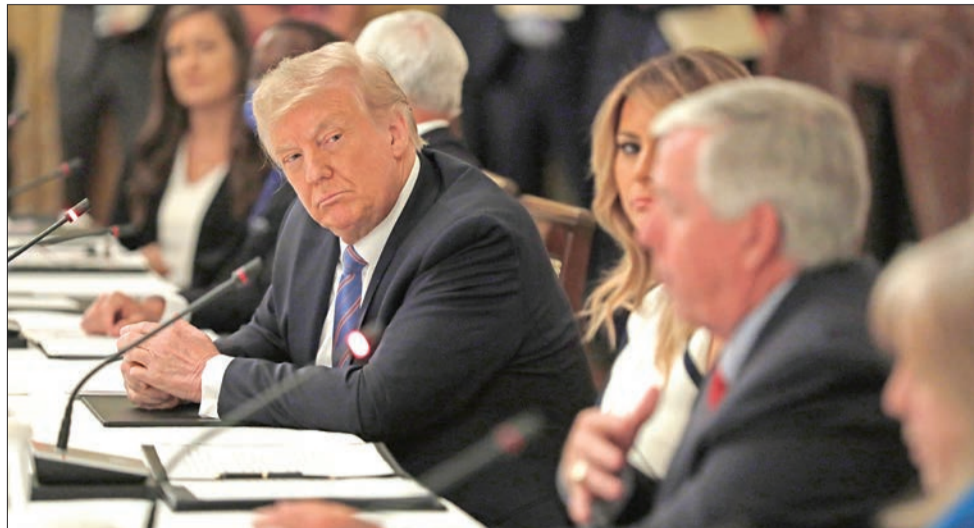
ترامب مشاركاً بحوار في البيت الأبيض لإعادة فتح المدارس أمس الأول

الرئيس يخالف تقديرات فاوتشي الصحية... وبايدن يتعهد بالعودة إلى «الصحة العالمية» إهانة عمر تدعو لتفكيك «النظام» • FBI: بكين لديها مرشحتون رئاسيون مفضلون