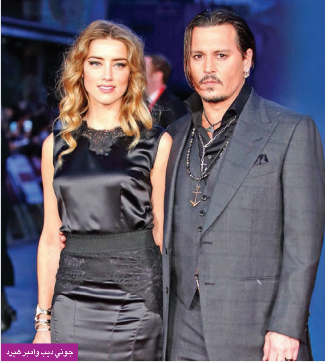
جونى ديب وأمبير هيرد

وفي الأوراق المقدمة إلى المحكمة، قال فريق ديب أيضاً إن هيرد بدأت علاقة غرامية مع الرئيس التنفيذي لشركة "تسلا" إيلون ماسك في أوائل 2015، بعد فترة وجيزة من زواجها، وانخرطت في علاقة واحدة على الأقل خارج إطار الزواج مع زملائها من الممثلين، لكن لم يُذكر سوى اسم الممثل جيمس فرانكو. ولدى سؤاله من المحامية ساشا واس، أقر ديب أنه تناول "كل الأدوية المعروفة للإنسان" منذ أن كان صغيراً حتى بلغ من العمر 14 عاماً، وقال إنه عانى طفولة صعبة، كما تأقلم بصعوبة مع شهرته ونجاحه. وغرض على المحكمة تسجيل مصور التقطته هيرد بهاتفها المحمول يظهر ديب غاضباً وهو يصغف أبواب خزنة المطبخ. ورد ديب قائلاً "يمكنني فقط أن أقول إنني كنت منزعجاً، منزعجاً جداً"، مضيفاً أن مشاهدة التسجيل كانت تجربة مزعجة. ورداً على المحامية واس، نفى ديب أن "الغضب الشديد يمثل جانباً سيئاً من شخصيته"، مضيفاً ديب في شهادته أن هيرد رشقته بزجاجة مما تسبب في إصابة أصبعه. بدوره، قال القاضي أندرو نيكول إن القضية ستستمر مدة ثلاثة أسابيع. ومن المقرر أن تقدم فانيسا بارادي، شريكة ديب السابقة والممثلة وينونا رايدر، أدلة عبر رابط فيديو.