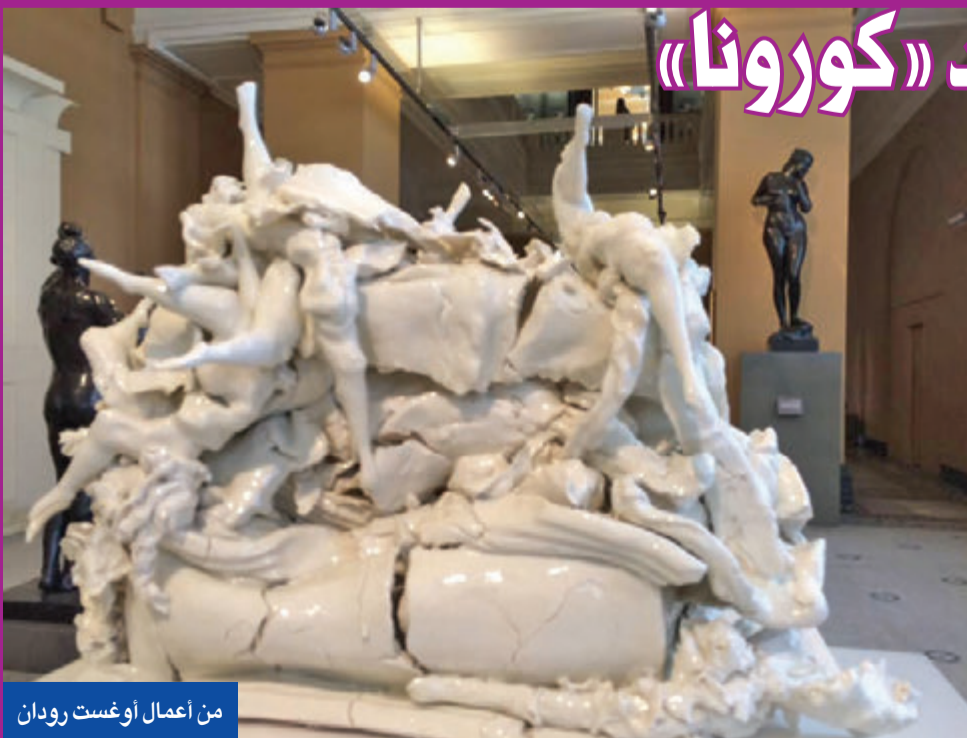
من أعمال أوغست رودان

غير أنه يتعين ألا تتجاوز النسخ الأصلية 12، وهو ما يعني أن منحوتة مثل "المفكر" لا يمكن نسخها مجدداً، في حين أن أربع نسخ من "أبواب الجحيم" يمكن بيعها. واجتذب المتحف، الذي افتتح للجمهور عام 1919، نحو 570 ألف زائر العام الماضي، 75 في المئة منهم سائحون أجانب. لكن من المتوقع أن ينخفض العدد هذا العام إلى 200 ألف بسبب مواصلة إغلاق فرنسا حدودها أمام كثير من السائحين الأجانب، خاصة الأميركيين، وفي ظل تطبيق قواعد التباعد الاجتماعي. وتأمل باريس أن تعود بقوة إلى النشاط الثقافي والفني لجذب السياح، لاسيما أنها افتتحت رسمياً متحف اللوفر الشهير أمام الزوار، مما يبعث الأمل على النهوض بالاقتصاد من بوابة السياحة من خلال عرض الأعمال الفنية لابراز الفنانين في العالم. (رويترز)