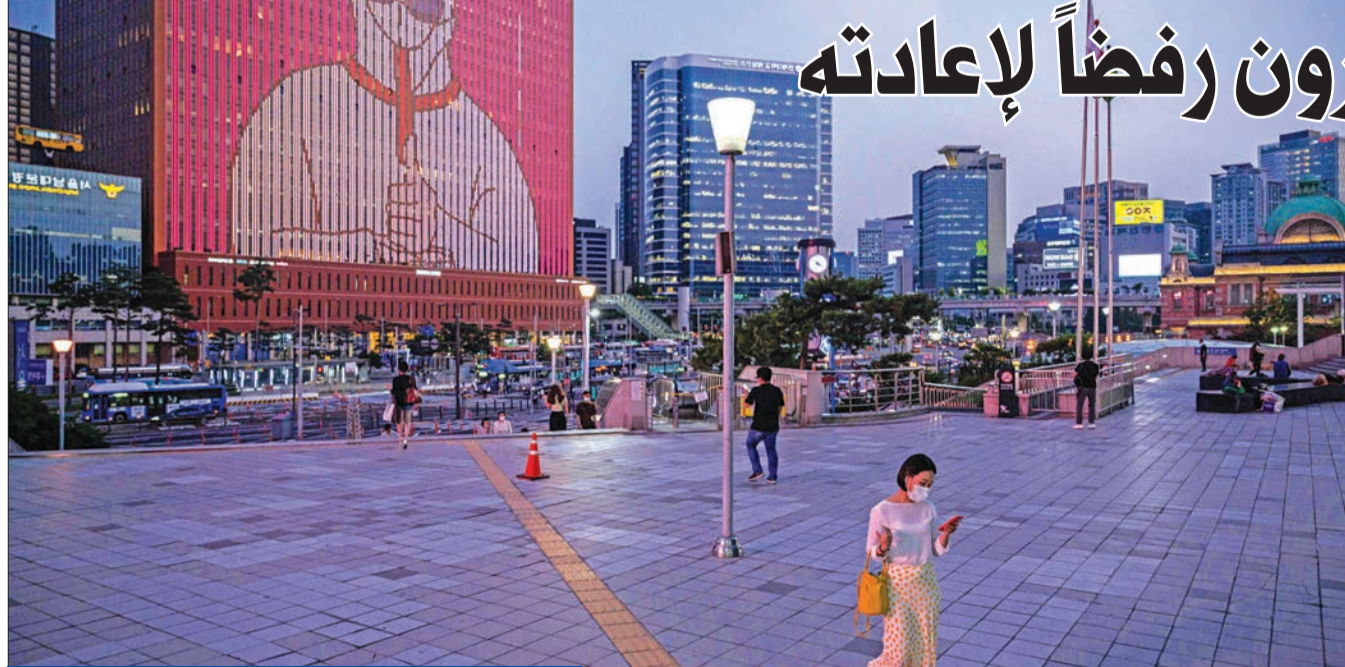
شاشة كبيرة تبث تعليمات صحية في سيول (أ ف ب)

وقال الرئيس الصربي ألكسندر فوسيتش، في وقت سابق، إن السلطات ستتخذ إجراءات أكثر صرامة، بما في ذلك إغلاق بلغراد خلال عطلة نهاية الأسبوع بسبب ارتفاع عدد الإصابات. ويتهم المعارضون الحكومة