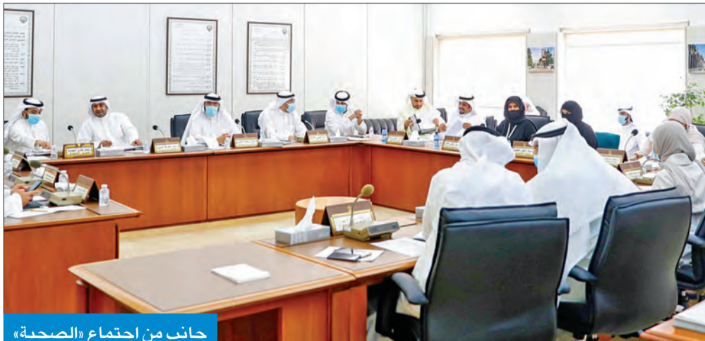
جانب من اجتماع «الصحية»

حماد: صندوق مالي لتعويضهم والحلول خلال أسبوع