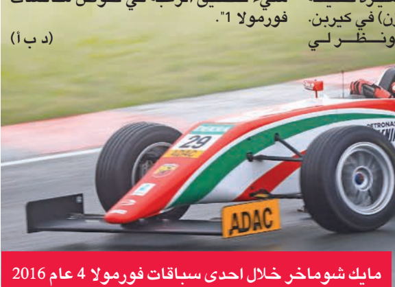
مايكل شوماخر خلال إحدى سباقات فورمولا 4 عام 2016

أكد مايكل شوماخر مجدداً رغبته في خوض منافسات سباقات سيارات فورمولا 1، التي يحمل والده الأسطورة الألماني مايكل شوماخر الرقم القياسي لها، بإحراز لقب بطولة العالم 7 مرات. وقال مايكل شوماخر، في تصريحات لمجلة «بلادي بوي»، لدى سؤاله عما يمكن أن يفعله في حالة عدم التمكن من خوض منافسات فورمولا 1، «لا توجد خطة بديلة، ولم تكن هناك خطة بديلة أبداً، لأنه عندما تكون هناك خطة بديلة، فأنت لا تسعى لتنفيذ خطتك الأساسية بالشكل المناسب». ويقضي مايكل (21 عاماً) موسمته الثاني في منافسات فورمولا 2، ضمن فريق بريما الإيطالية، كما أنه عضو باكادمية فيراري للسائقين الشباب، ويتطلع إلى خوض