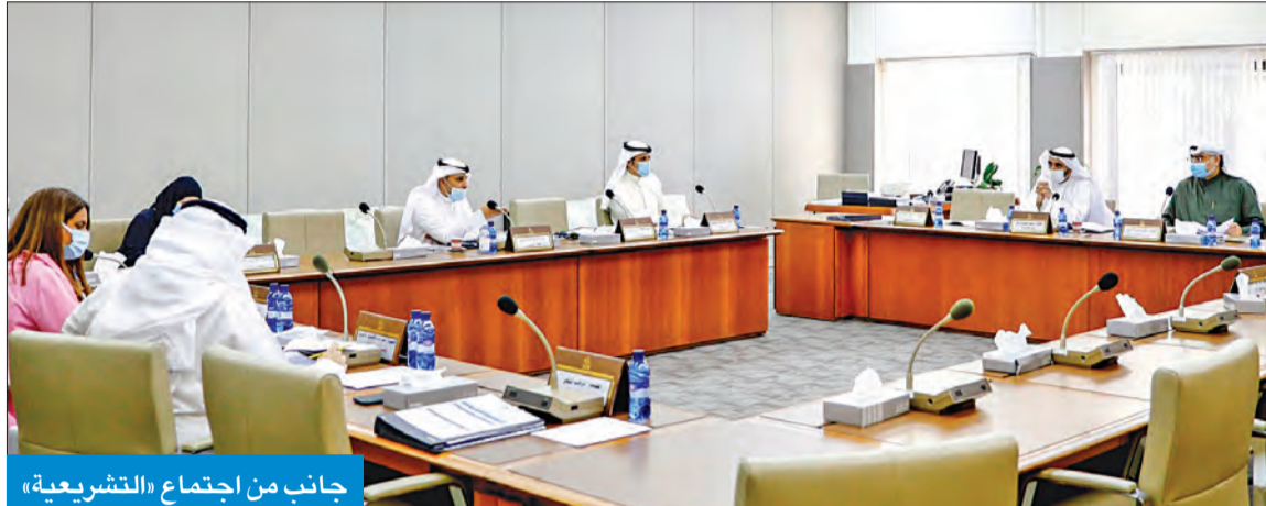
جانب من اجتماع «التشريعية»

● أقرت تعديل قانون الجزاء بإضافة الأم إلى جانب الأب في توقيع إجراء العمليات الجراحية الشطلي: وافقنا على 3 مقترحات بشأن مزاوله مهنة الطب البشري والأسنان