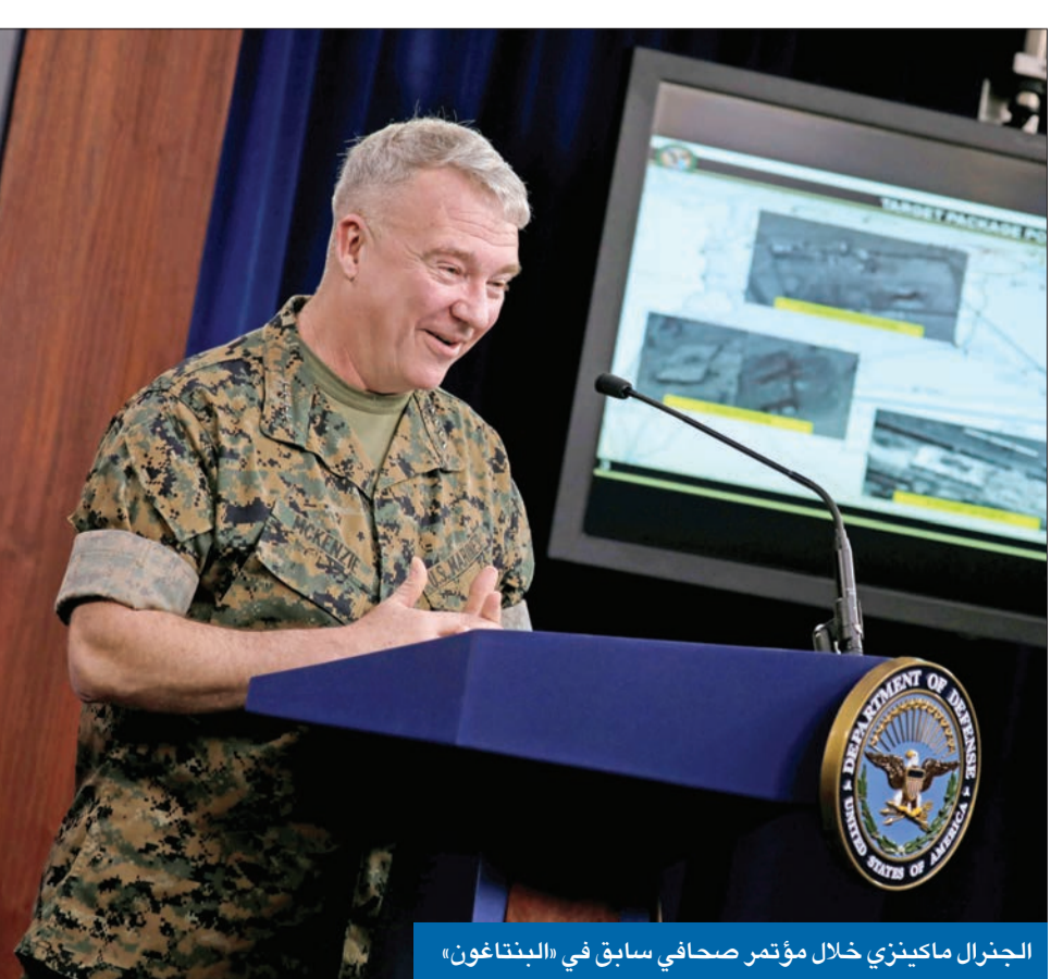
الجنرال ماكينزي خلال مؤتمر صحفي سابق في «البنطاغون»

أطلق قائد المنطقة الوسطى في الجيش الأميركي (سنككوم)، الجنرال كينيث ماكينزي جملة من المواقف، في خضم جولة بالمنطقة، شملت حتى الآن الكويت والسعودية والبحرين وقطر والأردن ولبنان والعراق وشمال سورية، هدفها مناقشة التحديات الأمنية المشتركة. ورغم رفضه الإجابة عن أسئلة تتعلق بالحوادث الغامضة في إيران، وبينها الانفجار في موقع نطنز النووي، فضلاً عن الهجوم المحدود الذي استهدف معدات أميركية في جنوب العراق، والتصعيد الحوثي ضد السعودية، اللذين رأى مراقبون أنه قد يكون وراءهما «تلاعب» رد إيراني، كان ماكينزي حازماً لجهة تحذير طهران من أن أي استهداف للقوات الأميركية سيكون ثمنه باهظاً. وقال ماكينزي، في مؤتمر صحفي عبر