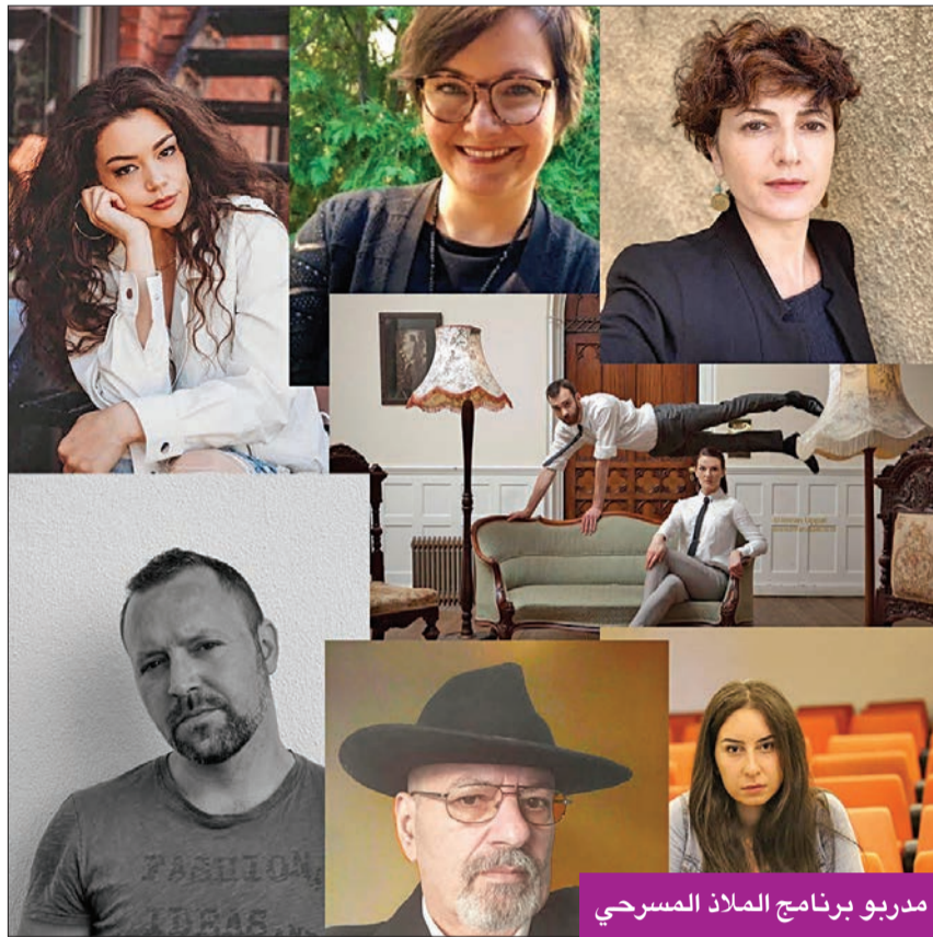
مدرّبو برنامج الملاذ المسرحي

وتتناول ورشة فوكس أساسيات الأداء الصوتي من خلال التقنيات العملية والمشاريع الشخصية، إذ سيكتسب المشاركون مهارات تحسين النطق والتنفس وغيرها، وسيساعدون ذلك في مشاريع المونولوج والخطابة والقراءة