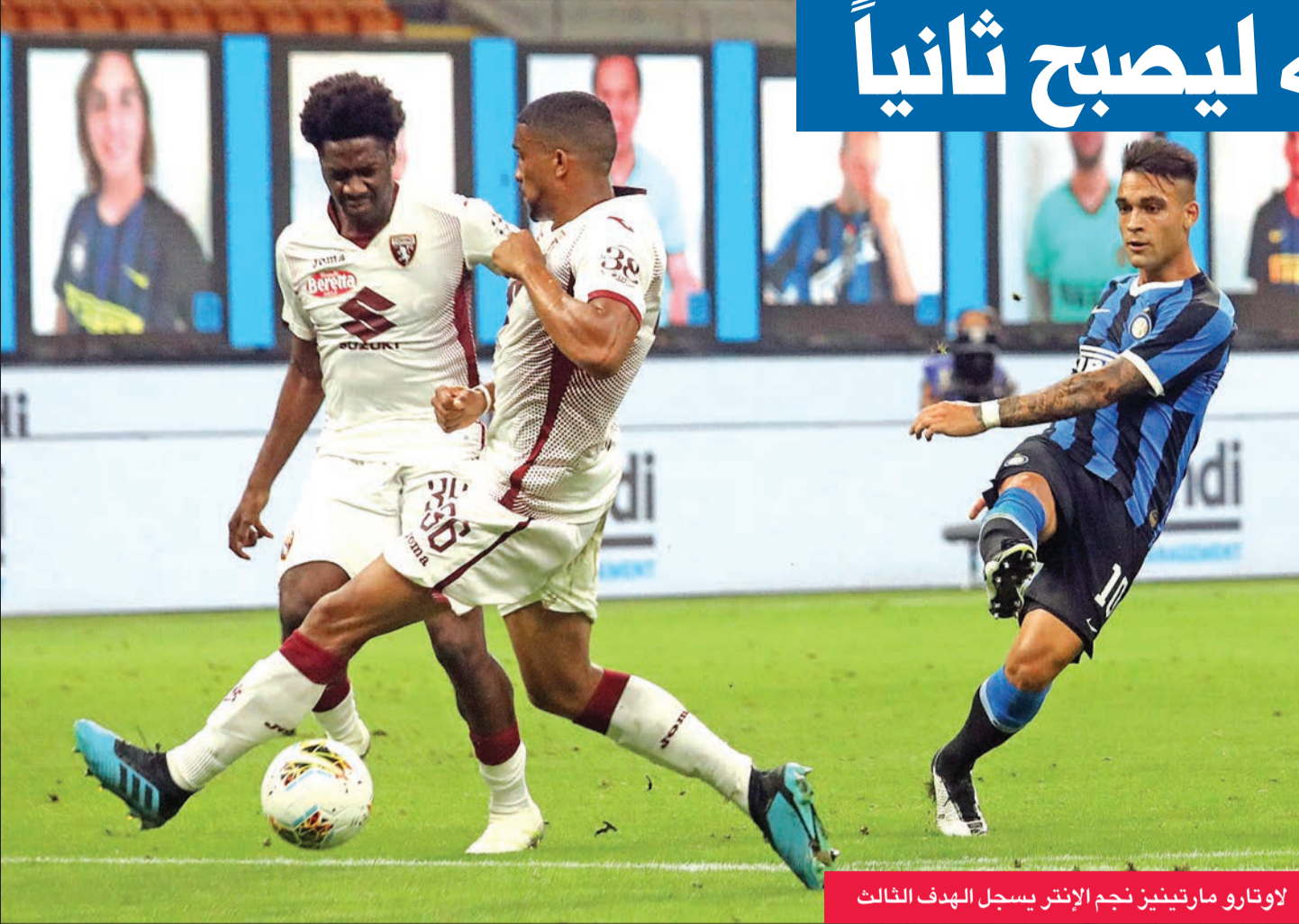
لاوتارو مارتينيز نجم الإنتر يسجل الهدف الثالث

والفائز على لاتسيو في المرحلة السابقة، والذي لم يخسر في مبارياته الست الأخيرة، بينما يحل لاتسيو، الذي خسر مبارياته الثلاث الأخيرة، ضيفا على أودينيزي اليوم أيضا. أما ميلان، الذي حافظ على سجله خاليا من الهزائم منذ الاستئناف بتعادله الأحد مع نابولي، فيستضيف بارما، بينما يلعب الفريق الجنوبي مع مضيفه بولونيا.