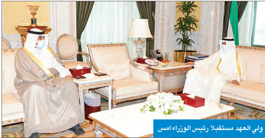
ولي العهد مستقبلاً رئيس الوزراء أمس

استقبل سمو ولي العهد الشيخ نواف الأحمد، بقصر السيف، صباح أمس، سمو رئيس مجلس الوزراء الشيخ صباح الخالد.