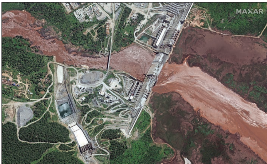
صورة من الأقمار الاصطناعية لسد النهضة

بعد يوم على اختتام المحادثات الخاصة بسد النهضة الإثيوبي من دون اتفاق بين الدول الثلاث المعنية لإثيوبيا ومصر والسودان، حول تشغيل السد، أفادت وكالة «أسوشيتد برس» الأميركية، بأن صوراً جديدة للخطتها الأمامية الاصطناعية لخزان بحيرة سد النهضة تظهر أنه قد بدأ بالامتلاء من جانبيها، ونشرت وكالة «رويترز»، صوراً غير مسبوقة عبر الأقمار الاصطناعية تظهر سد النهضة الإثيوبي ونهر النيل الأزرق في إثيوبيا.