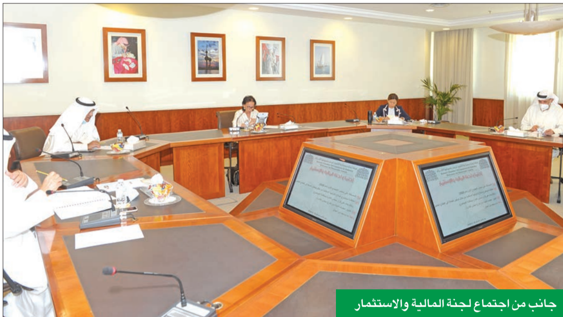
جانب من اجتماع لجنة المالية والاستثمار

أكدت اللجنة أن الاقتصاد الوطني يعاني مجموعة من الاختلالات الرئيسية، على رأسها محدودية دور القطاع الخاص في النشاط الاقتصادي، على الرغم من أن رؤية الكويت الجديدة 2035 تستند إلى الدور الريادي للقطاع الخاص في العملية التنموية.