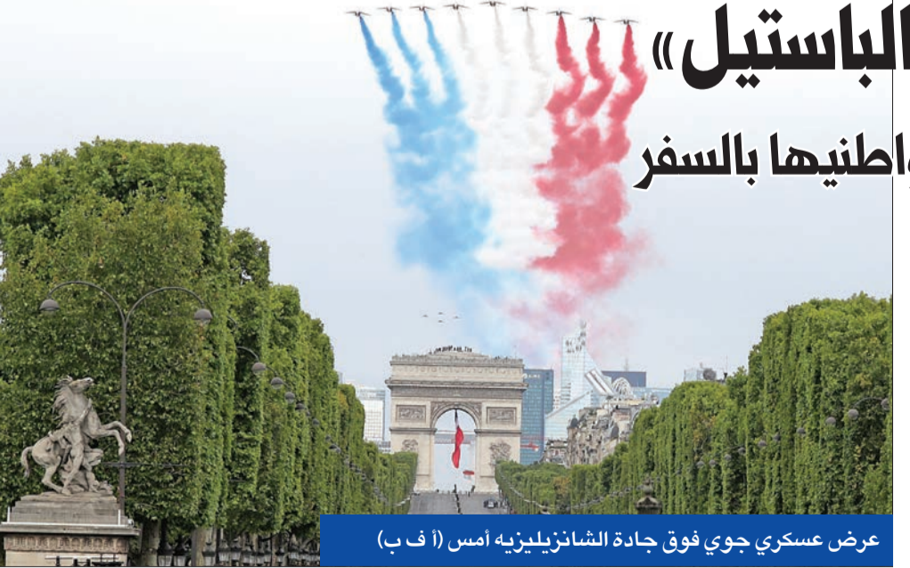
عرض عسكري جوي فوق جادة الشانزليزيه أمس

نقل الخبر متى سيسمح بالسفر. وفي أميركا، حاول البيت الأبيض التقليل من حجم التوترات بين الرئيس الأميركي دونالد ترامب وخبر الأمراض المعدية أنطوني فاوتشي، عضو خلية مكافحة فيروس كورونا الأساسي في فريقه حول خطورة تفشي الفيروس في أميركا، في حين أمر حاكم كاليفورنيا، غافين نيوسوم، دور السينما والمطاعم والحانات التي تستقبل الزبائن في