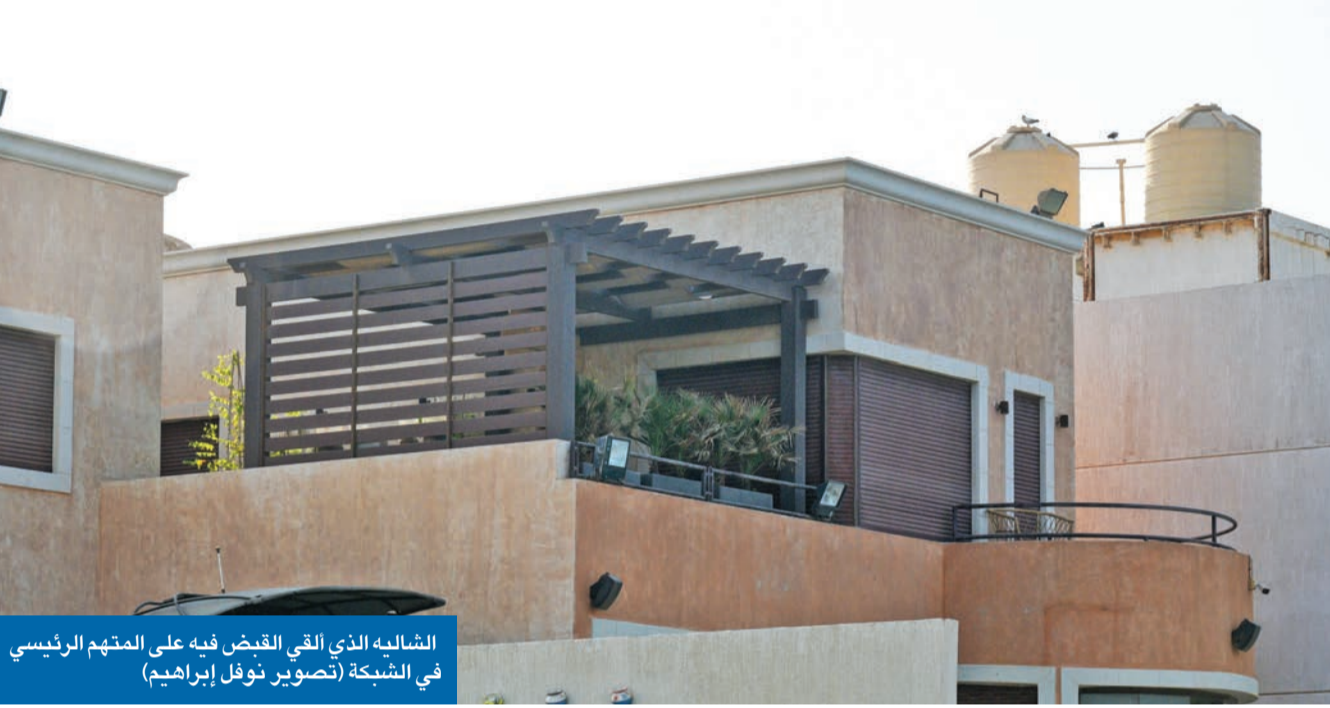
الشاليه الذي ألقى القبض فيه على المتهم الرئيسي في الشبكة

بعد رصد وتتبع وتحريات استمرت عدة أشهر، تمكنت أجهزة الأمن في البلاد من إلقاء القبض على شبكة غسيل أموال، بعد مدهمتها شاليها في منطقة بنيدر يقطنه الرأس المدير للشبكة، المتهم الرئيسي الذي علمت «الجريدة» من مصادرها، أنه واد إيراني متزوج من مواطنة، وأن تلك الشبكة مرتبطة بحزب الله اللبناني. وقالت الإدارة العامة للعلاقات والإعلام الأمني بوزارة الداخلية إن ضبط تلك الشبكة جاء بعد تتبع تحركات أفرادها في عدة مناطق بالبلاد، مبيئة أن الأجهزة داهمت أربعة مواقع أخرى يستخدمها المتهم، وهي منزل، ومزرعة بالوفرة، وشقتان في العاصمة والسالمية، وقامت بتفتيشها وتحفظت على بعض ما فيها. وأوضحت الإدارة، في بيان لها مساء أمس الأول، أن نتائج التفتيش انتهت إلى العثور على سيارات فارهة وكلاسيك مخزنة في المزرعة، ودراجات رباعية الدفع، وساعات ومجوهرات ثمينة، ومبالغ مالية بالعملة المحلية وغيرها، فضلاً عن عدد من كراتين الخمور. وأكدت أن التحقيقات مستمرة 02