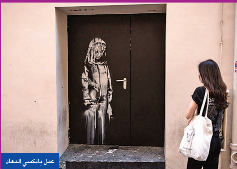
عمل بانكسي المعاد

حزينة، تحية للضحايا التسعين الذين سقطوا فيها نتيجة هجمات 13 نوفمبر 2015 في العاصمة الفرنسية. وسُرق العمل مع الباب الذي رسم عليه في يناير 2019. وعُثر على الباب المسروق في مزرعة ريفية بباروتسو في عملية مشتركة للشرطة الإيطالية والفرنسية. واقف 6 أشخاص في فرنسا نهاية يونيو الماضي، في إطار عملية واسعة للشرطة القضائية الباريسية في جبال الألب ومناطق من وسط البلاد. ووجهت إلى اثنين منهم تهمة السرقة، وإلى الأربعة الآخرين تهمة إخفاء مسروقات. يذكر أن بانكسي هو فنان غرافيتي إنكليزي مشهور ومجهول في نفس الوقت، يعتقد أن اسمه روبرت بانكسي من مواليد سنة 1974، وأصله من