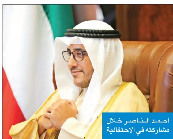
أحمد الناصر خلال مشاركته في الاحتفالية

من الجوانب ومجالات التعاون المشترك لكلا الجانبين، وأثنى على الموقف المشرف الذي اتخذته البعثة الاتحاد الأوروبي في الحفاظ على حقوق الشعب الفلسطيني الشقيق والاستمرار في دعم الخوصل إلى حل الدولتين ورفضه الممارسات الإسرائيلية غير المشروعة بضم أراض فلسطينية وعربية، علاوة على المواقف الإنسانية الداعمة للشعب السوري، كذلك المساعي الحميدة والحيثية لمساعدة العراق واليمن وليبيا والتخفيف من احتياجاتهم الإنسانية، مؤكداً أن الكويت ستبذل قصارى جهدها لمساعدة شركائها في الاتحاد الأوروبي في هذا السياق. وأشاد وزير الخارجية وأثنى على العمل الدؤوب الذي تقوم به بعثة الاتحاد الأوروبي في إطار تعزيز التعاون المشترك بين الجانبين والدفع بالعلاقات الثنائية إلى آفاق أرحب وأوسع وتحقيق جميع الأهداف المشتركة بينهما.