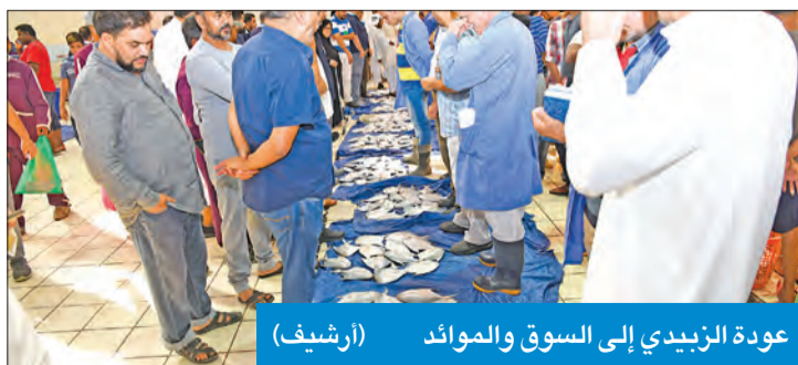
عودة الزبيدي إلى السوق والموائد

ترتّب عليه تراخى في الصيد خلال الشهور الماضية، بعد فرض الحظر الشامل، إلى جانب قرارات غلق أسواق الأسماك والمزادات المتأثرة بها.