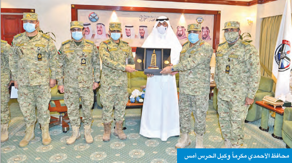
محافظ الأحمدى مكرماً وكيل الحرس أمس

أكد محافظ الأحمدى الشيخ فواز الخالد أن تضافر جهود الأجهزة الحكومية كان له أثر بالغ في مواجهة تداعيات جائحة كوفيد 19، متمنياً في هذا الصدد الدور الحيوي الذي قام به الحرس الوطني خلال تلك الأزمة.