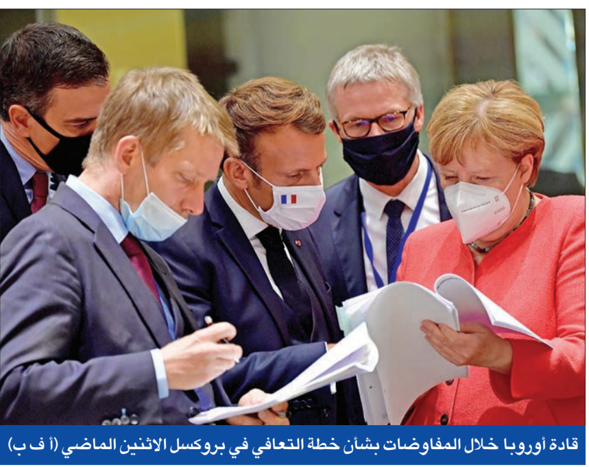
قادة أوروبا خلال المفاوضات بشأن خطة التعافي في بروكسل الإثنين الماضي

وقال زعيم حزب الرابطة الإيطالية، في مؤتمر صحفي بروما: «لا توجد هدايا لأحد، إنه قرض». في إشارة إلى الأموال التي قد تحصل عليها إيطاليا من حزمة دعم التعافي الأوروبية.