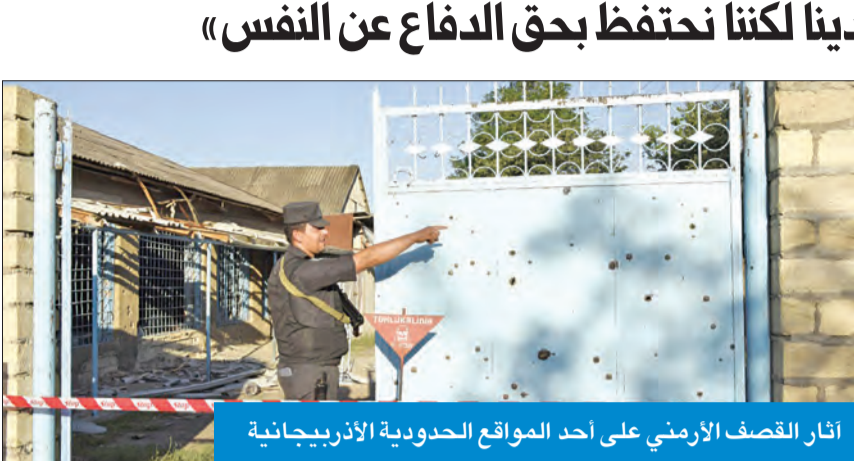
آثار القصف الأرميني على أحد المواقع الحدودية الأذربيجانية

أدانت سفارة أذربيجان لدى الكويت انتهاك القوات المسلحة الأرمينية وقف إطلاق النار على الحدود ومحاوله احتلال مواقع عسكرية حدودية أذربيجانية، والتي ردت على الاعتداءات. وقالت السفارة في بيان لها «انتهكت القوات المسلحة الأرمينية نظام وقف إطلاق النار في الحدود بين أذربيجان وأرمينيا، وقصفت بالمدفعية مواقع القوات المسلحة الأذربيجانية يوم 12 الجاري، وحاولت وحدات القوات المسلحة الأرمينية الهجوم للاستيلاء على المواقع الأذربيجانية في اتجاه مقاطعة توفول الأذربيجانية الواقعة في الحدود مع أرمينيا». وفي يومي 13 و 14 يوليو، واصلت وحدات القوات المسلحة الأرمينية تكثيف القصف المدفعي والأسلحة الثقيلة على المناطق السكنية، ومواقع عسكرية أذربيجانية في محافظة توفول، وانتهكت وقف إطلاق النار على حدود جمهورية ناخشيفان ذات الحكم الذاتي في اتجاه مقاطعتي شهبوز وجلفا لجمهورية أذربيجان، وأطلقت النار على