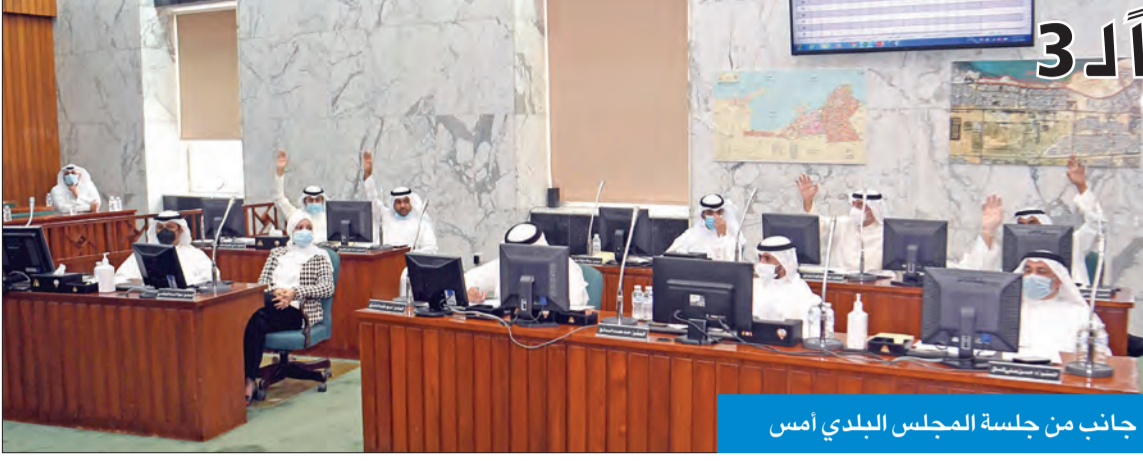
جانب من جلسة المجلس البلدي أمس