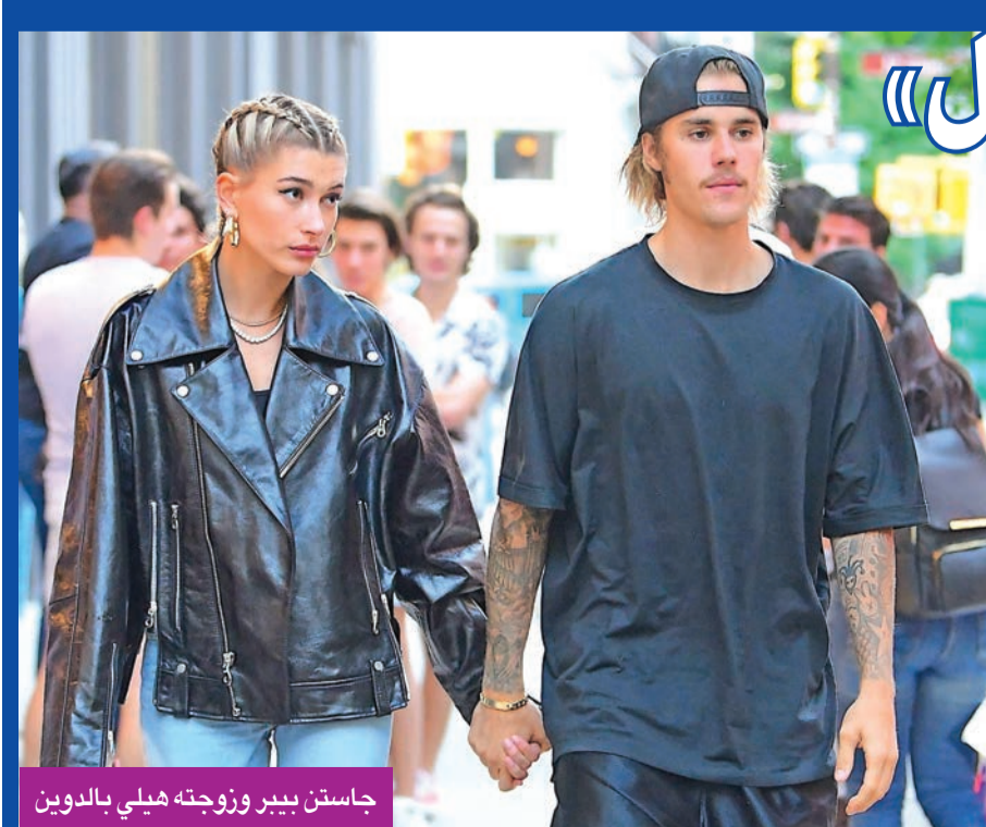
جاستن بيبير وزوجته هيلي بالدوين

أفادت تقارير إعلامية بأنه بعد أشهر من الحجر المنزلي، اختارت النجمة العالمية مونيكا بيلوتشي أن ترتدي فستاناً طويلاً من الدانتيل باللونين النبيذي والأسود، وجاءت الإطالة شديدة الأناقة من دار دولتشي أند غابانا. وبيّنت التقارير أن الممثلة الإيطالية البالغة 55 عاماً خلطت الانظار بجمالها، وهي التي كانت قد بدأت مسيرتها في عالم الأضواء من خلال مجال عرض الأزياء، ثم انتقلت إلى التمثيل. جاء ذلك خلال مشاركتها أمس الأول في فعاليات مهرجان تاورمينا السينمائي بدورته الـ 66 في إيطاليا، حيث تم تكريم دار دولتشي أند غابانا، من خلال المصممين ستيفانو غابانا ودومينيكو دولتشي. من جانب آخر، أعربت النجمة العالمية مونيكا بيلوتشي عن خوفها على ابنتها ديفا 15 عاماً من النجم الفرنسي فنسنت كاسيل، بسبب خوضها عرض الأزياء والموضة والإعلانات.