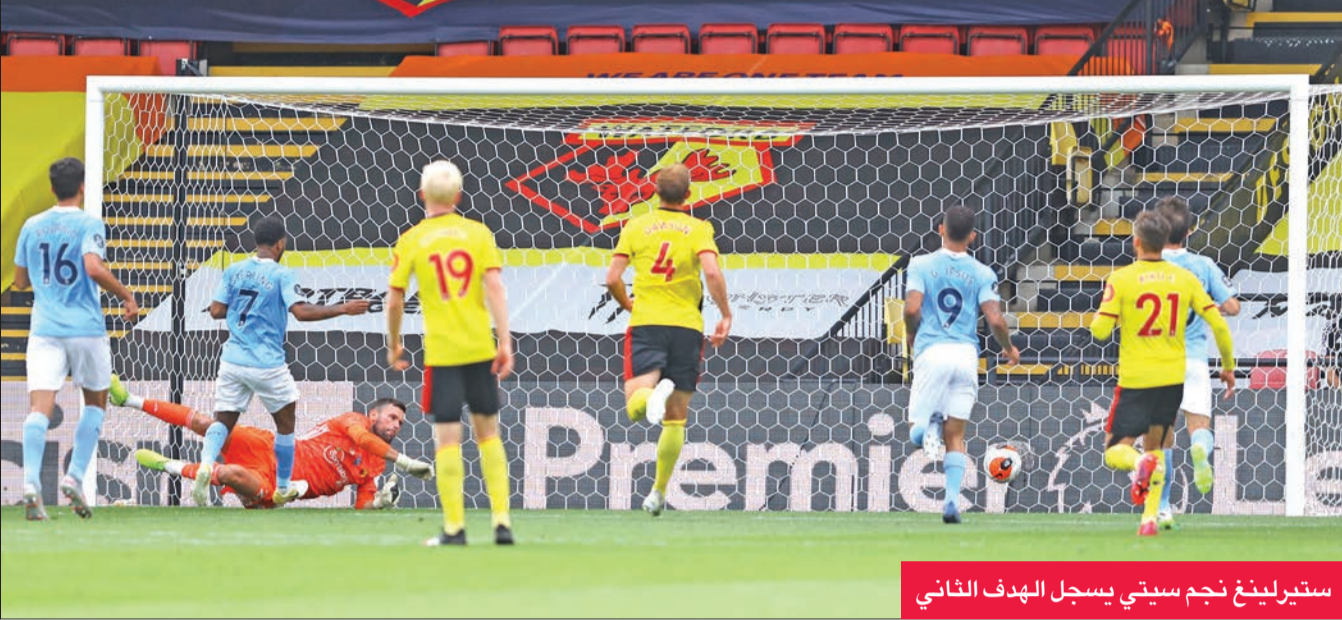
ستيرلينغ نجم سيتي يسجل الهدف الثاني

وصلت إليه الكرة من ركلة ركنية إلى الجهة اليمنى داخل المنطقة، فتابعها بعينه "على الطائر" على يسار الحارس الأرجنتيني إيميليانو مارتينيز (27) وهو الهدف الثالث في آخر ثلاث مباريات لتريزيغيه مع فيلا، بعد أن سجل ثنائية في مرمى كريستال بالاس في المرحلة 35. وانتظر أرسنال حتى الدقيقة 77 لتهدية مرمى أصحاب الأرض وكاد يعادل النتيجة لولا ناب الخاتم عن الحارس الإسباني بيبي رينا لإبعاد رأسية ادوارد نكيتيا.