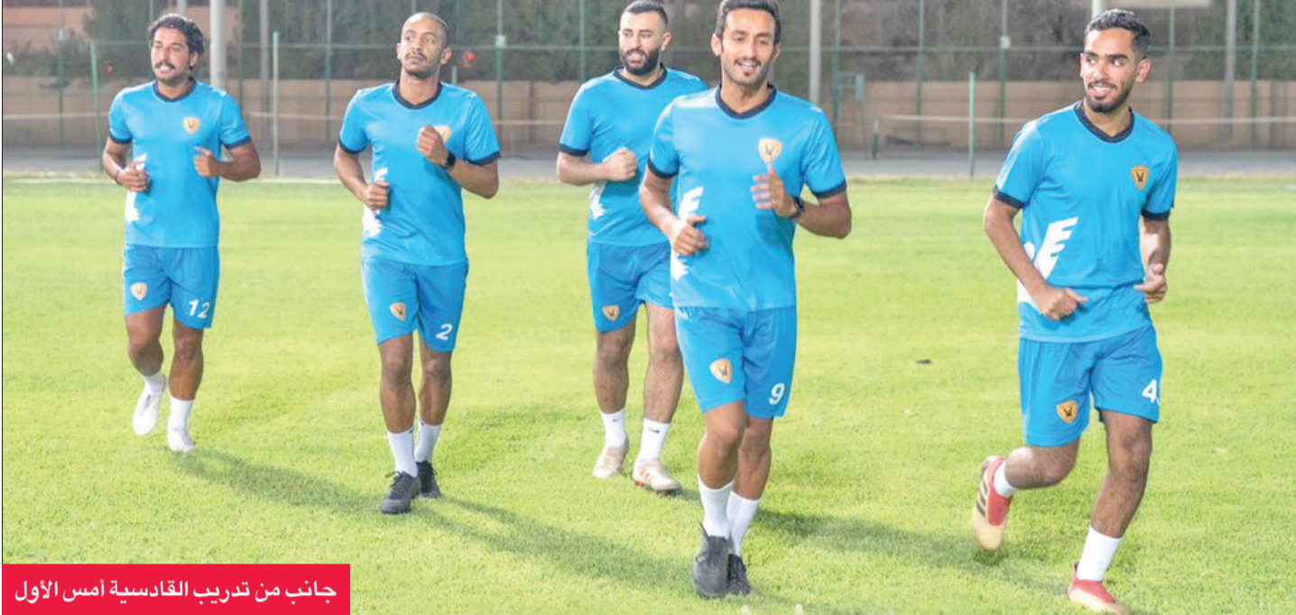
جانب من تدريب القادسية أمس الأول

بهذا الأمر، في إشارة إلى إمكانية إعارة أحد المحترفين خارج القادسية.