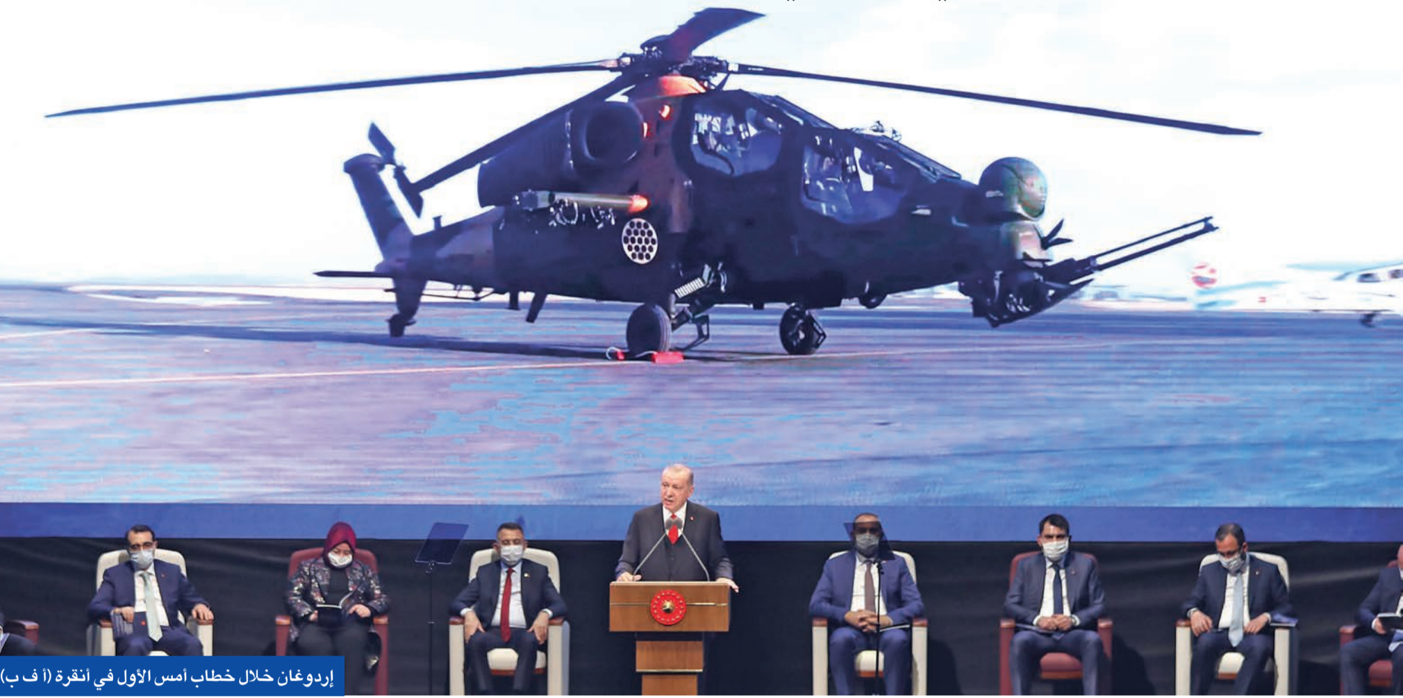
إردوغان خلال خطاب أمس الأول في أنقرة

وتجنب الخطوات التي يمكن أن تؤدي إلى زيادة التوترات، وصف الاتحاد الأوروبي الخطوة التركية بـ«الرسالة الخطئة».