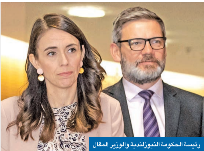
رئيسة الحكومة النيوزلندية والوزير المقال

أقالت رئيسة الوزراء النيوزلندية جاسيندا أردرن، وزير شؤون علاقات أساكن العمل والسلامة، وسط ادعاءات عن إقامة علاقة غير مناسبة مع واحدة من موظفيه.