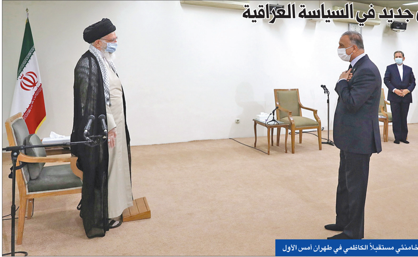
خامنئي مستقبلاً الكاظمي في طهران أمس الأول

ذكرت مصادر شيعية رفيعة في بغداد، لـ«الجريدة»، أن الحصيلة النهائية لزيارة رئيس حكومة العراق لطهران، والحراك سقياً، يتمثل في توافق الطرفين على دخول عهد مختلف وقواعد مغايرة نتيجة تحولات عميقة شهدتها العراق والمنطقة، وطى صفحة التدخلات السلبية التي ارتكبت بها ملفات الجانبين طوال 17 عاماً تلت سقوط صدام حسين. ورغم هذه التقديرات التي تتحدث عنها أرفع القيادات الشيعية في بغداد، عادة عودة الكاظمي من زيارة طويلة نسبياً لطهران، فإن الرأي العام العراقي وكثيراً من الساسة أدوا استياءهم من شكل الزيارة ولقاء الكاظمي بالمرشد الأعلى علي خامنئي، والتغريدات التي نشرها الأخير على «تويتر»، وأماتات بلغة تهديد واضحة للتغيرات التي تعارض نفوذها في العراق.