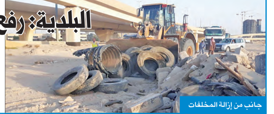
جانب من إزالة المخلفات

الإشرافي تطبيقاً للخطة التي تم وضعها بدأت برفع ونقل 855 م 3 من الأنقاض والمخلفات وتم ترحيلها إلى مواقع المرادم المخصصة لها من قبل البلدية. ولفت العدواني إلى مواصلة العمل في الموقع لاستكمال إزالة جميع المخلفات والأنقاض وتنظيفه تماماً.