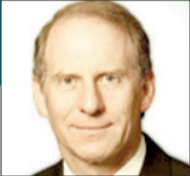
ريتشارد ن. هاس*

* رئيس مجلس العلاقات الخارجية ومؤلف كتاب "العالم: مقدمة موجزة" «بروجيكس سنديكيت، 2020، بالاتفاق مع «الجريدة»