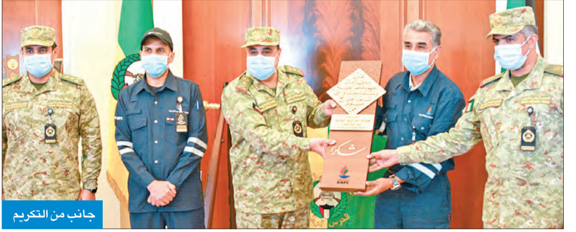
جانب من التكريم

أدانت سفارة أذربيجان لدى الكويت انتهاك القوات المسلحة الأرمينية وقف إطلاق النار على الحدود ومحاوله احتلال مواقع عسكرية حدودية أذربيجانية، والتي ردت على الاعتداءات. وقالت السفارة في بيان لها «انتهكت القوات المسلحة الأرمينية نظام وقف إطلاق النار في الحدود بين أذربيجان وأرمينيا، وقصفت بالمدفعية مواقع القوات المسلحة الأذربيجانية يوم 12 الجاري، وحاولت وحدات القوات المسلحة الأرمينية الهجوم للاستيلاء على المواقع الأذربيجانية في اتجاه مقاطعة توفول الأذربيجانية الواقعة في الحدود مع أرمينيا». وفي يومي 13 و 14 يوليو، واصلت وحدات القوات المسلحة الأرمينية تكثيف القصف المدفعي والأسلحة الثقيلة على المناطق السكنية، ومواقع عسكرية أذربيجانية في محافظة توفول، وانتهكت وقف إطلاق النار على حدود جمهورية ناخشيفان ذات الحكم الذاتي في اتجاه مقاطعتي شهبوز وجلفا لجمهورية أذربيجان، وأطلقت النار على