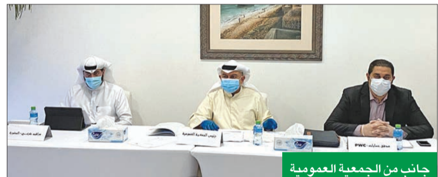
جانب من الجمعية العمومية

عقدت "البحرين الأولى" للتطوير العقاري أمس، اجتماع الجمعية العمومية السنوي للمساهمين للسنة المالية المنتهية في 31 ديسمبر 2019، واحتفلت الشركة بعودتها إلى الربحية، وإعلان إنشاء أول فرع لمكتبة جرير في البحرين، واستكمال مجمعها التجاري الجديد (البلكون) في الواحة البحرية للمناامة.