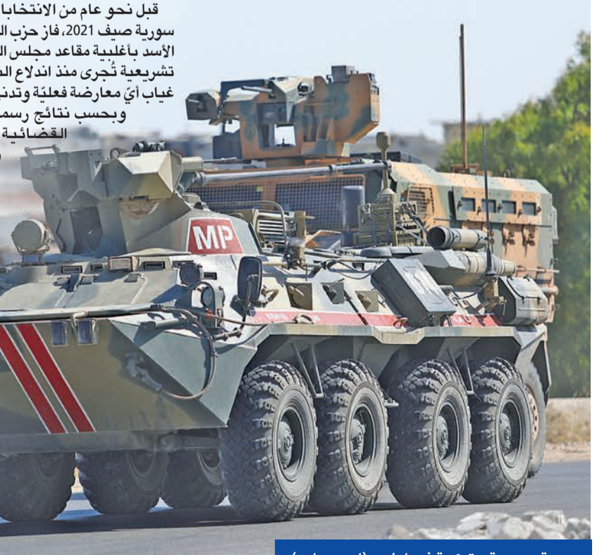
دورية روسية - تركية في إدلب

ولم يتمكن السوريون المقيمون بالخارج، وبينهم ملايين اللاجئين الذين شردتهم الحرب، من المشاركة في الاقتراع، كذلك بالنسبة إلى المقيمين في مناطق لا تزال تحت سيطرة الفصائل المناوئة لدمشق. وفي أول جلسة، يقوم البرلمان المنتخب بانتخاب