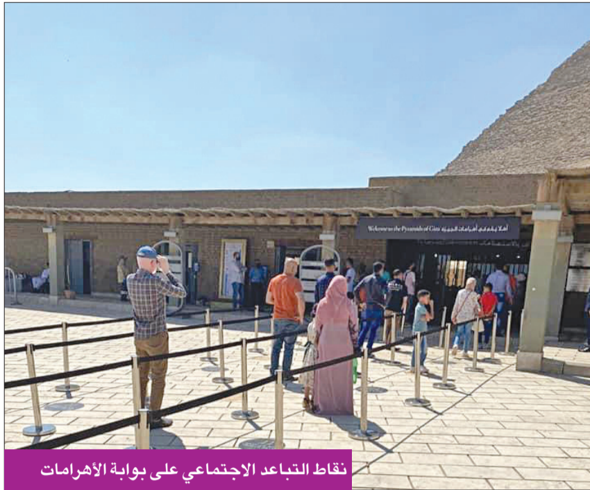
نقاط التباعد الاجتماعي على بوابة الأهرامات

الاماكن متحف النوبة، ومتحف الأقصر، والمتحف المصري بالتحرير، ومتحف الفن الإسلامي، والمتحف القبطي، ومعابد أوسمبل وفيله في فراء، والتزام المرشد السياحي بارتداء الكمامة، مع قيامه بالشرح باستخدام السماعات داخل المتاحف، وتعقيم السماعات بعد كل استخدام، على أن توفر شركات السياحة الكمامات للسائحين ومرافقيهم. وكذا وضع حد أقصى لعدد الزائرين الموجودين في الوقت ذاته داخل المتاحف والمواقع الأثرية غير المكشوفة على النحو التالي: 200 زائر في الساعة بالمتحف المصري بالتحرير، و100 زائر في الساعة في المتاحف الأخرى، ومن 10 إلى 15 فرداً لزيارة أي هرم أو مقبرة أثرية من الداخل (حسب مساحة الأثر).