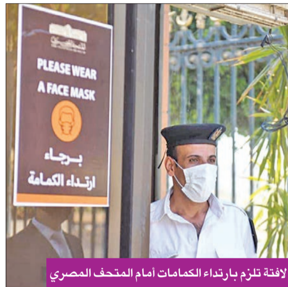
لافتة تُلزم بارتداء الكمامات أمام المتحف المصري

عادت الحياة إلى طبيعتها في مصر وفق مبدأ التعايش مع أزمة كورونا التي بدأت تخف وطأتها تدريجياً، إذ فتحت العديد من المتاحف والمعالم الأثرية أبوابها للزائرين منذ مطلع يوليو الجاري بعد توقف دام نحو ثلاثة أشهر، لكن جائحة الفيروس التاجي فرضت شروطاً لزيارة هذه المعالم أبرزها وضع "حد أقصى" لدخول الأماكن الأثرية، كإجراء احترازي في مواجهة "كوفيد-19".