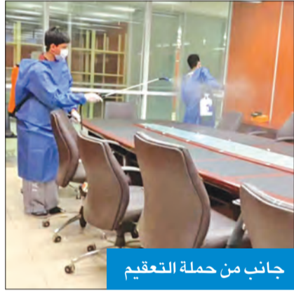
جانب من حملة التعقيم