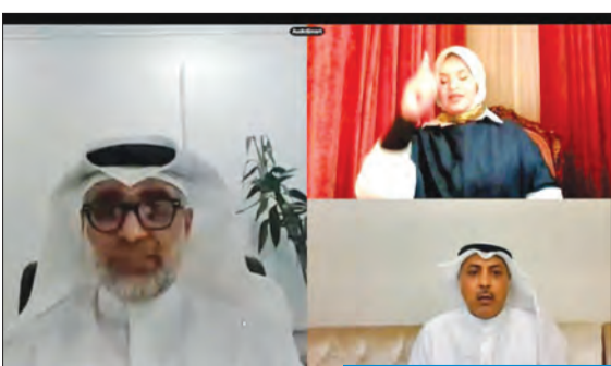
مشاركون في الملتقى

المطيري: نسعى إلى دمج ذوي الإعاقة في جميع الأنشطة الحياتية والمجتمعية