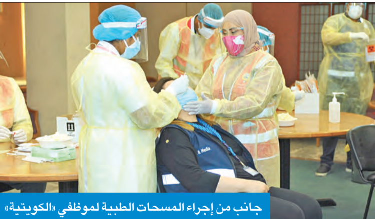
جانب من إجراء المسحات الطبية لموظفي «الكويتية»

العززي: مستعدون لانطلاق رحلتنا التجارية مطلع أغسطس المقبل