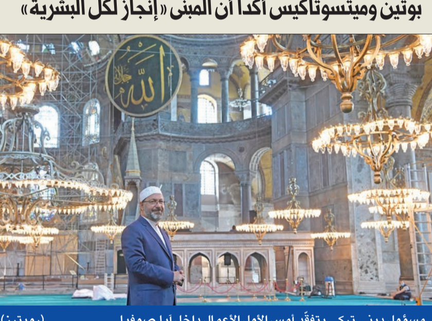
مسؤول ديني تركي يتفقد أمس الأول الأعمال داخل آيا صوفيا

أعلن والي إسطنبول علي يرليقيا، أمس، أثناء تفقده الاستعدادات لإقامة أول صلاة جمعة في كاتدرائية آيا صوفيا، اليوم، بعد 86 عاماً من تحويلها إلى متحف، أن «الجامع الذي يعد أحد أروع المزارات الدينية في العالم، والذي يعد رمزاً لفتح إسطنبول (29 مايو 1453) سيفتح للعبادة غدا الجمعة (اليوم)». واعتبر في تصريح صحفي أدلى به، في باحة آيا صوفيا، أن «الجمع يريدون المشاركة في افتتاح آيا صوفيا، هناك اهتمام كبير. لقد قمنا باستعداداتنا لإدارة هذا الملتقى بطريقة تناسب القيمة الرمزية للحدث». وذكر الكرملين في «بجهد ومناقب السلطان محمد الفاتح الثاني وجنوده، الذين لم يدخروا جهداً في سبيل المحافظة على آيا صوفيا، كصرح يمثل الإنسانية جمعاء»، ولفى إلى أن «أداء الصلاة سيتم اعتباراً من الساعة 10 صباحاً»، راجياً من المشاركين إحضار كماداتهم، وسجادات الصلاة، والتخلي بالملابس البسيطة. وفي 10 يوليو الجاري، ألغت المحكمة الإدارية العليا التركية، قرار مجلس الوزراء الصادر في 24 نوفمبر 1934، بتحويل آيا صوفيا من مسجد إلى متحف. ويعد بيومين، أعلن رئيس الشؤون الدينية