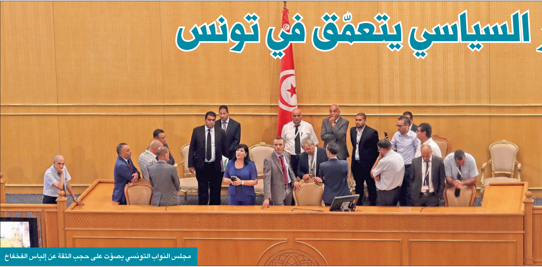
مجلس النواب التونسي يصوت على حجب الثقة عن إلياس الفخاخ