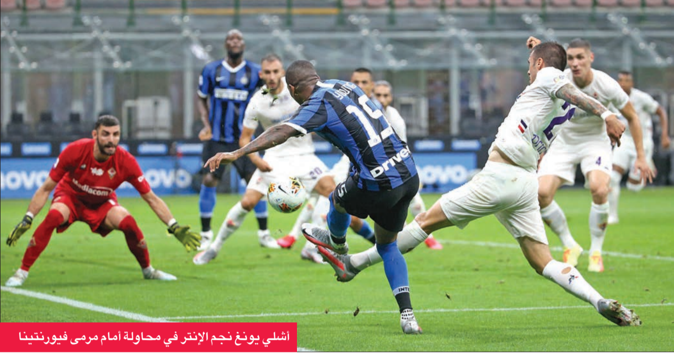
اشلي يونغ نجم الإنتر في محاولة أمام مرمى فيورنتينا

الثامن عشر بفارق أربع نقاط خلف جنوى السابع عشر وصاحب آخر المركز المُقْبِية في الدرجة الأولى، والفائز على جاره ومضيفه سمبوريا بهدفين لدومينيكو كريستشيتو (22) من ركلة جزاء) والدنماركي لوكاس ليراغ (72) مقابل هدف لمانولو غابياياديني (32)، والحق بريشيا بسبيل إلى الدرجة الثانية، بعدما تجمد رسيدته عند 24 نقطة في المركز قبل الأخير. وتعادل تورينو مع ضيفه هيلاس فيرونا بهدف لسيموني تسانتسا (67) مقابل هدف لغابيو بوريني (56) من ركلة جزاء).