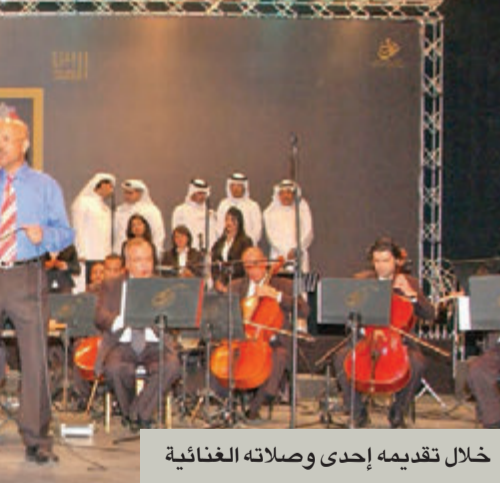
خلال تقديمه إحدى وصلاته الغنائية