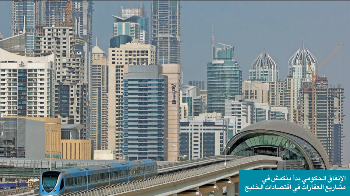
الاتفاق الحكومي بدأ ينكمش في مشاريع العقارات في اقتصادات الخليج

قدرة المنطقة على الاستفادة من العائد الديمغرافي، أي تفعيل النمو الاقتصادي بفضل فئة الشباب المستعدة للمشاركة في سوق العمل بأعلى درجات الإنتاجية. يعني التحلي عن هذه الفئة اليوم أن يواجه الأجيال، حين يتقدم الشباب في السن، سبب قلة الفرص. في ما يخص السياسة المالية، يطرح هذا الوضع مشاكل كارثية حتى دول الخليج الثرية تعجز عن تجنبها تزامناً مع تصاعد مشكلة المساواة بين الأجيال. حين يتقدم الشباب في السن، سيصبحون عبئاً متزايداً على الحكومات في مجالات الرعاية الصحية والإسكان والإنفاق الاجتماعي.