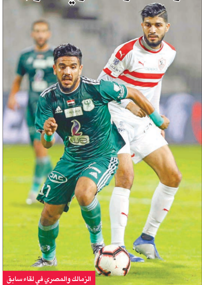
الزمالك والمصري في لقاء سابق

حين سيعلن جدول بقية المباريات على ضوء ما سيعلنه الاتحاد الإفريقي من مواعيد لمباريات الأهلي والزمالك في مسابقة دوري أبطال أفريقيا، وبيراميدز في كأس الاتحاد الإفريقي. وكان الاتحاد الإفريقي للعبة (كاف) حدد شهر سبتمبر لإقامة نصف نهائي ونهائي مسابقتي دوري الأبطال وكأس الاتحاد. ويلعب الأهلي والزمالك مع الوداد والرجاء المغربيين في نصف نهائي دوري أبطال إفريقيا، وبيراميدز مع حوريا كوناكري الغيني في نصف نهائي كأس الاتحاد الذي يشهد مواجهة مغربية مغربية بين نهضة بركان وحسنية أغادير.