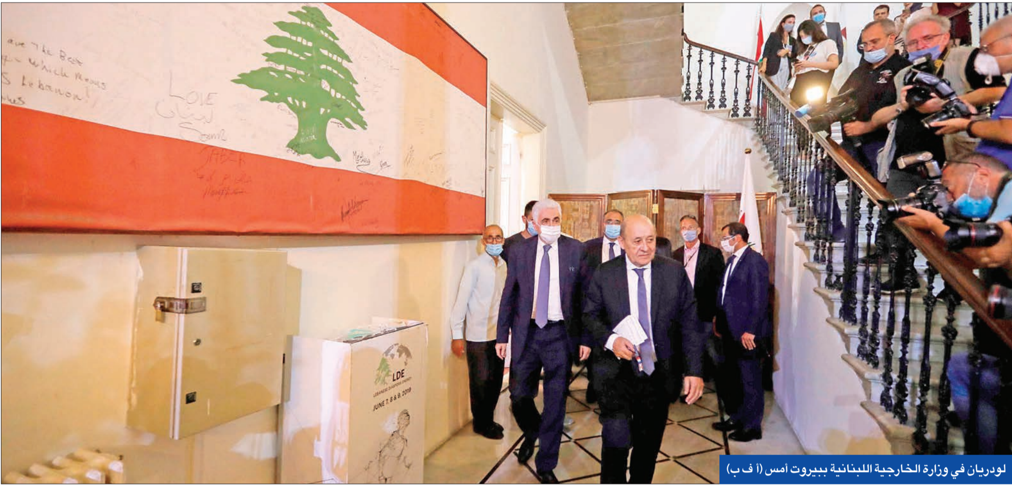
لودريان في وزارة الخارجية اللبنانية ببيروت أمس

وقبل الوزير الفرنسي إلى عون رسالة شفوية من نظيره الفرنسي إيمانويل ماكرون أكد فيها «وقوف فرنسا إلى جانب لبنان في الظروف الصعبة التي يمر بها، كما كانت دائماً وعبر التاريخ». وقال لودريان، إن بلاده «مصممة على مساعدة لبنان وهي تتطلع إلى إنجاز الإصلاحات الضرورية التي يحتاج إليها»، مؤكداً أن «مفاعيل مؤتمر (سيدرا) لا أن تعمل في هذا المجال وبشكل سريع والوقت ضاغط ويعمل لغبر مصطلحاتنا»، معتبراً أن «مؤتمر (سيدرا) يعكس الاهتمام الفرنسي بلبنان». وأعلن أن «فرنسا تدعم دائماً قوة السلام اليونيفيل، ونحن أكدنا عدم المساس بمهامها». وأضاف أن فرنسا ستساعد المدارس.