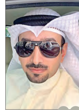
آلية حجز المواعيد طورت العمل في مؤسسات الدولة