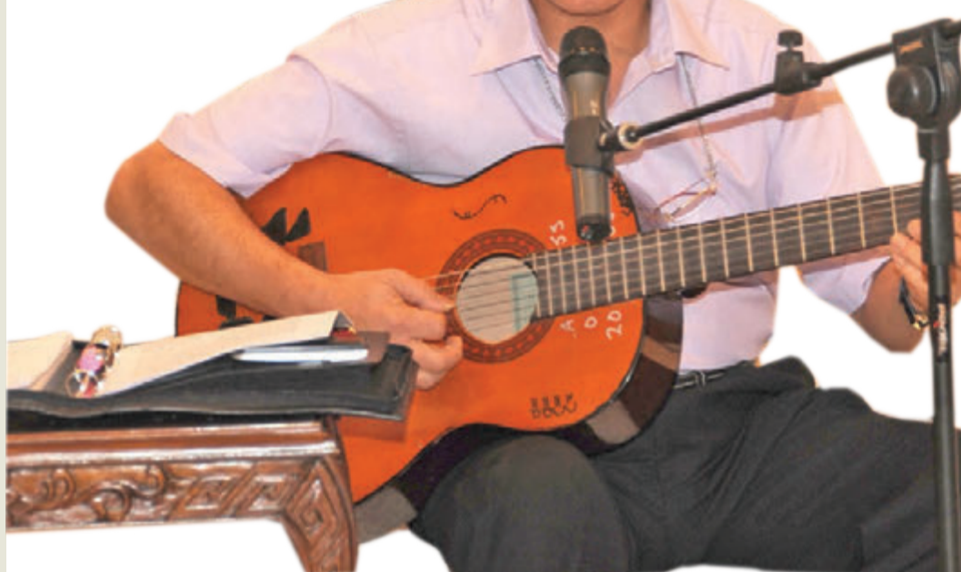
خلال تقديمه إحدى وصلاته الغنائية

ويشير إلى أن الأغنية الفلسطينية تحضّن بياناً وموقفاً إنسانياً وسياسياً يعلنه الأفراد والأحزاب، وتحمل فلسفة ومواقف منتجها ووجهة نظره، بل الأساليب الحلول التي يراها ويتبناها لمقاومة العدو وتحقيق الانتصار. لذلك، نلاحظ تنوع نصوص هذا الشكل من الأغاني بقدر تنوع الفصائل الفلسطينية ومواقفها السياسية، وفلسفة كل منها، وأيديولوجيتها، فكل منها يملك صانعين ومحترفين يبدعون له، خصوصاً الأغاني التي تطير بفلسفته عبر الأثير إلى شتى الأذان، والأغاني الخاصة التي ترد في مهرجانات كل فصل، وتمثله بالمناسبات العامة والمشاركة.