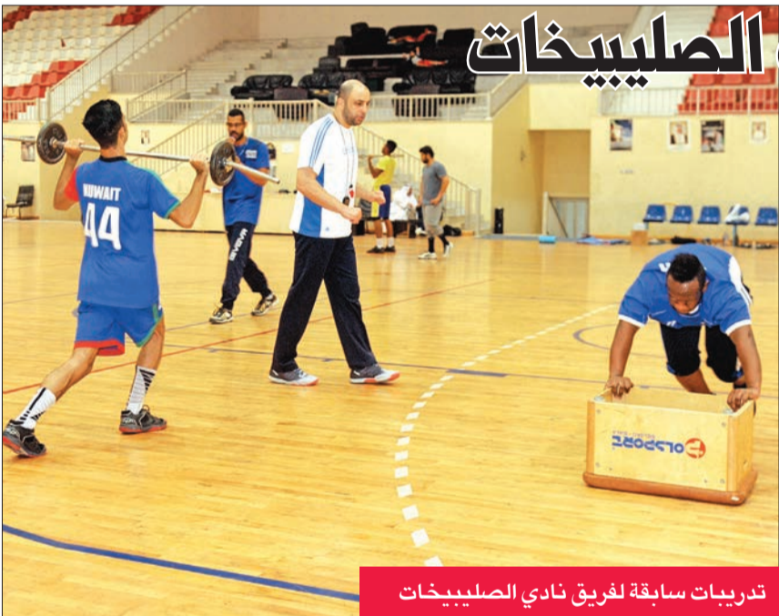
تدريبات سابقة لفريق نادي الصليبيخات

تبرع الأمير منصور بن مشعل المشرف العام على كرة القدم في نادي أهلي جدة السعودي بمبلغ ستة ملايين ريال لدعم خزينة النادي. ووصف عبد الإله مؤمنة رئيس الأهلي، الدعم بأنه غير مستغرب من جانب الأمير بن مشعل، ويأتي استمراراً لدعمه النادي والمعنوي لفريق الكرة. وأكد مؤمنة أن الدعم سيساهم بكل تأكيد في توفير الأجواء المناسبة للاعبين والجهازين الفني والإداري لتحقيق الفريق الانتصارات المتتالية في كل البطولات التي يشارك في منافساتها. ويستعد الأهلي لاستئناف دوري كأس محمد بن سلمان في الرابع من أغسطس المقبل، إذ يحتل المركز الرابع برصيد 37 نقطة، كما يتأهب لمواجهة النصر في نصف نهائي كأس خادم الحرمين الشريفين، ويتصدر الفريق مجموعته الأولى في دوري أبطال آسيا.