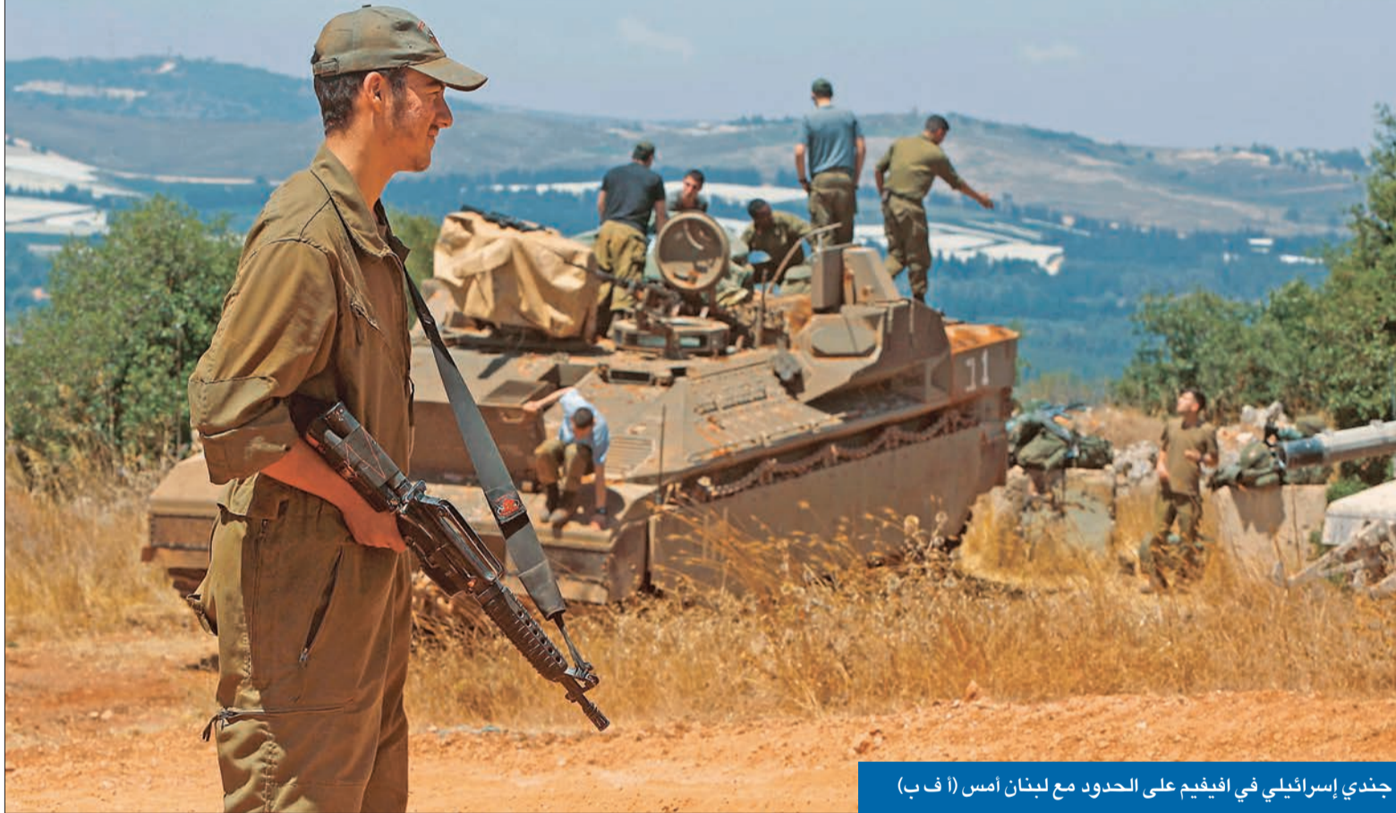
جندي إسرائيلي في أفيم على الحدود مع لبنان أمس