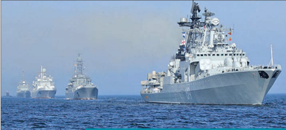
الأسطول الروسي يحصل على تحسين واضح في قدراته العملية

جديدة تهدف إلى تطوير المنطقة القطبية الشمالية حتى عام 2035، وتشمل جذب استثمارات وخلق وظائف، وبيد الكرملين أيضاً بناء طريق تجارية في المنطقة القطبية الشمالية تهتم بالملاحة الدولية، وهو مشروع يحظى بأولوية لدى الرئيس الروسي فلاديمير بوتين منذ طرح الفكرة في عام 2018. ويعقد بوتين أن حصيلة الشحن عبر طريق البحر الشمالي يمكن أن تصل إلى 80 مليون طن بحلول عام 2024، وهو هدف طموح جداً، نظراً لأن الحصيلة كانت 10.7 ملايين طن في عام 2017، و20.2 مليون طن في عام 2018، و31.5 في عام 2019.