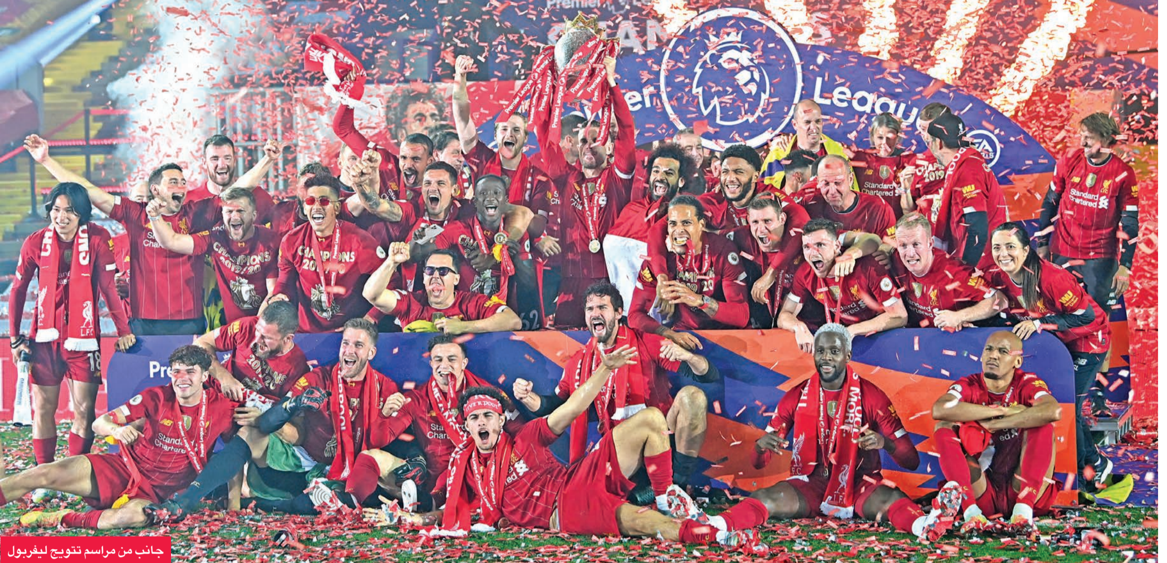
جانب من مراسم تتويج ليفربول

الخامس عشر مبتعدا بربع نقاط عن أستون فيلا السابع عشر، وواتفورد الثامن عشر (34 نقطة لكل منهما).