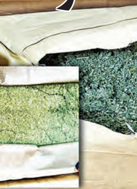
جانب من المضبوطات

من عينة الكيميكال، و600 غرام من بودرة الكيميكال، و2 كيلو ونصف الكيلو غرام بودرة مخدرة، كل منها في طرد مستقل. وأضاف المطيري، أنه بناء على تلك الضبوطات وحسب القوانين الجزمكية والإجراءات المتبعة تم عمل اللازم والتعاون مع البحث والتحريري الجمركي والتنسيق مع الإدارة العامة لمكافحة المخدرة التابعة لوزارة الداخلية لاتخاذ ما يلزم من إجراءات قانونية.