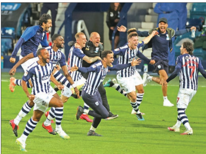
فرحة لاعبي ويست بروميتش بالتأهل للدوري

لحق وست بروميتش البيون بليدز يونائيكد إلى الدوري الممتاز، بتعاقبه مع ضيفه كوينز بارك رينجرز 2-2، أمس الأول، في المرحلة الأخيرة من دوري الدرجة الأولى الإنكليزي لكرة القدم الثانية (عمليا).