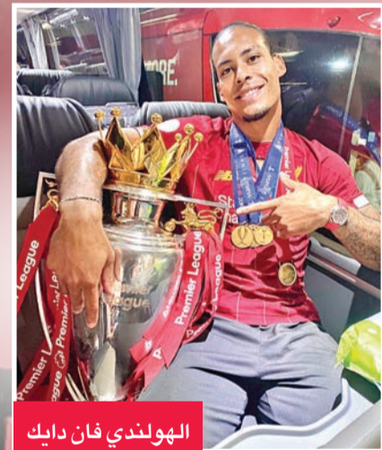
الهولندي فان دايك

عبر فيرجل فان دايك، نجم لليفربول الإنجليزي، عن سعادته الغامرة بالفوز بلقب الدوري الإنجليزي الممتاز، بعد مراسم التتويج التي جرت أمس الأول.