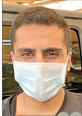
الأزمة أثبتت مدى الحاجة إلى التعامل الإلكتروني