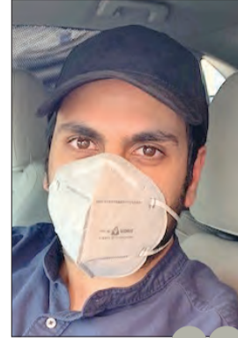
خطوة ناجحة ساهمت في توعية الناس وإدخال ثقافة جديدة