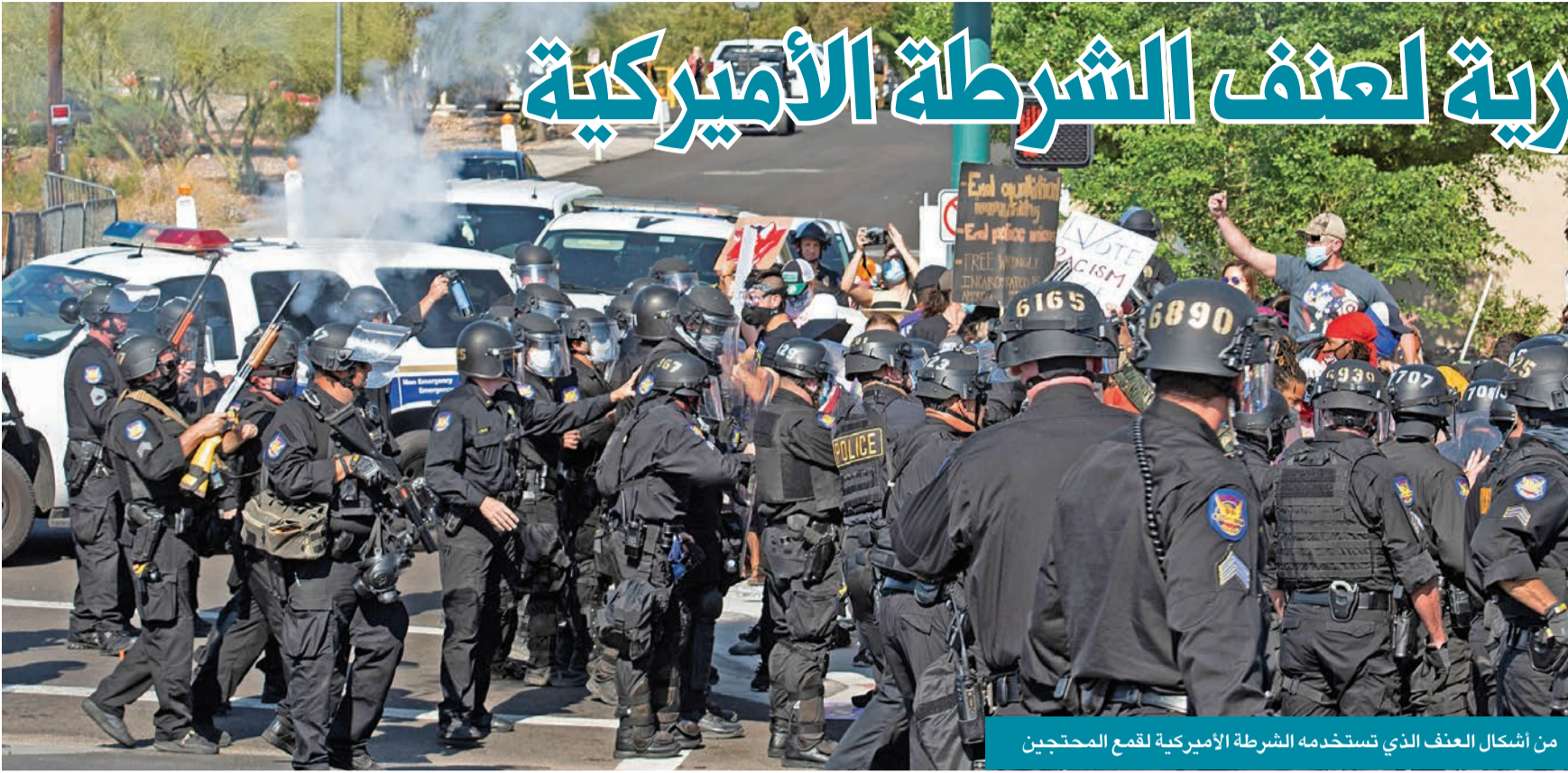
من أشكال العنف الذي تستخدمه الشرطة الأميركية لقمع المحتجين