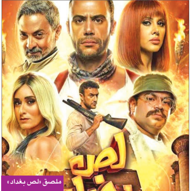
ملصق «لص بغداد»

ويتوقع الموزعون السينمائيون قراراً خلال أيام من رئيس الحكومة بإعادة العمل بطاقة استيعابية تصل إلى 50 في المئة على الأقل بالصالات السينمائية بما يسمح باستيعاب أعداد أكبر من الجمهور خصوصاً مع موسم عيد الأضحى، الذي لا تزال معالمه غير واضحة بشكل نهائي وسط التخوف من العائدات التي ستكون أقل على الإطلاق في موسم العيد، بما يدفع لتأجيل الأفلام ذات الميزانيات الضخمة التي كانت جاهزة للعرض في موسم عيد الفطر وتم إرجاؤها لإغلاق الصالات السينمائية. وحتى الآن، ستطرح أفلام بميزانيات محدودة جداً من أجل تغطية كلفة إنتاجها في مقدمتها فيلم «زنزانة 7» الذي يقوم ببطولته كل من أحمد زاهر، ونضال الشافعي، ومايا نصري إذ يصور فريق العمل المشاهد الأخيرة خلال الفترة الحالية، كما سيطرح فيلم «ورقة جمعة» للفنانة لوسي وهو الفيلم المؤجل من العام الماضي وعرض للمرة الأولى في الدورة الأخيرة من مهرجان