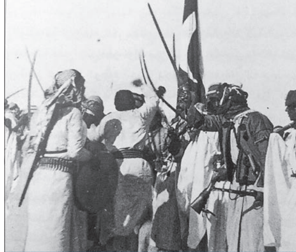
كويتيون يؤدون رقصة الحرب قرب الجهراء في ديسمبر 1901

وتستمر المواجهة، ويحتم القتال، حتى يستسلم أحد الطرفين، أو يبدا في الفرار. هذا جزء مما ورد في تقرير داودينغ عن الجانب العسكري في الكويت، الذي سيتم ترقيع الجملال فترة من الزمن، ثم بعد أن يحين الوقت المناسب يتم فتح الطريق لالاشتباك الكامل باستخدام الجمال، ومن خلفها القوات المشاة،