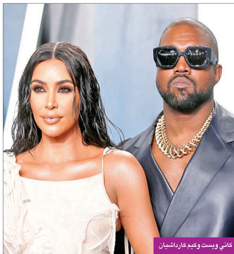
كاني ويست وكيم كارداشيان