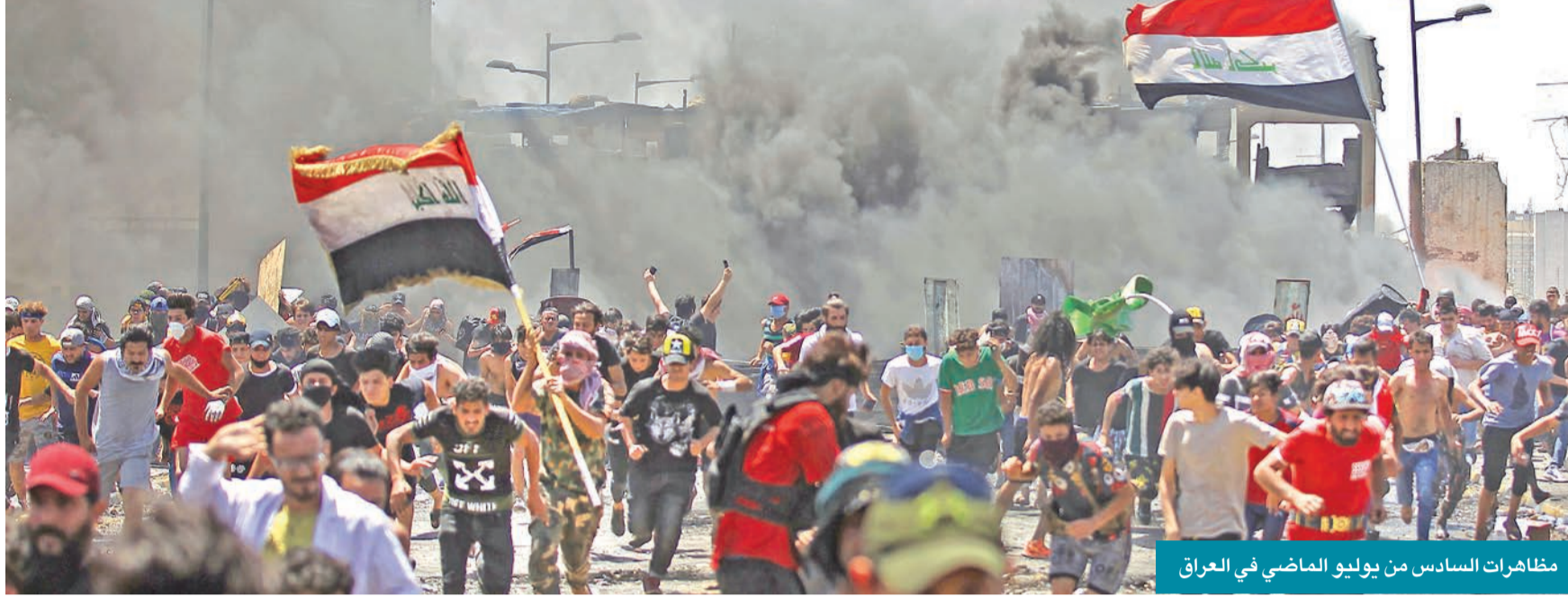
مظاهرات السادس من يوليو الماضي في العراق