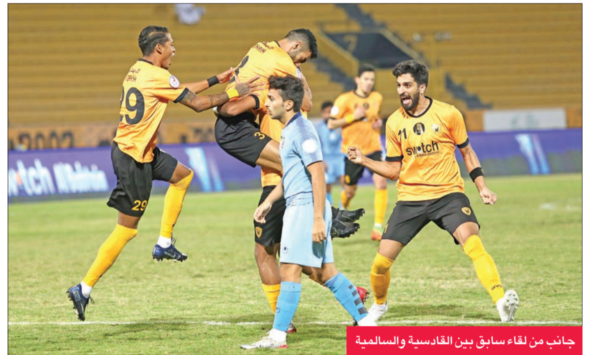
جانب من لقاء سابق بين القادسية والسالمية

بالنسبة للبرتغالي الذي يقوده المدرب الوطني جمال يعقوب حتى نهاية الموسم الجاري، هو البقاء في المربع الذهبي حتى النهاية.