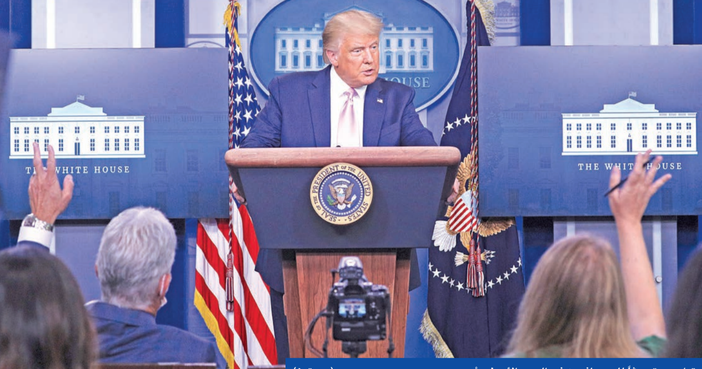
ترامب يتحدث للصحافيين في البيت الأبيض أمس

واشنطن تكثف الضغط على لندن لدعم تحركها... وطهران تعزز تخصيب اليورانيوم وتكشف عن صاروخين