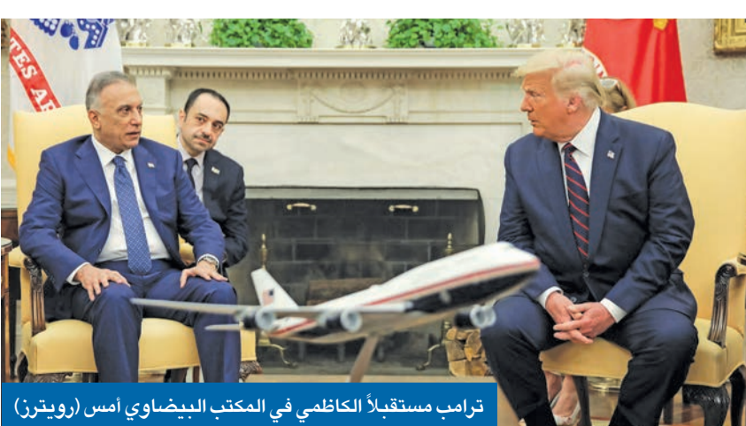
ترامب مستقبلاً الكاظمي في المكتب البيضاوي أمس

بغداد - محمد البصري أحبطت زيارة رئيس الحكومة العراقية مصطفى الكاظمي لواشنطن باهتمام كبير ركز على تفاهات واعدة مع عمالقة الاقتصاد الأميركي، وتأكيد التزام البيت الأبيض بدعم بغداد ضد نفوذ الميليشيات الموالية لطهران، لكن ذلك تزامن مع موجة قاسية من الاعتقالات في البصرة، استهدفت قيادة الاحتجاج الشعبي المناهضين لنفوذ إيران، وفي مستهل الزيارة،