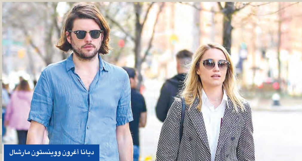
ديانا أغرون ووينستون مارشال

انفصلت النجمة ديانا أغرون عن الموسيقي البريطاني وينستون مارشال عقب 3 أعوام من الزواج. وشهدت نجمة مسلسل Glee تقلبات مزعجة خلال الفترة السابقة حيث شهدت اخفاقات وعدم تفاهم اديا إلى طلاقها من مارشال الذي تزوجته في حفل زفاف مميز كان حديث وسائل الإعلام وأقيم في المغرب. وكان مكان الحفل مفاجأة للمقربين من العروسين، كما أن خيار الفستان لم يكن متوقفاً، إذ كسرت العروس قاعدة الفستان الأبيض واعتمدت تصميماً غير تقليدي وغير متوقع إطلاقاً.