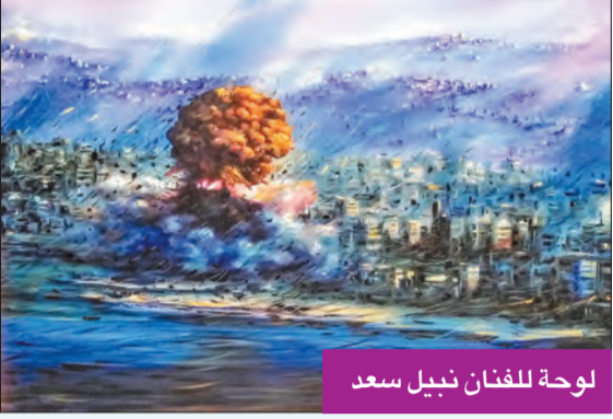
لوحة للفنان نبيل سعد

أطلقت جمعية تبرؤ للفنون والمسرح الوطني اللبناني ومسرح إسطنبولي في مدينة صور، في سياق الأنشطة الرقمية، دعوة للمشاركة في معرض الرسم والفوتوغرافيا، الذي سيجرى عبر الإنترنت تحت عنوان «من أجل بيروت».