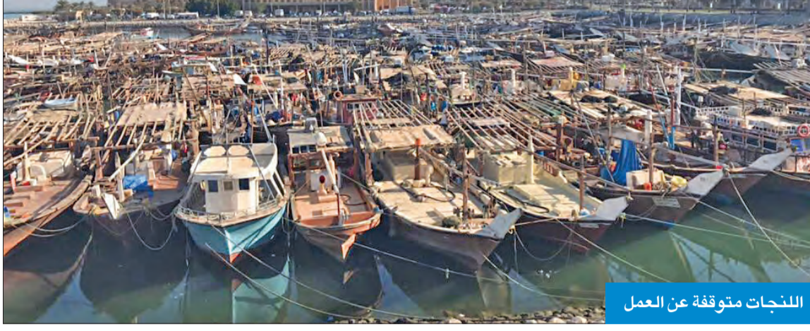
الللنجات متوقفة عن العمل

من يقف في صفهم بل يُتهمون بالثقاعس وهذا امر غير منطقي، ففي النهاية تحريك قطاع الاسماك يعود بالنفع للدولة.