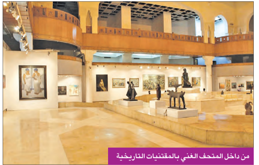
من داخل المتحف الغني بالمقتنيات التاريخية

تم تجديده وإغلاقه منذ أزمة كورونا ويضم أعمالاً متميزة من نهاية القرن الـ 19