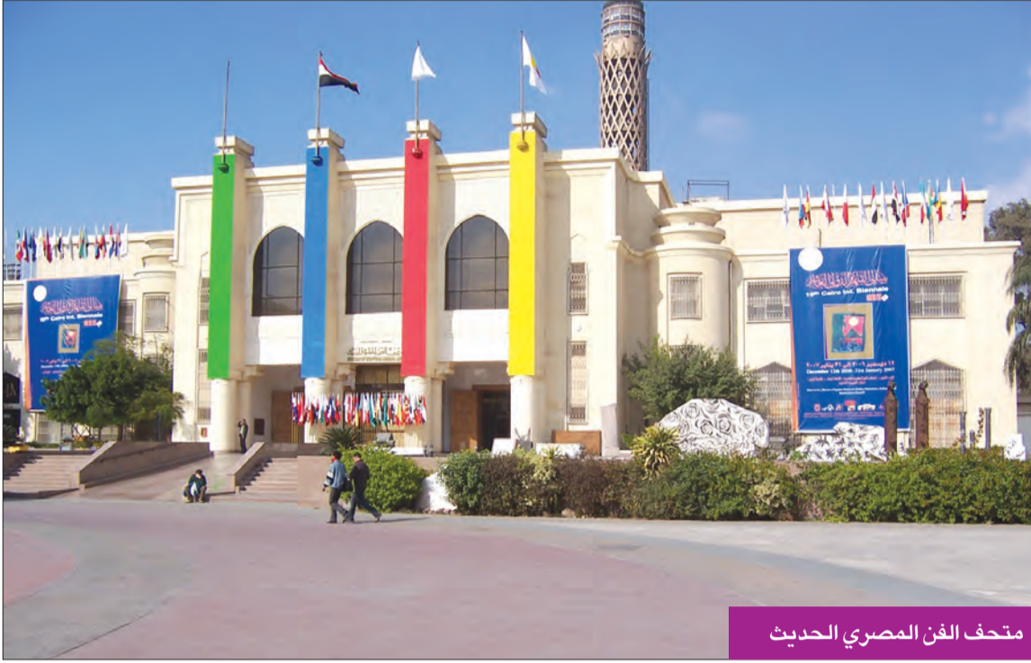
متحف الفن المصري الحديث