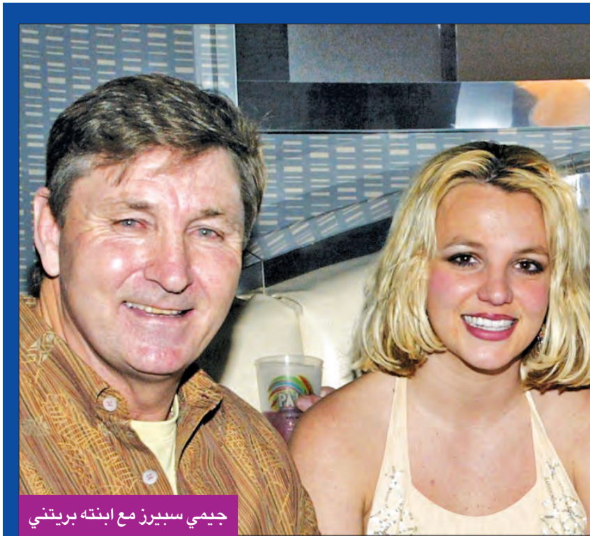
جيمي سبيرانز مع ابنته بريتي

سلسلة هاري بوتر بطولة دانيال رادكليف وإيما واتسون، تعتبر سبباً في شهرة رادكليف الذي يجسد دور الساحر هاري بوتر.