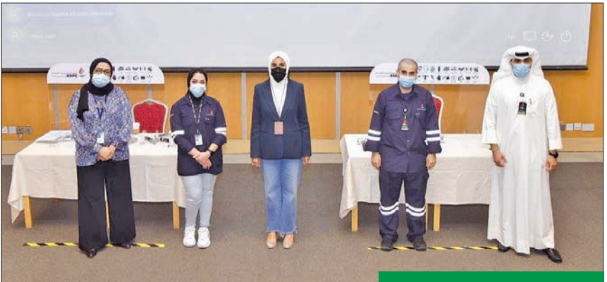
مشاركون في برنامج التدريب وأضافت أنها ستتخلف بتقديم مكافأة شهرية للطلاب طوال فترة الدراسة، مشيرة إلى أن تقديمها

واكدت أنها تهدف من خلال هذا البرنامج التدريبي الشباب الكويتي، وتوفير فرص العمل الملائمة لهم بعد التخرج، وكذلك سد احتياجات دوائر العمليات التابعة للشركة من خريجي هذا التخصص، والذين يؤدون دوراً مهماً وأساسياً في عمل المصافي. وكانت «البتترول الوطنية» أجرت قبل أيام قرعة لتوزيع دفعة جديدة من خريجي تخصص تكنولوجيا تشغيل المصافي، قوامها 54 خريجاً،