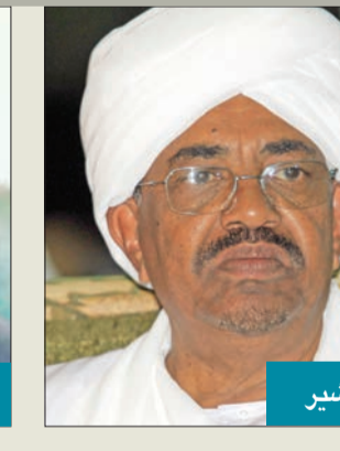
عبد الله حمدوك

وتتمثل التحديات الكبيرة التي تواجه الاقتصاد السوداني في بقاء اسم السودان على قائمة الدول الراضية للإرهاب وديونه المستحققة للمؤسسات المالية الدولية، والتي تقدر بـ 3 مليارات دولار إضافة إلى ديونه الداخلية البالغة أكثر من 57 مليار دولار، ويفضي تصنيف السودان كدولة راعية للإرهاب إلى تقييد الاستثمارات الخارجية المباشرة وإمكانية حصوله على إعفاء من صندوق النقد الدولي ضمن شريحة برنامج الدول الأكثر فقراً. وتجدر الإشارة إلى أن رفع اسم السودان من قائمة الدول الراضية للإرهاب يمكن الولايات المتحدة من التصويت لصالحه في القروض والتمهيلات الائتمانية وضمانات المؤسسات المالية الدولية. ومن أجل مواجهة التبعات القاسية