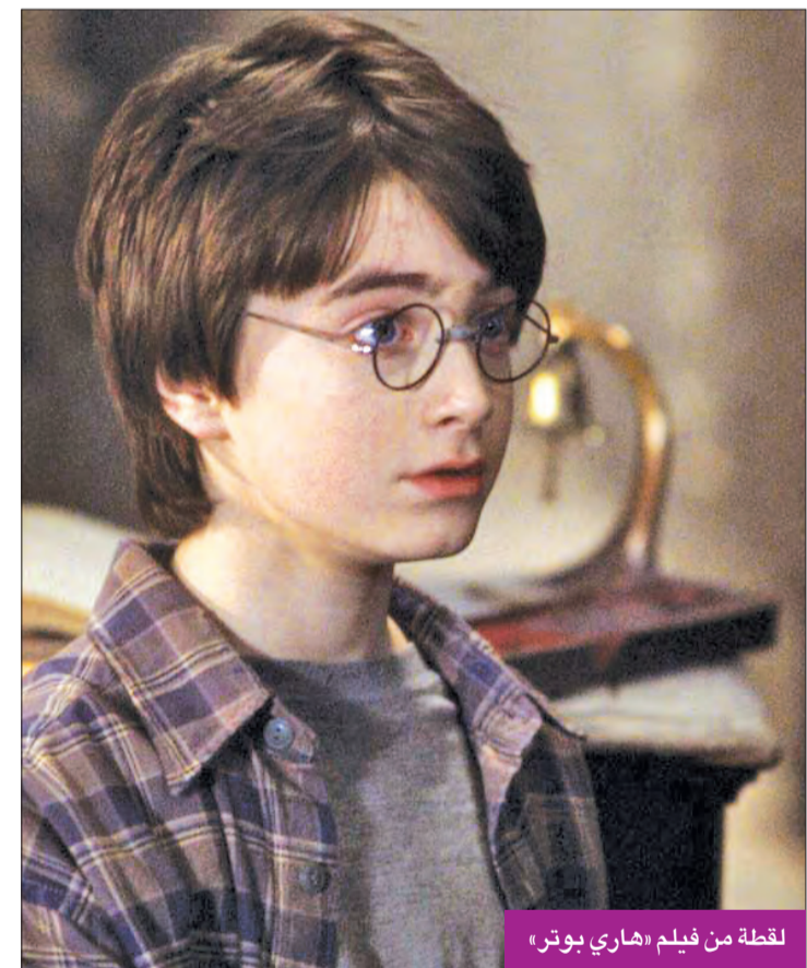
لقطة من فيلم «هاري بوتر»

يذكر أن بيرري وخطيبها النجم العالمي أورلاندو بلوم ينتظران وصول ابنتهما للحياة خلال الأيام المقبلة، فقد أكد بلوم مؤخراً أنه متحمس جداً ومتشوق جداً لرؤيتها.