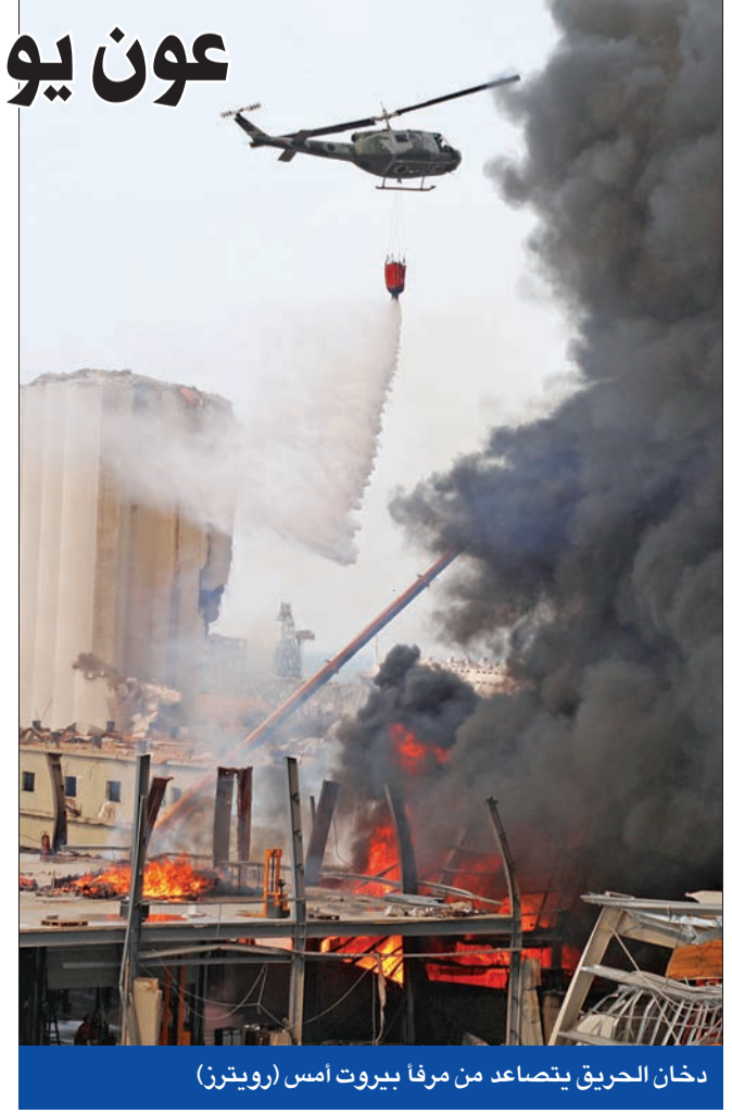
دخل الحريق يتصاعد من مرفأ بيروت أمس

وكشفت مصادر متابع، أن الرئيس عون أوفد على عجل خلال الساعات الماضية المدير العام للأمن العام اللواء عباس إبراهيم إلى باريس، حيث عقد سلسلة لقاءات لاسيما مع السفيرين برنار إيمييه وإيمانويل بون تتعلق بمسار المبادرة الفرنسية من مختلف وجوهها لاسيما لأصحاب المصالح المتعلق بتشكيل الحكومة والمهلة المحددة ونقل إبراهيم إلى عون اهتمام فرنسا