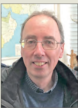
المؤلف سايمون سي سميت

الخارجية عليهما، وبيدأها المؤلف بمقدمة مطولة توازي فصلا كاملا، تناول فيها بالشرح أوضاع الكويت منذ تولي الشيخ مبارك الصباح زمام الحكم فيها عام 1896م، مع تركيز وتفصيل لمجريات الأحداث في حقبة حكم الشيخ أحمد الجابر الصباح (1921 - 1950م) لا سيما أحداث نشأة ونهاية المجلس التشريعي عامي 1938 و1939م، وتتوالى فصول الكتاب الستة متناولة بتسلسل زمني لمجريات الأحداث في الكويت خلال عهد الشيخ عبدالله السالم الممتد من 1950 حتى 1965م. الكتاب غني بالمراجع التي يستند إليها في معلوماته، مما يثريه ويقوي صدق هذه المعلومات، وفيما يلي تفاصيل الحلقة السادسة: