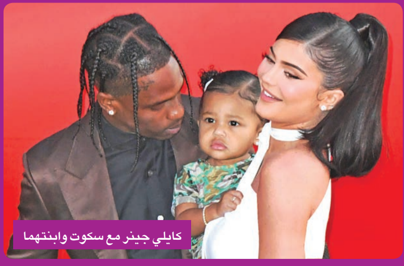
كايلي جينر مع سكوت وابنتهما

بالمان، وعلقت على الصورة، قائلة: «شكراً لك أوليفر روستينغ على فستان الميلاد المثالي»، علماً أن روستينغ هو مصمم أزياء فرنسي والمدير الإبداعي لدار أزياء بالمان. ويبدو أن منشور كايلي وشكرها لعلامة بالمان ولمديرها الإبداعي روستينغ، استغزى كوستيلو، الذي اتهمها بأنها لا تهتم إلا بدور الأزياء العالمية الراقية والمشهورة جداً، ولا تعطي أي تقدير أو امتنাম للمصممي الأزياء الصاعدين، وهو منهم، أو الأقل شهرة. وكتب كوستيلو بصفحة الخاصة: «شكراً لك أوليفر على فستان الميلاد المثالي، وشكراً للمصممين بدون أسماء الذين يعملون بلا كلل على مدار الساعة على إطلالات مخصصة لها، لكنها لن تقوم بعمل تاغ لهم أو شكرهم ما لم يكن دعمهم مدفوعاً». وأضاف: «وشكراً لفريق الماكياج والبريق الذي دائماً ما يتم تقديره. بغض النظر عن السبب، هذا المنشور ليس له علاقة بي، لأن كايلي ترتدي مني مرة واحدة فقط في السنة، وأنا محظوظ إذا حصلت على صورة لائقه لنشرها. لا أقل من شأن أي من فريقها الذي يصمم لها ستايلها ولا فريق الماكياج والبريق، رغم أننا نعلم أنه لا يمكنك الانتظار حتى تلغي متابعتي».