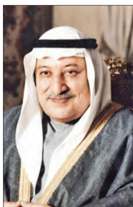
عبد الله المبارك

في نهاية 1958م قدر حجم خسائر احتياطي الهند بسبب عملية تهريب الذهب من الخليج بما بين 30 و35 مليون جنيه إسترليني سنويا