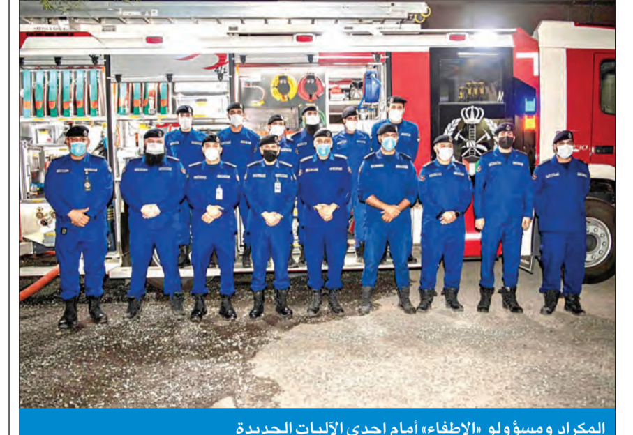
المكرد ومسؤولو الإطفاء أمام إحدى الآليات الجديدة

دشن المدير العام للإدارة العامة للإطفاء، الفريق خالد المكرد، مساء أمس الأول، عمل الآليات مكافحة الحريق والإنقاذ المتطورة التي تعمل بنظام «CAFS» في عدد من مراكز الإطفاء بعد دخولها الخدمة، ويبلغ عدد ما تم توزيعه على المراكز من الدفعة الأولى 15 آلية متقدمة تكنولوجياً، وتساعد على تقليل صرف المياه ومادة الفوم، لتعطي نتائج أفضل خلال عملية مكافحة الحرائق، وتقلل الوقت والجهد على رجال الإطفاء، ما يساهم في تقليل الخسائر والأضرار.