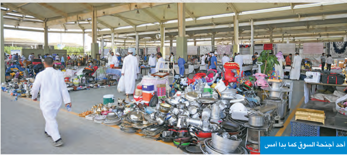
أحد أجنحة السوق كما بدأ أمس

ذكر أحد المسؤولين في السوق أن البلدية والشركة خصصتا 12 ساعة لعمل سوق الجمعة خلال 3 أيام نهاية الأسبوع، حيث يفتح أبوابه من الساعة 9 صباحاً حتى الساعة 9 مساءً لاستقبال الجميع.