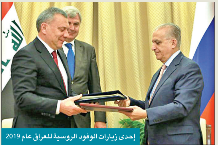
إحدى زيارات الوفود الروسية للعراق عام 2019

الكاظمي دعا بوتين، عبر السفير الروسي ماكسيموف، لزيارة بغداد. كما لا يفوت الكرملين فرصة لإقحام نفسه كلما ازداد التوتر بين بغداد أو أربيل وواشنطن. على سبيل المثال، عندما تصاعدت التوترات في أعقاب الضربات الجوية الأميركية التي قتلت القائد العسكري الإيراني الأقدم قاسم سلیماني، ناقش المسؤولون الروس والعراقيون تعميق التعاون العسكري.