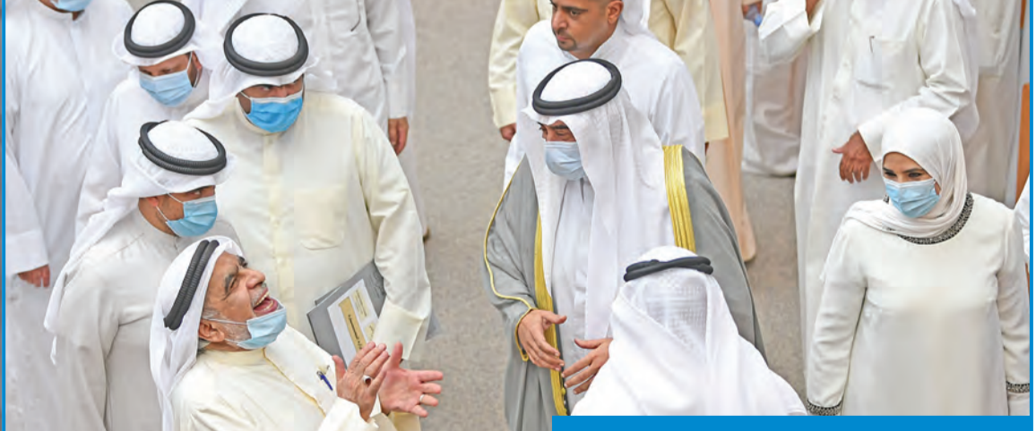
الخالد وعبد الصمد في ضحكة مشتركة عقب الجلسة