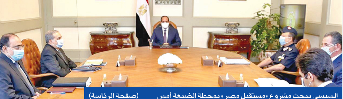
السياسي يبحث مشروع «مستقبل مصر» بمحطة الضبعة أمس (صفحة الرئاسة)

● وزير النقل يعتذر عن إهانة مجند ● المصريون يرفضون عودة «الشيخة»