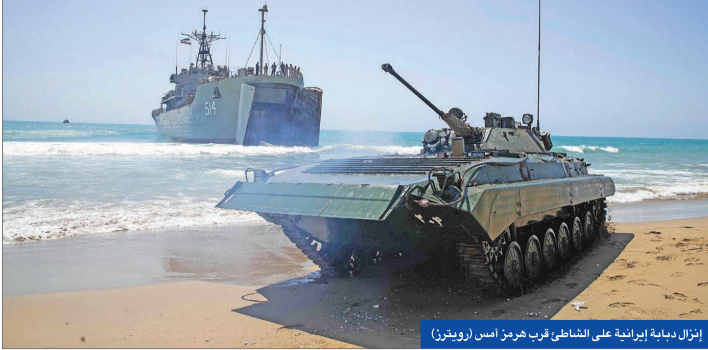
إزالة دبابة إيرانية على الشاطئ قرب هرمز أمس

● «الحرس الثوري» يشن أكبر عملية حدودية مع العراق وتركيا ● شحنة البنزين المُصدرة تصل إلى تكساس