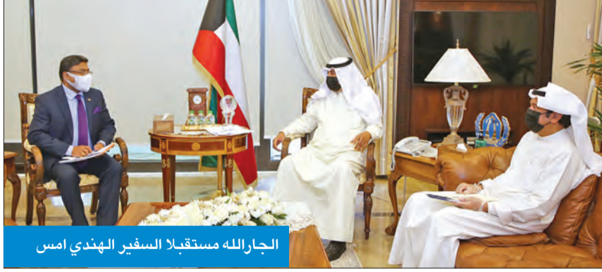
الجارالله مستقبلاً السفير الهندي أمس

اجتمع نائب وزير الخارجية خالد الجارالله، أمس، مع سفير الهند لدى الكويت سبيني جورج، بمناسبة تسلم مهام عمله سفيراً لبلاده لدى دولة الكويت. وتعد اللقاء بحث عدد من أوجه العلاقات