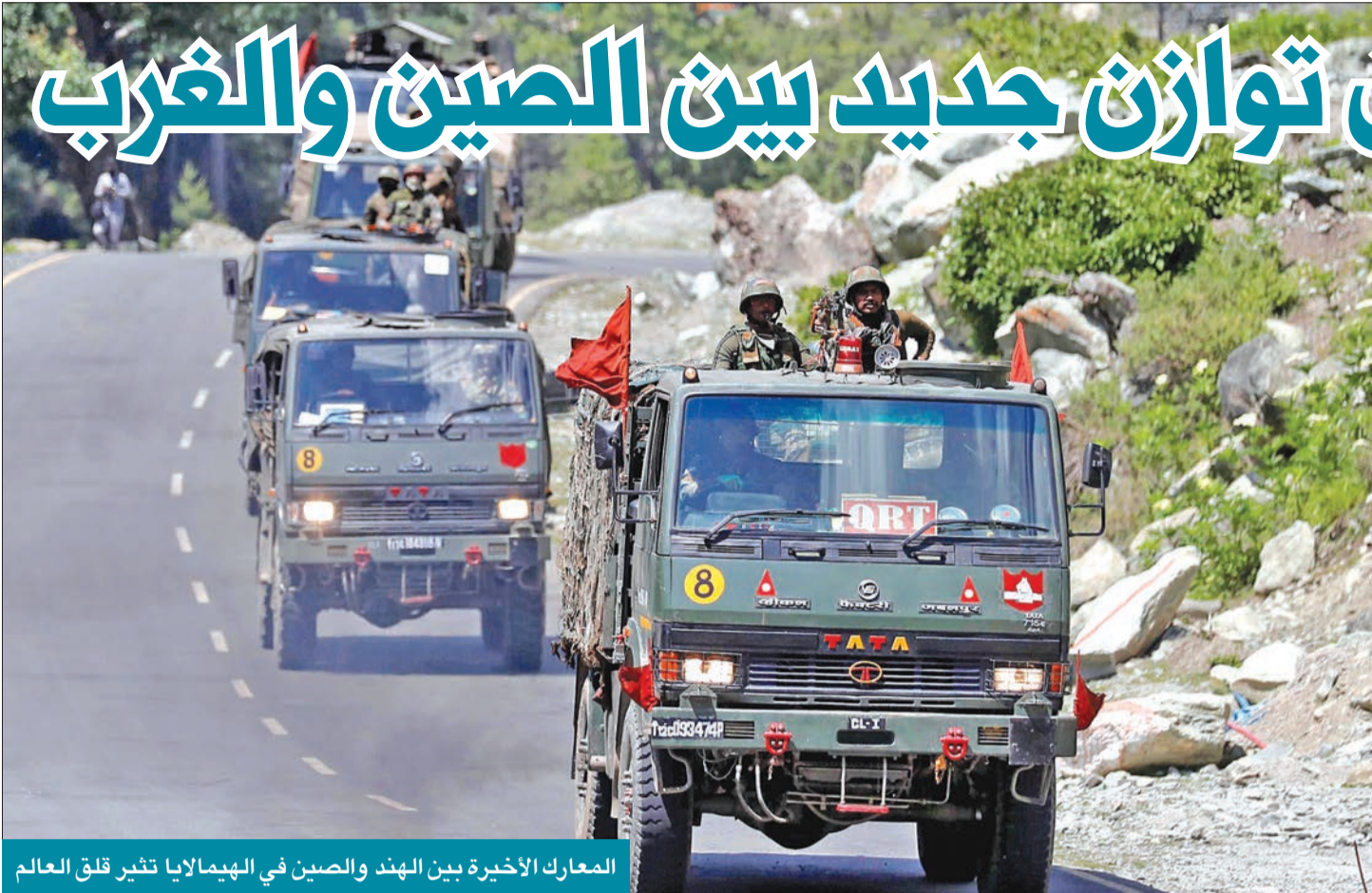
المعارك الأخيرة بين الهند والصين في الهيمالايا تغير قلق العالم

ودفع موسكو الى إعادة النظر في موقعها بين الصين والغرب كما أن المرء يمكن أن يتحدث عن فرص اختيار الغرب للحوار مع موسكو بغية ابعادها عن الصين، ولكن تلك الخطوة لن تكون سهلة من دون التضحية بالقيم الأساسية للغرب مع الأخذ بعين الاعتبار ما حدث في أوكرانيا وبيلاروسيا وجورجيا إضافة الى الكثير من عمليات تسميم وعمليات سياسية في روسيا ودول أخرى وتدخل الكرملين في العمليات الديمقراطية في الولايات المتحدة وبريطانيا والكثير من بلدان العالم.