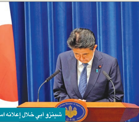
شينزو أبي خلال إعلانه استقالته

كان التحالف مع الولايات المتحدة الركيزة الأساسية التي اعتمدها أبي في سياسته الخارجية، وقد ساعد في تحقيق مراجعة ناجحة للخطوط الإرشادية المتعلقة بالتحالف بين اليابان والولايات المتحدة وعميقة الى حد كبير في عهد الرئيس باراك أوباما، ولكن التاريخ سيذكر أبي بدرجة أكبر بسبب تعاونه الوثيق مع الرئيس دونالد ترامب وتكوين علاقة وطيدة مع واشنطن وكان أبي يدرك أن التعاون مع واشنطن يعتبر خطوة حيوية بالنسبة الى استقرار وازدهار اليابان، كما كان أسلوبه في التعامل مع الرئيس ترامي يهدف في المقام الأول الى مواجهة الصين وضمان تقديم الولايات المتحدة المساعدة اللازمة من أجل حماية اليابان، لكنها كانت في الوقت نفسه الخطر الأكثر جلاء للمصالح القومية اليابانية، وكانت رسال أبي الى البلدان الآسيوية الأخرى في الكثير من الجوانب واضحة تماماً وهي أن اليابان هي الدولة التي يمكن العمل معها على صعيد التبادل التجاري، والتي لن تزعجكم أو تهددكم. وربما كانت مجرد مصادفة أخرى في