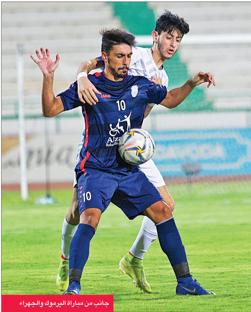
جانبا من مباراة اليرموك والجهراء