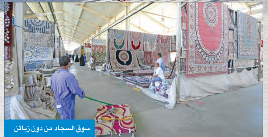
سوق السجاء من دون زبائن

وبين أنه خصصت أوقات معينة للتعقيم، لاسيما أنه تم وضع مشرفين على دورات المياه لمراقبة عمليات التنظيف والتعقيم المستمرة، حيث إنشأ الأكثر عرضة لانتشار الوباء، مشيراً إلى تعاون موظفي البلدية عبر الأخذ بملاحظاتهم، حرصاً على عدم تسجيل أي مخالفات. وأوضح أن إعادة البسطات تتم بشكل تدريجي، وهناك مراقبة لعملية دخول الشاحنات وإنزال البضاعة لكل بسطة، وإخضاع سائقي الشاحنات للفحص قبل الدخول، متمنياً التعاون من المرشدين وعدم الازدحام أمام البسطات والتعقيم المستمر أثناء التجول.