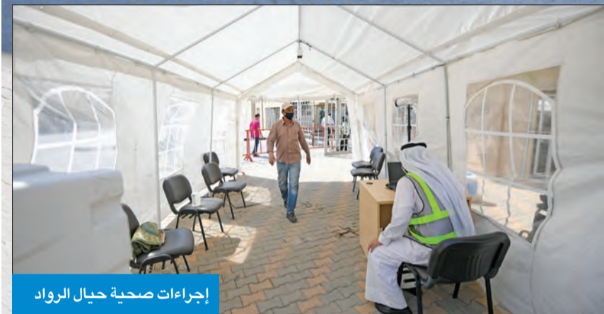
إجراءات صحية حيال الرواد