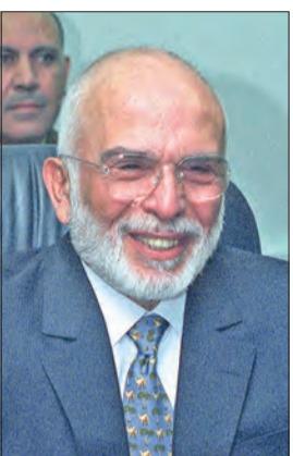
الملك حسين بن طلال