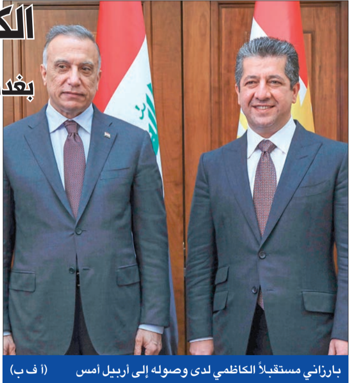
بارزاني مستقبلاً الكاظمي لدى وصوله إلى أربيل أمس

وأكد الكاظمي خلال لقاء مع رئيس «الحزب الديمقراطي الكردستاني» مسعود بارزاني بحضور عدد من المسؤولين في عاصمة الإقليم أربيل، أن كردستان جزء أساسي ومتكامل من العراق. وقال إن التنسيق عالي المستوى بين القوات المسلحة بمختلف صنوفها والبيشمركة، ساعد في