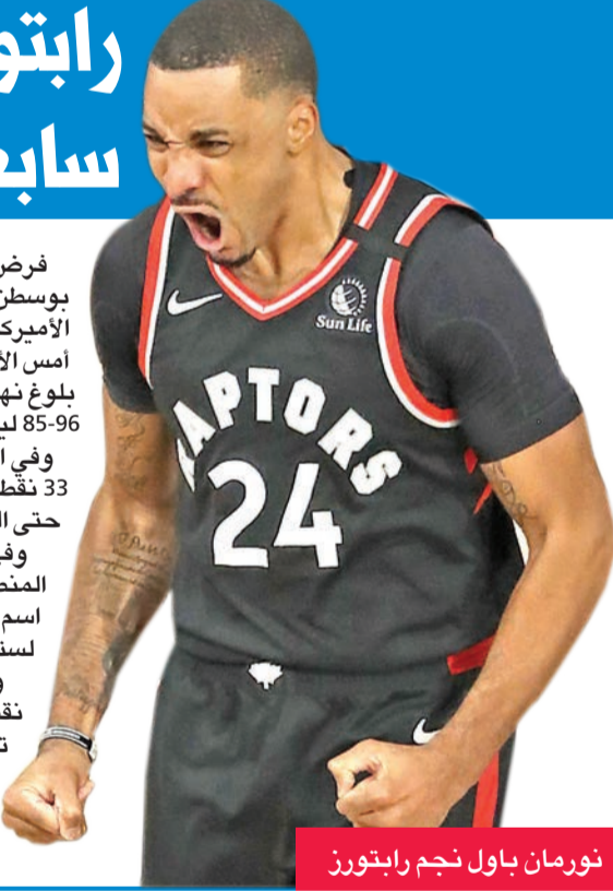
نورمان باول نجم رابرتوز

وكان الصربي نيكولا يوكيتش الأفضل من جانب ناغتس مع 26 نقطة و 11 متابعاً، فيما أضاف الكندي جمال موراي 18 نقطة و 7 تمريرات حاسمة، ومايكل بوتز جونبور 15 نقطة و 6 متابعات. أما من جانب كليبرز فسجل كل من ماركوس موريس والكرواتي ايفيتشا زوباتش 11 نقطة، وأضاف الأخير 9 متابعات.