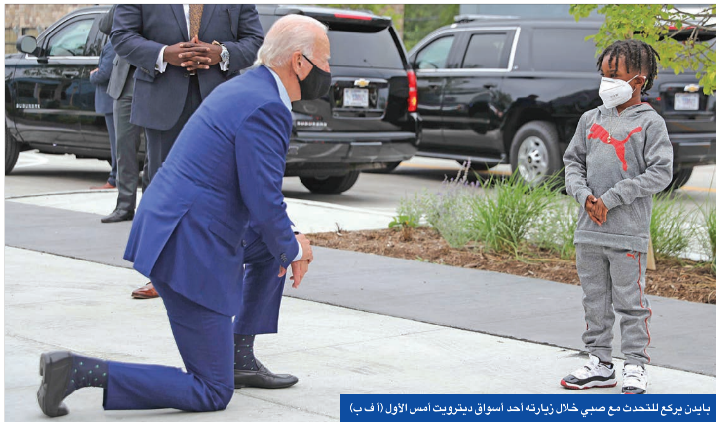
بايدن يركع للتحادث مع صبي خلال زيارته أحد أسواق ديترويت أمس الأول

هل منع البيت الأبيض الاستخبارات من تقييم مخاطر تدخل روسيا بالانتخابات وقصرها على الصين وإيران؟