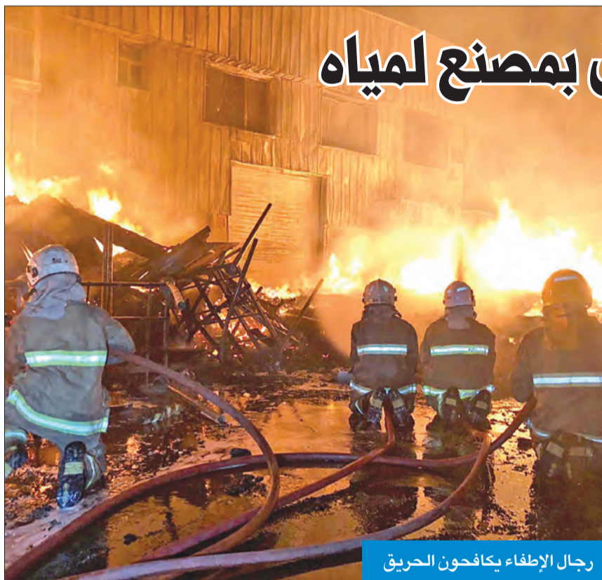
رجال الإطفاء يكافحون الحريق

تمكنت فرق الإطفاء من السيطرة على حريق اندلع صباح أمس في مخزن تابع لأحد مصانع تعبئة مياه الشرب بمنطقة صباحان. وقال مدير إدارة العلاقات العامة والإعلام بالإدارة العامة للإطفاء العقيد محمد الغريب، إن غرفة العمليات تلقت بلاغاً، فجر أمس، يفيد بانطلاق حريق في مصنع بمنطقة صباحان، في مصنع بمنطقة صباحان، فتم توجيه مراكز إطفاء صباح الصناعي، ومبارك الكبير للمواد الخطيرة،