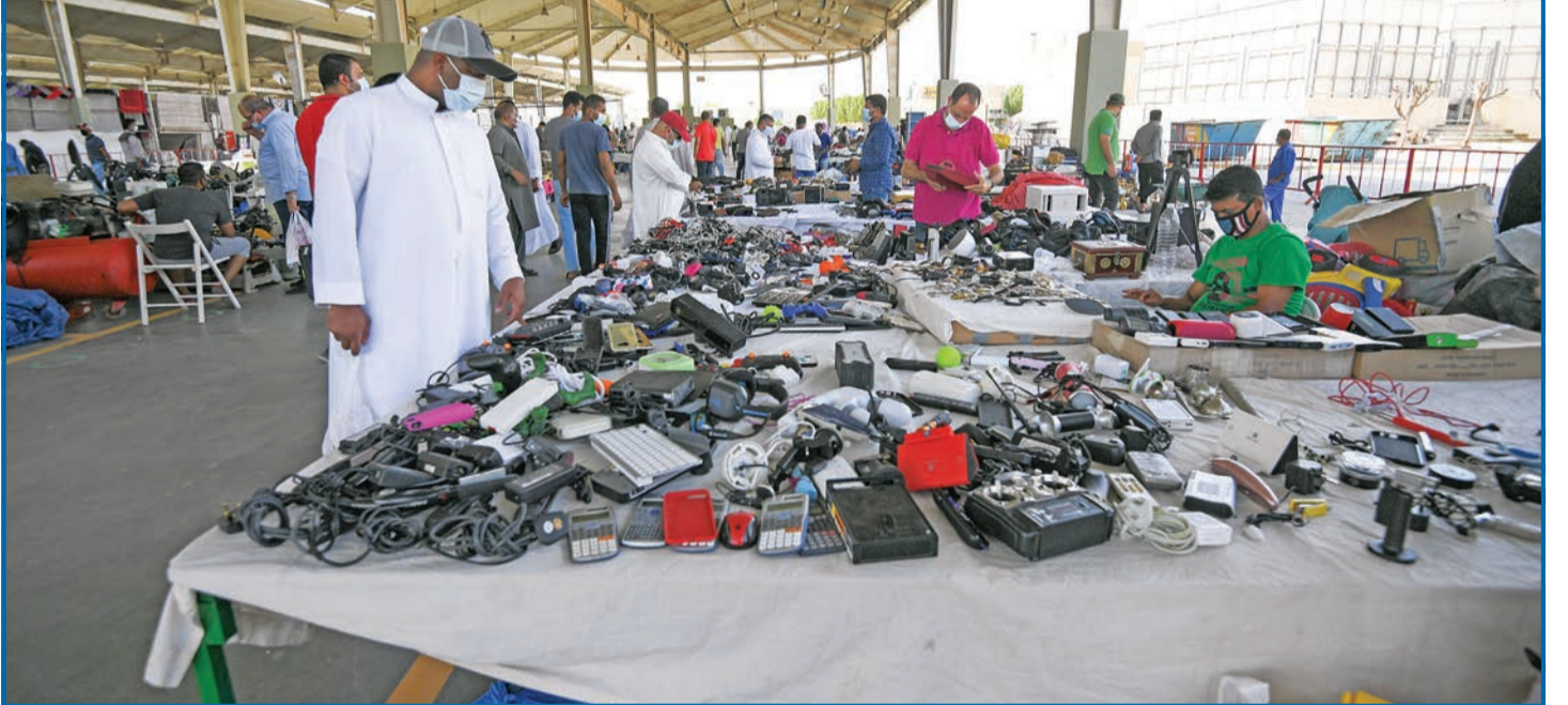
وسط تطلع طالت مدته إلى نفذ غبار «كورونا» عن أجواء الحياة... تم افتتاح سوق الجمعة أمس أمام رواده الذين دشّنوا عودتهم إليه مرتدين الكمامات حريصين على الاستجابة للإرشادات الصحية... وفي الصورة الدفعة الأولى من رواد السوق أمام بسطات لادوات الإلكترونية المستعملة.