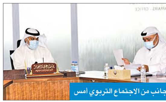
جانب من الاجتماع التربوي امس

صباحاً، وفي الفترة المسائية بعقر المقابلات في ثانوية صلاح الدين بمنطقة الزهراء بدءاً من الخامسة مساءً حسب جداول المقابلات لمختلف التخصصات، لزيادة عدد المقابلات في اليوم الواحد، ونيسيراً على لجان المقابلات المتقدمين، ولضمان تطبيق الاشتراطات الصحية. وأوضح السلطان انه تم تشكيل لجنة مقابلات لمختلف التخصصات، لانتهاؤها منها في