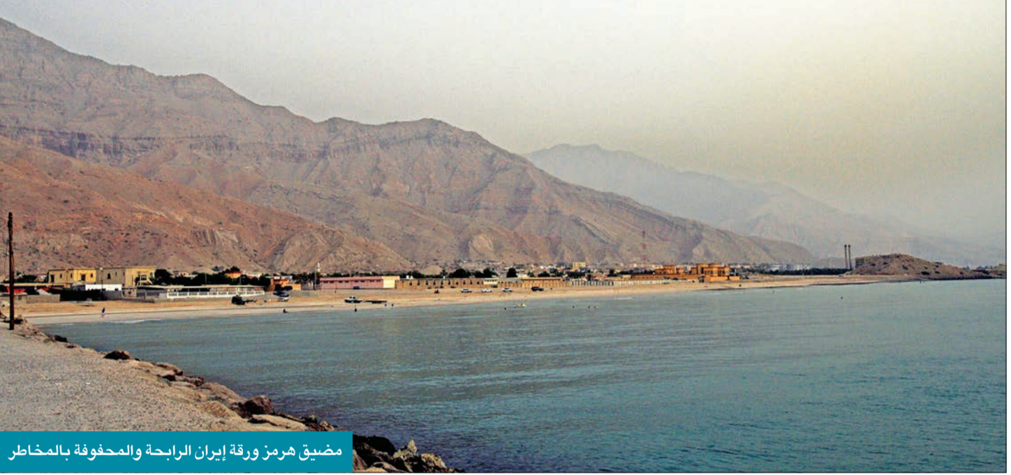
مضيق هرمز ورقة إيران الراحبة والمحفوظة بالمخاطر

وتجدر الإشارة إلى أنه منذ هجمات 11 سبتمبر تمكنت حركة جهادية من تنفيذ هجوم واحد فقط ضد هدف أميركي، وفي حقيقة الأمر أن الولايات المتحدة انغثت أكثر من 6