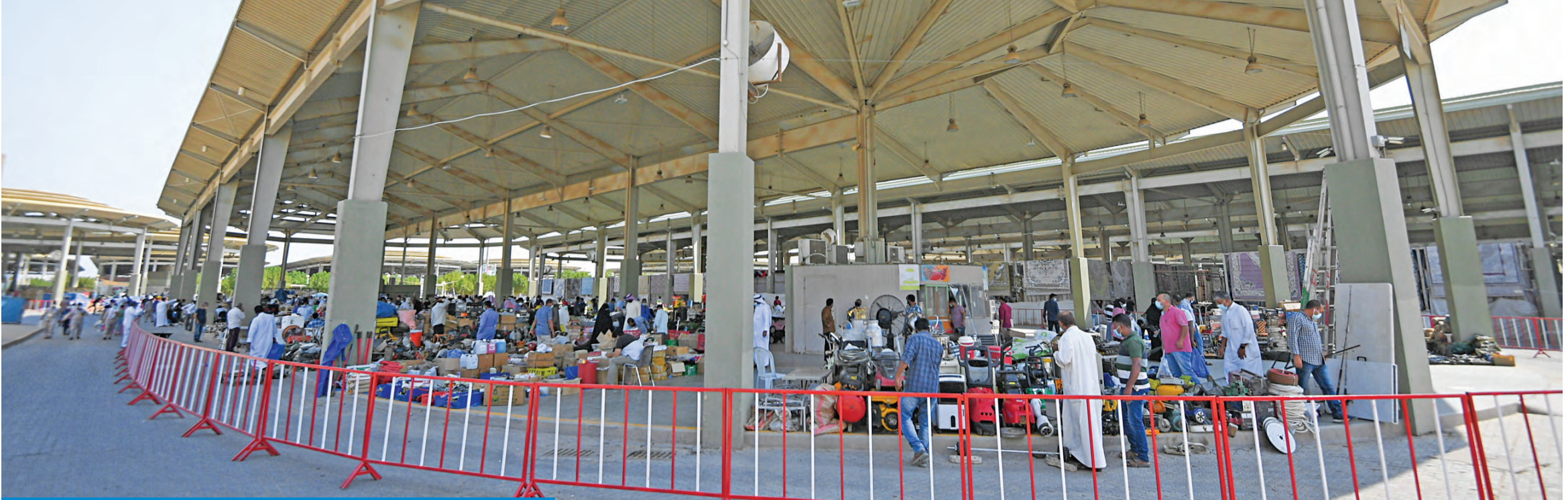
إجراءات احترازية وقلة رواد في سوق الجمعة بعد إعادة افتتاحه أمس

البلدية تراقب الالتزام بتطبيق الاشتراطات... ولا تهاون مع أي خلل