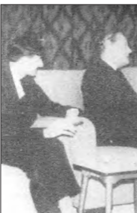
جلسة المباحثات التي سبقت تحقيق الكويت استقلالها التام. من اليمين: الشيخ عبدالله السالم، إدوارد هيث (الورد الخاصة الملكية)، السير جورج ميدلتون (المقيم السياسي)، جي سي بي ريتشموند (الوكيل السياسي البريطاني).

بلغت أرصدة إمارات الخليج بالجنه إسترليني في نهاية عام 1958م ما مجموعه 260 مليون جنيه، وكان معظمها مملوكا للكويت، ولم يبقها سوى أرصدة غرب إفريقيا والملايو وإسترااليا، وقدرت أرصدة الخليج بـ 1959م بأنها تساوي ما يزيد على ربع أرصدة بريطانيا من الذهب وما تملكه من أرصدة العملات الأجنبية، ويكمن الخطر هنا في احتمال أن يقرر الحكام الحاليون، أو أنظمة حكم جديدة فيها تكون معادية، تنوع ثروتها المترامية مما سيعرض الجنيه الإسترليني لضغوط شديدة، وفضلا عن احتمال حدوث نزف