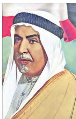
الشيخ عبد الله السالم

ورأى رئيس الإدارة العربية في الخارجية البريطانية بومونت إمكان تحقيق ميزات إيجابية في تعزيز وضعه استقلال الكويت في سياق التهديدات المحتملة الموجهة لوجودها المستقل، المتوقع صدورهما من جيرانها الأقوياء، وطرح بومونت وجهة نظره حول إمكانية تحقيق السردع إما من خلال وجود عسكري بريطاني، وسيكون ذلك