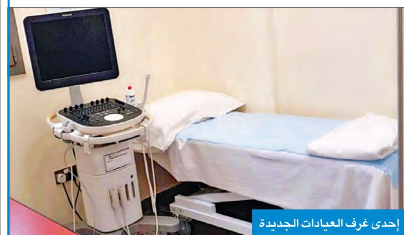
إحدى غرف العيادات الجديدة