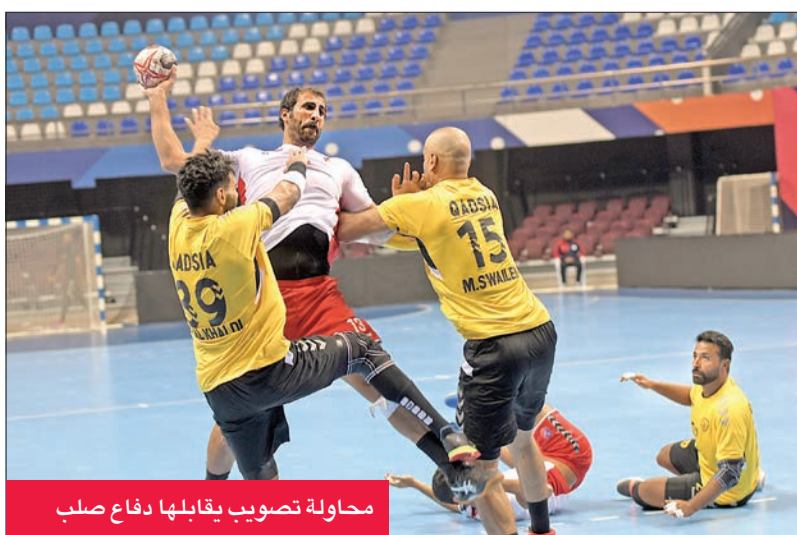
محاولة تصويب يقابلها دفاع صلب