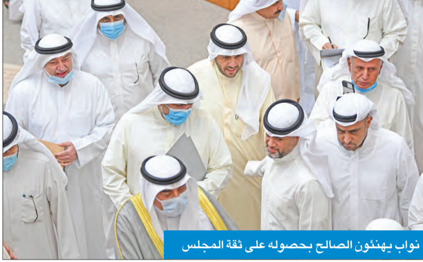
نواب يهنئون الصالح بحصوله على ثقة المجلس