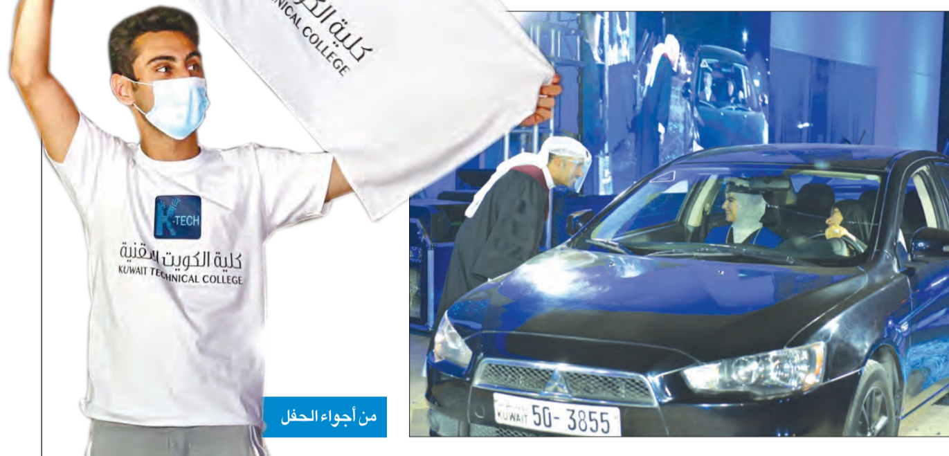
من أجواء الحفل