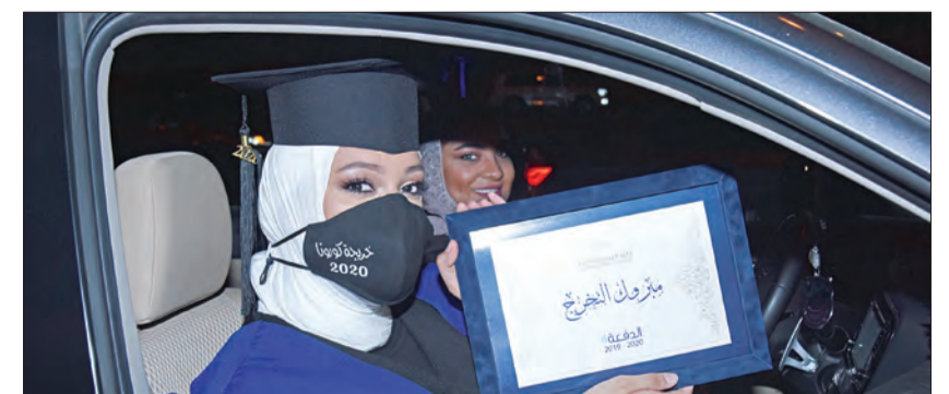
خريجو الكلية وتحدي الظروف