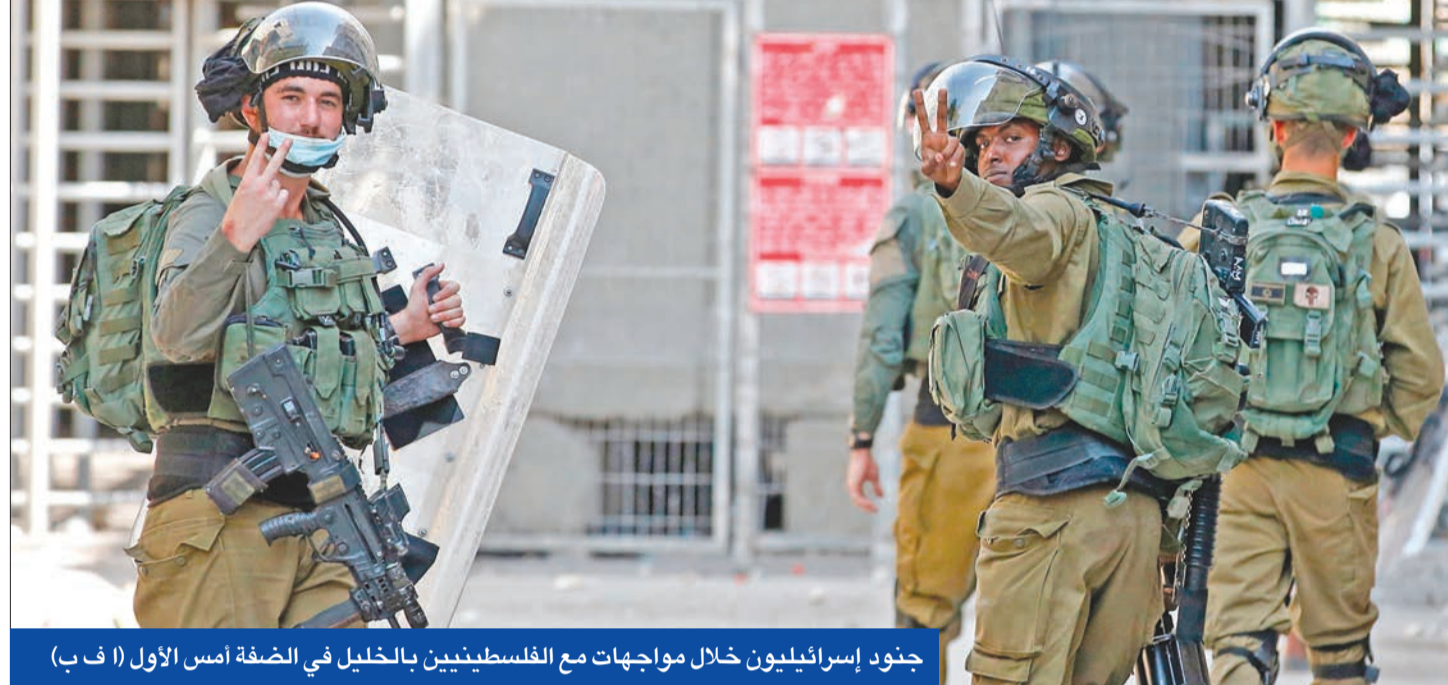
جنود إسرائيليون خلال مواجهات مع الفلسطينيين بالخليل في الضفة أمس الأول

● المنامة: الاتفاق مع تل أبيب ضرورة لمواجهة التحديات الاستراتيجية... و متمسكون بالحل العادل ● كوشنر: المتطرفون استخدموا القضية لإذكاء الكراهية ● فلسطين تدرس تعليق عضوية «الجامعة»