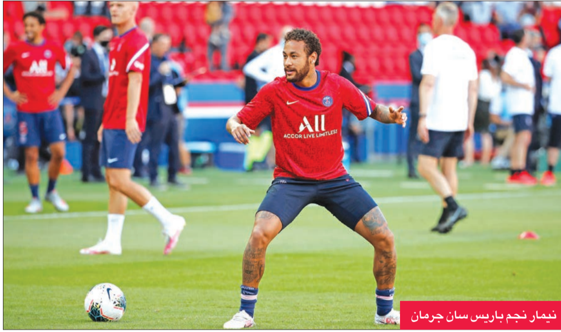
نيمار نجم باريس سان جرمان

فصفت نيمار في المركز السابع بين الأعلى اجرا بين المشاهير في العالم، وقدرت دخله لهذا العام بـ 95.54 مليون دولار، بما في ذلك صفقات الرعاية.