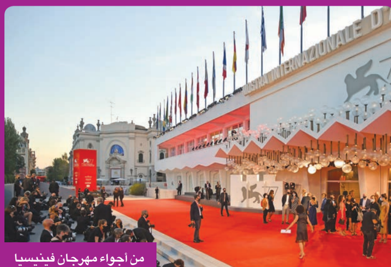
من أجواء مهرجان فينيسيا

دورته الـ 77 اشتهرت بـ «نسخة كورونا والكمامات» ومرّت دون مشاكل