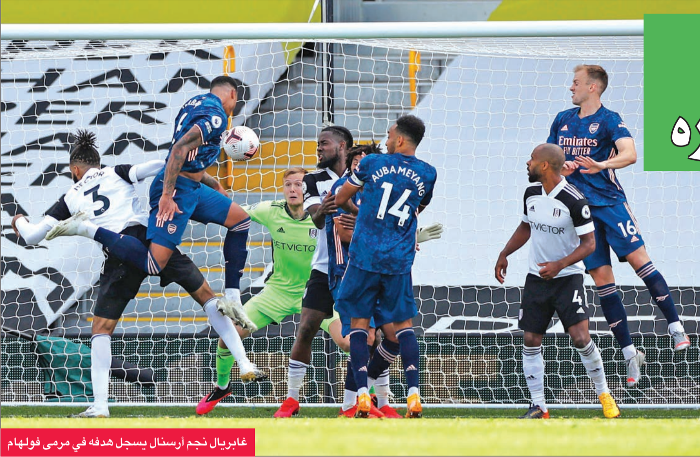
غابريال نجم أرسنال يسجل هدفه في مرمى فولهام

رفع أرسنال الستار عن فعاليات الموسم الجديد للدوري الإنجليزي لكرة القدم بفوز كبير 3-صفر على جاره ومضيفه فولهام أمس، في افتتاح مباريات المرحلة الأولى من المسابقة.