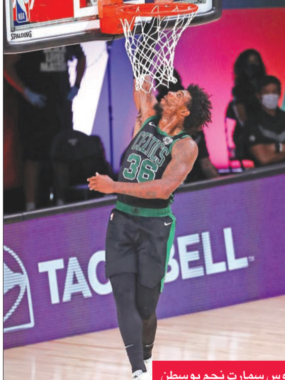
ماركوس سمارت نجم بوسطن

جزد بوسطن سلتيكس مع نجمه جايسون تانيوم خصمه في نصف نهائي المنطقة الشرقية تورونتو رايتورز من لقب دوري السلة الأمريكية للمحترفين، بفوزه عليه أمس الأول 92-87 في مباراة سابعة حاسمة في قاعة أورلاندو.