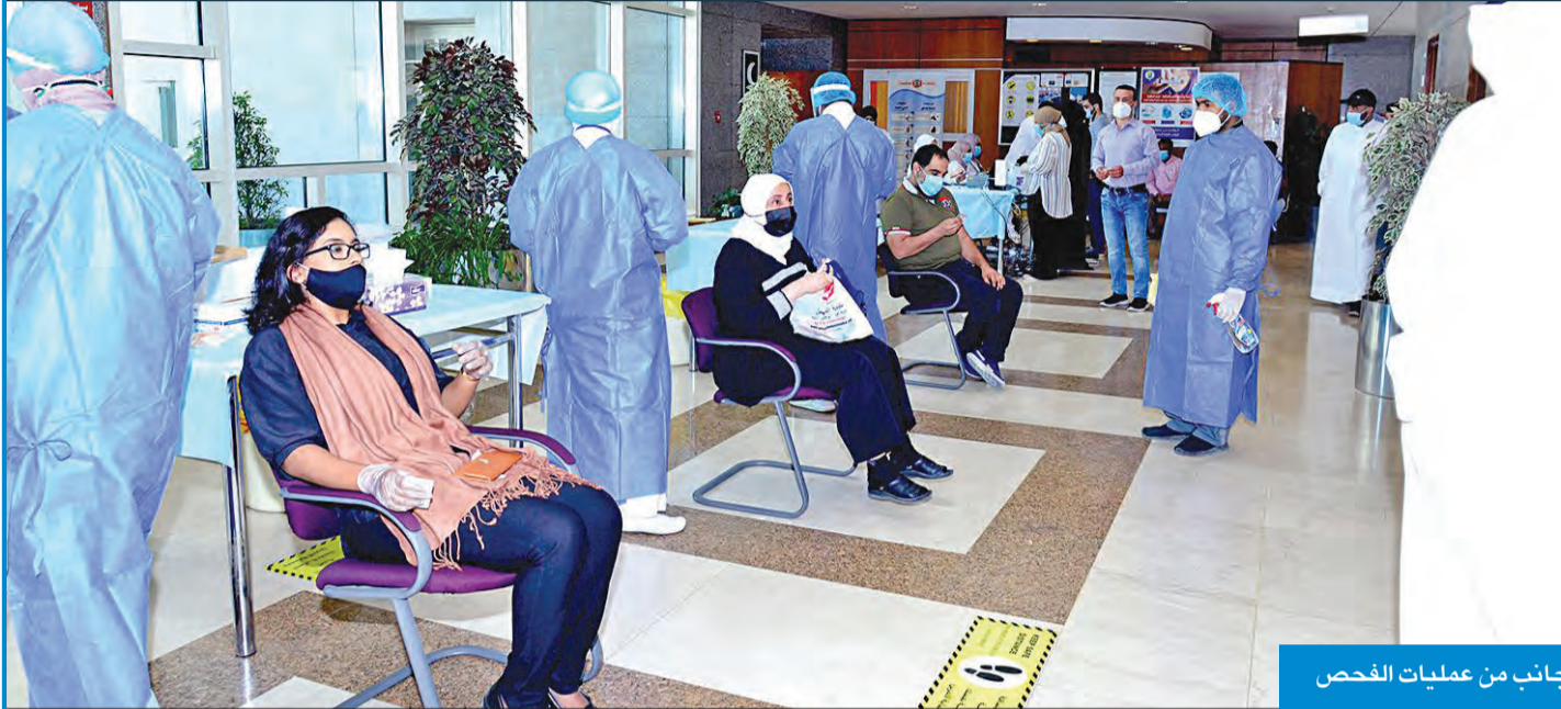
جانب من عمليات الفحص

مشيرة إلى أن «الإقبال كان جيداً على إجراء المسحات، ما يدل على وجود وعي من موظفي الجامعة، وحرص الإدارة الجامعية على الكشف المبكر على هذا الفيروس، وتوفير بيئة آمنة وصحية لمنتسبي الجامعة».