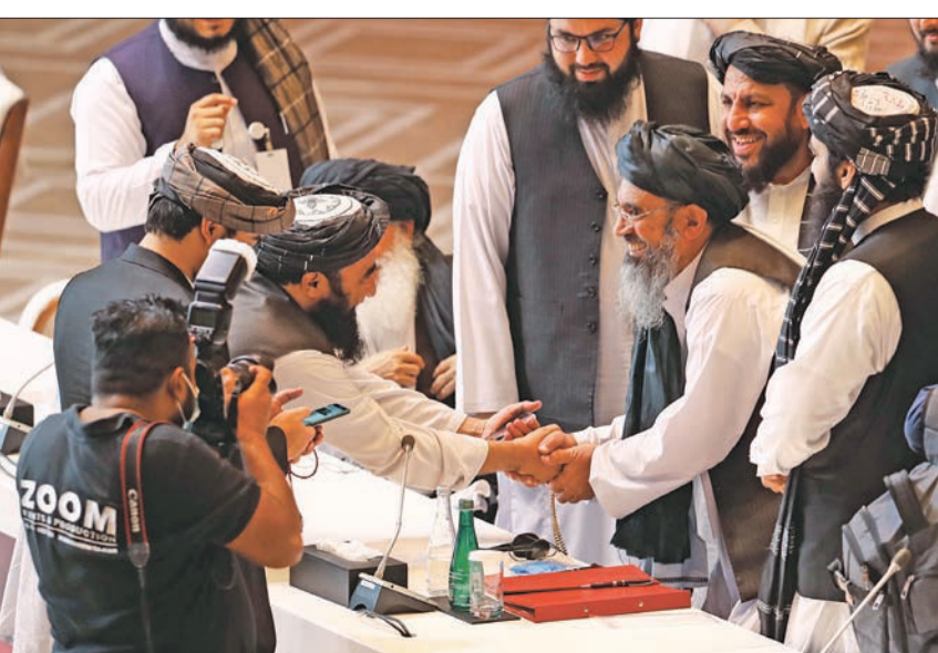
مصافحة بين عناصر وفد «طالبان» قبيل انطلاق المباحثات في الدوحة أمس

انطلقت في العاصمة القطرية، أمس، مفاوضات، هي الأولى من نوعها، بين الحكومة الأفغانية المدعومة من الغرب وحركة «طالبان» التي أزاحها الغزو الأميركي لكابل، بعد هجمات 11 سبتمبر عام 2001. وفي مستهل المباحثات التاريخية والشاكلة، دعا الوفد الحكومي برئاسة عبدالله عبدالله إلى وقف إنساني فوري لإطلاق النار، مشيراً إلى رغبة كابل في التوصل إلى «اتفاق سلام ينهي 20 عاماً من سفك الدماء». لكن عبدالله حذر من أنه «عندما تم التوصل إلى اتفاق بين أميركا و«طالبان»، في فبراير الماضي، كان الشعب يأمل سلاماً دائماً، لكن لسوء الحظ منذ ذلك الحين، قتل أكثر من 12 ألف أفغاني وأصيب أكثر من 15 ألفاً في موازاة ذلك، أكد