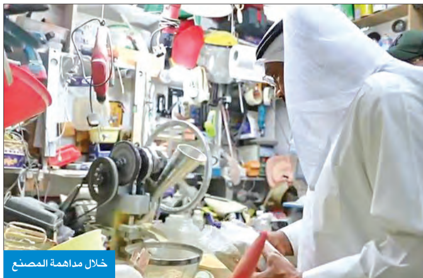
خلال مداهمة المصنع

وقال القبض على المتهمين الاول والثاني، وعتروا على مصنع متكامل لتصنيع الحبوب المخدرة. وتابع أن رجال المكافحة عثروا داخل المنزل على مكبس خاص لصنع الحبوب المخدرة، ومواد أولية تستخدم في عمليات التصنيع، وكميات كبيرة من الحبوب المخدرة المصنعة والمعدة للبيع، لافتاً إلى أنهم عثروا بحوزة المتهمين على سلاح ناري وذخيرة ومبالغ مالية حصيلة البيع. وأوضح المصدر أن المتهمين اعترفوا بأنهم التصنيع من إحدى الدول الآسيوية، وأنهم على دراية كافية بالمواد التي تستخدم بالتصنيع، والتي تحصلوا عليها من مواقع متخصصة على شبكة الإنترنت.