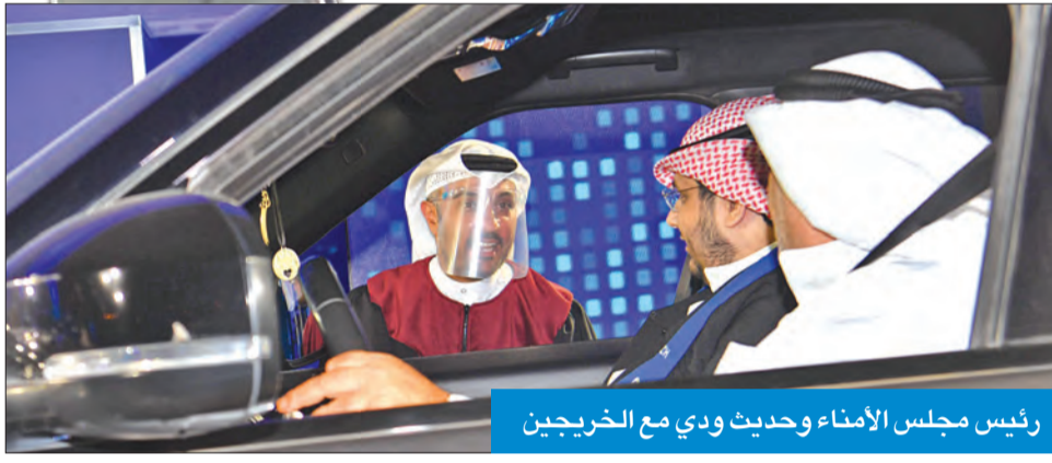
رئيس مجلس الأمناء وحديث ودي مع الخريجين