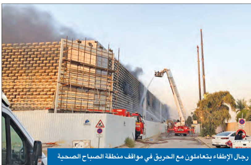
رجال الإطفاء يتعاملون مع مواقع حريق في مواقع منطقة الصباح الصحية

بالحادث، وقد عالجهم فنيو الطوارئ الطبية في الموقع. وختتم أنه تمت محاصرة النيران، مطمئناً إلى أنه لا خطورة على المستشفيات والمباني المجاورة.