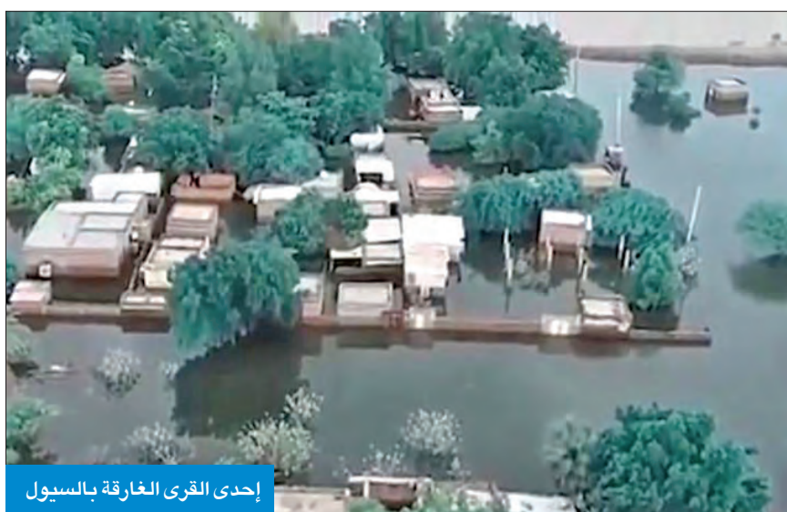
إحدى القرى الغارقة بالسيول

أطلقت جمعية احياء التراث الاسلامي، حملتها لاغاثة أشقائنا في السودان ضمن مشاريع صدقة الاسر، لمساعدة الالاف من الفقراء والارامل والايتام هناك ممن فقدوا منازلهم.