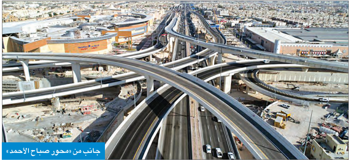
جانب من «محور صباح الأحمد»

المشروع يتيح الوصول إلى معظم ملاعب بطولة كأس العالم 2022