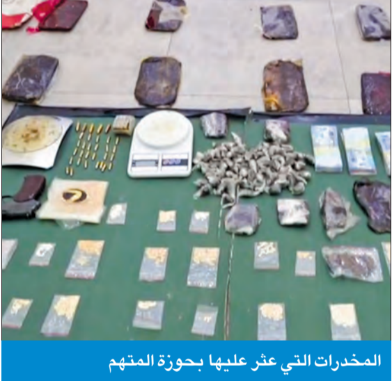
المخدرات التي عثر عليها بحوزة المتهم

عثر عليها مخزنة بجاخور استأجره «بدون» في كبد