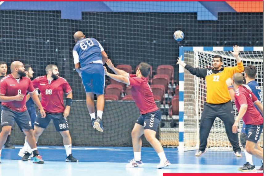
جانب من مباراة النصر واليرموك