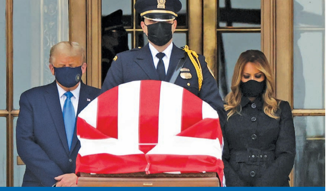
ترامب والسيدة الأميركية الأولى يلقيان النظرة الأخيرة على القاضية غينيسبورغ في مقر المحكمة العليا بواشنطن أمس

لم تكن إشارة الرئيس الأميركي دونالد ترامب، على هامش رعايته مراسم توقيع اتفاق السلام التاريخي بين الإمارات والبحرين وإسرائيل، إلى «صفقة عظيمة مع إيران بعد انتخابات نوفمبر»، عبثية، لكنها نابعة عن ثقة أتمنتها معطيات إيجابية، وتواصل مباشر مع الطرف القوي في الجمهورية الإسلامية، ممثلاً بالتبار الأصولي، الذي يهيمن على البرلمان، والقيادة العسكرية، وغالبية مفاصل الدولة. وفي تصريح لـ «الجريدة»، كشف أحد صقور إيران عن اتصالات تمت بين مندوبين من إدارة ترامب وأحد كبار الشخصيات الأصولية الرفيعة في طهران، موضحاً أنه تم على أثرها ترتيب اجتماع سري بين الجانبين الأسبوع الماضي في عُمان. وأوضح المصدر، وهو أيضاً أحد كبار مسؤولي التيار الأصولي، أن مندوبي ترامب عرضوا، خلال الاجتماع، الاتفاق على صيغة للتعاون للوصول إلى اتفاق مشترك بين الحكومة الأميركية المقبلة، والرئيس الإيراني المقبل، لا الحالي حسن روحاني. وقال إن «مندوبي ترامب أكدوا أنه سيفوز بولاية ثانية في الانتخابات الرئاسية المقررة في 3 نوفمبر، وهم لا يريدون الجلوس على طاولة المفاوضات مع حكومة روحاني؛ لأنها ليس لديها أي قدرة على تنفيذ تعهداتها، وتتحجج بان الحرس الثوري أخل بالاتفاق مع واشنطن، وذلك خارج عن سيطرتها». وأشار إلى أن الجانب الأميركي أبلغ الأصوليين أن