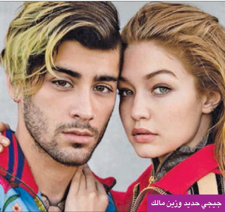
جيجي حديد وزين مالك

كشفت تقارير إعلامية عن لقاء مفاجئ لنجمة تلفزيون الواقع كيم كارداشيان، في مسهرة مميزة، مع صديقتها النجمة العالمية باريس هيلتون، اللتين تجمعهما صداقة متينة منذ سنوات طويلة حتى قبل شهرتهما. وبينت التقارير أن النجمة باريس هيلتون، البالغة 39 عاما، كشفت عن عدد من مقاطع الفيديو التي جمعتها بكم عبر مواقع التواصل الاجتماعي، والتي ضجت بين المتابعين والمحبين للنجمتين. ورجح العديد منهم أن كيم قررت التخلص من الضغوط النفسية بسبب مشاكلها مع كاني ويست، وتبحث عن بعض اللحظات السعيدة مع صديقتها باريس. بدورها، قامت كيم بنشر فيديوهات جمعتها بباريس، عبر حساباتها. ومن أخبار هيلتون، تناولت النجمة العالمية ادعاءات مختلفة حول حياتها الشخصية، من خلال فيلمها الوثائقي الجديد بعنوان «This Is Paris»، والذي سيبت عبر «يوتيوب». وبعد أن كشفت عن تعرضها للعنف في مدرستها الخلية بولاية يوتا، تحدثت باريس هيلتون عن صداقاتها السيئة والمتعددة التي تضررت منها في الماضي، حيث أكدت أنها تحملت أشياء لا يستطيع أحد تحملها، وكشفت أنها تعرضت لأنواع العنف مثل الخنق والضرب، وادعت أنها الآن في صداقة متينة ومستقرة وسلمية مع كارتر ريو. وكانت باريس ظهرت برفقة روم، أثناء