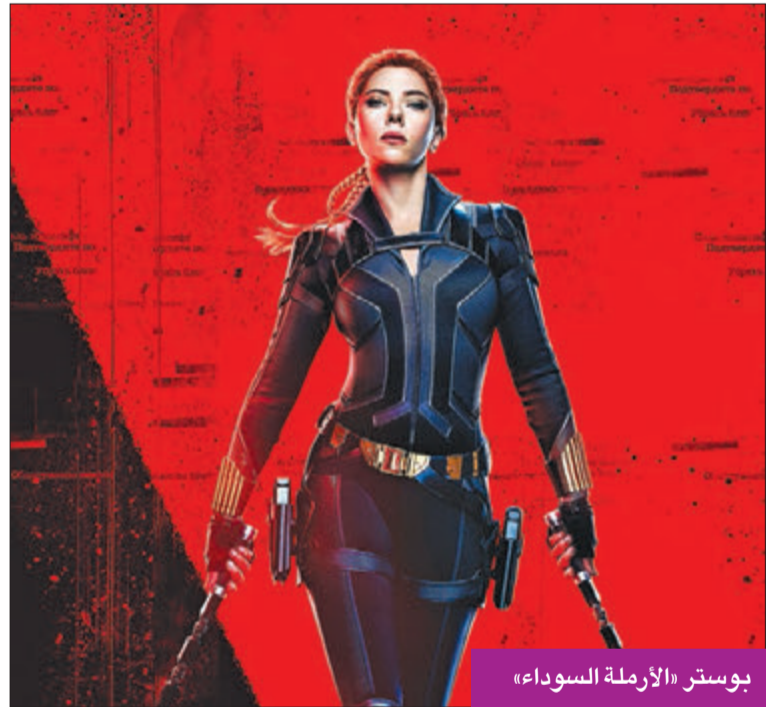
بوستر «الأرملة السوداء»