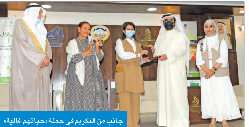
جانب من التكريم في حملة «حياتهم غالية»

العوضي: ندعم جميع الجنسيات والأولوية للحالات الشديدة والصعبة