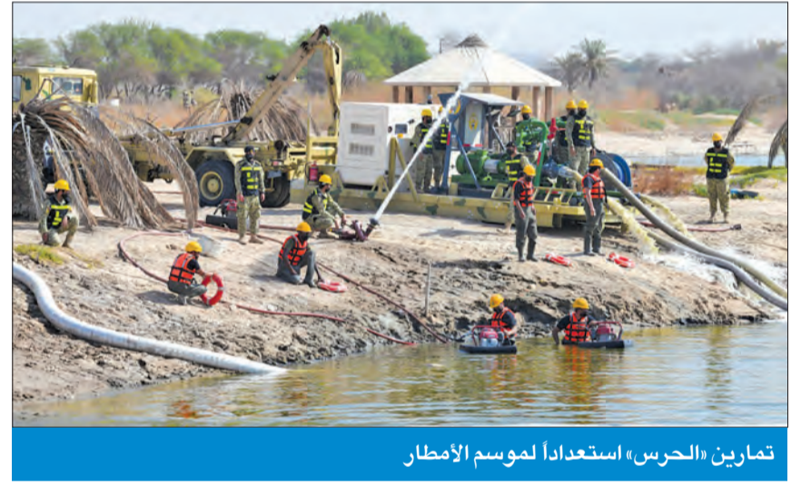
تمارين «الحرس» استعداداً لموسم الأمطار

المخصصة لسحب المياه في حال هطول أمطار الخير. وأكد الرفاعي، في تصريح صحفي، محاكاة الواقع العملي في التعامل مع الكوارث الطبيعية لمختلف الاحتمالات، حتى يتمكن الحرس من أداء دوره في مساندة أجهزة الدولة، وحماية أرواح وممتلكات المواطنين والمقيمين على هذه الأرض الطيبة.