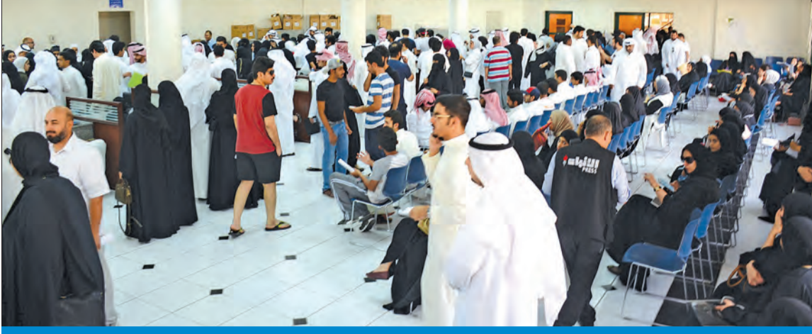
صورة أرشيفية للازدحام في صالة «قبول التطبيقي» للطلبة المرفوضين من القبول سابقاً

● «التطبيقي» المنفذ الوحيد لقبول الطلبة الذين لم يحالفهم الحظ في الحصول على مقاعد دراسية ● الشمري: الجامعة والهيئة لن تستطيعا استيعاب الأعداد... والتخفيض سيكلف الدولة أموالاً إضافية