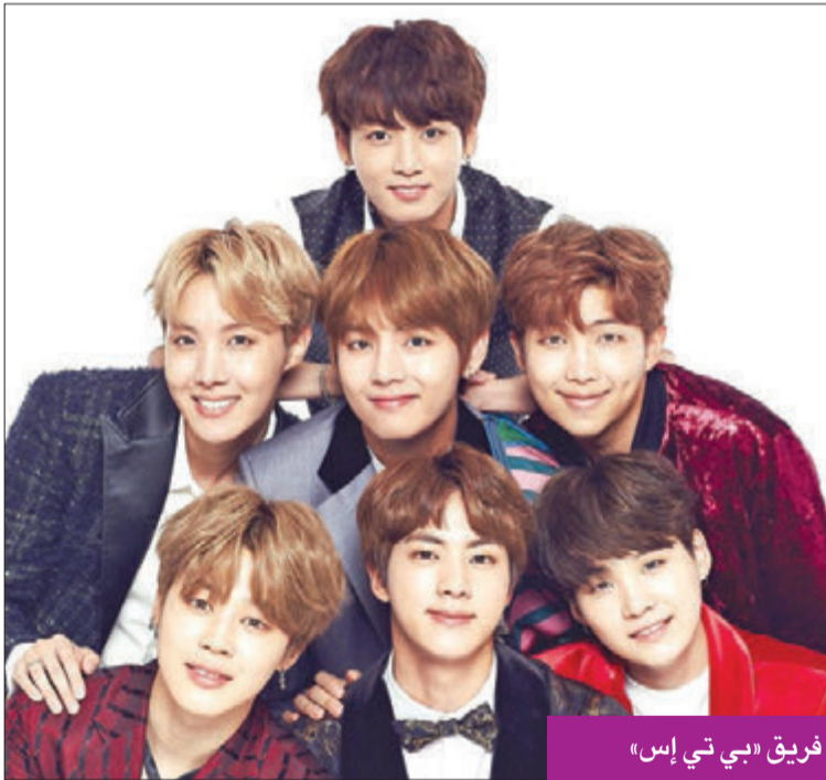
فريق «بي تي إس»