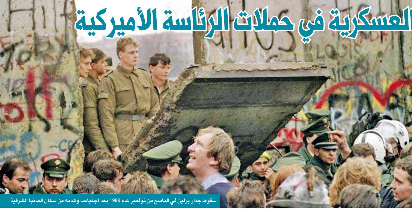
سقوط جدار برلين في التاسع من نوفمبر عام 1989 بعد اجتياحه وهدمه من سكان ألمانيا الشرقية

التي تهم وتؤثر بشكل واضح في تهديد مباشر لسلامة الشعب الأمريكي ورفاهيته. ولا يزال الإرهاب يمثل مشكلة صعبة ومتفاقمة وسيستمر على هذا النحو في المستقبل المنظور. وإضافة إلى ذلك فإن التصرفات العدوانية من جانب الخصوم مثل الصين وروسيا وإيران تسهم في تكدير الأميركيين بديمومة الجوانب الجيوسياسية، ولكن فيما يتعلق بالخطر الوشيك فمن كل تلك التهديدات لا تقارن بحصول ضحايا وباء كورونا أو بحصوله الخراب والدمار التي تلحقها سنويا ونتيجة العواصف والحرائق التي باي حال إلى حل عسكري.