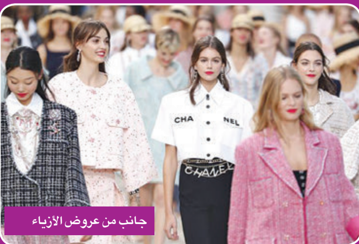
جانب من عروض الأزياء

على حضور جمهور، ومنها «فندي» و«دولتشي أند غابانا» و«إيترو» و«فيراغامو» و«ماكس مارا»، ورغم الصعوبات الناجمة عن تدابير التباعد الاجتماعي المفروضة بسبب جائحة كوفيد 19، وكذلك عن تغييرات اللحظة الأخيرة، كإلزامية إجراء فحص كورونا لجميع المسافرين الوافدين إلى إيطاليا من باريس. وإذا كان غياب الصينيين والكوريين والأميركيين ممنوعين من السفر إلى أوروبا رهنا، يكفل تحرير مقاعد استراتيجية يفيد منها غيرهم، فإن هذا الغياب يعكس كذلك استمرار أزمة القطاع رغم مؤشرات واضحة إلى عودة النشاط في الصين خلال الأشهر الأخيرة. (أ ف ب)