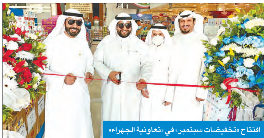
افتتاح «تخفيضات سبتمبر» في «تعاونية الجهراء»

الماجدي: تصل إلى 60% على أكثر من 250 صنفاً