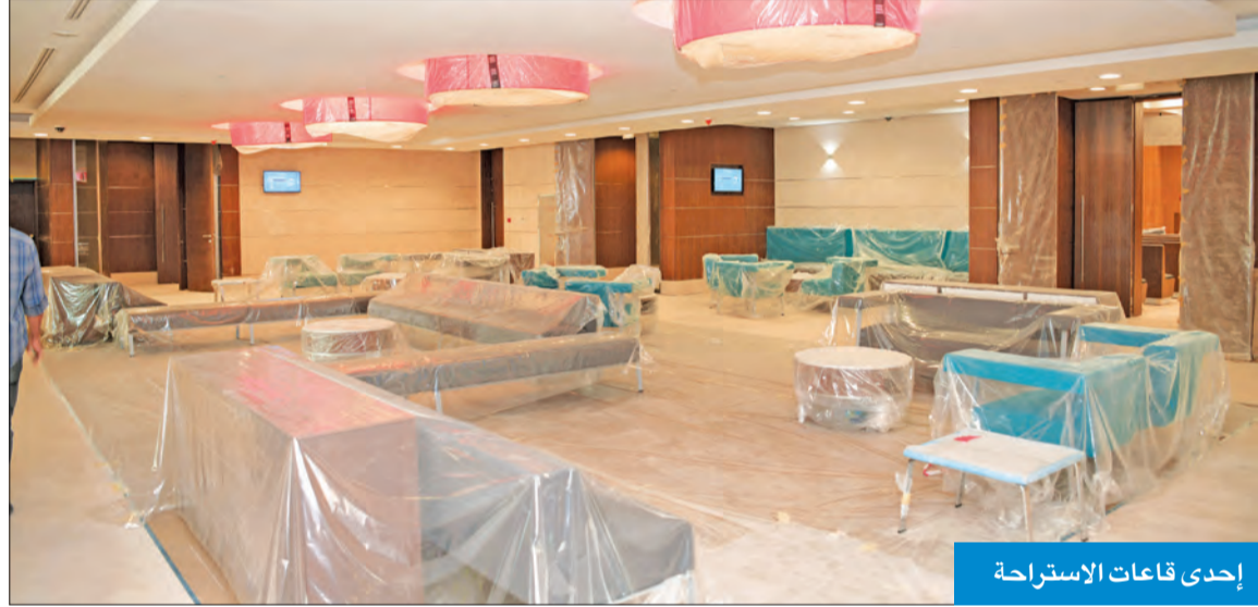
إحدى قاعات الاستراحة

وأضافت أنه في حال وجود أي مستند حديث توجد كاميرات لتصوير تلك المستندات، ومن ثم يتم عرضها على الموجودين.