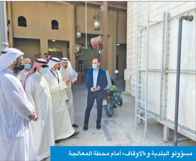
مسؤولو البلدية و«الأوقاف» أمام محطة المعالجة

قام قطاع المشاريع في بلدية الكويت بالتنسيق مع قطاع المساجد في وزارة الأوقاف، بتنفيذ مشروع لإعادة استخدام مياه وضوء المساجد في ري المزروعات بمنطقة أسواق المباركية، وهو عبارة عن غرفة معالجة مصغرة يتم تحويل مياه وضوء المساجد إليها، لتصفيتها وتعقيمها، ومن ثم استخدامها لري المزروعات في السوق.