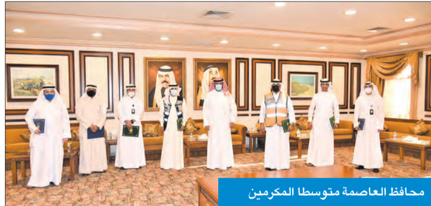
محافظ العاصمة متوسلاً المكرمين

كرم الموظفين المتميزين تقديراً لجهودهم في خدمة الوطن