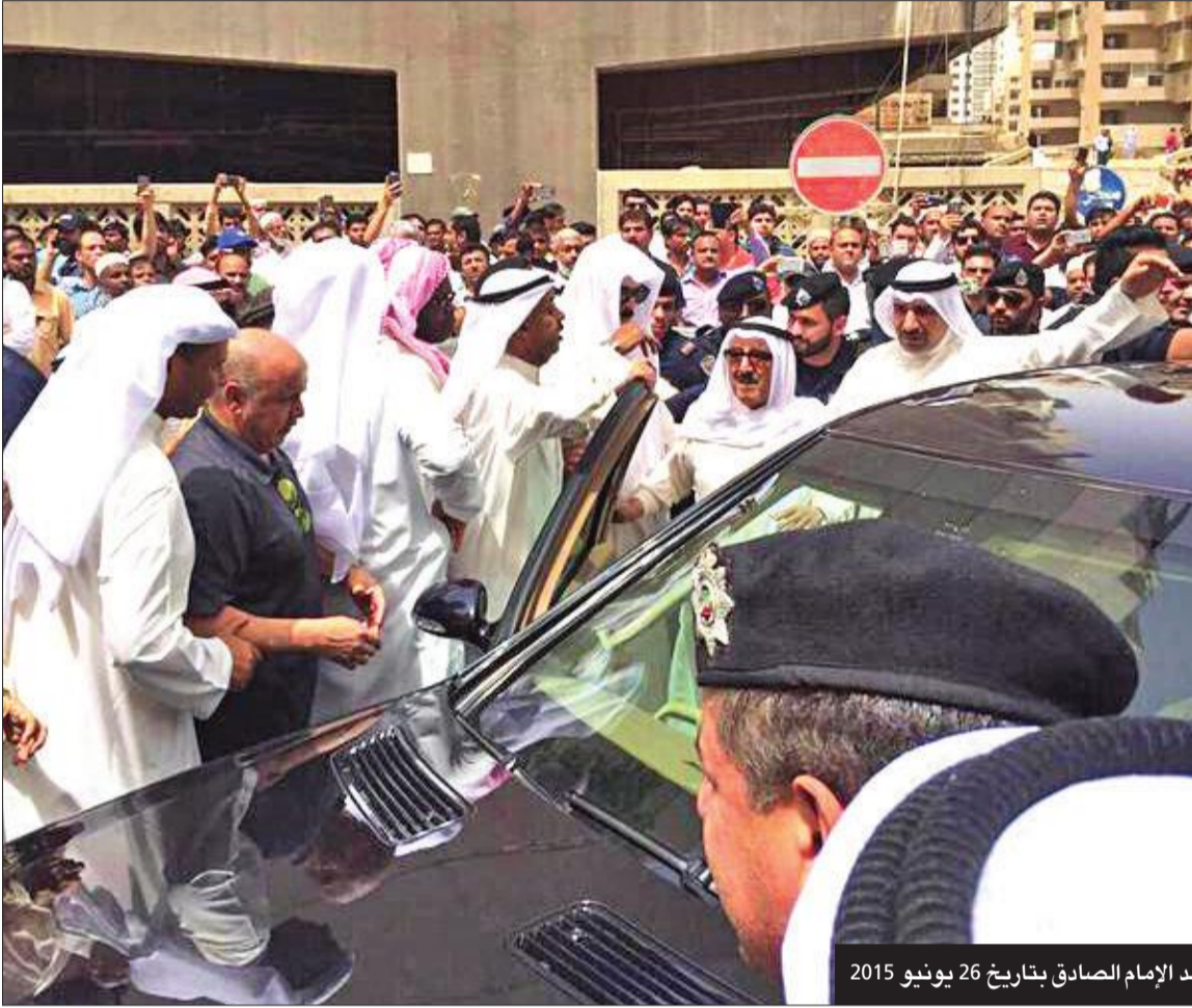
خلال تفقده موقع التفجير الإرهابي في مسجد الإمام الصادق بتاريخ 26 يونيو 2015