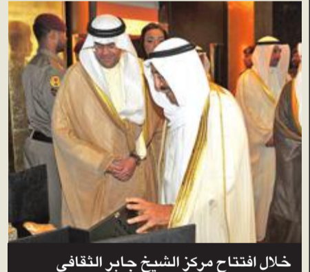
خلال افتتاح مركز الشيخ جابر الثقافي