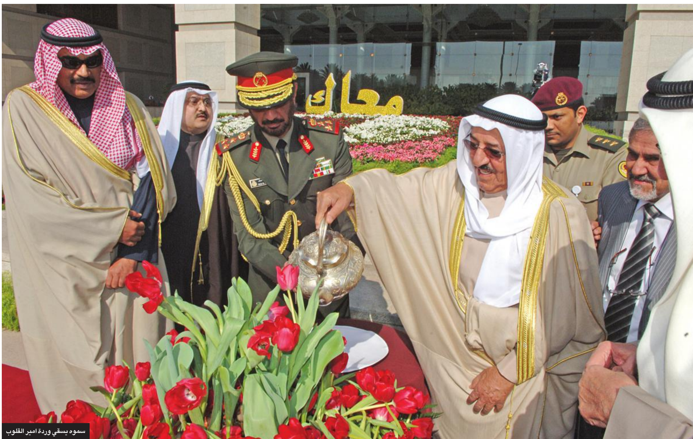
سموه يسقي وردة أمير القلوب