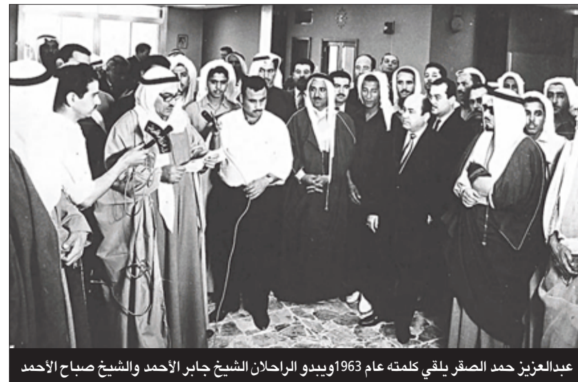
عبدالعزیز حمد الصقر يلقي كلمته عام 1963 ويبدو الراحلان الشيخ جابر الأحمد والشيخ صباح الأحمد