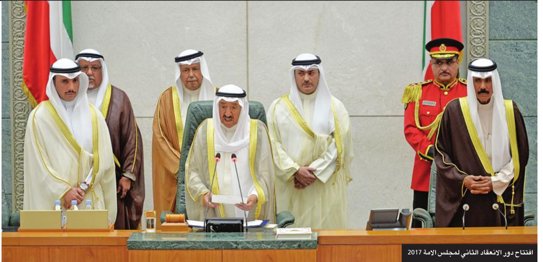
افتتاح دور الانعقاد الثاني لمجلس الأمة 2017

« إن الأمن والاستقرار، وسيادة القانون، والمبادئ التي جسدها الدستور، هي الأسس والقواعد التي نركز عليها لانطلاق عجلة الحياة العامة، واستمرارها بجميع خدماتها ومرافقها في سائر مناحي الحياة.»