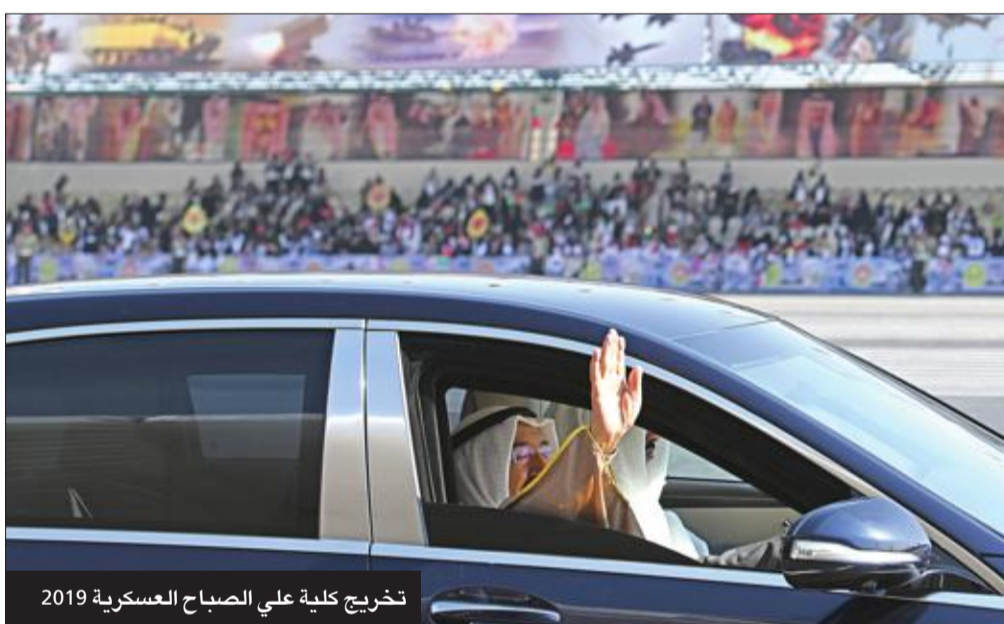
تخريج كلية علي الصباح العسكرية 2019