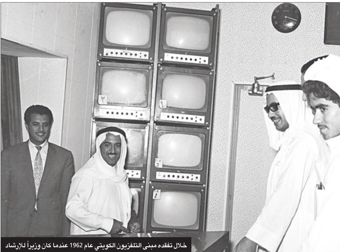
خلال تفقده مبنى التلفزيون الكويتي عام 1962 عندما كان وزيراً للإرشاد

انتهج مبدأ التوازن في التعامل مع القضايا السياسية وأبرزها الحرب العراقية الإيرانية وتخطى بالكويت مراحل حرجية في تاريخها