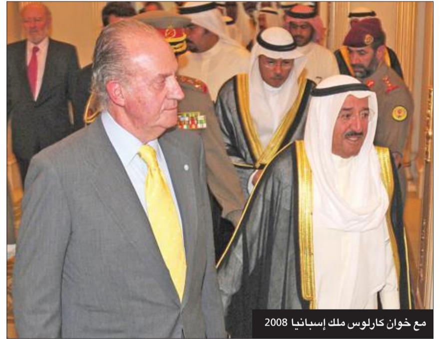
مع خوان كارلوس ملك إسبانيا 2008