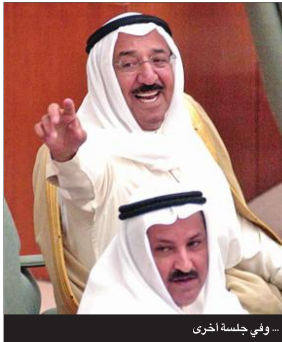
... وفي جلسة أخرى