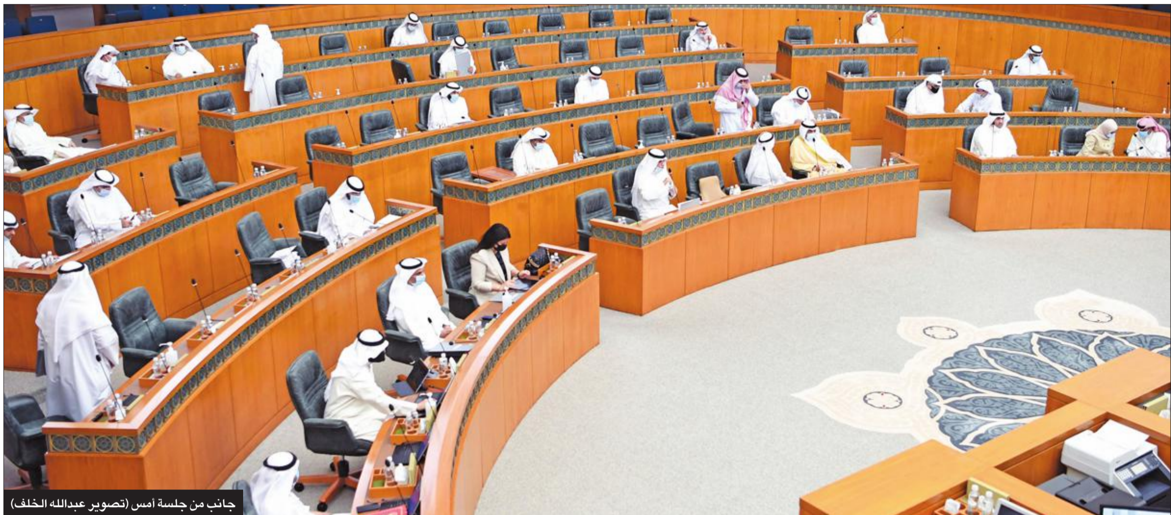
جانب من جلسة أمس

وبناء على رغبة الحكومة لعدم حضور نائب رئيس الوزراء وزير الداخلية وزير الدولة لشؤون مجلس الوزراء أنس الصالح، أجل المجلس بت قانون الإدارة العامة للتحقيقات.