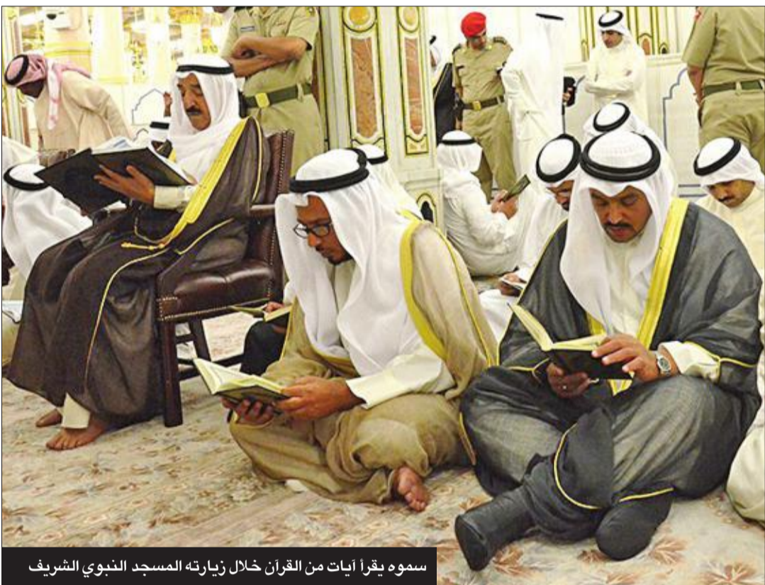
سموه يقرأ آيات من القرآن خلال زيارته المسجد النبوي الشريف

في عام 2018 تم افتتاح مسجد ومركز صباح الأحمد للدراسات الإسلامية في مدينة كانبرا بأستراليا