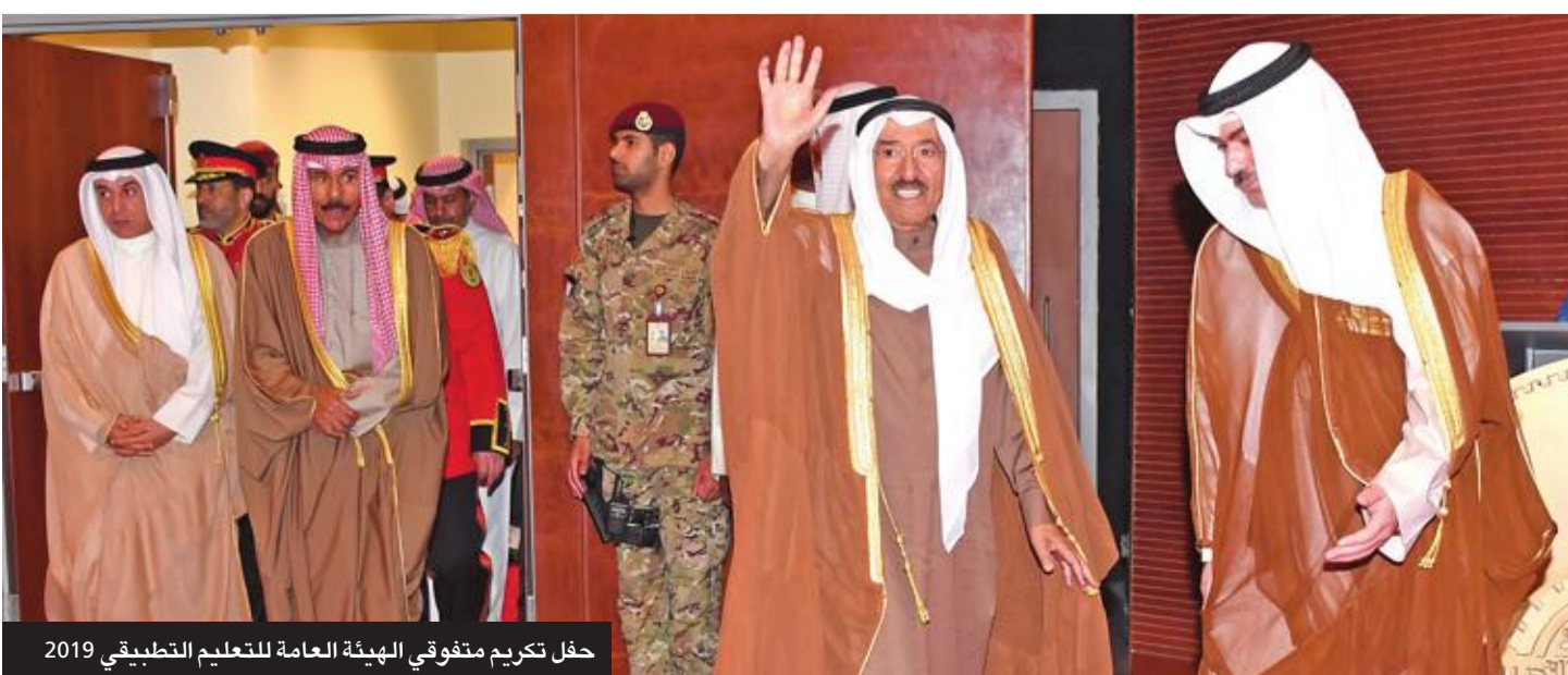
حفل تكريم منفوقى الهيئة العامة للتعليم التطبيقي 2019