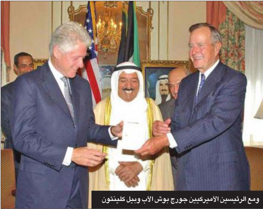
ومع الرئيسين الأميركيين جورج بوش الأب وبيبل كلينتون