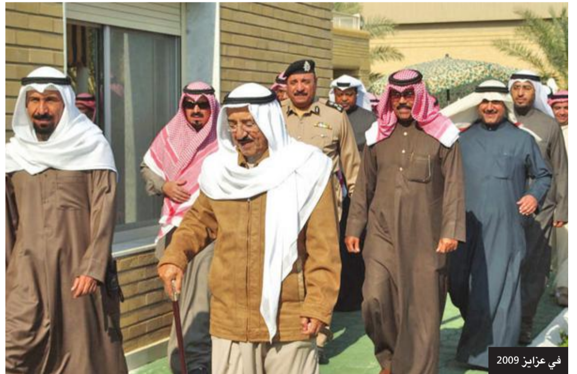
في عزايم 2009

«إننا نؤمن بأن الكويت لجميع أبنائها وليست لفئة دون أخرى فالكل يعيش على أرضها وينتمي لهويتها...»