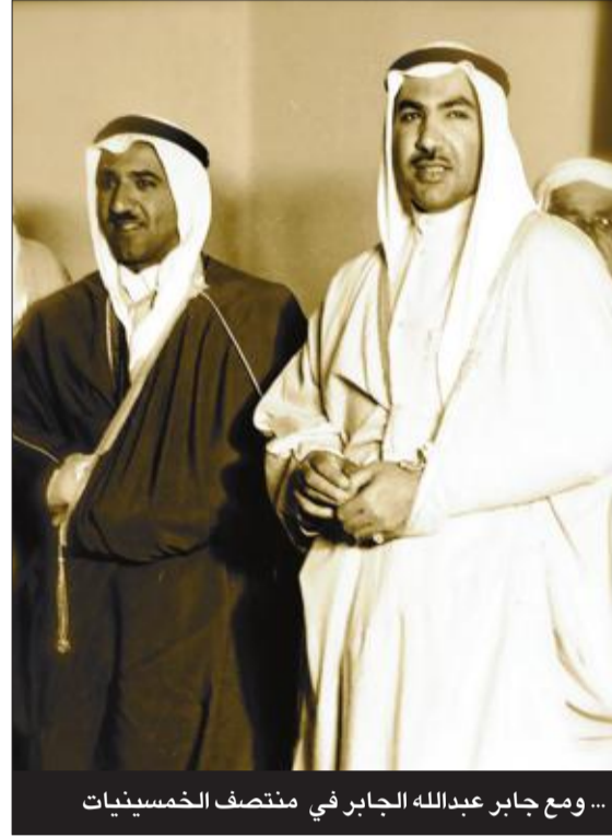
... ومع جابر عبدالله الجابر في منتصف الخمسينيات