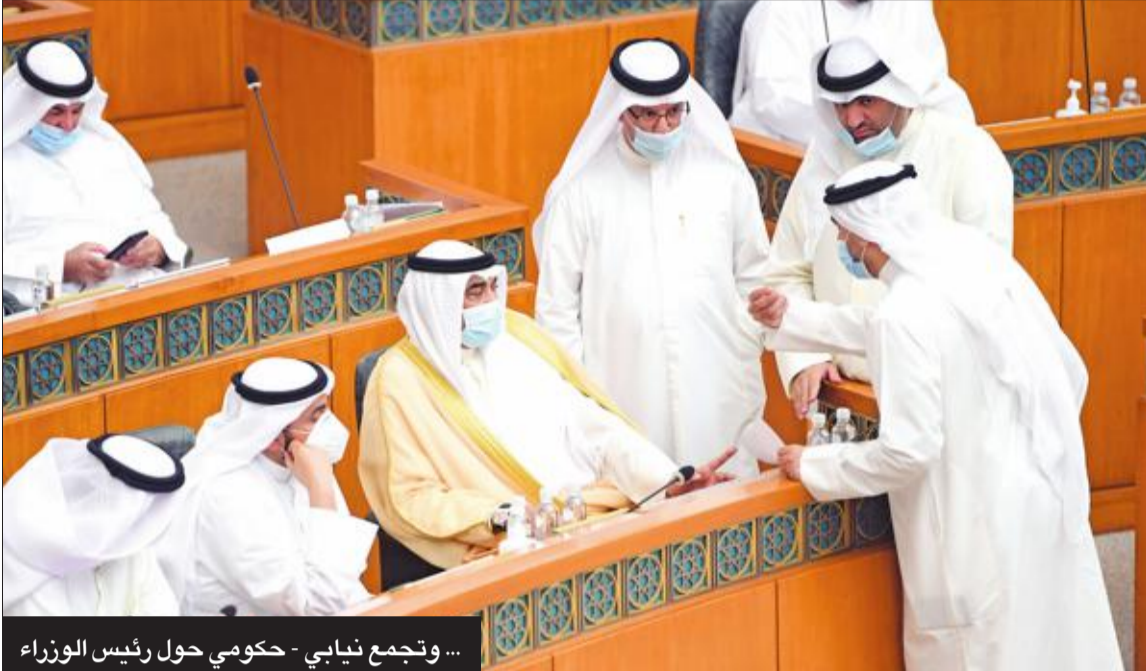
... وتجمع نيابتي - حكومي حول رئيس الوزراء