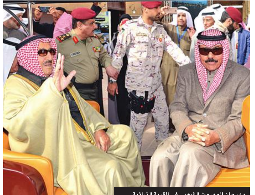
مهرجان الموروث الشعبي في القرية التراثية