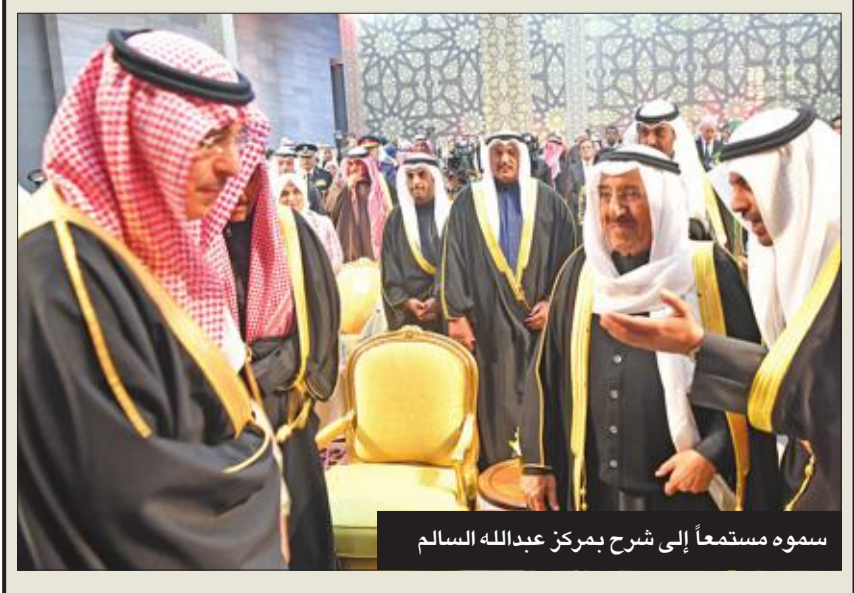
سموه مستمعاً إلى شرح بمركز عبدالله السالم