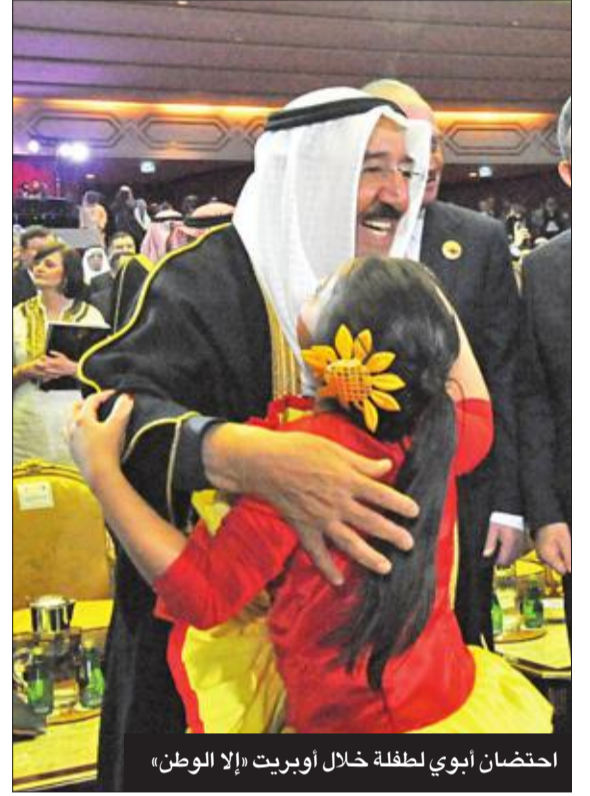
احتضان ابني لطفلة خلال أوبريت «إلا الوطن»