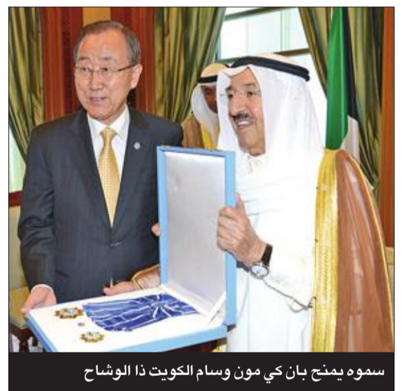
سموه يمنح بان كي مون وسام الكويت ذا الشواح