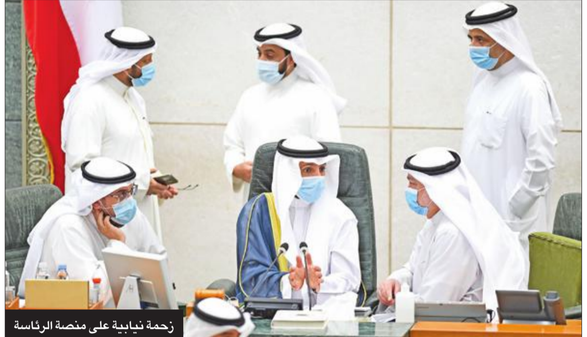
زعمة نيابية على منصة الرئاسة