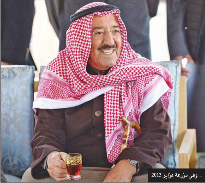
... وفي مزرعة عزابن 2013