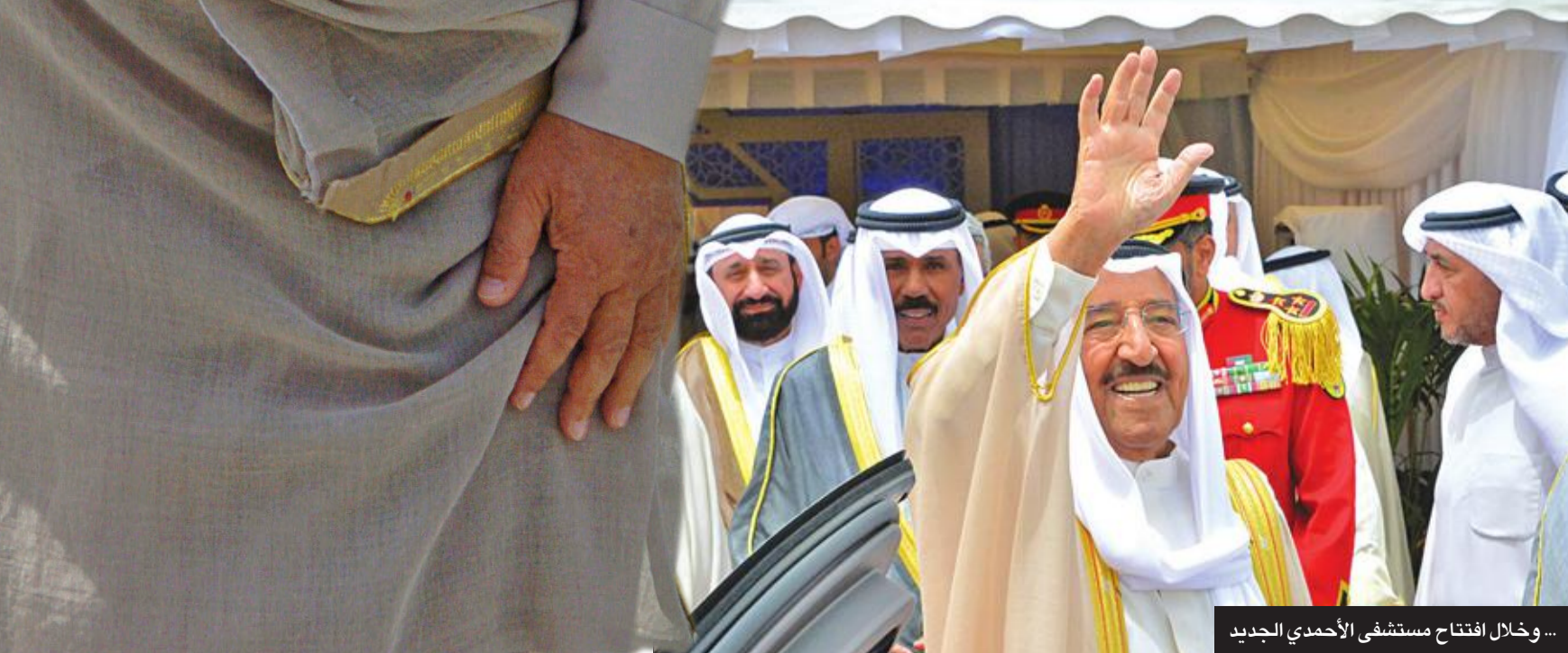
... وخلال افتتاح مستشفى الأحمدي الجديد