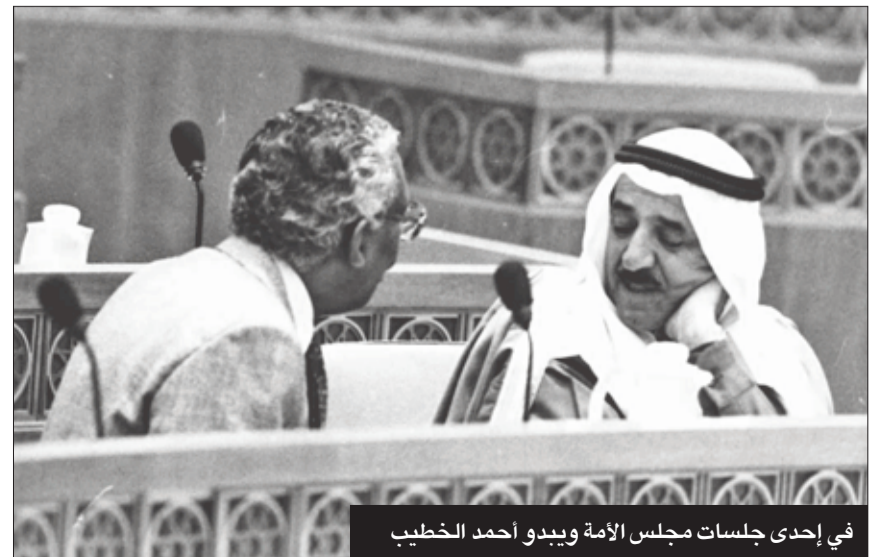
في إحدى جلسات مجلس الأمة ويبدو أحمد الخطيب