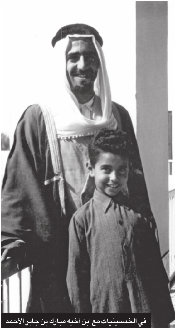
في الخمسينيات مع ابن أخيه مبارك بن جابر الأحمد

ولد الشيخ صباح الأحمد بتاريخ 16 يونيو عام 1929 في مدينة الجهراء شمال غرب الكويت العاصمة، وكانت الجهراء حينئذ قرية زراعية، وعاش طفولته في كنف أخواله آل العتار، الذين يُعدون من كبريات الأسر الكويتية في تلك المنطقة، التي غدت مدينة ثم محافظة بعد ذلك. وانتقل سموه من الجهراء إلى قصر السيف وهو في عمر الرابعة، حيث كبر مع أخيه الشيخ جابر في كنف الشيخة