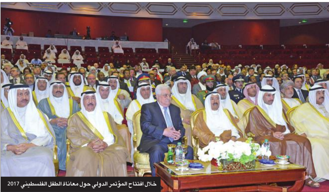
خلال افتتاح المؤتمر الدولي حول معاناة الطفل الفلسطيني 2017