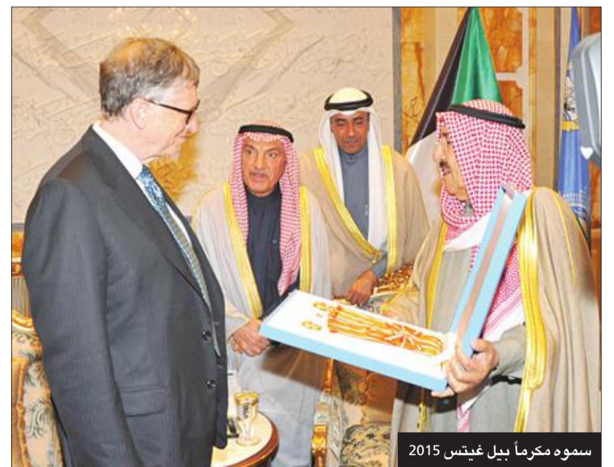
سموه مكرماً بيل غيتس 2015