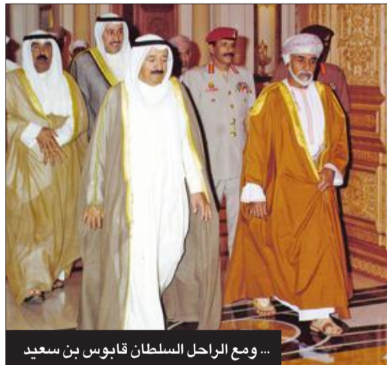
... ومع الراحل السلطان قابوس بن سعيد