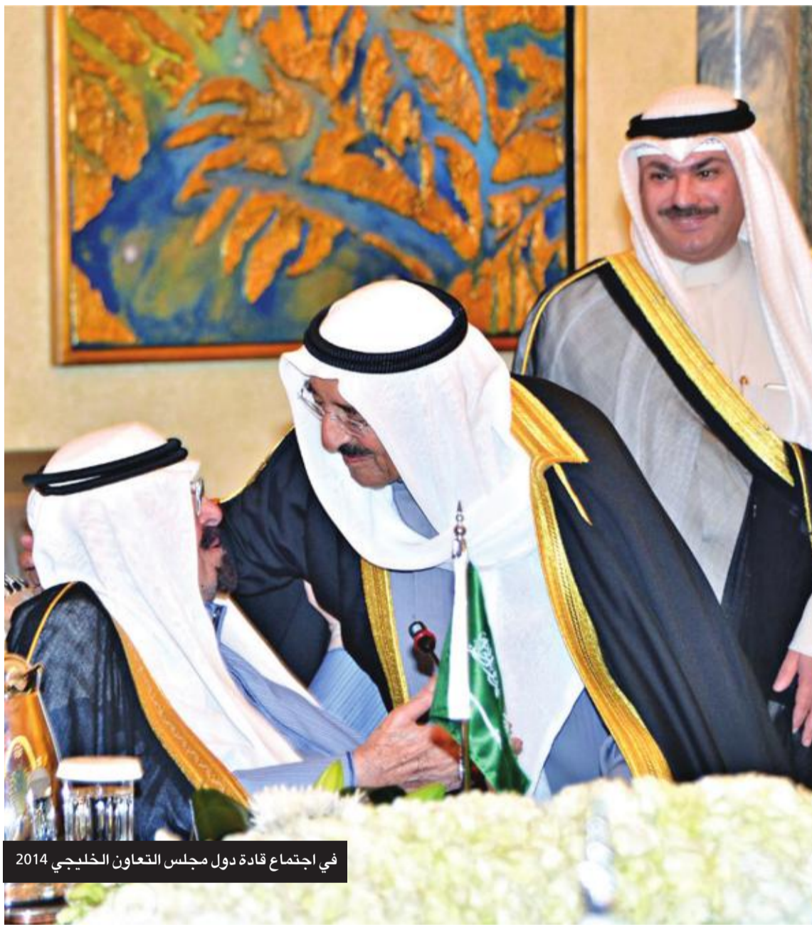
في اجتماع قادة دول مجلس التعاون الخليجي 2014

وفي عام 2018 أمر سموه، رحمه الله، وبلطفه إنسانية حانية بتسديد ديون الغارمين المحبوسين من مواطنين ومقيمين، رغبة من سموه بجمع شملهم بأسرهم، بمناسبة احتفالات البلاد بأعيادها الوطنية، كما أصدر سموه مكرمة مالية على نفقته الخاصة لمصلحة أبنائه المتألمين لإدخال الفرحة في نفوسهم، وكان رحمه الله قد أمر في عام 2011 بمكرمة أميرية بمنح كل مواطن ألف ديناراً وصرف التموين مجاناً لمدة عام، احتفالاً بالأعياد الوطنية، وتنفيذاً لتوجيهات سموه عام 2003 عندما كان رئيساً للوزراء، أنشأت الحكومة صندوقين خيريين، أحدهما لتعليم أبناء المحتاجين في الكويت، ومنهم فئة المقيمين بصورة غير قانونية، والآخر لتقديم الرعاية الصحية لهم بالتعاون