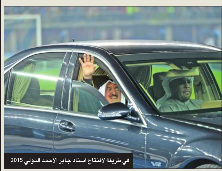
في طريقه لافتتاح استاد جابر الأحمد الدولي 2015