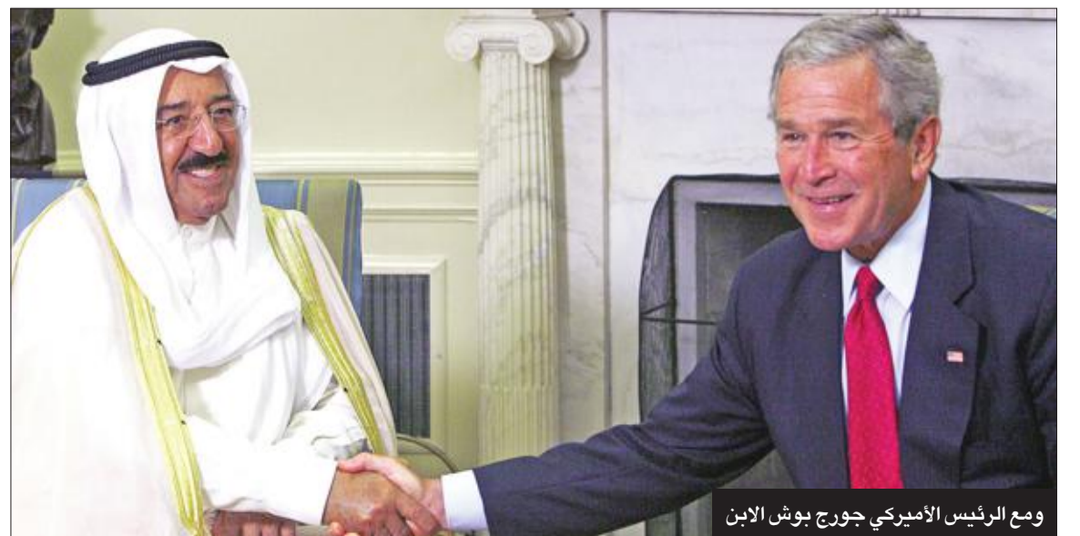
ومع الرئيس الأميركي جورج بوش الابن