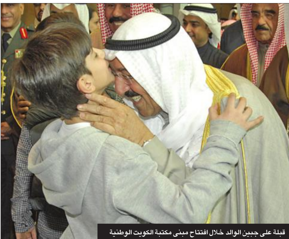
قبله على جبين الوالد خلال افتتاح مبنى مكتبة الكويت الوطنية