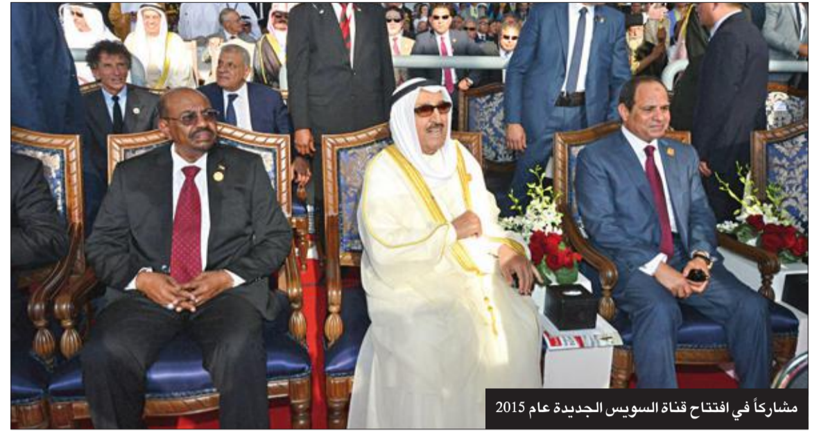
مشاركاً في افتتاح قناة السويس الجديدة عام 2015