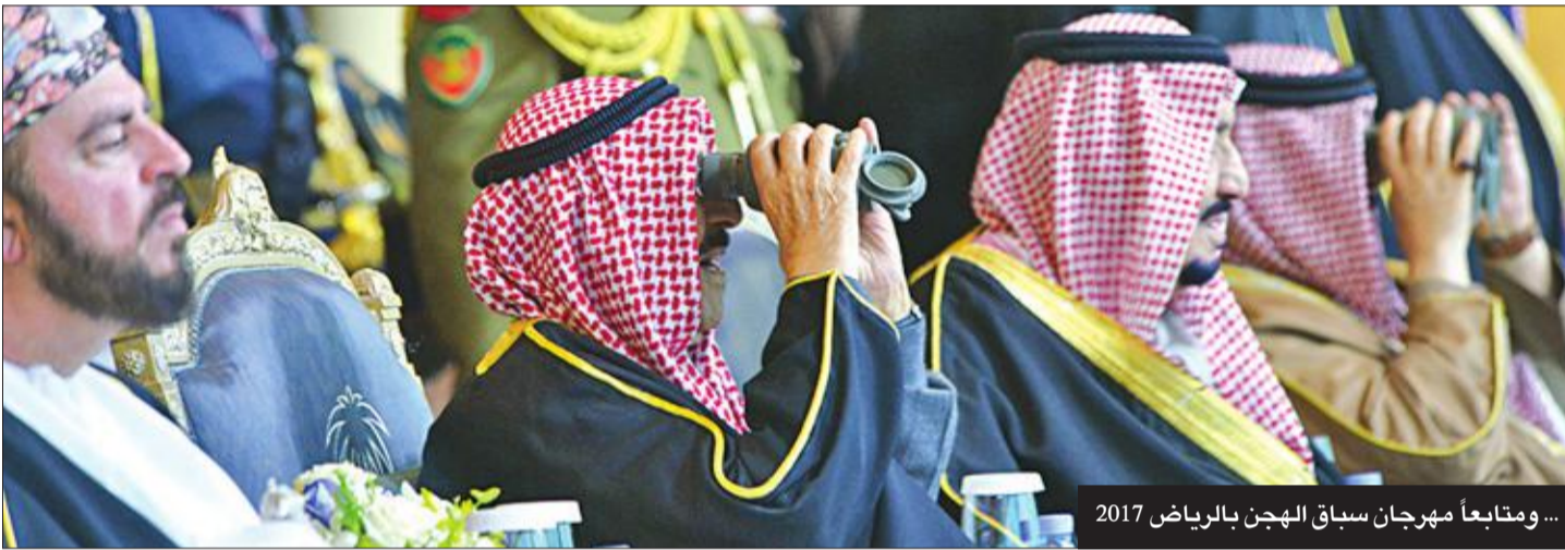
... ومتابعاً مهرجان سباق الهجن بالرياض 2017