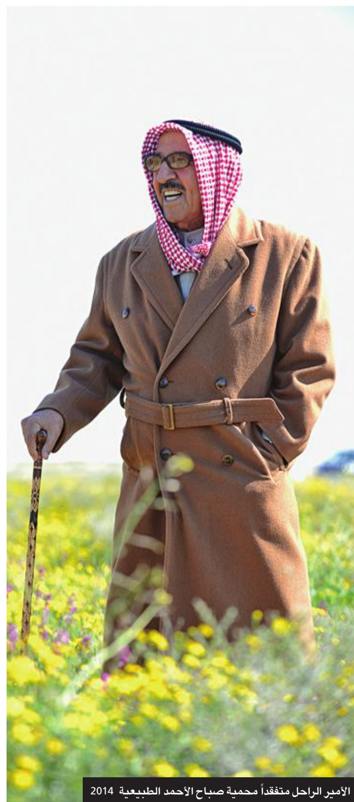
الأمير الراحل متفقداً محمية صباح الأحمد الطبيعية 2014

المناسبة: النطق السامي في دور الانعقاد العادي الأول 2009