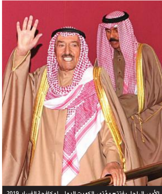
الأمير الراحل يفتتح مؤتمر الكويت الدولي لمكافحة الفساد 2019