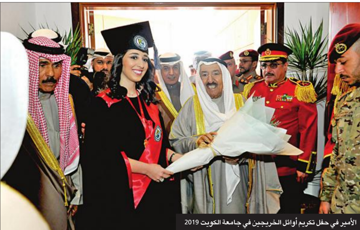
الأمير في حفل تكريم أوائل الخريجين في جامعة الكويت 2019