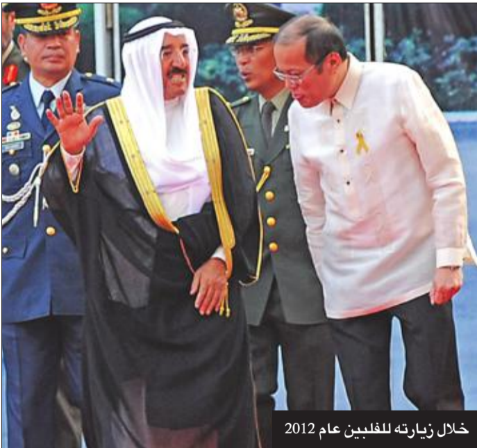
خلال زيارته للفلبين عام 2012