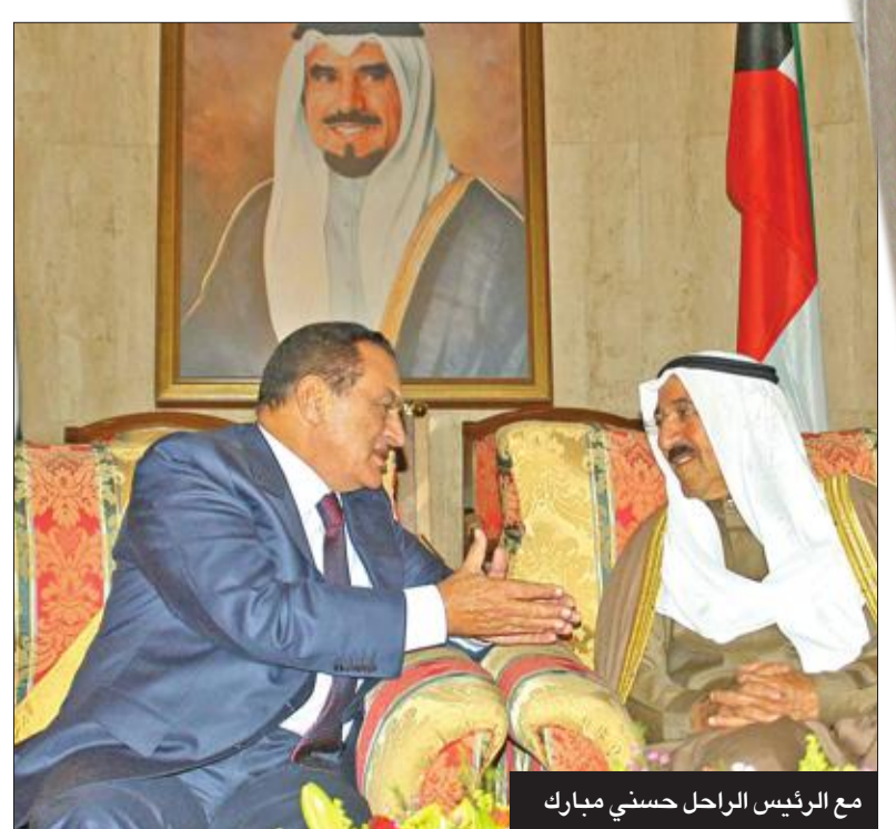
مع الرئيس الراحل حسني مبارك