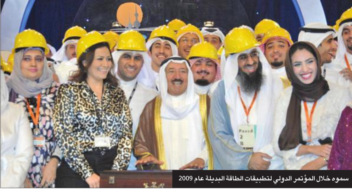
سموه خلال المؤتمر الدولي لتطبيقات الطاقة البديلة عام 2009