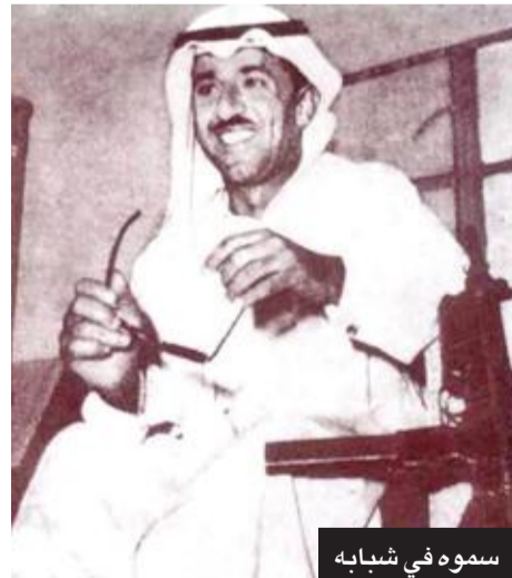
سموه في شبابه