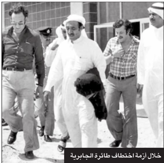
خلال أزمة اختطاف طائرة الجابرية