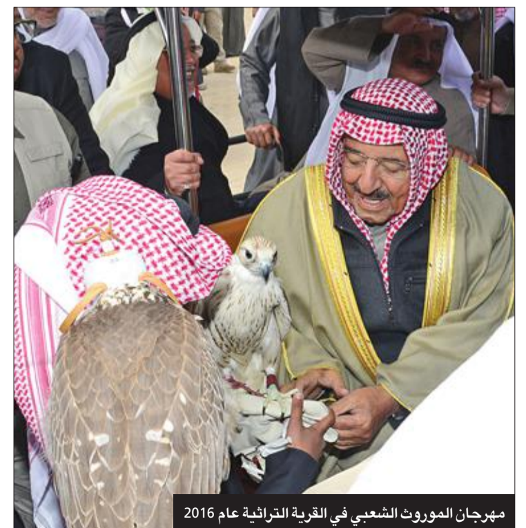
مهرجان الموروث الشعبي في القرية التراثية عام 2016