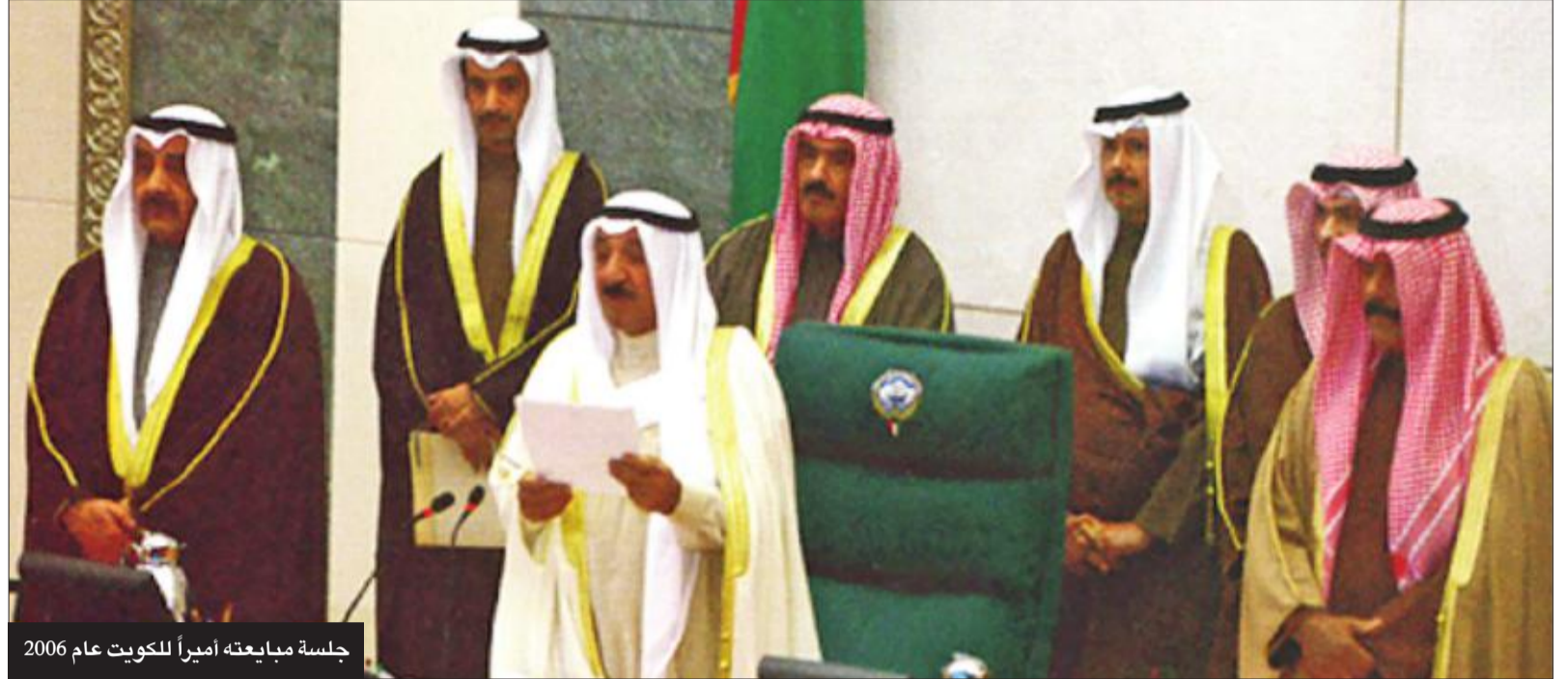
جلسة مبايعته أميراً للكويت عام 2006