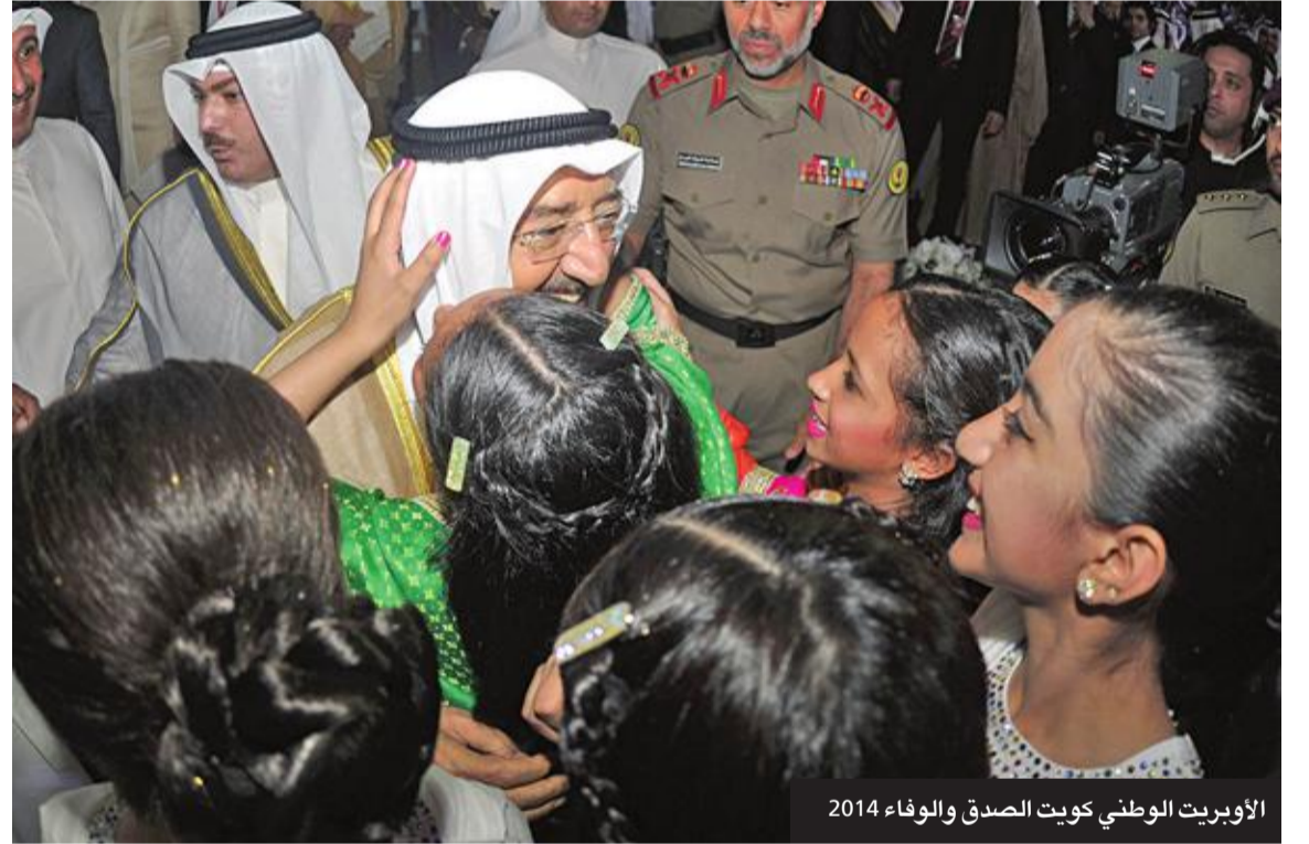
الأوبريت الوطني كويت الصدق والوفاء 2014