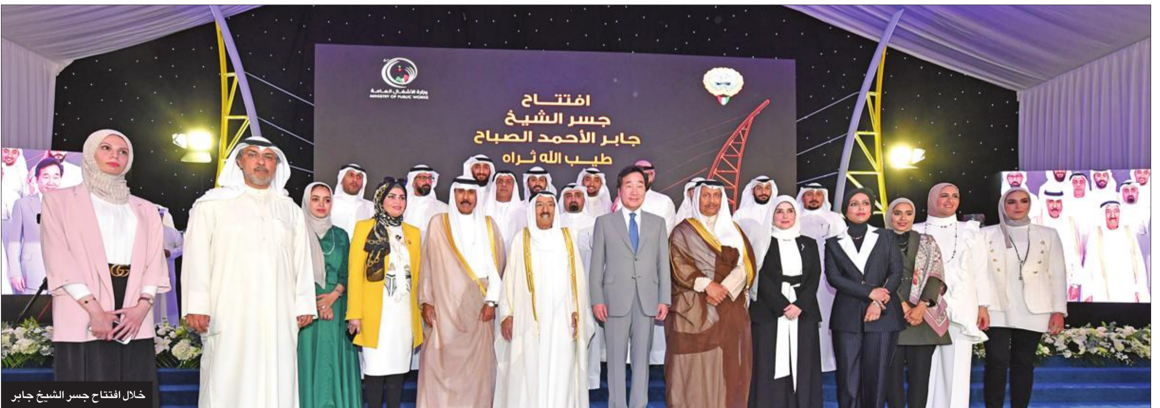
خلال افتتاح جسر الشيخ جابر