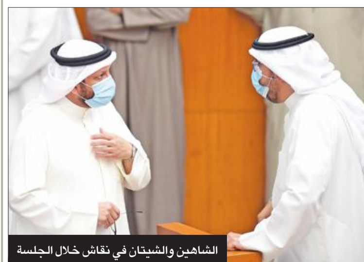
الشاهين والشيتان في نقاش خلال الجلسة

تقدر بأكثر من أسبوع من أجل تقرير وجهات النظر، لأن هذا القانون محل حديث الجميع، ويجب أن نترجم أقوالنا إلى أفعال بإقراره".