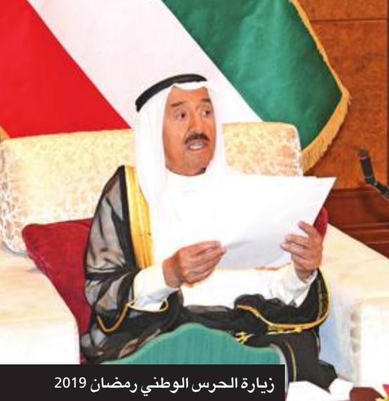
زيارة الحرس الوطني رمضان 2019