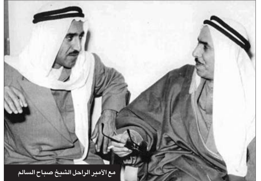
مع الأمير الراحل الشيخ صباح السالم

مع أبناءه من رجال الجيش والشرطة ومختلف قطاعات المجتمع وجمعيات النفع العام وتلمس أحوالهم وسماع آمالهم وطموحاتهم، حافظ سموه على عادته الرمضانية السنوية بزيارات تشمل نادي ضباط الجيش ووزارة الداخلية والإدارة العامة للإطفاء والرئاسة العامة للحرس الوطني، وديوانية الرعي الأول وكبار السن وجمعية المكفوفين الكويتية، والنادي الكويتي الرياضي للمعاقين وجمعية الصم والبكم، وديوانية شعراء النبط والمقاهي الشعبية. وضمن الفعاليات والأنشطة الخاصة باحتفالات الأعياد الوطنية، واضب سموه على حضور الأوبريتات الوطنية المدرسية، ليكون داعماً ودافعاً لغرس الروح الوطنية في قلوب الطلاب والطالبات المشاركين في الأوبريت.