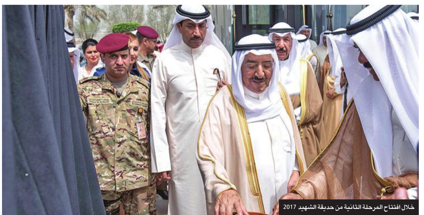
خلال افتتاح المرحلة الثانية من حديقة الشهيد 2017