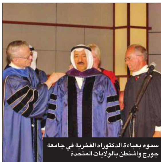
سموه بعبارة الدكتوراه الفخرية في جامعة جورج واشنطن بالولايات المتحدة