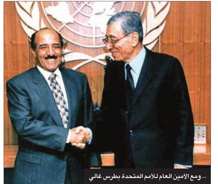
... ومع الأمين العام للأمم المتحدة بطرس غالي