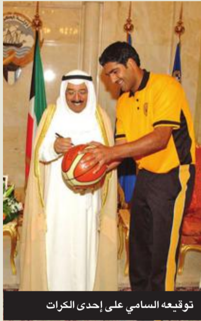
توقيع السامي على إحدى الكرات

وبطولة أمير الكويت الدولية الكبرى للرماية التي تقام سنوياً. ولعل الشغل الشاغل لسموه كان رفع الإيقاف الرياضي الضالَم والمشووم عن الرياضة الكويتية، الذي فرض في 27 أكتوبر 2015، وهو ما تحقق في عام 2019 برفع الإيقاف نهائياً عن الرياضة الكويتية، بفضل الدعم غير المحدود من لدن سموه، وبجهود أبناء الكويت على كافة المستويات، سواء الحكومة أو مجلس الأمة أو الهيئة العامة للرياضة. وقد أعرب، رحمه الله، بعد قرار رفع الإيقاف عن تطلعه إلى أن تسهم خطوة رفع تعليق النشاط الرياضي عن الكويت، في تحقيق الرياضيين المزيد من البطولات والإنجازات، موجهاً إياهم إلى أن يتخذوا من قرار رفع التعليق حافزاً لهم.