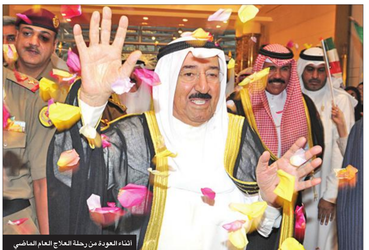
أثناء العودة من رحلة العلاج العام الماضي