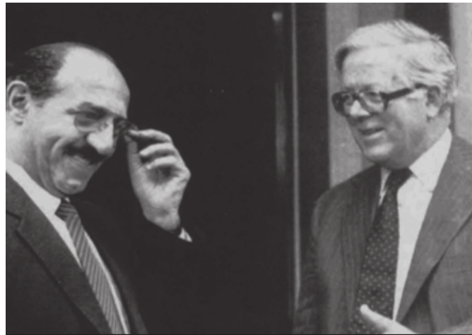
وزير الخارجية البريطاني جفري هاو لدى استقباله وزير الخارجية صباح الأحمد