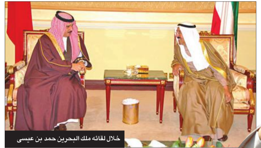
خلال لقائه ملك البحرين حمد بن عيسى

قاد نهضة ثقافية وأنشأ مركزاً عبدالله السالم والشيخ جابر الثقافيين ومتحف قصر السلام