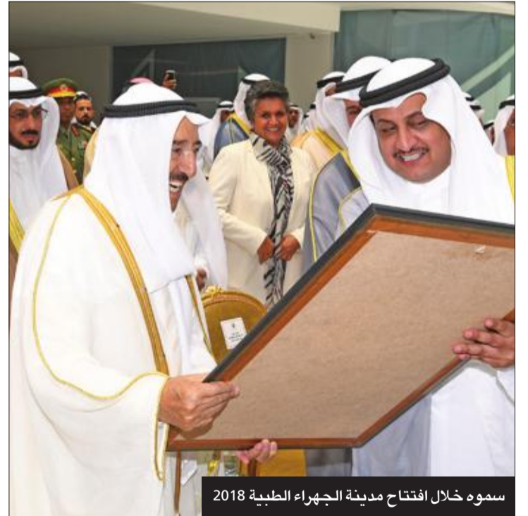
سموه خلال افتتاح مدينة الجهراء الطبية 2018