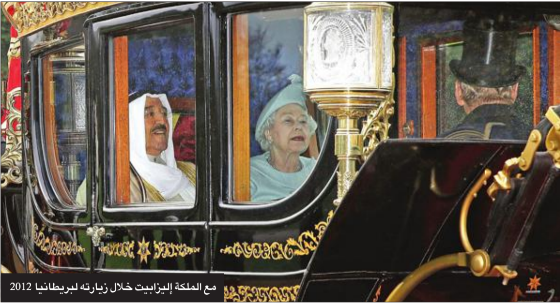
مع الملكة إليزابيث خلال زيارته لبريطانيا 2012