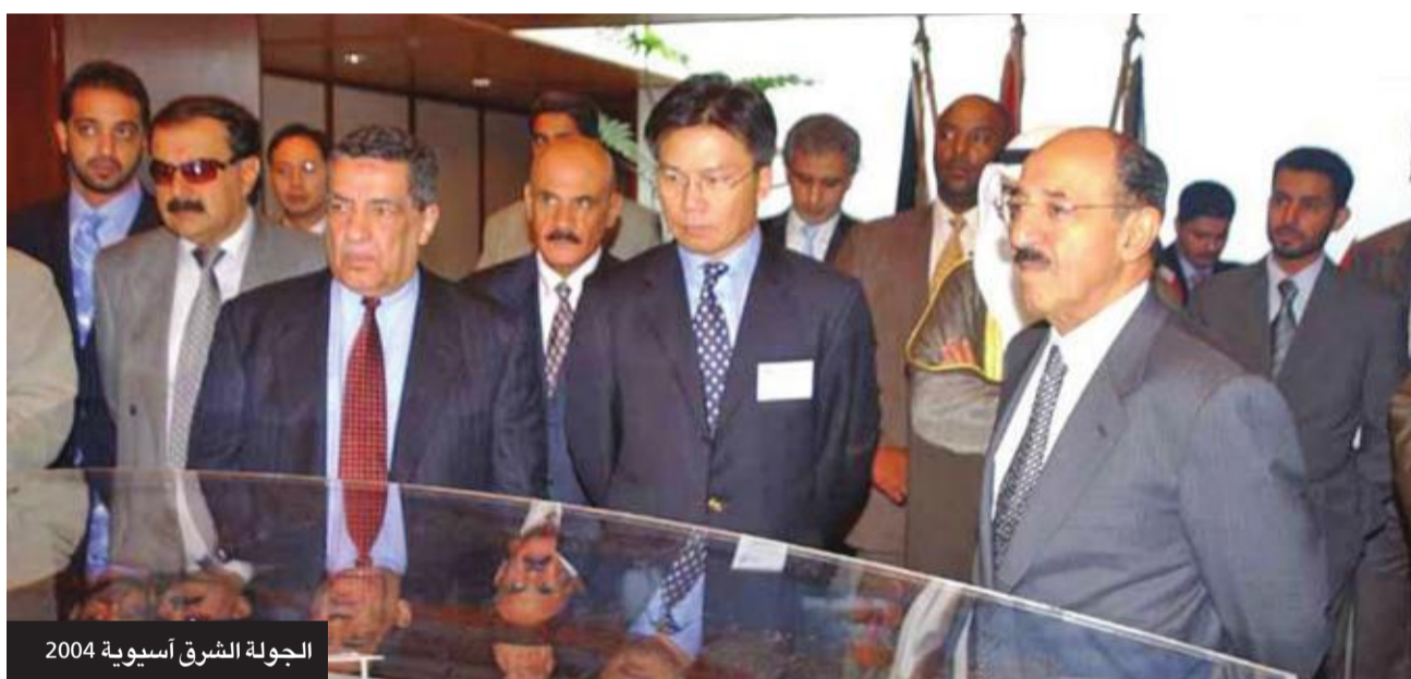
الجولة الشرق آسيوية 2004