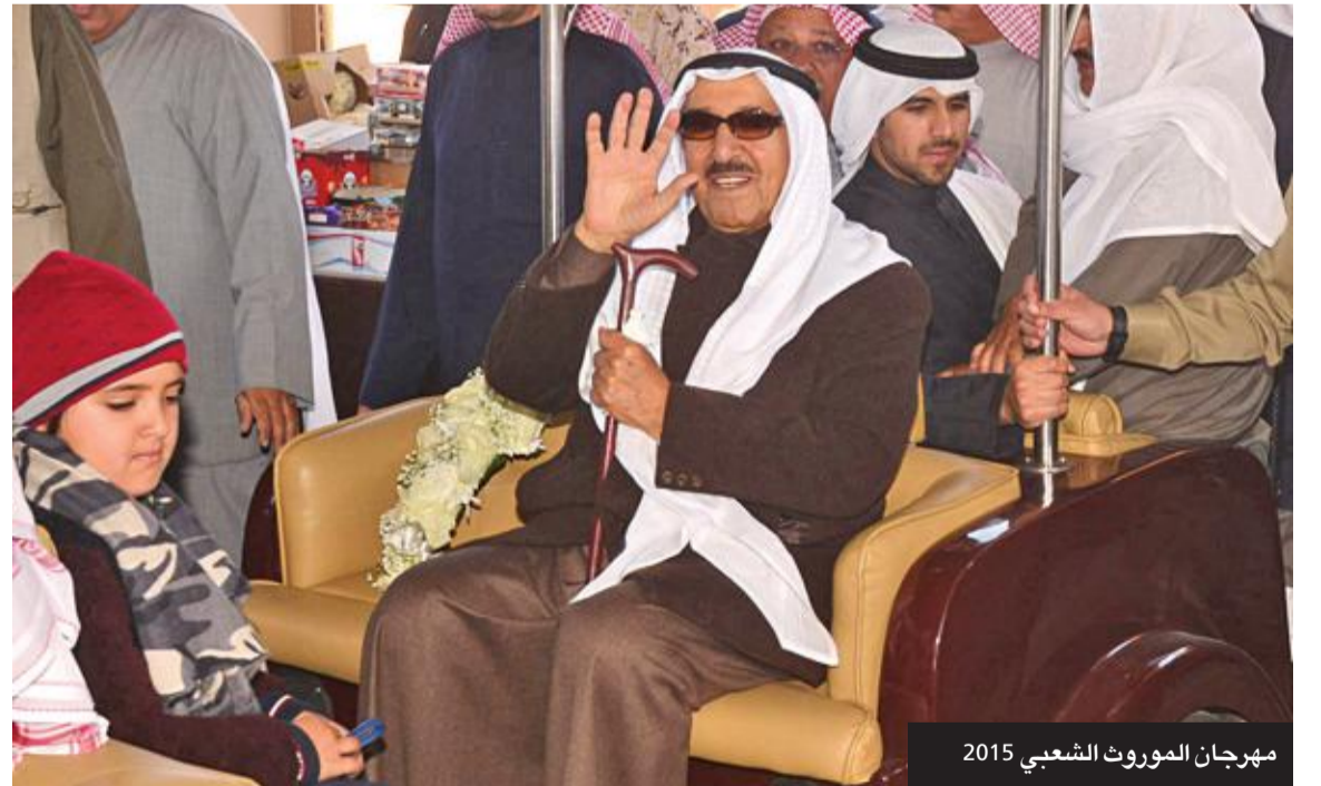
مهرجان الموروث الشعبي 2015