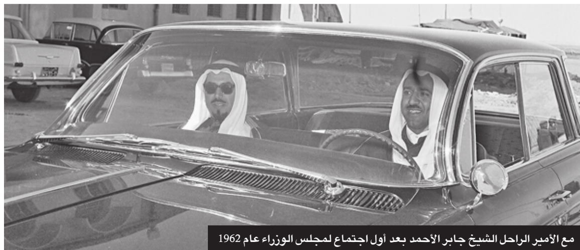
مع الأمير الراحل الشيخ جابر الأحمد بعد أول اجتماع لمجلس الوزراء عام 1962