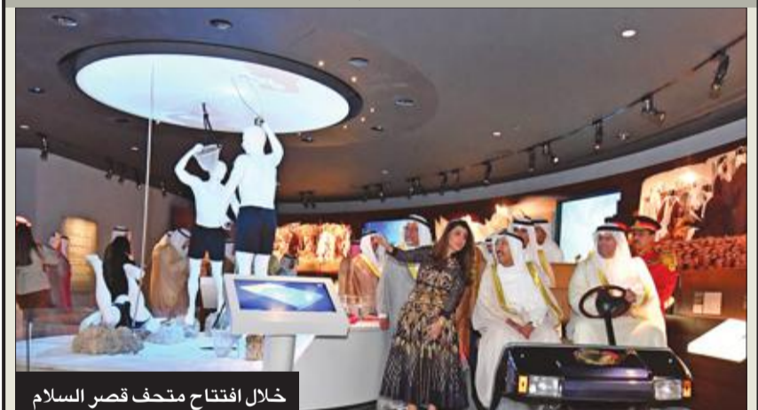
خلال افتتاح متحف قصر السلام

قاد نهضة ثقافية وأنشأ مركزاً عبدالله السالم والشيخ جابر الثقافيين ومتحف قصر السلام