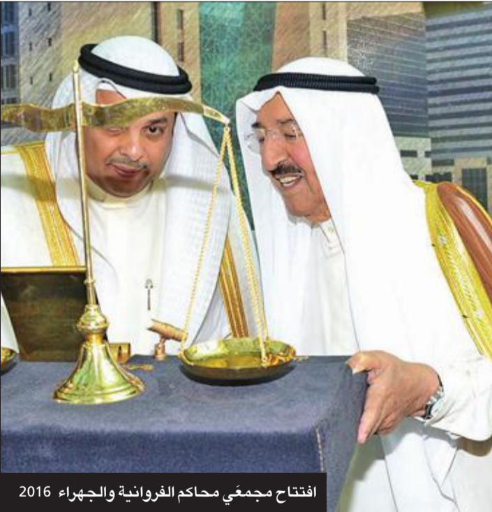
افتتاح مجمعي محاكم الفروانية والجهراء 2016