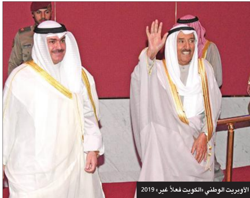
الأوبريت الوطني «الكويت فعلاً غير» 2019