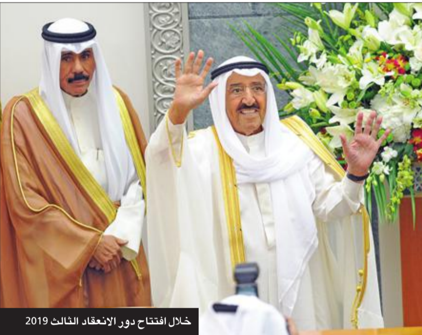
خلال افتتاح دور الانعقاد الثالث 2019