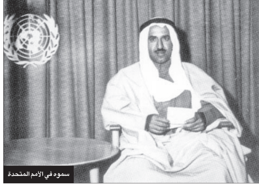
سموه في الأمم المتحدة

دول العالم. وفي عام 2018 تم افتتاح مسجد ومركز صباح الأحمد للدراسات الإسلامية في مدينة كانبرا بأستراليا، وقد سُمي باسم صاحب السمو الشيخ صباح الأحمد أمير الإنسانية تقديراً لجهوده وإسهاماته بالعمل الإسلامي والخيري في العالم.