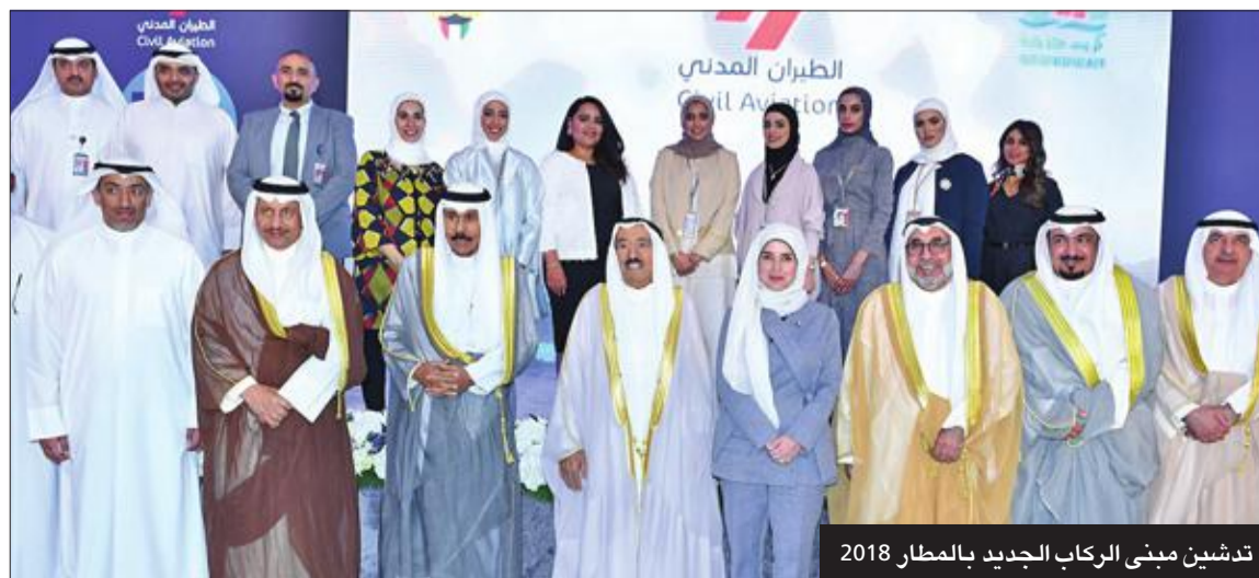
تدشين مبنى الركاب الجديد بالمطار 2018