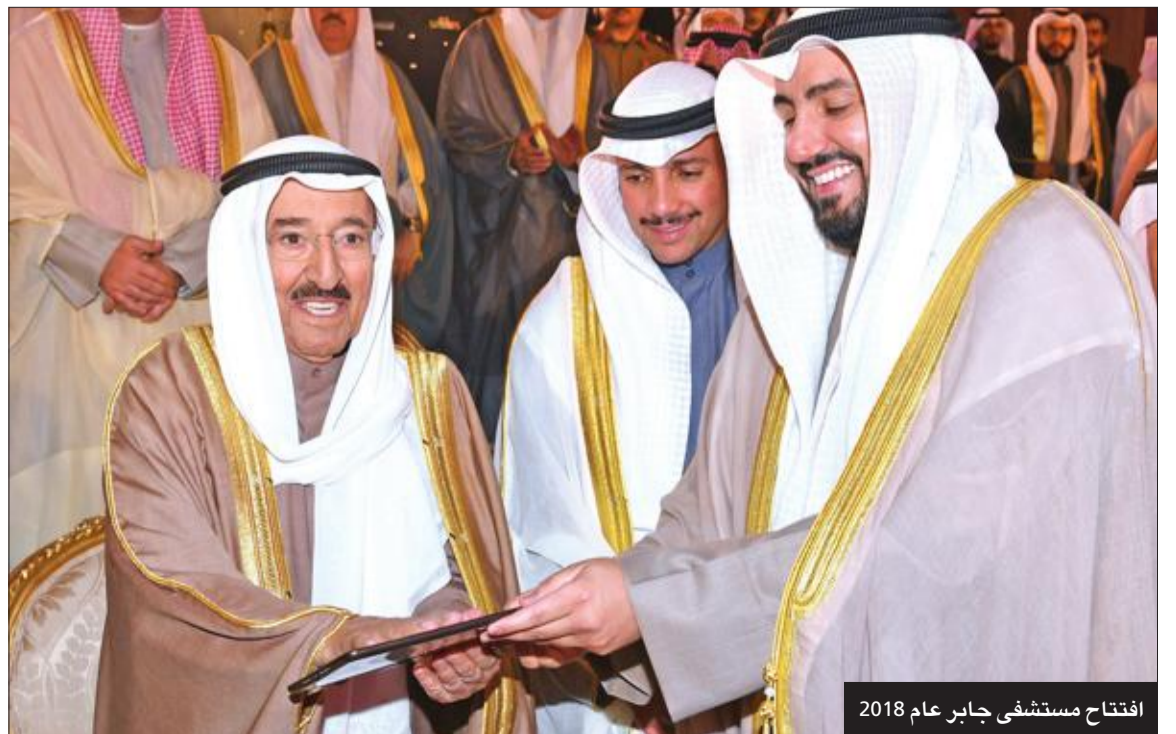
افتتاح مستشفى جابر عام 2018