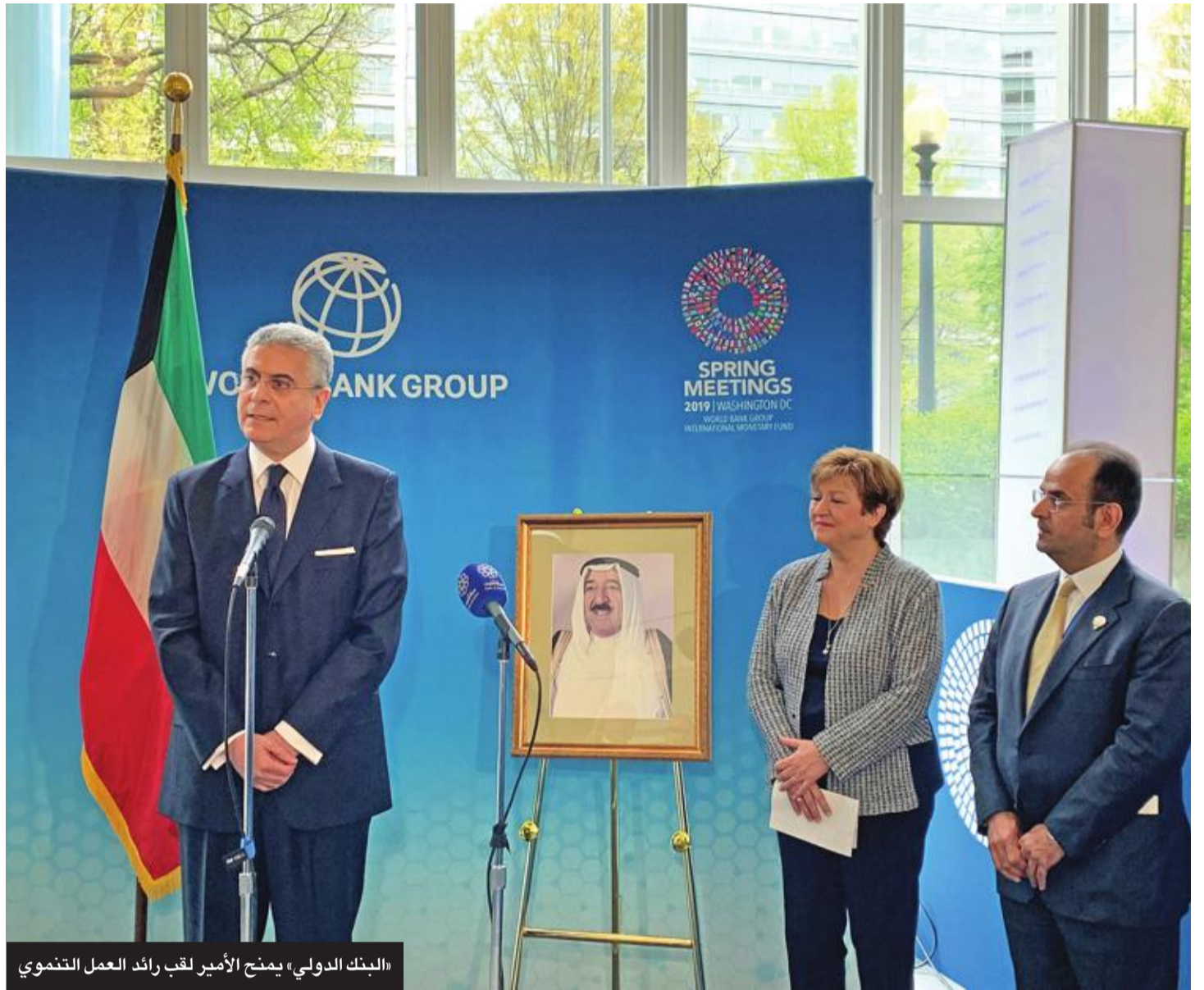
«البنك الدولي» يمنح الأمير لقب رائد العمل التنموي