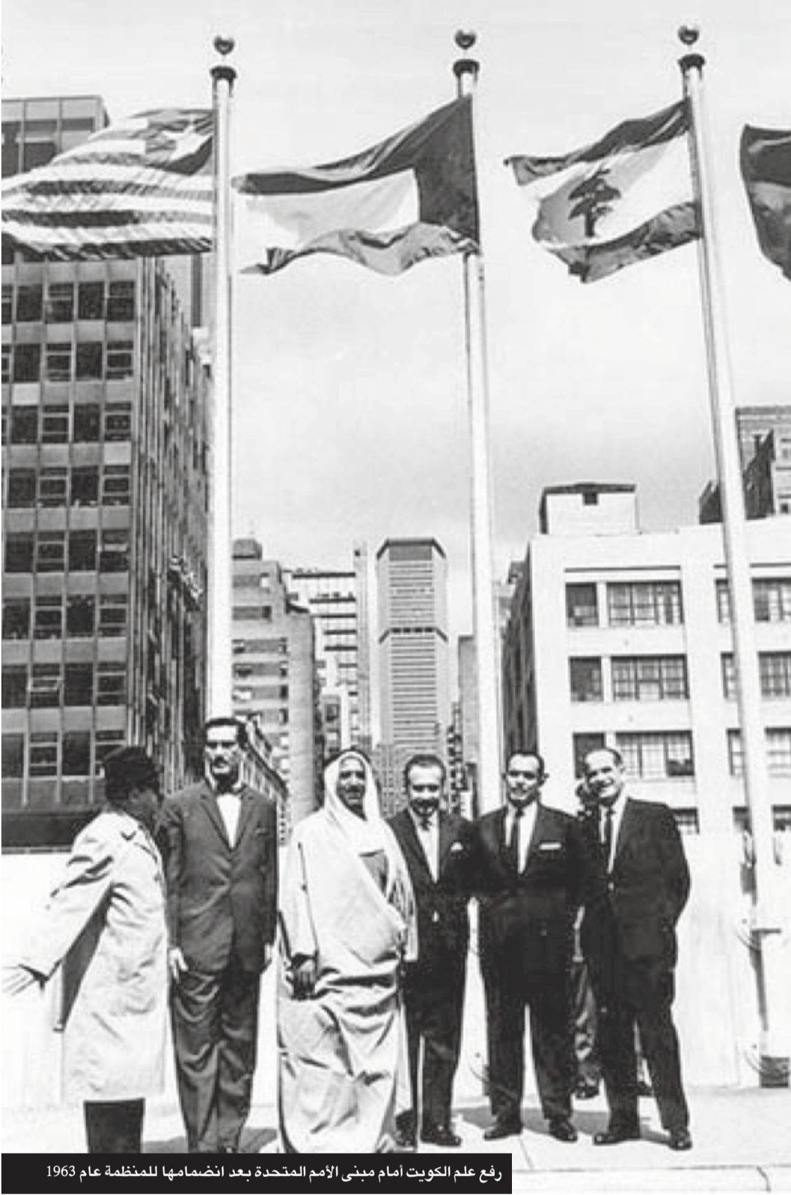
رفع علم الكويت أمام مبنى الأمم المتحدة بعد انضمامها للمنظمة عام 1963