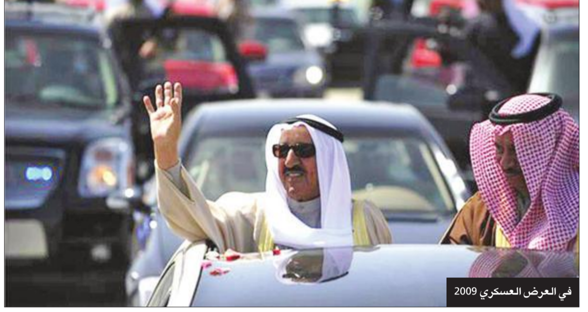
في العرض العسكري 2009