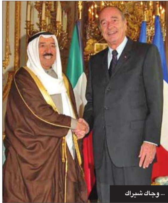
... وجاك شيراك