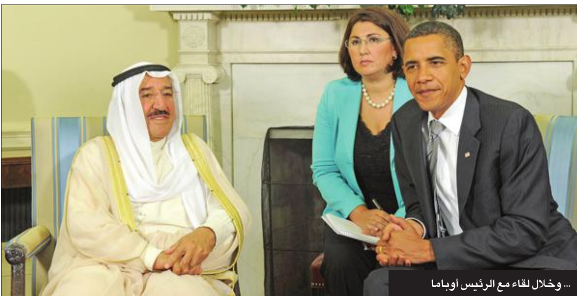
... وخلال لقاء مع الرئيس أوباما