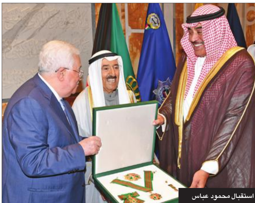
استقبال محمود عباس