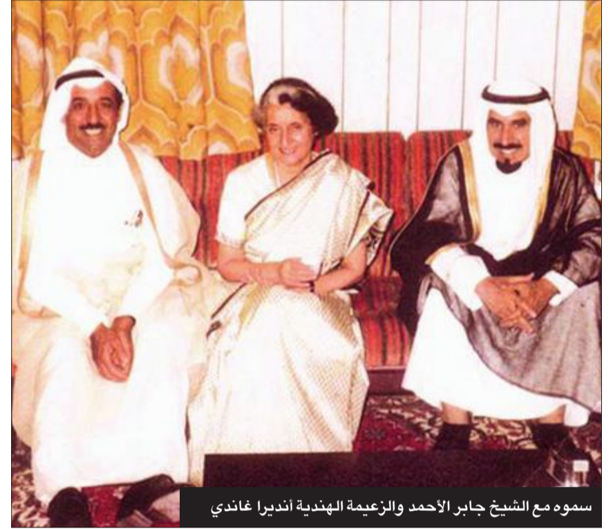
سموه مع الشيخ جابر الأحمد والزعيمة الهندية أنديرا غاندي