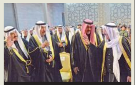
... وافتتاح مركز الشيخ عبدالله السالم