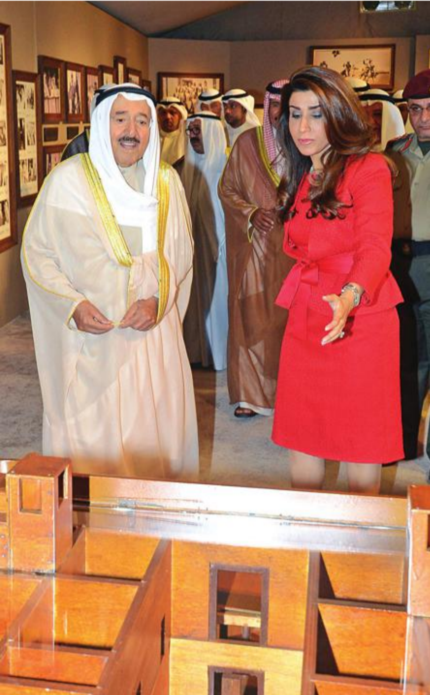
الراحل خلال رعايته حفل اختيار الشيخ عبدالله الجابر الصباح الشخصية الرائدة لـ«الديونسكو» في مجال الثقافة والتعلم لعام 2014 - 2015

سموه رفض في بداية الوباء اقتراح الحكومة خروجه من الكويت وأثر البقاء مع إخوانه وأبنائه المواطنين