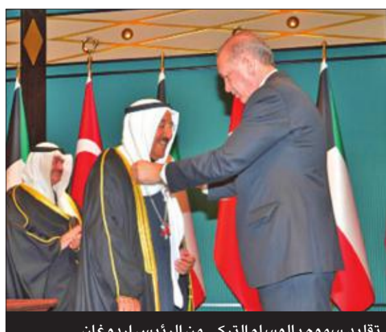
تقليد سموه بالوسام التركي من الرئيس إردوغان