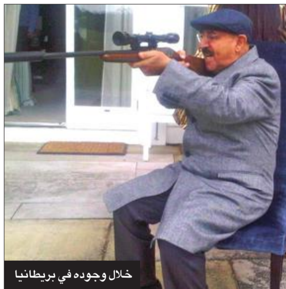
خلال وجوده في بريطانيا