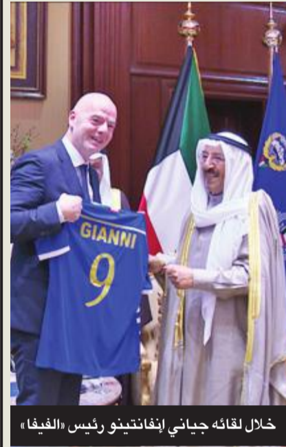
خلال لقائه جيانى إيفانتينو رئيس «الفيفا»