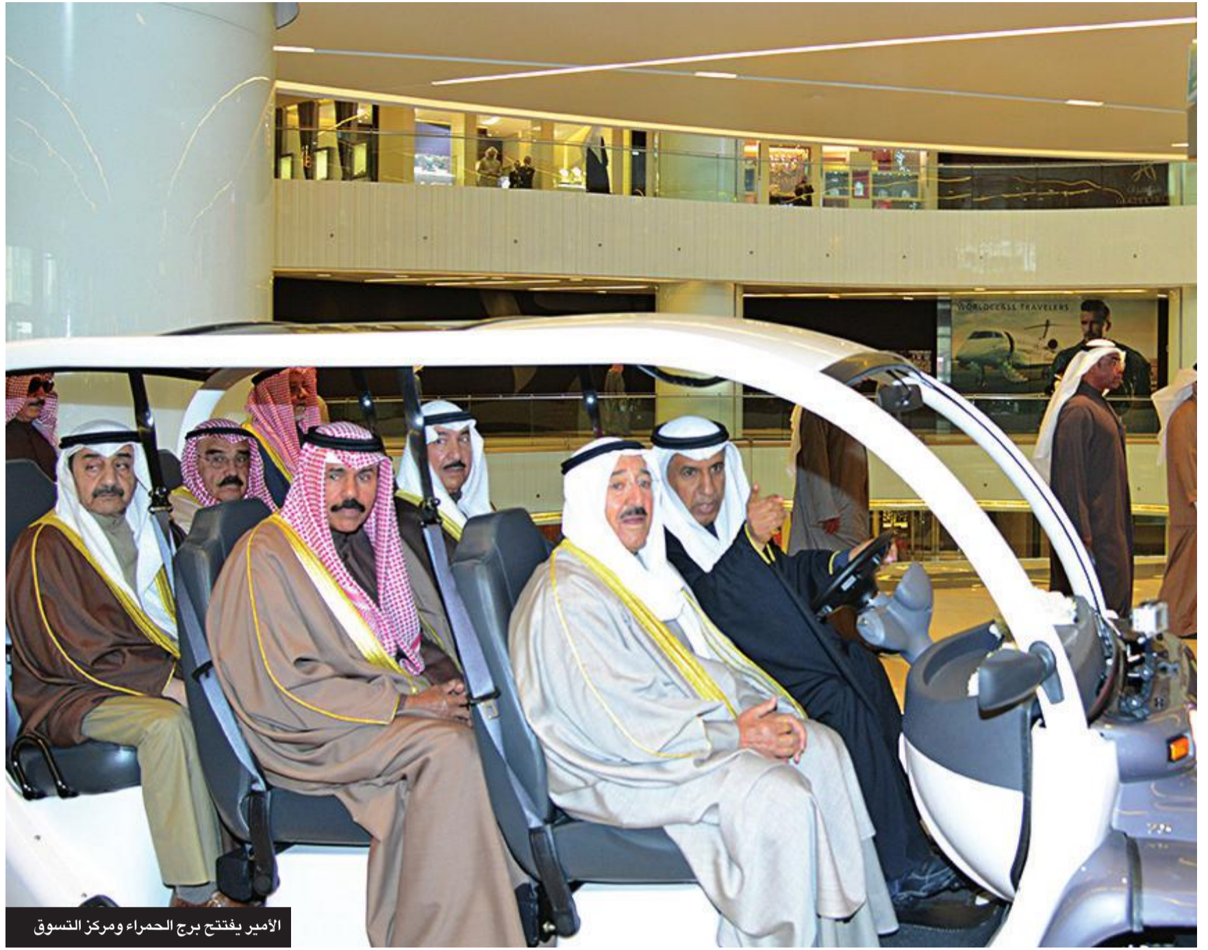
الأمير يفتتح برج الحمراء ومركز التسوق

المناسبة: افتتاح أعمال دور الانعقاد العادي الرابع للفصل التشريعي الخامس عشر 2019