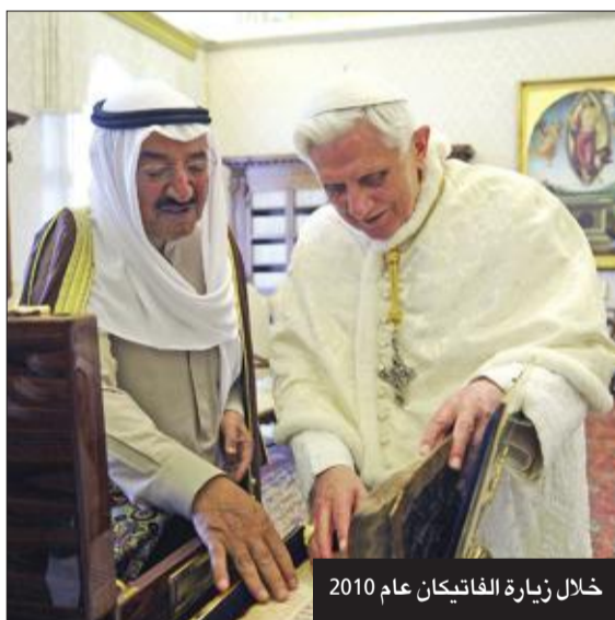
خلال زيارة الفاتيكان عام 2010

● أنشأ مركز الكويت للابتكار الوطني لدعم شباب الوطن ورعاية مواهبهم وإبداعاتهم ● رؤيته كانت تحويل البلاد مركزاً مالياً وتجارياً عالمياً يحاكي الدول المتقدمة