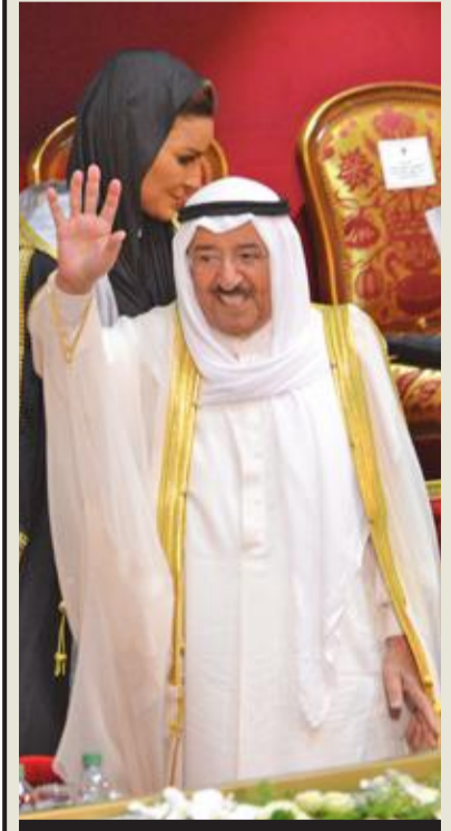
ملوفاً للحضور بمركز جابر