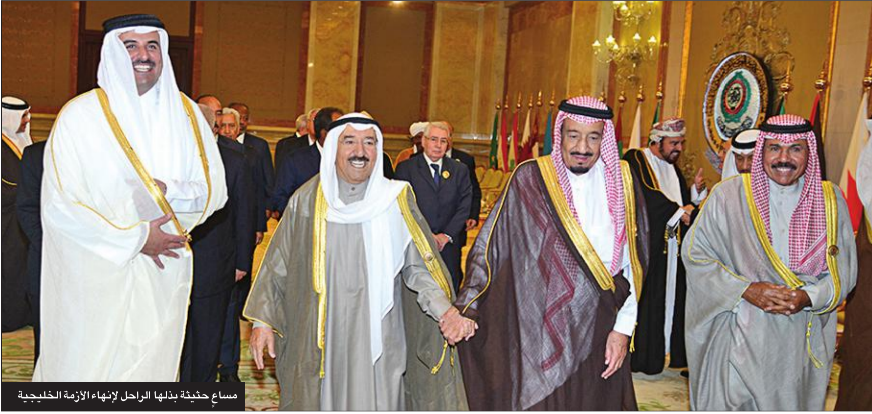
مساع حثيثة بذلها الراحل لإنهاء الأزمة الخليجية

صاحب السمو الشيخ صباح الأحمد على قرية في إندونيسيا في عام 2011، لتكون شاهداً على عطاء الكويت غير المحدود أميراً وشعباً، ومبادراتها في إغاثة المحتاجين بمختلف أنحاء العالم. وتعد قرية الشيخ صباح الأحمد الخيرية أحد الأوجه المشرقة للعمل الإنساني الكويتي، وهي تسهم في توطيد العلاقات مع إندونيسيا، وقد استقبل سموه، رحمه الله، في عام 2019 أئمة القرية، وأشد بالجهود الخيرية والإنسانية للقائمين عليها، مؤكداً أن أعمال الخير والإحسان، ركائز سامية جبل عليها أهل الكويت منذ القدم وتوارثتها الأجيال، مجسدين بذلك نموذجاً مشرفاً لأصالة معدنهم وشغفهم بالمسارعة لأعمال الخير ومشاريع العطاء في مختلف