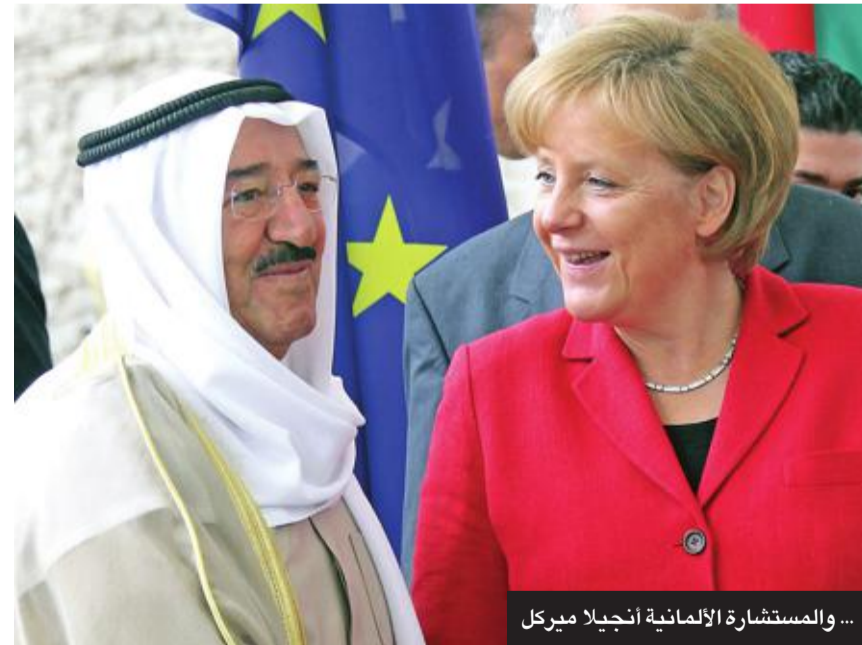
... والمستشارة الألمانية أنجيلا ميركل