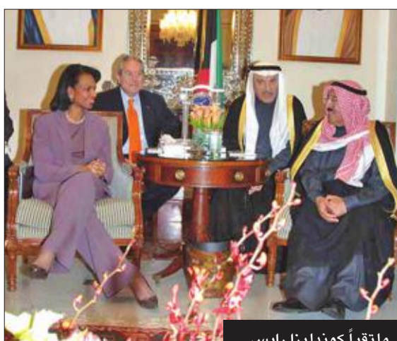
ملتقىاً كوندوليزا رايس