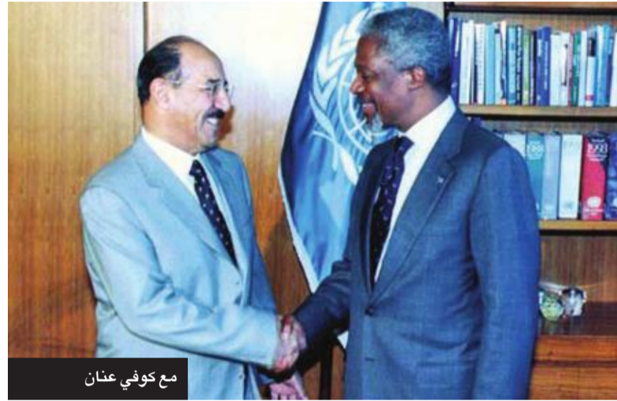
مع كوفي عنان

كان التفجير الإرهابي الذي تعرض له مسجد الإمام الصادق في 26 يونيو 2015 أكبر دليل على تلاحم القيادة والشعب، في مشهد مهيب وقف له العالم إكباراً وتقديراً؛ فبعد فترة قصيرة من