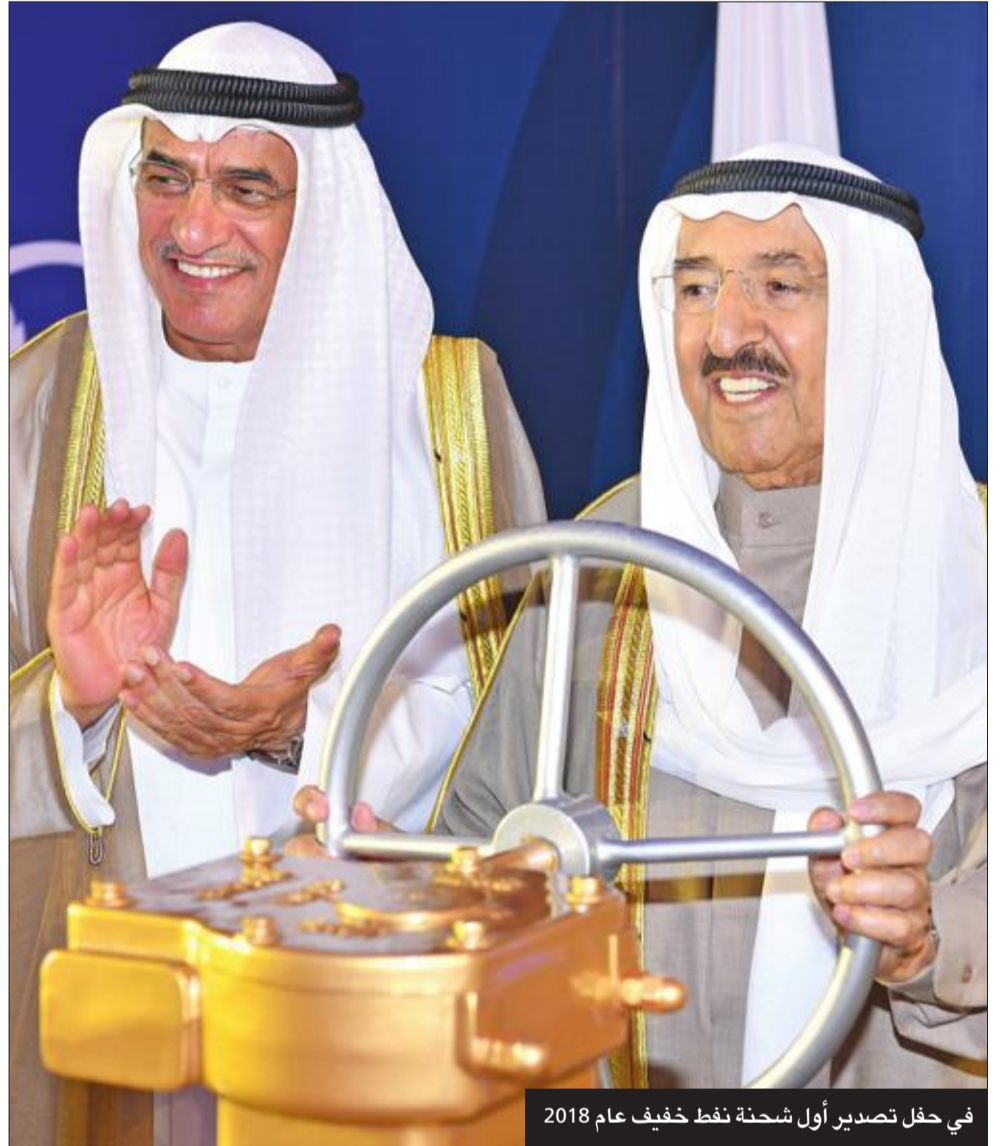
في حفل تصدير أول شحنة نפט خفيف عام 2018

لن تفي الكلمات حق سمو الشيخ صباح الأحمد، رحمه الله، وذكر مناقبه، ونظلم مقصرين في تسليط الضوء على مسيرته العطرة وإنجازاته الضخمة، ورسمه الخطوط العريضة لمستقبل الكويت ضمن رؤية جديدة وضع نصب عينيه مستقبلاً واعداً لأبنائها ومكانة متميزة بين دول العالم.