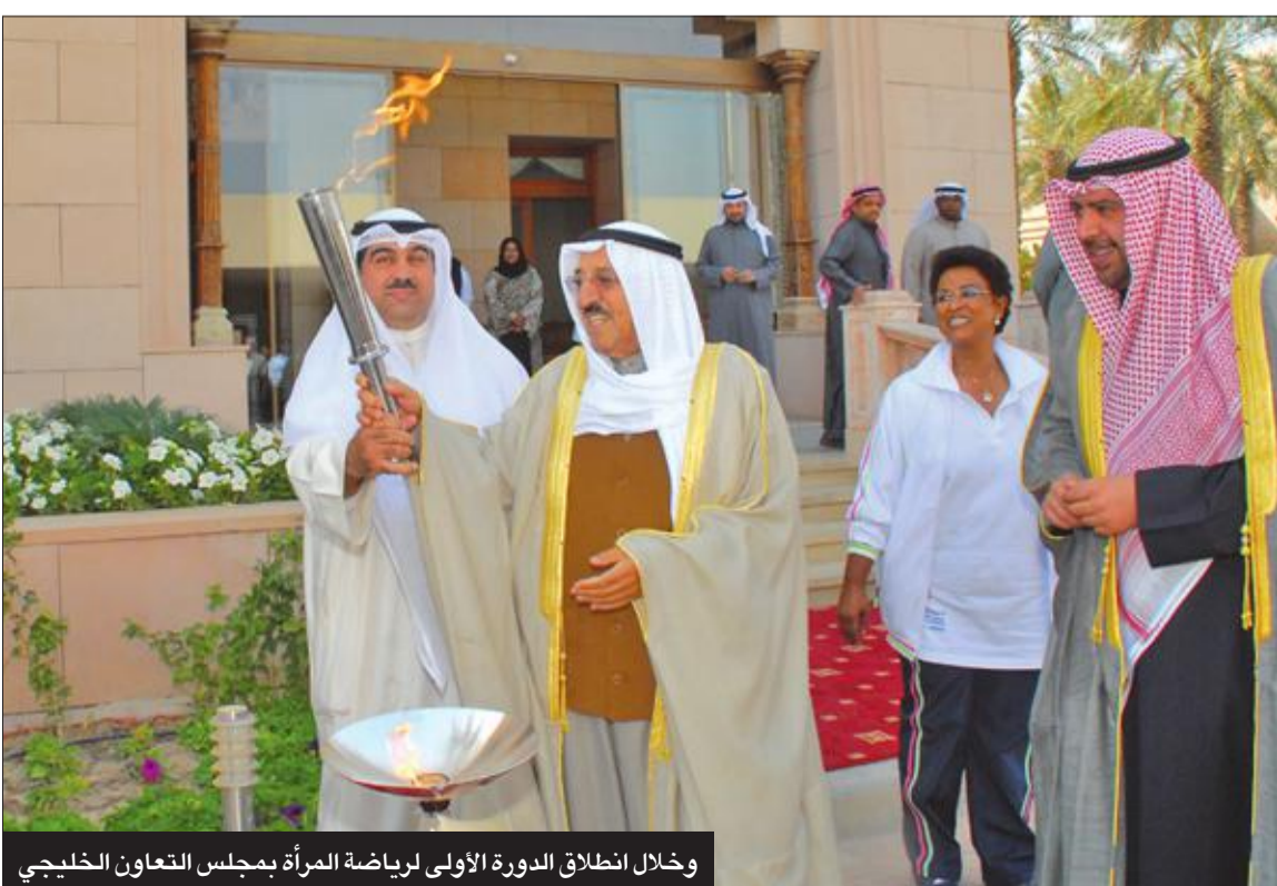
وخلال انطلاق الدورة الأولى لرياضة المرأة بمجلس التعاون الخليجي