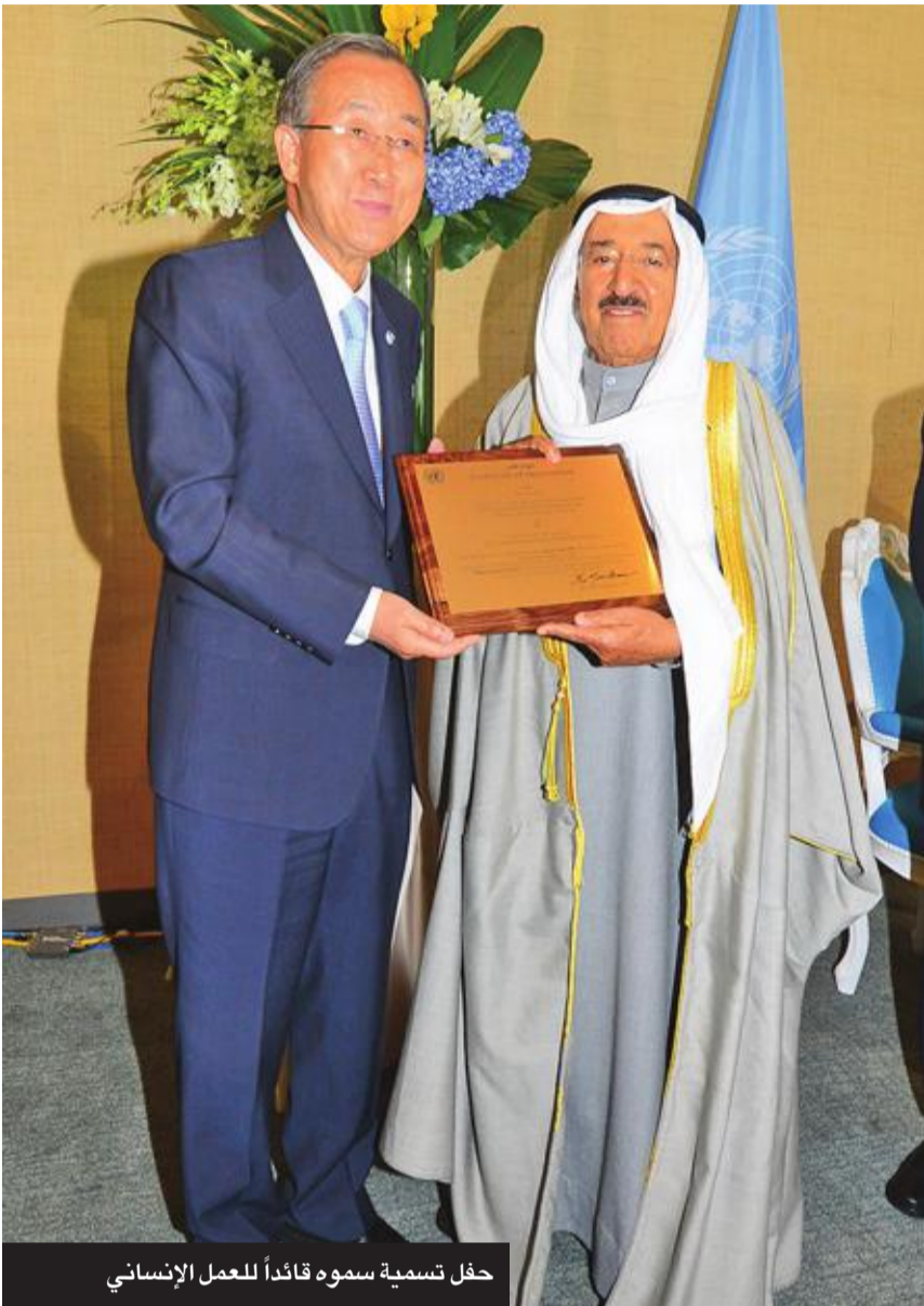
حفلة تسمية سموه قائداً للعمل الإنساني