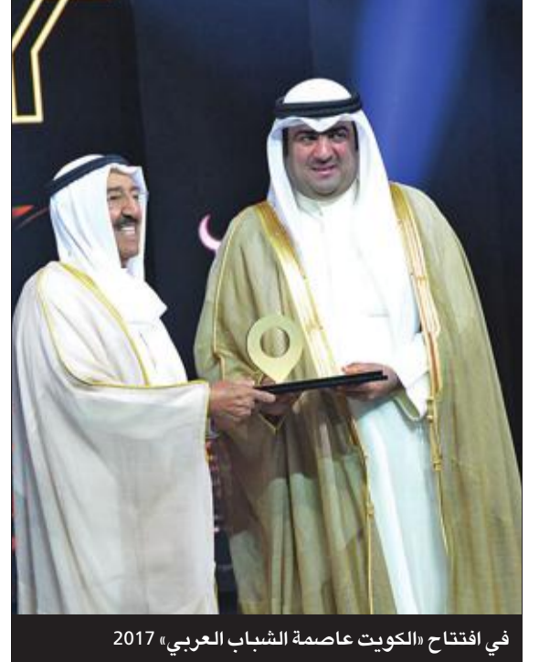
في افتتاح «الكويت عاصمة الشباب العربي» 2017