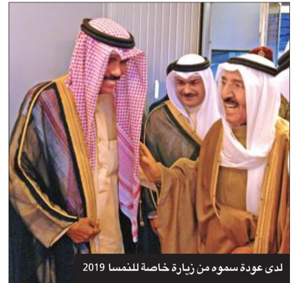
لدى عودة سموه من زيارة خاصة للنمسا 2019