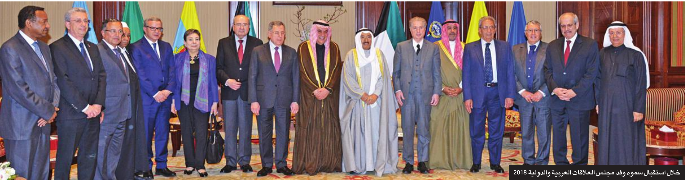
خلال استقبال سموه وفد مجلس العلاقات العربية والدولية 2018