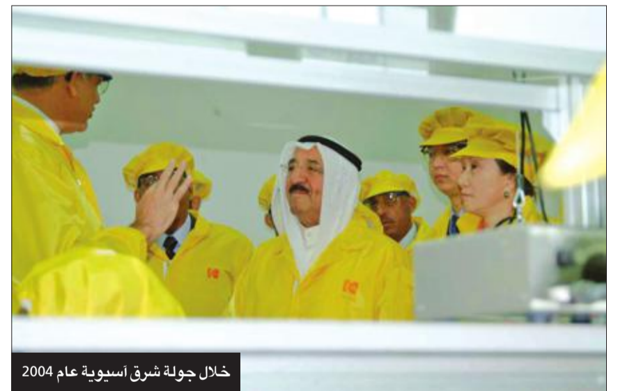
خلال جولة شرق أسبوية عام 2004