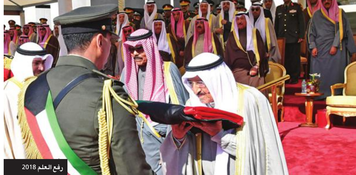
رفع العلم 2018