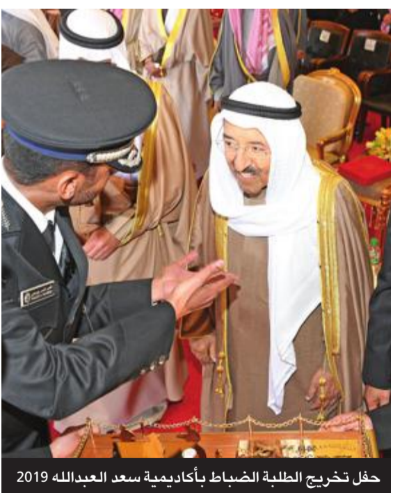
حفل تخريج الطلبة الضباط بأكاديمية سعد العبدالله 2019