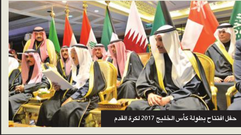
حفل افتتاح بطولة كأس الخليج 2017 لكرة القدم