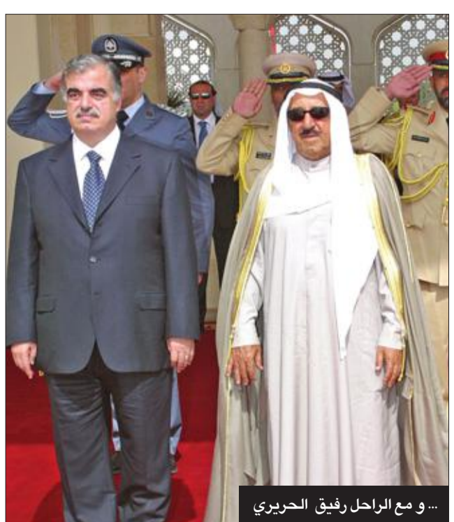
... ومع الراحل رفيق الحريري