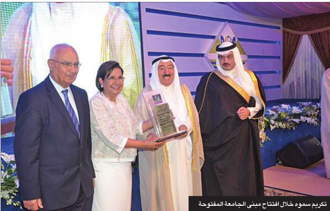
تكريم سموه خلال افتتاح مبنى الجامعة المفتوحة