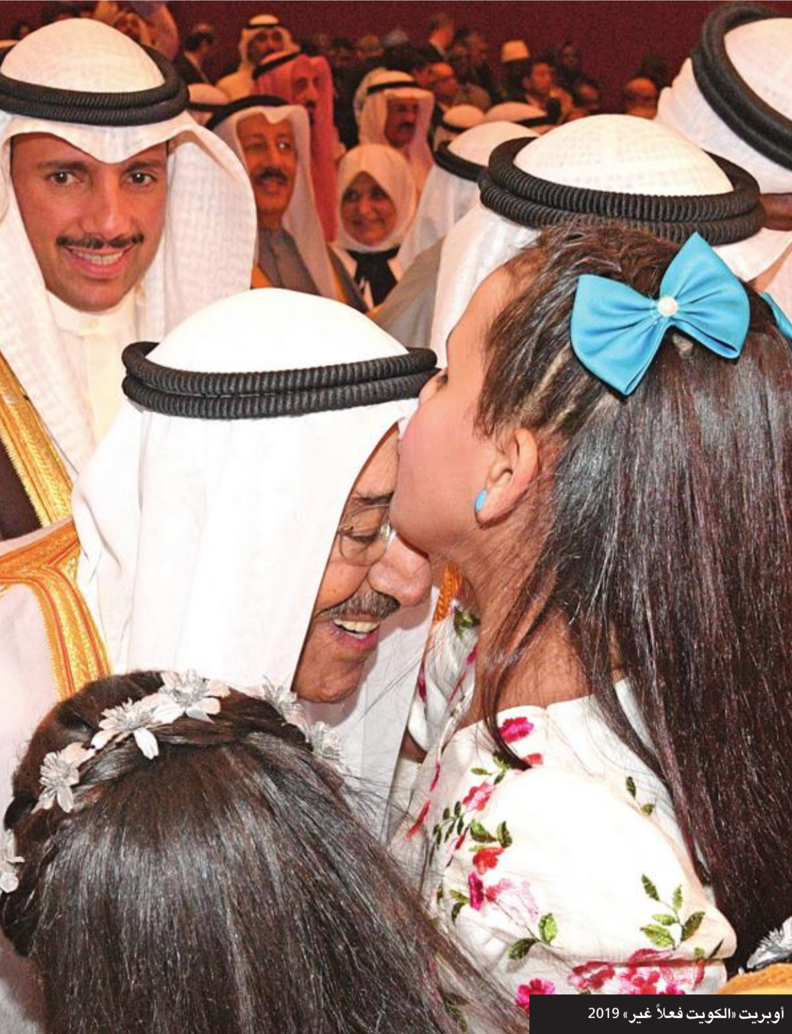
أوبريت «الكويت فعلاً غير» 2019

المناسبة: وضع حجر الأساس لاستاد جابر الأحمد الأولمبي ألقاها نيابة عنه الشيخ ناصر الصباح 2005