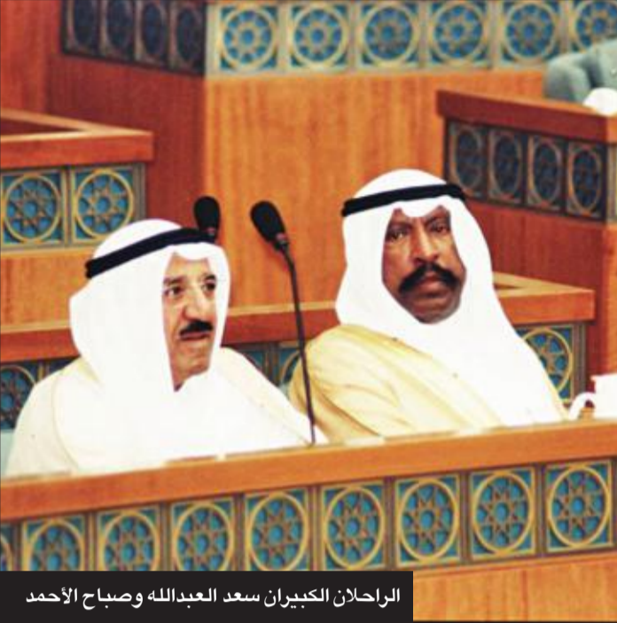
الراحلان الكبيران سعد العبدالله وصباح الأحمد