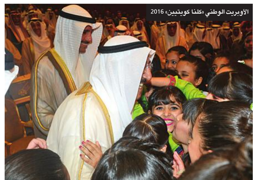
الأوبريت الوطني «كلنا كويتيين» 2016