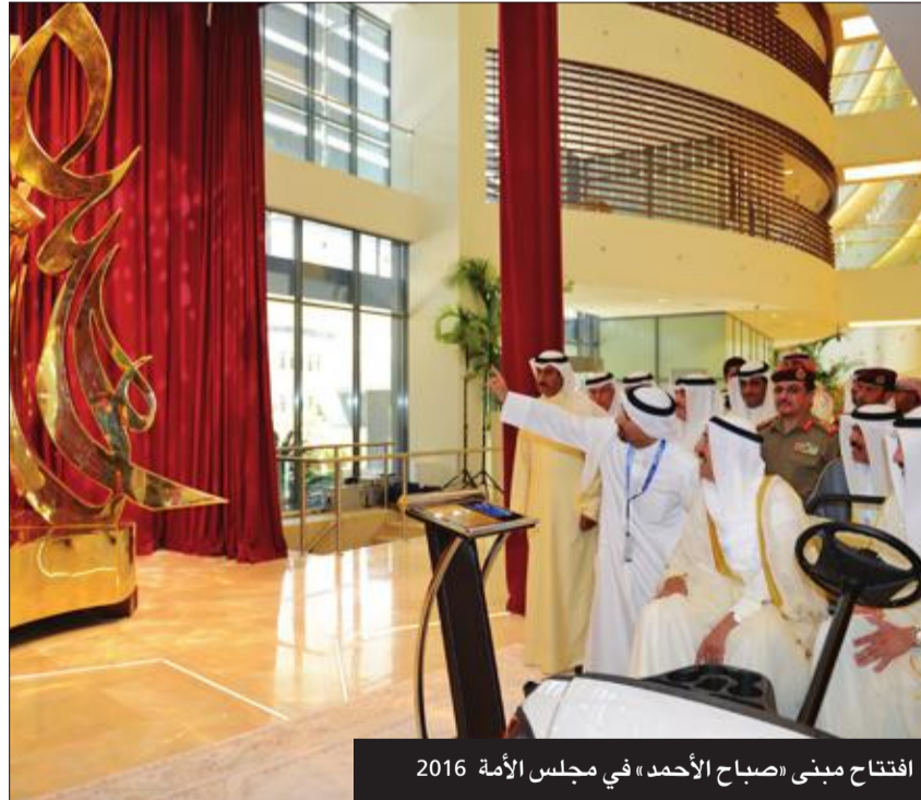
افتتاح مبنى «صباح الأحمد» في مجلس الأمة 2016