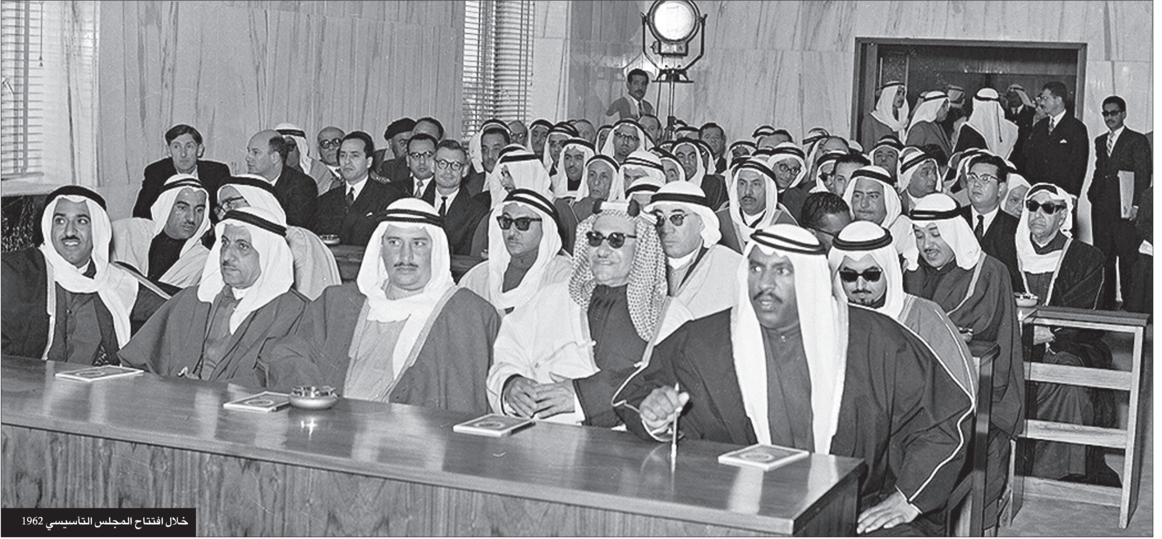
خلال افتتاح المجلس التأسيسي 1962