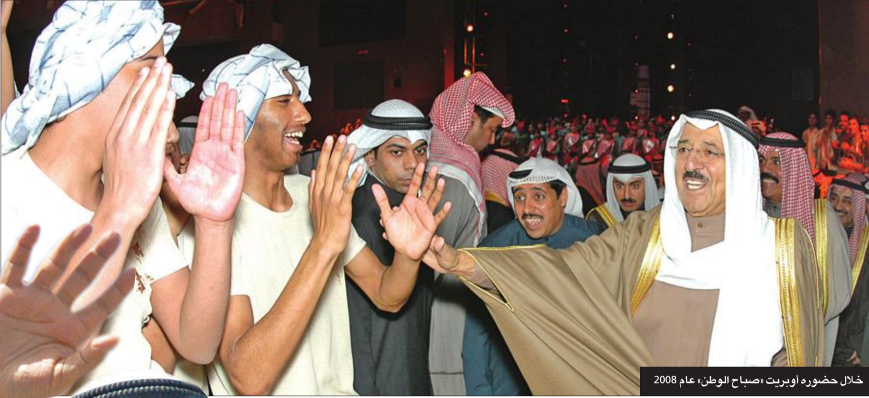
خلال حضوره أوبريت «صباح الوطن» عام 2008