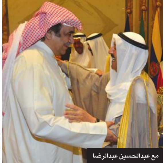
مع عبدالحسين عبدالرضا