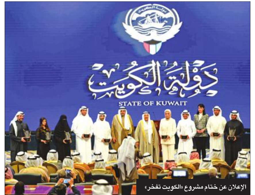
الإعلان عن ختام مشروع «الكويت تفخر»