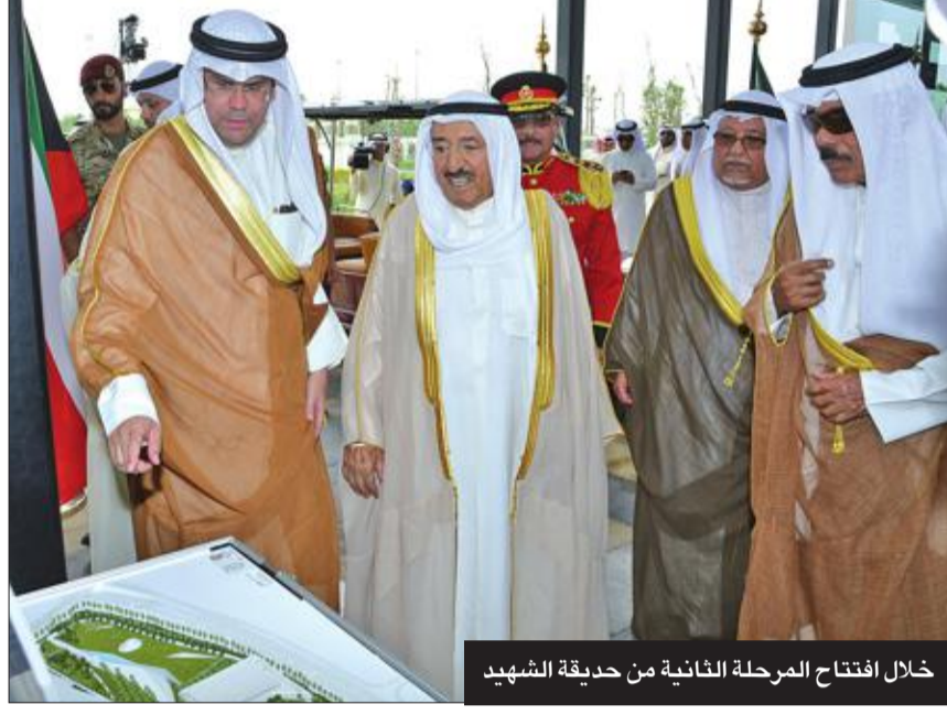
خلال افتتاح المرحلة الثانية من حديقة الشهيد