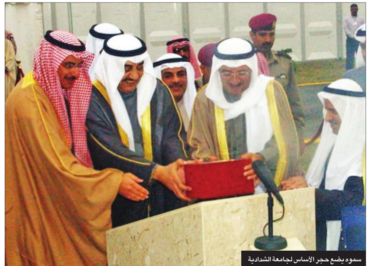
سموه يضع حجر الأساس لجامعة الشدادية