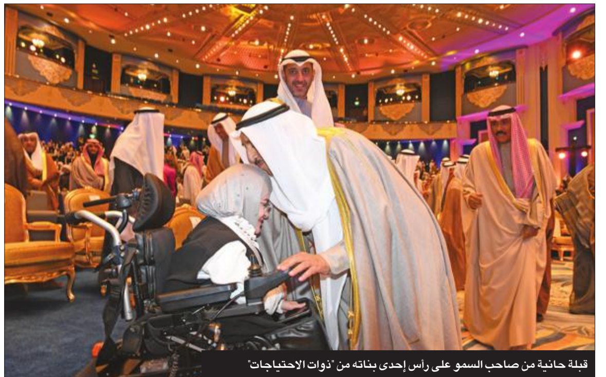
قبلة حانية من صاحب السمو على رأس إحدى بناته من 'ذوات الاحتياجات'