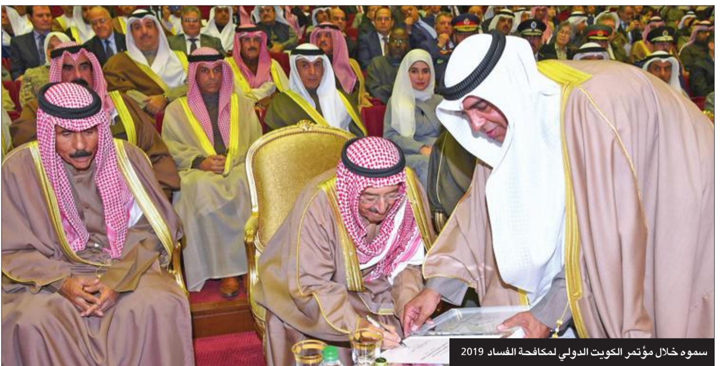
سموه خلال مؤتمر الكويت الدولي لمكافحة الفساد 2019

عهد الشيخ صباح الأحمد، رحمه الله، هو عهد الإنجازات، التي شملت كل القطاعات، بما في ذلك الحركة الثقافية والفنية بالكويت، وقد أعاد سموه إلى الكويت عصر الثقافة والفن، الذي لطالما تميزت به، من خلال افتتاح العديد من المراكز الثقافية والمتاحف والمسارح، وأولى سموه اهتماماً بالفنون، وعلى رأسها المسرح، فقد أنشأ أول مركز لرعاية الفنون الشعبية في الكويت عام 1956، وعقب توليه