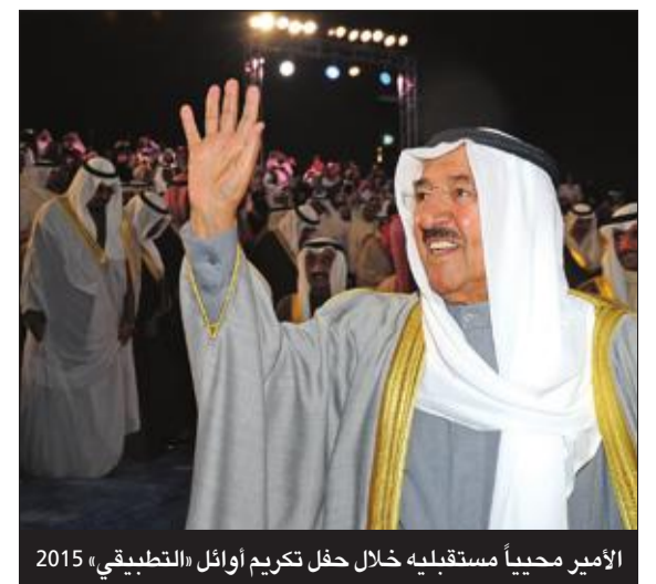
الأمير محيياً مستقبله خلال حفل تكريم أوائل «التطبيقي» 2015