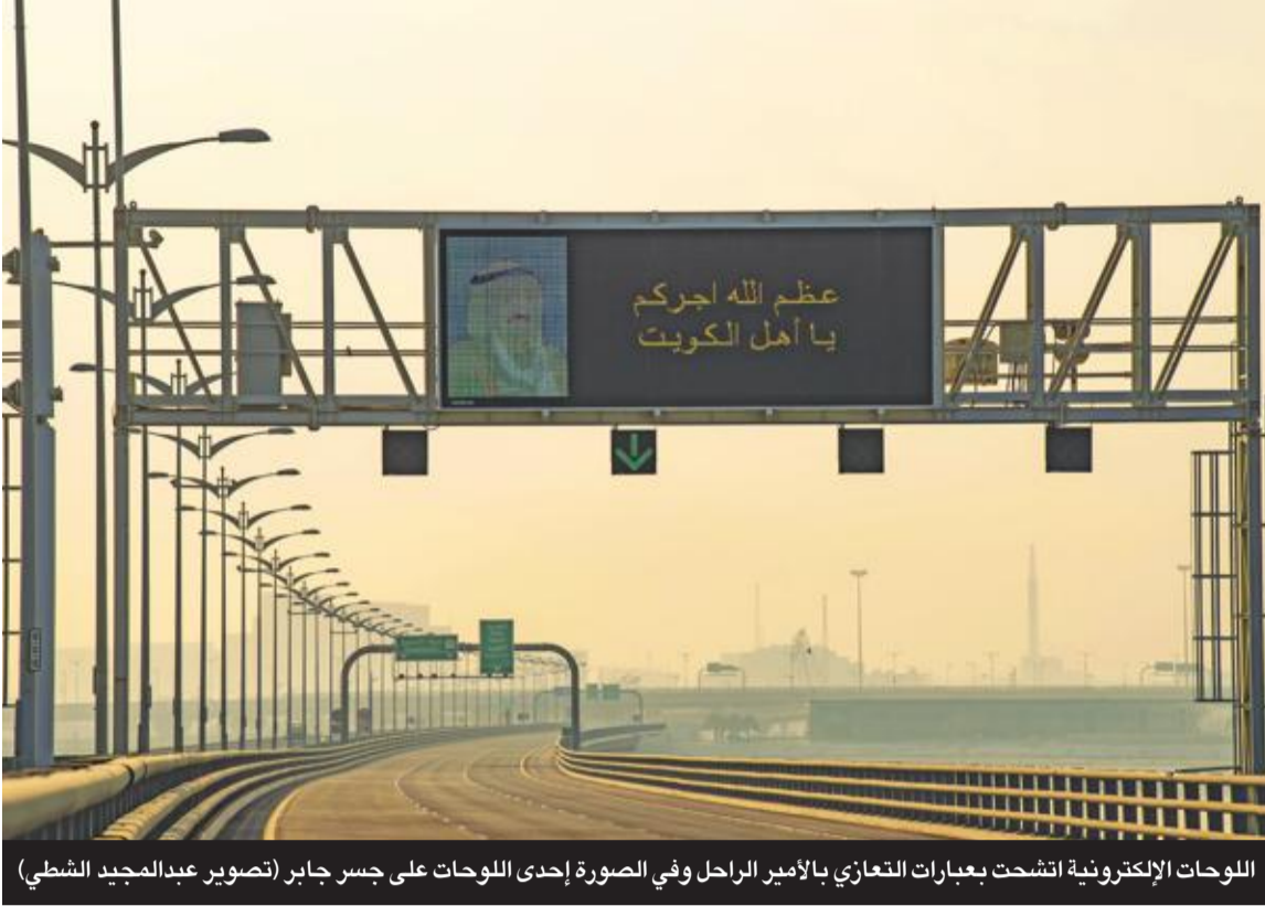
اللوحات الإلكترونية انتشرت بعبارات التعازي بالأمير الراحل وفي الصورة إحدى اللوحات على جسر جابر