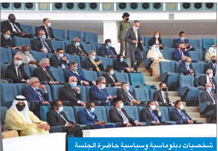
شخصيات دبلوماسية وسياسية حاضرة الجلسة

تعرضت الكويت خلال تاريخها لتحديات ومحن نجحنا بتجاوزها متكاتفين