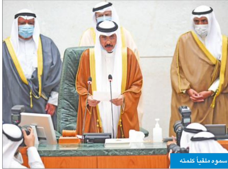
سموه ملقياً كلمته