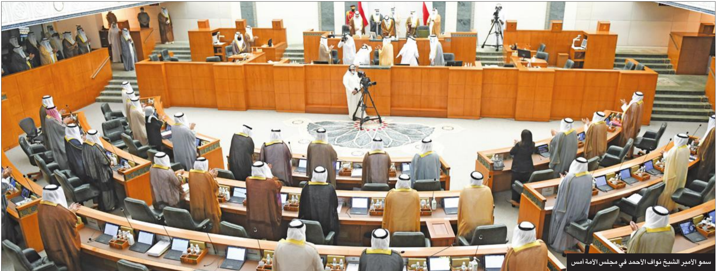
سمو الأمير الشيخ نواف الأحمد في مجلس الأمة أمس

كرمنا لتقديرنا الكبير". وأشار بومبيو إلى أننا نحترم إرثه ونبقى ملتزمين بشراكتنا القوية وصادقنا مع الكويت. وقال كبير الدبلوماسيين الأميركيين: "نقدم لاربعين عاماً".