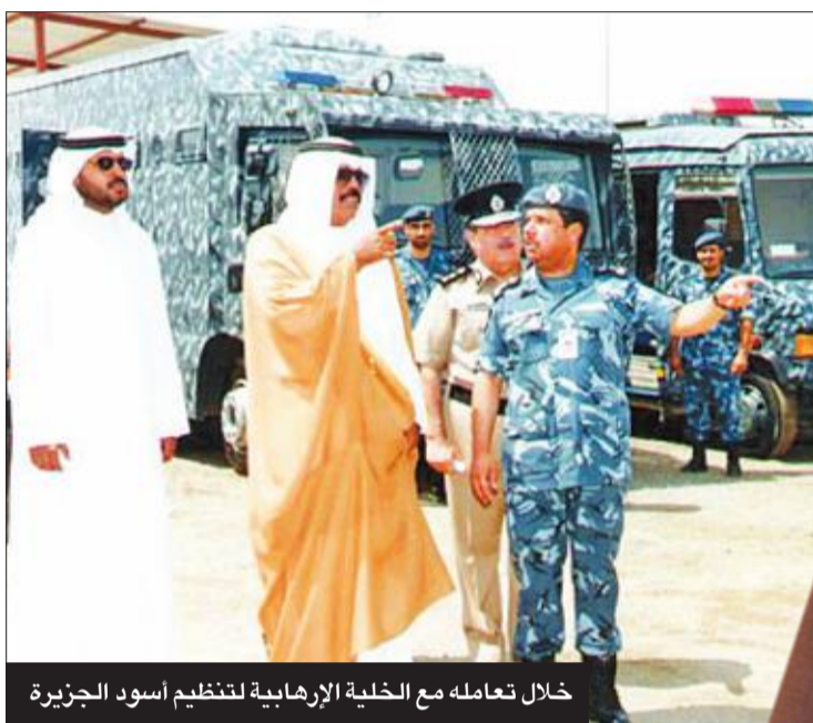
خلال تعامله مع الخلية الإرهابية لتنظيم أسود الجزيرة