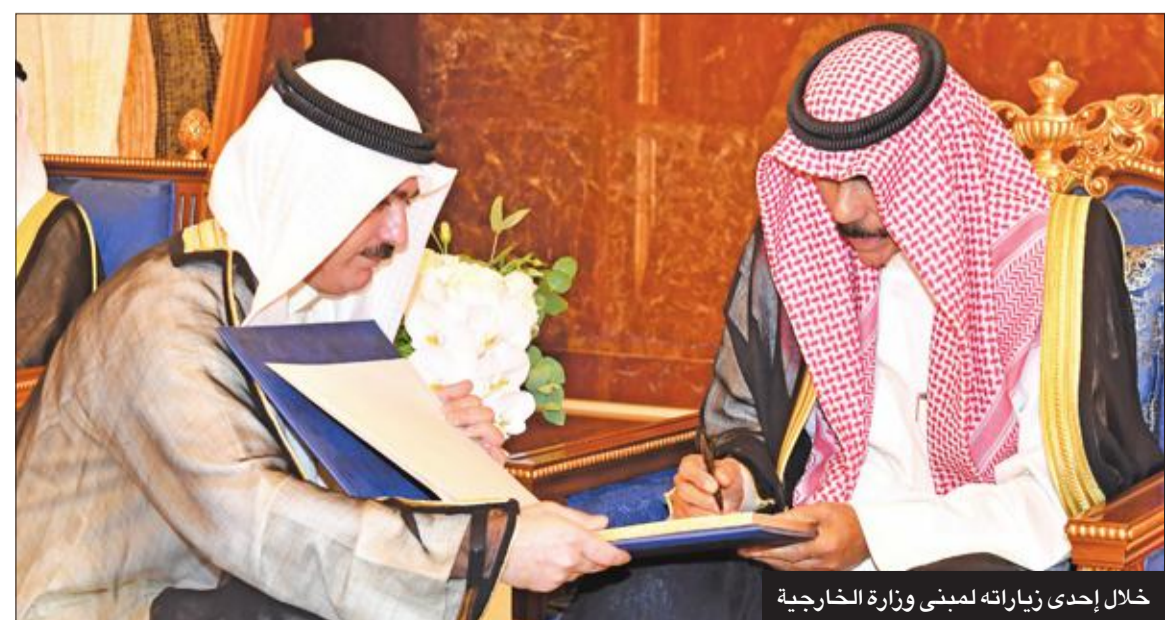
خلال إحدى زيارته لمبنى وزارة الخارجية