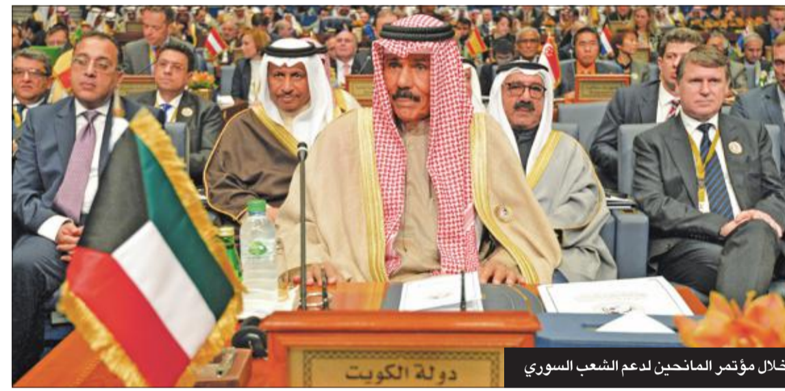
خلال مؤتمر المانحين لدعم الشعب السوري

واجه سمو الشيخ نواف الأحمد الكثير من المحطات الصعبة في مسيرته، لعل أصعبها محنة الغزو العراقي عام 1990، وكان سموه صلباً قوياً قادراً على أن يعين إخواته الأمير الراحل الشيخ جابر الأحمد، والأمير الوالد الراحل الشيخ سعد العبدالله، ورفيق دربه سمو الأمير الشيخ صباح الأحمد رحمه الله.