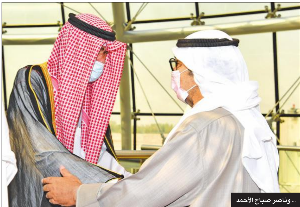
...وناصر صباح الأحمد

ودعت الكويت، أمس، أمير الإنسانية الراحل الشيخ صباح الأحمد إلى مثواه الأخير، حيث ووري الجثمان الطاهر لفقيد الوطن صاحب السمو أمير البلاد الشيخ