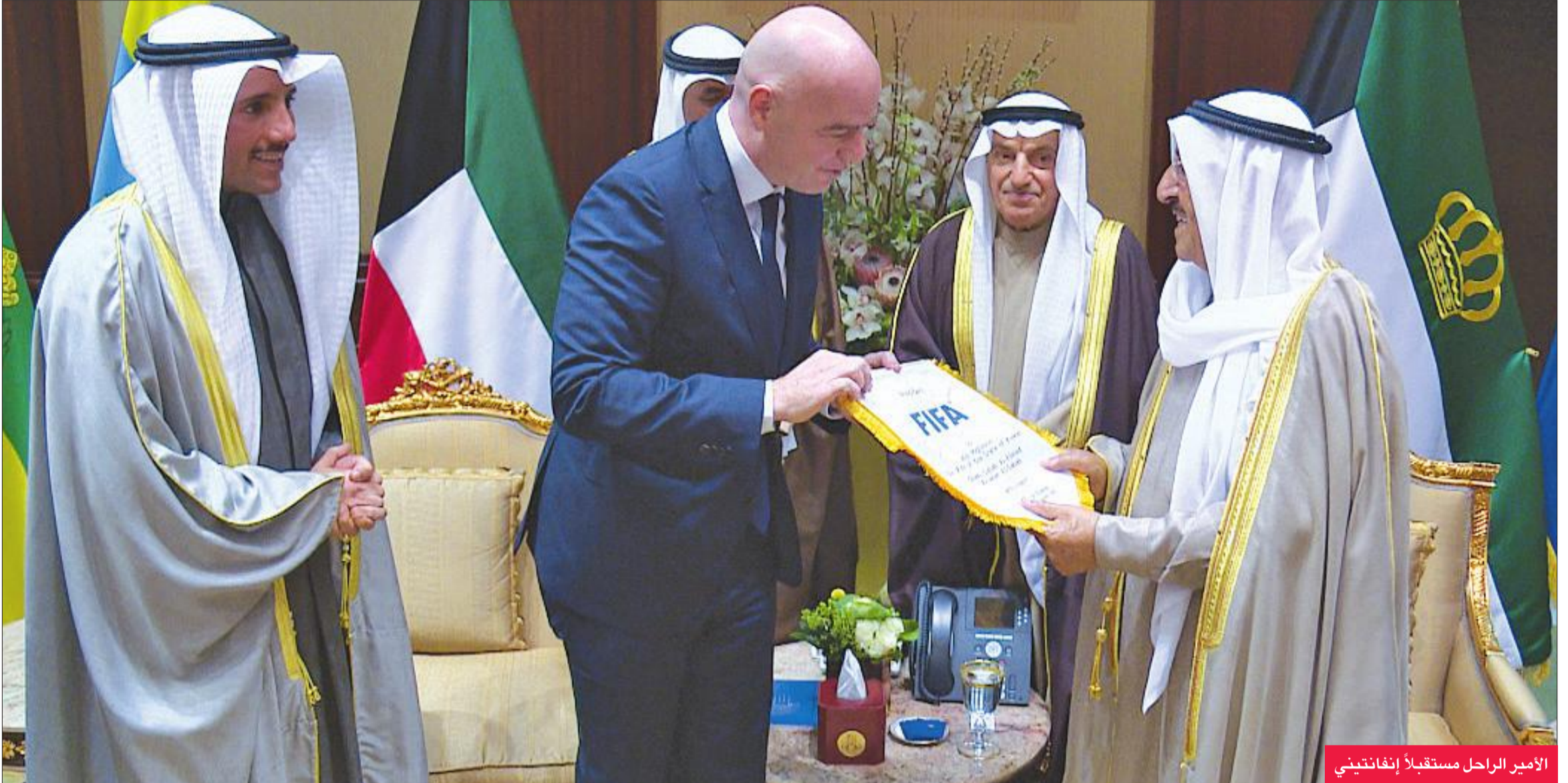
الأمير الراحل مستقبلاً إنفاثيني

نعت الاتحادات الكويتية سمو أمير البلاد الراحل الشيخ صباح الأحمد، مؤكدة أنه طوال مسيرته الحافلة كان الداعم الأول لها، وصاحب الأيدي البيضاء في كل المجالات.