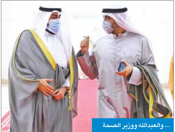
... والعبد لله ووزير الصحة

هنا نواب مجلس الأمة سمو أمير البلاد الشيخ نواف الأحمد الجابر الصباح بتواجيله مسند الإمارة وأدائه اليمين الدستورية أمام مجلس الأمة أمس، أميراً للكويت، داعين الله تعالى أن يعين سموه على حمل الأمانة والحفاظ على المكتسبات الدستورية وتحمل المسؤولية وسط الظروف التي تمر بها الكويت والمنطقة، والعبور بالبلاد إلى أعلى المراتب، فهو خير خلف لخير سلف، وبايعوا سموه على السمع والطاعة. وهنا نائب رئيس مجلس الأمة عيسى الكندري سمو الأمير بادائه اليمين الدستورية أمام المجلس، أمس، أميراً للبلاد حيث القى كلمته السامية المعبرة، قائلاً إن الكويت تدشن عهداً جديداً بإمارة جديدة يقودها أمير عرّف بصلاحه ومخافة ربه وحبه لشعبه ومماثلة خلقه وتواضعه الجرم مع الآخرين، صغيراً كان أم كبيراً غنياً أم فقيراً". وأضاف الكندري: "هنئاً لنا جميعاً بسمو الشيخ نواف الأحمد أميراً للكويت وقائداً لمسيرتها، ويشاء القدر أن تتزامن إمارته في