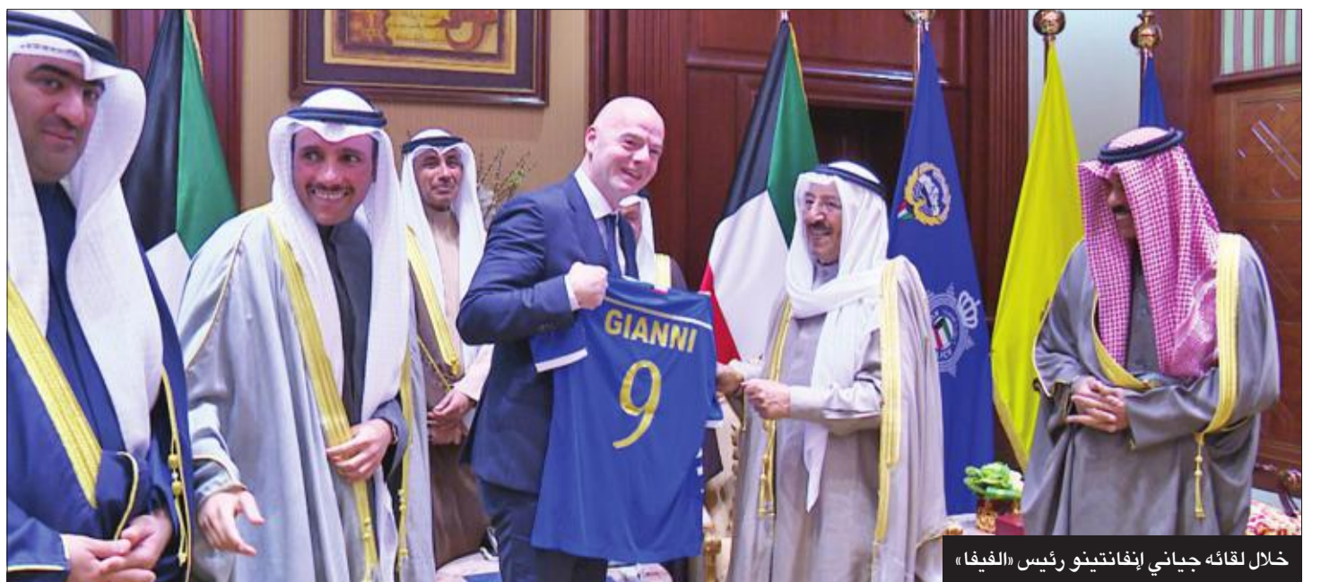
خلال لقائه جيانني إنفانتينو رئيس «الفيفا»