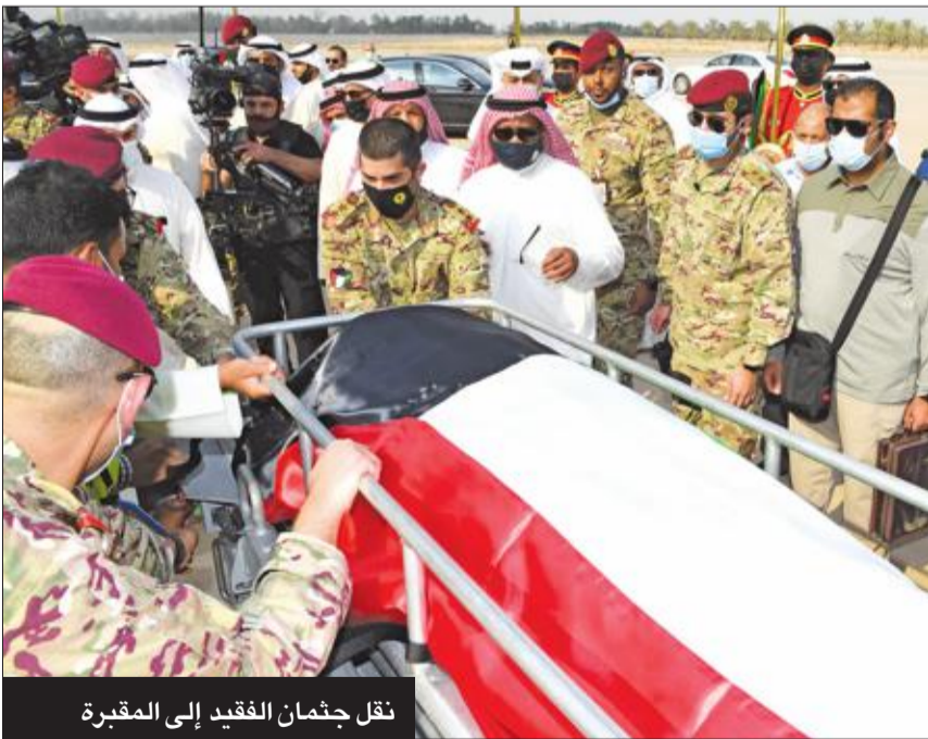
نقل جثمان الفقيد إلى المقبرة

فور وصول الطائرة الأميرية الحاملة لجثمان سمو الأمير الراحل الشيخ صباح الأحمد، رحمه الله، إلى أجواء الكويت، رافقتها 4 طائرات حربية من سلاح الجو الكويتي، حتى وصولها إلى مطار الكويت الدولي.