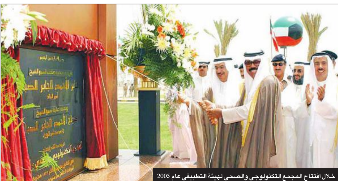
خلال افتتاح المجمع التكنولوجي والصحي لهيئة التطبيق عام 2005