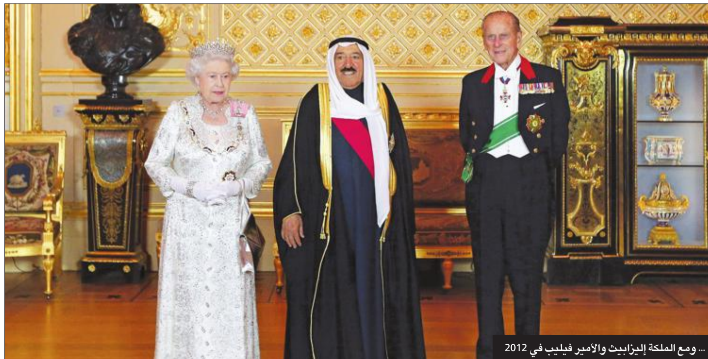
... ومع الملكة إليزابيث والأمير فيليب في 2012

وقال السفير الغنيم لـ«كونا» إن هذا التكريم يأتي نظراً إلى دور الأمير الراحل على الصعيد مختلف قضايا حقوق الإنسان بشموليتها وعالميتها مشيراً إلى أن عدداً من المنظمات الدولية الأخرى العاملة في جنيف تعزّمت هي الأخرى تنظيم مثل تلك المبادرات حزناً وتكريماً واعتزازاً بما قام به المغفور له على الصعيد العالمي. كما نظمت الجمعيات والمنظمات الإنسانية السورية أمس، وقفة تضامنية مع الشعب الكويتي حداداً على وفاة الأمير الراحل طيب الله ثراه. وقال مدير مكتب جمعية عطاء التركية في شانلي أورفا أسامة الشيدون في اتصال هاتفي مع «كونا»، إن الأمير الراحل ساهم بشكل كبير في التخفيف عن الام