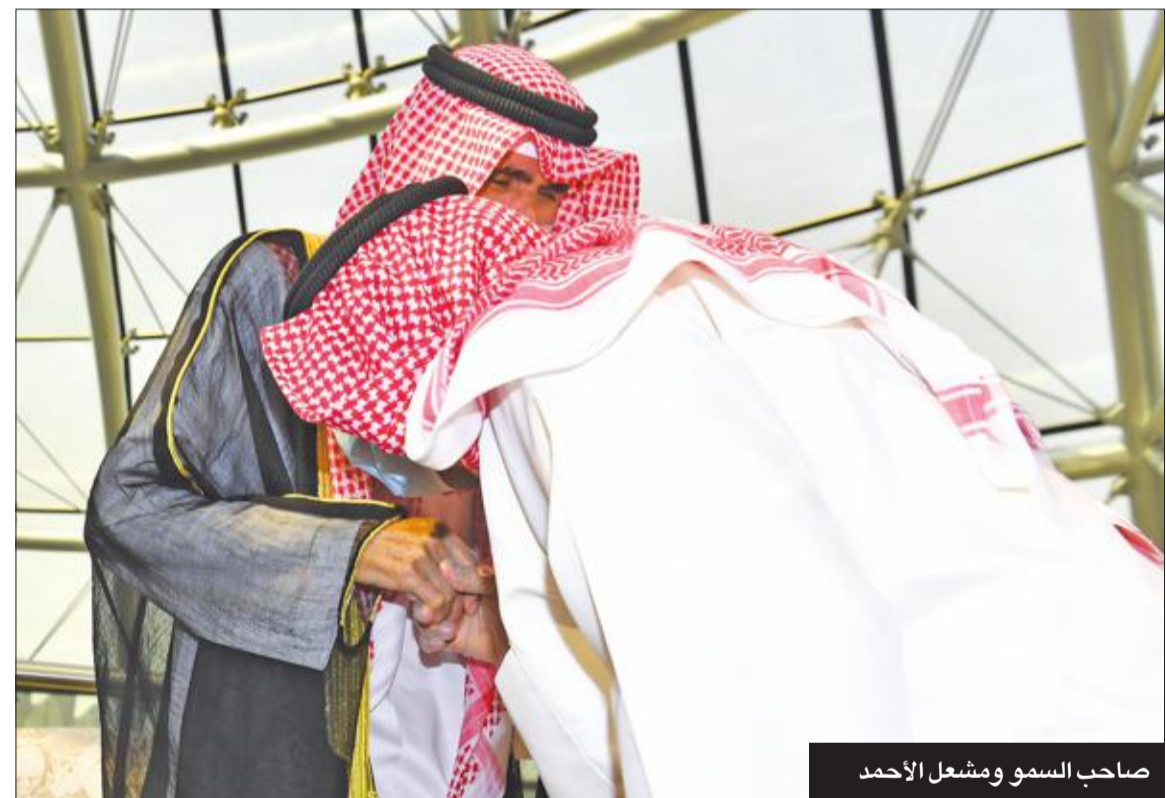
صاحب السمو ومشعل الأحمد