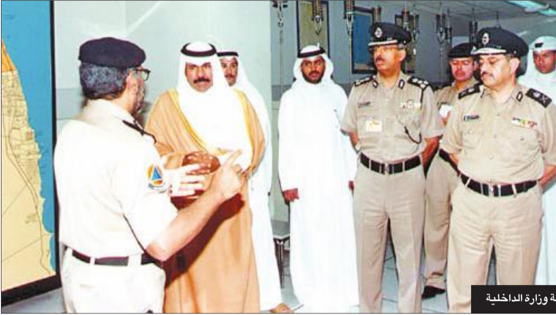
خلال تولي سموه حقيبة وزارة الداخلية

في 7 فبراير 2006 صدر أمر أميري بتزكية سمو الشيخ نواف ولياً للعهد عضداً وسنداً لأخيه الأمير الراحل في استكمال مسيرة البناء والنهضة