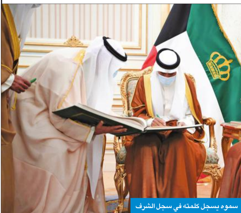
سموه يسجل كلمته في سجل الشرف

تفضل صاحب السمو أمير البلاد الشيخ نواف الأحمد بتسجيل كلمته السامية على سجل الشرف في مجلس الأمة هذا نصها: بسم الله الرحمن الرحيم تتمتع دولة الكويت بفضل الله تعالى وتوفيقه بنظام ديمقراطي راسخ تجلّى بالثوابت والأسس الدستورية التي تضمن سلامة وانتظام انتقال مسند الإمارة والصلاحيات الدستورية والمتعلقة به دونما أي فراغ دستوري وبما يضمن الاستقرار وديمومة مسيرة الخير في الوطن الغالي، مستذكّرين بكل الإجلال متأثر الأمير الراحل صاحب السمو الشيخ صباح الأحمد الجابر الصباح طيب الله ثراه الإنسانية والخبرة ونهجه النير الذي ارتقى بمكانة الوطن بين الأمم.