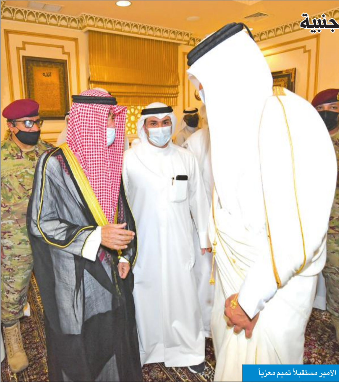
الأمير مستقبلاً تميم معزياً