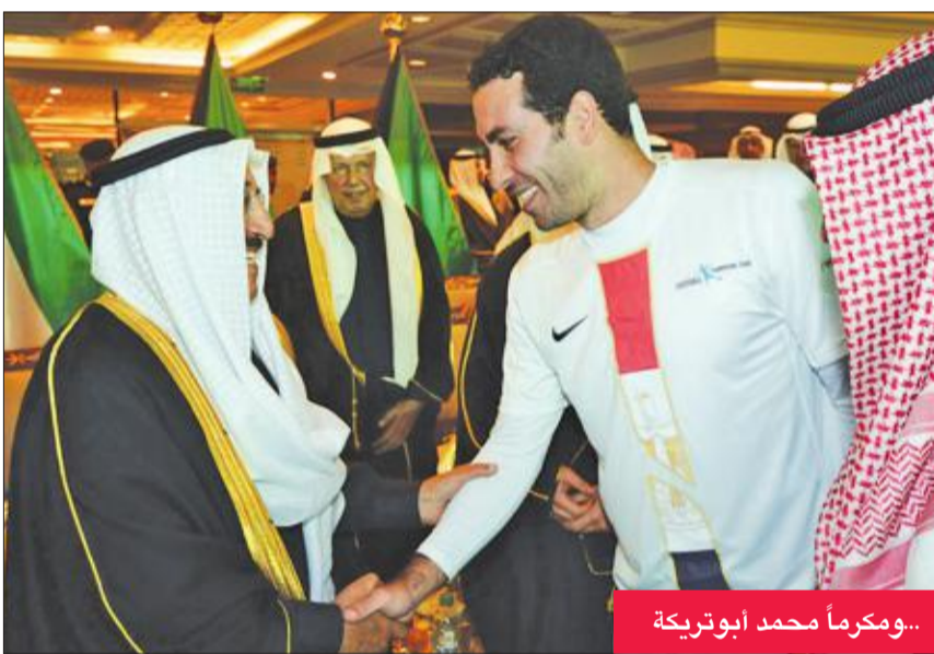
...ومكرماً محمد أبو تريكة

وتوجه بأحر التعازي لسمو أمير البلاد الشيخ نواف الأحمد وإلى أسرة الصباح وجميع الشعب الكويتي. من جانبه، توجه نائب رئيس الاتحاد خليل إبراهيم بالتحازي إلى القيادة السياسية والشعب الكويتي كافة لوفاة المغفور له سمو الشيخ صباح الأحمد، مشيراً إلى أن الفقيد يعد خسارة كبيرة للكويت حيث كانت لسموه مناقب كثيرة لا تعد ولا تحصى لا سيما في دعم الرياضة والرياضيين.