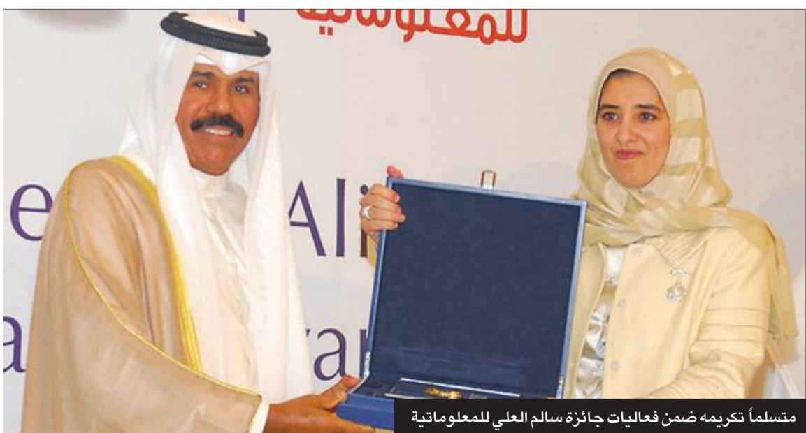
متسلماً تكريمه ضمن فعاليات جائزة سالم العلي للمعلوماتية