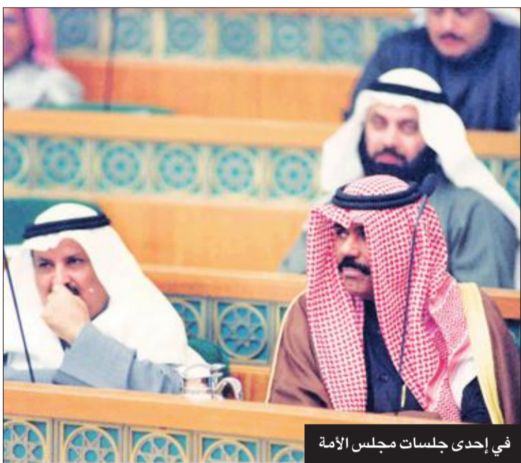
في إحدى جلسات مجلس الأمة

وأثبت سمو الشيخ نواف الأحمد في كل موقع دخله وفي كل مهمة أسندت إليه كفاءته وحرصه على تطبيق القانون وتحقيق العدالة، وبث الثقة والطمأنينة في جميع النفوس، فحظي باحترام الجميع... وفيما يلي لمحات من سيرته ومحطات من رحلته في حب الكويت والعمل الجاد من أجلها.