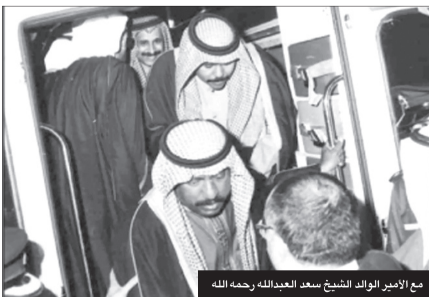
مع الأمير الوالد الشيخ سعد العبدالله رحمه الله