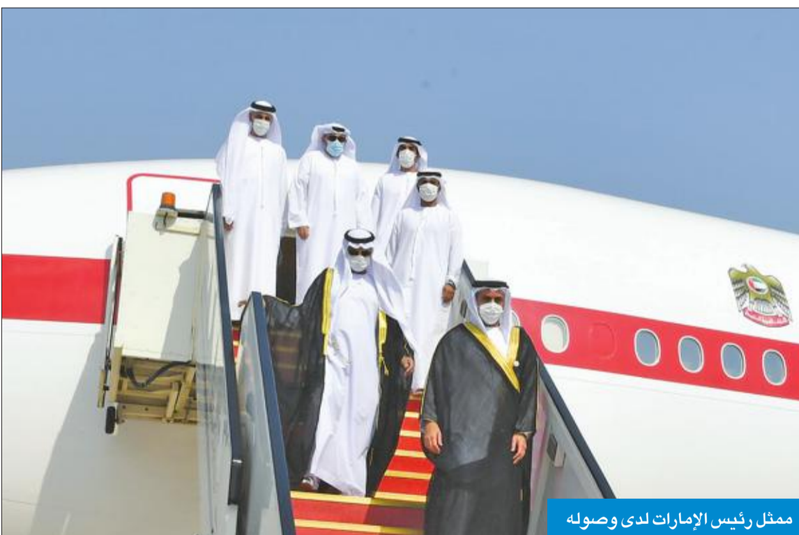
ممثل رئيس الإمارات لدى وصوله

إسهامات سموه سبطل التاريخ يذكرها بأحرف من نور ومواقفه الثابتة تجاه قضايا الامتين العربية والإسلامية السيسى