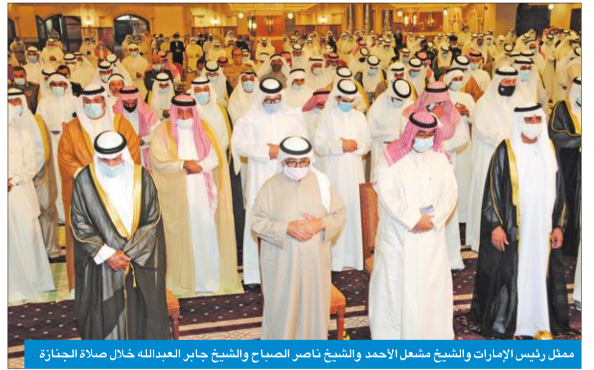
ممثل رئيس الإمارات والشيخ مشعل الأحمد والشيخ ناصر الصباح والشيخ جابر العبدالله خلال صلاة الجنازة