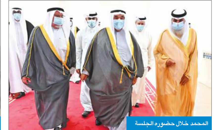
المحمد خلال حضوره الجلسة