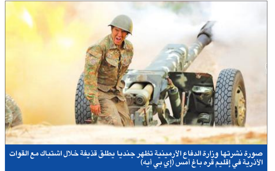
صورة نشرتها وزارة الدفاع الأرمنية تظهر جنديا يطلق قذيفة خلال اشتباك مع القوات الأذرية في إقليم قره باغ أمس