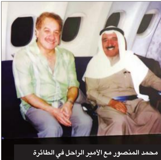
محمد المنصور مع الأمير الراحل في الطائرة

وأضاف الشطي: «كلنا أمل في صاحب السمو الشيخ نواف الأحمد في استكمال مسيرة العطاء والنهضة. وتحقيق قفزات جديدة للكويت في كل مناحي الحياة. فالكويت صغيرة بمساحتها كبيرة بعطائها».