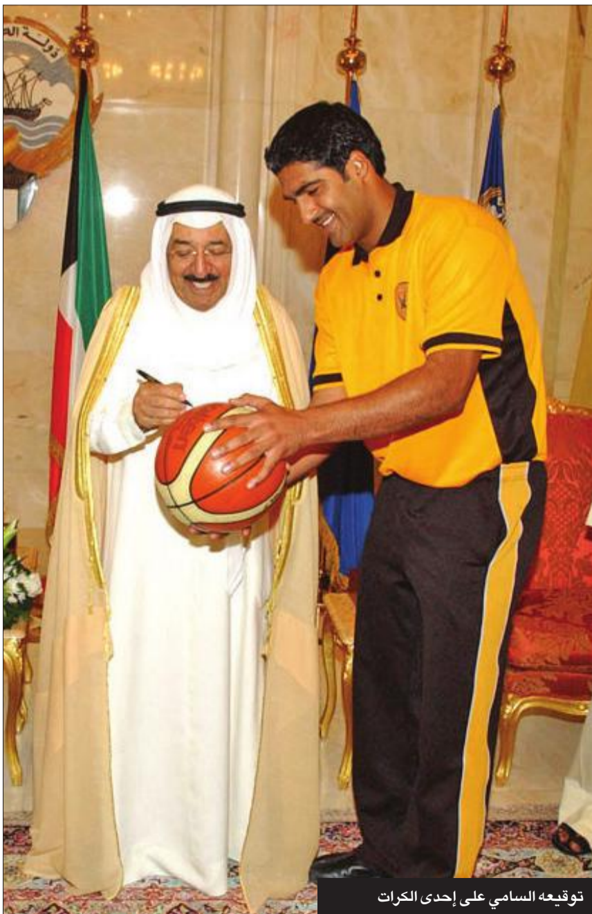
توقيع السامي على إحدى الكرات

ترجل فارس الكويت الأول سمو الشيخ صباح الأحمد، بعد أن أغدق على الرياضة بسخاء، ليضعها في مصاف الدول الكبرى المرشحة على الدوام لاستضافة أكبر البطولات، فكان عصره رحمه الله مليئا وذاخرا بوجود أبطال ونجوم العالم على أرض الكويت، وأشقاء الخليج، كما شكل سموه حائط صد أمام كل من حاول العبث بمصير الرياضيين، وتصدى بنفسه لكل من سعى لإدخال الكويت في أزمت رياضية. ونجح رحمة الله عليه في استقطاب