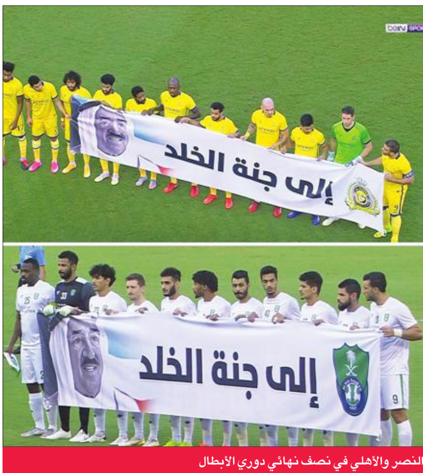
النصر والأهلي في نصف نهائي دوري الإبطال

من جهتها، قررت اللجنة الأولمبية القطرية إيقاف النشاط الرياضي للمنافسات المحلية مدة 3 أيام وذلك من الثلاثاء إلى الخميس، وذلك حداداً على وفاة صاحب السمو الشيخ صباح الأحمد. وأصدرت اللجنة تعميماً يتضمن إيقاف جميع الأنشطة الشبابية والرياضية في الأندية والاتحادات المختلفة، على أن يعود النشاط الرياضي اعتباراً من غد الجمعة. كما نشرت اللجنة الأولمبية الإماراتية عبر صفحتها على "فيسبوك": "خالص التعازي للشعب الكويتي الشقيق في وفاة أمير الكويت الراحل الشيخ صباح الأحمد. إننا لله وإنا إليه راجعون. ونقدم رئيس الاتحاد الآسيوي للملاكمة، أس العتيبي، وإدارة الاتحاد بخالص التعازي لأسرة الملاكمة الكويتية في وفاة أمير الكويت الراحل.