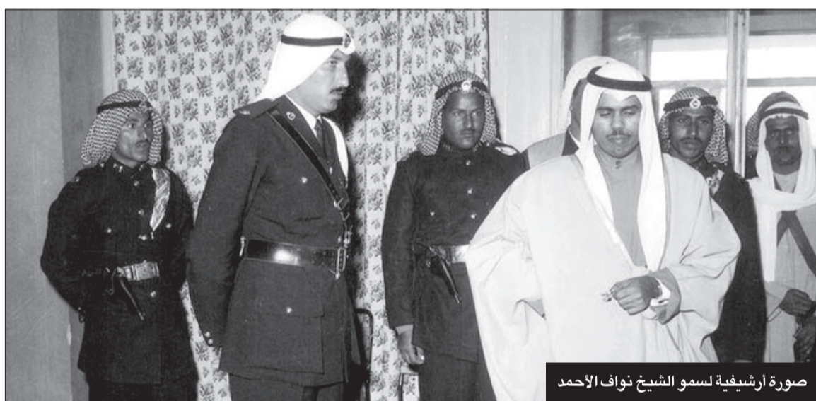
صورة أرشيفية لسمو الشيخ نواف الأحمد

وخلال توليه منصب نائب رئيس الحرس الوطني، ترك سموه بصمات واضحة لإعادة ترتيب وتنظيم الحرس الوطني، وتحقيق التوافق والتوازن بين الجندي والأسرى، وقد بذل سموه جهوداً مضنية على مدى تسع سنوات لتحقيق هدفه الأسمى، وهو الوصول إلى أرقى المستويات والمعدلات في المؤسسات الأمنية المماثلة في أكثر دول العالم تطوراً. عمل سموه على تطوير المنظومة العسكرية للحرس وجعله الذراع اليمنى للقوات المسلحة، كما أرسى خطط التطوير في الحرس، التي تعتمد على عدة محاور أولها التنمية البشرية التي تتحقق بدءاً من حسن اختيار الموارد البشرية، وثانيها التدريب الجاد المستمر والتحصيل العلمي سواء في المجال العسكري القتالي أو في النواحي التخصصية الفنية والإدارية، وثالثها الارتقاء بمستوى الفرد ورعايته صحياً ورفع روحه المعنوية. قام سموه بإرسال العديد من منتسبي الحرس الوطني للخارج في بعثات ودورات عسكرية متطورة، كما عمل