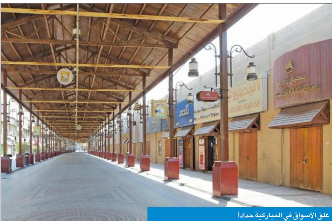
غلق الأسواق في المباركية حدادا