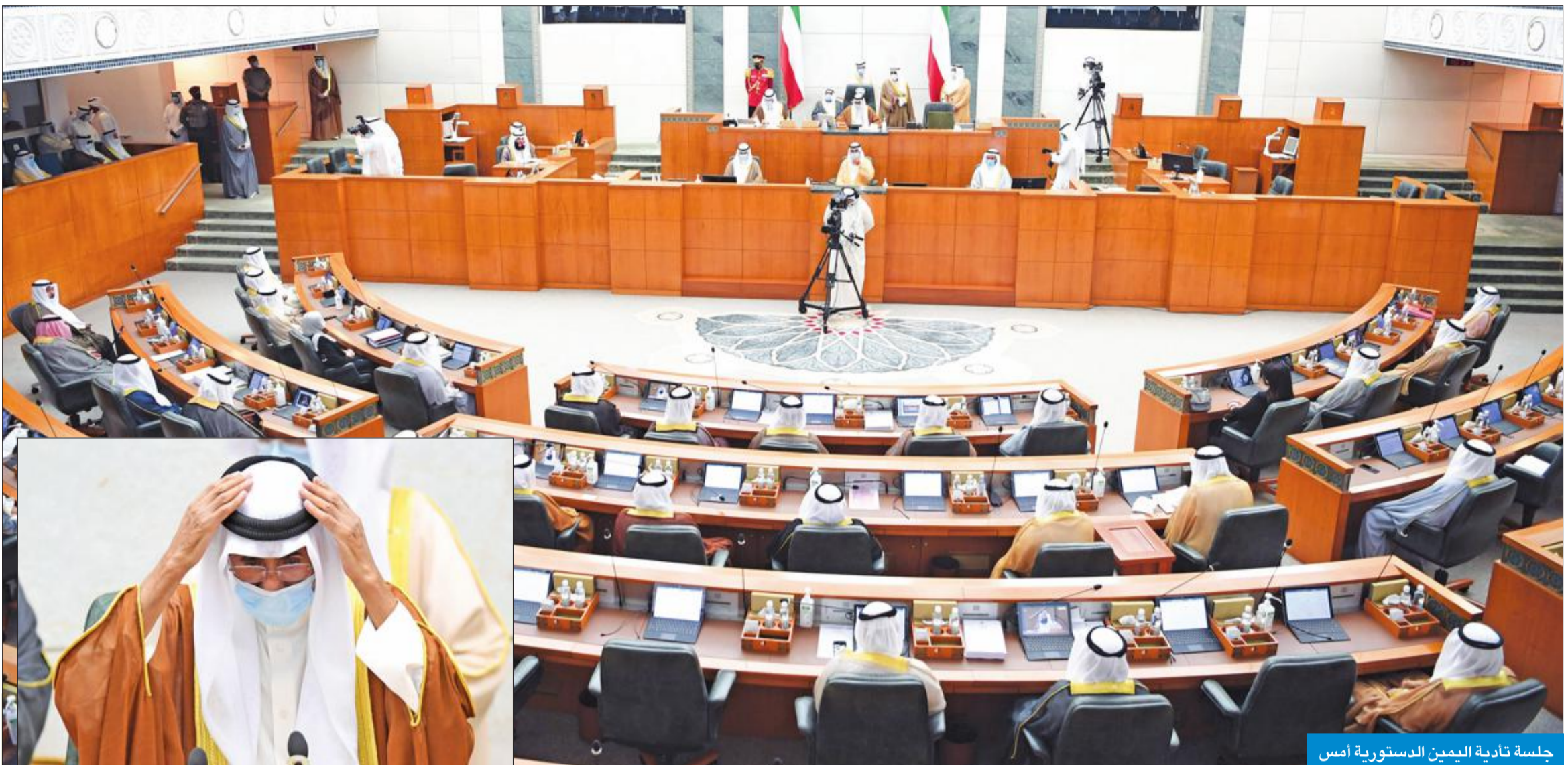
جلسة تادية اليمين الدستورية أمس

«وطننا العزيز يواجه ظروفًا دقيقة وتحديات خطيرة لا سبيل لتجاوزها إلا بوحدة الصف»