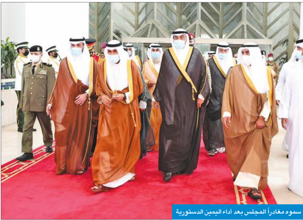
سموه مغادراً المجلس بعد أداء اليمين الدستورية

والإزدهار، عهد يطبق فيه القانون على الكبير والصغير، عهد لا ينعم فيه فاسد بفساده، ولا مغامر بمغامراته، ولا منكبس على حساب الوطن بمكاسبه. وأكد الغانم أن نبرة الثقة التي استخدمها في وصف عهدكم الجديد، نابعة من معرفة الكويتيين بكم، وهي معرفة عمرها عقود من التضحية والبذل والعطاء، كنت فيها متميزاً متألفاً، متسامياً محللاً، ونموذجاً رفيعاً في كل حالة من حالاتكم، ومرحلة من مراحل حياتكم. قال: إنني في هذه المناسبة