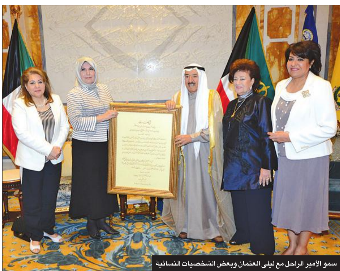
سمو الأمير الراحل مع ليلي العثمان وبعض الشخصيات النسائية

بكلمات معبّرة، وجمل يتقاطر منها الحزن والأسى، قدّم العديد من المثقفين والأدباء في الكويت التعازي إلى أسرة آل الصباح والشعب الكويتي والعالم العربي، مستذكّرين مناقب «قائد الإنسانية»، الذي قدّم إلى وطنه خدمات جليلة.