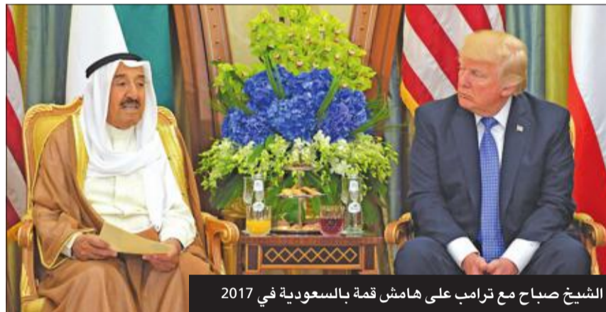
الشيخ صباح مع ترامب على هامش قمة السعودية في 2017

وكان وزير الخارجية الأميركي، مايك بومبيو، قد أعرب عن حزنه العميق لوفاة الشيخ صباح، وقال في بيان: "لقد شكّلت رؤيته الكويت لتصبح دولة مزدهرة وحديثة كما هي اليوم ونتج عن قيادته العالمية تغيير دائم وإيجابي في الكويت ومنطقة الشرق الأوسط بأسرها". ووصف الشيخ صباح الأحمد بأنه "كان زعيماً مجازاً وصديقاً لجميع الدول"، مؤكداً أن الولايات المتحدة "تقدّر بشدة الشراكة القوية" للأمير الراحل "في تعزيز الاستقرار والأمن الإقليميين، وهو ما انضم من خلال قيام الرئيس ترامب بمنحه وسام الاستحقاق العسكري بدرجة قائد أعلى