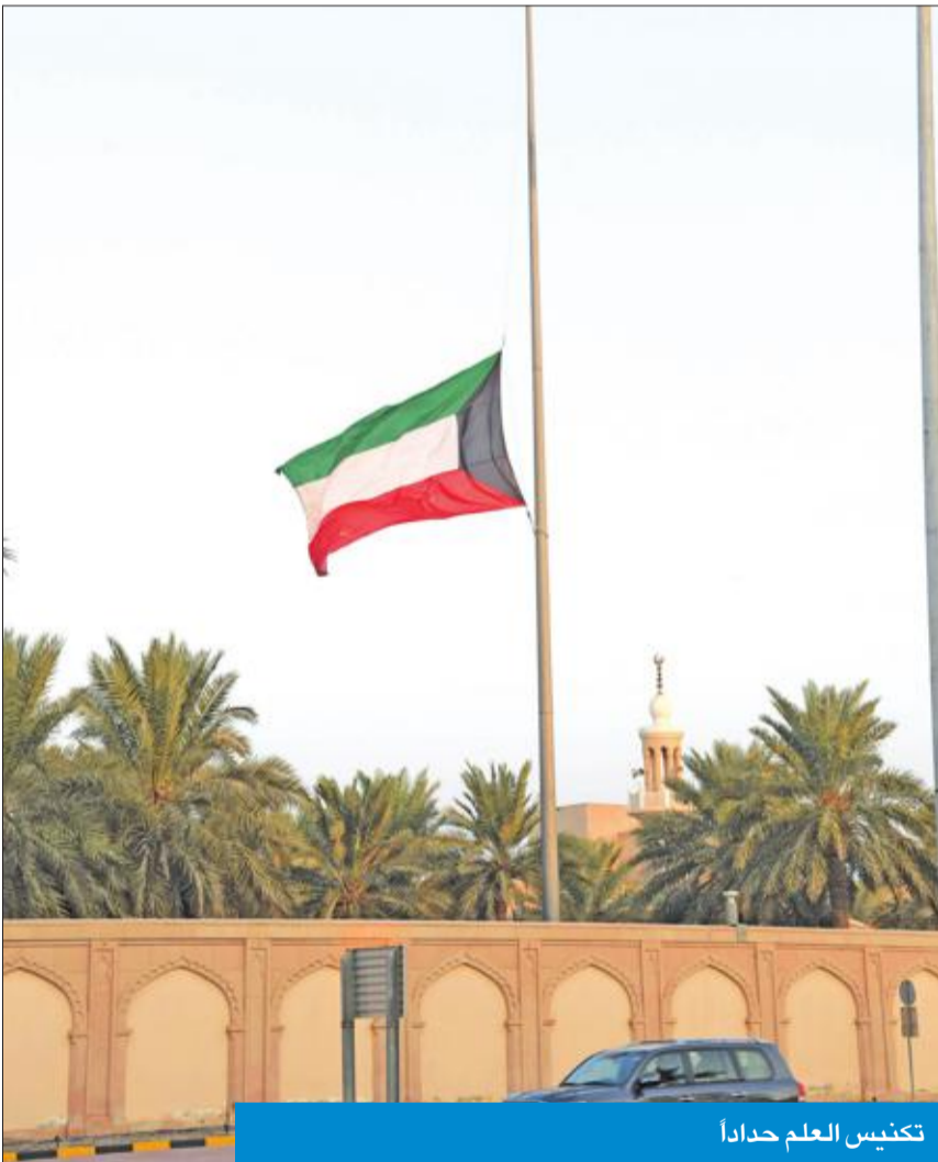
تكليس العلم حدادا