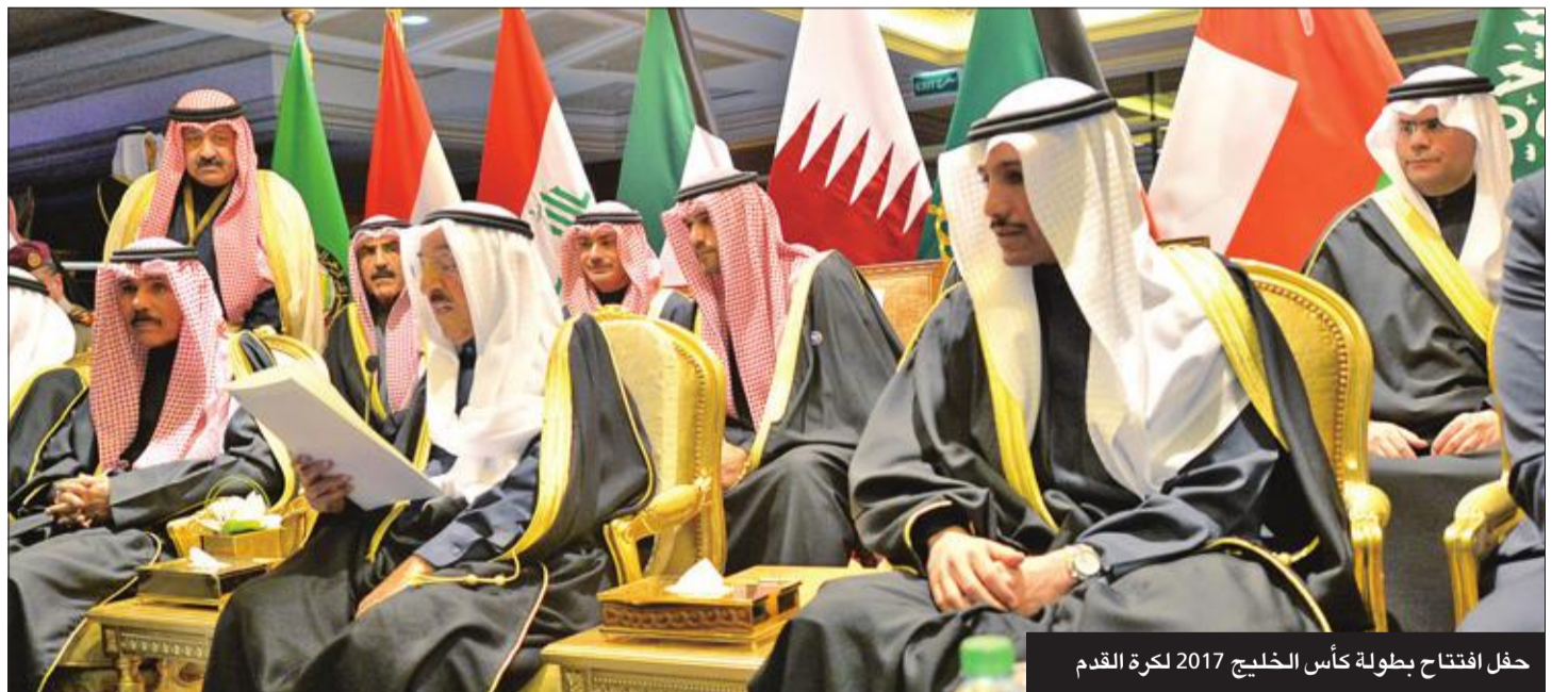
حفلة افتتاح بطولة كأس الخليج 2017 لكرة القدم