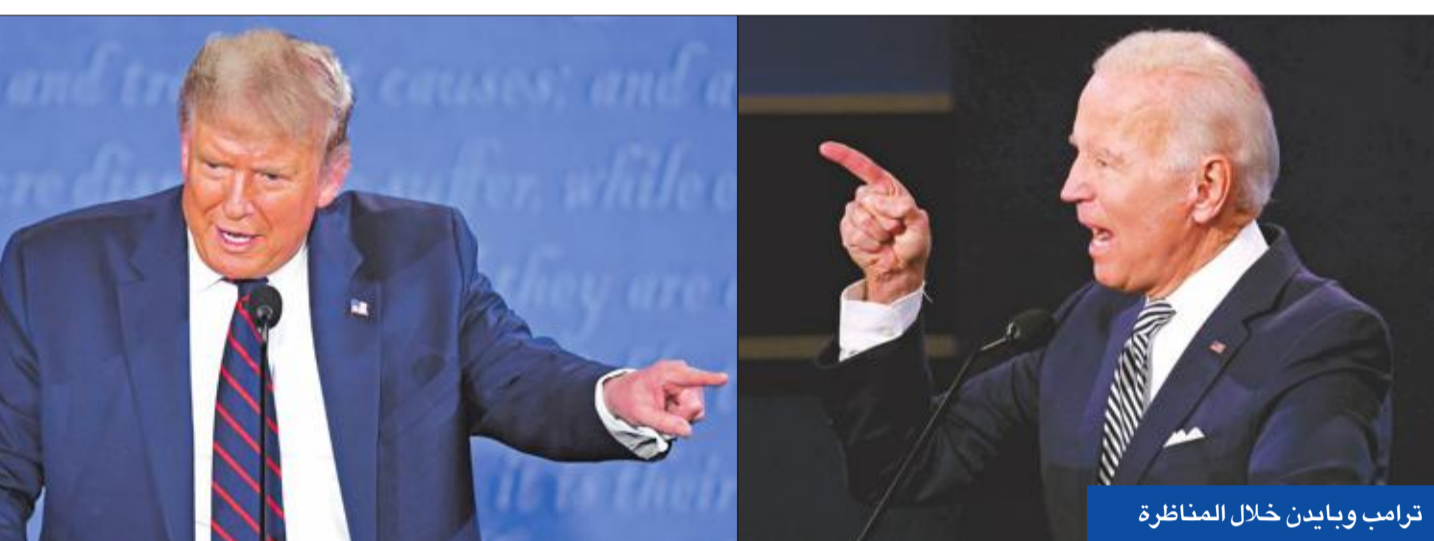
ترامب وبايدن خلال المناظرة

وقال ترامب من على منصة المناظرة في كلفلاند بولاية أوهايو، مخاطباً نائب الرئيس السابق: «أنت لا تمتّ إلى الذكاء بصلة،