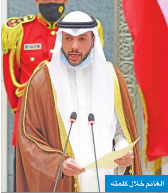
الغانم خلال كلمته

«نؤكد اعتزازنا بدستورنا ونهجنا الديمقراطي ونفتخر بكويتنا دولة القانون والمؤسسات»