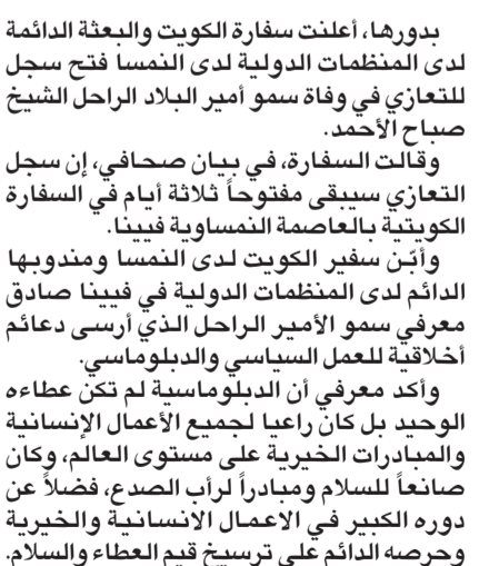
فتح سجل التعازي بوفاته صاحب السمو في سفارة الكويت بتونس

بدورها، أعلنت سفارة الكويت والبعثة الدائمة لدى المنظمات الدولية لدى النمسا فتح سجل التعازي في وفاة سمو أمير البلاد الراحل الشيخ صباح الأحمد.