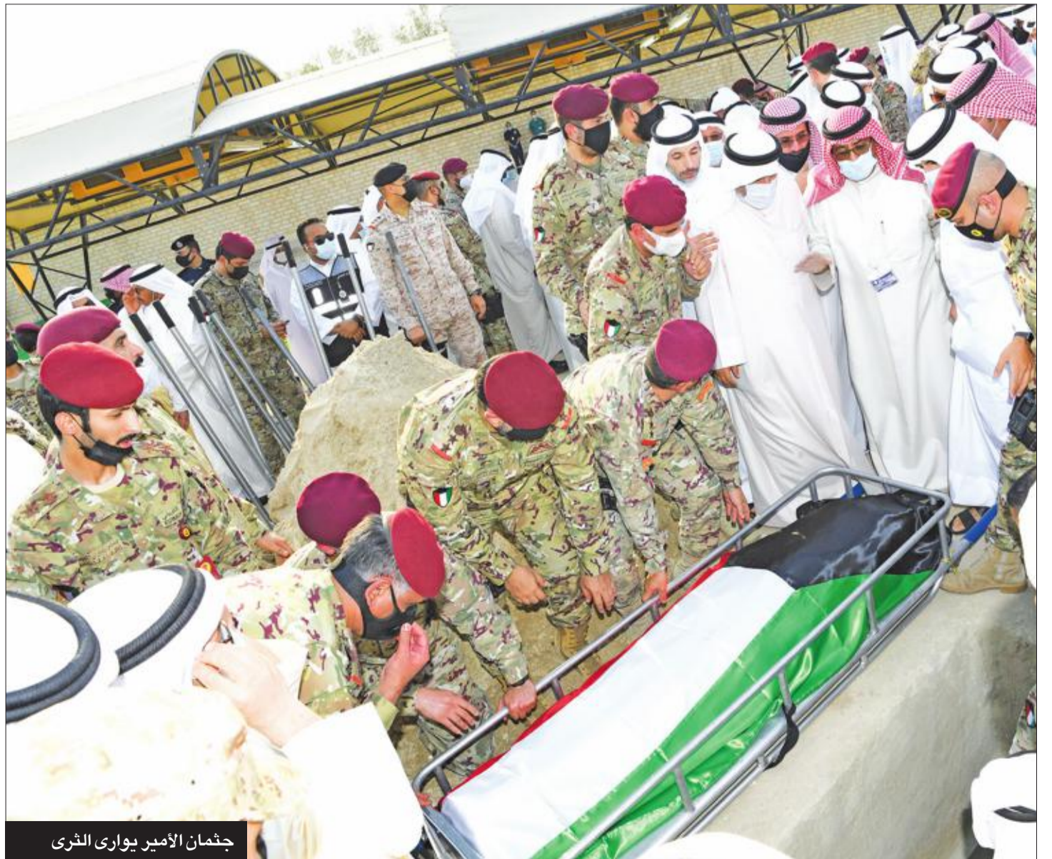
جثمان الأمير يوارى الثرى