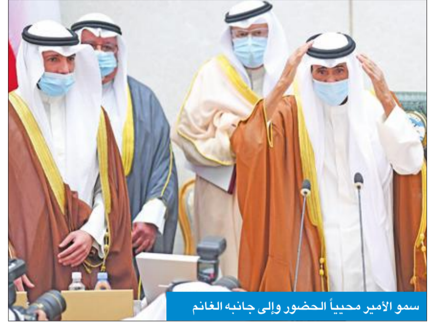
سمو الأمير محيياً الحضور وإلى جانبه الغانم