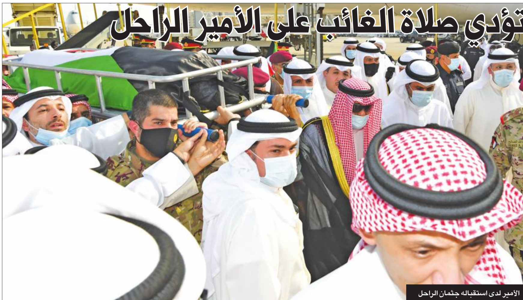
الأمير لدى استقباله جثمان الراحل