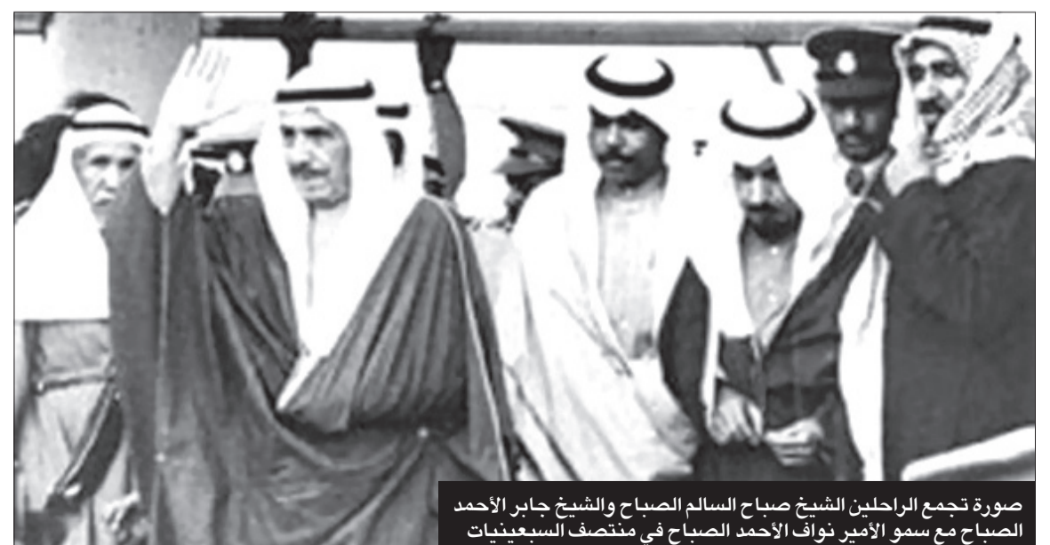
صورة تجمع الراحلين الشيخ صباح السالم الصباح والشيخ جابر الأحمد الصباح مع سمو الأمير نواف الأحمد الصباح في منتصف السبعينيات