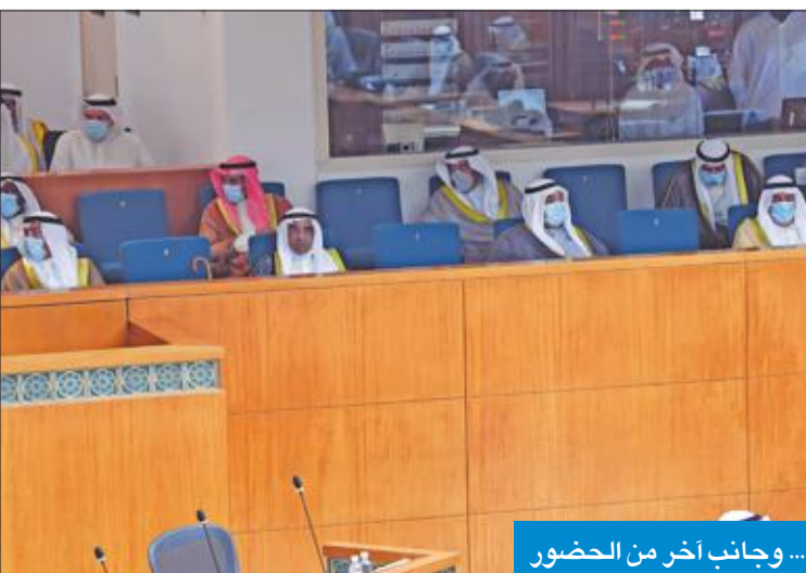
... وجانب آخر من الحضور