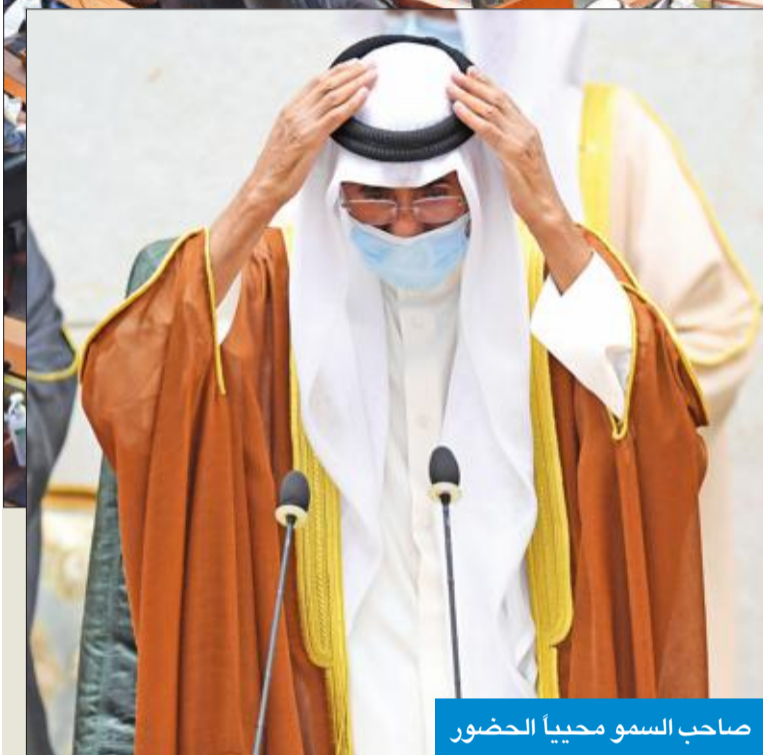
صاحب السمو محيياً الحضور

لخير ورفعة الكويت وأهلها الأوفياء»، وشدّد سموه، في كلمته الأولى أميراً للبلاد، على الاعتزاز «بدستورنا ونهجنا الديمقراطي ونفتخر بكويتنا دولة القانون». ثم ألقى الغانم كلمة قال فيها «أنت يا سمو الأمير سيف مجرب، وقائد مؤيد، وحكيم مسدد، هكذا عرفك الكويتيون خليطاً بين الحزم والتواضع، ومزجاً بين الحسم والقلب الكبير».