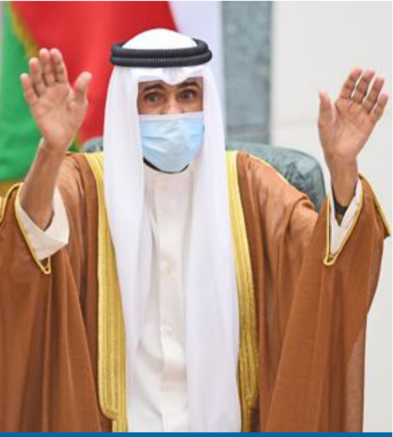
الأمير محياً الجمهور لدى دخوله قاعة عبدالله السالم لاداء اليمين الدستورية أمس

● «نعتز بالدستور ونهجننا الديمقراطي» ● «رحل عنا رمزٌ شامخ قدم الكثير لوطنه وشعبه وأمته» ● «نعيش ظروفاً دقيقة لا سبيل لتجاوزها إلا بوحدة الصف» ● العاهل السعودي: مصيرنا مشترك ونقف مع الكويت ● ترامب يدعو الخليج لتحقيق رؤية الراحل