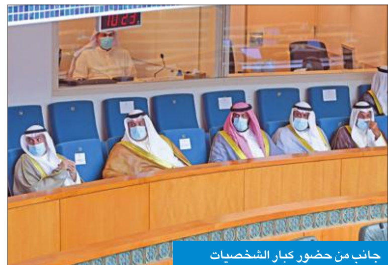
جانب من حضور كبار الشخصيات