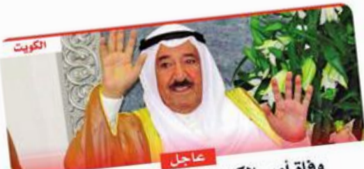
وفاة أمير الكويت الشيخ صباح الأحمد الصباح