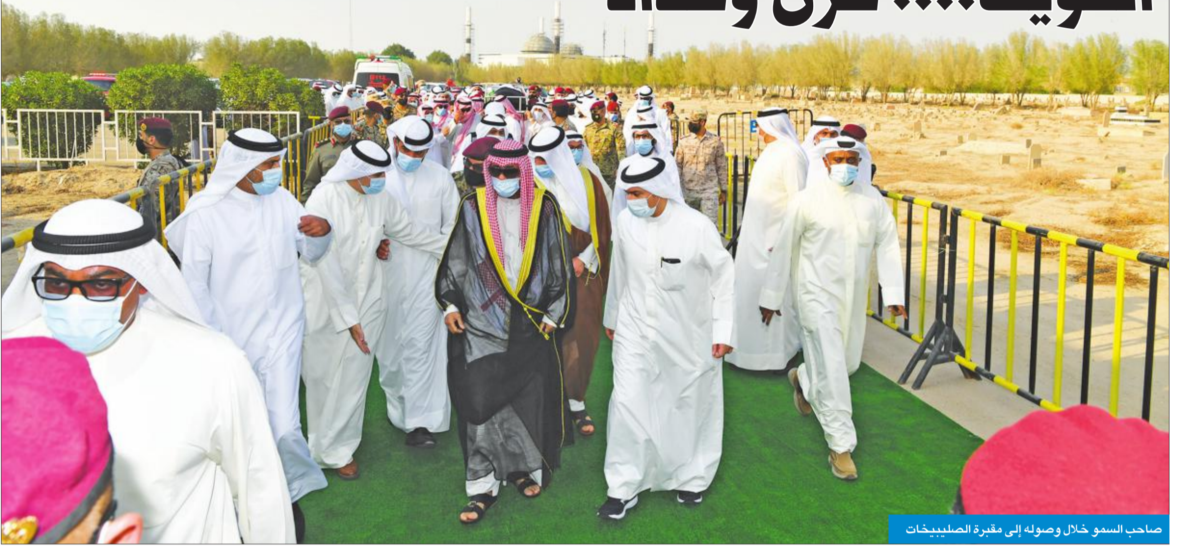
صاحب السمو خلال وصوله إلى مقبرة الصليبيخات