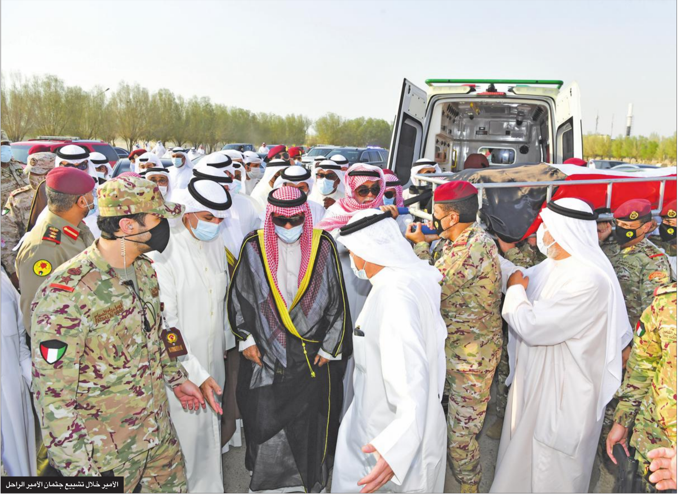
الأمير خلال تشييع جثمان الأمير الراحل