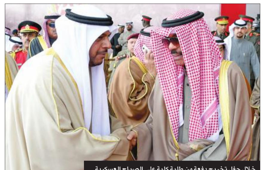
خلال حفل تخريج دفعة من طلبة كلية علي الصباح العسكرية

وعند تشكيل أول حكومة كويتية بعد حرب تحرير الكويت وعودة الشرعية، تم تكليف سموه بحقيبة وزارة الشؤون، وهنا كان يقول سموه: «أنا جندي أقبل العمل في أي مكان يضعني فيه سمو أمير البلاد». وقور