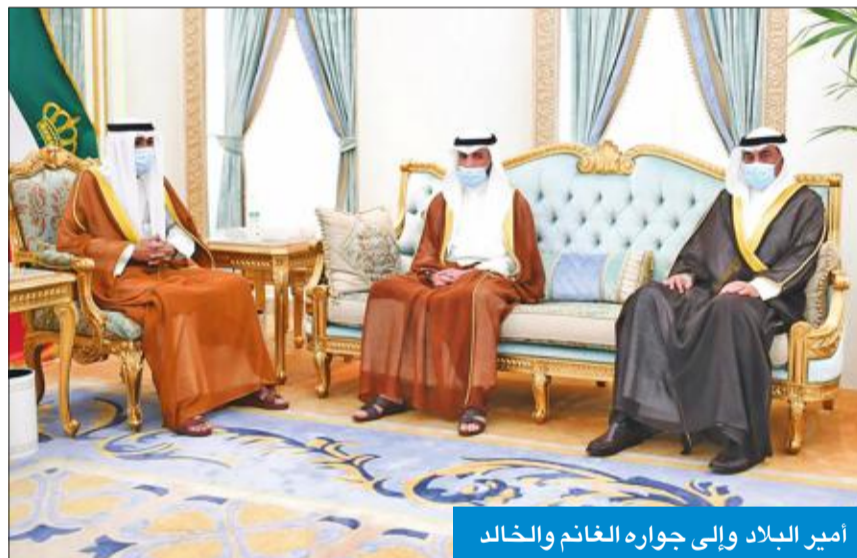
أمير البلاد وإلى جواره الغانم والخالد

وتابع سموه: تعرّضت الكويت خلال تاريخها الطويل إلى تحديات جادة ومحن قاسية نجحنا بتجاوزها