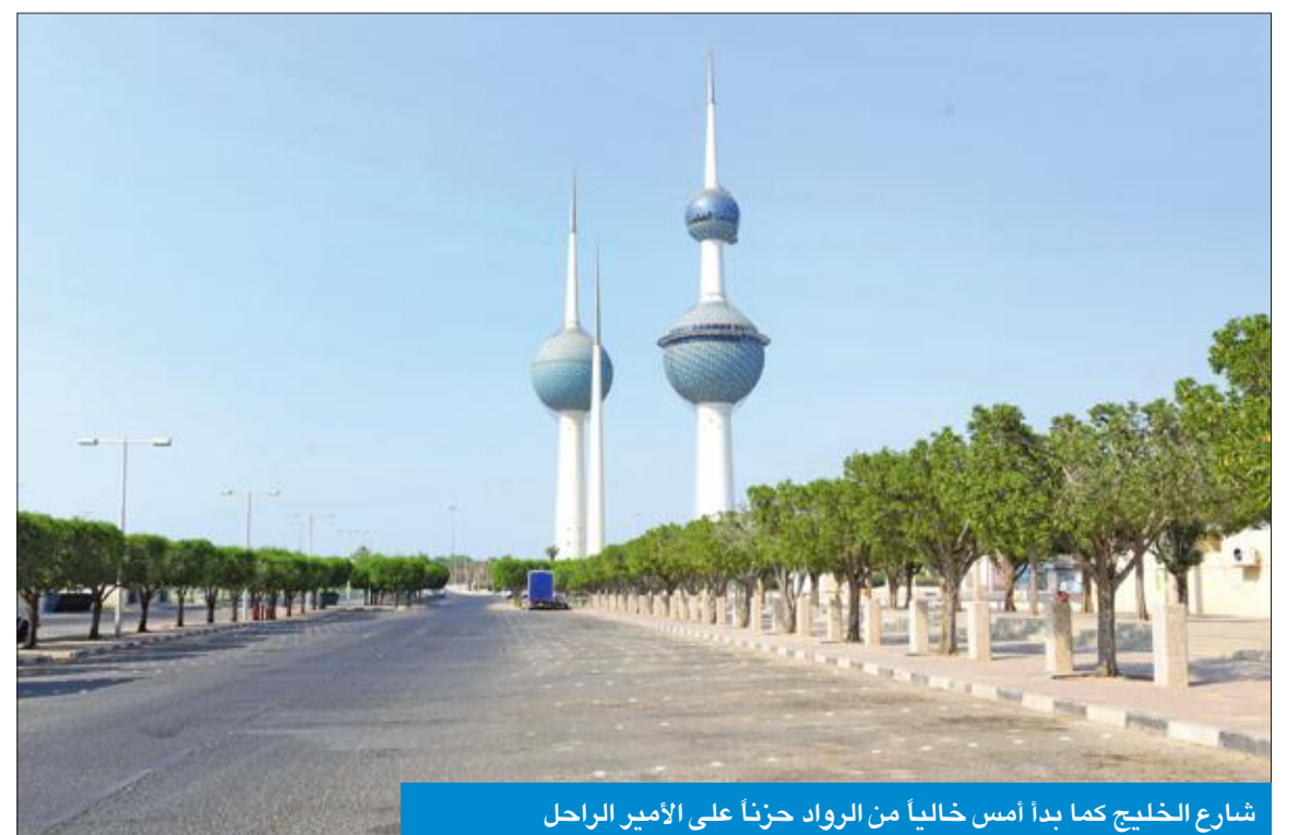
شارع الخليج كما بدأ أمس خاليا من الرواد حزنا على الأمير الراحل