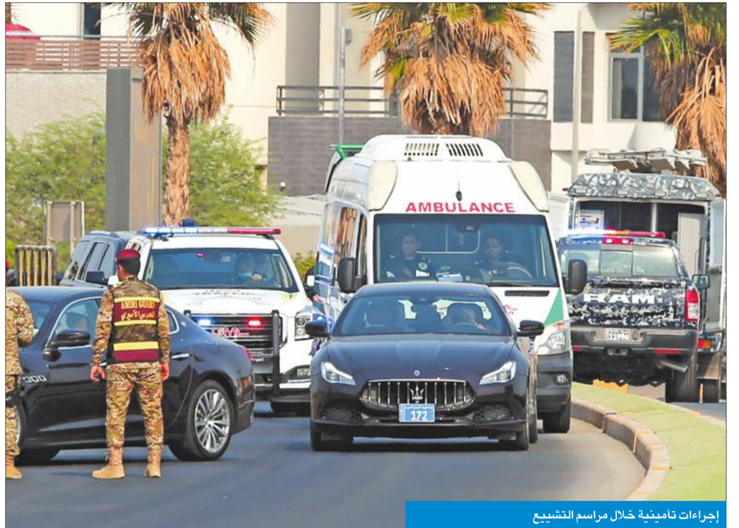
إجراءات تأمينية خلال مراسم التشييع