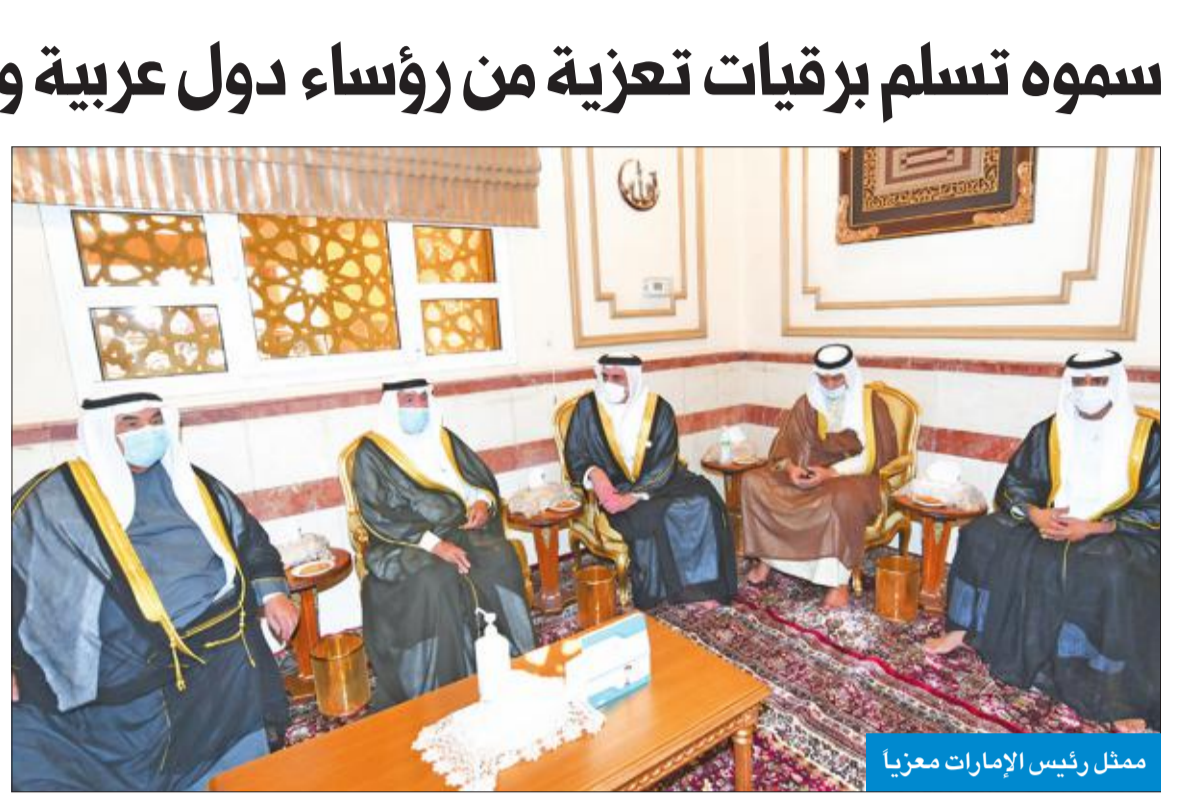
ممثل رئيس الإمارات معزياً

بواسع رحمته ورضوانه ويسكنه فسيح جناته وأن يلهم سموه وذويه والشعب الكويتي جميل الصبر وحسن العزاء. وتلقى صاحب السمو برقية تعزية من ولي عهد أبوظبي نائب القائد الأعلى للقوات المسلحة في دولة الإمارات العربية المتحدة الشيخ محمد بن زايد آل نهيان أعرب فيها عن خالص تعازيه وصادق روضائه ويسكنه فسيح جناته وأن يلهم سموه وذويه والشعب الكويتي جميل الصبر وحسن العزاء. وقد بعث صاحب السمو ببرقيات شكر جوابية ضمنها خالص شكره وتقديره لما عبروا عنه من صادق المواساة وخالص التعازي والدعاء راجيا لهم موفور الصحة والعافية، ضارعا إلى الباري تعالى بأن لا يري الجميع أي مكروه بعزير.