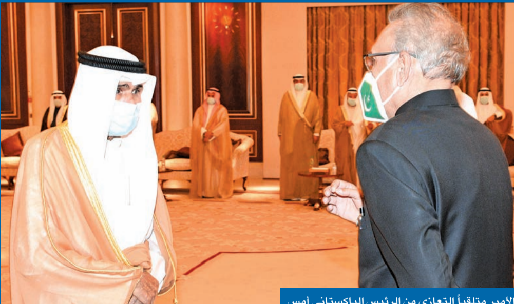
الأمير متلقياً التعازي من الرئيس الباكستاني أمس

«مواطنونا وإعلامنا ولجاننا الخيرية جسدوا روح الأسرة الكويتية الواحدة»