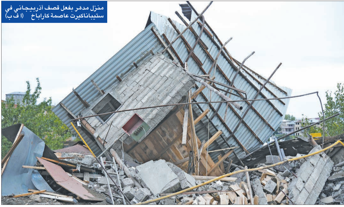
منزل مدمر بفعل قصف أذربيجاني في ستيباناكيرت عاصمة كاراباخ

*دفعة جديدة من المرتزقة السوريين ويريفان تطالب واشنطن بتفسيرات عن استخدام تركيا F16