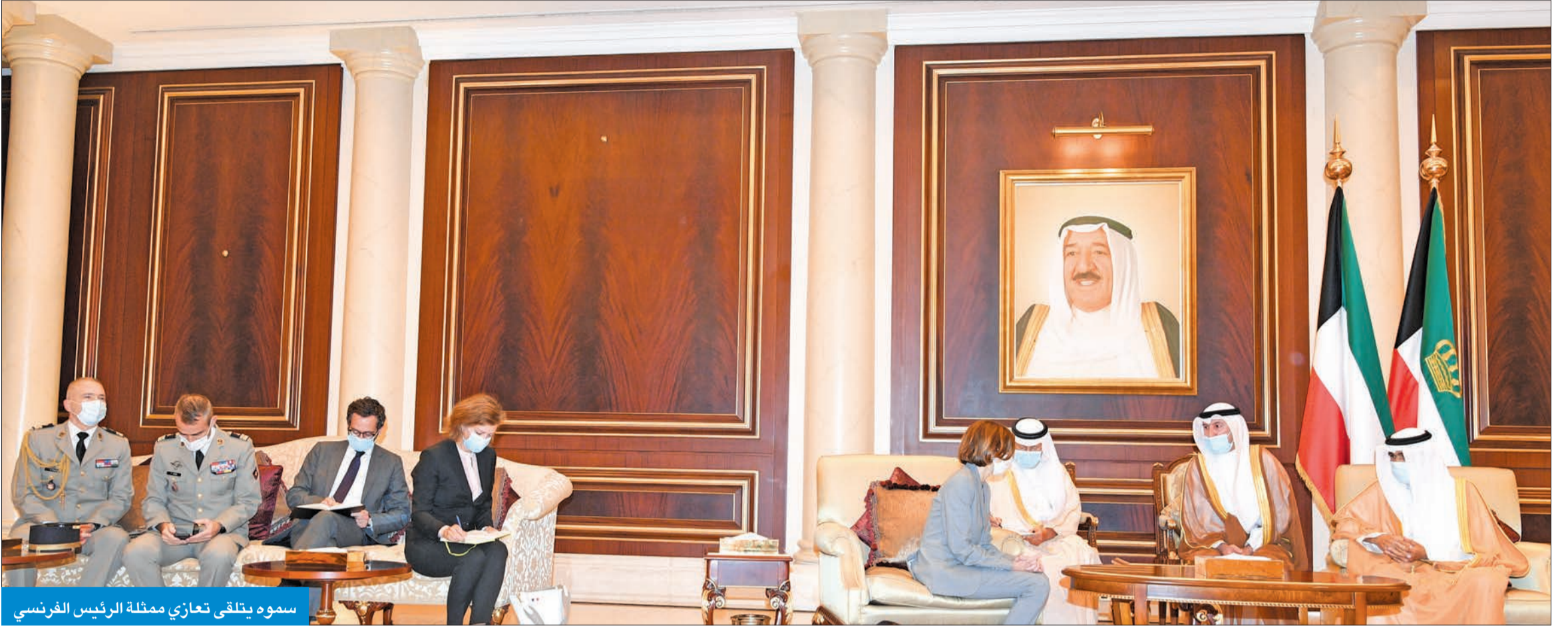
سموه يتلقى تعازي ممثلة الرئيس الفرنسي