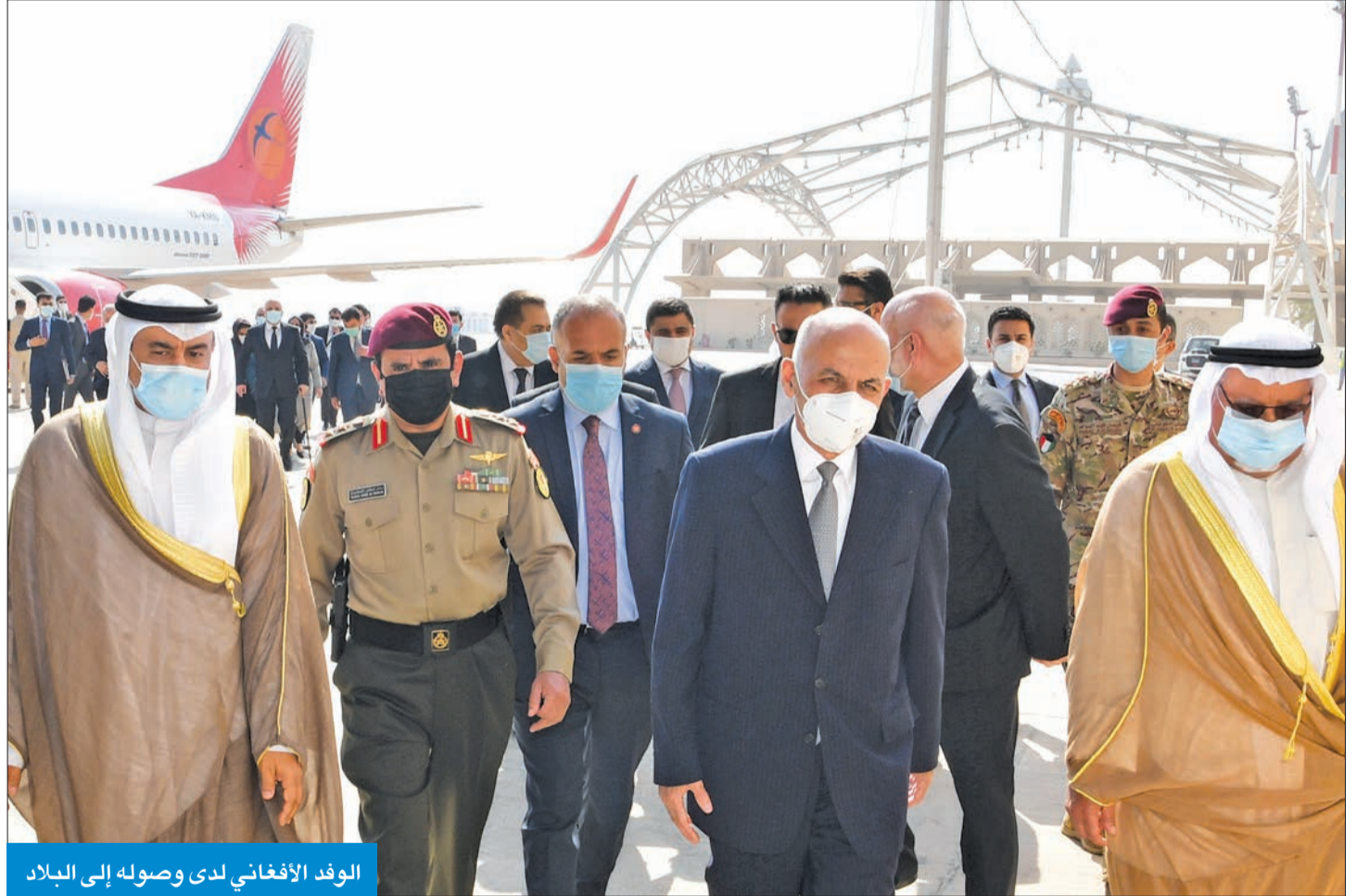
الوفد الأفغاني لدى وصوله إلى البلاد

فتحت سفارة الكويت لدى إسبانيا سجل التعازي بوفاة صاحب السمو أمير البلاد الراحل الشيخ صباح الأحمد طيب الله ثراه لمدة ثلاثة أيام. وأعلنت السفارة في بيان أمس الأول ان معظم سفراء الدول العربية والأجنبية المعتمدين في العاصمة