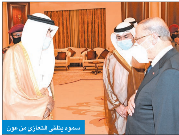
سموه يتلقى التعازي من عون

تواصل أمس توافد قادة العالم والمسؤولين ووفود ممثلي الدول الخليجية والعربية والإسلامية والأوروبية والإفريقية والآسيوية، إلى الكويت، لتقديم واجب العزاء بوفاة أمير الإنسانية سمو الشيخ صباح الأحمد طيب الله ثراه وجعل الجنة مثواه. واستقبل صاحب السمو أمير البلاد الشيخ نواف الأحمد، في المطار الأميري، ظهر أمس، رئيس الجمهورية اللبنانية العماد ميشال عون ورئيس مجلس النواب نبيه بري ورئيس مجلس الوزراء حسان دياب والوفد المرافق،