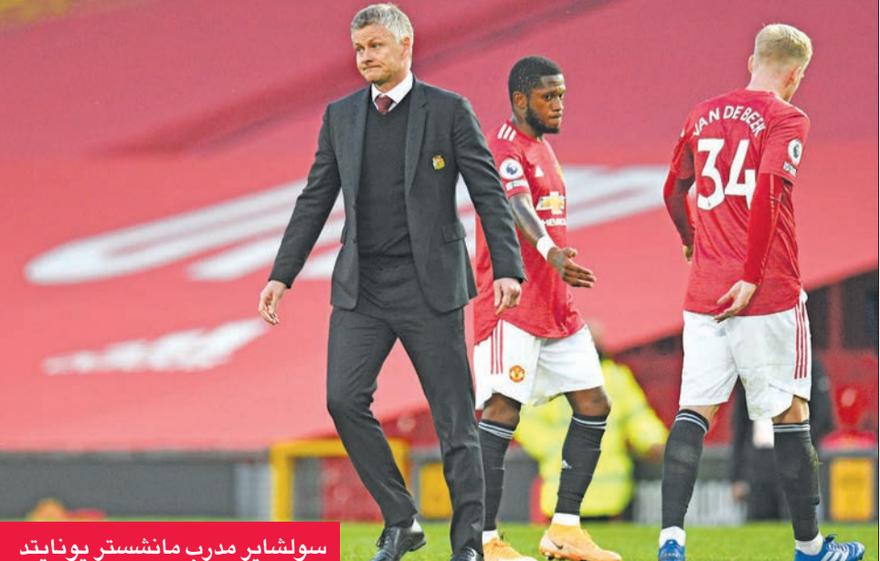
سولشاير مدرب مانشستر يونايتد

لكن سرعان ما أصابت الخيبة المشجعين بعد أن خسر الفريق مباراته الأولى للموسم على يد ضيفه كريستال بالاس (3-1)، قبل أن تقع الكارثة أمس الأول