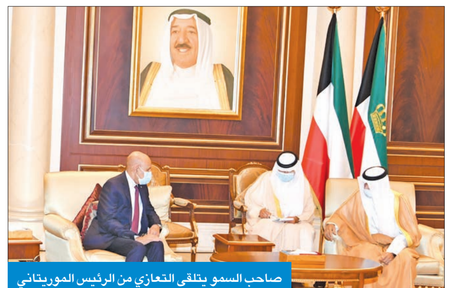
صاحب السمو يتلقى التعازي من الرئيس الموريتاني