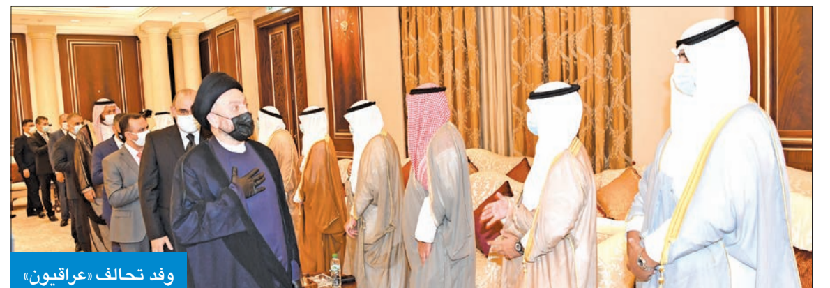
وفد تحالف «عراقيون»