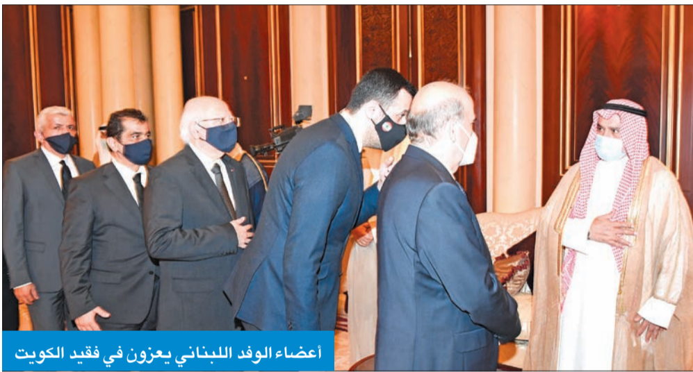
أعضاء الوفد اللبناني يعززون في فقيد الكويت