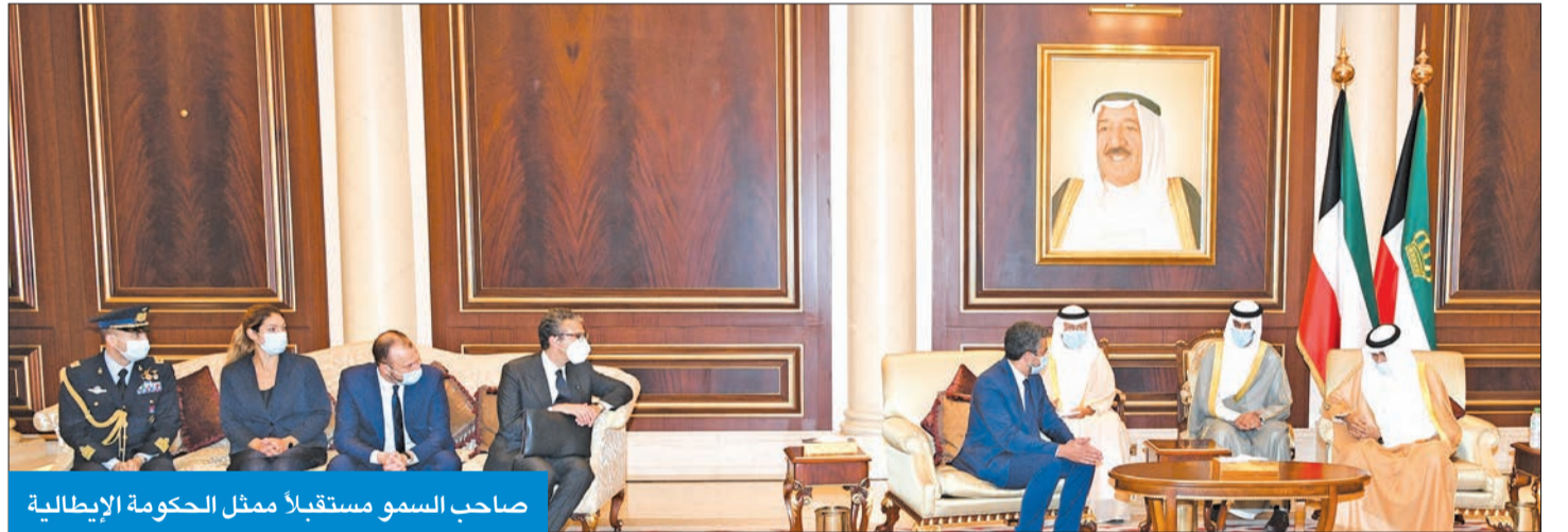
صاحب السمو مستقبلاً ممثل الحكومة الإيطالية