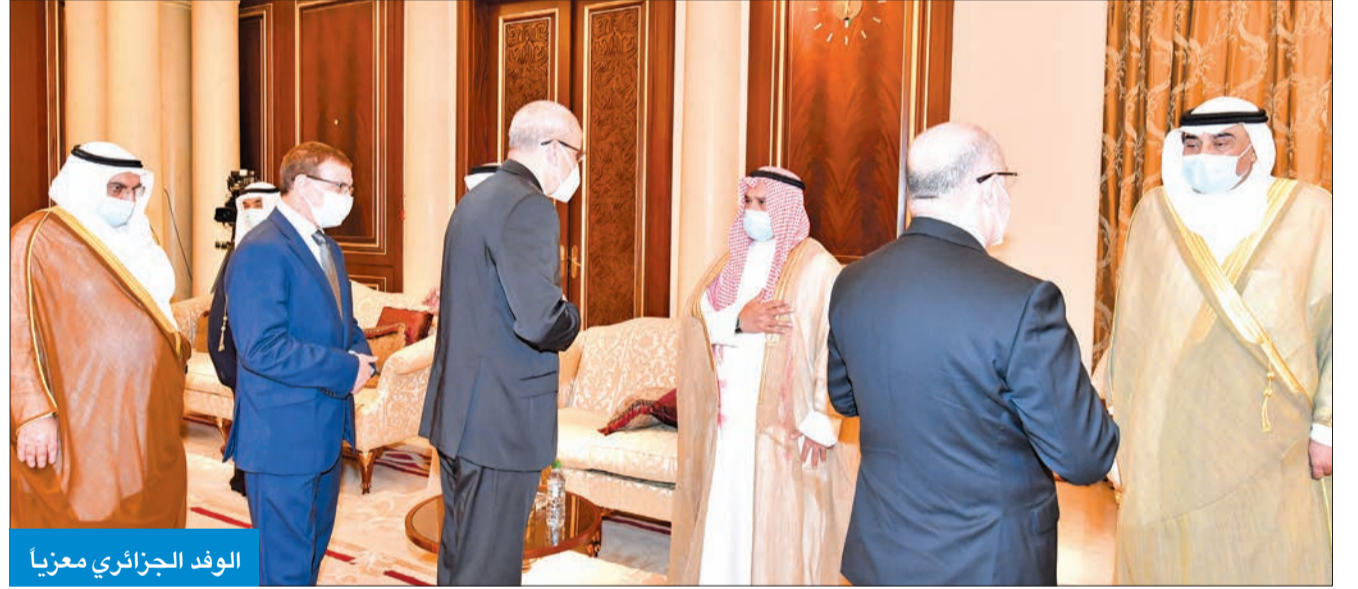
الوفد الجزائري معزيا