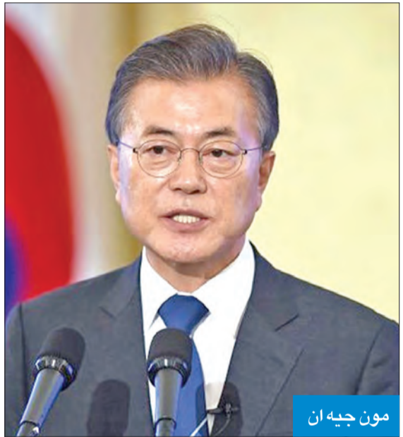
مون جيه ان