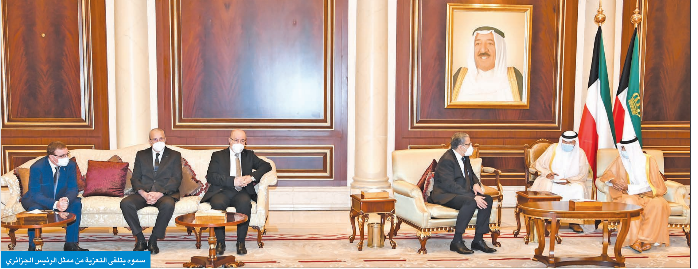
سموه يتلقى التعزية من ممثل الرئيس الجزائري