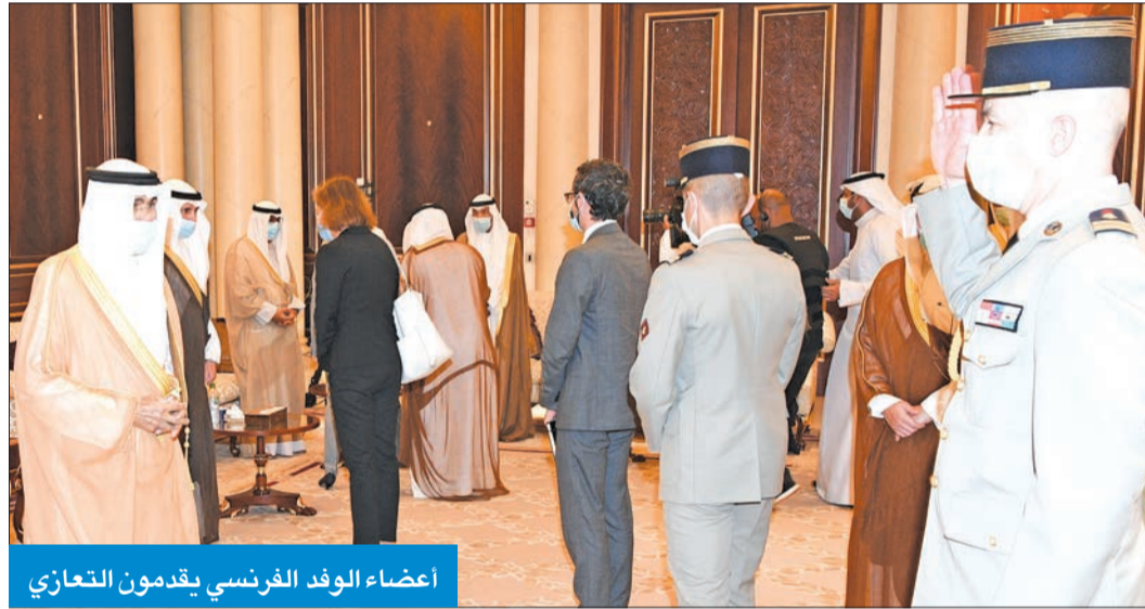
أعضاء الوفد الفرنسي يقدمون التعازي

ممثل ملك المغرب الملك محمد السادس، وزير الأوقاف والشؤون الإسلامية أحمد التوفيق ووزير العدل محمد بن عبد القادر، حيث قاما بتقديم واجب العزاء في وفاة الشيخ صباح الأحمد.