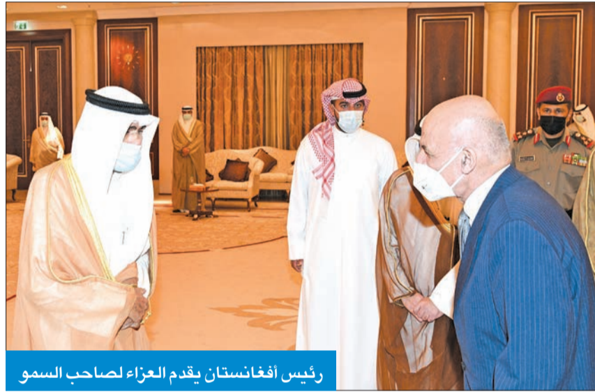
رئيس أفغانستان يقدم العزاء لصاحب السمو

عبد العزيز بن تركي، حيث قاموا بتقديم واجب العزاء في وفاة فقيد الوطن المغفور له بإذن الله تعالى صاحب السمو أمير البلاد الراحل الشيخ صباح الأحمد طيب الله ثراه وجعل الجنة مثواه.