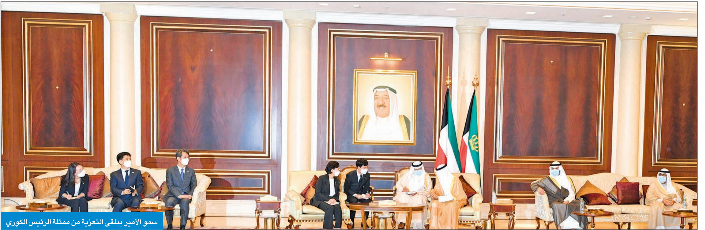
سمو الأمير يتلقى التعزية من ممثلة الرئيس الكوري