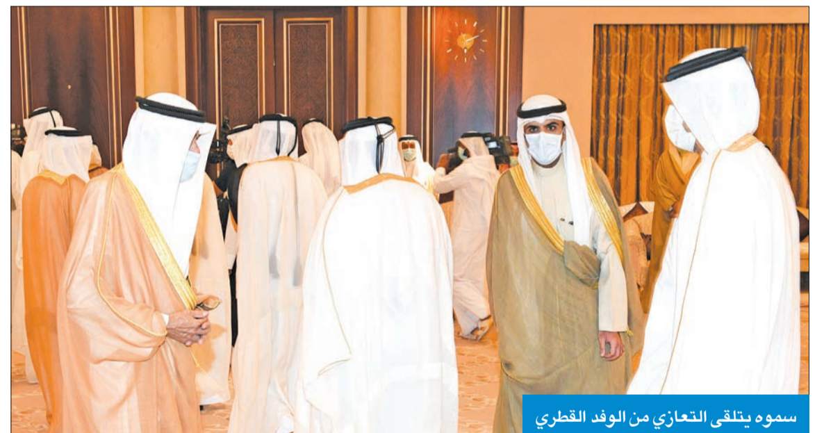
سموه يتلقى التعازي من الوفد القطري