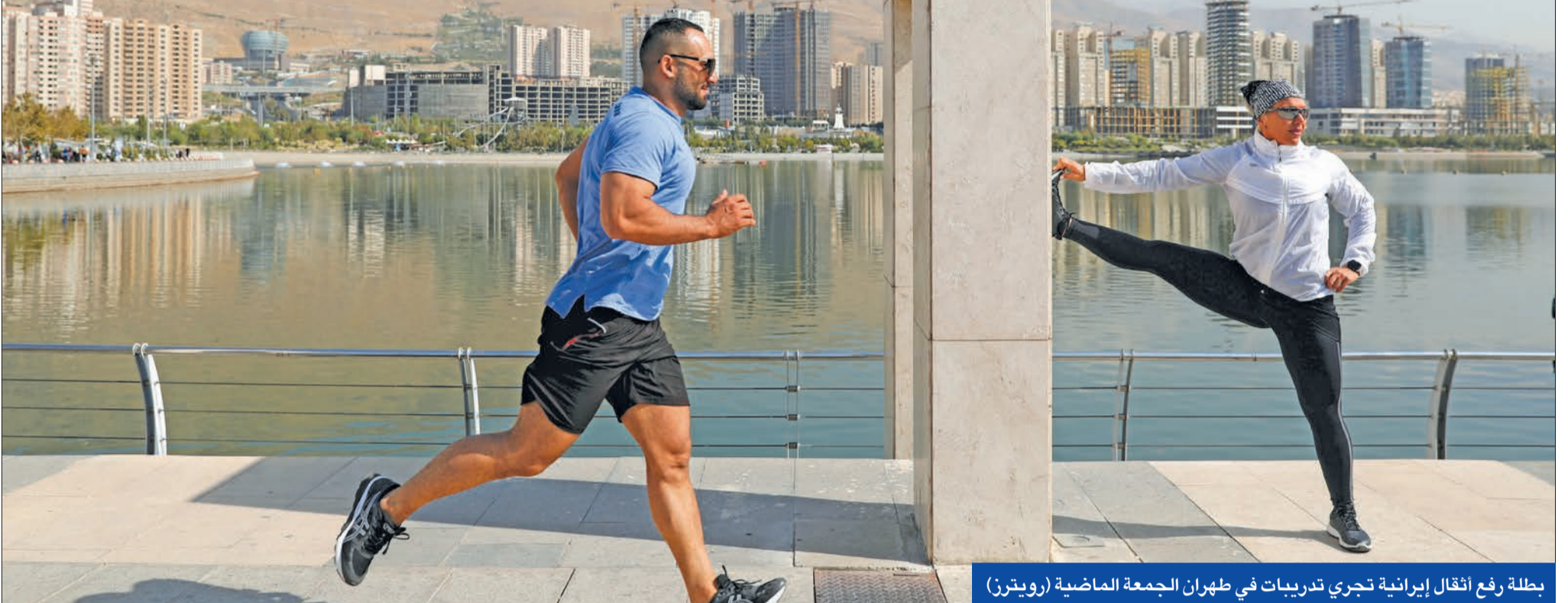
بطلة رفع أثقال إيرانية تجري تدريبات في طهران الجمعة الماضية

الأكثر دقة وتفصيلاً والذي يلتزم به أعضاء ائتلمعت بسبب ارتفاع أسعار