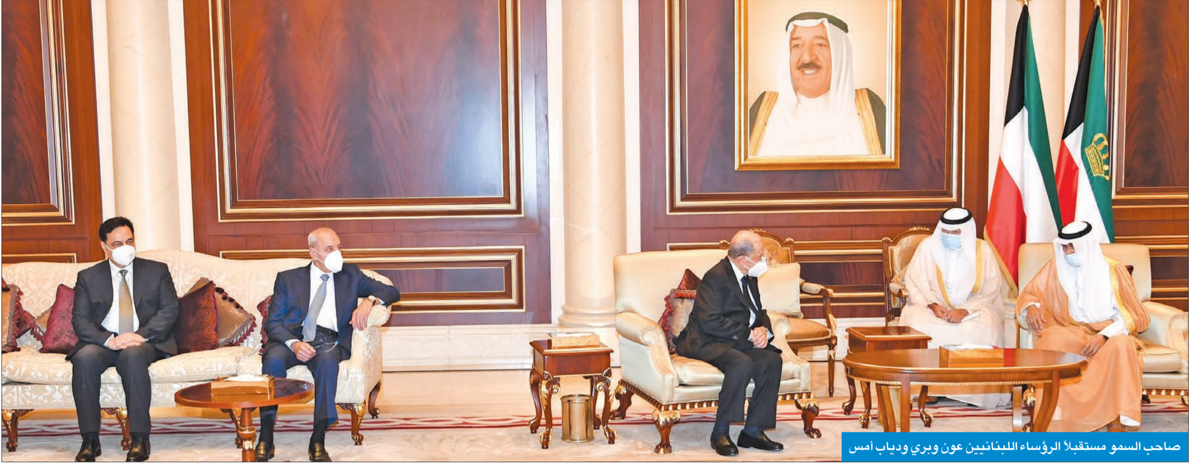
صاحب السمو مستقبلاً الرؤساء اللبنانيين عون ويري ودياب أمس

تقدمهم الرؤساء اللبنانيون وممثلو «التعاون» والدول العربية والغربية