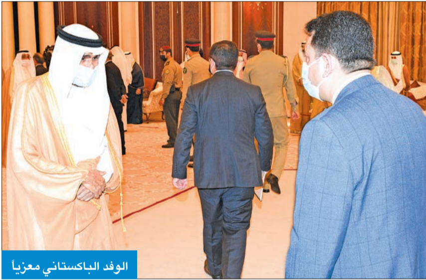
الوفد الباكستاني معزيا