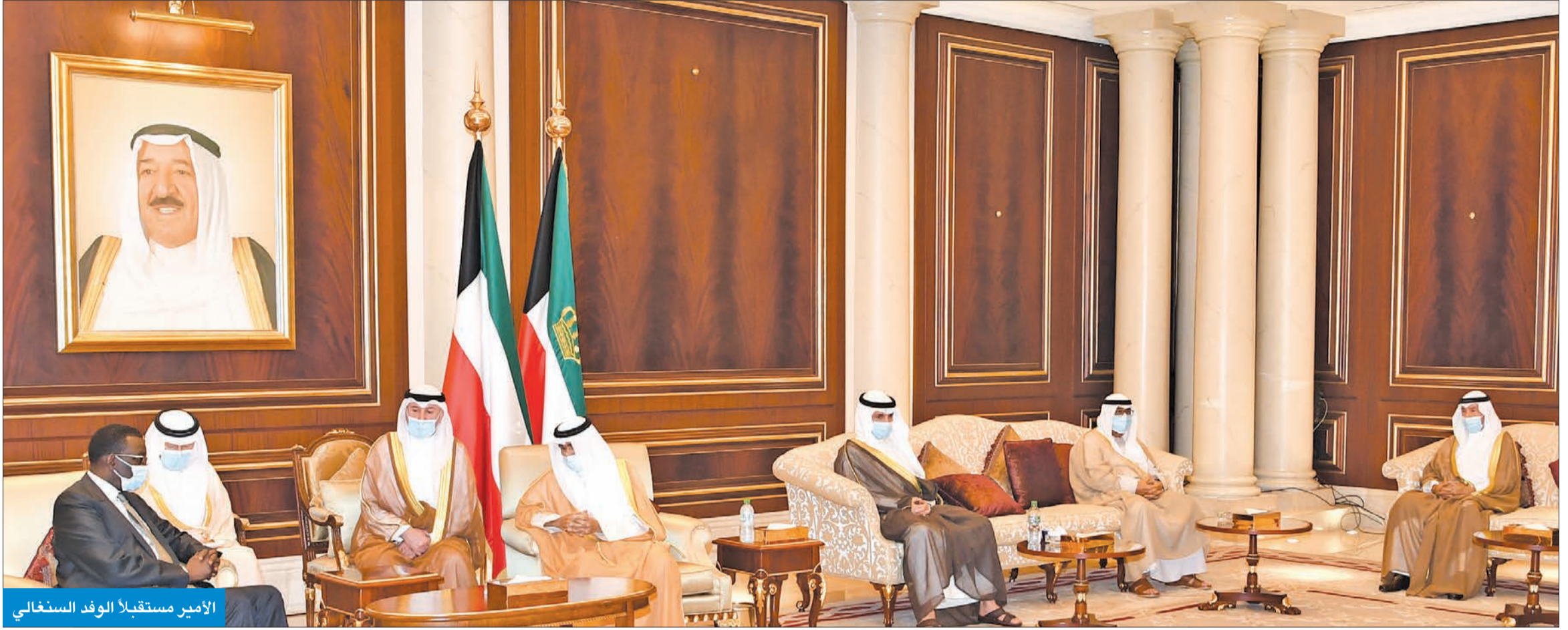
الأمير مستقبلاً الوفد السنغالي