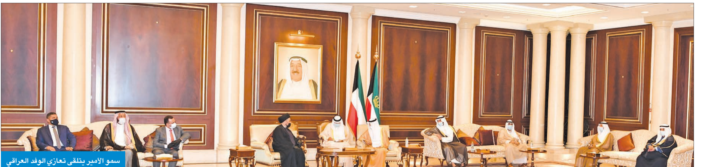
سمو الأمير يتلقى تعازي الوفد العراقي