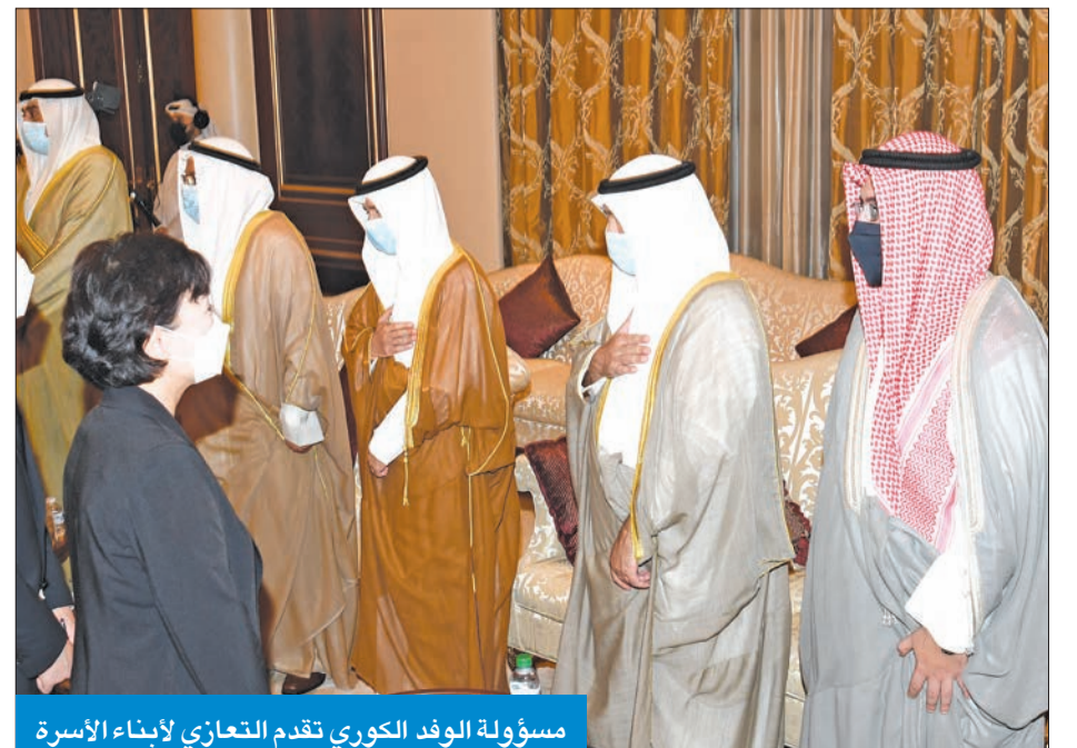
مسؤولو الوفد الكوري تقدم التعازي لأبناء الأسرة