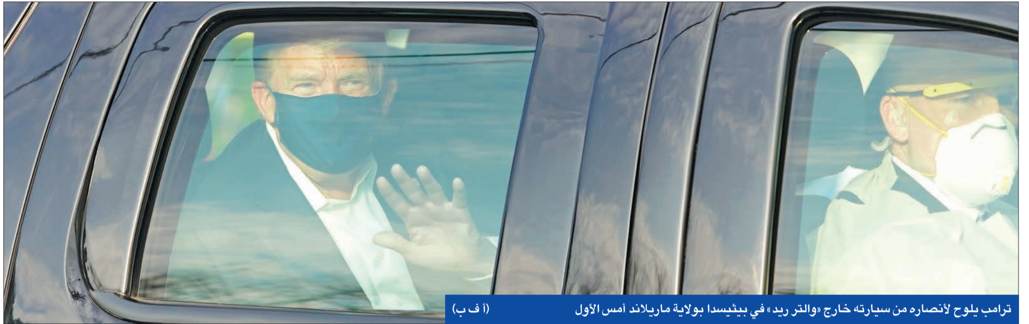
ترامب يلوح لأنصاره من سيارته خارج «والتر ريد» في بيتسدا بولاية ماريلاند أمس الأول