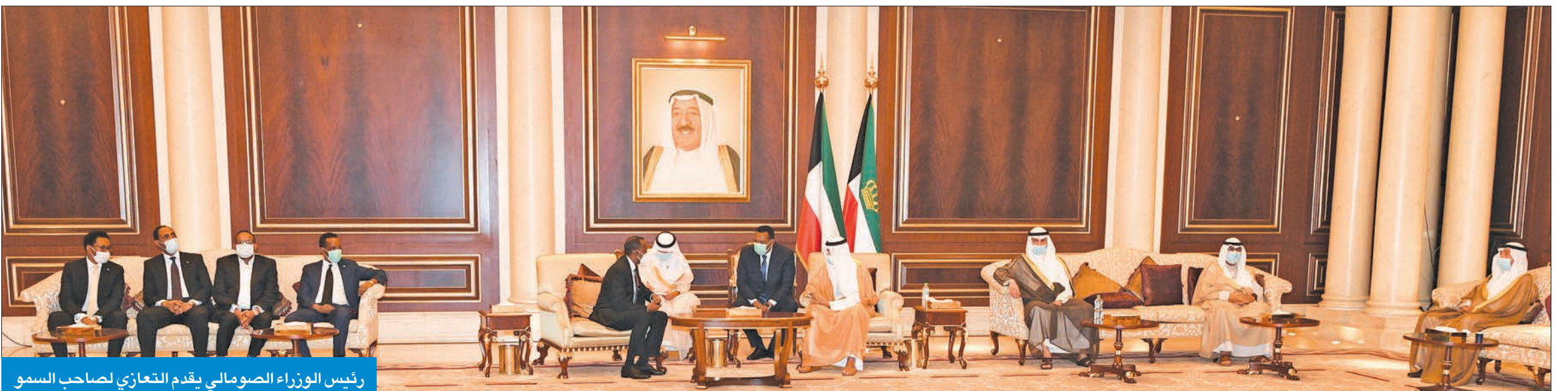
رئيس الوزراء الصومالي يقدم التعازي لصاحب السمو

وقال: «عملت عن قرب عندما كنت أميناً عام للأمم المتحدة مع الأمير الراحل،