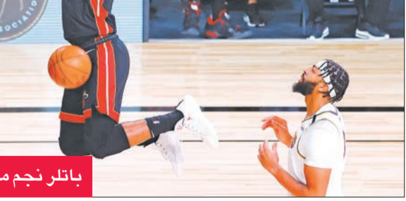
باتلر نجم ميامي يسجل في سلة ليكرز

أصبح باتلر (31 عاماً) ثالث لاعب في تاريخ الدوري يحقق «تريل دابل» في النهائي مع 40 نقطة، بعد جيري وست في 1969 وليجرون جيمس في 2015.