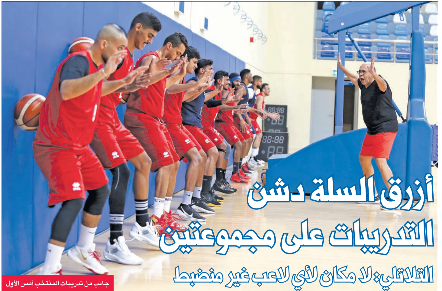
جانب من تدريبات المنتخب أمس الأول

إلى ذلك، رفعت لجنة المسابقات باتحاد الكرة عقب انتهاء اجتماع أمس الأول إلى مجلس إدارة اتحاد الكرة، توصيتين، الأولى هي تسجيل الأندية للاعبين فئة غير محددى الجنسية في قوائمها من دون حد أقصى (تسجيل مفتوح)، وذلك بعد موافقة الاتحاد الدولي (الفيفا) في الكونغرس الأخير الذي حضره رئيس الاتحاد الشيخ أحمد البوسيف والأمين العام للاتحاد صلاح عيسى القناعي عبر برنامج زوم، على مشاركة هؤلاء