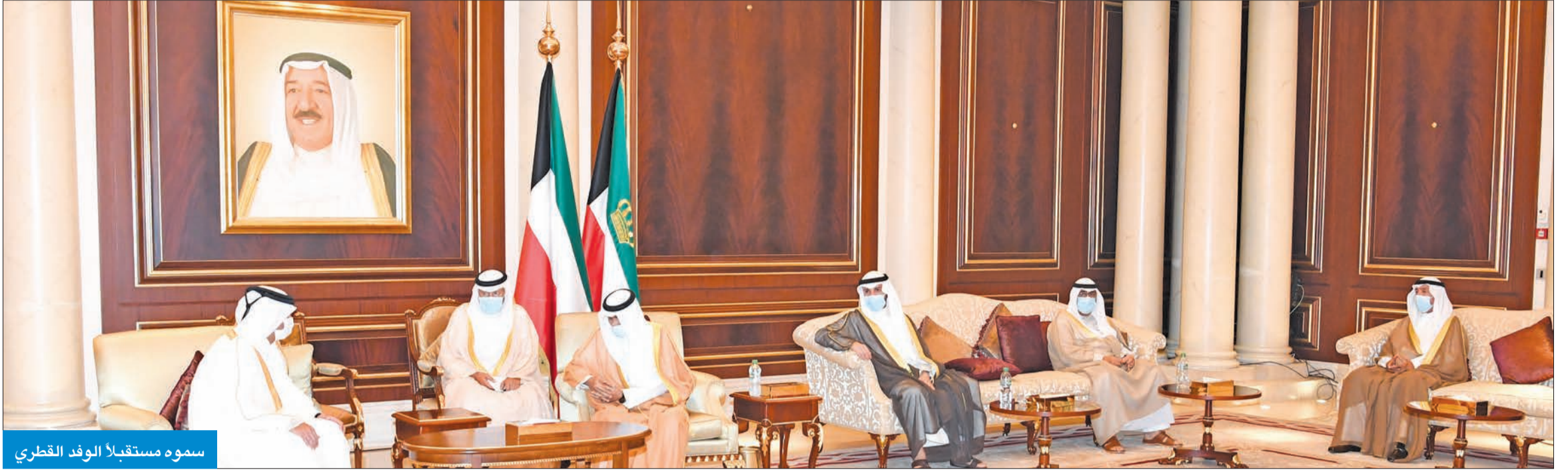
سموه مستقبلاً الوفد القطري