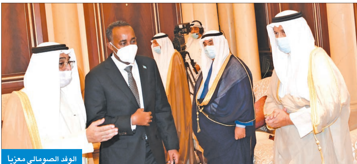
الوفد الصومالي معزياً