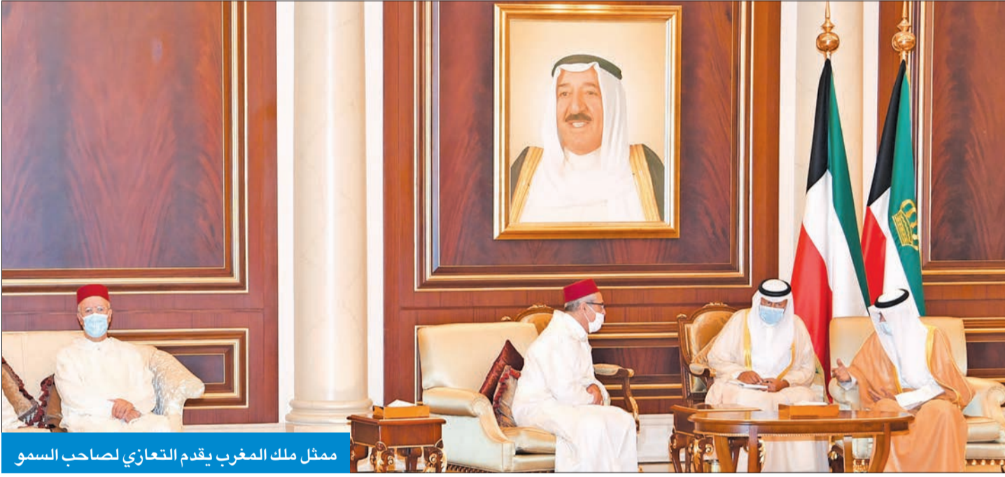
ممثل ملك المغرب يقدم التعازي لصاحب السمو

الشيخ صباح الأحمد، طيب الله ثراه، وجعل الجنة مثواه. كما قدم الرئيس اليمني التعازي إلى رئيس مجلس الأمة مرزوق الغانم، ونائب رئيس الحرس الوطني الشيخ مشعل الأحمد، والشيخ جابر العبدالله، وسمو الشيخ ناصر المحمد، وسمو الشيخ جابر المبارك، وسمو رئيس مجلس الوزراء الشيخ صباح الخالد، وعدد من الشيوخ الكرام. أمير البلاد الراحل الشيخ صباح الأحمد، طيب الله ثراه وجعل الجنة مثواه. كما قدموا التعازي إلى رئيس مجلس الأمة مرزوق الغانم، ونائب رئيس الحرس الوطني الشيخ مشعل الأحمد، والشيخ جابر العبدالله، وسمو الشيخ ناصر المحمد، وسمو الشيخ جابر المبارك، وسمو رئيس مجلس الوزراء الشيخ صباح الخالد، وعدد من الشيوخ الكرام.