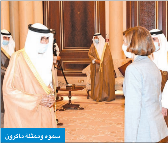
سموه وممثلة ماكرون