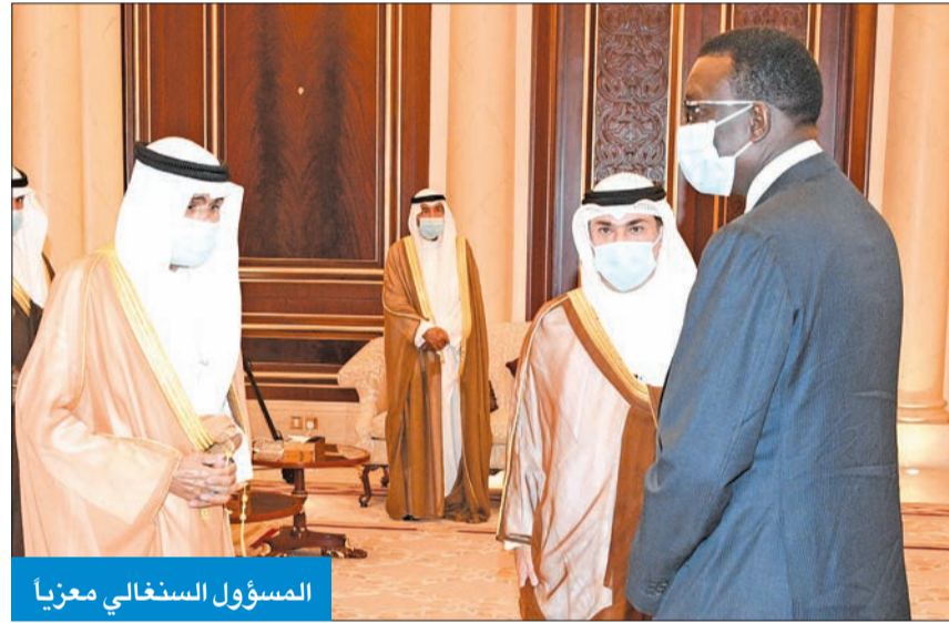
المسؤول السنغالي معزياً

◀ والوفد المرافق، حيث قام كذلك بتقديم واجب العزاء.