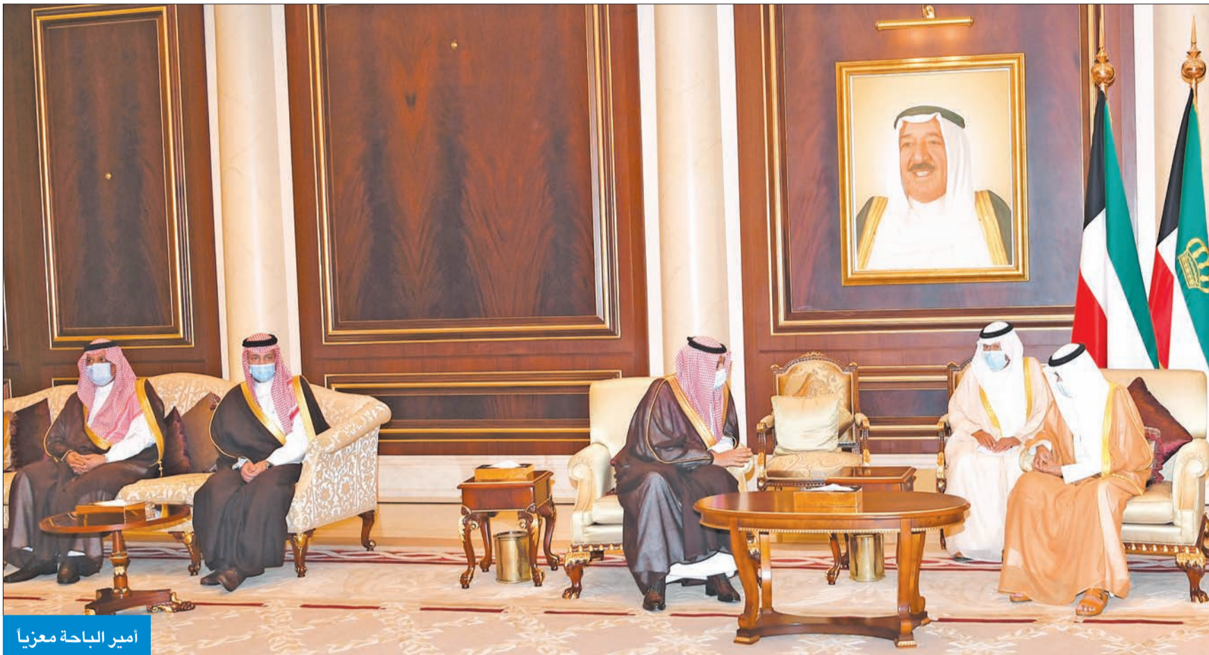
أمير الباحة معزيا

الأميري، رئيس مجلس الوزراء ووزير الداخلية في قطر الشيخ خالد بن خليفة والوفد المرافق، حيث قام بتقديم واجب العزاء في وفاة فقيد الوطن الشيخ صباح الأحمد. كما استقبل سموه أمير منطقة الباحة في المملكة العربية السعودية الدكتور حسام بن سعود والمستشار في الديوان الملكي الأمير عبدالعزيز بن سطاتم وأمير منطقة حائل الأمير عبدالعزيز بن سعد وأمير منطقة الحدود الشمالية الأمير فيصل بن خالد ووزير الرياضة الأمير