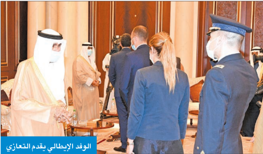
الوفد الإيطالي يقدم التعازي