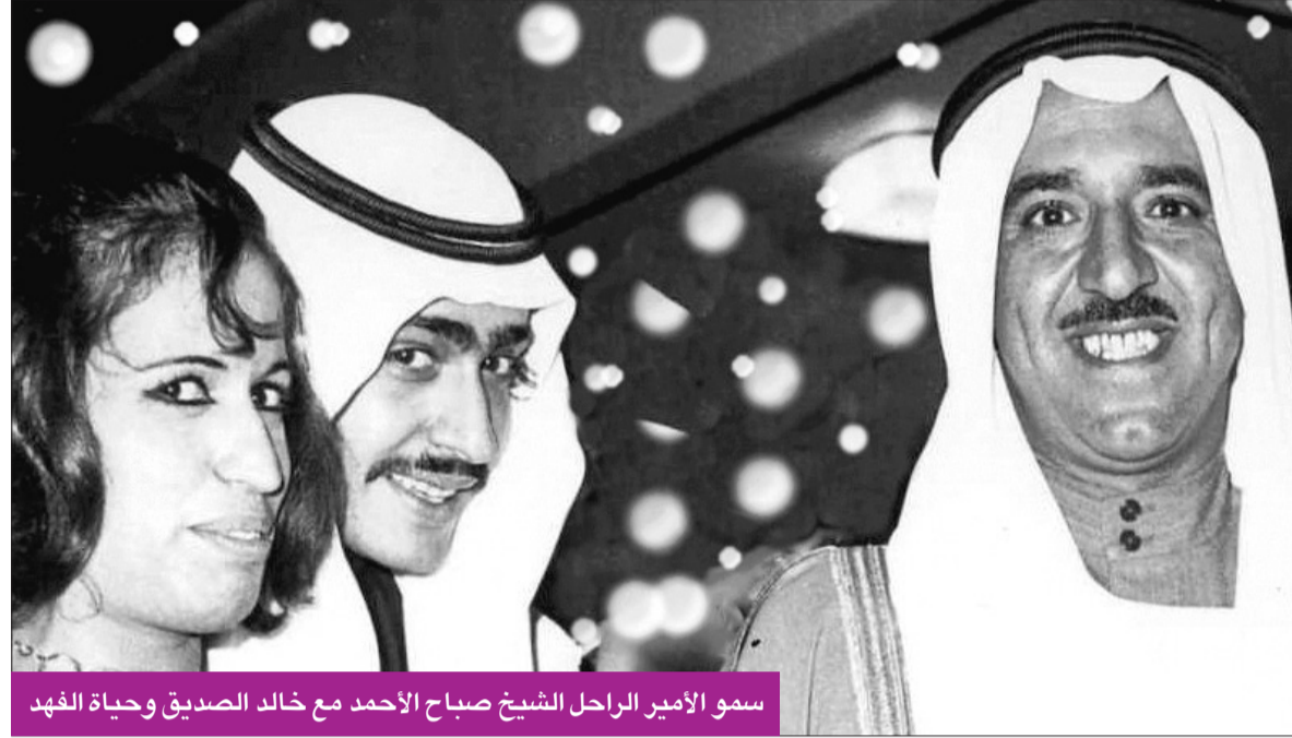
سمو الأمير الراحل الشيخ صباح الأحمد مع خالد الصديق وحياء الفهد

مع تولي حضرة صاحب السمو الأمير الشيخ نواف الأحمد مسند الإمارة، تفاعلت قطاعات عريضة في الكويت من المؤسسات الثقافية والفنية بازدهار الفنون في عصره، لكي تكون مرة للكويت الحديثة ونهضتها الشاملة، ومن هذه القطاعات القطاع السينمائي، حيث عدد نخبة من السينمائيين مطالبهم، ومنها إقامة أكاديمية سينمائية متخصصة لتخريج المواهب، وتعديل النسبة التي تتقاضها دور العرض السينمائية، ودعم المواهب الشبابية، وفتح المجال للمنتج الوطني لتقديم أفلام وثائقية وعدم قصرها على وزارة الإعلام، واستعادة الريادة من جديد، ومواكبة أحدث وسائل التكنولوجيا في العالم... إضافة إلى آراء أخرى في السطور التالية: