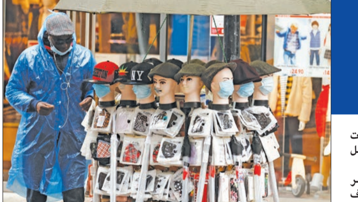
رجل يعرض كمادات للبيع في مدينة مانشستر البريطانية أمس

يبدو أن فيروس "كورونا" يشن هجوماً قاسياً على السياسيين الذين أعلن العشرات منهم في الأيام القليلة الماضية إصابتهم، يأتي ذلك مع تسارع عودة مدن العالم، واحدة تلو الأخرى، إلى "زمن القيود"، نتيجة الارتفاع الكبير في عدد الحالات، فيما بدا أن "الموجة الثانية" من الوباء التي قال الجميع إنها أتية لا محالة مع الإقفلونزا الموسمية قد انطلقت بقوة. في فرنسا، استدخل باريس ومنطقتها في حال تاهب قصوى اعتباراً من اليوم لمدة 15 يوماً. وأعلنت شرطة العاصمة الفرنسية أنه سيتم إغلاق الحانات في إطار سلسلة من القيود الجديدة. وفي تشيكا، دخلت حال الطوارئ