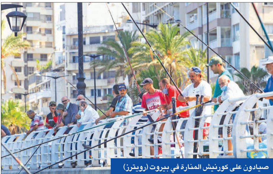
صيادون على كورنيش المنارة في بيروت

لاقي اتفاق الإطار الذي صدر من بيروت بالموافقة على مفاوضات ترسيم الحدود مع إسرائيل، لحسم الخلاف حولها، ترحيباً أميركياً وإسرائيلياً وأمياً، ما حمل أوساطاً دبلوماسية على طرح أسئلة حول مصير النزاع بين لبنان وإسرائيل والخرق الإسرائيلي شبه اليومي جواً وبحراً وبراً للسيادة اللبنانية.