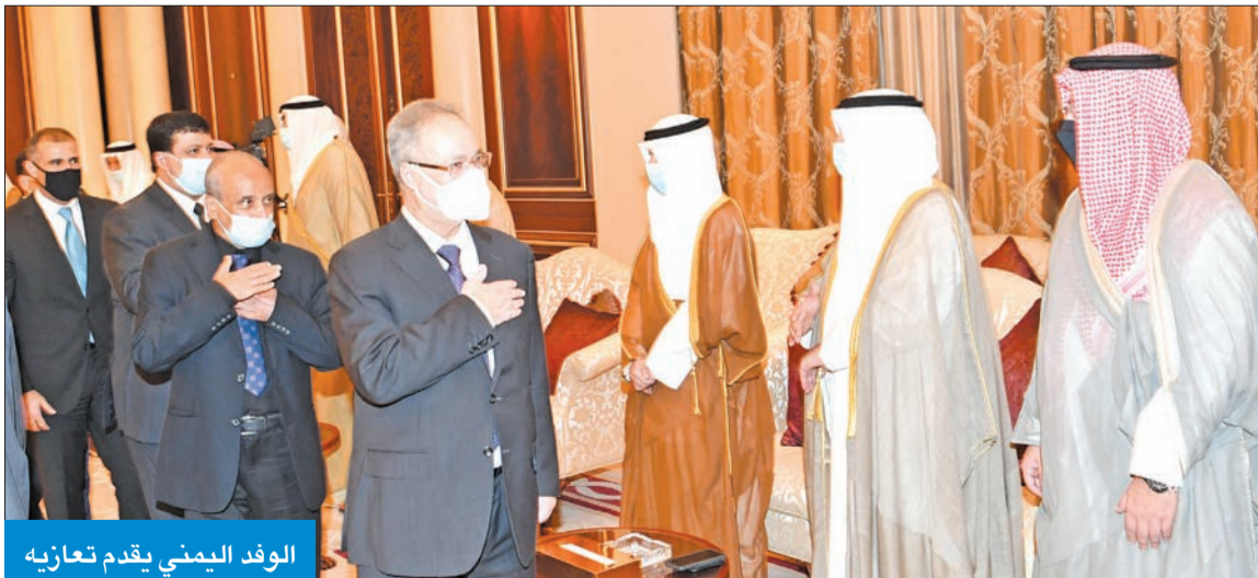
الوفد اليمني يقدم تعازيه