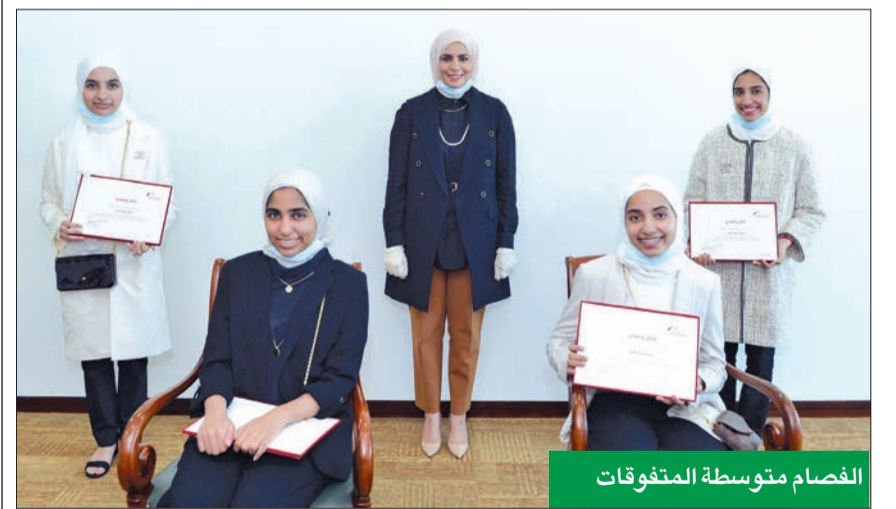
الفصام متوسطة المتفوقات

دائماً ما يفتخر بالإنجازات التي يحققها شباب الكويت من الكينسين، مشيراً إلى دعم البنك للشباب في مختلف المجالات والقطاعات، سواء في المجال التعليمي أو على مستوى المشاريع الصغيرة، إلى جانب منحهم فرصاً وظيفية مميزة في البنك.