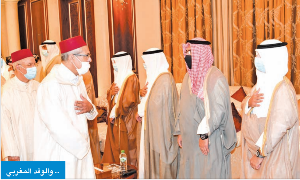
... والوفد المغربي

«الشورى» القطري كما استقبل سموه رئيس مجلس الشورى في قطر احمد بن عبد الله آل محمود واعضاء المجلس، حيث قدموا واجب العزاء في وفاة فقيد الوطن المغفور له بإذن الله تعالى صاحب السمو البلاد الراحل الشيخ صباح