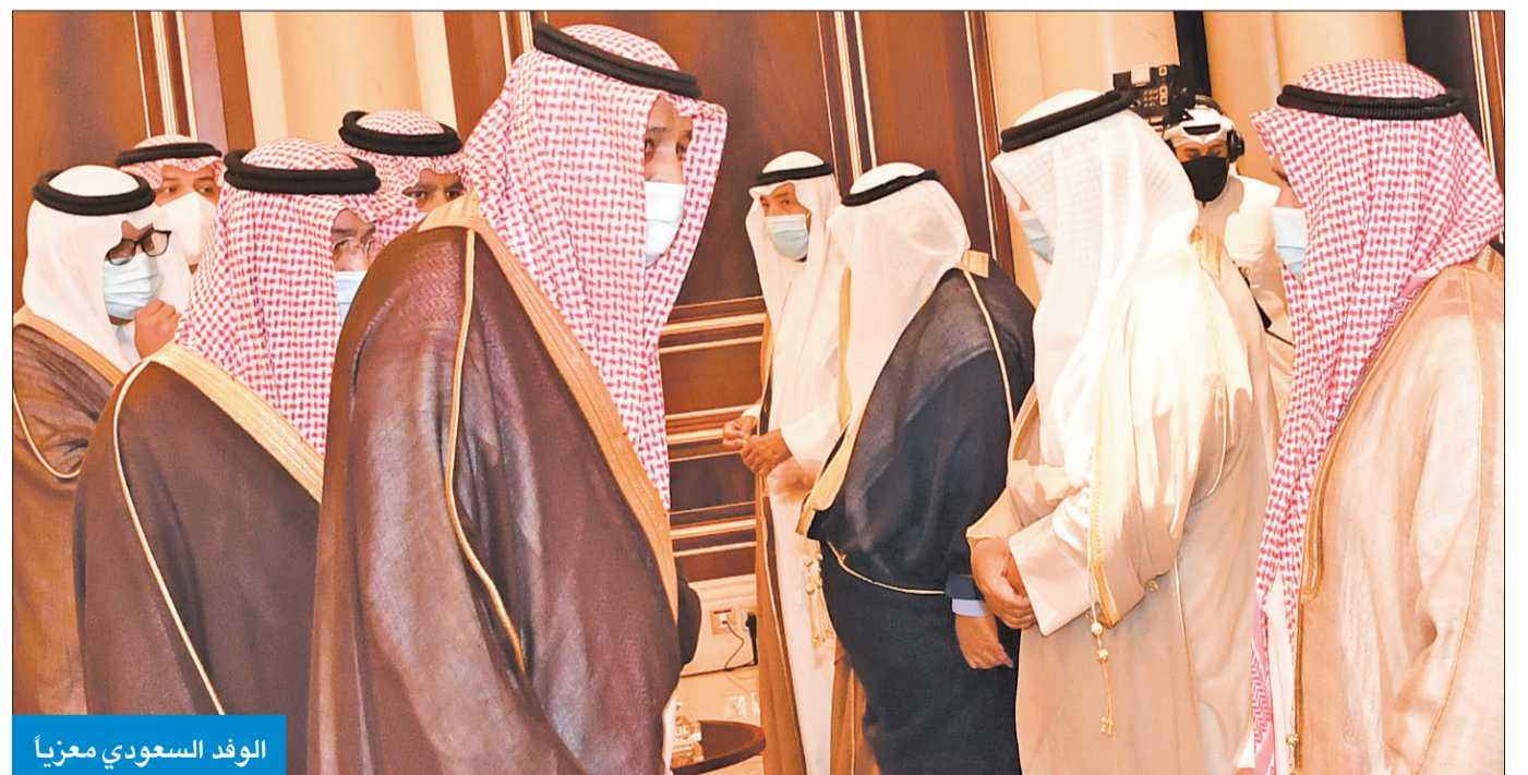
الوفد السعودي معزيا