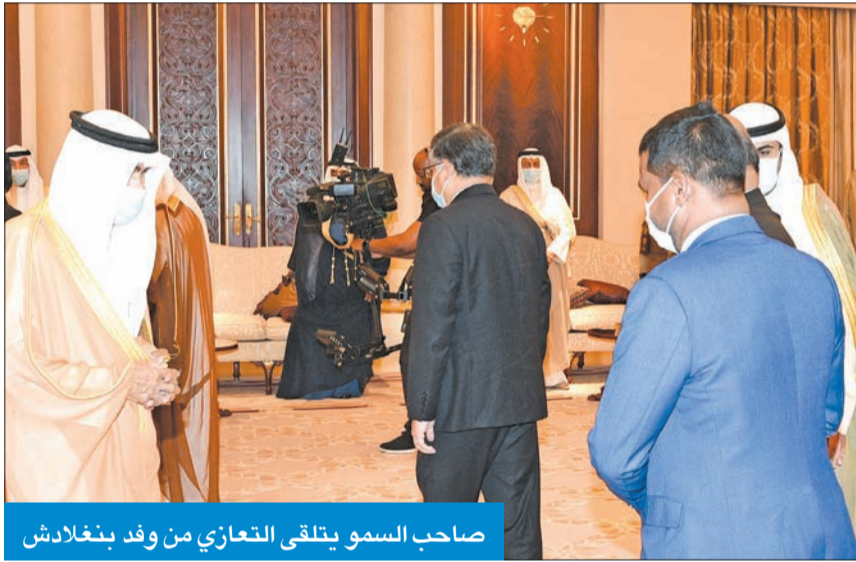
صاحب السمو يتلقى التعازي من وفد بنغلادش