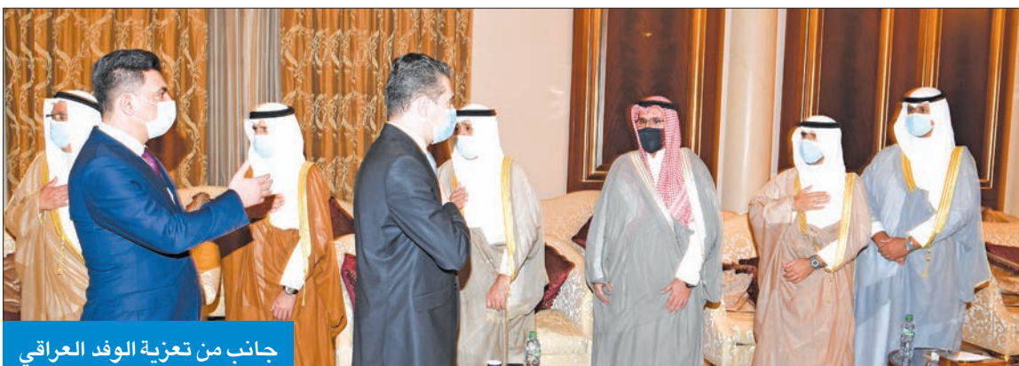
جانب من تعزية الوفد العراقي