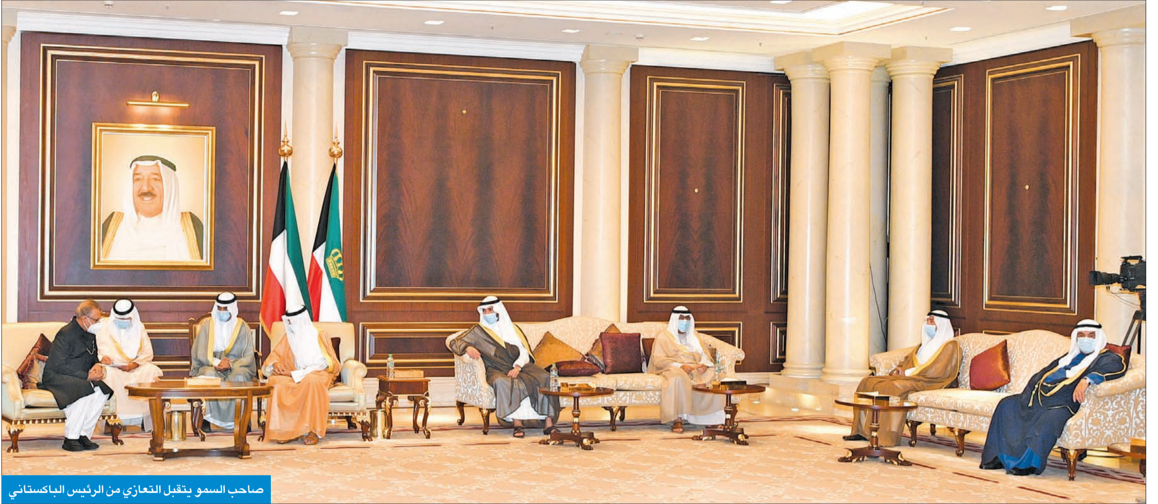
صاحب السمو يتقبل التعازي من الرئيس الباكستاني