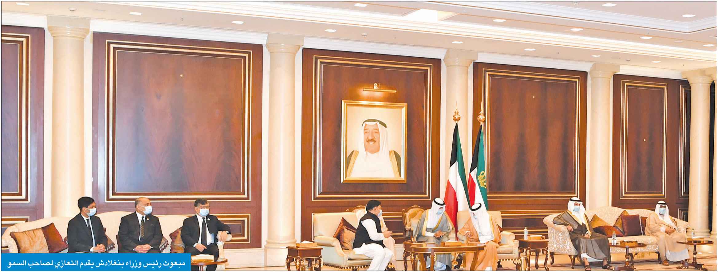
مبعوث رئيس وزراء بنغلادش يقدم التعازي لصاحب السمو