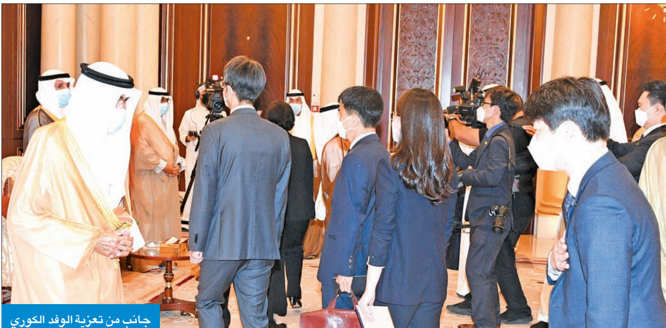
جانب من تعزية الوفد الكوري