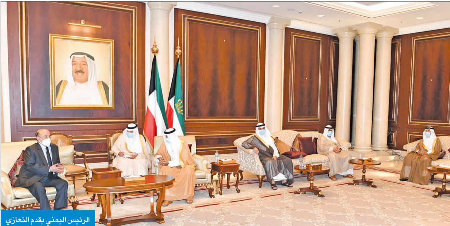
الرئيس اليمني يقدم التعازي