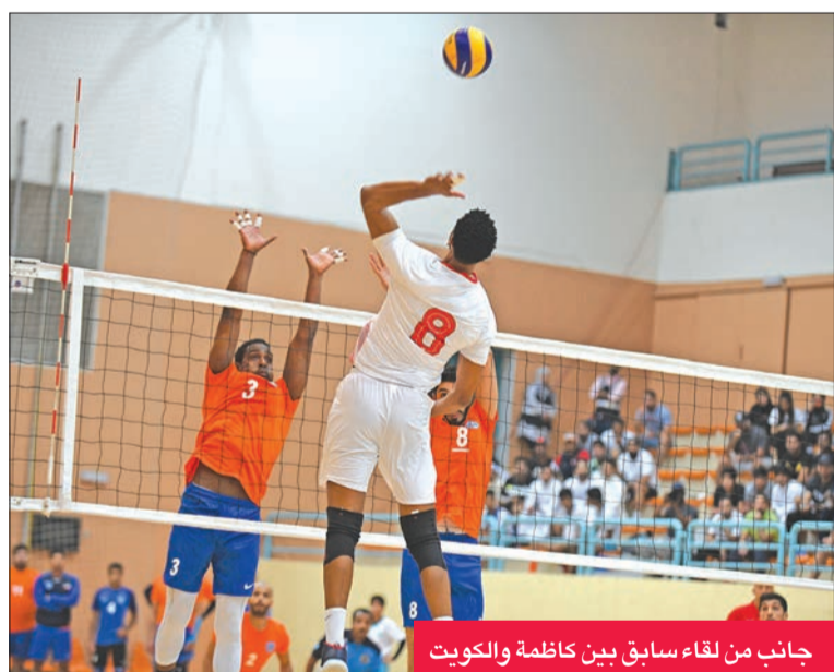
جانب من لقاء سابق بين كاظمة والكويت

يستضيف الفريق الأول للكرة الطائرة بنادي كاظمة نظيره الكويت على صالة يوسف شاهين الغانم، وذلك عند السادسة من مساء اليوم، في المباراة الختامية المؤجلة من الدور الأول لمنافسات الدوري الممتاز للكرة الطائرة.