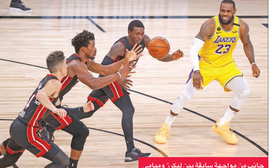
جانب من مواجهة سابقة بين ليكرز وميامي

بمستوى ميامي بغياب نجميه بام اديبايو والسولوفيني غوران دراغييتش عن المباراة الثانية والثالثة بعد إصابتهما في الأولى. وفي حين عاد الأول إلى المباراة الرابعة فإن الشكوك لا تزال تحيط بإمكانية خوض دراغييتش المباراة الخامسة.