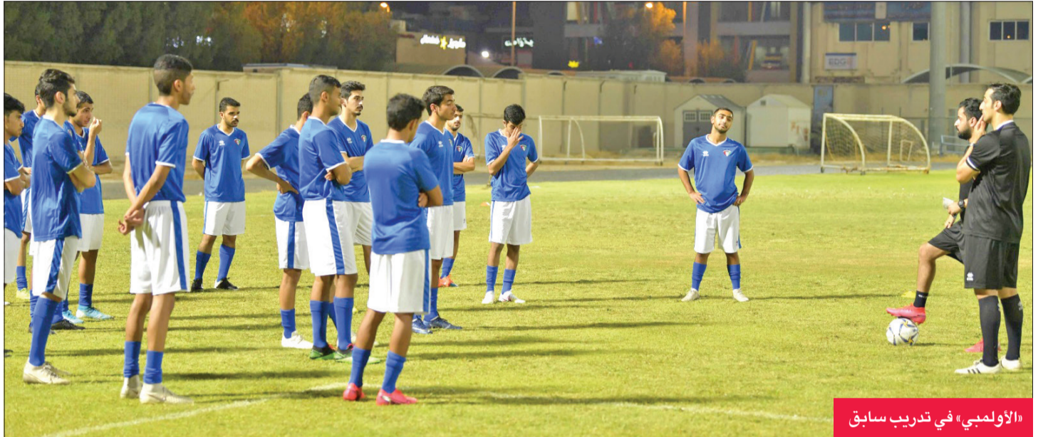
«الأولمبي» في تدريب سابق