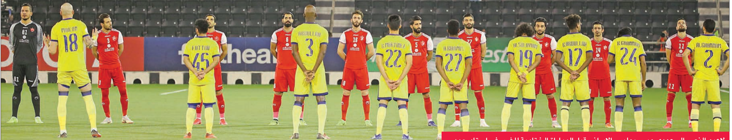
لاعب النصر السعودي وبرسبوليس الإيراني قبل المباراة الختامية للغرب في استاد حمد

بعد نجاح الدوحة في تنظيم استكمال منافسات «أبطال آسيا» لغرب القارة