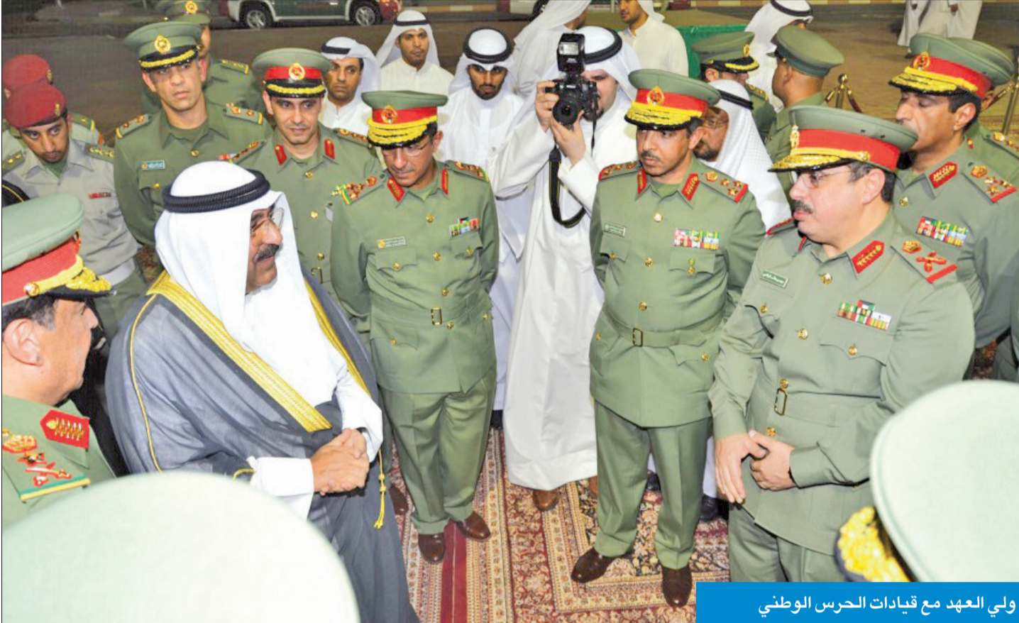
ولي العهد مع قيادات الحرس الوطني

«سموه يتمتع بحكمة وخبرة طويلة في الحفاظ على مقدرات البلاد وصيانة أمنها»