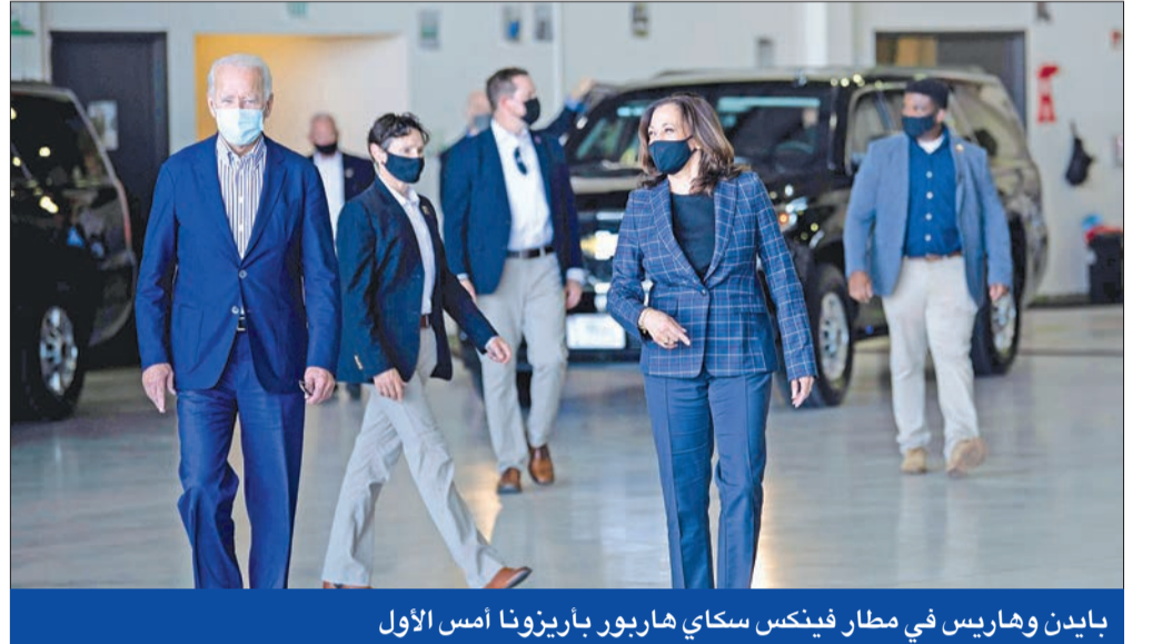
بايدن وهاريس في مطار فينكس سكاى هاربور باريزونا أمس الأول

الانتخابات، ووجهه ترامب، أمس الأول، انعقاد نادرة، لاثنين من أقرب مساعديه هما وزير الخارجية مايك بومييو والمدعي العام وزير العدل مساء الأريبعاء، وهو ما يفوق بكثير مناظرة عام 2016، التي شارك فيها السناتور تيم كين ضد بنس، الذي كان حاكم ولاية إلينوي في ذلك الوقت، ما يقدر بنحو 37.2 مليون مشاهد. ووضع العديد من مراقبي الانتخابات أهمية أكبر لمرشحي نائب الرئيس هذا العام، حيث كان الرئيس دونالد ترامب والمرشح الديمقراطي للرئاسة جو بايدن من بين أكبر المرشحين للرئاسة سنة في التاريخ حيث تبلغ أعمارهما 74 و 77 على التوالي.