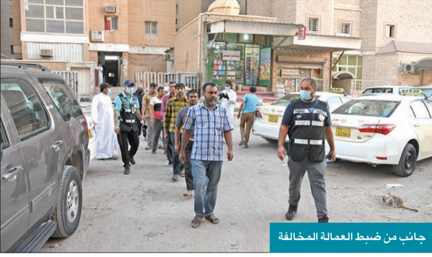
جانب من ضبط العمالة المخالفة

قطع التيار عن المباني المؤجرة لأنشطة غير مرخصة حتى إغلاقها نهائياً