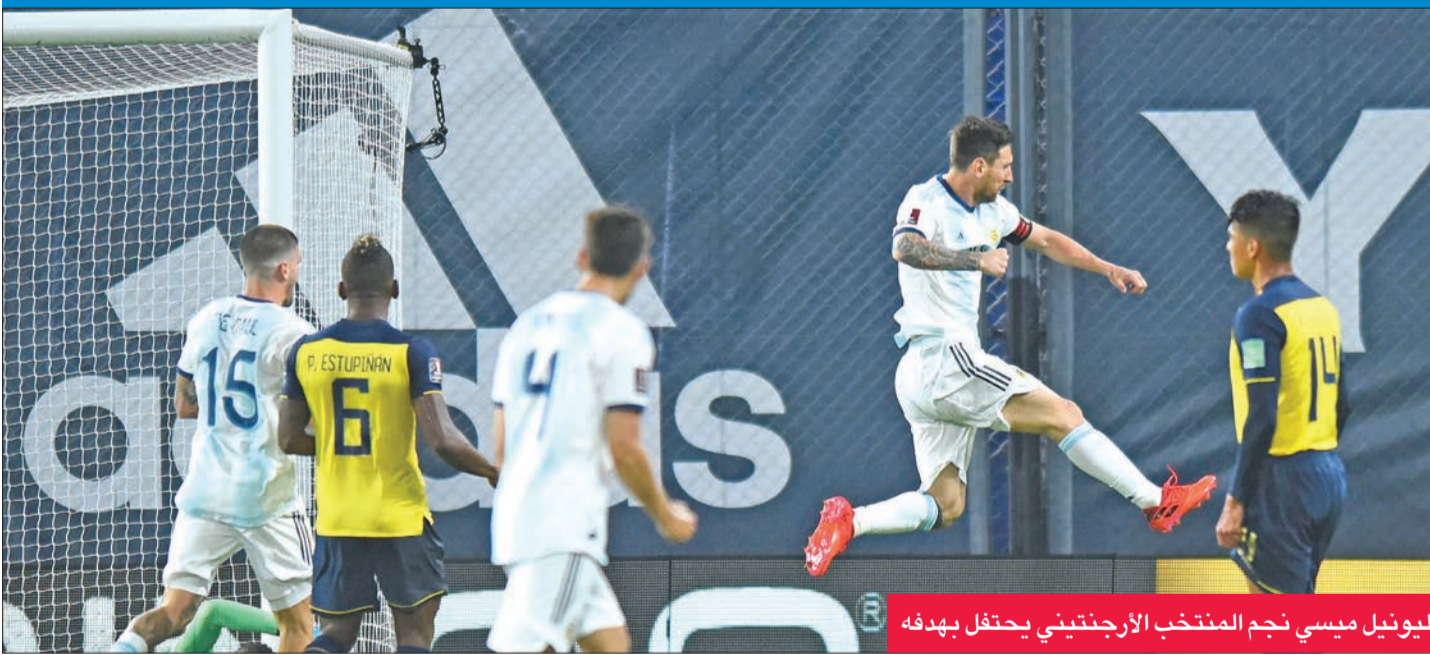
ليونيل ميسي نجم المنتخب الأرجنتيني يحتفل بهدفه

قاد كل من نجم الأرجنتيني ليونيل ميسي، وزميله السابق في برشلونة الأوروغوياني لويس سواريز، منتخبهما إلى الفوز على الإكوادور وتشيلي 1 - 0. وفي 2-1 تواليا، في مستهل مشوار تصفيات أميركا الجنوبية المؤهلة إلى مونديال قطر 2022.