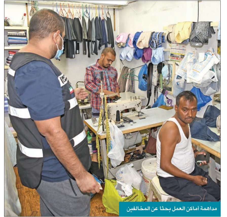
مداومة أماكن العمل بحثاً عن المخالفين

حين إغلاقها بصورة نهائية، لاسيما أن استمرار عملها بهذه الصورة البعيدة تماماً عن اشتراطات الأمان والسلامة، وغير مرخصة من الإدارة العامة للاطفاء ينذر بوقوع كوارث قد تؤدي بحياة مئات البشر، خصوصاً مع وجود ورش تصنيع الأخشاب (المناجر) في بعض سراديب البنائيات.