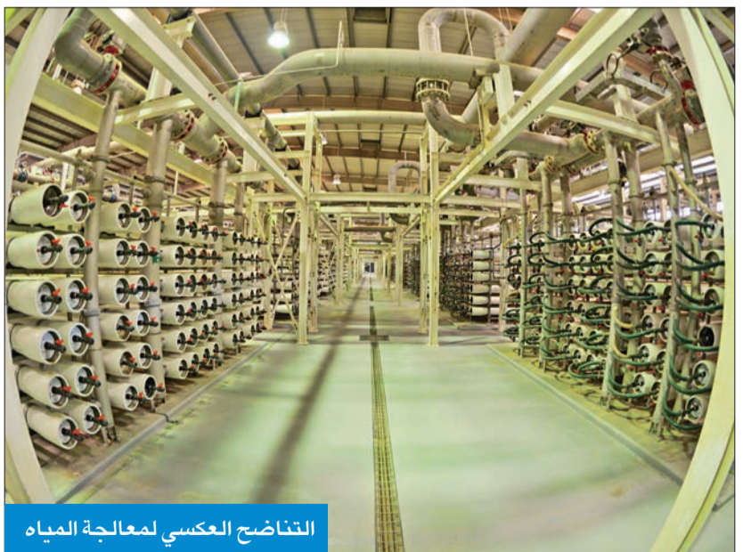
التناضح العكسي لمعالجة المياه

زيادة الإنتاج ليتوافق مع التعداد السكاني والتوسع العمراني