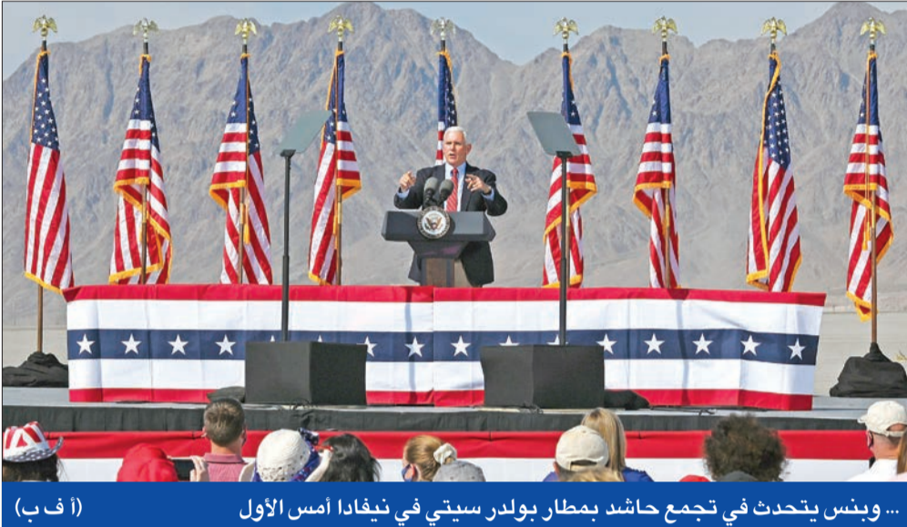
... وبنس يتحدث في تجمع حاشد بمطار بولدر سيتي في نيفاذا أمس الأول

حذر من تولي هاريس الرئاسة... وهاجم بومييو وبار بسبب بريد كلينتون والتدخل الروسي