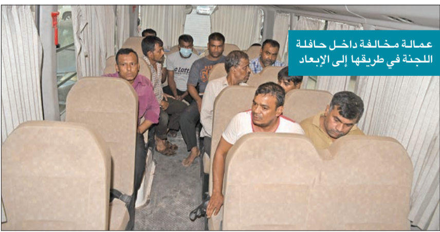
عمالة مخالفة داخل حافلة اللجنة في طريقها إلى الإبعاد

الظفيري، إنه «تم مخاطبة وزارة الكهرباء والماء التي قامت بقطع التيار الكهربائي