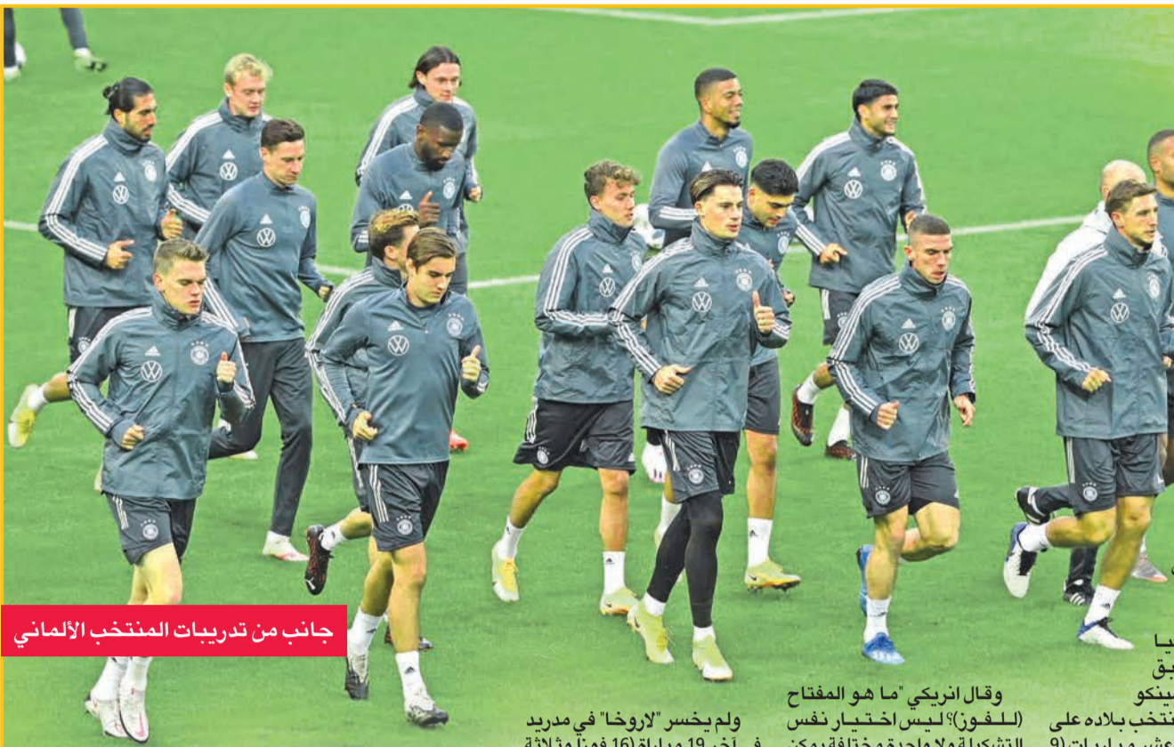
جانب من تدريبات المنتخب الألماني

وتملك جزر الفارو ست نقاط، ولاتفيا أربع نقاط، ونقطة لكل من مالطا وأندورا. ويتنافس منتخب ليشنتشتاين مع ضيفه جبل طارق على صدارة المجموعة الثانية التي تضم أيضا سان مارينو، لكنه لا يخوض التصفيات في هذه المرحلة، لأن المجموعة تضم ثلاثة منتخبات فقط. وحصد المنتخب الأولن ثلاث نقاط من مباراتهما الأولى بينما لا يملك سان مارينو أي نقطة.