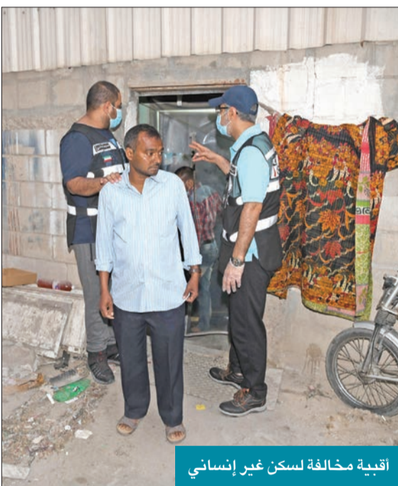
أقبية مخالفة لسكن غير إنساني

وبالعودة إلى الحملة، أوضح الظفيري، أنها أسفرت عن ضبط نحو 40 عاملاً مخالفاً لقانوني الإقامة والعمل موزعين بين القطاع الأهلي من حملة المادة (18) وعمالة منزلية من حملة المادة (20)، إضافة إلى عمالة التحاق بعائل مادة (22)، لافتاً إلى أن عمالة القطاع الأهلي يتم وقف ملف صاحب العمل المسجلة عليه هذه العمالة، وإمهارة بالرمز (73) إلى حين التأكد من إبعادها عن البلاد، ثم إعادة التفتيش عليه للتأكد من التزامه بتشغيل العمالة لديه، أما العمالة المنزلية المضبوطة فيتم مخاطبة «الداخلية» بشأنها، ممثلة في الإدارة العامة لمباحث شؤون الإقامة، لاتخاذ الإجراءات القانونية حيالها وبحق كفلائها.