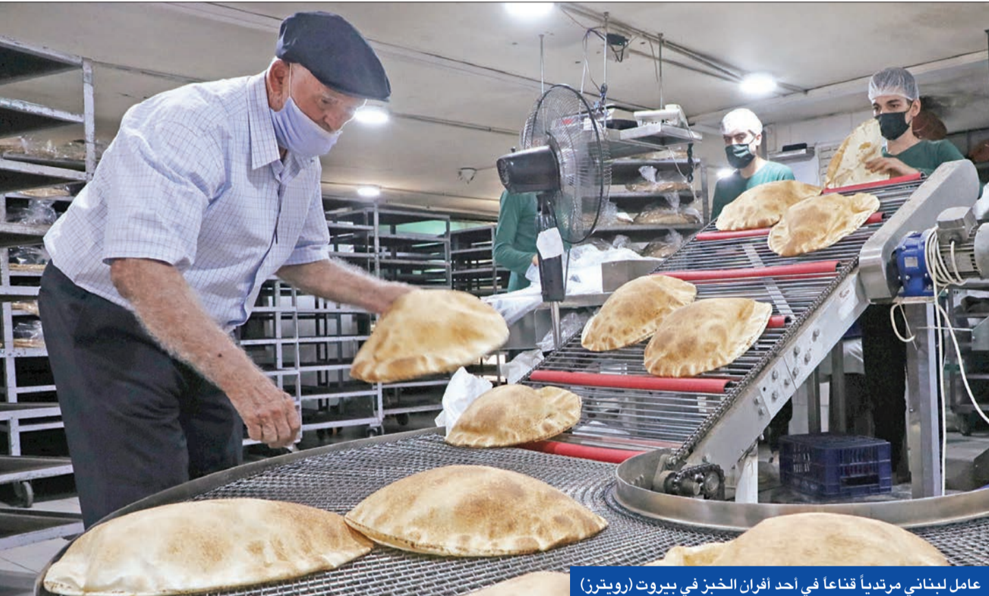
عامل لبناني مرتدياً قناعاً في أحد أفران الخبز في بيروت

وأضاف الحريري: «البعض يقول عن سعد الحريري ضعيف وقلبه طيب ويضحى، هل شاهدوا ما حصل في سورية. 85% من السوريين من الطائفة السننية، أين هم الآن؟ الاكيد انني لن أكون السبب بان يعاني اللبنانيون ما عاناه الشعب السوري».