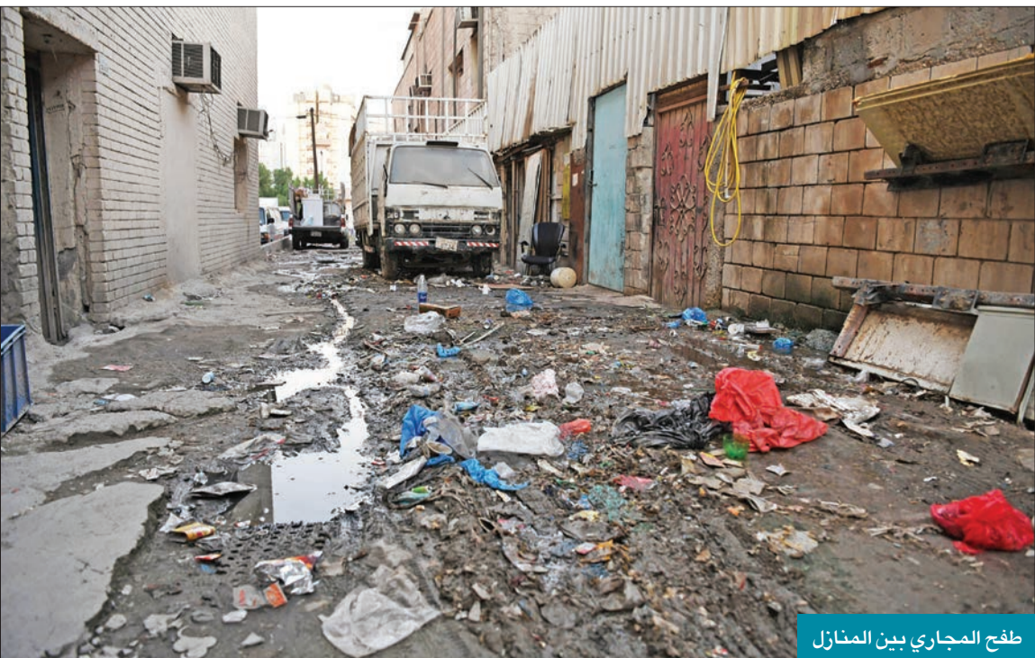
طغح المجاري بين المنازل