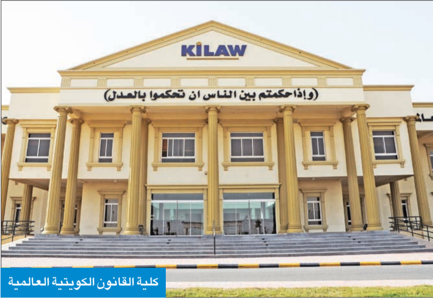
كلية القانون الكويتية العالمية

يُعد افتراضياً عبر برنامج «زوم» وسط مشاركة واهتمام واسعين من المختصين