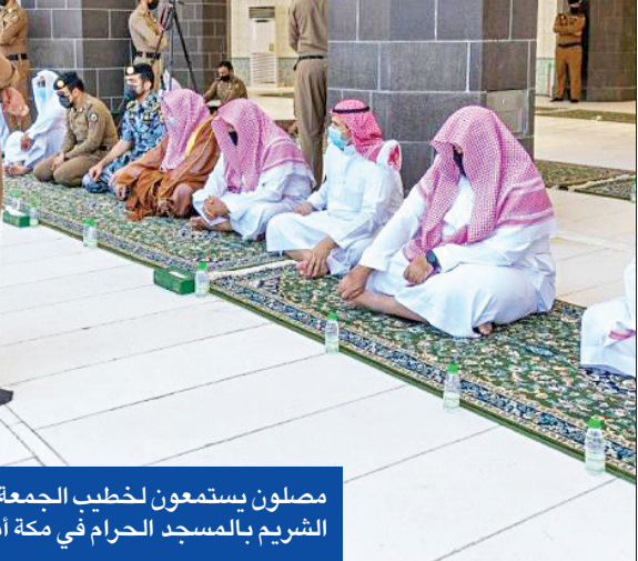
مصلون يستمعون لخطيب الجمعة الشيخ سعود الشريم بالمسجد الحرام في مكة أمس

قررت سلطنة عمان العودة إلى إجراءات الإغلاق الجزئي لمواجهة زيادة تفشي فيروس كورونا، أمس، لتكون بذلك أول دولة خليجية تقوم بذلك في مواجهة «الارتفاع الحادّ لأعداد المنومين في أجنحة المستشفيات وأسرة العناية في تاريخ القطاع الصحي بالسلطنة، وما ينتج عن هذا من وضع خطير يتجاوز قدرة المنظومة الصحية والعاملين فيها على التعامل مع هذه الجائحة وغيرها من الأمراض». وأكدت اللجنة أن الإجراءات الجديدة جاءت من أجل حماية جميع أفراد المجتمع، ولضمان قدرة القطاع الصحي على أداء مهامه.