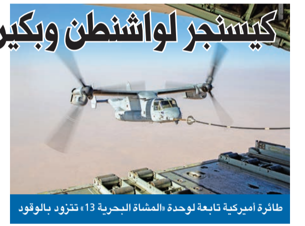
طائرة أميركية تابعة لوحدة «المشاة البحرية 13»، تتزود بالوقود

على وقع توترات جيوسياسية غير مسبوقه، حذر وزير الخارجية الأميركي الأسبق هنري كيسنجر، من احتمال نشوب حرب عالمية ثالثة، مشيراً إلى أن الولايات المتحدة والصين يجب أن تضعوا حدوداً للمواجهة، وإلا فإن العالم سيدج نفسه في