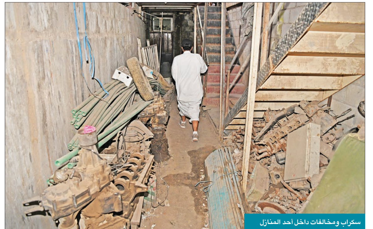
سكرب ومخالفات داخل أحد المنازل