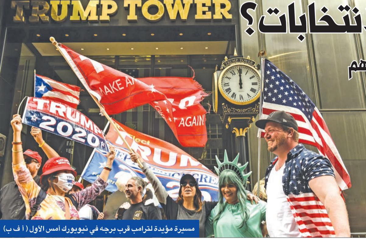
مسيرة مؤيدة لترامب قرب برجها في نيويورك أمس الأول

زيادة قياسية في الاقتراع المبكر: 9 ملايين اختاروا رئيسهم