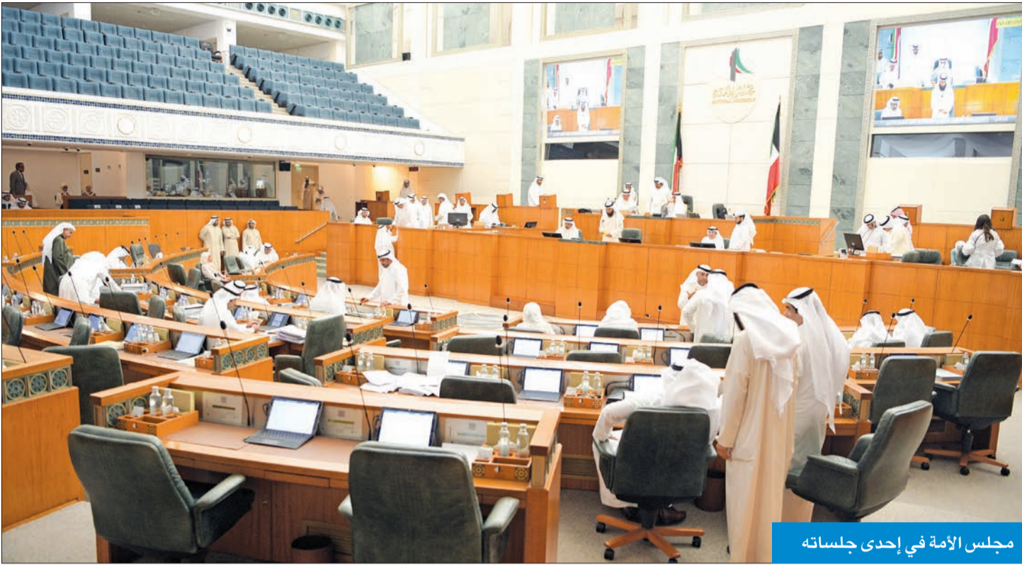
مجلس الأمة في إحدى جلساته

وكان وزير التربية وزير التعليم العالي د. سعود الحرابي أكثر الوزراء استجواباً بعدد ثلاثة استجوابات، يعقبه رئيس الحكومة الخالد بتقديم استجوابين له، ووزير الداخلية آنس الصالح باستجوابين أيضاً، ووزير المالية براك الشبتان باستجوابين كذلك. وهنا تجدر الإشارة إلى استقالة وزير الكهرباء والماء محمد بوشهري بعد صدور حكم قضائي بعد توليه حقيبة الوزارة، وتوليح نيابي وجه إليه باستجوابه، لتكون بذلك فقدت حكومة الخالد وزيرين جراء تقديمهما استقالتهما.