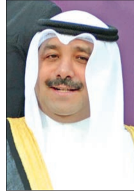
صباح ناصر الصباح

وأردف الناصر أن الشعب الكويتي بمعنونه الأصيل يواصل عطاءه الخيري بكل سخاء وإقدام في ظل النعم التي أنعم الله بها عليه من دون تمييز أو اجندات سياسية، اللهم إلا من منطلق الواجب الإنساني والأخلاقي وتعاليم ديننا الإسلامي الحنيف، مستطرداً: وفي ذلك دليل دامغ وبرهان ساطع على تجذر حب الخير وقيمة الإسلام السامية