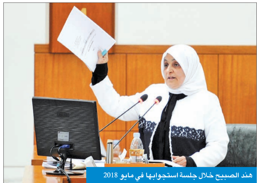
هند الصبيح خلال جلسة استجوابها في مايو 2018

رئيس المجلس مرزوق الغانم الطلب دون فتح باب النقاش أو التصويت بناء على موافقة المجلس.