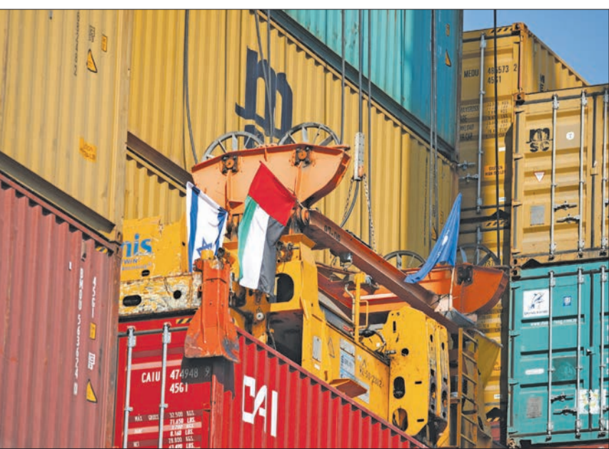
مستوعب عليه العمالان الإماراتي والإسرائيلي خلال إنزاله في مرافق حيفا أمس

في أول اتصال هاتفي علن بينهما منذ توقيع اتفاق السلام الإماراتي- الإسرائيلي، الهادف إلى تطبيع العلاقات، واقامة تعاون واسع بين البلدين سيبتم الماضي، أجرى ولي عهد أبوظبي محمد بن زايد ورئيس الوزراء الإسرائيلي بنيامين نتنياهو أول اتصال هاتفي بينهما أمس.