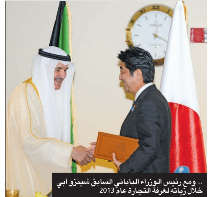
... ومع رئيس الوزراء الياباني السابق شينزو آبي خلال زيارته لغرفة التجارة عام 2013