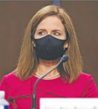
باريت خلال الجلسة أمس

القاضية المحافظة: السياسة ليست للمحاكم... وسأحكي ميولي الشخصية