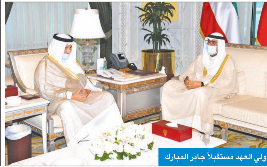
ولي العهد مستقبلاً جابر المبارك

استقبل رئيس مجلس الوزراء سمو الشيخ صباح الخالد، في قصر السيف، أمس، الأمين العام لمجلس التعاون لدول الخليج العربية الدكتور نايف الحجرف، بمناسبة زيارته للبلاد. حضر المقابلة مساعد وزير الخارجية لشؤون مجلس التعاون لدول الخليج العربية السفير ناصر المزين.