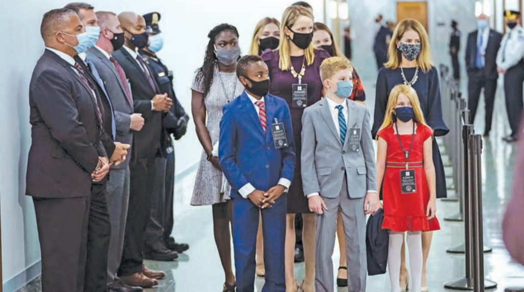
أبناء باريت السبعة وبينهم اثنان بالتبني يرافقون والدتهم إلى مقر الكونغرس أمس (أ ف ب)

جونسون بفيروس كورونا الذين عزلوا أنفسهم قبل 10 أيام. وقد يشارك لي وتيليس وهما عضوان في اللجنة القضائية، في جلسة الاستماع افتراضياً. لكن عليهم الحضور جميعاً شخصياً للتصويت خلال الجلسة العامة ما قد يطرح مشكلة سلامة صحية والدليل على تصميمهم على انتزاع هذا النصر قبل الاقتراع أعرب رون جونسون أنه مستعد للحضور بـ «ملابس رواد الفضاء» إذا لزم الأمر.