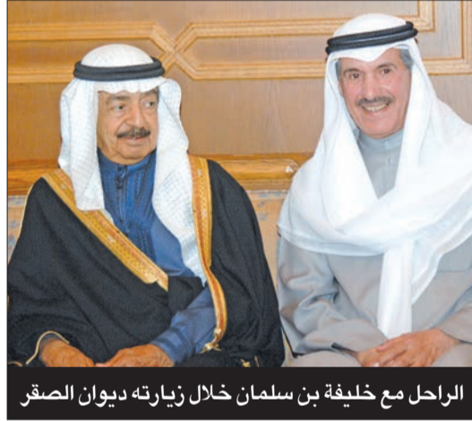
الراحل مع خليفة بن سلمان خلال زيارته ديوان الصقر