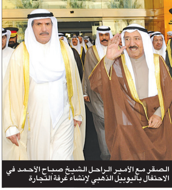
الصقر مع الأمير الراحل الشيخ صباح الأحمد في الاحتفال باليوبيل الذهبي لإنشاء غرفة التجارة والصناعة والزراعة العربية