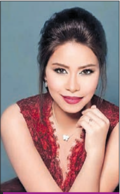
شيرين عبد الوهاب

تلقت الفنانة شيرين عبد الوهاب التهنئة، بمناسبة عيد ميلادها الـ 40، من العشرات من نجوم الفن والمشاهير، إلا أنها قررت توجيه الشكر لستة نجوم فقط، اعتبرتهم أصحابها الحقيقيين، وهم: الفنانة الإماراتية أحلام، والفنان ملحم زين، والنجمة مئة شلبي، والمطربة مي كساب، واللبنانية ميا دياب، والسورية أصالة. شيرين احتفلت بطريقة مميزة بعيد ميلادها، عبر حسابها بـ"تويتر"، واختارت ختام الاحتفال بتوجيه تغريدة شكر قالت فيها: "أشكر أخوايت وأصحابي الفنانين اللي عدوا عليا في عيد ميلادي. حقيقي انتوا بعم الصحاب، ويا رب دائماً موجودين في حياتي". وقامت شيرين بتوجيه رسالتها للنجوم الـ 6 وهو ما أثار انتباه متابعيها،