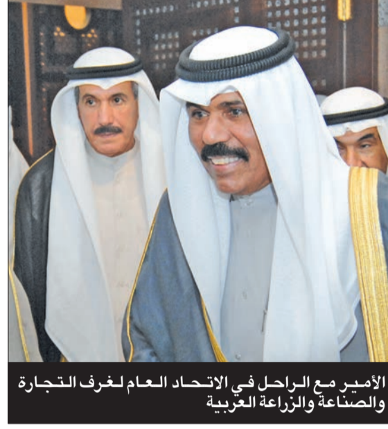
الأمير مع الراحل في الاتحاد العام لغرف التجارة والصناعة والزراعة العربية

الراحل انتمى إلى عائلة سياسية وتجارية «أباً عن جد» عُرفت بمواقفها الوطنية والجريئة