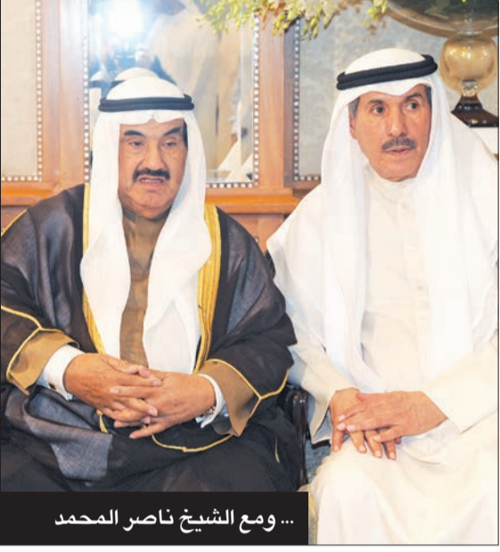
... ومع الشيخ ناصر المحمد

ودعت الكويت، أمس، أحد رجالها البارزين، وهو المرحوم خالد عبدالله الحمد الصقر، ومثلما عاش الراحل حياة الجبل المؤسس بكل تضحياته وكبريائه، فإنه عاصر كذلك عصر النهضة وبناء الدولة الحديثة في خمسينيات القرن الماضي.