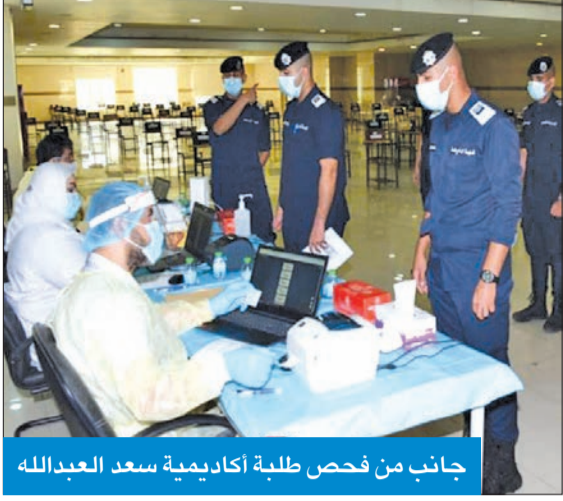
جانب من فحص طلبة أكاديمية سعد العبدالله

777 إصابة جديدة بـ «كوفيد - 19» و6 وفيات وشفاء 534 حالة