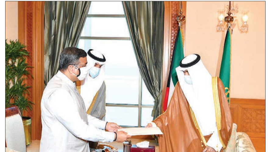
الأمير مستقبلاً وزير البترول الهندي أمس

التي حفلت بالعباءة، سائلا المولى جل وعلى أن يتغمده فقيد الوطن بواسع رحمته ومغفرته ويسكنه فسيح جناته.