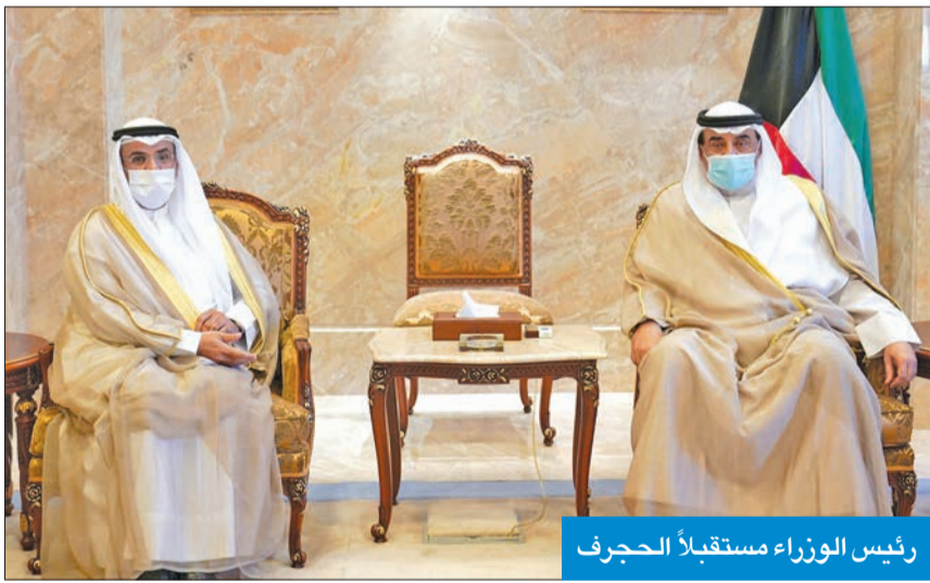
رئيس الوزراء مستقبلاً الحجرف

استقبل رئيس مجلس الوزراء سمو الشيخ صباح الخالد، في قصر السيف، أمس، الأمين العام لمجلس التعاون لدول الخليج العربية الدكتور نايف الحجرف، بمناسبة زيارته للبلاد. حضر المقابلة مساعد وزير الخارجية لشؤون مجلس التعاون لدول الخليج العربية السفير ناصر المزين.