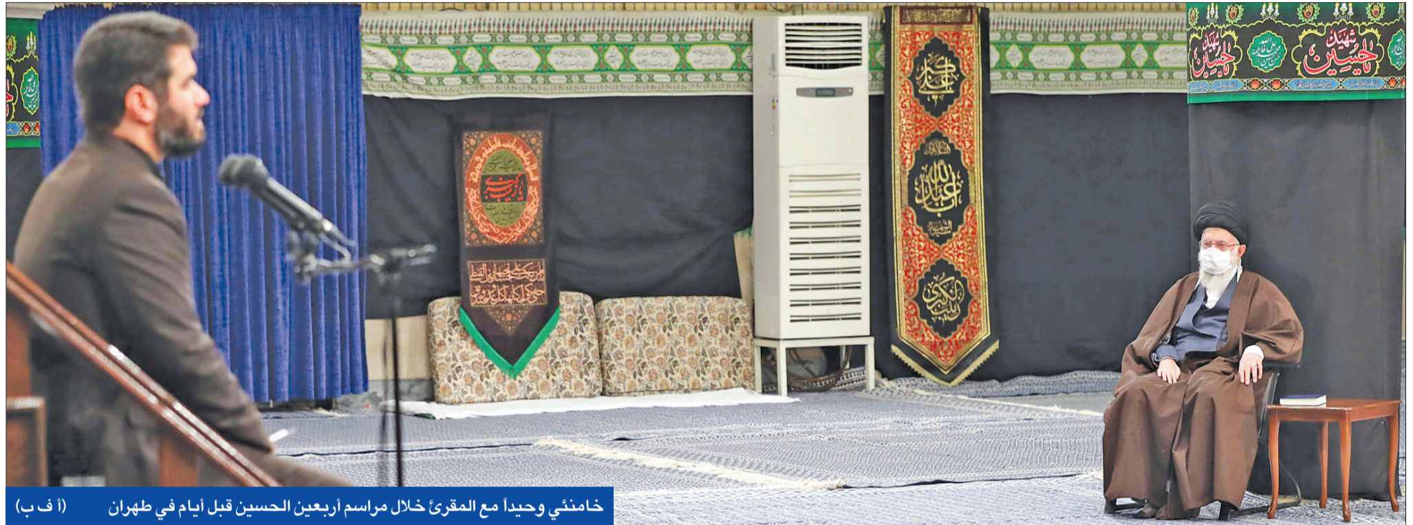
خامنئي وحيدا مع المقرئ خلال مراسم أربعين الحسين قبل أيام في طهران

• خلافات إيرانية - صينية دفعت ظريف لزيارة بكين • بوريطة: طهران هددت أمن المغرب