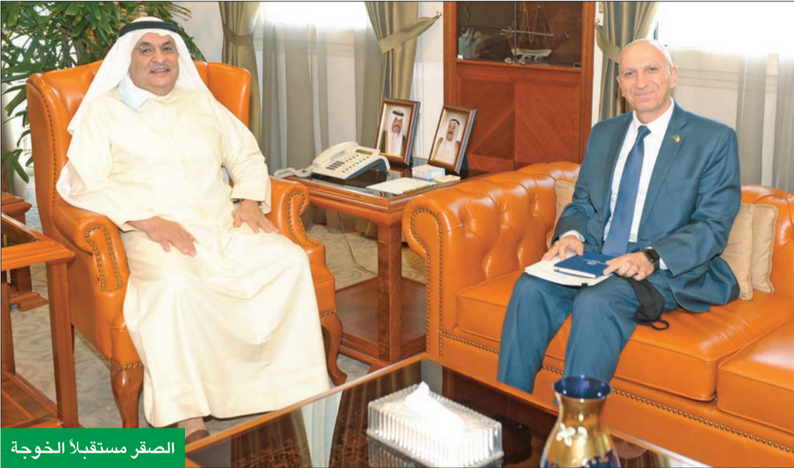
الصقر مستقبلاً الخوجة

رئيس غرفة التجارة التقى بمكتبه الممثل المقيم للبنك الدولي في الكويت ● الخوجة: قدمنا وثيقة إطار الشراكة الاستراتيجية الوطنية