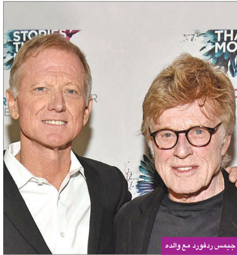
جيمس ردفورد مع والده

رغم مرور 4 سنوات على إعلانه اعتزاله، وتحديداً في عام 2016، فإن الممثل التركي محمد الأكورت، الشهير بشخصية "جودت أغا"، لا يزال محط اهتمام الكثيرين. وأعاد عدد كبير من المتابعين تداول صور جديدة له، نشرها هو في صفحته الخاصة بأحد مواقع التواصل الاجتماعي، أحدثت صدمة كبيرة لديهم، بسبب التغيير الكبير والواضح في شكله. وبدا الأكورت كأنه كبر فجأة في السن، حيث حلق شعره تماماً وأطال لحيته، وهذا التغيير دفع كثيرين إلى التساؤل عما إذا كان الرجل الظاهر في الصورة هو الممثل نفسه. يُشار إلى أن الأكورت قرّر الاستقرار في البرازيل بعد اعتزاله، وأخبر معارفه وأصدقاءه وكل من يسأله عن عودته في عمل جديد، سواء أكان تلفزيونياً أم سينمائياً، بأنه اعتزل التمثيل وابتعد عن الساحة الفنية.