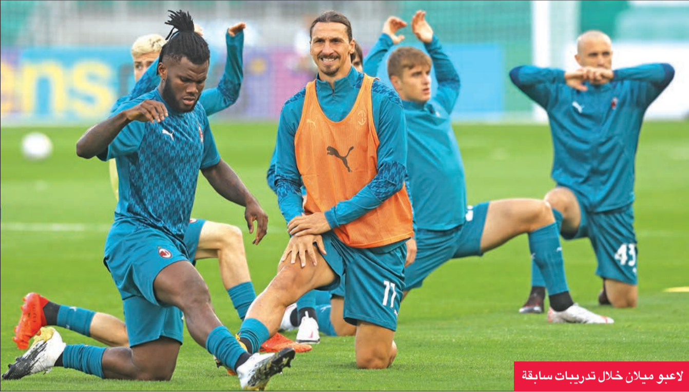
لاعبو ميلان خلال تدريبات سابقة

يستهل ميلان الإيطالي مشواره في بطولة الدوري الأوروبي لكرة القدم اليوم، عندما يحل ضيفا على سلاتيك الاسكتلندي. تنتقل اليوم منافسات الموسم الجديد من الدوري الأوروبي لكرة القدم (يوروبا ليغ) بعد نحو شهرين على نهاية الموسم السابق الماراثوني الذي عكّره فيروس كورونا، حيث يبرز في الواجهة لقاء قمة بين ميلان الإيطالي ومضيفه سلتيك الاسكتلندي، فيما تبدأ الأندية الإسبانية والإنكليزية مشوارها بمباريات سهلة. تجمع المباراة بين ميلان و سلتيك في الجولة الاولى من المجموعة الثامنة، وهما فريقان من المفترض أن يلتقيا في ظروف طبيعية في المسابقة القارية الإهم دوري أبطال أوروبا، التي توج الفريق الإيطالي بلقبها في سبع مناسبات فيما رفع نظيره الاسكتلندي كأسها مرة واحدة في العام 1967. وسيعول ميلان على نجمه المتألق والمخضرم السويدي زلاتان إبراهيموفتش لقيادته الى الفوز، عتفا على الأداء المميز التي يقدمه منذ وصوله الى ملعب "سان سيرو" لفترة ثائية في يناير الفائت. ويدخل "الروسونيري" المباراة بمعنويات عالية بعد أن حسم ديربي ميلانو على حساب جاره وغريمه