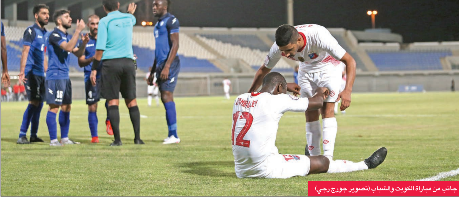
جانب من مباراة الكويت والشباب