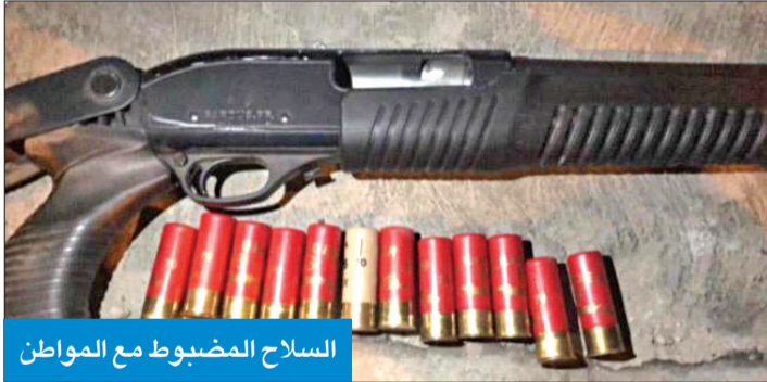
السلاح المضبوط مع المواطن

المتهم من أرباب السوابق وأطلق النار عشوائياً داخل المنزل