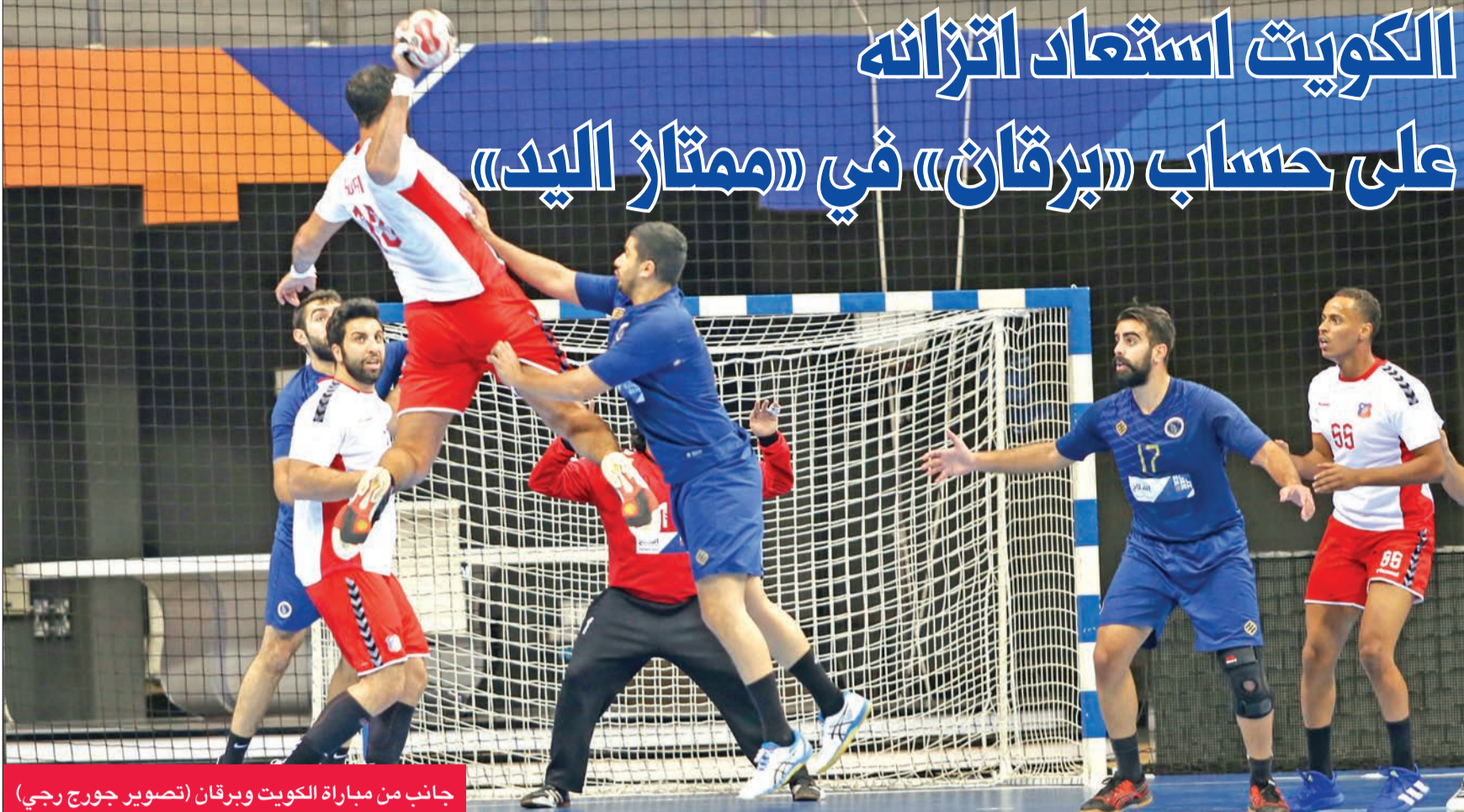
جانب من مباراة الكويت وبرقان