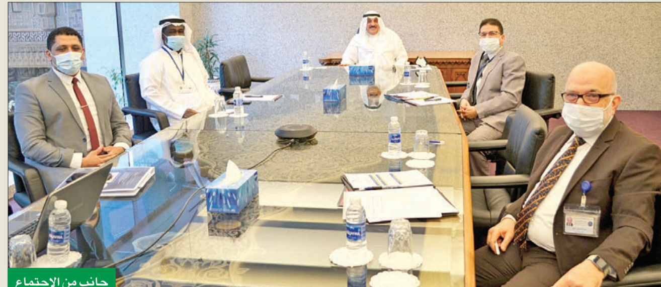
جانب من الاجتماع

عقدت الاجتماع التاسع عشر للخبراء عبر تقنية الاتصال المرئي «Zoom»