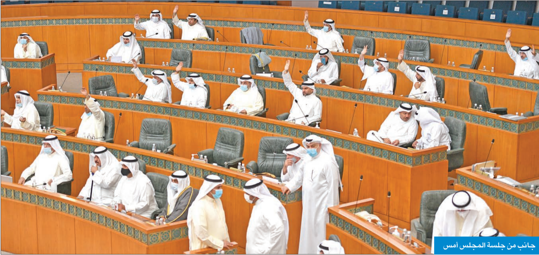
جانب من جلسة المجلس أمس