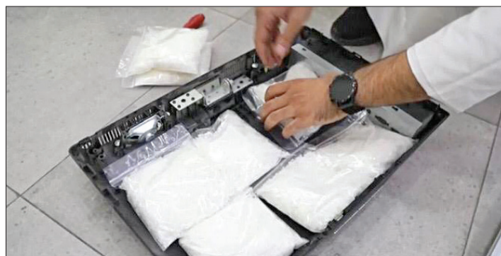
مادة الشبو المضبوطة مع المتهمين

وذكر المصدر أن المتهمين اعترفا أيضاً بانهما هربا المخدرات بمساعدة من هم ثالث متوار عن الانظار عن طريق إخفاها داخل أجهزة كهربائية استوردتها من إحدى الدول الآسيوية، لافتاً إلى أن رجال المكافحة حددوا اسم المتهم الثالث وتم وضع اسمه ضمن قوائم المطلوبين تمهيدا لإلقاء القبض عليه.