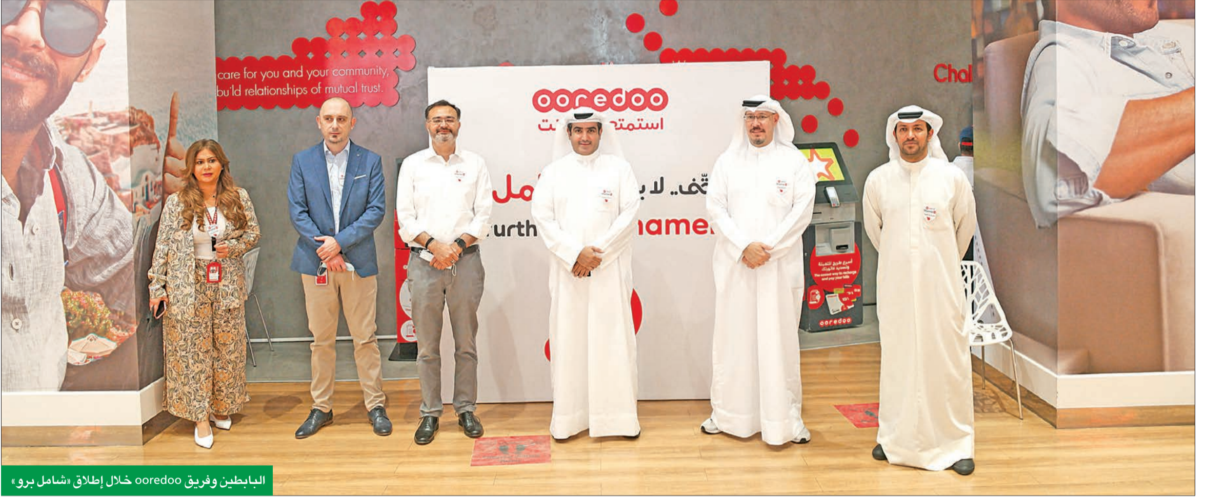
البابطين وفريق Ooredoo خلال إطلاق «شامل برو»

المنتج يخلق تجربة استثنائية للعملاء ويمكنهم من الاستمتاع بالميزات غير المحدودة بدءاً من اليوم