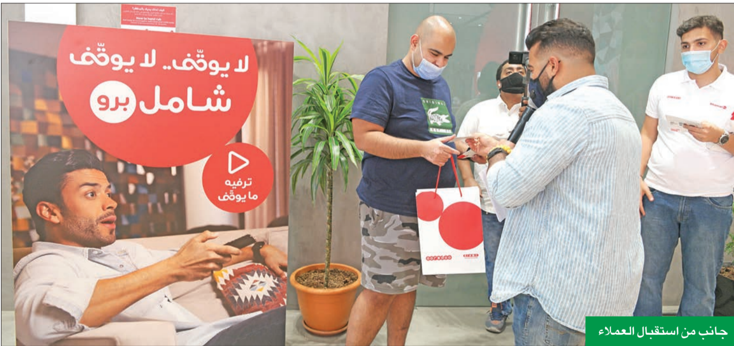
جانب من استقبال العملاء