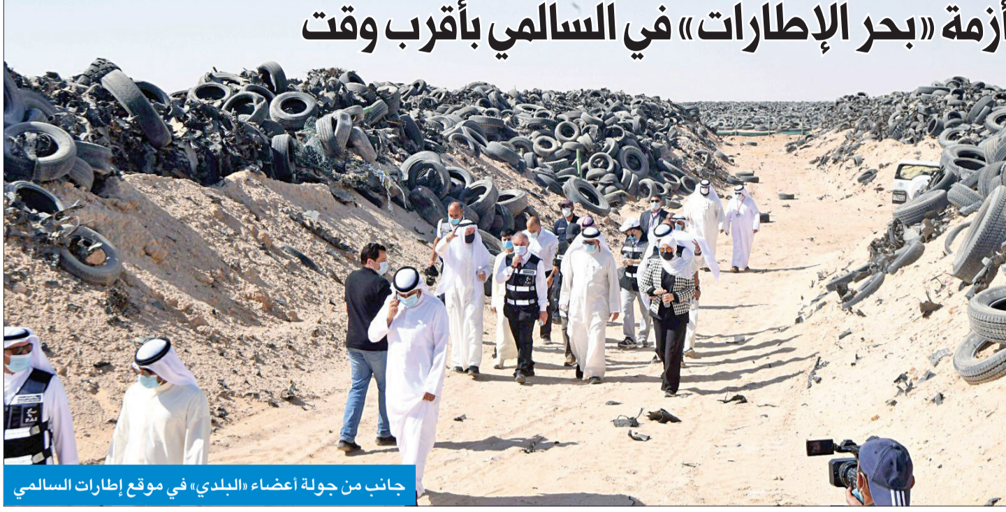
جانب من جولة أعضاء «البلدي» في موقع إطارات السالمي

أعضاء المجلس شدوا على ضرورة حل أزمة «بحر الإطارات» في السالمي بأقرب وقت