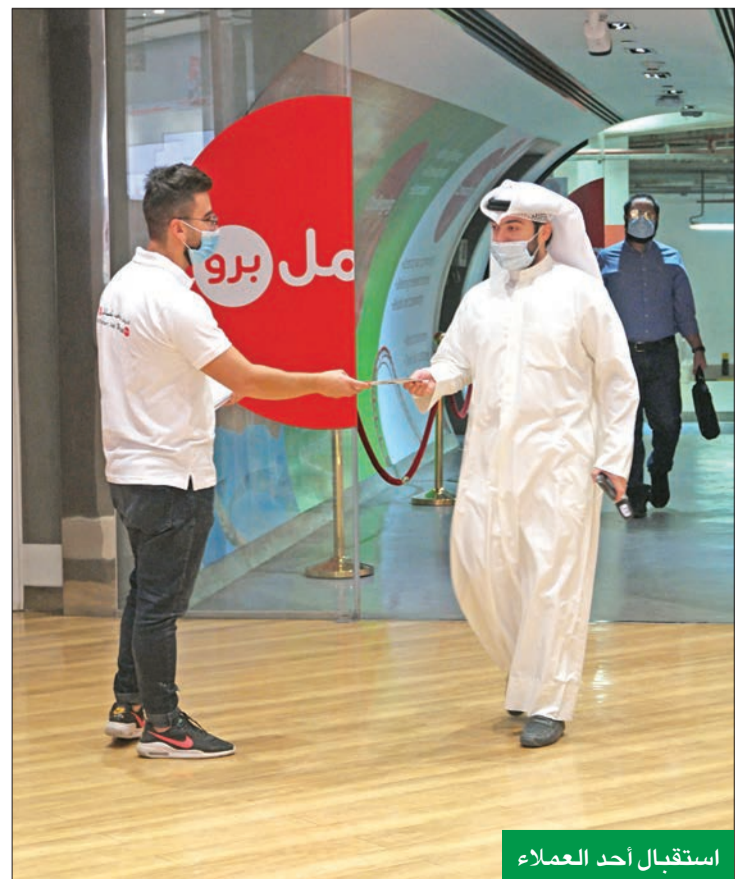
استقبال أحد العملاء