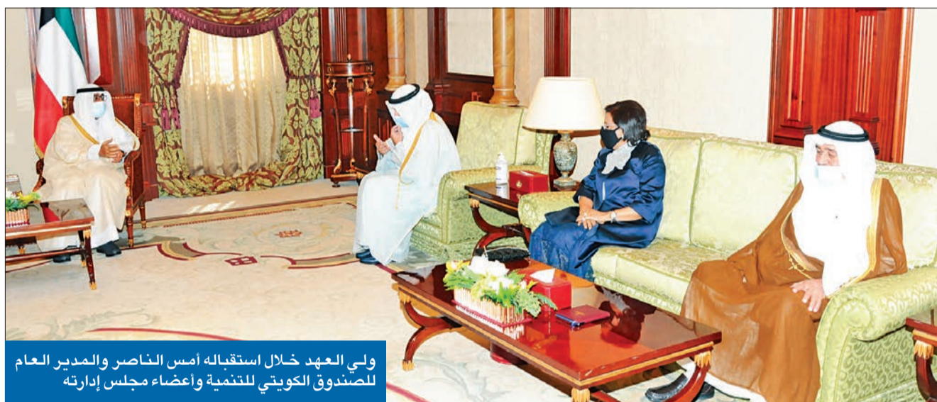
ولي العهد خلال استقباله امس الناصر والمدير العام للصندوق الكويتي للتنمية وأعضاء مجلس إدارته

سموه أشاد لدى استقباله «الكويتي للتنمية» بدعم الصندوق الاقتصادي لدول العالم «إسهاماته كبيرة في إعانة البلدان النامية واستجابته لتداعيات كورونا جاءت سريعة»