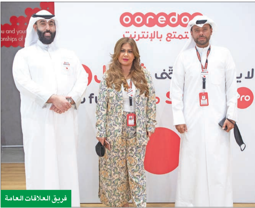
فريق العلاقات العامة

إلى جانب الأنشطة الترفيهية التي أقيمت، أظهرت الفعالية التزام Ooredoo وقدرتها على الوفاء بوعد العلامة التجارية والمتمثل في إثراء تجربة الأفراد الرقمية. وتواصل Ooredoo ابتكار منتجاتها وخدماتها وتحسينها بناءً على متطلبات العملاء المتغيرة، وتقديم خدمات مخصصة عبر الإنترنت.