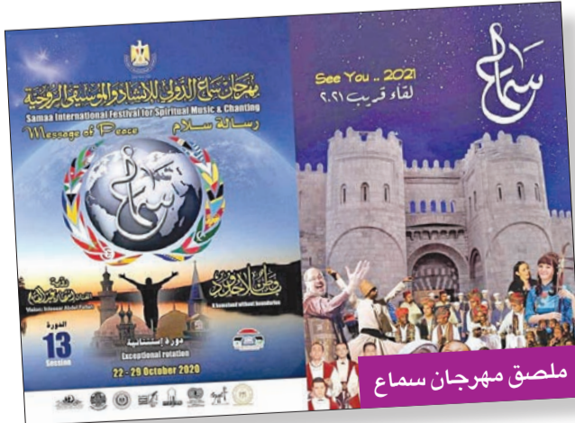
ملصق مهرجان سماع