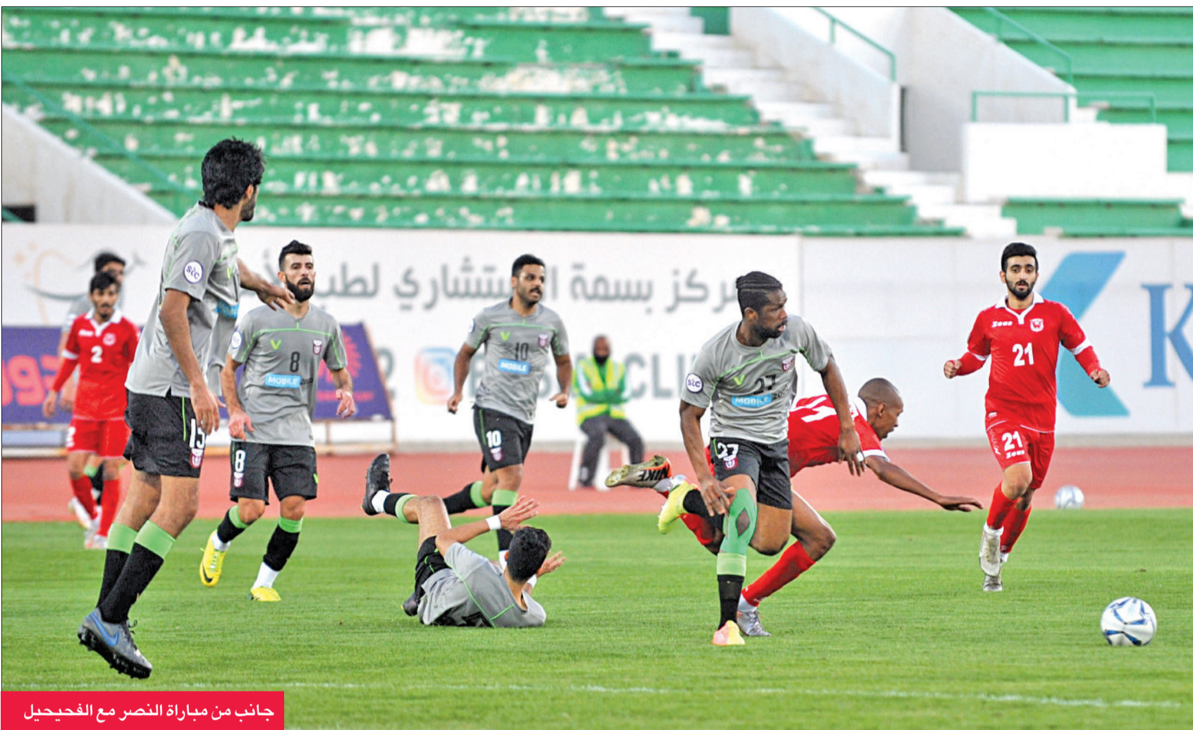
جانب من مباراة النصر مع الفحيحيل