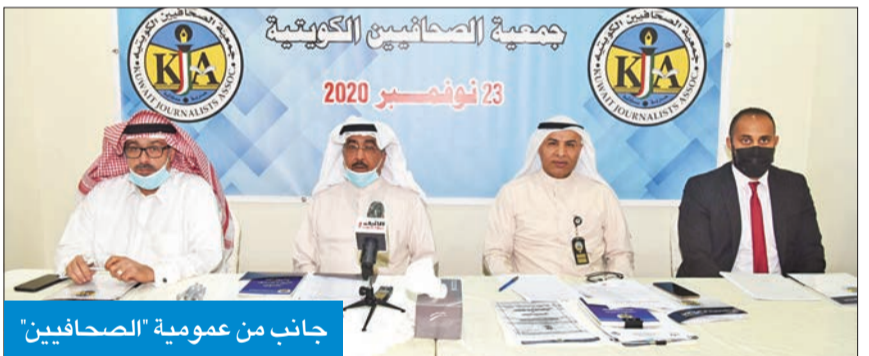
جانب من عمومية «الصحافيين»