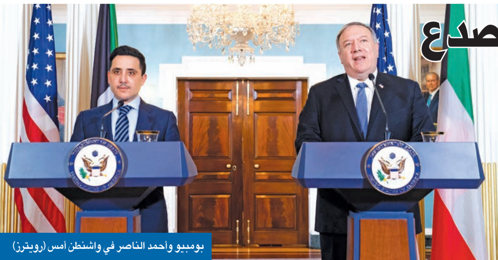
بومبيو وأحمد الناصر في واشنطن أمس

اختتم وزير الخارجية وزير الإعلام بالوكالة الشيخ د. أحمد الناصر مع نظيره الأميركي مايك بومبيو أمس، الجولة الرابعة من الحوار الاستراتيجي بين الكويت والولايات المتحدة، بتوقيع عدد من الاتفاقيات، واستعراض التقدم الذي أحرز خلال الأسبوعين الماضيين في مجموعات العمل الافتراضية. وفي مؤتمر صحفي مشترك في واشنطن، أكد بومبيو، أن بلاده لديها علاقات قوية وتاريخية مع الكويت، وعملت معها على مواجهة التحديات. وأعرب بومبيو عن شكره للكويت، لـ «العمل الذي تقوم به لدعم جهودنا في مكافحة الإرهاب»، وفي حملة الضغوط القصوى ضد 02