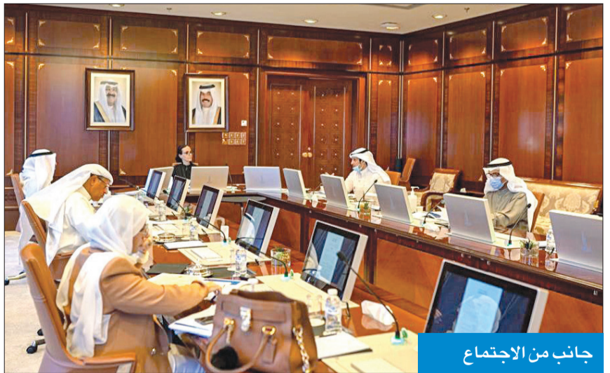
جانب من الاجتماع

خدمة المجتمع، وتنمية الذات في إطار علمي تراكمي. وأضافت أن مشروع الاستراتيجية الوطنية للعمل التطوعي بالكويت يعتمد على منهجية عمل شمولية وتكاملية، بهدف توحيد الجهود، وتعزيز الاستفادة، وتنظيم العمل التطوعي. وأشارت إلى أن هذه الاستراتيجية تعد الأولى من نوعها على مستوى دول مجلس التعاون الخليجي، وستركز على إشراك جميع جهات الدولة والقطاعات الأهلية والخاص ذات الصلة بالعمل التطوعي لتنميته