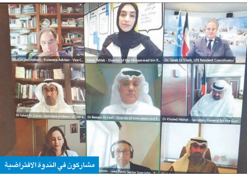
مشاركون في الندوة الافتراضية

النموذج الجديد المبني على تحسين التعليم، والتدريب القوي بين الأوساط الأكاديمية والقطاع العام والخاص.