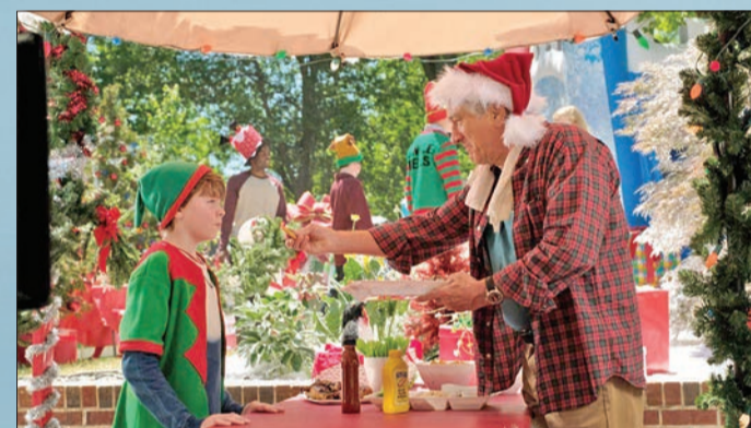
روبرت دي نيرو في مشهد من فيلم 'The War With Grandpa'

خيمت جائحة كورونا على إيرادات أفلام كبار نجوم السينما العالمية، ومنهم روبرت دي نيرو، وليام نيسون الذي حقق كل منهما 25 مليون دولار فقط في الوقت نفسه الذي استطاع فيه فيلم The Eight Hundred تحقيق أعلى إيرادات بالسينما حول العالم في ظل الجائحة، حاصدا 500 مليون. وحقق فيلم الكوميديا The War With Grandpa للنجم العالمي روبرت دي نيرو بدور العرض السينمائي حول العالم حوالي 25 مليون دولار. الفيلم تدور أحداثه حول علاقة