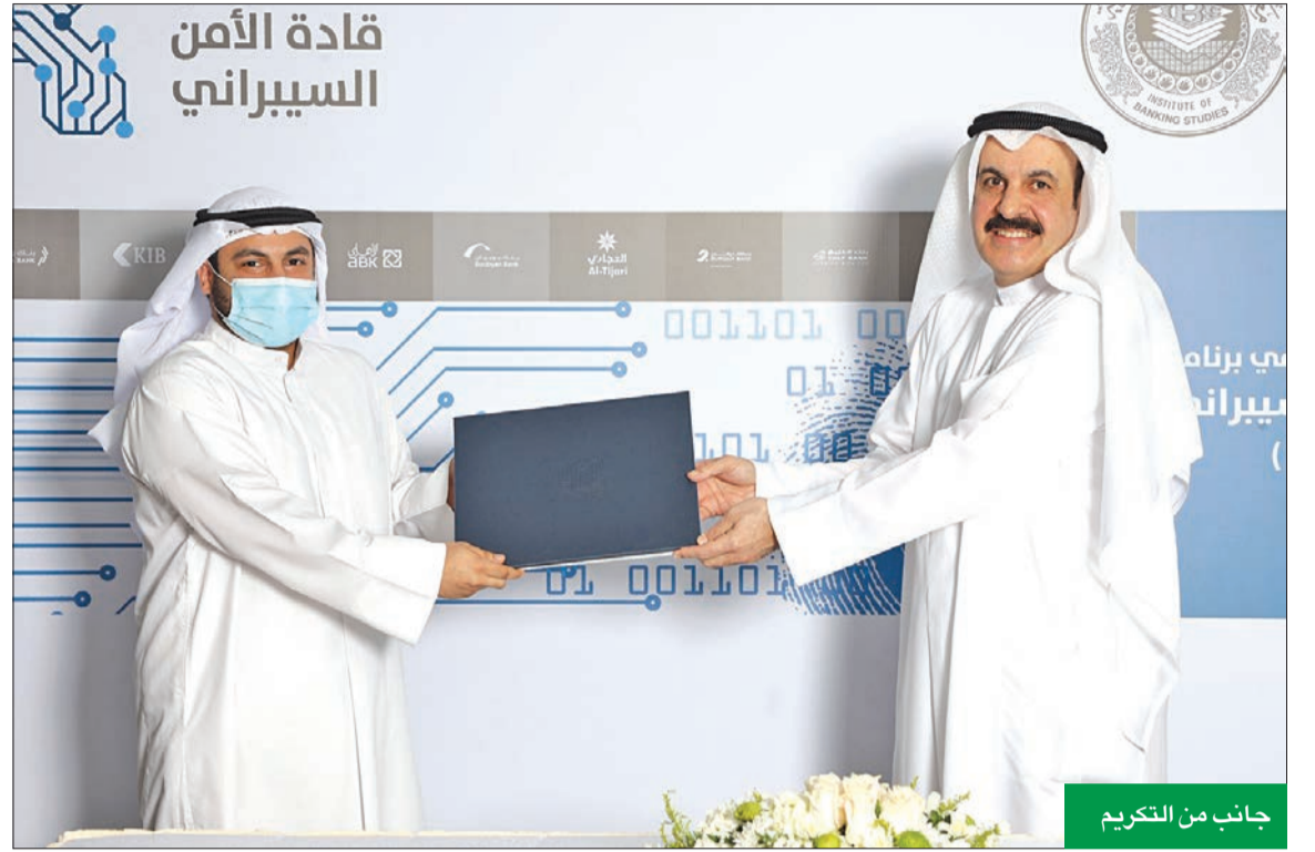
جانب من التكريم

ضمن استراتيجية «المركزي» لتنمية الكوادر الوطنية في القطاع المصرفي والاقتصاد الوطني، وبناء القدرات الفنية في مجال أمن وتكنولوجيا المعلومات.