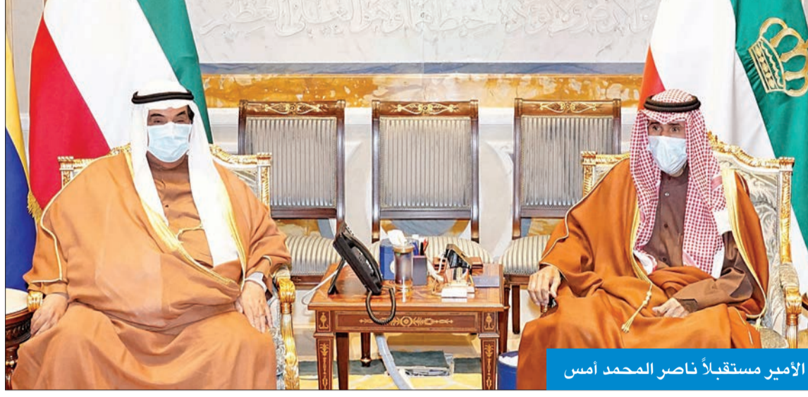
الأمير مستقبلاً ناصر المحمد أمس