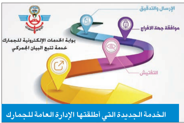
الخدمة الجديدة التي أطلقتها الإدارة العامة للجمارك