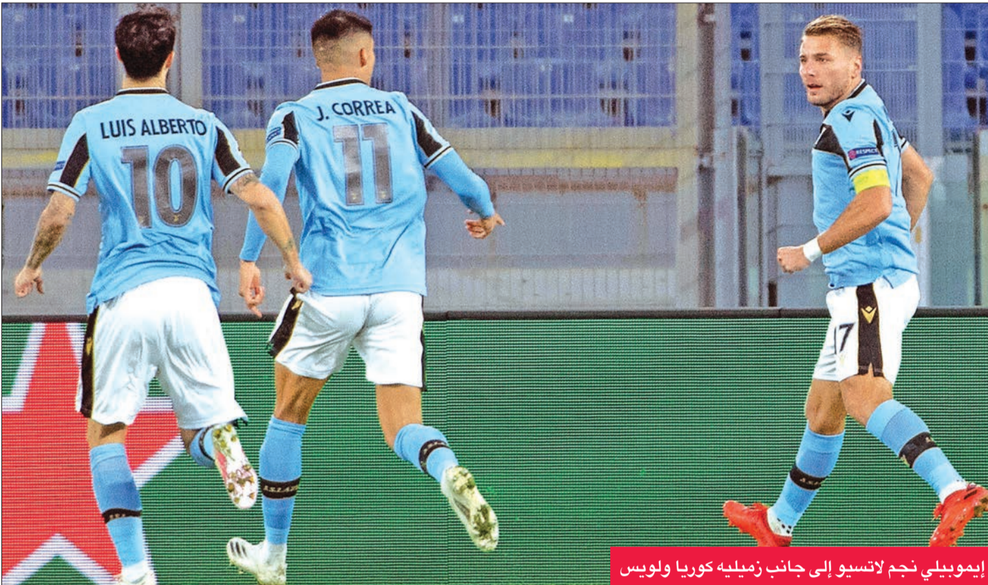
إيموبيلي نجم لاتسيو إلى جانب زميله كوريا ولويس

والمخاطرة من خلال الادعاء بمعرفة حقائق ليست معروفة، واجهت أسباب صعبة حقا. إيموبيلي الذي عاد للرقم القياسي لعدد الأهداف المسجلة في الدوري الإيطالي برصيد 36 هدفا الموسم الماضي، جاءت نتيجة مسحته هو وثلاثة من زملائه «إيجابية» بناء على الاختبارات التي أجراها الاتحاد الأوروبي لكرة القدم (يويفا) في 27 أكتوبر الماضي، ليغيب عن المباراة أمام كلوب بروج في اليوم التالي، والتي انتهت بالتعادل بهدف لمثله في دوري الأبطال.