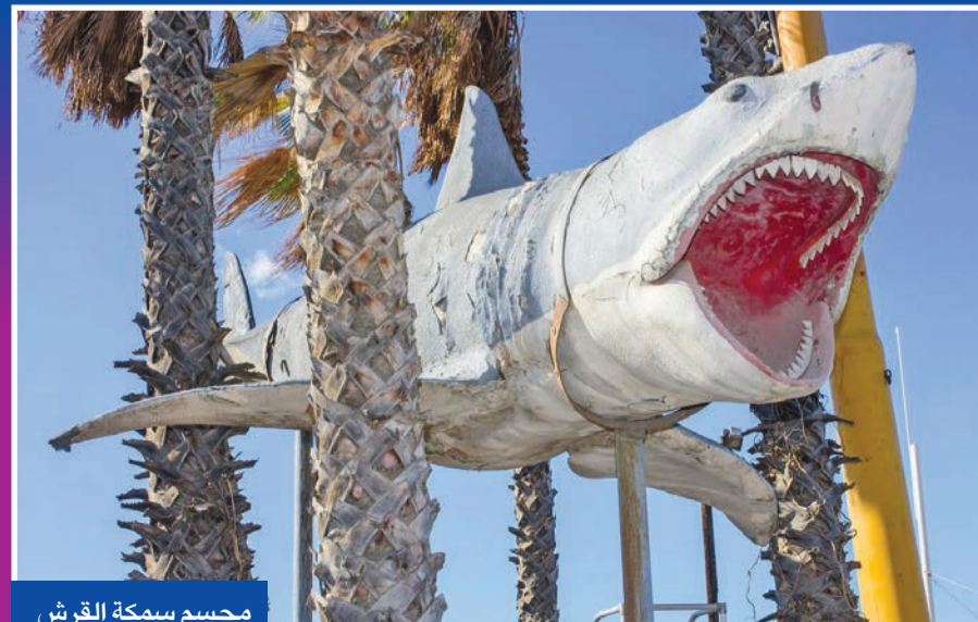
مجسم سمكة القرش

مجسم مصنوع من الألياف الزجاجية يبلغ طوله 8 أمتار