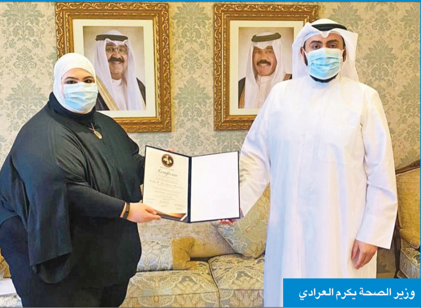
وزير الصحة يكرم العرادي

في الاختبارات السريرية والجوانب التنظيمية على حد سواء.