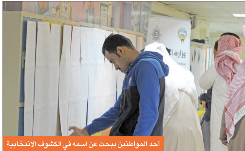
أحد المواطنين يبحث عن اسمه في الكشوف الانتخابية

تقدم منطقة الصباحية الى المرتبة الأولى، وتراجعت منطقة صباح السالم الى المرتبة الثانية، وتقدمت منطقة علي صباح السالم الى المرتبة الخامسة، بعد أن كانت في المرتبة الثامنة. أما المناطق التي شهدت أقل أعداد من الناخبين، فجاءت على التوالي: الزور بناخبين فقط، وميناء عبدالله بـ 24 قيدا، والوفرة بـ 43 قيدا، والغنيطيس بـ 88 قيدا، والمسيلة بـ 161 قيدا.