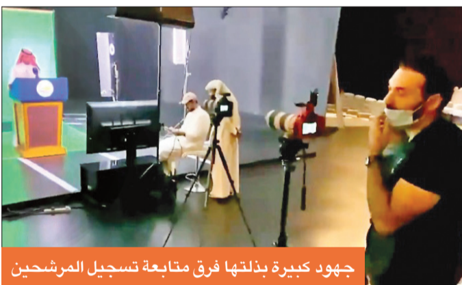
جهود كبيرة بذلتها فرق متابعة تسجيل المرشحين

تتضمن برنامجه الانتخابي، بنسخة من «سي دي» حتى يستطيع الاستفادة منه وبثه على وسائل التواصل الاجتماعي أو في القنوات الفضائية الأخرى.