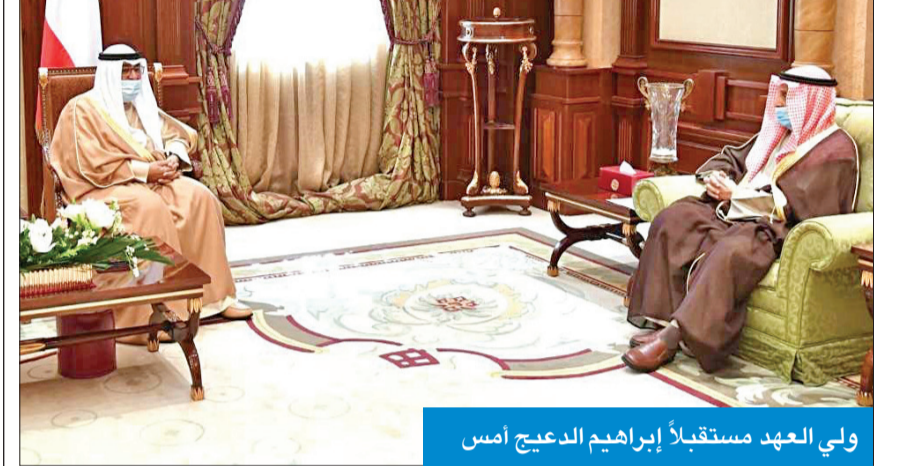
ولي العهد مستقبلاً إبراهيم الديعج أمس

استقبل سمو ولي العهد الشيخ مشعل الأحمد، بقصر بيان، صباح أمس، سمو الشيخ ناصر المحمد، والشيخ الدكتور إبراهيم الديعج.