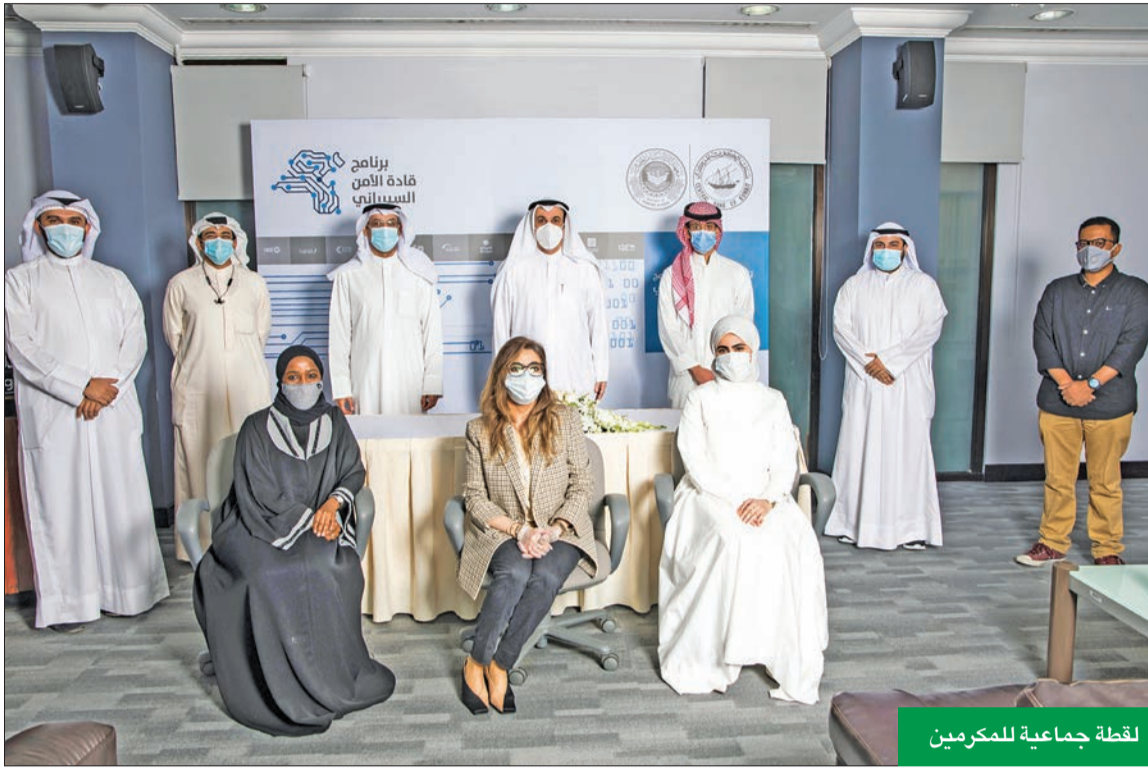
لقطة جماعية للمكرمين