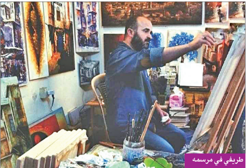
طريفي في رسمه

بداياتي الفنية الأولى في عالم الفن التشكيلي تشكّلت منذ الطفولة، وقد شاركت في بعض المعارض بمراسم التعليم الأولى، بعد أن خضت تجربة رسم إحدى اللوحات، والتي نالت إعجاب أفراد العائلة، وكانت بداية الانطلاق نحو الفن التشكيلي منذ تخرّجي في جامعة دمشق للفنون الجميلة قسم التصوير الزيتي عام 1999، وأصبحت لدي تجربة ثرية وعميقة ومتجددة، وعشق للفرشاة التي كانت بالنسبة