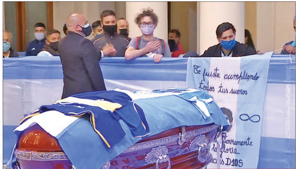
نعش مارادونا في القصر الرئاسي الأرجنتيني

وتبقى أبرز محطات مارادونا الكروية قيادته منتخب "التانغو" إلى لقب كأس العالم 1986 في المكسيك، حيث مرر في النهائي التميرية الحاسمة لهدف الفوز على ألمانيا الغربية في الدقيقة 86 (2-3)، كما سجل