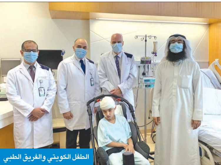
الطفل الكويتي والفريق الطبي

وكان الطفل (10 سنوات) يعاني حالة صرع صعبة، إذ يصاب بأربع أو خمس نوبات في اليوم على الأقل، فيما كان طول النوبات يتراوح بين بضع ثوانٍ وأربع دقائق، ما يشكل خطراً على صحته.