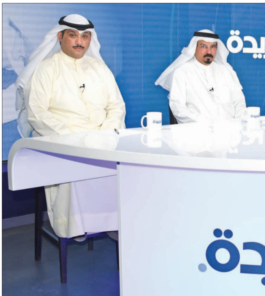
الديمقراطية والتعليم والصحة لتعديل النظام الانتخابي،