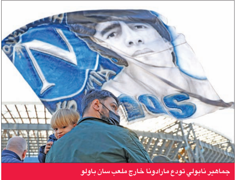
جماهير نابولي تودع مارادونا خارج ملعب سان باولو

وجماهيره الجنوبية الفقيرة مقارنة بمدن الشمال خصوصا ميلانو وتورينو. ويشرح في سيرته "حقيقتي" (2016) "شعرت فورا بانني كالمسكة في الماء. احببت هذه المدينة بسرعة، لأنها ذكرتني بجذوري". وتابع ابن مدينة لانوس: "شعرت بانني امثل جزءاً من ايطاليا لا بهم أحداً". وذكر في فيلم لأمير كوستوريتسا حمل اسمه عام 2008 "اعتقد الناس ان الجنوب ليس بمقدوره الفوز على الشمال". عقدة نقص تبحرت في 10 مايو 1987: تعادل ضد فيورنتينا (1-1) على ملعب سان باولو توج نابولي التي غرقت في احتفال لم يتكرر لاحقا في ذاكرة الولد الرهيب.