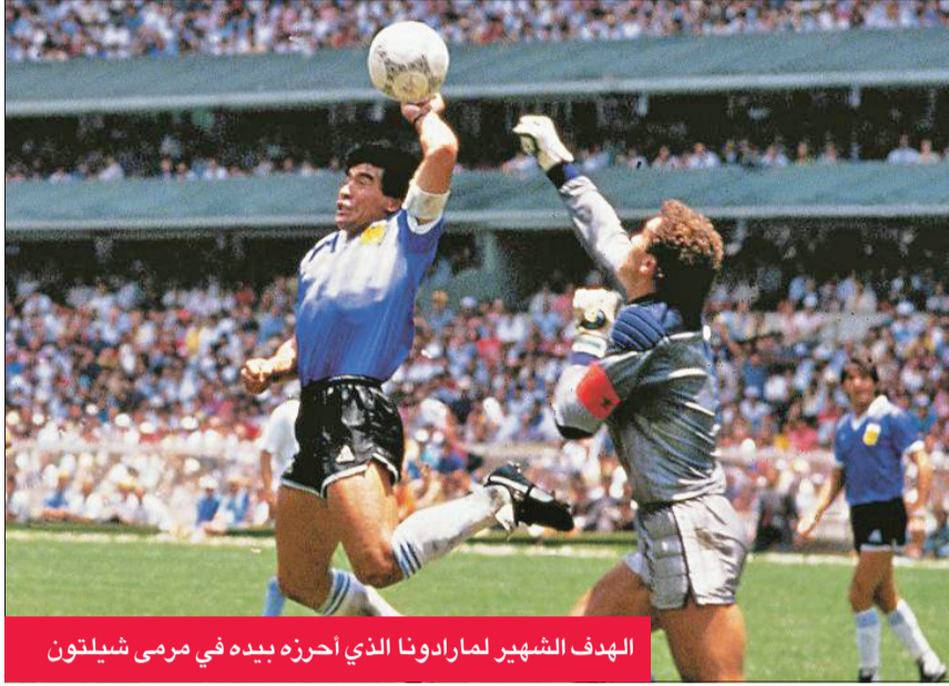
الهدف الشهير لمارادونا الذي أحزره بيده في مرمى شيلتون

الارجنتينيين 1-2، قبل ان تتابع مشوارها نحو اللقب الثاني في تاريخها. وذكر شيلتون "ما لم يعجبني انه لم يعتذر ابدا. لم يقفز في اي مرحلة انه قام بالغش وبيد الاعتذار، مضيفا "بدلا من ذلك استخدم (يد الله). لم يكن هذا الامر مناسباً". وراى الحارس المميز سابقا ان مارادونا "كان يتمتع بالعظمة، لكنه لم يكن صاحب روح رياضية". وأضاف اللاعب الذي حمل الوان بلاده 15 مرة، وأحرز لقب كاس أوروبا للاندية الابطال مرتين مع نوتنغهام فوريس: "ارتبطت حياتي بشكل كبير بما قام به مارادونا. وليس بالطريقة التي كنت أرغبها". وتابع الحارس البالغ راهنا