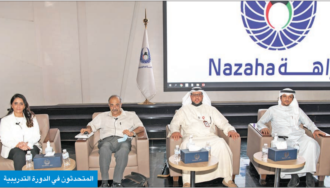
المتحدثون في الدورة التدريبية

● 187 شاباً وفتاة خضعوا لدورة تدريب في «نزاهة» لتعريفهم بقانون الانتخاب وترجمته في الواقع ● الفيلي: عليهم العمل الجاد ومنع التأثير على إرادة الناخبين ومتابعة الفرز