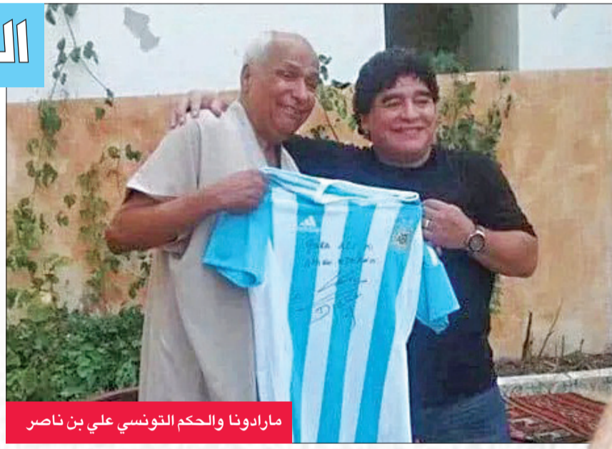
مارادونا والحكم التونسي علي بن ناصر

بتذكر الحكم التونسي، علي بن ناصر، كل حركة قام بها "العبقري" الأرجنتيني الراحل ديفغو مارادونا في مباراة بلاده مع انكلترا في ربع نهائي مونديال مكسيكو 1986، التي اشرف عليها وشهدت تسجيله هدفا تاريخيا بيده، ساهم بفوز بلاده الى هدف ثانٍ "تحفة" الاجمل في تاريخ كأس العالم. وقال بن ناصر، الذي اصبح اول حكم تونسي يدير مباراة على هذا المستوى "لم أتشاهد لمسة اليد، لكن شككت في ذلك". تابع لوكالة "فرانس برس": "بمقدوركم رؤية المشاهد، تراجعتم لأخذ رأي مساعدي، البلغاري دوتشيف، وعندما أكد الهدف احسبته".