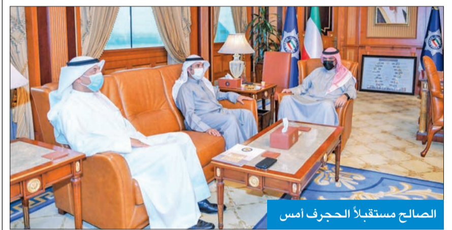
الصالح مستقبلاً الحجرف أمس

استقبل نائب رئيس مجلس الوزراء وزير الداخلية، أنس الصالح، في مكتبه بمقر الوزارة، أمس، الأمين العام لمجلس التعاون لدول الخليج العربية الدكتور نايف الحجرف.