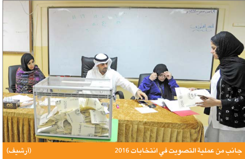
جانب من عملية التصويت في انتخابات 2016 (أرشيف)

5 آلاف موظف لتغطية الاقتراع... وشهادة الخلو من الفيروس شرط لمشاركتهم