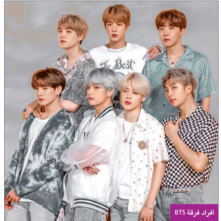
أفراد فرقة BTS

وقد كشف الممثل الأمريكي (59 عاماً) عن سره هذا خلال مقابلة مع قناة "سي بي إس"، قائلاً: "أقص شعري بنفسي منذ الخامسة والعشرين من العمر. وشعري كالقش يسهل قصه، ولا مجال للخبط". وأضاف كلوني مبسماً أنه استثمر منذ زمن بعيد في جهاز "فلووبي"، وهي آلة لجز الشعر مرفقة بشفاطة حققت رواجاً واسعاً في الثمانينات عبر المبيعات التلفزيونية بالولايات المتحدة، مؤكداً: "ما زلت أحتفظ بالجهاز، ولا يستغرقني قص شعري أكثر من دقيقتين". (أ ف ب)