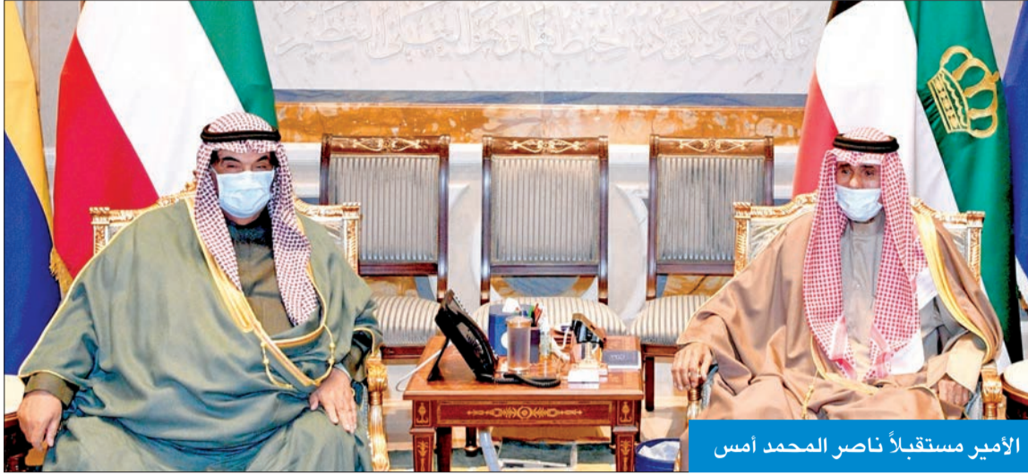
الأمير مستقبلاً ناصر المحمد أمس

«حققت إنجازات حضارية وتنموية بارزة عززت مكانتها الرفيعة»