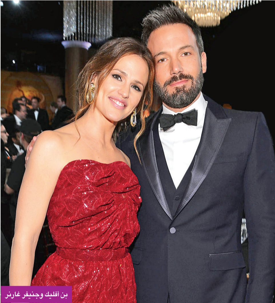
بن أفليك وجنيفر غارنر

اتفقا على قضاء عيد الشكر ببقاء الولد مع أمه والبنتين مع والدهما