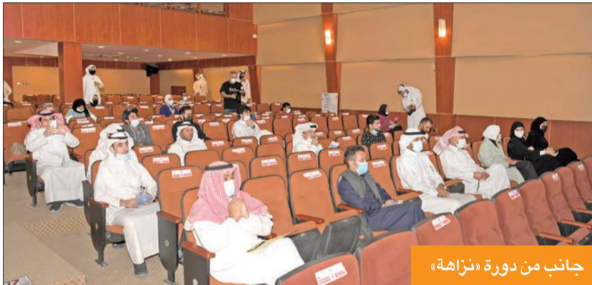
جانب من دورة «نزاهة»

«جمعية الشفافية»: وصول الدفعة الأولى من الفريق الدولي لمراقبة العملية الانتخابية