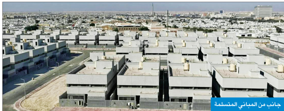
جانب من المباني المتسلمة