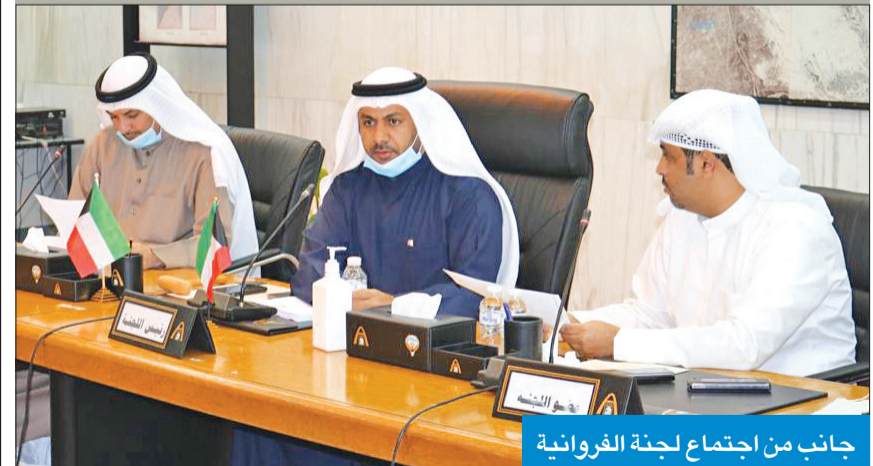
جانب من اجتماع لجنة الفروانية