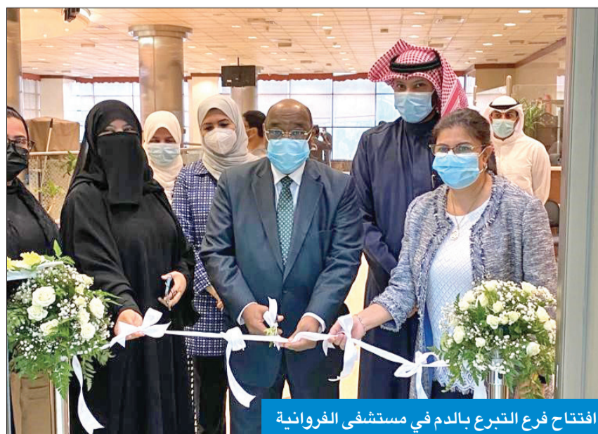
افتتاح فرع التبرع بالدم في مستشفى الفروانية

أوقات العمل الرسمية من الأحد إلى الخميس بدءاً من الساعة السابعة والنصف صباحاً حتى الثامنة والنصف مساءً لخدم المحافظة الفروانية وضواحيها. الفرع المركزي والفروع جمع نحو 75 ألف كيس دم وتأمينية آلاف كيس صفائح دموية منذ بداية عام 2020 باستخدام أحدث التقنيات العالمية لناحية السلامة والجودة. وبينت أن افتتاح فرع الدم الجديد من شأنه المساهمة في زيادة الدخل اليومي للتبرع بالدم بنسبة 4 في المئة علاوة على تخفيف الضغط على البنك الرئيسي وتوفير العناء والوقت والجهد للمراجعين. وأضافت أن الإدارة واجهت