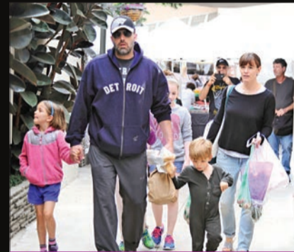
جنيفر غارنر وبن أفليك وأبنائهما

كبير، وينعكس ذلك في المناسبات التي باتت تركز فيها على الظهور معهما، تمهيداً للإرتباط الرسمي الذي يخطط له كل من بن أفليك ودي أرماس خلال الأونة المقبلة. كما أكدت التقارير الصحافية أن عدم احتفال الابنتين مع والدهما بعيد الشكر يرجع لاتفاق مشترك بينهما وبين أفليك على السماح لهما بالاقتراب أكثر من أنا دي أرماس منذ فترة، ويعود ذلك للتفاهم الكبير بين الثنائي رغم الانفصال، والذي أشاد به بن أفليك في وقت سابق.