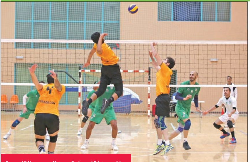
جانب من لقاء سابق بين العربي والقادسية