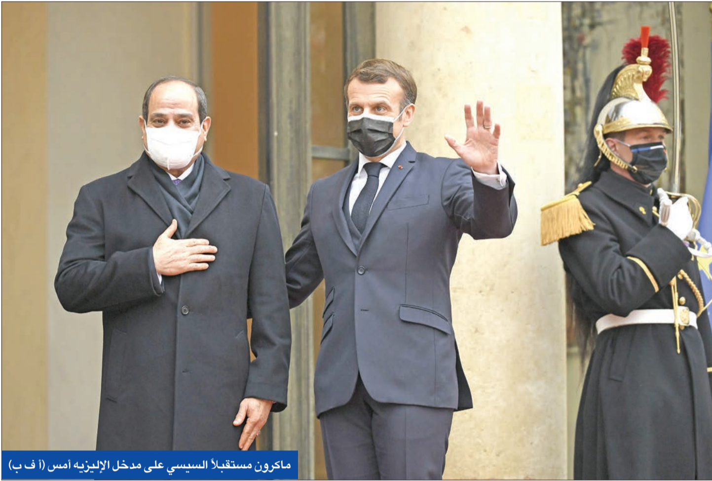
ماكرون مستقبلاً السيسي على مدخل الإليزيه أمس

في المقابل، أعلن وزير الخارجية الألماني هايكو ماس، في جهود الوساطة التي تقوم بها بلاده لتخفيف التوتر في العلاقات بين الاتحاد الأوروبي وتركيا «باعت بالفشل حتى الآن». وأكد أن «تركيا ستدفع نتيجة سياساتها العداثية من خلال مشاركتها عبر تقنية الفيديو كونفرانس، في ورشة عمل بخصوص شرق المتوسط، نظمتها «جامعة أقدنير» بولاية أنطاليا بالتعاون مع مجلس الجامعات الدولي، حث الرئيس التركي الاتحاد الأوروبي على أن «يتخلص بسرعة من العمى الاستراتيجي، ولا يتصرف حيال شرق المتوسط حسب أهواء اليونان وقبرص»، موضحاً أن «تركيا التي تمتلك أطول شريط ساحلي على البحر المتوسط لا يمكنها أن تكتفي بمقعد المتفرج على تطورات المنطقة، وهي لن تعترف بالمخططات والخرائط الرامية إلى حجبها بسواحل أنطاليا». من ناحية، دفع وزير خارجية اليونان نيكوس دندياس باتجاه فرض العقوبات، لافتاً إلى أن «أزمة تقاعست عن الرد على بوادر حسن النية التي أبدتها الاتحاد الأوروبي». أما نائب رئيس المفوضية الأوروبية، مارغاريتيس شيناس، فقد رأى أن «تركيا فعلت كل شيء خاطئ، وعلت كل ما في وسعها لمعاداة الجميع وليس أوروبا فقط». (إسطنبول، بروكسل - وكالات)