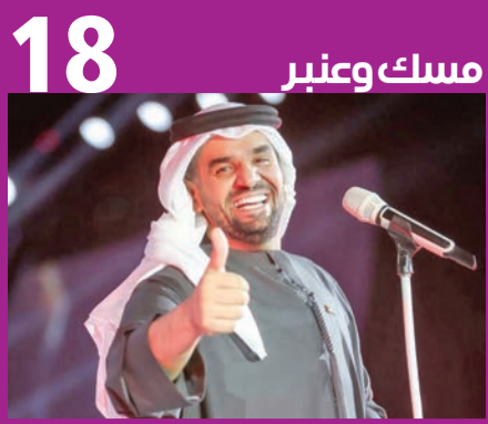
18 مسك وعنبر

كشف تطبيق Spotify أن المطرب حسين الجسمي هو أكثر من استمع إليه مستخدمو التطبيق في قوائم أغاني حفلات الزفاف في 2020.