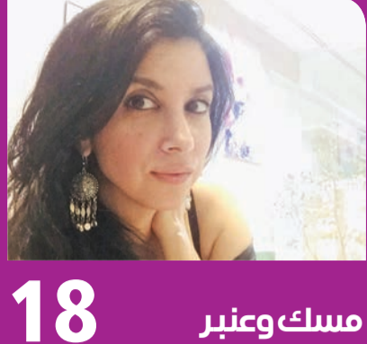
18 مسك وعنبر

كشف تطبيق Spotify أن المطرب حسين الجسمي هو أكثر من استمع إليه مستخدمو التطبيق في قوائم أغاني حفلات الزفاف في 2020.