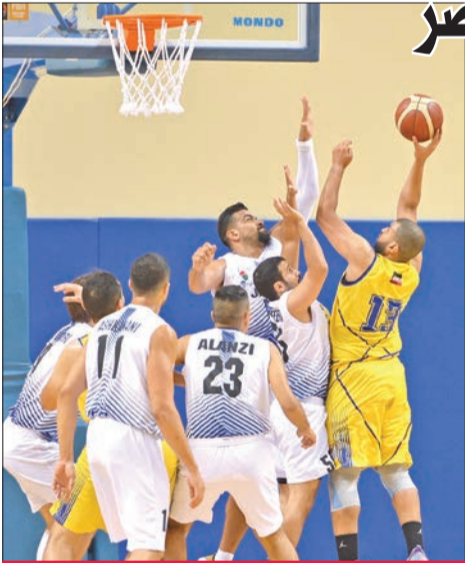
هجمة لسلة الساحل ودفاع محكم للجهراء

حقق الجهراء فوزاً سهلاً على منافسه الساحل بنتيجة 96-55، خلال المباراة التي جمعتهم امس الأول على صالة الاتحاد بمجمع الشيخ سعد العبدالله الرياضي، في افتتاح منافسات القسم الثاني للمجموعة الأولى لدوري السلة، والتي شهدت أيضاً فوز العربي على النصر بنتيجة 85-62.