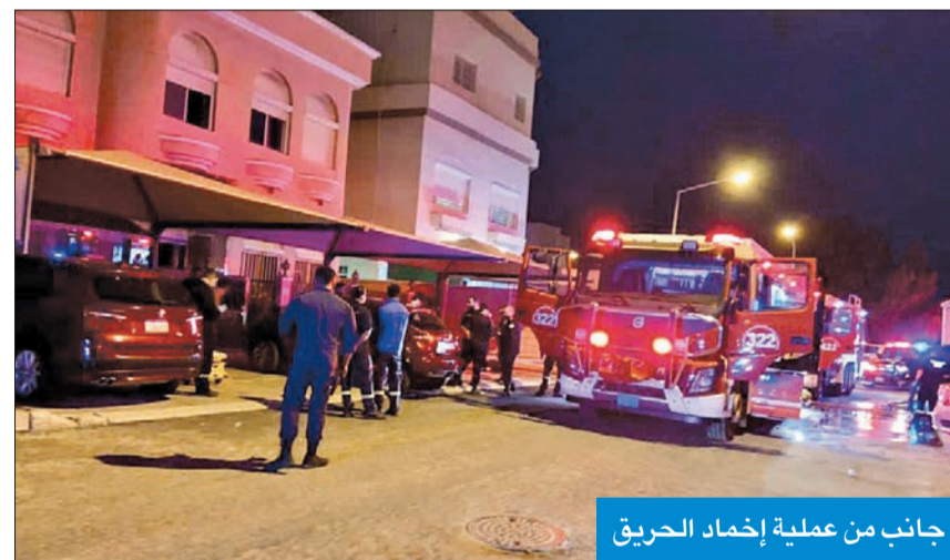
جانب من عملية إخماد الحريق

لقت مواطنة من مواليد 1962 مصرعها وتحمها وأصيب اثنان بالاختناق في حادث حريق منزل بمنطقة سلوى مساء أمس. وذكرت إدارة العلاقات العامة والإعلام بقوة الإطفاء العام، في بيان لها، أن فرق الإطفاء توجهت الى موقع الحادث من مراكز البعد ومشرف وتبين لها أن الحريق في غرفة بالدور الأرضي وتمت مكافحته وإخماده، في حين عالجت فرق الطوارئ الطبية المصابين بالاختناق في الموقع، وباشرف فريق التحقيق عمله لمعرفة أسباب الحادث.