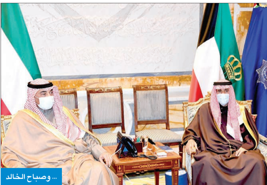
... وصباح الخالد

كما أعرب أمير دولة قطر عن خالص شكره وتقديره للمساعي الحميدة والجهود للخبرة التي قادها الأمير الراحل الشيخ صباح الأحمد، وطيب الله ثراه، وجعل الجنة مقواه، والجهود التي بذلها صاحب السمو أمير البلاد الشيخ نواف الأحمد، والتي أثمرت بنتائج المرجوة. وتم خلال الاتصال استعراض العلاقات الأخوية الراضية التي تربط البلدين والشعبين الشقيقين، ومسيرة العمل الخليجي المشترك، وتمنى أمير قطر لصاحب السمو موفور الصحة والعافية، ولدولة الكويت ولشعبها كل التقدم والازدهار.