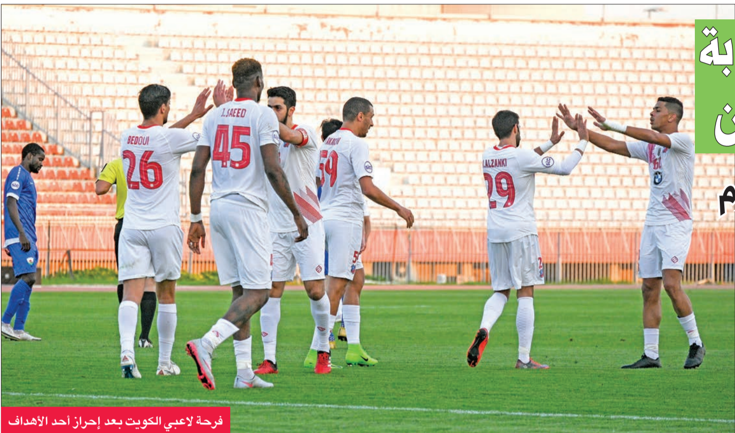
فرحة لاعبي الكويت بعد إحراز أحد الأهداف

وتغيير خطة اللعب الهجومية التي انتهجها العنابي منذ بداية الموسم. في المقابل، يدخل القادسية القادم من تعادل مخيب في الجولة الماضية أمام البرموك مواجهة النصر تحت الضغط، نظراً لتراجع النتائج، وتراجع مستوى العديد من اللاعبين لاسيما في خط الدفاع، ويعول مدرب الفريق الإسباني فرانكو على خبرة لاعبيه، وحماس الشباب وقدرتهم على تصحيح الأوضاع.