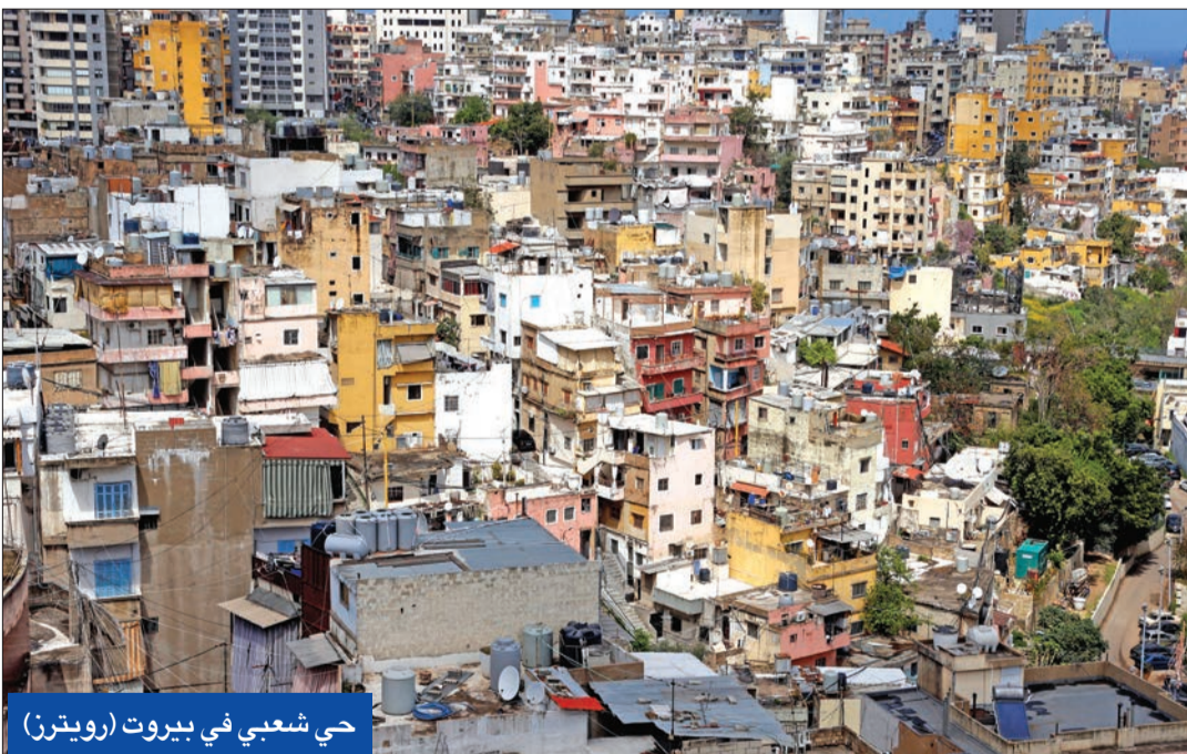
حي شعبي في بيروت

● اللواء إبراهيم: اتخذت إجراءات بعد ورود معلومات عن اغتالات