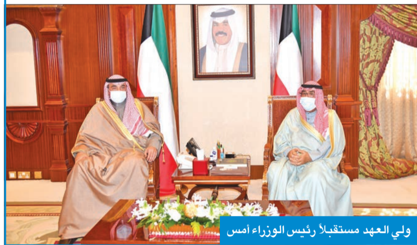
ولي العهد مستقبلاً رئيس الوزراء أمس

استقبل سمو ولي العهد الشيخ مشعل الأحمد، بقصر بيان، صباح أمس، رئيس مجلس الأمة مرسوق الغانم، وسمو الشيخ ناصر المحمد، واستقبل سموه أيضاً رئيس مجلس الوزراء سمو الشيخ صباح الخالد.