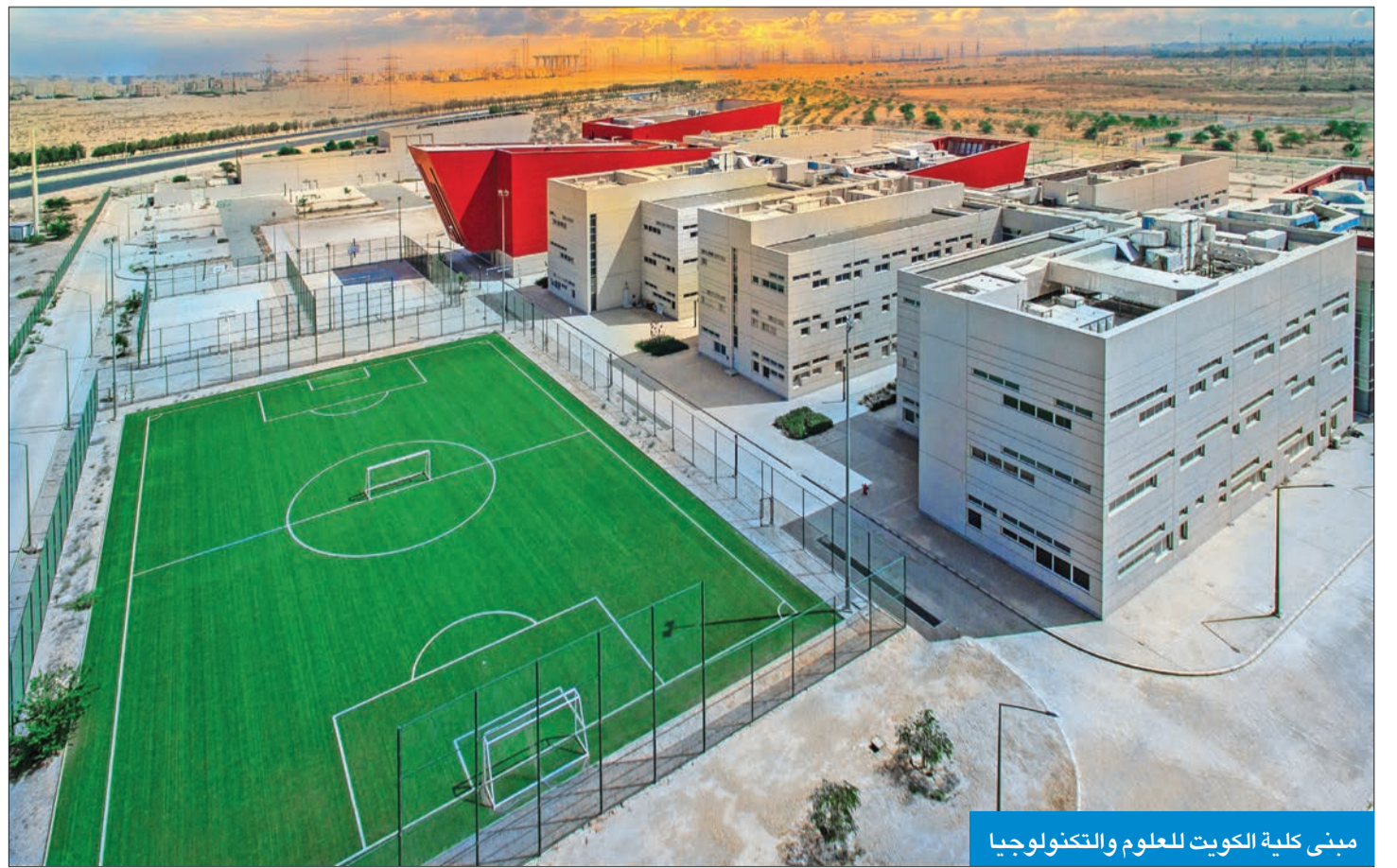
مبنى كلية الكويت للعلوم والتكنولوجيا

المعلومات، وضابط أمن المعلومات، (IA)، ومدير أخصائي أمن المعلومات، ومهندس مدير أمن نظم المعلومات، ومهندو أو ضباط أمن المعلومات، وأمن المعلومات ومدققو تكنولوجيا المعلومات، أو محلل المخاطر والتهديد والضعف، ومسؤولو النظام، ومسؤولو ومهندسو الشبكة.