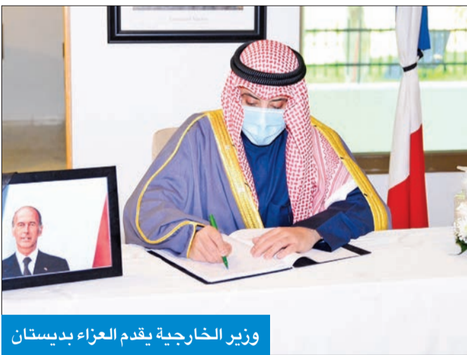
وزير الخارجية يقدم العزاء بديستان

وزير الخارجية زار سفارة فرنسا معزياً بديستان