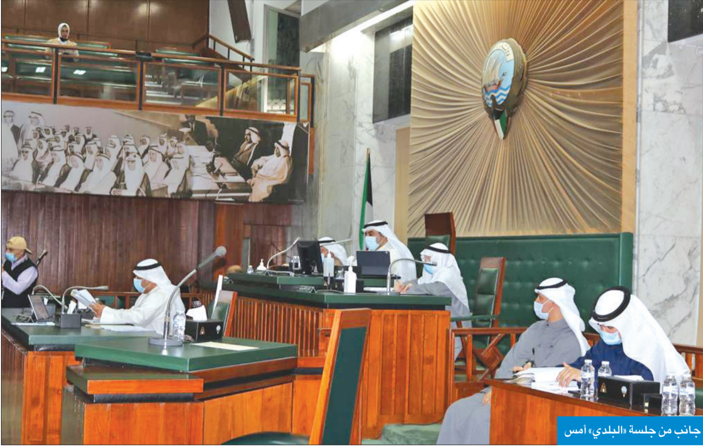
جانب من جلسة «البلدي» أمس

المواقع المخصصة في كيفان والفيحاء... وإعادة استخدامها حدائق وأنشطة ترفيهية