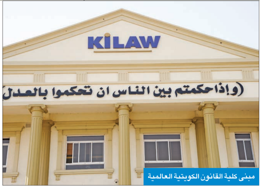
مبنى كلية القانون الكويتية العالمية

تحت عنوان «الخطأ الطبي ومسؤولية المستشفيات عن عمليات التجميل»، أقامت إدارة التطوير الطلابي والمسابقات في كلية «KiLAW» المنتدى الثاني خلال الفصل الدراسي الأول 2020 - 2021.