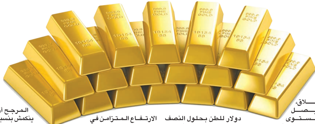
الإطلاق، ليصل لمستوى

عانت كل شركات الوساطة الأميركية عملاً واحداً على الأقل خلال شهر نوفمبر، بحسب موقع تتبع مشكلات الخدمة عبر الإنترنت «داون ديتكتور»، في إشارة للتداولات المحمومة.