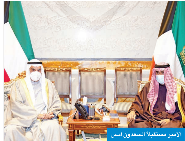
الأمير مستقبلاً السعودون أمس