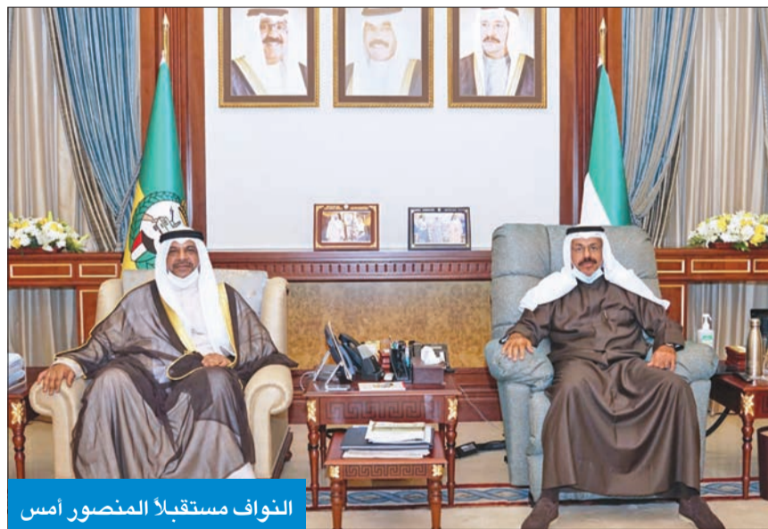
النواف مستقبلاً المنصور أمس

«البيئة»: جهة رقابية تحول دون وقف تلوث الجون