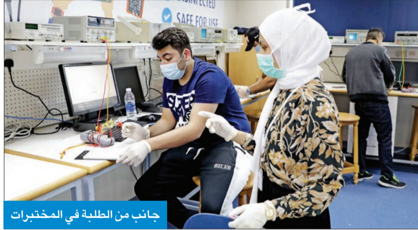
جانب من الطلبة في المختبرات

عبدالنبي: بعد الحصول على الموافقات اللازمة من مجلس الجامعات الخاصة