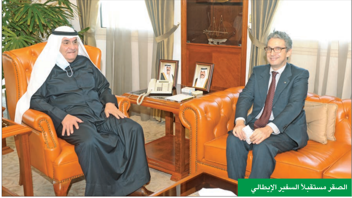
الصقر مستقبلاً السفير الإيطالي

ناقش مع السفير كارلو بالدوتشي تعميق العلاقات الاقتصادية وفتح آفاق جديدة للتعاون