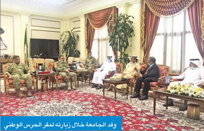
وفد الجامعة خلال زيارته لمقر الحرس الوطني