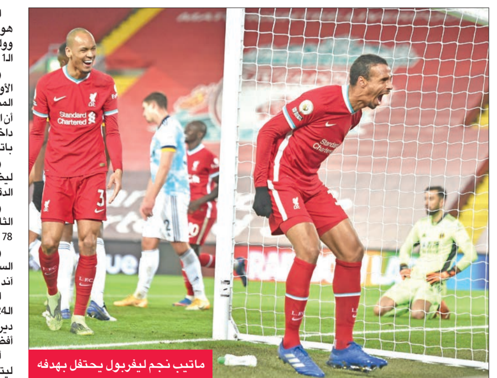
ماتيب نجم ليفربول يحتفل بهدفه

استمر صراع الصدارة المحترم في الريمبير ليغ بين توتنهام هوتسبير وليفربول، بعد أن حقق الأخير فوزاً كبيراً على ضيفه وولفرهامبتون بأربعة أهداف دون رد، أمس الأول، في إطار الجولة 11 بالدوري الإنجليزي الممتاز لكرة القدم. وعلى ملعب (أنفيلد رود)، وأمام حضور جماهيري محدود للمرة الأولى منذ تفشي جائحة "كورونا" في مارس الماضي، افتتح النجم المصري محمد صلاح مسلسل أهداف "الريدز" في الدقيقة 24، بعد أن استغل خطأ من مدافع كوتونر كوادري في تسلم الكرة ليقنصها داخل المنطقة ويسدد الكرة على يسار الحارس البرتغالي روي باتريسيو، ليرفع رصيده إلى 9 أهداف هذا الموسم. وفي الشوط الثاني، استمر مسلسل تهديد أصحاب الأرض، ليضيف الهولندي جورجينيو فاينالدوم الهدف الثاني في الدقيقة 59. وفي الدقيقة 67، أضاف المدافع الكاميروني جويل ماتيب الهدف الثالث، قبل أن تختتم النيران الصديدة برباعية "الريدز" في الدقيقة 78 بهدف البرتغالي نيلسون سميدو بالخطأ في مرماه. واستعاد ليفربول بهذه النتيجة الكبيرة نغمة الانتصارات بعد السقوط في فخ التعادل الإيجابي في الجولة الماضية أمام برايتون أند هوف البيون بهدف لكل فريق. الفوز أيضاً رفع رصيد كتيبة الألماني يورغن كلوب للنقطة 24، ليجاوروا بها توتنهام هوتسبير، الذي حقق فوزاً ثميناً في دربي لندن على حساب أرسنال بثنائية نظيفة، في الصدارة مع أفضلية "السبيرز" بفارق الأهداف. أما "الذئاب" فسقطوا في فخ الخسارة الرابعة هذا الموسم، ليتجمد رصيدهم عند 17 نقطة في المركز العاشر. (إفي)