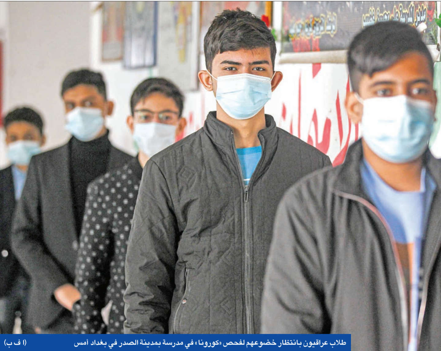
طلاب عراقيون بانتظار خضوعهم لفحص «كورونا» في مدرسة بمدينة الصدر في بغداد أمس

أكد عضو البرلمان عن ائتلاف "دولة القانون" حسين المالكي وجود تنسيق من أجل إعادة العمل بـ"اللجنة السباعية"، التي تضم رئيس الائتلاف نوري المالكي، ورئيس منظمة بدر هادي العامري، وزعيم تيار الحكمة عمار الحكيم، ورئيس تحالف النصر حيدر العبادي، وزعيم ملبشيا الخزعلي، وعبدالحسين الموسوي عن حزب الفضيلة، وممثل عن تحالف سائرون (التابعة للتيار الصدري)، والتي توقفت منذ فترة طويلة، موضحاً في حديث نقلته وسائل إعلام محلية أن "القوى السبع اتفقت قبل نحو 3 أشهر على إعادة عمل اللجنة بهدف التهدئة، ووقف الترشح الإعلامي قبل الانتخابات".