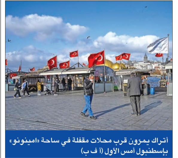
أتراك يمزون قرب محلات مقلدة في ساحة «امينونو» بإسطنبول أمس الأول

بينما كان وزراء الخارجية الأوروبيون يبحثون إمكانية فرض عقوبات على تركيا بسبب أزمة شرق المتوسط، عشية قمة أوروبا حاسمة بهذا الشأن، دعا الرئيس التركي رجب طيب إردوغان جميع الأطراف المعنية إلى العودة إلى طاولة المفاوضات للتوصل إلى «صيغة تكون رابحة للجميع»، مشدداً في الوقت نفسه على أن بلاده لن تتنازل.