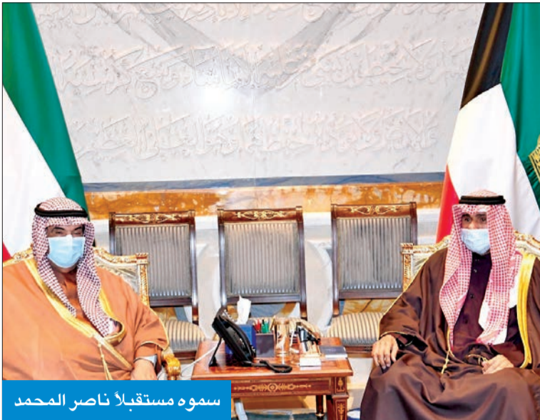
سموه مستقبلاً ناصر المحمد

سموه تلقى اتصالاً من أمير قطر وبرقية من ملك البحرين وعزى رئيس باكستان