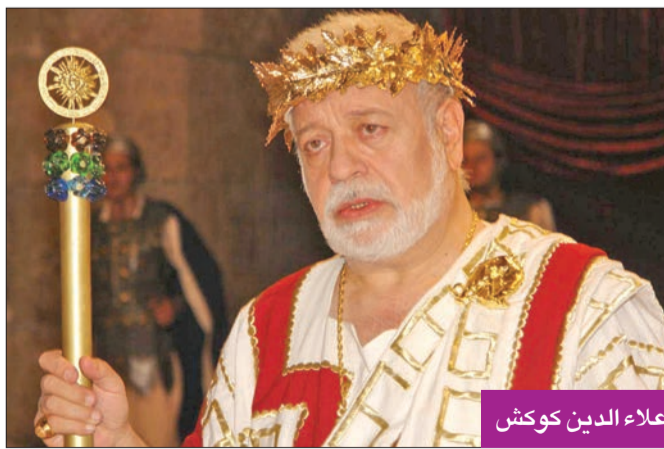
علاء الدين كوكش

ونعى الممثل السوري تيم حسن، كوكش، عبر صفحته الخاصة على موقع التواصل، وكتب: «رحم الله المخرج البارز علاء الدين كوكش صانع الكثير من الأعمال السورية الجميلة المتنوعة والراسخة في ذاكرتنا... تعازي لأسرته الكريمة وكل محبيه. إنا لله وإنا إليه راجعون». وعلق الفنان أيمن زيدان على رحيل