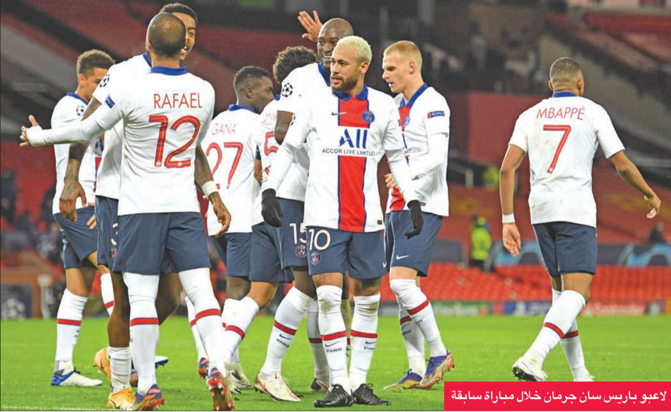
لاعبو باريس سان جرمان خلال مباراة سابقة

وفي المجموعة الخامسة، قضى الأمر بتصدر تشلسي الإنجليزي وتأهل اشبيلية الإسباني لثمان النهائي، بالإضافة إلى حلول كراستودار (10).