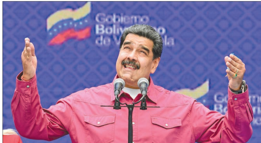
مادورو خلال مؤتمر صحفي في كراكاس أمس الأول

تحدثت، مضيقاً، نامل أن تعود الدبلوماسية إلى وزارة الخارجية الأميركية والبيت الأبيض، في إشارة إلى هزيمة الرئيس دونالد ترامب في الانتخابات فنزويلا التشريعية. كما وصف وزير الخارجية البرازيلي إرنستو أروجو أمس، عملية الاقتراع بأنها "خدعة انتخابية حاولت خلالها دكتاتورية مادورو تسخير نيكولاس مادورو غير الشرعي لن تعكس إرادة الشعب الفنزويلي.