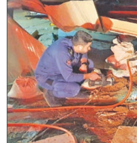
لحظة العثور على الجثة

عملية استخراج الجثة واطفاء كبد هرعوا الى الموقع وتبين بعد البحث وجود جثة راعي الأغنام محشورة تحت ركاب الغرفة، مشيرة إلى أن الفرقة قامت برفع الركاب وتمت