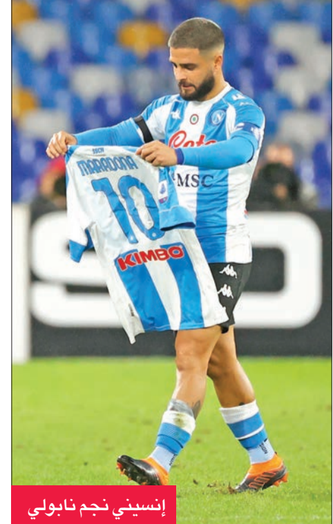
إسبيني نجم نابولي

وقبل المباراة الماضية في «يوروبا ليغ» ضد ريبكا الكرواتية (2- صفر) على ملعب «سان باولو» من خلال ارتداء القميص رقم 10 وإسم الأسطورة، وارتدى جميع اللاعبين الشارة السوداء، واحتفوا بالقميص الرمز خلال تقديم الفريقين وخلال دقيقة الصمت، حيث ظهرت صورة للغائب الأكبر على شاشة عملاقة داخل الملعب.