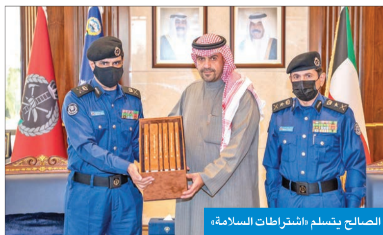
الصالح يتسلم «اشتراطات السلامة»

السامية فهي وسام على صدورنا ودافع لمزيد من العطاء.