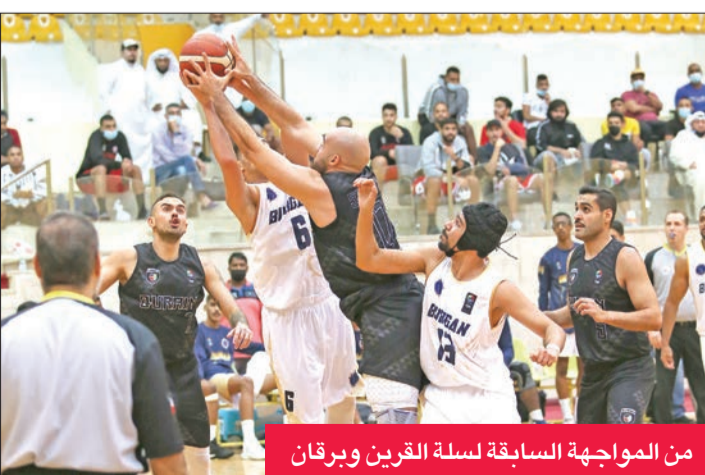
من المواجهة السابقة لسلة القرين وبرقان