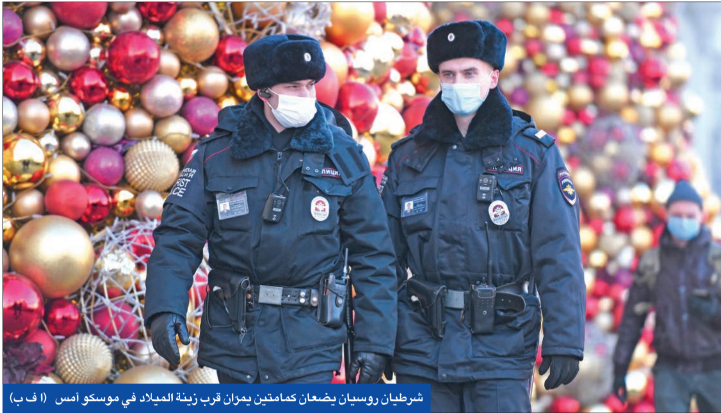
شريطان روسيان يضعان كمامتين يمزان قرب زينة الميلاد في موسكو أمس

دبي: «سينوفارم» فعال بنسبة 85% • 100 مليون أميركي سيخضعون للتطعيم في 100 يوم