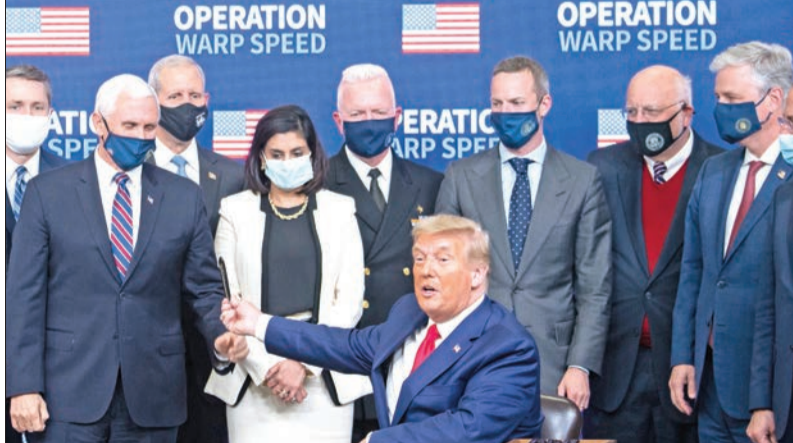
ترامب يسلم قلماً لنائبه مايك بنس بعد التوقيع على إعطاء الأولوية للأميركيين لتلقي لقاحات كورونا في البيت الأبيض أمس الأول

«نحاول البقاء أربع سنوات أخرى، وإلا (إذا لم يحدث ذلك)، فسأراكم بعد أربع سنوات». هذا الموقف يمثل «إشكالية خاصة لمسؤولي الإدارة الحاليين والسابقين» الذين يُنظر إليهم على أنهم مرشحو محتملون في سياق، ووزير الخارجية مايك بومبيو، وسفيرة ترامب السابقة لدى الأمم المتحدة نيكي هايلي.