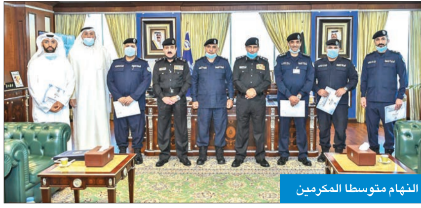
النهام متوسط المكرمين

وأعلنت الوزارة، في بيان لها، أن التكريم جاء في إطار الاستراتيجية الموضوعية للمؤسسة الأمنية، وبناءً على توجيهات نائب رئيس مجلس الوزراء وزير الداخلية أنس الصالح بتكريم المجد وإعلاء قيم العمل، وقد تم التكريم بمكتب