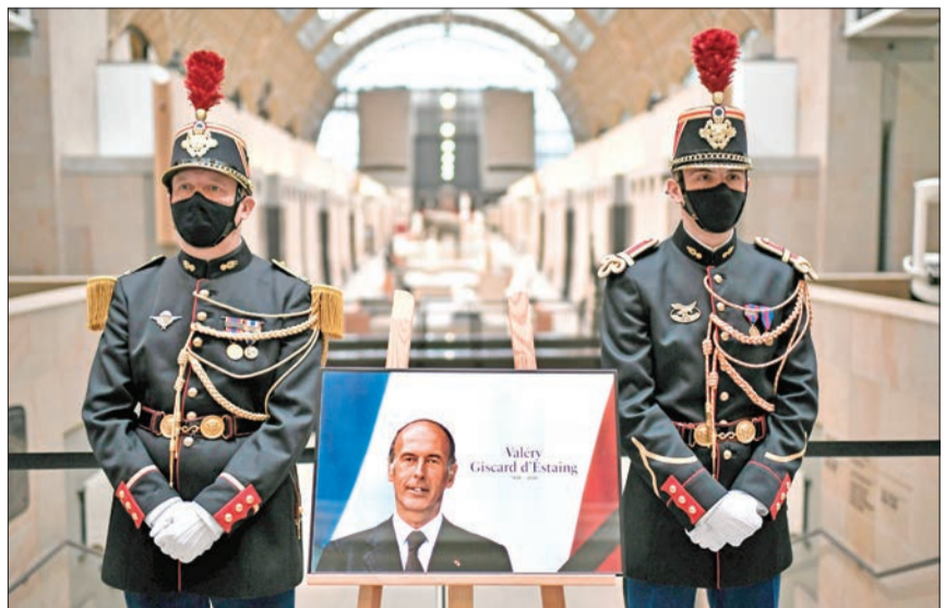
جنديان يحرسان صورة للرئيس الفرنسي الراحل فاليري جيسكار ديستان

النائب المعارض أحمد طنطاوي، تحول إلى حديث المصريين والشغل الشاغل لوسائل التواصل الاجتماعي، خلال الساعات الماضية، بعدما أعلن أنصاره فوزه، بعدما جمعا أصوات المصوتين لمصلحته، لكن النتيجة النهائية جاءت بخسارته، لتمتلى