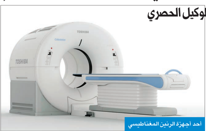
أحد أجهزة الرنين المغناطيسي

الشركة الجديدة، لكون الأخيرة هي الوكيل الوحيد لها بدولة الكويت.