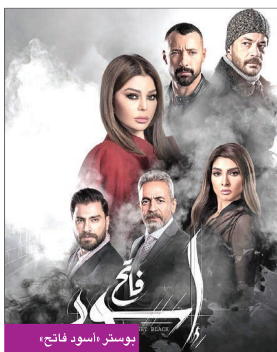
بوستر «أسود فاتح»

شاهد عام 2020 حالات زواج، وحوادث طلاق لعدد من نجوم الفن، بعضها جاء بشكل مفاجئ