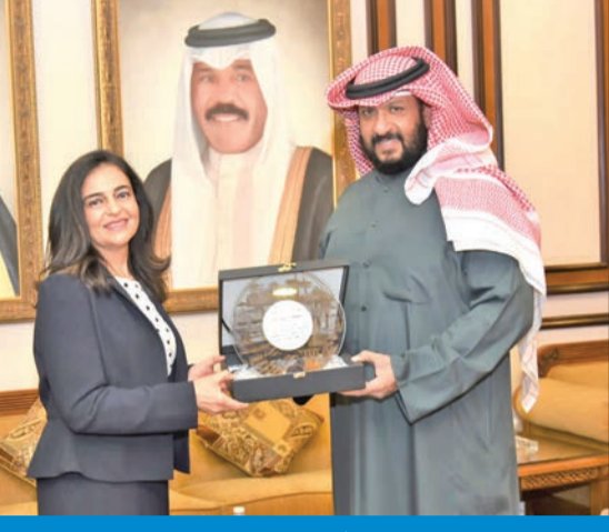
محافظ العاصمة مكرماً إحدى المشاركات في التجربة

أكد محافظ العاصمة الشيخ طلال الخالد أن «إرسال أول تجربة علمية من الكويت إلى محطة الفضاء التابعة لوكالة الفضاء الأميركية (ناسا) يعد نجاحاً وإنجازاً تاريخياً لدولة الكويت». وعبر الخالد، في تصريح له على هامش تكريمه الدكتور بسام الفيلى ومجموعة الشباب والشابات المشاركين في التجربة، عن «فخره واعتزازه بكل المساهمات والمبادرات المخلصة التي تخدم وتشرف الكويت في كل المجالات»، مؤكداً «تشجيعه لمثل هذه الإنجازات وللهؤلاء الشباب والشابات». وأثنى «بجهود الفيلى ودعمه لمثل هذه المبادرات