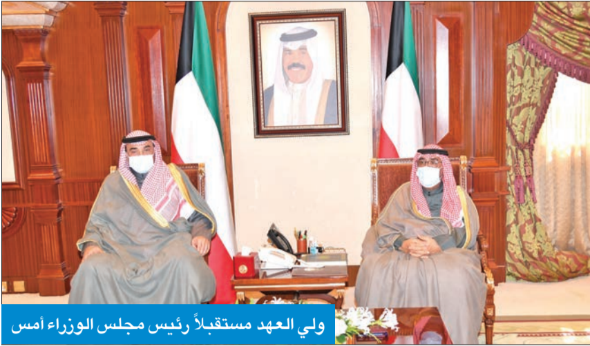
استقبل سمو ولي العهد الشيخ مشعل الأحمد بقرص بيان، صباح أمس، رئيس مجلس الأمة مرزوق الغانم، واستقبل سموه كذلك، رئيس مجلس الوزراء سمو الشيخ صباح الخالد.