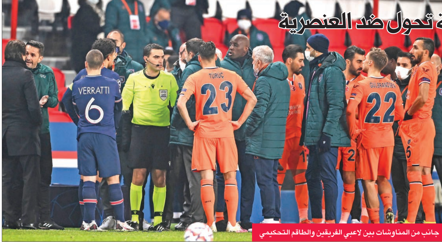
جانب من المناوشات بين لاعبي الفريقين والطاقم التحكيمي

أثارت حادثة الإهانة العنصرية التي وجهها الحكم الرابع الروماني سيباستيان كولتيسكو بحق مساعد مدرب باشاك شهير التركي، خلال المباراة أمام باريس سان جرمان، موجة من التفاعلات في معظم الصحف الرياضية العالمية.