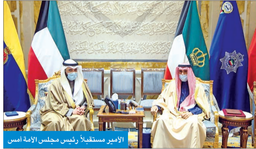
الأمير مستقبلاً رئيس مجلس الأمة أمس

استقبل صاحب السمو أمير البلاد الشيخ نواف الأحمد بقرص بيان صباح أمس سمو ولي العهد الشيخ مشعل الأحمد.