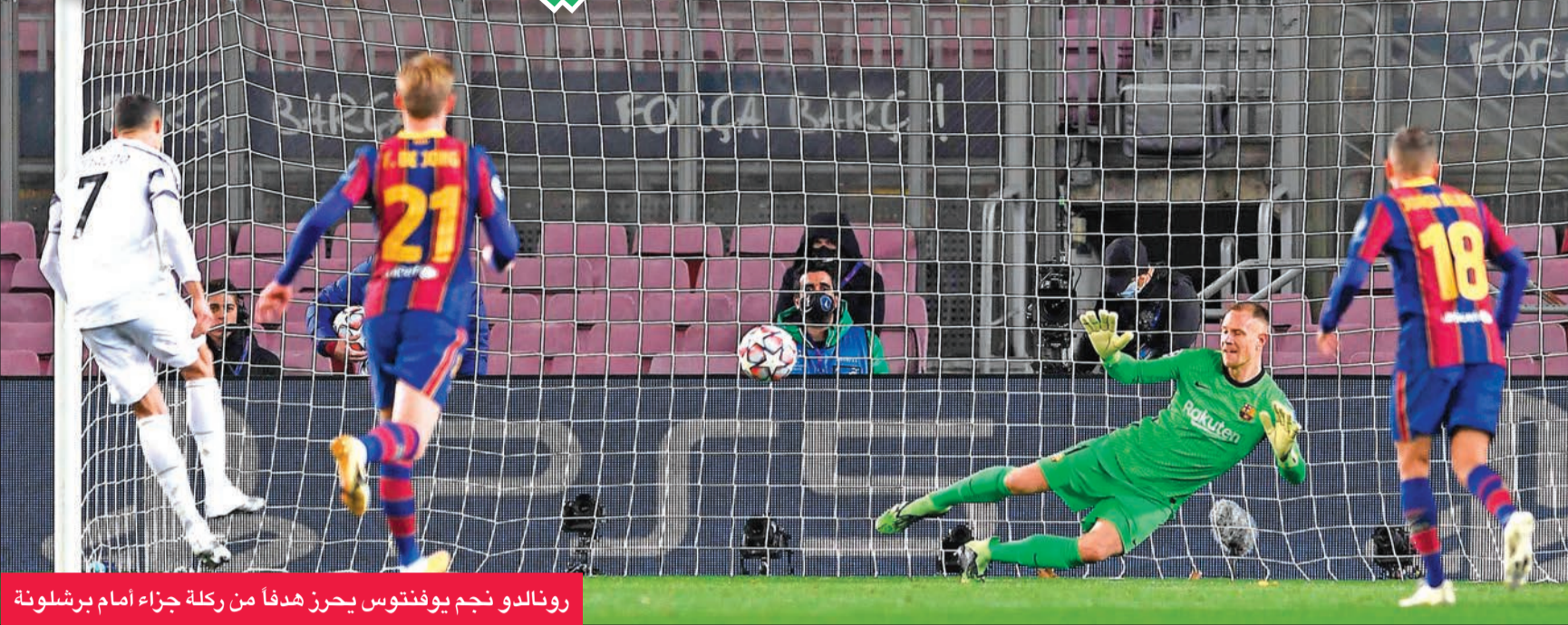
رونالدو نجم يوفنتوس يحرز هدفاً من ركلة جزاء أمام برشلونة

نتيجة تقدمه بثلاث نقاط وتفوقه في المواجهتين المباشرين (صفر-صفر و4-صفر)، أنهى رين الفرنسي مشاركته الأولى على الإطلاق في المسابقة بخسارة على أرضه أمام إشبيلية بثلاثة أهداف لمواطنه جول كوندني (32) والمغربي يوسف النصيري (2+45 و81) مقابل هدف لجورجينيو روتيه (86) من ركلة جزاء. وانتهى رين مشاركته التاريخية بنقطة واحدة في المركز الأخير خلف كراستودار الروسي، الذي كان ضامناً لانتقاله إلى «يوروبا ليغ» قبل سفره إلى لندن، حيث تعادل مع تشلسي المتصدر بهدف للفرنسي ريمي كابيل (24) مقابل هدف للإيطالي جورجينيو (28 من ركلة جزاء).