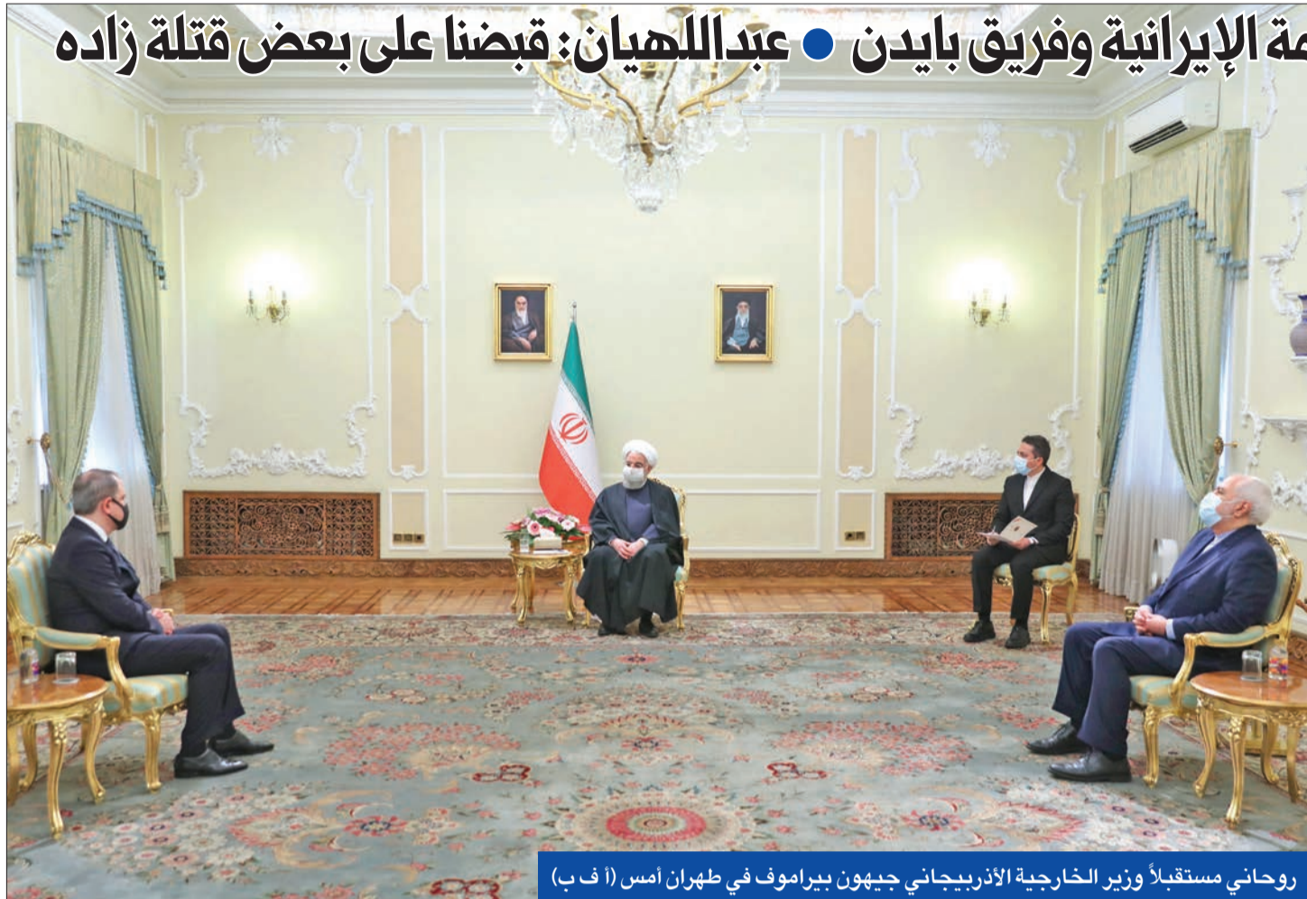
روحاني مستقبلاً وزير الخارجية الأذربيجاني جيهون بيراموف في طهران أمس

إشارات ايجابية بين الحكومة الإيرانية وفريق بايند • عبداللهيان: قبضنا على بعض قتلة زاده