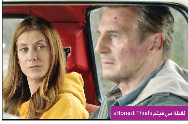
لقطة من فيلم «Honest Thief»

التقطت عدسات كاميرات الباراتزي صورا للعارضة العالمية اليساندرا أمبروسيو وهي تستجم على شاطئ فلوريانوبوليس في البرازيل أمس. وكانت اليساندرا (39 عاما) تستمتع بوقتها وتشرّب ماء جوز الهند. يُذكر أن أمبروسيو وُلدت في 11 أبريل 1981 بمدينة أيريتشم في ولاية ريو غراندي دو سول البرازيلية، واسمها الحقيقي اليساندرا كورين ماريا أمبروسيو، وهي من أصل إيطالي وبولندي، حيث كانت جدتها من الأب جوانا يوجينيا جروش، مهاجرة من بولندا، ووصلت إلى البرازيل عام 1929. وتُعد اليساندرا من أشهر عارضات الأزياء العالميات، وكانت من عارضات فيكتوريا سيكريت، وشاركت في حملات دعائية وعروض أزياء لأهم دور الأزياء العالمية، منها دولتشي أند غابانا، وبالمين وارماني أكستشاينغ، رالف لورين وكريستيان ديور.