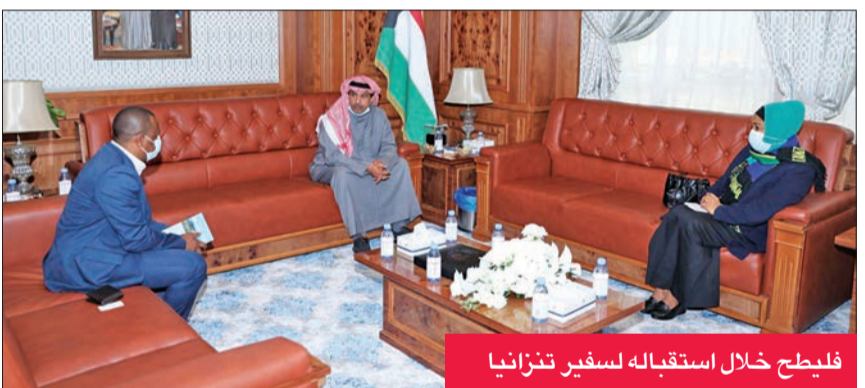
فليطح خلال استقباله لسفير تنزانيا

تعزيز العلاقات الرياضية بين البلدين. ومن جانبها، أبدت السالمة إعجابها بالحركة الرياضية الكويتية وما تحققت من إنجازات على كل الصعد في مختلف البطولات، كما تقدمت بخالص الشكر على حسن الاستقبال وما وجدته من حفاوة وترحيب من مسؤولي الهيئة العامة للرياضة.