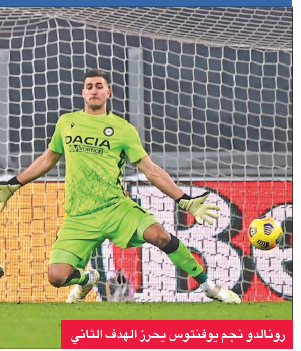
رونالدو نجم يوفنتوس يحرز الهدف الثاني

بقيت زعامة الدوري الإيطالي ومدينة ميلانو للفريق الأحمر والأسود في مستهل العام الجديد، بعد فوز ميلان على مضيفه بينيفينتو 2- صفر رغم النقص العددي في صفوفه، أمس الأول، في المرحلة السادسة عشرة التي شهدت فوزاً كبيراً لخصمه المقبل يوفنتوس حامل اللقب على ضيفه أودينيزي 4-1 بفضل ثنائية وتمريرة للبرتغالي كريستيانو رونالدو. ودخل ميلان، الباحث عن استعادة أمجاد الماضي والفوز باللقب للمرة الأولى منذ 2011 قبل أن يحكره يوفنتوس طوال تسعة مواسم متتالية، إلى لقاءه وبينيفينتو الذي يشرف عليه هدافه السابق فيليبو إنزاغي، وهو في المركز الثاني بعدما تربع جاره اللدود إنتر على الصدارة مؤقتاً باكتساحه ضيفه كروتوني 6-2. وبدأ ميلان مباراته وبينيفينتو بافضل طريقة بعد تقدمه في الدقيقة