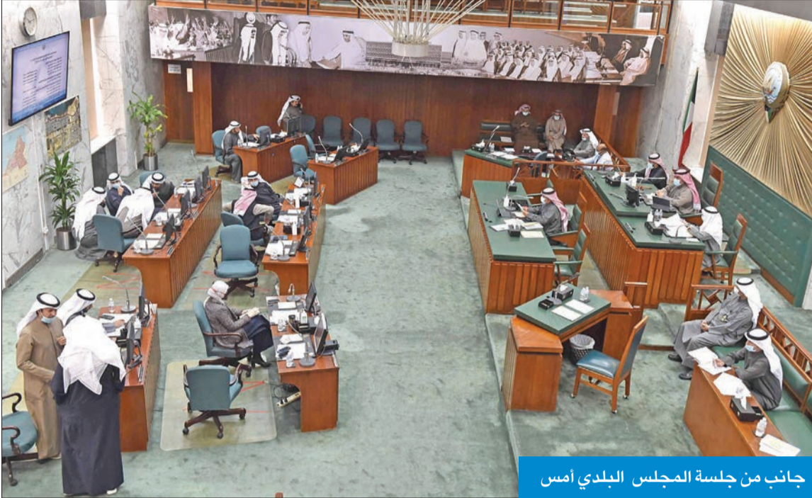
جانب من جلسة المجلس البلدي أمس

اعتمد تعديلات اللجنة القانونية والمالية وملاحظات الأعضاء عليها