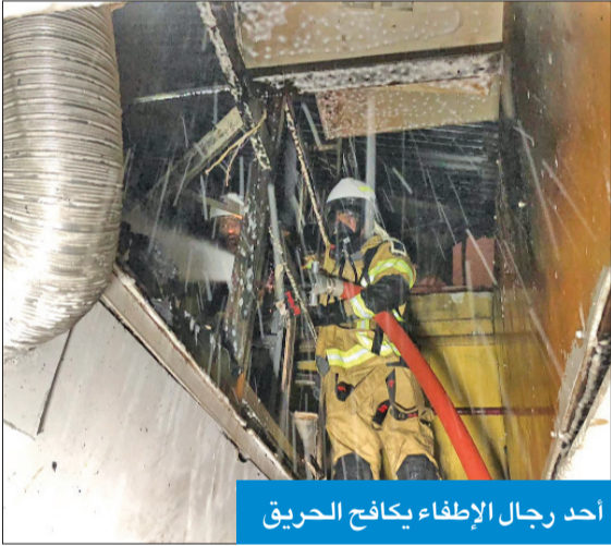
أحد رجال الإطفاء يكافح الحريق

تمكنت فرق قوة الإطفاء العام مساء أمس الأول من السيطرة على حريق اندلع في أحد الكراجات بمنطقة الشويخ الصناعية، ولم يسفر الحريق عن وقوع إصابات واقتصر على الخسائر المادية. وفي التفاصيل، قال مدير إدارة العلاقات العامة والإعلام بقوة الإطفاء العام، العقيد محمد الغريب، إن غرفة عمليات قوة الإطفاء العام تلقت بلاغاً يفيد باندلاع حريق في كراج بمنطقة الشويخ الصناعية، فتم توجيه مركزي إطفاء الشويخ الصناعي والشهداء إلى موقع البلاغ، وتبين أن الحريق اندلع في سندرة الكراج، فشرع رجال الإطفاء في مكافحة الحريق ومحاصرته والسيطرة عليه بسرعة قياسية، وحالوا دون امتداده إلى بقية أرجاء الكراج. وذكر الغريب أن ضباط مراقبة التحقيق في حوادث الحريق وضباط إدارة الوقاية انتقلوا إلى موقع البلاغ للمعاينة، وفتح تحقيق في أسباب اندلاع الحريق.