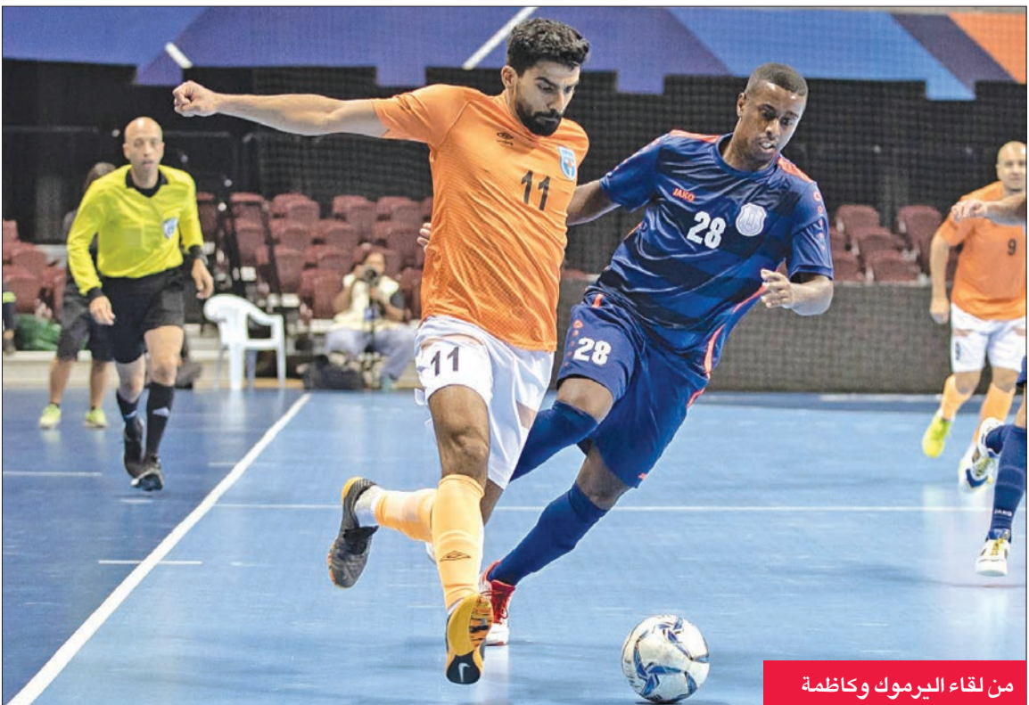
من لقاء اليرموك وكازمة