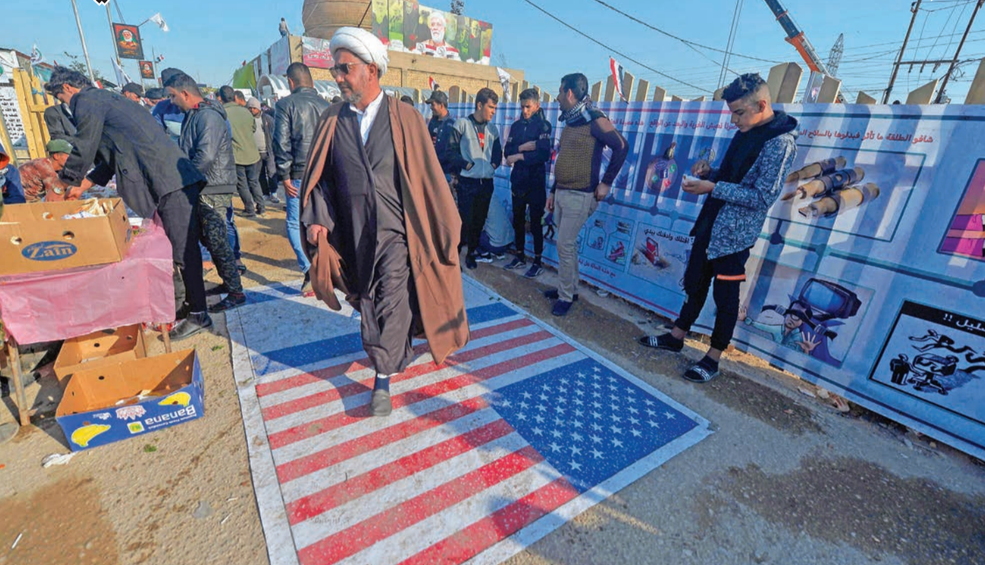
عراقيون يدوسون على علم أميركي خلال توجههم إلى مدافن وادي السلام في النجف لزيارة قبر أبو مهدي المهندس

مع تراجع احتمالات التصعيد العسكري بين واشنطن وطهران، يبدو أن الأخيرة قررت العودة إلى التصعيد النووي، معلنة أنها رفعت نسبة تخصيب اليورانيوم في منشأة فوردو إلى 20% في إجراء اعتبرته أوروبا انتهاكاً للاتفاق النووي، بينما أبقّت الولايات المتحدة حامله طائرات في الخليج.