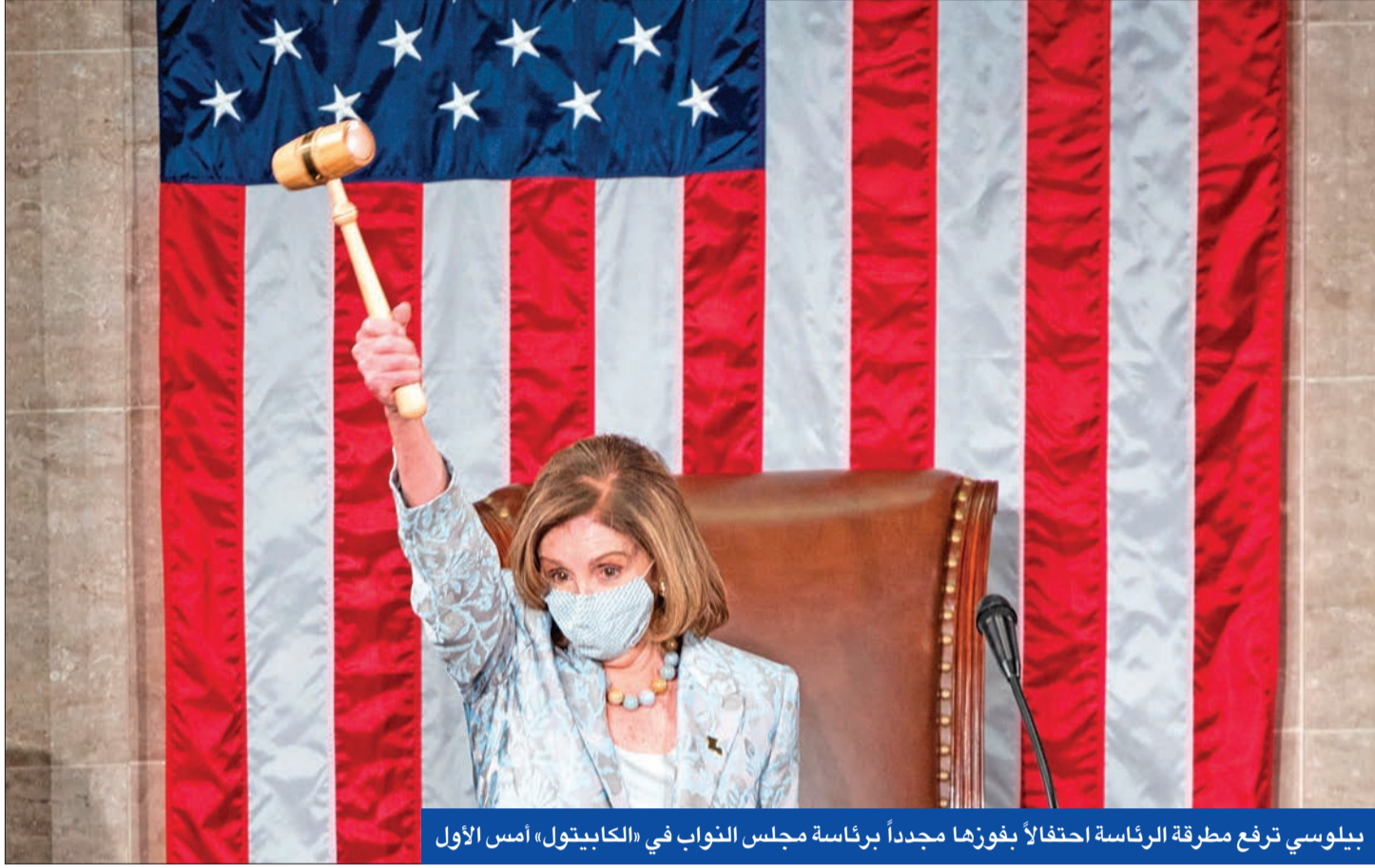
بيلوسي ترفع مطرقة الرئاسة احتفالاً بفوزها مجدداً برئاسة مجلس النواب في «الكابيتول» أمس الأول

ضجت الأوساط السياسية في واشنطن بالغضب، بسبب مكالمة هاتفية مسربة للرئيس المنتهية ولايته دونالد ترامب، يضغط فيها على سكرتير ولاية جورجيا لتغيير نتائج الانتخابات، في وقت حذر وزراء دفاع أميركا السابقون من تدخل الجيش في الجدل الدائر حول عملية نقل السلطة إلى الرئيس المنتخب جو بايدن. عشية انطلاق انتخابات إعادة الحاسمة في جورجيا لغالبية مجلس الشيوخ، نجح خصوم الرئيس الأمريكي دونالد ترامب في توجيه ضربة قوية له، بالكشف عن اتصال هاتفى مسرب تسبب في فضيحة سياسية له قبل مغادرة البيت الأبيض. وفي المكالمة الهاتفية التي سجلت دون علمه، واستغرقت ساعة واحدة، طلب ترامب من حاكم ولاية جورجيا الجمهوري براى رافسنبرغر «إيجاد» الأصوات الكافية لقب نتائج الانتخابات الرئاسية، وإلغاء خسارته أمام غريمه الديمقراطي جو بايدن. وفي مقتطفات من المكالمة، انتقد ترامب رفض رافسنبرغر لفوزه بجورجيا، وتحدث مرارا وتكرارا عن تزوير الانتخابات، وقال ترامب، في جزء من المكالمة: «شعب جورجيا غاضب، وشعب البلاد غاضب. ولا يوجد خطأ في قول إنكم قمتم بإعادة فرز الأصوات، ويجب أن تكون لديك انتخابات دقيقة. وأنت جمهوري»، مضيفا: «انظروا. كل ما أريد القيام به هو هذا. أريد فقط أن أجد 11780 صوتا، وهو ما لدينا أكثر منه. لأننا فزنا بالولاية». وحاول ترامب خلال المحادثة الطويلة، التي