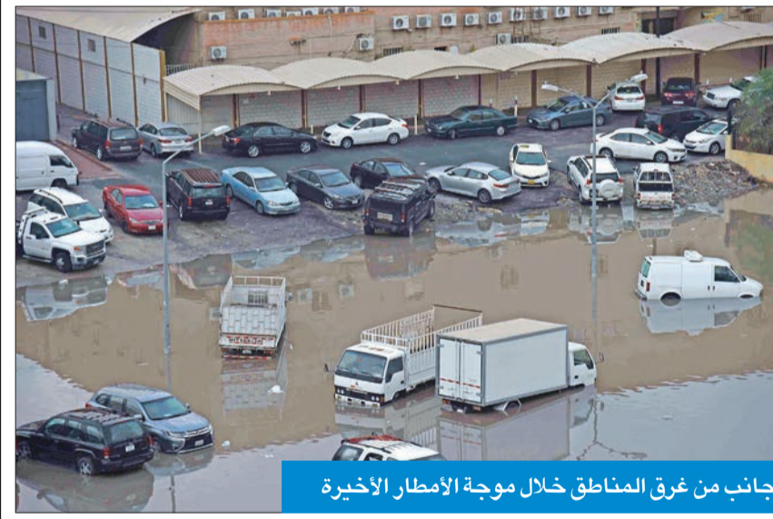
جانب من غرق المناطق خلال موجة الأمطار الأخيرة