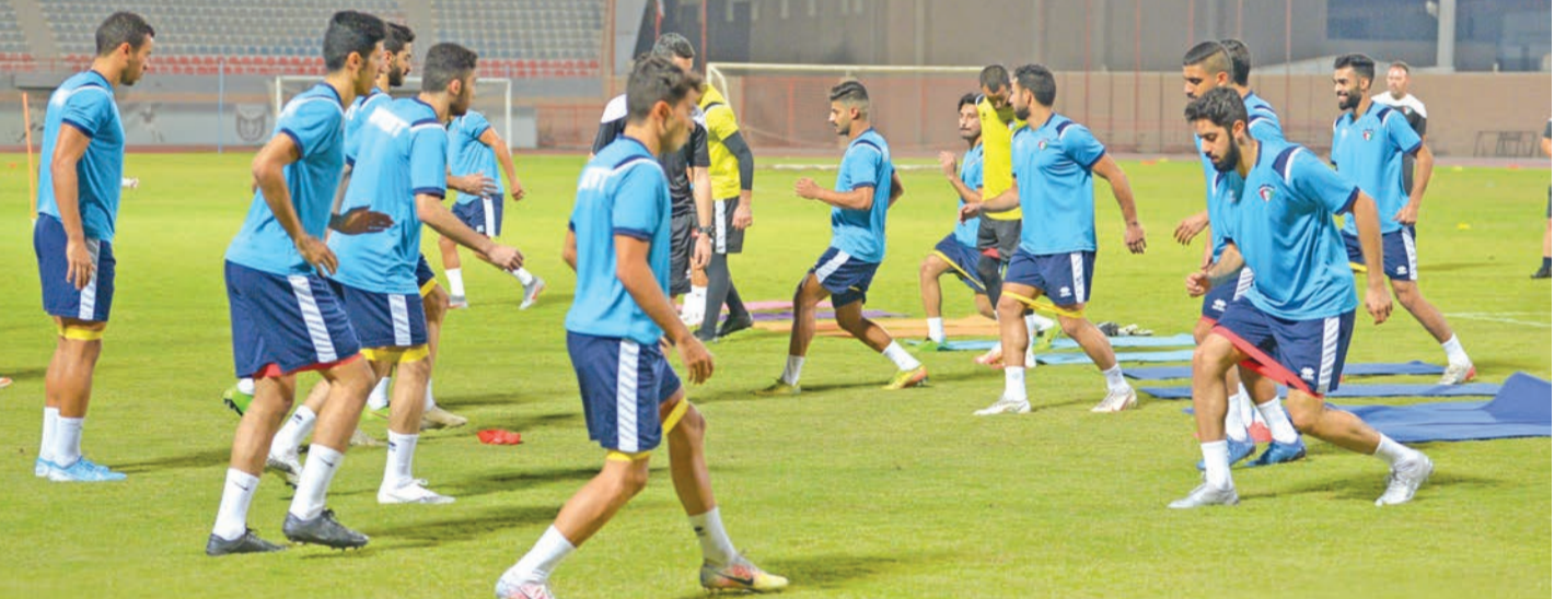
تدريب سابق للأزرق

فترة طويلة لصفوف المنتخب. وغيب عن التدريبات الحالية، وكذلك مباراة المنتخب اللبناني، لاعبو الفرق التي تأهلت إلى الدور نصف النهائي لبطولة كأس سمو ولي العهد، ومن بينها الكويت، وذلك لانشغالهم بالتدريبات مع فرقتهم، استعداداً للمواجهتين اللتين تحدد لهما الجمعة المقبل.