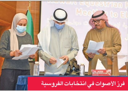
فرز الأصوات في انتخابات الفروسية

الفروسية أن كل المواقف نفس المصلحة الفارس والحواد. يذكر أن العلي حاكم دولي للفروسية، وتقوم بالتعليق على البطولات التي تقام في الكويت.