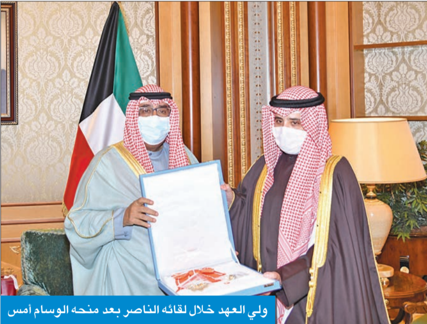
ولي العهد خلال لقائه الناصر بعد منحه الوسام أمس

تقديراً لجهود وزير الخارجية في خدمة الوطن وتنمية أواصر العلاقات بين الكويت وأشقائها صاحب السمو: مجهودك كبير... والله يعينك على الأشياء القادمة