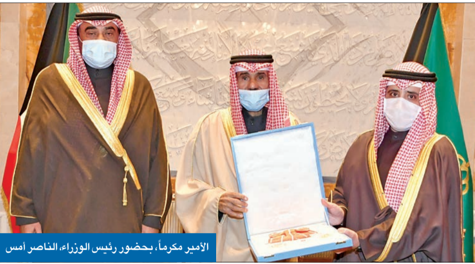
الأمير مكرماً، بحضور رئيس الوزراء الناصر أمس

• وزير الخارجية: نعمل بتوجيهاتكم السامية... وخدمة الوطن أكبر شرف