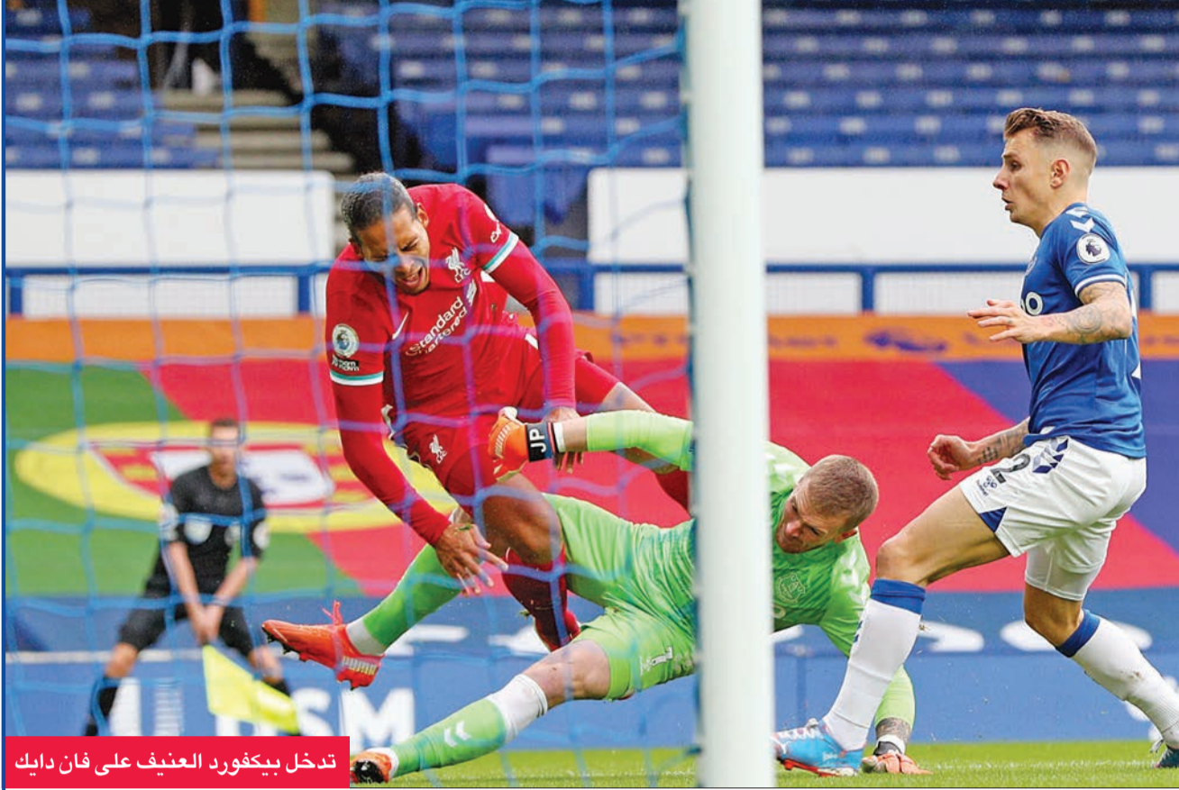
تدخل بيكفورد العنيف على فان دايك

في هذا الموسم، من الواضح أن حامل لقب ليفربول قد تعرض للظلم في العديد من القرارات التحكيمية، خاصة تلك التي عاد خلالها الحكام لتقنية الـ «فار».