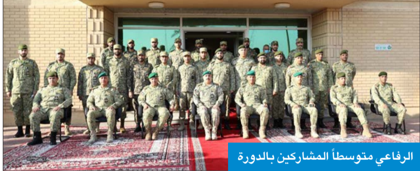
الرفاعي متوسطاً المشاركين بالدورة

أكد وكيل الحرس الوطني، الفريق الركن المهندس هاشم الرفاعي، أهمية الدورات التي يعدها الحرس الوطني بهدف تطوير قدرات الضباط في التخطيط والتنفيذ للعمليات القتالية الدفاعية والارتقاء بمهاراتهم في التخطيط والتنفيذ للعمليات المشتركة مع أجهزة الدولة. جاء ذلك خلال افتتاح الرفاعي، بحضور كبار القادة والضباط، دورة القيادة والأركان الصغرى التي يقيمها معهد تدريب قوات الحرس الوطني. ونقل وكيل الحرس إلى المشاركين تحيات القيادة العليا للحرس الوطني، ممثلة في رئيس الحرس الوطني سمو الشيخ سالم العلي، ونائب رئيس الحرس الوطني الفريق أول المقاعد الشيخ أحمد النواف. وقال إن دورة القيادة والأركان الصغرى تروى الضباط بمفهوم التخطيط الاستراتيجي ووضع التصورات المستقبلية والحلول المنطقية اللازمة وتوسيع مداركهم وزيادة ثقافتهم العامة وتنمية الفكر الإبداعي لديهم من خلال إدارة الحلقات النقاشية وإعداد البحوث الجماعية والفردية.