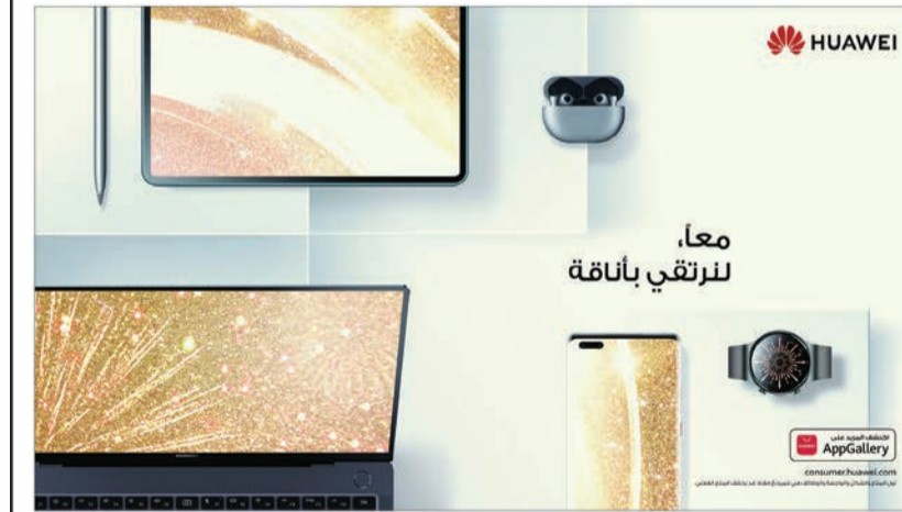
معاً، لنرتقي بأناقة

في بداية العام الجديد يجب أن تفكر في بعض القرارات التي تريد تحقيقها، سواء كان ذلك من حيث اللياقة البدنية أو الصحة أو امتلاك أحدث الأدوات المتصلة لتحافظ على تقدمك في إيقاع اليوم سريع الحركة. أصبح العالم الآن مدفوعاً إلى حد كبير بالتكنولوجيا، لذلك ليس من الغريب أن شقت الأدوات التقنية طريقتها إلى الأشياء التي نريد أن نتحصل عليها في العام الجديد، لاسيما أنها يمكن استخدامها لمساعدتنا في الحفاظ على لياقتنا وصحتنا واتصálnا بالعالم من حولنا.