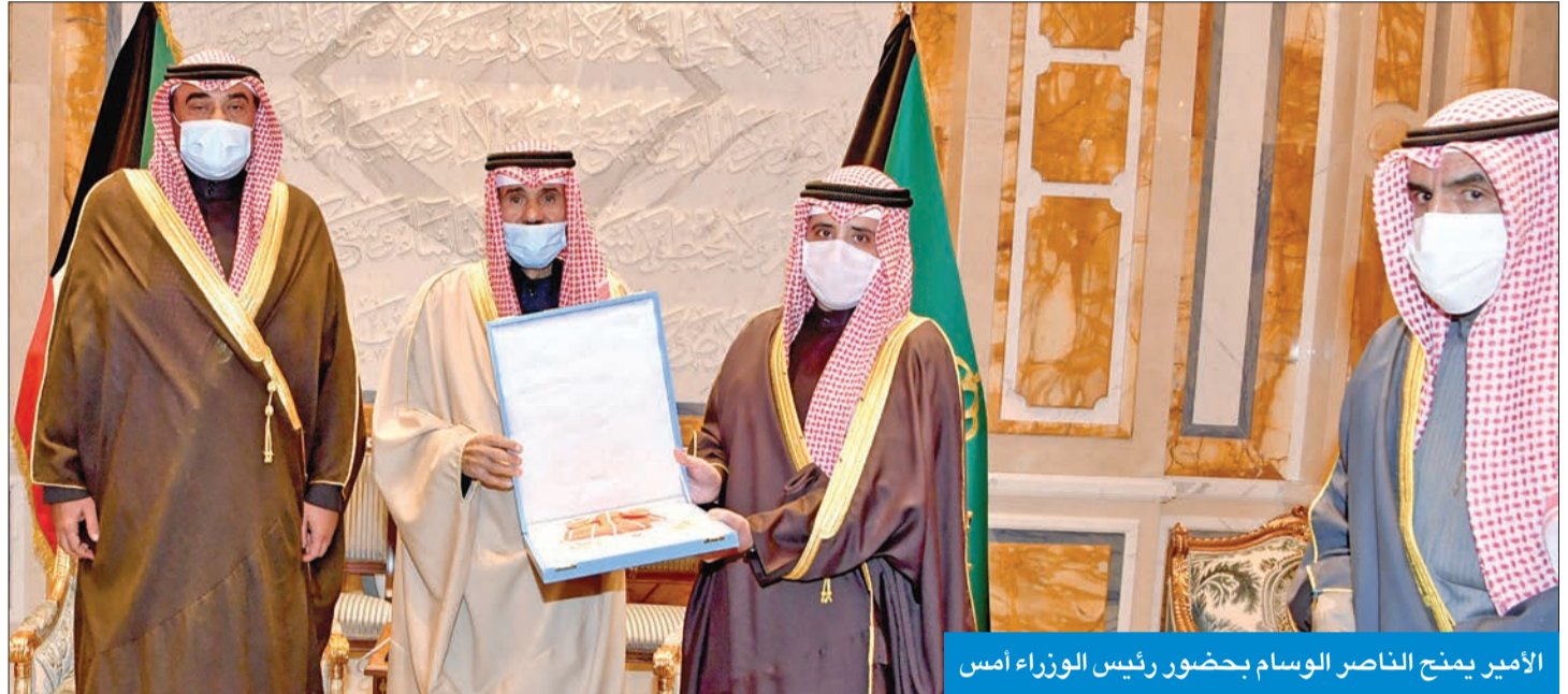
الأمير يمنح الناصر الوسام بحضور رئيس الوزراء أمس

«وسام الكويت ذو الوشاح من الدرجة الأولى» وأعرب الخالد عن خالص تهنأته بمنح صاحب السمو هذا الوسام الرفيع، والذي يأتي عرفانا وتقديرا للور الذي قام به في نجاح اجتماع الدورة 41 للمجلس الأعلى لدول مجلس التعاون لدول الخليج العربية.