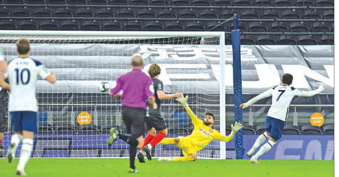
سون مين نجم توتنهام يحرز الهدف الثاني

برنتفورد من الدرجة الأولى بنتيجة 2-0 صفر في نصف النهائي. ويدين سير بير بالفوز للفرنسي موسا سيسوكو (12) والكوري الجنوبي سون هيونغ مين (70).