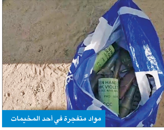
مواد متفجرة في أحد المخيمات

ما إذا كانت مواد متفجرة صالحة للاستعمال أم أنها مواد غير متفجرة.