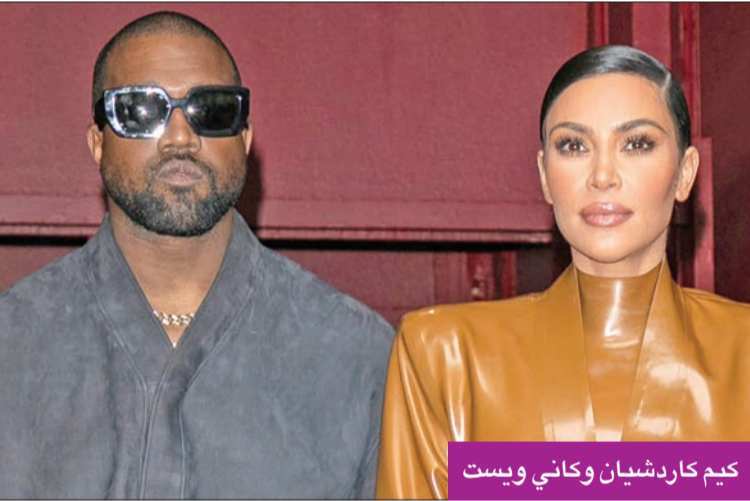
كيم كارديشيان وكاني ويست