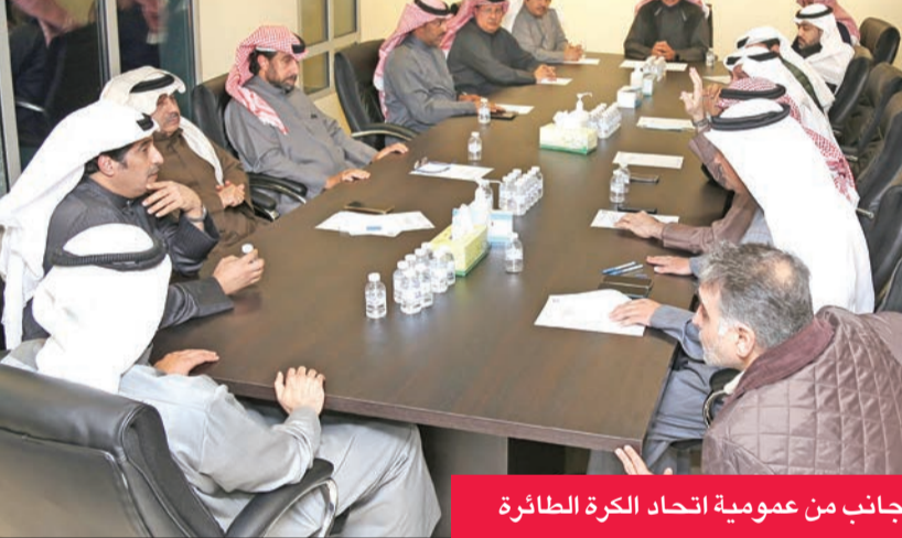
جانب من عمومية اتحاد الكرة الطائرة

أعلى مستوى وصولاً إلى المستوى المأمول، موضحة أنه سيتم كشف النقاب عن هذه الخطة خلال الفترة المقبلة.