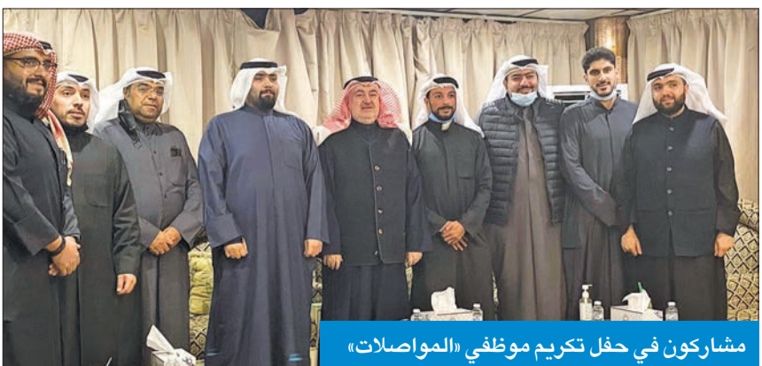
مشاركون في حفل تكريم موظفي «المواصلات»

العازمي: جهود كبيرة لـ «خدمات المشتركين» في منع سرقات كوابل الهواتف