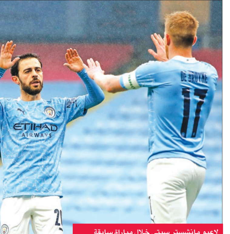
لاعبو مانشستر سيتي خلال مباراة سابقة

ويدخل فريق المدرب الإسباني جوزيب غوارديولا المباراة منتشياً بلوغه المباراة النهائية لمسابقة كأس الرابطة على حساب جاره مانشستر يونايتد (2-صفر) في أول ترافورد، والدور الرابع لمسابقة كأس الاتحاد على حساب برمنغهام سيتي (3-صفر)، لكنه سيفتقد خدمات هدافه التاريخي الدولي الأرجنتيني سيرخيو أغويرو لمخالطته أحد الأشخاص المصابين بفيروس "كوفيد-19". وعانى مانشستر سيتي مؤخراً من العديد من الإصابات بفيروس كورونا المستجد بلغت 11 حالة إيجابية بحسب غوارديولا، أبرزها لحارس مرماه البرازيلي إيدرسون ومواطنه المهاجم غابريال جيزوس وكايل ووكر والإسبانيان فيران توريس وأريك غارسيا، وتسببت في تأجيل القمة ضد إيفرتون في 28 ديسمبر الماضي.