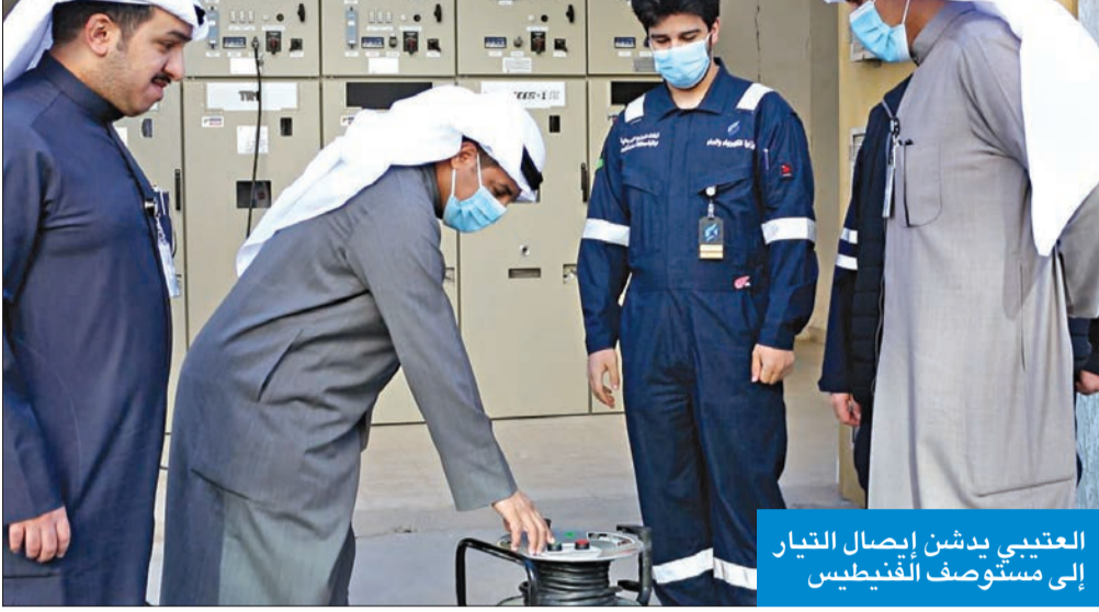
العتيبي يهتف بإيصال التيار إلى مستوصف الفينطيس

العتيبي: تنسيق لفتح باب التراخيص والبناء في «المطلاع» و«جنوب عبدالله المبارك»