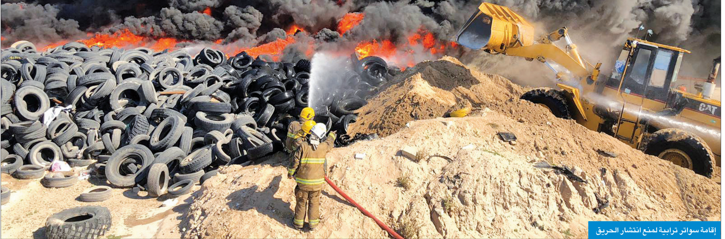
إقامة سوانر ترابية لمنع انتشار الحريق

حريق جديد في الإمارات... «البيئة» تؤكد أنه بفعل فاعل... و«الإطفاء»: شبهة جنائية