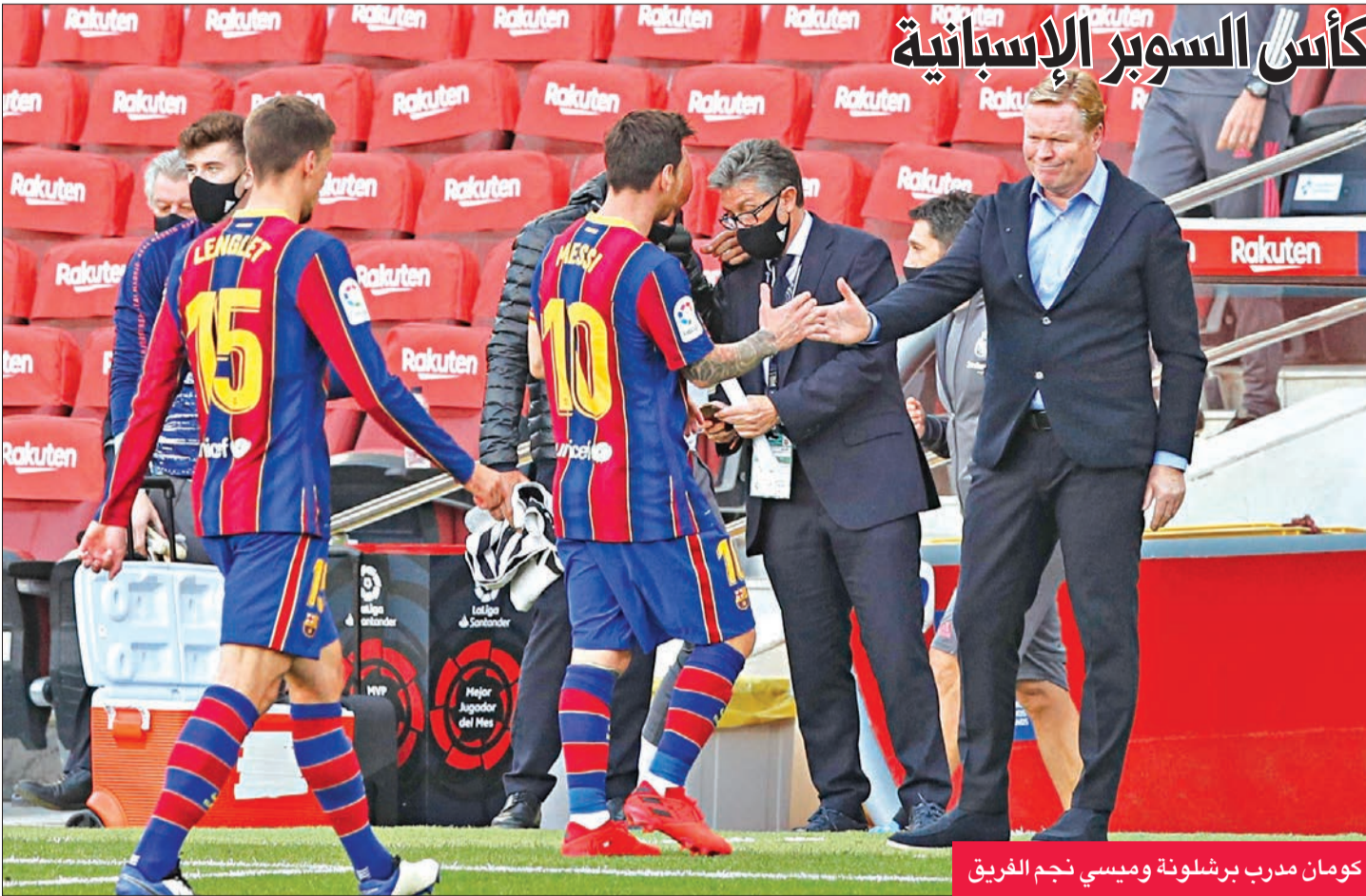
يلتقي ريال سوسبيداد في نصف نهائي كأس السوبر الإسباني