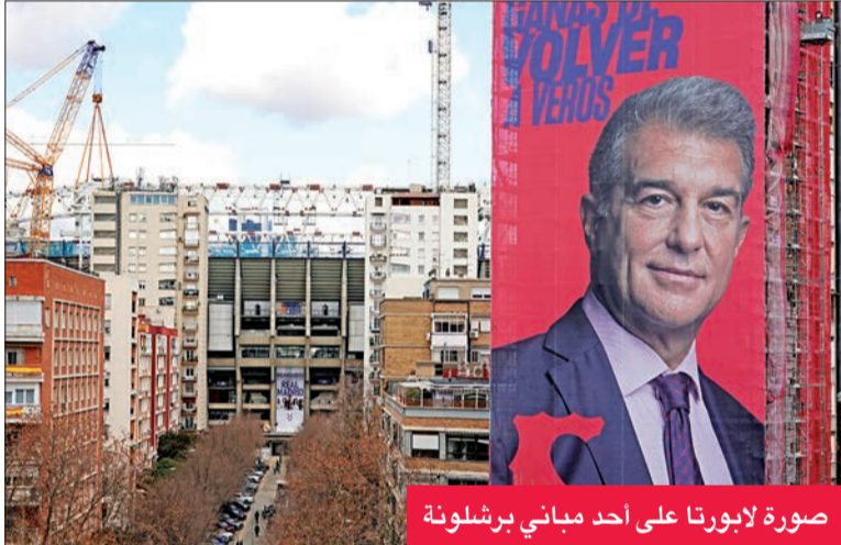
صورة لابورتا على أحد مباني برشلونة

أعلن نادي برشلونة الإسباني الإثنين أن رئيسه السابق جوان لابورتا وثلاثة مرشحين آخرين اجتازوا المرحلة الأولى من الترشح لانتخابات الرئاسة، بحصول كل منهم على 2257 توقيعاً ضرورياً من المنتسبين للنادي. وأشار النادي الكتالوني في بيان له إلى أن المرشحين المقبولين إضافة إلى لابورتا هم فيكتور فونت وتوني فريتشا وإيميلي روسو، مضيفاً "لم يتمكن جوردو فاري وكزافييه فيلاجوانا وأغوستي بينيديتو ولويس فرنانديز وألبيرتي ريبيرا من الوصول إلى الحد الأدنى من عدد التوقيعات المطلوبة". وبدأت عملية عد التوقيعات والتحقق من صحتها أمس على أن تنتهي الخميس. وتخص اللوائح في النادي على أنه يجب على المرشح الطامح لخوض الانتخابات جمع ما لا يقل عن 2257 توقيعاً ضرورياً من المنتسبين للنادي (المنشجون-المساهمون) ليصبح مرشحاً رسمياً. ووفقاً لبيان "بلاوغرانا" جمع لابورتا أكبر عدد من التوقيعات (10272) تلاه فونت (4713) وفريتشا (2822) وروسو (2510). وتقام الانتخابات في 24 يناير الجاري.