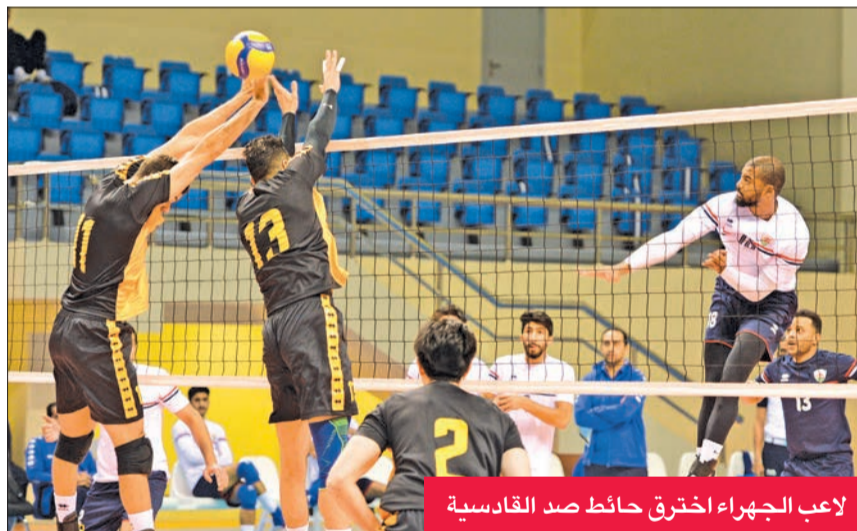
لاعب الجهراء اخترق حائط صد القادسية

فجّر فريق الجهراء لكرة الطائرة مفاجأة مدوية بفوزه على القادسية، في لقاء ماراثوني، بثلاثة أشواط مقابل شوطين، في المباراة التي جمعتهما أمس الأول على صالة الاتحاد بمجمع الشيخ سعد العبدالله، في ختام الجولة السابعة من الدوري الممتاز للعبة، وجاءت نتائج الأشواط كالتالي: (25-21، 25-14، 25-29)، (25-22، 25-18).