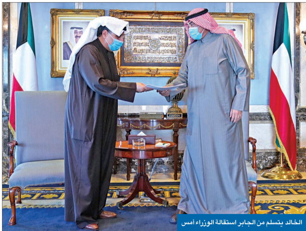
الخالد يتسلم من الجابر استقالة الوزراء أمس

نتيجة لتعذر التعاون مع مجلس الأمة بعد استجواب لرئيسها أيده 38 نائباً