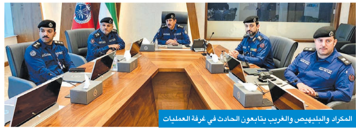
المكراد والبليهيض والغريب يتابعون الحادث في غرفة العمليات

ضباط التحقيق أحوالاً عينات وأثراً مهمة من الموقع إلى مختبر الإطفاء