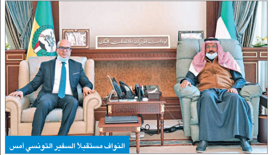
النواف مستقبلاً السفير التونسي أمس

استقبل نائب رئيس الحرس الوطني الشيخ أحمد النواف، في ديوانه بالرئاسة العامة للحرس الوطني سفير تونس لدى الكويت الهاشمي عجيلي، وتم خلال اللقاء بحث الموضوعات ذات الاهتمام المشترك. ورحب النواف بالسفير التونسي، مؤكداً عمق العلاقات بين الكويت وتونس الشقيقة.