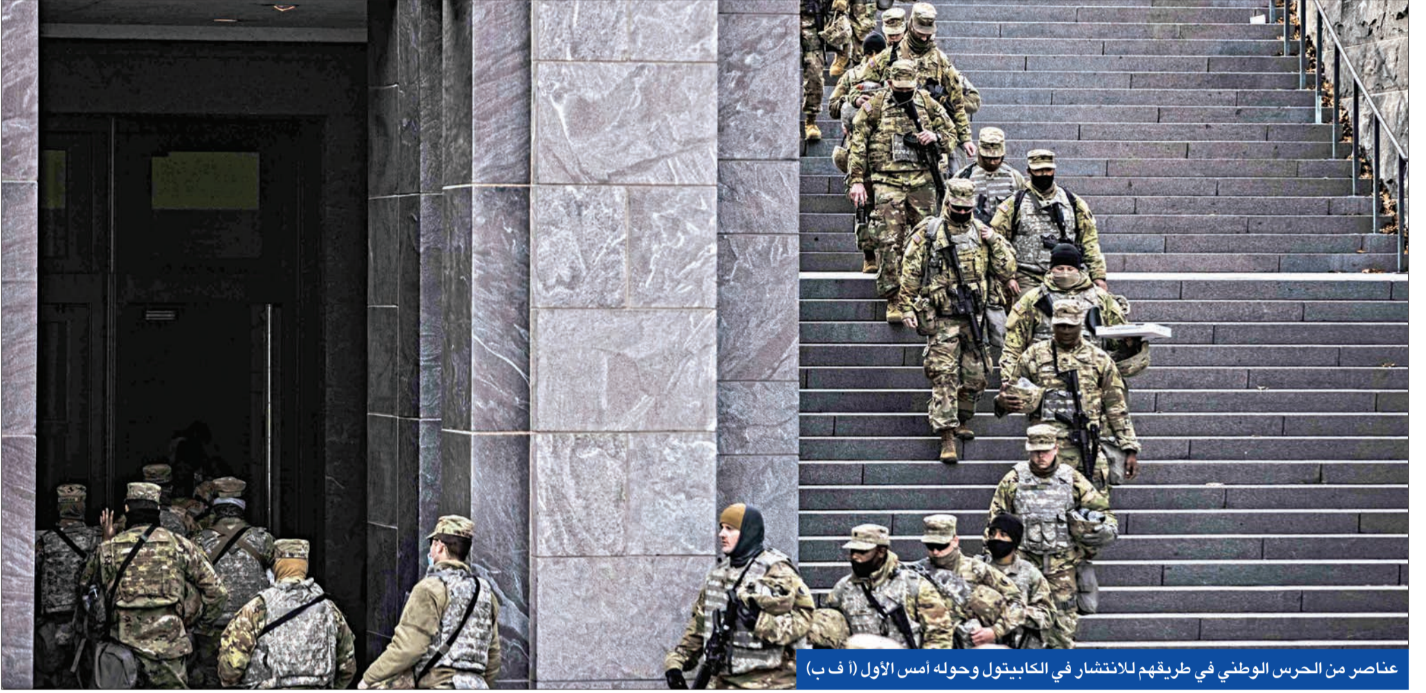
عناصر من الحرس الوطني في طريقهم للانتشار في الكابيتول وحوله أمس الأول

• توقيف مسلح قرب «الكابيتول» • مشهد محاكمة ترامب بدأ يتشكل... ونائب يدعو لاعتقاله