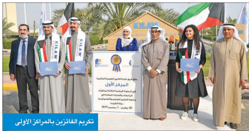
تكريم الفائزين بالمراكز الأولى

قانونية في مسابقة المحكمة القانونية، وتتمني لديه القدرات من بعد. وأشار الكندري إلى أن الكلية تقوم بدور ريادي في دعم قدرات الطلاب وصقل مواهبه التعليمية، من خلال فتح باب المشاركة والمنافسة مع جهات تعليمية عالمية والوقوف على منح الطلاب مجموعة من الدورات العملية التي تصقل مواهبه وتتمني لديه القدرات القانونية». وأضاف أن «الإنجاز الكبير يتمثل بحصول طلبة الكلية على المركز التاسع عالمياً في مسابقة فيليب جيسب من بين 745 فريقاً عالمياً باللغة الإنجليزية، وتجاوز طلبتنا من خلال المسابقة جامعات عربية عالمياً بالقانون».