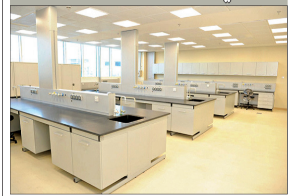
مختبر فحص الأغذية

بعد خطوة رئيسية لنقل اختصاص الرقابة على المواد الغذائية من بلدية الكويت إلى الهيئة وفقاً لقانون إنشائها رقم 112 لسنة 2013. وأشارت إلى أنه سيتم استكمال إجراءات تجهيز المختبر لبدء مرحلة التشغيل الفعلي، وذلك كتحكم منظومة الرقابة على المواد الغذائية بجميع مراحلها وتوحيد الجهة المعنية بتطبيقها، مما يؤدي إلى نقلة نوعية في جودة الخدمة المقدمة. وأكدت بهبهاني أنه سيتم نقل مقر إدارة الأغذية والمستوردة من موقعها الحالي بمنطقة الصليبيخات إلى الموقع الجديد بـ «الشويخ الصناعية»، وذلك خلال الأيام القليلة المقبلة.