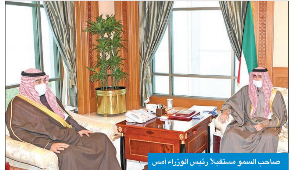
صاحب السمو مستقبلاً رئيس الوزراء أمس

استقبل سمو ولي العهد، الشيخ مشعل الأحمد، بقصر السيف، أمس، رئيس مجلس الأمة مرزوق الغانم، واستقبل سموه كذلك، رئيس مجلس الوزراء أنس الصالح، ووزير الداخلية الشيخ تامر العلي.