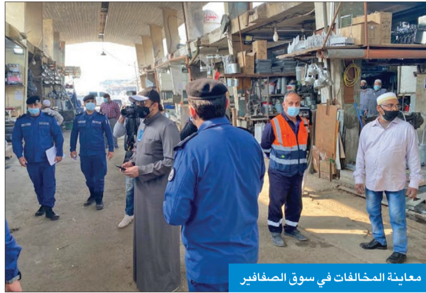
معاينة المخالفات في سوق الصفافير

أكد محافظ العاصمة الشيخ طلال الخالد أن قطع التيار الكهربائي بالكامل عن سوق الصفافير جاء كإجراء قانوني من الجهات المعنية، لوجود مخالفات جسيمة للمحلات والورش الموجودة، بما يهدد الأرواح والممتلكات وينسب بشكل مستمر في الكوارث وتهديد البيئة المحيطة.