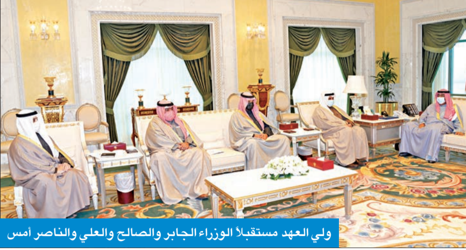
ولي العهد مستقبلاً الوزراء الجابر والصالح والعلي والناصر أمس

استقبل سمو ولي العهد، الشيخ مشعل الأحمد، بقصر السيف، أمس، رئيس مجلس الأمة مرزوق الغانم، واستقبل سموه كذلك، رئيس مجلس الوزراء أنس الصالح، ووزير الخارجية الشيخ الدكتور أحمد الناصر، ووزير الداخلية الشيخ تامر العلي.