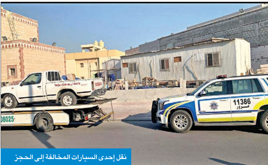
نقل إحدى السيارات المخالفة إلى الحجز

الأحداث، تمهيدا لإحالتهم إلى نيابة الأحداث، لافتا إلى أن رجال المرور تمكنوا من ضبط 71 مستهتراً، إلى جانب وافدين يقودان مركبتين دون الحصول على رخصة سوق وتمت إحالتهم إلى إدارة الإبعاد تمهيدا لإبعادهما عن البلاد.