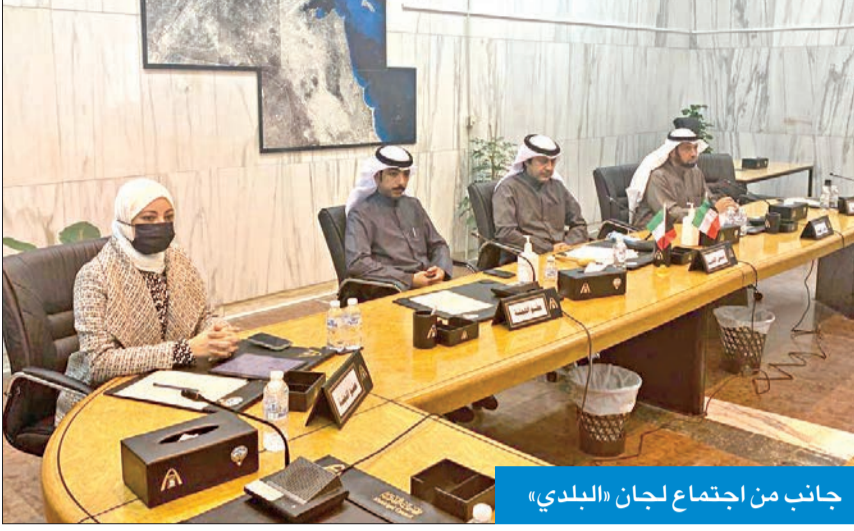
جانب من اجتماع لجان «البلدي»