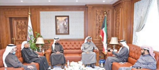
فليطح مستقبلاً الشعفار في مكتبه

في تقديم كل أوجه الدعم لتمكين الشقيق الإماراتي من مواصلة مسيرة عطائه على رأس الاتحاد الآسيوي للدراجات الهوائية،