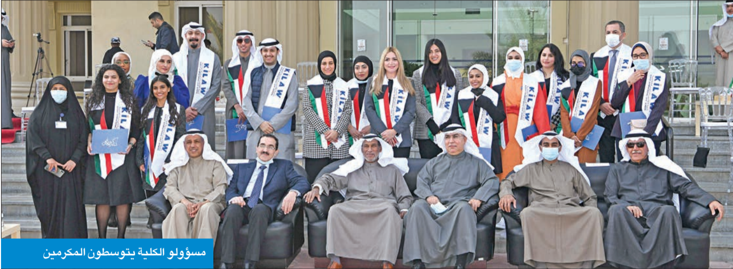
مسؤولو الكلية يتوسطون المكرمين