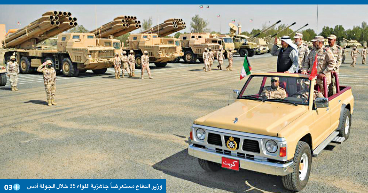
وزير الدفاع مستعرضاً جاهزية اللواء 35 خلال الجولة أمس 03+