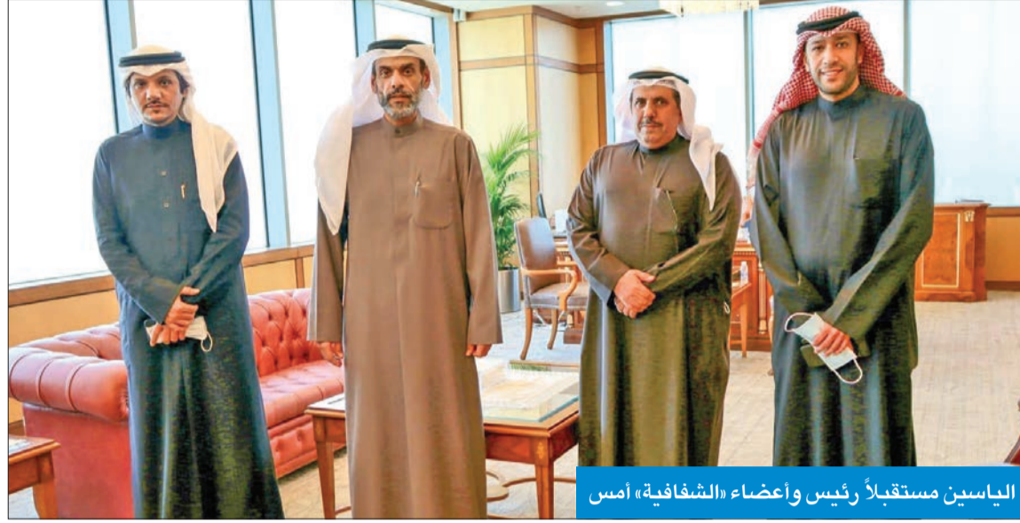
الياسين مستقبلاً رئيس وأعضاء «الشفافية» أمس

أكد وزير العدل د. نواف الياسين، أن تقدم الكويت بـ7 مراكز في مؤشر مدركات الفساد الصادر من منظمة الشفافية الدولية، أخيراً، يعكس الجهود الحكومية المخلصة في تعزيز النزاهة ومكافحة أوجه الفساد وتطوير التشريعات خلال العامين الماضيين.