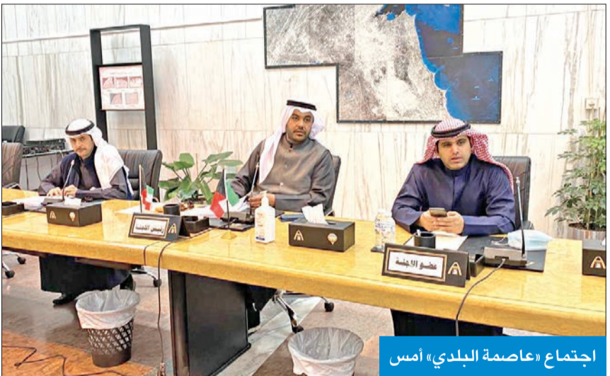
اجتماع «عاصمة البلدي» أمس

«عاصمة البلدي» وافقت على استحداث ممشي في «جابر الأحمد»