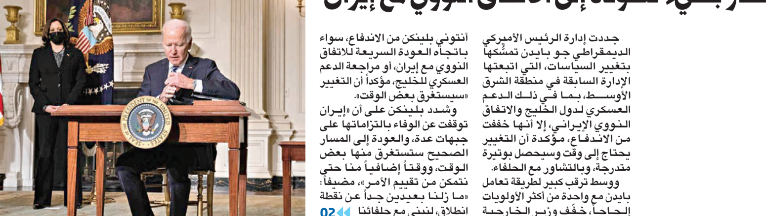
انتونيو بلينكن مع حلفائنا 02<

مسار بطيء للعودة إلى الاتفاق النووي مع إيران