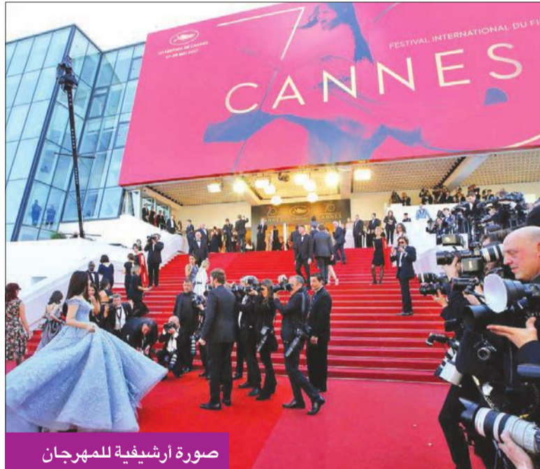
صورة أرشيفية للمهرجان

يذكر أن غوميز ركزت خلال الفترة الماضية على تصوير مشاهد مسلسلها الكوميدي الجديد «Only Murders In the Building» في الولايات المتحدة الأمريكية، ومن المقرر أن يُعرض العمل على شبكة hulu.