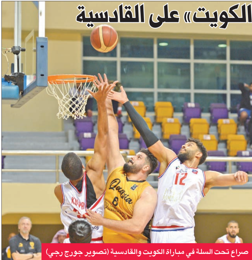
صراع تحت السلة في مباراة الكويت والقادسية