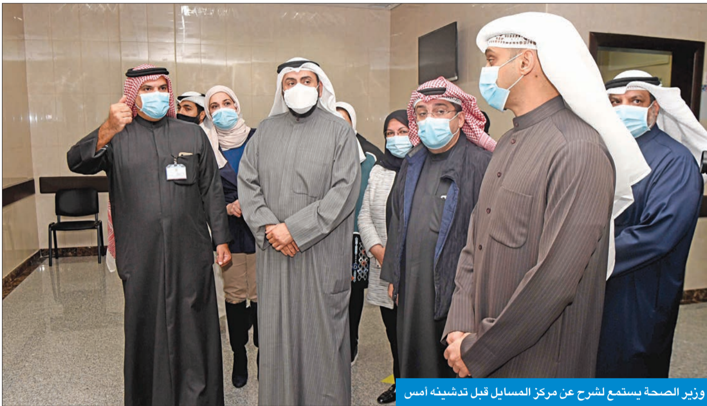
وزير الصحة يستمع لشرح عن مركز المسائل قبل تدشينه أمس

● باسل الصباح: 20 ألف شخص الطاقة الاستيعابية اليومية للتطعيم بعد انضمام المستوصفات ● وزير الصحة دشّن مركز المسائل للتطعيم ضد «كورونا»