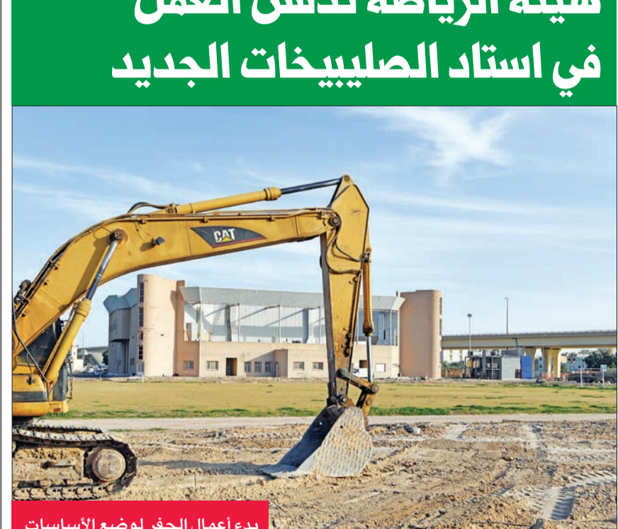
بدء أعمال الحفر لوضع الأساسات

دشن قطاع شؤون الصيانة والإنشاءات والمرافق بالهيئة العامة للرياضة عمله لتشديد استاد الصليبيخات الجديد، إذ شهد موقع العمل وضع حجر الأساس إيماناً بالعمل الرسمي في المشروع وفق أحدث المعايير الهندسية والطرز المعمارية الرياضية. ويمثل استاد الصليبيخات الجديد نقلة نوعية كبيرة للنادي في ظل فتح باب الاستثمار داخل الأندية لتعزيز قدراتها المالية وتقديم خدمة أفضل لأعضاء الجمعية العمومية وأهالي المنطقة، كما