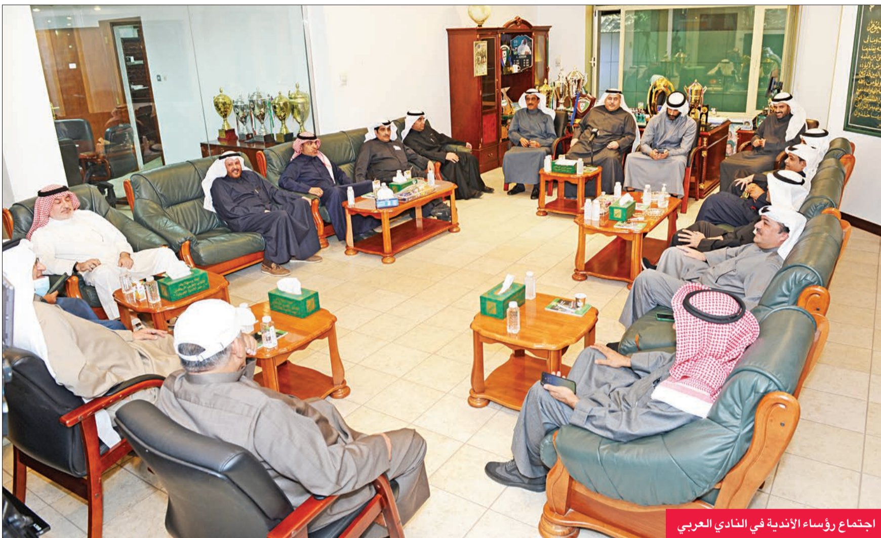
اجتماع رؤساء الأندية في النادي العربي

تشكل وفداً للاجتماع مع رئيس مجلس الأمة ومقابلة وزير الشباب بعد غد