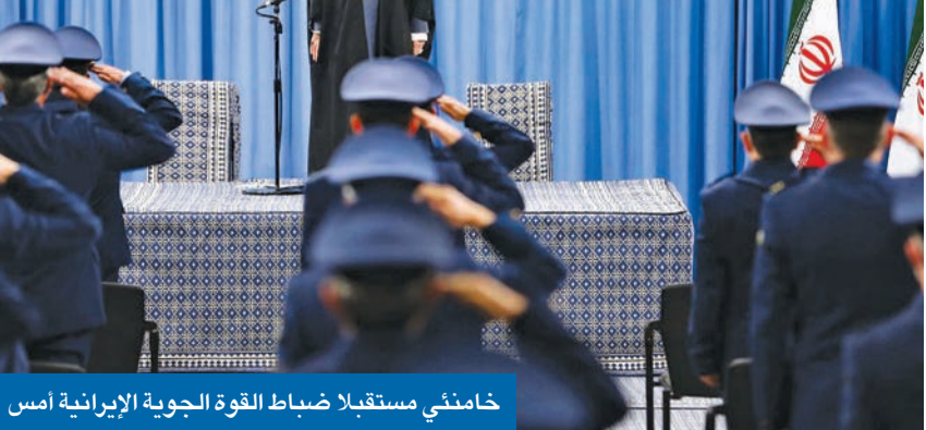
خامنئي مستقبلاً ضباط القوة الجوية الإيرانية أمس

مفاوضات عبر شاشات التلفزيون بين الرئيس الأميركي ومرشد إيران الأعلى