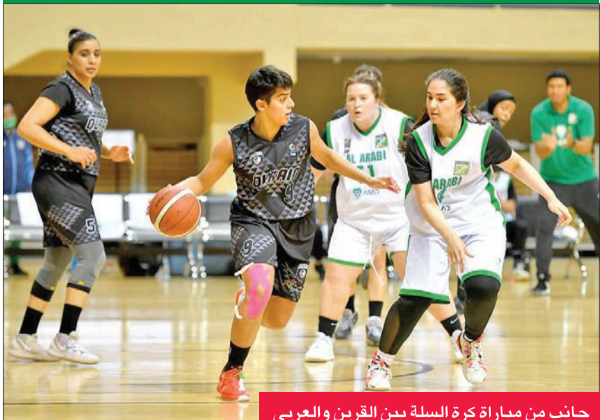
جانب من مباراة كرة السلة بين القرين والعربي

على فريق العربي ب بنتيجة 54-47. وبذلك ارتفع رصيد القرين والفتاة إلى 4 نقاط لكل منهما، بينما ارتفع رصيد فريق العربي أ وب إلى نقطتين لكل منهما، وسيتوقف الدوري النسائي بعد انتهاء الجولة الثانية امتثالاً لقرار مجلس الوزراء بإيقاف النشاط الرياضي.