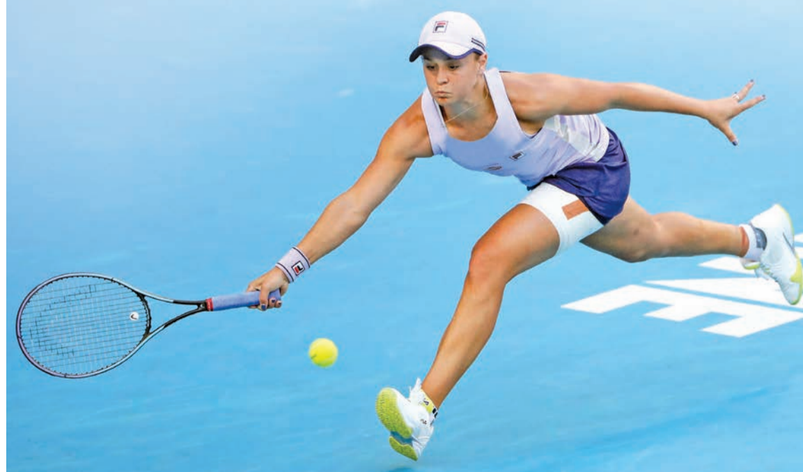
بارتي خلال منافسات بطولة أستراليا

واصلت الأسترالية المصنفة أولى أنشلي بارتي عروضها القوية وعبرت أمس إلى الدور الرابع من بطولة أستراليا المفتوحة، أولى البطولات الأربع الكبرى في كرة المضرب، في حين أهدر الروسي دانيل مدفيديف المصنف رابعاً تقدمه بمجموعتين، ثم حقق فوزه الأول بعد خمس مجموعات في مسيرته، أمام الصربي فيليب كراينوفيتش. وأقيمت مباريات أمس غيغاب الجماهير بعد قرار السلطات المحلية إكمال البطولة دون متفرجين لخمسة أيام على الأقل،