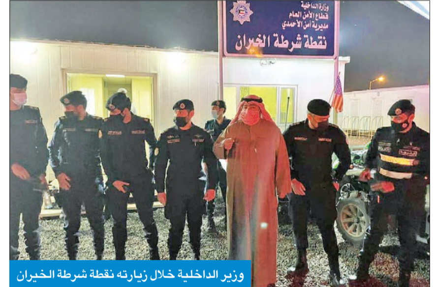
وزير الداخلية خلال زيارته نقطة شرطة الخيران

فتحت الإدارة العامة للعلاقات والإعلام الأمني بوزارة الداخلية ما تم تداوله على أحد مواقع التواصل الاجتماعي، بشأن وجود حساب باسم وزير الداخلية الشيخ ثامر العلي. وأوضحت الإدارة في بيان لها، أن هذا الحساب لا يعود إلى الوزير، وليس له صلة به، وأنه لا يوجد له أي حساب على أي من مواقع التواصل، سواء «تويتر» أو «فيسبوك» أو «انستغرام».