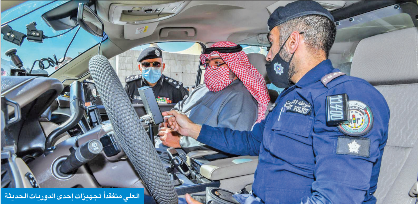
العلي متفقدًا تجهيزات إحدى الدوريات الحديثة

تفقد «الخيران الصحي» و«صباح الأحمد» البحرية ومخافر بالفروانية والعاصمة و«المرور» ومجمعات