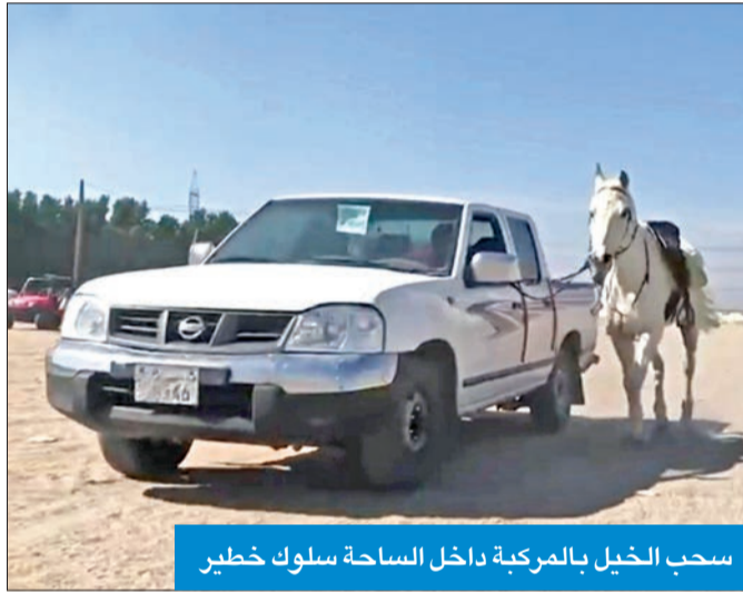
سحب الخيل بالمركبة داخل الساحة سلوك خطير

و«بوني» للتاجير دون خضوعها لأي فحوص أو رقابة طبية