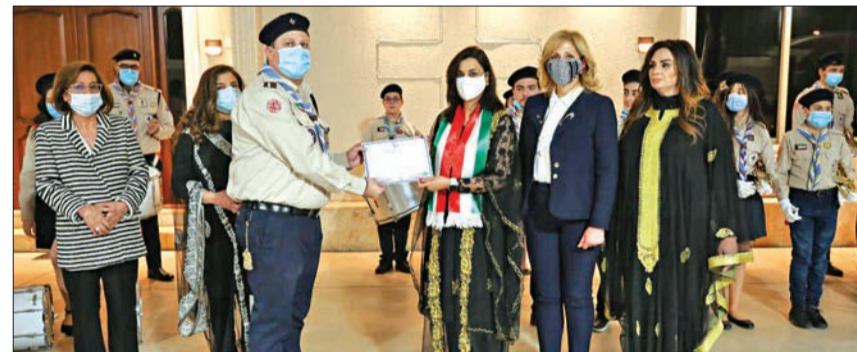
جانبا من الاحتفال