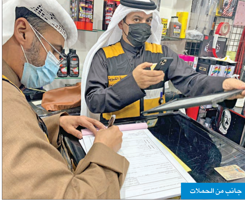
جانب من الحملات

وكشف رئيس قسم إزالة المخالفات في بلدية الفروانية فهد الموزري أن مفتشي البلدية يعتمدون الباركود الآلي في التفتيش لمنع التلاعب والتزوير في التراخيص الخاصة