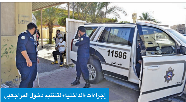
إجراءات «الداخلية»، لتنظيم دخول المراجعين

بالتوجه إلى هذا المكتب المؤقت في نادي المعاقين طوال فبراير الجاري لانجاز الإجراءات المتعلقة بتمديد جوازات السفر تمكيناً للمراجعين من اتمام إجراءات أقاماتهم لا سيما