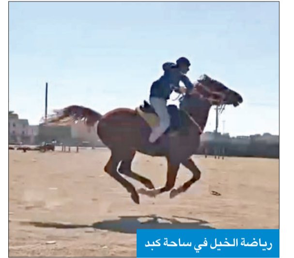
رياضة الخيل في ساحة كبد