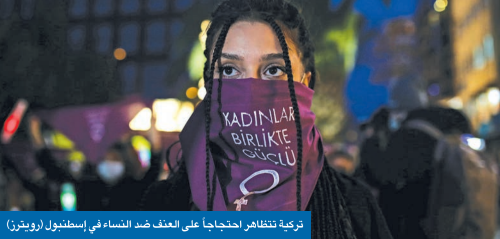
تركية تتظاهر احتجاجاً على العنف ضد النساء في إسطنبول (رويترز)

تضم مصر والخليج وصولاً إلى القرم... وتستثني إسرائيل