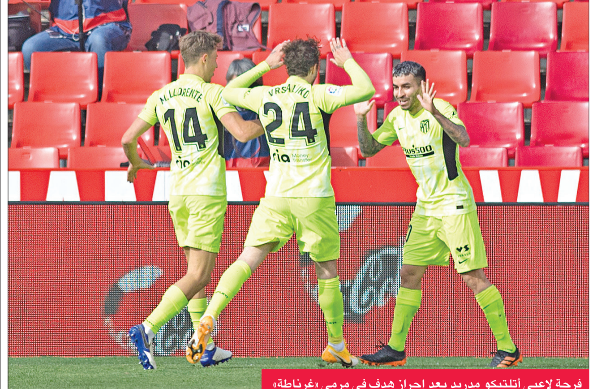
فرحة لاعبي أتليكو مدريد بعد إحراز هدف في مرعى "غرناطة"

وكان أتليكو الطرف الأفضل، لكن الحارس البرتغالي روي سيلفا منع الهادفين الأوروغوياني المخضرم لويس سواريز متصدر ترتيب هدافي الدوري، الذي تخلى عنه برشلونه، والأرجنتيني أنخل كوريا من الوصول إلى شبكاه. استمر عدم إقناع أتليكو في الشوط الثاني، في حين بدأ غرناطة خطراً في الركلات الثابتة، حتى أنقذه ماركوس يورنتي بيسارية زاحفة من حافة المنطقة في الزاوية البعيدة إلى يسار الحارس سيلفا (63). وتنافس سيميوني الصعداء، لكن ليس لوقت طويل، فمن ركنية لاحقة