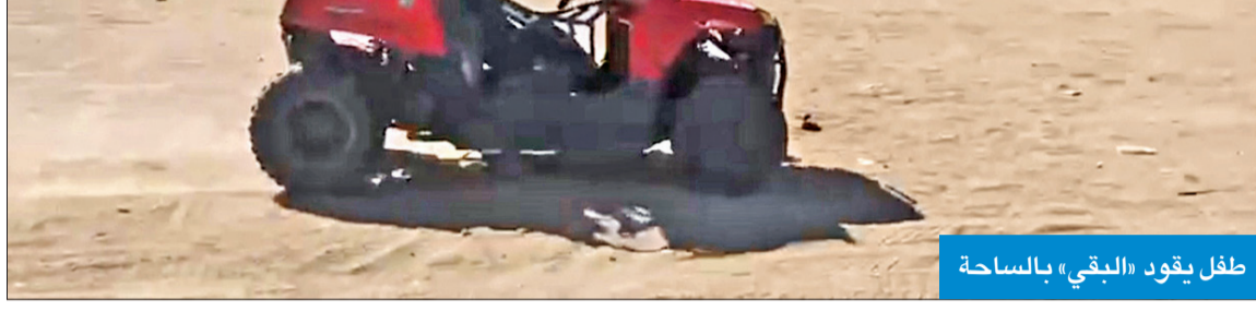
طفل يقود «البي» بالساحة

● الموقع أسير سندان البلدية و«الداخلية» ومطربة الاشتراطات الصحية ● مواطنون ومقيمون: شر لا بد منه وسط ظروف «كورونا»