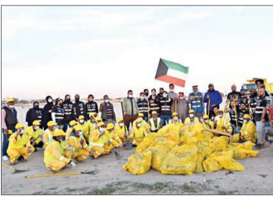
جانب من الحملة

انطلقت حملة نظافة البر في منطقة الجهراء تحت شعار «عمار يا كويت أجمل» بدعم من الرئيس الفخري لحملة عمار يا كويت الشبيخة أمل الحمود وإدارة النظافة وإشغالات الطرق في بلدية الجهراء. وقالت الرئيسة الفخرية للحملة إن الهدف منها وطني لمساندة بلدية الكويت وإدارة النظافة، مضيئة خلال انطلاق الحملة أن وجود الشباب هو رسالة معبرة أرادت حملة «عمار يا كويت» أن توصلها للجميع بأن الكويت أولاً وأخيراً ومن الواجب خدمتها في شتى المجالات. ومن جهته، أكد مدير إدارة النظافة وشغالات الطرق في فرع بلدية الجهراء فهد الفريفة، استمرار فرق البلدية في تقديم السند اللوجستي لحملة «عمار يا كويت» وللفرق التطوعية، من خلال توفير الأليات والمعدات اللازمة، وعمالة النظافة، والأكياس البيئية لرفع المخلفات التي تلقى بالبر أو الأماكن الأخرى، إضافة إلى تسخير كل إمكانياتها لمساندة تلك الفرق في حملاتها، لاسيما المتعلقة بتنظيف الأماكن التي يرتادها الجمهور. ومن جهته، أشاد رئيس مجلس إدارة حملة عمار يا كويت الإعلامي ناصر المهلهل بالفرق التطوعية وتحديتها الشباب الذين تركوا وسائل الترفيه والراحة والبحث عن سعادتهم، بتنظيف تلك الأماكن وهذه بحد ذاتها رسالة وطنية شبابية.