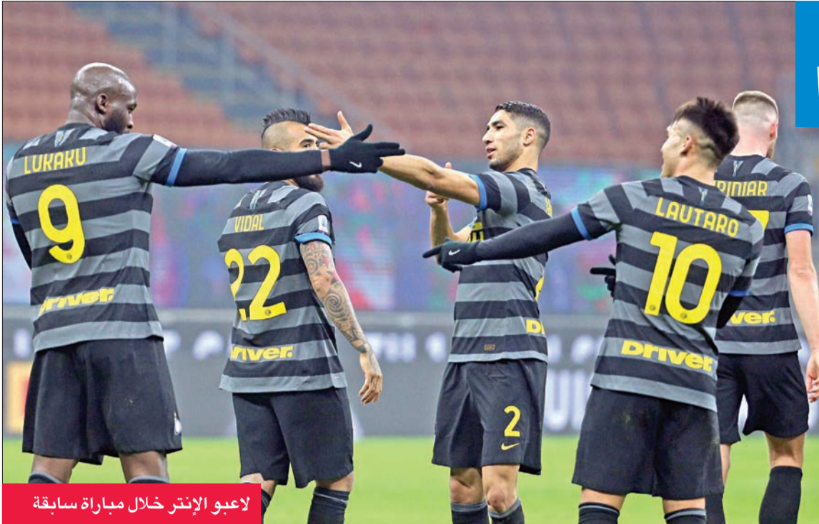
لاعبو الإنتر خلال مباراة سابقة

إلى 24 نقطة في المركز الرابع عشر بفارق الأهداف خلف بينيفينتي، الذي رفع رصيده إلى 24 نقطة في المركز الثالث عشر.