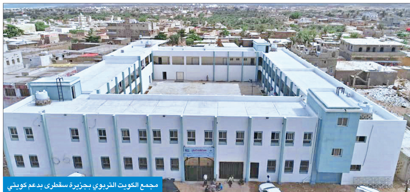
مجمع الكويت التربوي بجزيرة سقطرى بدعم كويتي

شهد الأسبوع الماضي عطاء إنسانيا كويتيا متجددا لتقديم الدعم للمتعثرين والنازحين والمحتاجين في اليمن، مع التركيز بشكل خاص على الجهود الإغاثية والتعليمية، إلى جانب مشروعات توفير المياه. وقد وقع محافظ لحج اليمنية، اللواء أحمد تركي، مذكرة تفاهم مع مؤسسة التواصل للتنمية الإنسانية لتنفيذ 4 مشروعات للمياه يستفيد منها نحو 120 ألف مواطن يمني بتمويل من جمعية الرحمة العالمية» بالكويت.