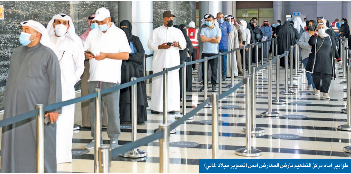
طوابير أمام مركز التطعيم بأرض المعارض أمس

● بعد زيادة مراكزها إلى 25 ● توافر اللقاح يضاعف المعدل ● 55 ألفاً تلقوا الجرعات ● 400 ألف سجلوا في المنصة... ورسائل «الصحّة» امتدت لتغطية الشباب من 18 إلى 40 عاماً