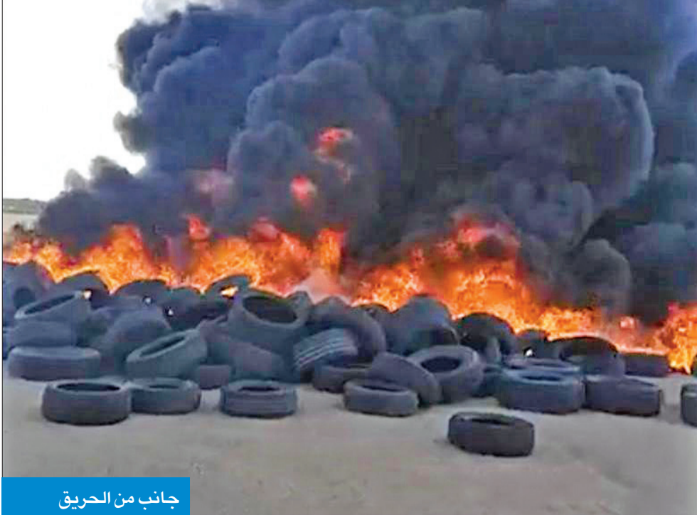
جانب من الحريق

تمكنت 3 فرق بقوة الإطفاء العام، مساء أمس، من السيطرة على حريق اندلع في موقع تجميع الإطارات في بر السالمي.