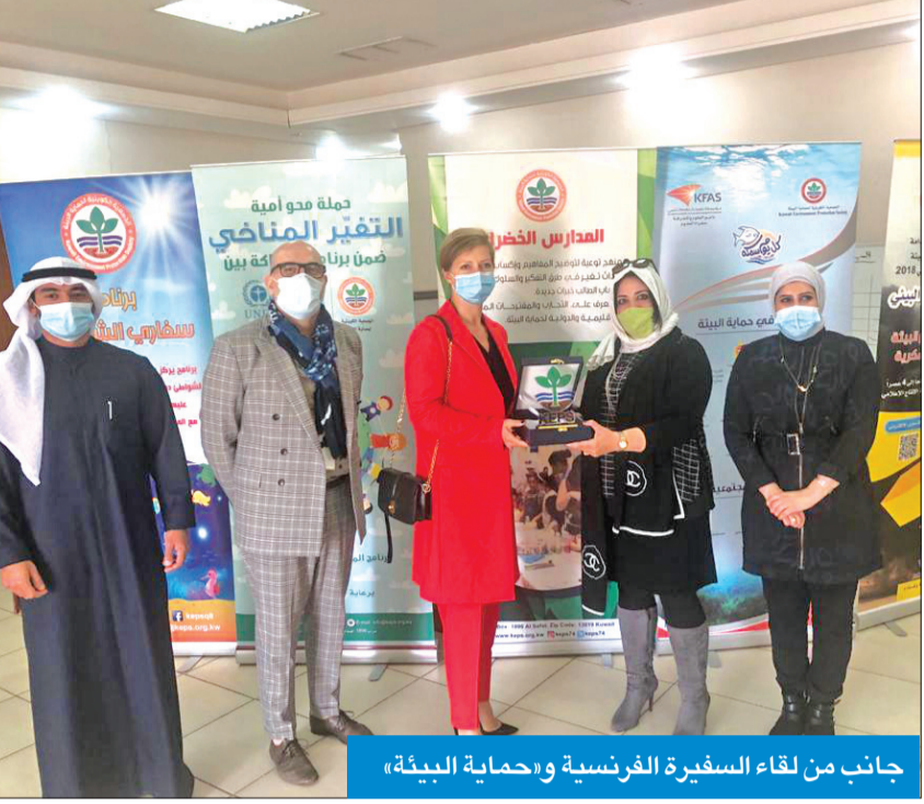
جانب من لقاء السفارة الفرنسية و«حماية البيئة»

عن تعطيل العمل الإداري لموظفي الجمعية يوم الخميس الماضي. وأكدت أنه تم إجراء المسحة الطبية اللازمة لرئيسة الجمعية كونها كانت مخالطة للسفيرة الفرنسية وظهرت نتيجة الفحص والمسحة سلبية، مضيفة «تبقى تلك النتائج المباشرة نتيجة الالتزام بالاشتراطات الصحية أثناء أداء أعمالنا في الجمعية.