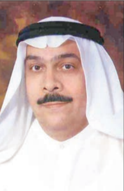
تصر ال هيد

«انستغرام» بعدد محدود من الأعضاء، ولا يمكن لأي أحد آخر خلفهم الدخول إلى المجموع والاطلاع على محادثاتهم، مما ينفي ركن العلانية، إذ إن تلك المحادثات، مع رفضها من المحكمة، فإنها ذات خصوصية، ولم يطلع عليها الكافة، إذ إن العلانية من أركان جرائم مخالفة قانون الوحدة الوطنية والمطبوعات والنشر.