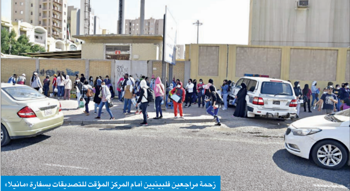
زحمة مراجعين فلبينيين أمام المركز المؤقت للتصديقات سفارة «مانبلا»

بعدما تسبب وقف العمل بالتصديقات في السفارة في انتهاء فترة صلاحية جواز عدد منهم، وبالتالي تعذر تمديد أقاماتهم وفرض بعض غرامات التأخير عليهم نتيجة ذلك.