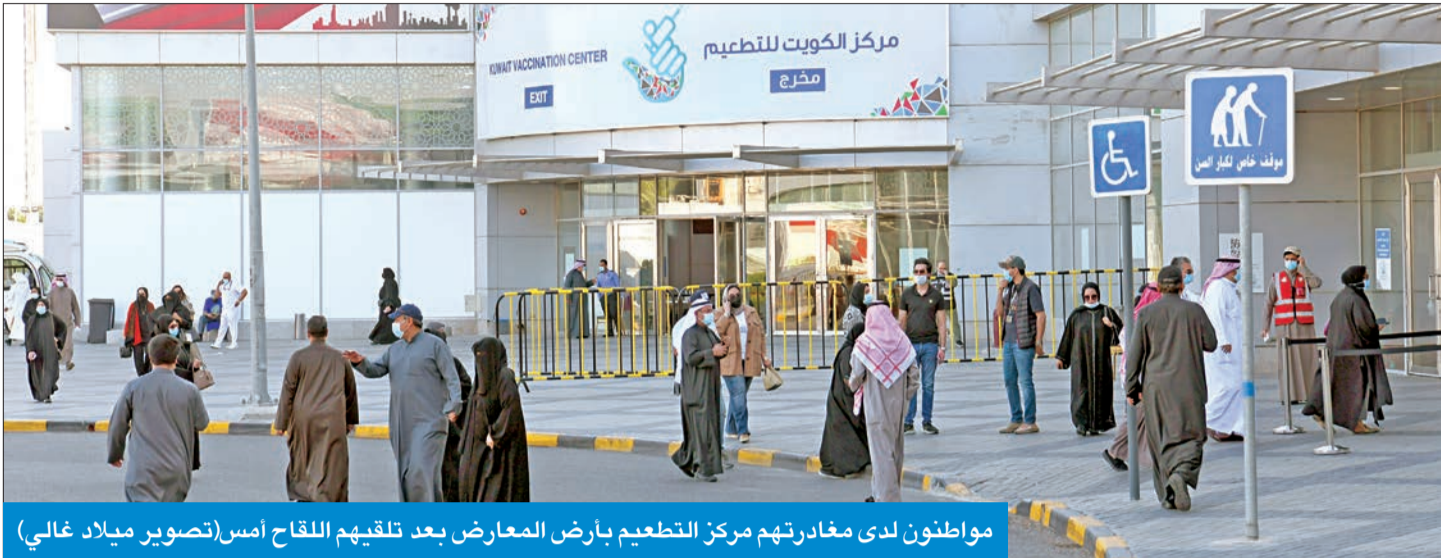
مواطنون لدى مغادرتهم مركز التطعيم بارض المعارض بعد تلقيهم اللقاح أمس

فريق طبي ماليزي في البلاد قريباً... وتدشين خدمة التطعيمات بالمستشفيات اليوم