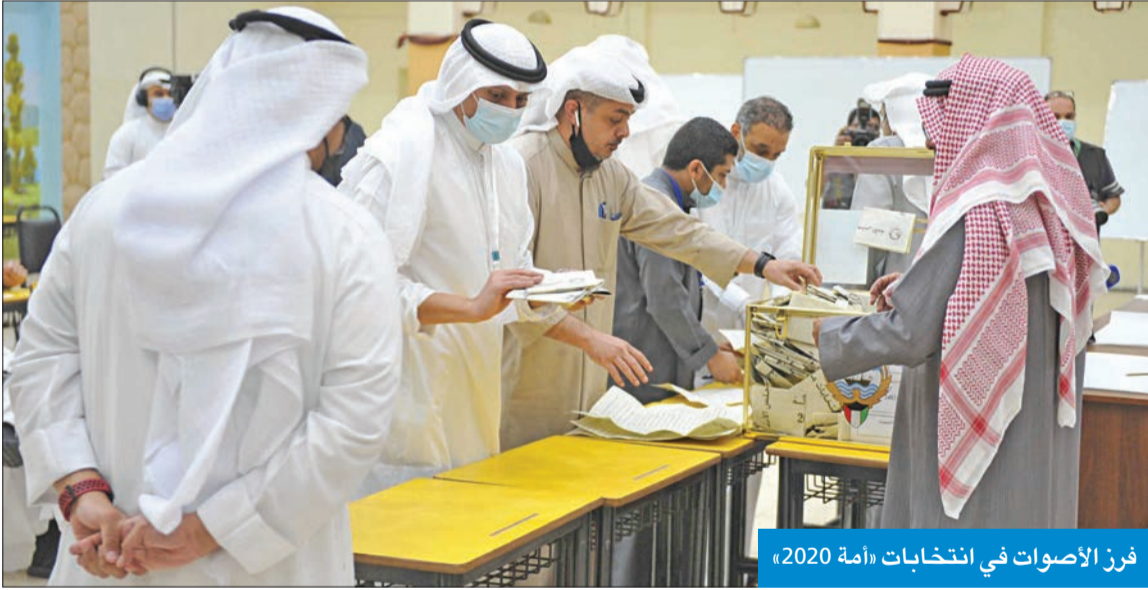
فوز الأصوات في انتخابات «أمة 2020»

«عُرِضت يومين ثم أُوقِف الموقع طبقاً للإجراءات المتبعة»