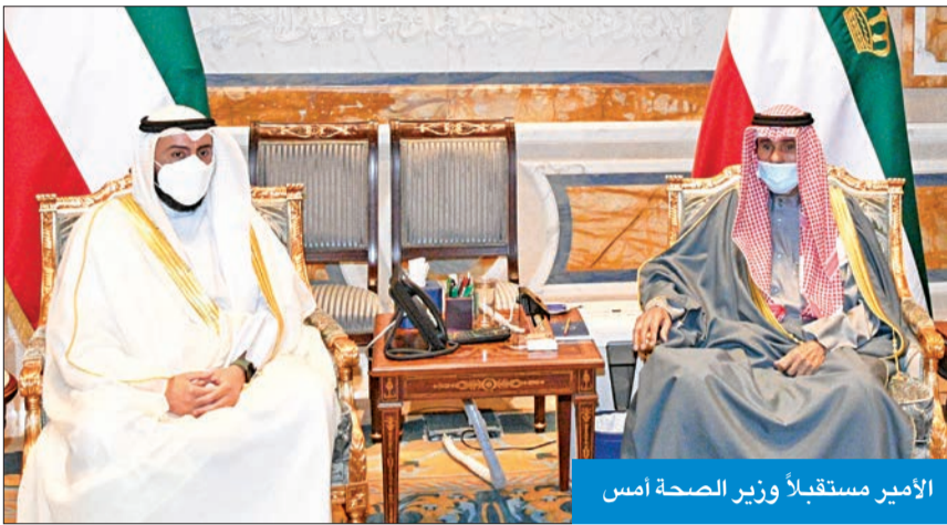
الأمير مستقبلاً وزير الصحة أمس

كما اطلع سموه على ما قدمه وزير الصحة من استعراض شامل لمجلس الأمة حول تلك الجهود، وعلى سير عملية التطعيم التي تقوم بها "الصحة" بكل سهولة ويسر. وجدد سموه ثقته برئيس مجلس الوزراء وتقديره لما رأسها الخالد، من جهود بناءة لمواجهة مختلف تداعيات هذه الجائحة، مشيداً سموه بالجهود التي تقوم بها مختلف الجهات الرسمية المختصة والجهات الأخرى، لاسيما وزارة الصحة، ممثلة بكوادرها وطاقمها الطبية، ووقوفهم في الصفوف الأمامية للتصدي لهذا الوباء رغم ما يتعرضون له من مخاطر العدوى، مجسدين بذلك الروح الوطنية العالية التي يتمتع بها أبناء الوطن العزيز. وقدّر سموه التعاون التام لرئيس مجلس الوزراء مع أعضاء مجلس الأمة لمعالجة مختلف القضايا التي تهم الوطن والمواطنين، وتجاوز أي معوقات، متطلعاً سموه إلى تكاتف كل الجهود لخدمة الوطن العزيز وإعلاء شأنه.