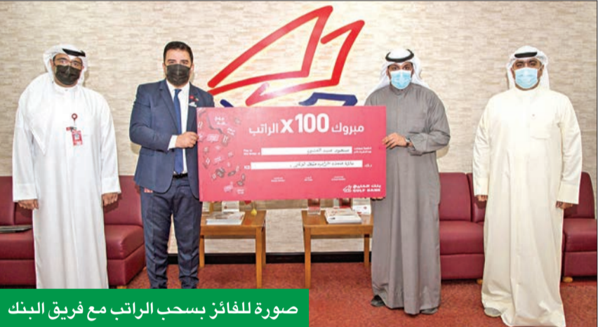
صورة للفائز بسحب الراتب مع فريق البنك

الخاص. كما يقدم البنك عروضاً خاصة للعاملين في الصوف الأولى تقديراً لجهودهم المستمرة في مواجهة فيروس كورونا. عرض العاملين في الصوف الأولى وصمم بنك الخليج عرضاً خاصاً للموظفين الكويتيين العاملين في الصوف الأولى الراغبين بتحويل رواتبهم إلى بنك الخليج، حيث يحصلون على مجموعة من المميزات التي تبدأ فور إتمام عملية تحويل الراتب، منها هدية نقدية حتى 200 دينار، أو قرض بدون فوائد حتى 10 آلاف دينار، أو عرض من الخيارات المعتمدة لقرض السيارة، بالإضافة إلى بطاقة ائتمانية فيزا أو ماستر كارد مغفلة من الرسوم السنوية للسملة الأولى، وبطاقة ماستر كارد وورلد مجانية (عند إنفاق مبلغ 5000 دينار). إلى جانب مزايا أخرى تشمل صندوق امانات مجاناً لمدة سنة عند فتح الحساب، وخدمات كونسورجس مجانية، ونسيئة فائدة خاصة للودائع، وكما تتم إعادة تصنيف العميل لفئة أعلى من بين عملاء البنك. ويمكن أن يستفيد من هذا العرض الموظفون الكويتيون العاملون في الإدارة العامة للإطفاء، والحرس الوطني، والطيران المدني (بما فيها الخطوط الجوية الكويتية)،