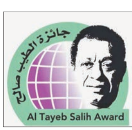
شعار جائزة الطيب صالح