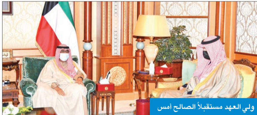
ولي العهد مستقبلاً الصالح أمس

استقبل سمو ولي العهد الشيخ مشعل الأحمد، بقصر بيان صباح أمس، رئيس مجلس الأمة مرزوق الغانم، ثم رئيس مجلس الوزراء سمو الشيخ صباح الخالد. واستقبل سموه، نائب رئيس مجلس الوزراء وزير الدولة لشؤون مجلس الوزراء أنس الصالح.