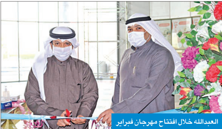
العبدالله خلال افتتاح مهرجان فبراير

العبدالله: خصومات تصل إلى 70% على أكثر من 500 صنف