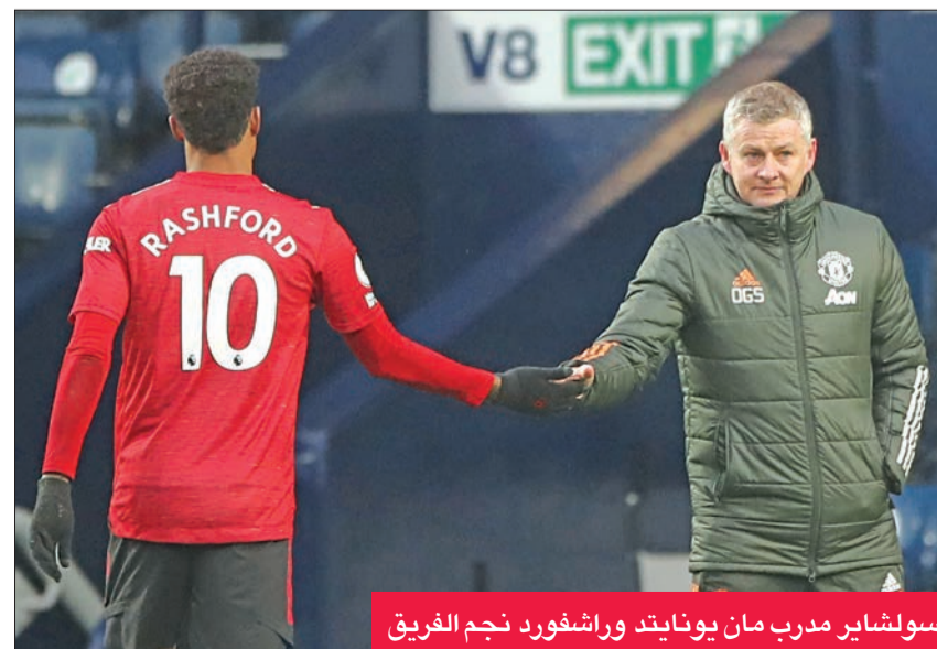
سولشاير مدرب مان يونايتد وراشفورد نجم الفريق