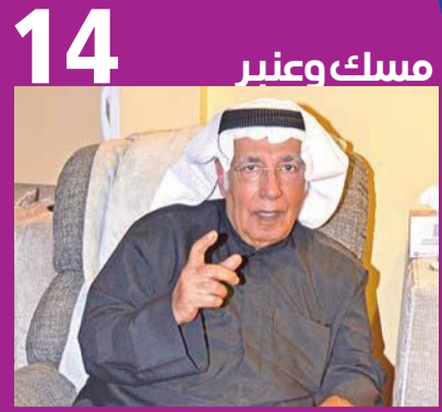
14 مسك وعبر

أطلقت نجمة «ذا فويس كيدز» لين الحايك أغنيته المصورة الجديدة «بدي قللك» عبر قنواتها الرسمية على اليوتيوب.