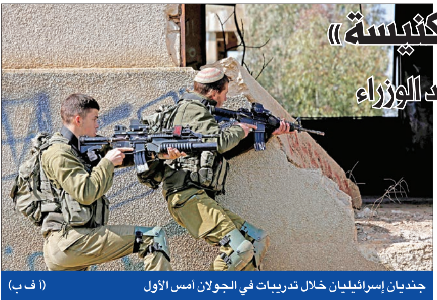
جنديان إسرائيليان خلال تدريبات في الجولان أمس الأول

وأعتبر أن «هناك حوقة تعمل على توجيه الاتهامات إلى حزب الله، من خلال استخدام وسائل إعلام وشبكات التواصل الاجتماعي»، وخاطب من يقدمون الحجج والدليل، قائلاً إنهم «يعملون وفق منطق أن