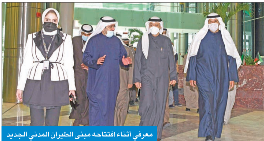
معرفي أثناء افتتاحه مبنى الطيران المدني الجديد

أكد خلال افتتاحه أنه سيوفر بيئة مناسبة ومتطورة لخدمة الموظفين