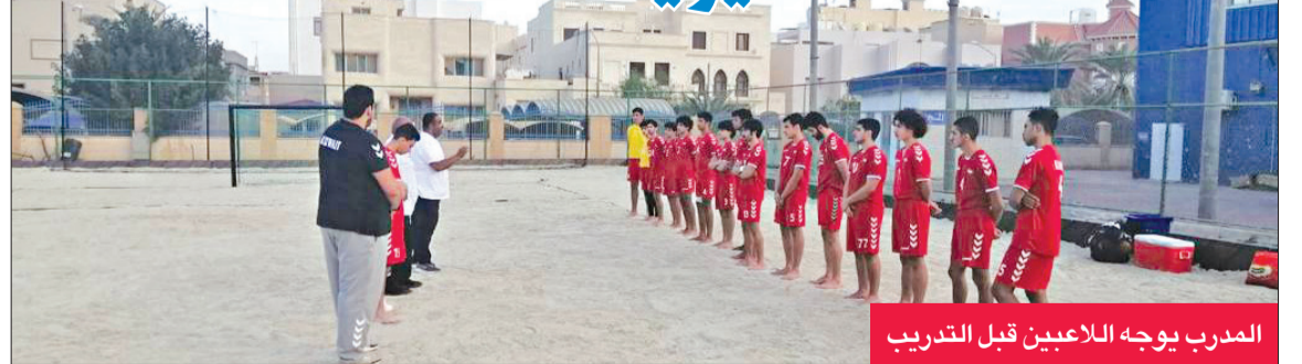
المدرّب يوجه اللاعبين قبل التدريب