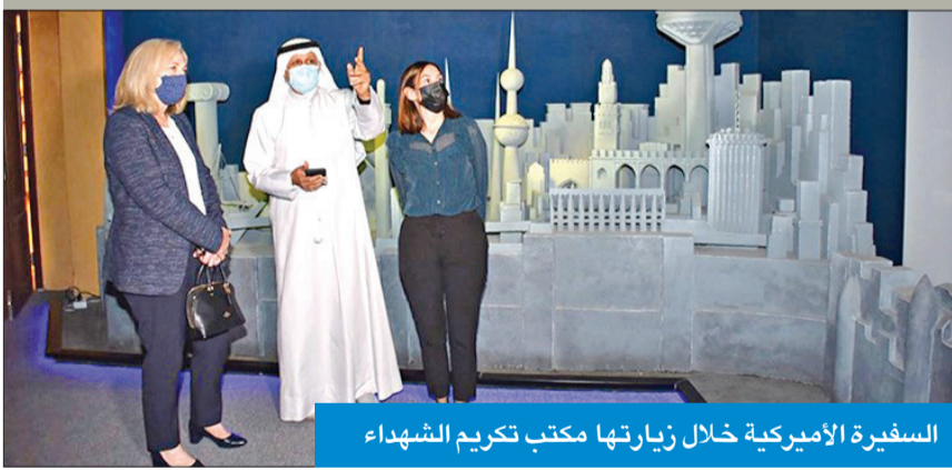
السفيرة الأميركية خلال زيارتها مكتب تكريم الشهداء

التحرير مع دول التحالف آنذاك والشعب الكويتي. وأضاف أن مكتب الشهيد لا ينسى البطولات التي قام بها شهداء الكويت، ومن واجبنا أن نحكي تلك المواقف المشرفة وذلك تكريماً لتضحياتهم. وقدم شرحاً لمحتويات المتحف وما تضمنه من صور للأمير الراحل سمو الشيخ جابر الأحمد، طيب الله ثراه، وبوش الأب بالعودة إلى الاتفاق، وهو الاتجاه الذي يدعمه ظريف، الذي اقترح خطوات متزامنة ورفعا تدريجياً للعقوبات، في حين أن روحاني يريد رفعا شاملاً وسريعاً لتحقيق مكسب.