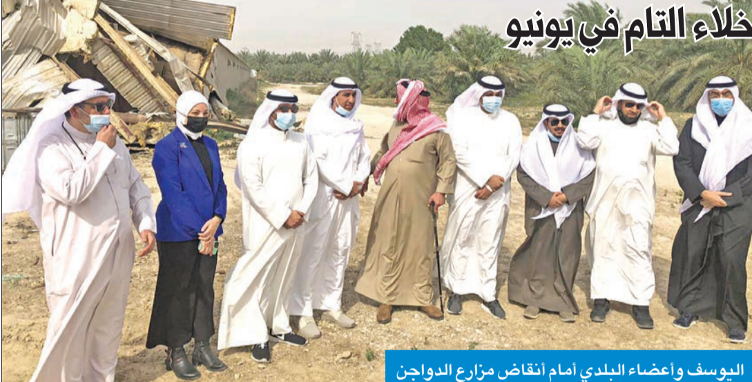
اليوسف وأعضاء البلدي أمام نقاض مزارع الدواجن

في الإزالة الفورية، مؤكدة أن منطقة جنوب سعد العبدالله ينتظرها أكثر من 30 ألف عائلة تنتظر السكن.