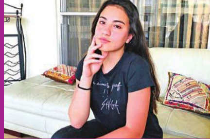
14 مسك وعبر

دعم الفنان السعودي عباي الجوهري الفنان المصري رامي جمال، أملاً في أن يحالفه التوفيق والنجاح في كل مشاريعه الفنية.