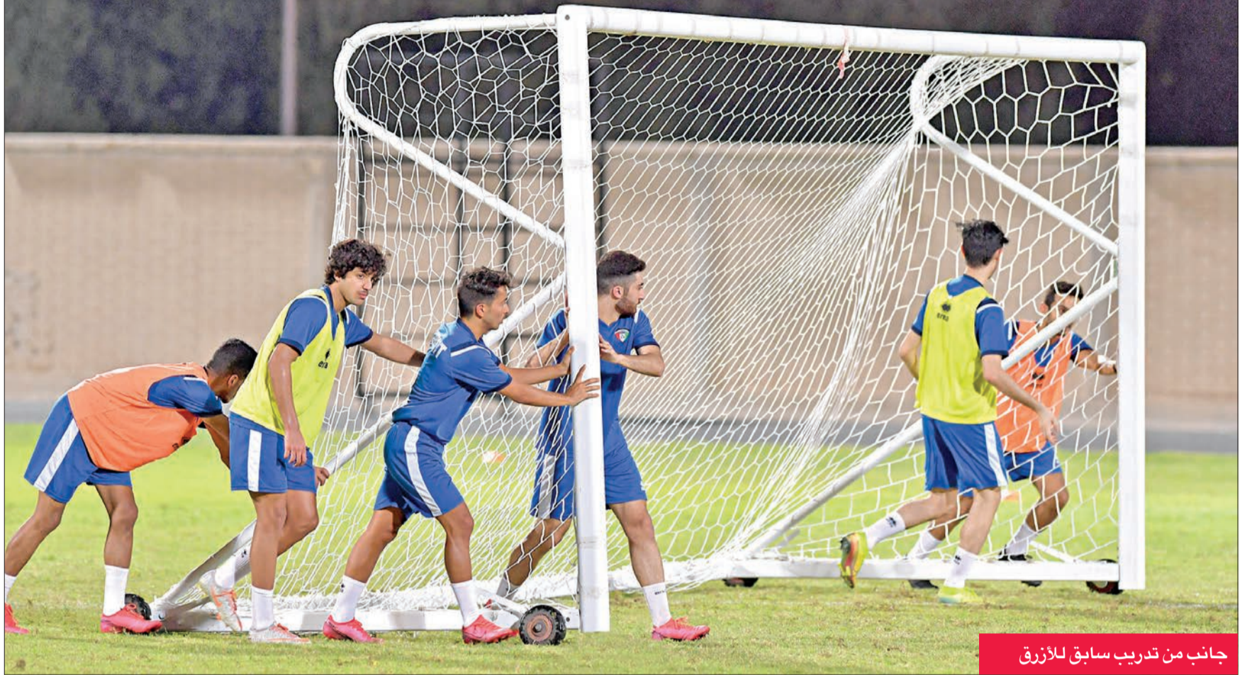
جانب من تدريب سابق للأزرق