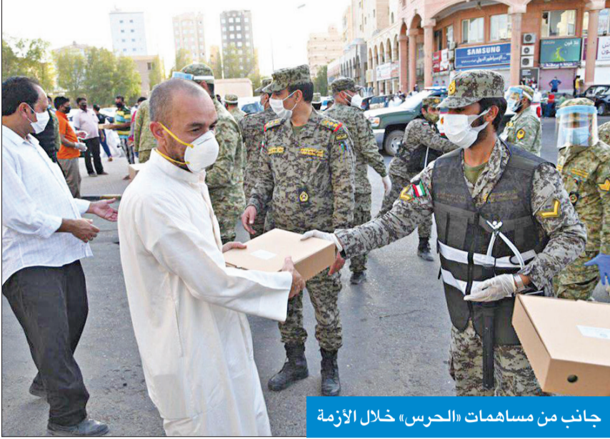
جانب من مساهمات «الحرس» خلال الأزمة