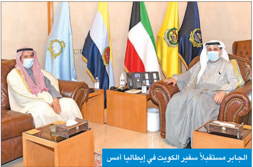
الجابر مستقبلاً سفير الكويت في إيطاليا أمس

استقبل نائب رئيس مجلس الوزراء وزير الدفاع الشيخ حمد الجابر، بمكتبه، صباح أمس، سفير الكويت لدى جمهورية إيطاليا الشيخ عزام الصباح. وتطرق اللقاء إلى تبادل الأحاديث الودية وأهم الأمور والموضوعات ضمن محور الزيارة، مشيداً بدور سفارة الكويت في إيطاليا، في تعزيز أوامر التعاون والعمل المشترك بين البلدين الصديقين.