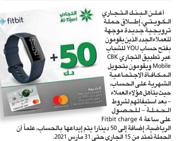
Fitbit charge 4

أعلن البنك التجاري الكويتي، إطلاق حملة ترويجية جديدة موجهة للعملاء الجدد الذين يقومون بفتح حساب YOU للشباب عبر تطبيق التجاري CBK Mobile ويقومون بتحويل المكافأة الاجتماعية الشهرية على الحساب، حيث يتأهل هؤلاء العملاء -بعد استيفائهم لشروط الحملة - للحصول على ساعة Fitbit charge 4