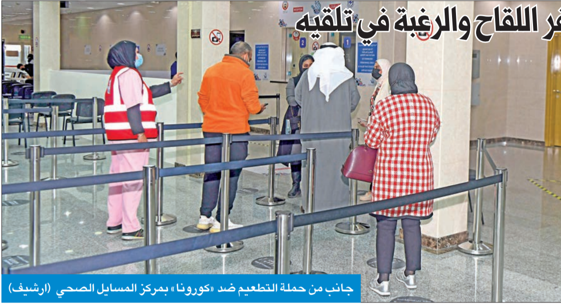
جانب من حملة التطعيم ضد «كورونا» بمركز المسابيل الصحي (ارشيف)

بشروط تطعيم 20 ألف شخص يومياً وتوافر اللقاح والرغبة في تلقيه