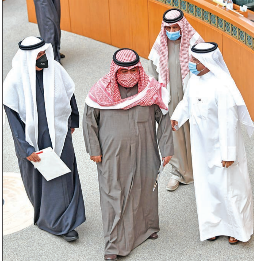
وزير الداخلية في جلسة أمس الأول الخاصة

وبينت أن آخر دورة تدريبية تم عقدها لضباط الصف الحاصلين على مؤهل جامعي أو ما يعادله للترقية إلى رتبة ملازم كانت خلال الفترة من 10 / 4 / 2016 حتى 8 / 9 / 2016.