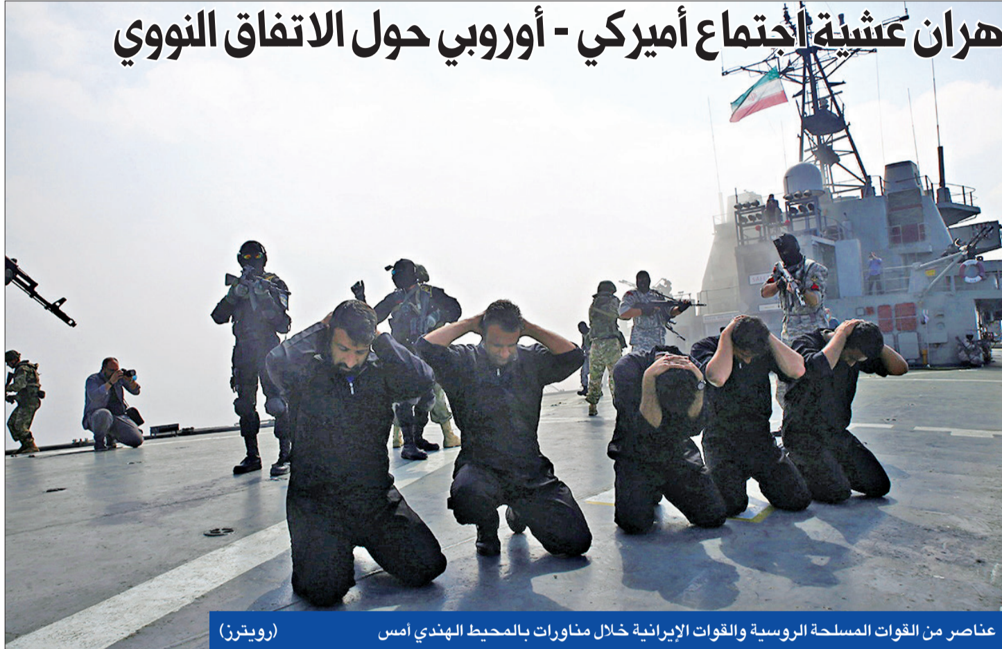
عناصر من القوات المسلحة الروسية والقوات الإيرانية خلال مناورات بالمحيط الهندي أمس

جددت طهران شروطها فيما يخص العودة المحتملة لإدارة الرئيس الأميركي جو بايدن إلى الاتفاق النووي، رافضة توسيعه أو ضم برنامجها الباليستي وأنشطتها الإقليمية إليه، وذلك عشية اجتماع أوروبي - أميركي يأتي قبل أيام من انتهاء مهلة حددتها إيران لوقف التزامها بـ «البروتوكول الإضافي» إذا لم ترفع عنها العقوبات.