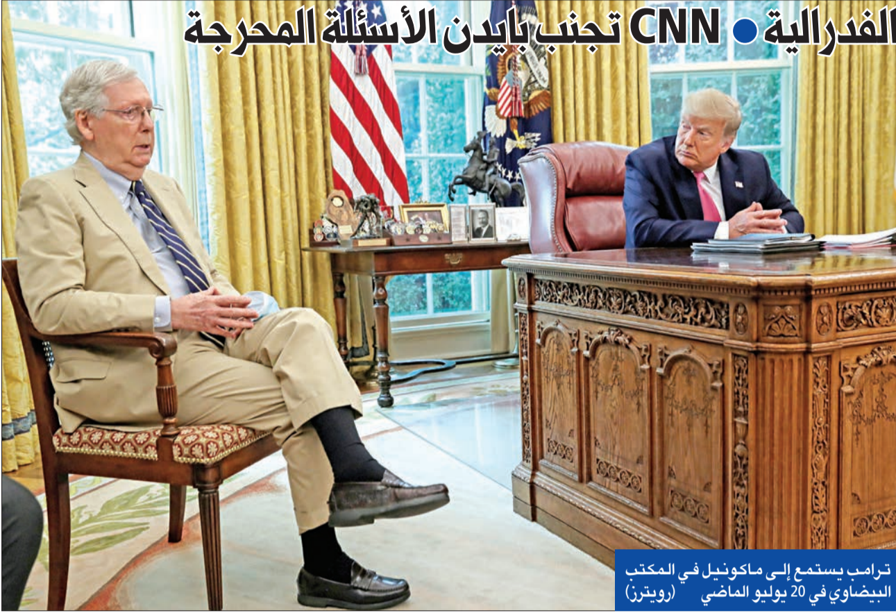
ترامب يستمع إلى ماكرون في المكتب البيضاوي في 20 يوليو الماضي

المتهمون يواصلون (العمل عليه) منذ الانتخابات الرئاسية.