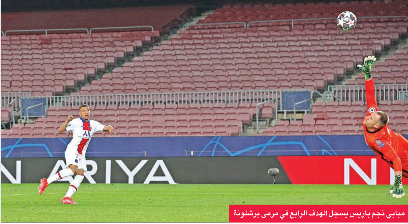
مبابي نجم باريس يسجل الهدف الرابع في مرصى برشلونة

ولم ينتظر ليفربول طويلا لتوجيه ضربة قاسية أخرى لمنافسه من هجمة مرتدة وصلت عبرها الكرة الى مانبيه، فحاول الفرنسي نوردي موكيل اعتراض الكرة لكنه أخفق في تدخله، ما سمح للسنگالي في الانفراد بغولاشي وتسجيل الهدف الثاني لفريق كلوب في غضون 5 دقائق (58).