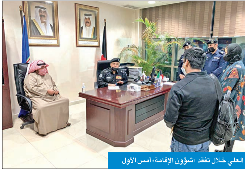
العلي خلال تفقد «شؤون الإقامة» أمس الأول

تفقد وزير الداخلية، الشيخ ثامر العلي، قطاع شؤون الإقامة مساء أمس الأول، واطلع على آلية سير العمل وإنجاز المعاملات، حيث كان في استقباله الوكيل المساعد لشؤون الإقامة اللواء أنور البرجس. واستمع العلي، خلال الزيارة، لشكاوى بعض المراجعين من المواطنين وأبناء الشهداء والمقيمين، مؤكداً تذليل العقبات التي تعترض معاملاتهم، وفق ما يقتضيه القانون، كما أعطى بعض التوجيهات التي تحقق سهولة في إنجاز الخدمات للمراجعين، منوهاً إلى ضرورة أن يلتزم الجميع بالاشتراطات الصحية. وناتى هذه الزيارة التفقدية استمراراً لمتابعة الوزير العلي لوجود الوكلاء المساعدين يوم