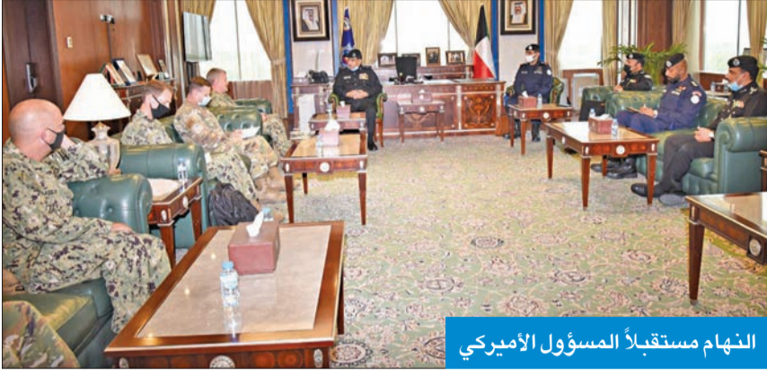
النهام مستقبلاً المسؤول الأميركي

بحث وكيل وزارة الداخلية الفريق عصام النهام أمس، مع قائد القوات البحرية في القيادة المركزية الأميركية قائد الأسطول الخامس قائد القوات البحرية المشتركة الفريق الركن صامويل بابارو مجالات التعاون المشترك. وأعلنت الإدارة العامة للعلاقات والإعلام الأمني بالوزارة، في بيان صحفي، أنه تمت خلال اللقاء مناقشة موضوعات الشراكة الأمنية الاستراتيجية المشتركة وأهمية العلاقات الثنائية بين الإدارة العامة لخفر السواحل والقوات البحرية الأميركية، وبحث سبل التعاون البحري بينهما. من جهته، أعرب الفريق الركن بابارو عن تقدير بلاده لدور الكويت في تعزيز الأمن والسلام في المنطقة وأهدى للفريق النهام درعاً تذكارية بهذه المناسبة. حضر اللقاء مساعد قائد القوات البحرية المشتركة لشؤون الإقليم العقيد ركن بحري الشيخ مبارك العلي والوكيل المساعد لقطاع أمن الحدود بالإدارة اللواء مبارك العميري.