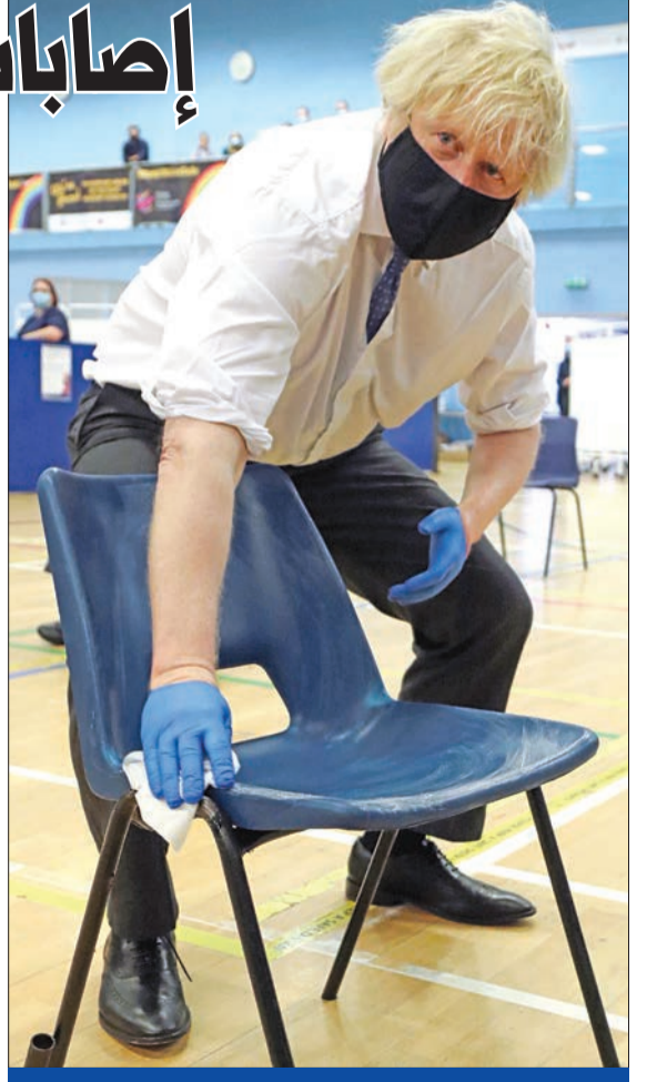
رئيس وزراء بريطانيا يعقم كرسيّاً أثناء زيارته لمركز تطعيم في ملعب كوبرجان جنوب ويلز أمس

من ناحية، قال رئيس جهاز الاستطلاع الإسبق واستاذ العلوم الاستراتيجية باكاديمية ناصر العسكرية، اللواء نصر سالم، لـ"الجريدة"، إن الصفقة جاءت بعد دراسة وموافقة مختلف الوزارات الفاعلة في الإدارة الأميركية خصوصاً وزارتي الدفاع والخارجية، قبل أن يوافق الرئيس بايدين على الصفقة، ما يعني وجود إجماع على هذه الصفقة داخل واشنطن "وهو أمر له مغزاه". وتابع: "مصر قوية قادرة على حماية