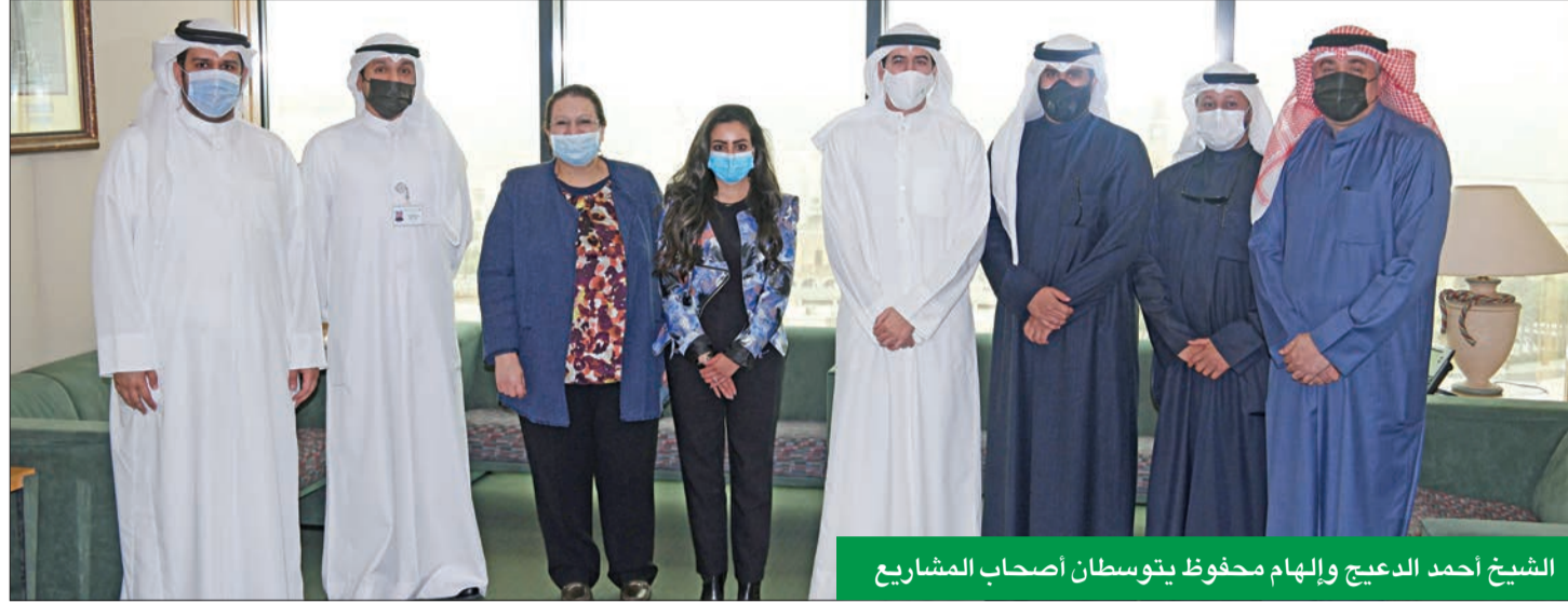
الشيخ أحمد الدعيج وإلهام محفوظ يتوسطان أصحاب المشاريع

أكد الشيخ أحمد الدعيج دعم «التجاري» لبرنامج «مبادرون»، الذي يأتي ضمن التزامه بمسؤوليته المجتمعية، ودوره الوطني نحو تحقيق التنمية الاجتماعية المستدامة التي تعتمد في الأساس على تطوير الأفكار الإبداعية لأصحاب الأعمال والمشاريع الصغيرة، لإكسابهم مهارات أساسية تساعد على تحقيق النجاح المنشود لأعمالهم.