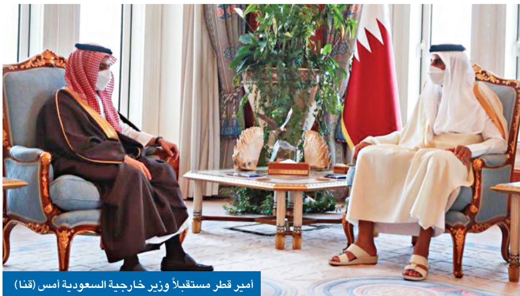
أمير قطر مستقبلاً وزير خارجية السعودية أمس (قنا)

أرسل العاهل السعودي الملك سلمان بن عبدالعزيز رسالة شفوية إلى أمير قطر تميم بن حمد، تناولت العلاقات الأخوية الوطنية وسبل دعمها وتعزيزها، وأبرز المستجدات الإقليمية والدولية. وفي أول زيارة للدوحة منذ اتفاق المصالحة في قمة العلاء، نقل وزير الخارجية الأمير فيصل بن فرحان تحيات خادم الحرمين إلى الشيخ تميم، وتمنياته له بدوام التوفيق والسداد، وللشعب القطري بالمزيد من التقدم والأزدهار. وأجرى الطرفان محادثات حول تحسين العلاقات. وفي تطور مواز، أكد المتحدث باسم الرئاسة التركية إبراهيم كالن أنه يمكن فتح صفحة جديدة في العلاقة مع مصر وعدد من دول الخليج، لـ «المساعدة في السلام والاستقرار الإقليميين». ووصفت «بلومبرغ» تحول لغة انقره، الذي تزامن مع توجه السعودية