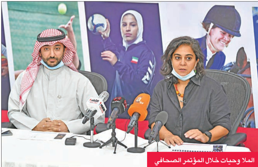
الملا وحيات خلال المؤتمر الصحفي

اللجنة الأولمبية الدولية، وتأهيل وإعداد الموهوبات ضمن برنامج البطل الأولمبي، ووضع حوافز مالية لدعم الفرق النسائية. كما اشتملت خطة الأهداف طويلة المدى على إدراج مسابقات الرياضية النسائية والأندية النسائية ضمن نقاط الدرج العام، وتوفير تأمين صحي للاعبات المنتخبات، وتطبيق لائحة الاحتراف الجزئي في جميع الأندية والاتحادات، وتحقيق إنجازات في البطولات العالمية والاسياد الآسيوية 2022-2023.