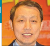
السفير لى مينغ قانغ *