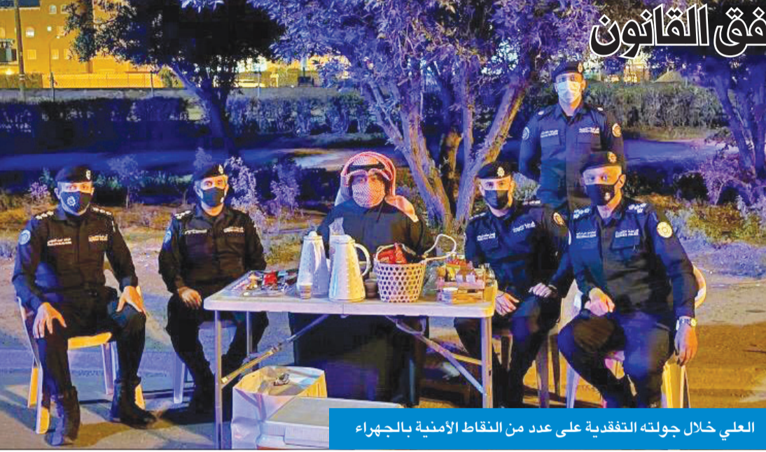
العلي خلال جولته التفقدية على عدد من النقاط الأمنية بالجهراء

تفقد عدداً من النقاط الأمنية ودعا إلى التعامل الراقي وفق القانون