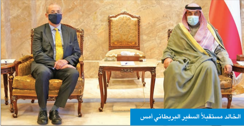
الخالد مستقبلاً السفير البريطاني أمس

استقبل رئيس مجلس الوزراء سمو الشيخ صباح الخالد، في قصر السيف، أمس، سفير المملكة المتحدة لبريطانيا وشمال أيرلندا لدى الكويت مايكل دانفورت، بمناسبة انتهاء مهام عمله.