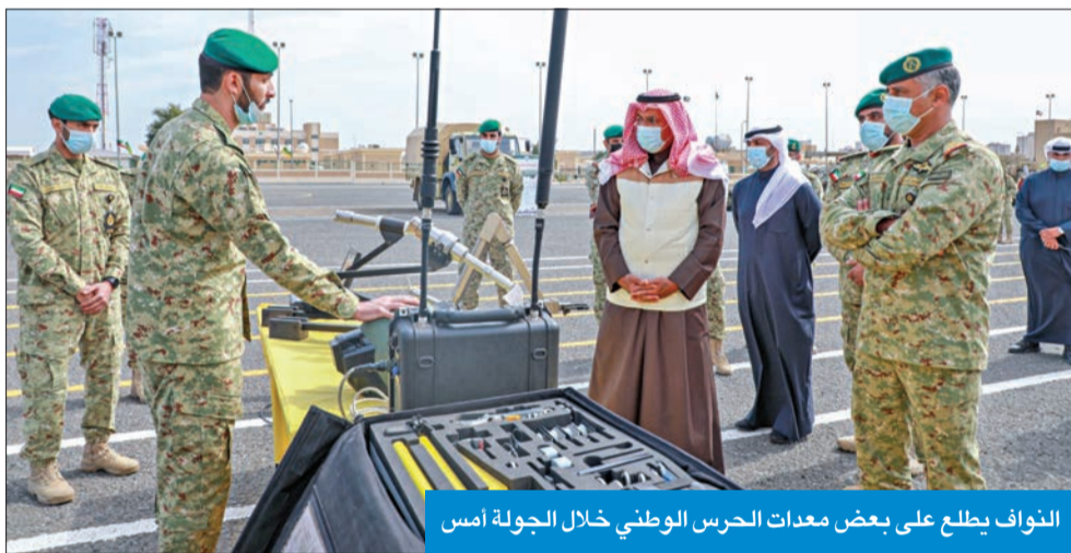
النواف يتطلع على بعض معدات الحرس الوطني خلال الجولة أمس

شدد نائب رئيس الحرس الوطني الفريق أول منقاع الشيخ أحمد النواف على استمرار خطط التأهيل ورفع الجاهزية القتالية لدى قوات الحرس الوطني، ليكونوا دائماً على أهبة الاستعداد في حماية مقدرات البلاد. جاء ذلك خلال جولة له في معسكر الصمود، تفقد خلالها عدداً من الوحدات، حيث كان في استقباله قائد الحماية والتعزيز العميد الركن حمد سالم.