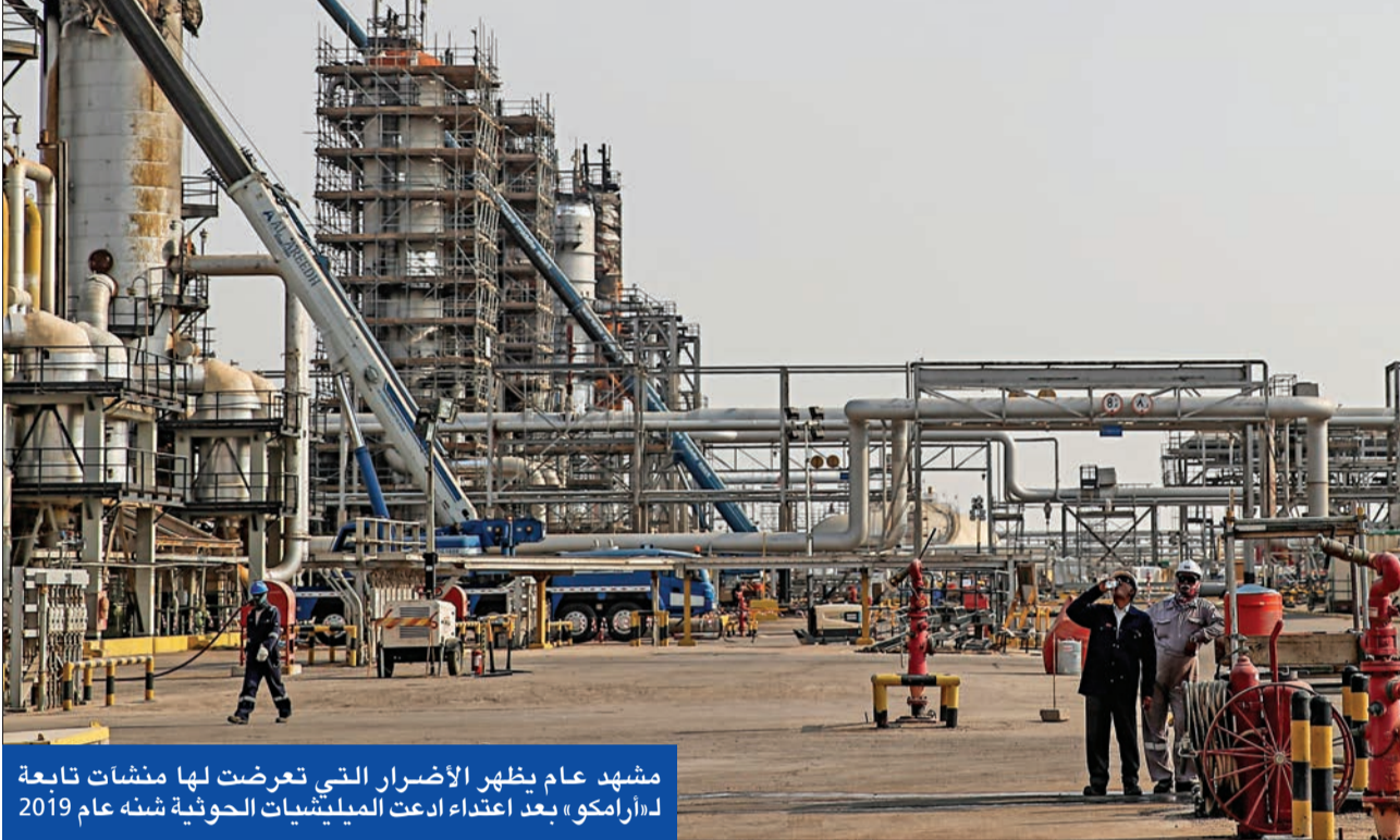
مشهد عام يظهر الأضرار التي تعرضت لها منشآت تابعة لـ«أرامكو» بعد اعتداء ادعت الميليشيات الحوثية شنه عام 2019

وأكدت أن أمن الإمارات وأمن السعودية كل لا يتجزأ وأن أي تهديد أو خطر يواجه المملكة تعتبره الدولة تهديداً لمنظومة الأمن والاستقرار فيها.