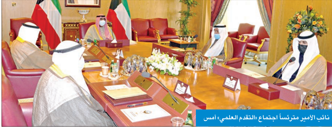
نائب الأمير مترأساً اجتماع «التقدم العلمي» أمس

سموه ترأس اجتماع «التقدم العلمي» ودعا إلى العمل بروح الفريق الواحد