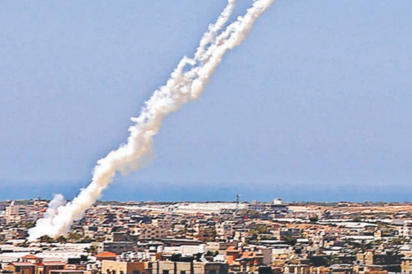
صواريخ تنطلق من رفح باتجاه إسرائيل أمس

● استهداف تل أبيب ومطار بن غوريون بعد أسدود وعسقلان... وقصف 500 هدف في غزة ● تحركات أميركية - مصرية ومجلس الأمن يجتمع... والأمم المتحدة تحذر من حرب شاملة