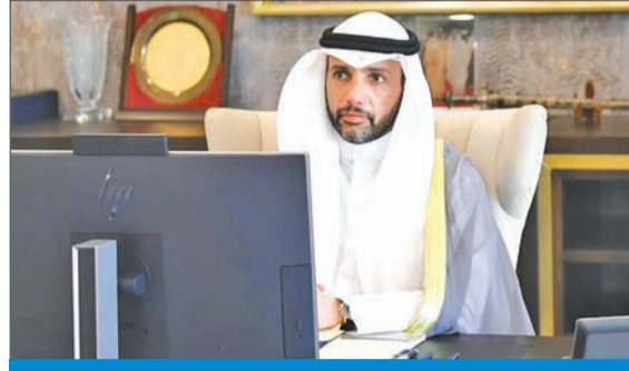
الغانم متحدثاً في مؤتمر الإتحاد البرلماني العربي

تقليدي ودبلوماسي، أو ثقافي وإعلامي، هو فعل مهم إلى درجة لا تتخيلونها. وقال: هنا أسأل: هل القوة هي العامل الحاسم في الصراع؟ وهل الغلبة العسكرية هي العنصر الفارق؟ إذا كان الجواب نعم، فلماذا بقي هذا العدو منذ 1948 في ورطته ومزقه الوجودي؟ ولماذا لم يحسم إنهاء الوجود الفلسطيني طوال العقود المنصرمة؟ وأشار إلى أن القوة مكنت العدو من سرقة الأرض والشجر والماء والحجر والسلاح التقليدي والأبيض بيد الفلسطيني.. لكن تلك القوة عجزت عن سرقة صوت