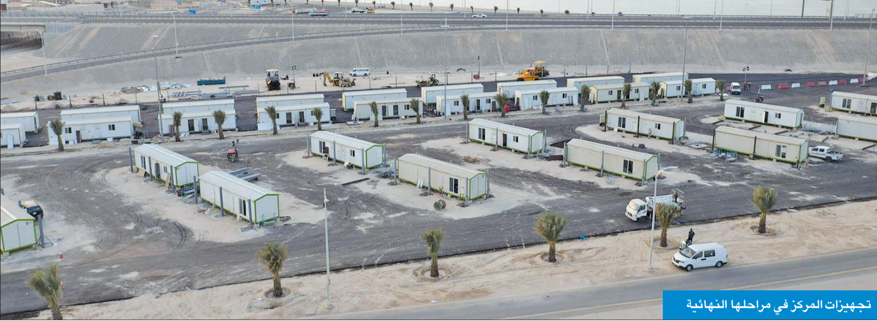
تجهيزات المركز في مراحلها النهائية

تفقد المشروع وأكد بدء العمل فيه خلال الأيام القليلة المقبلة