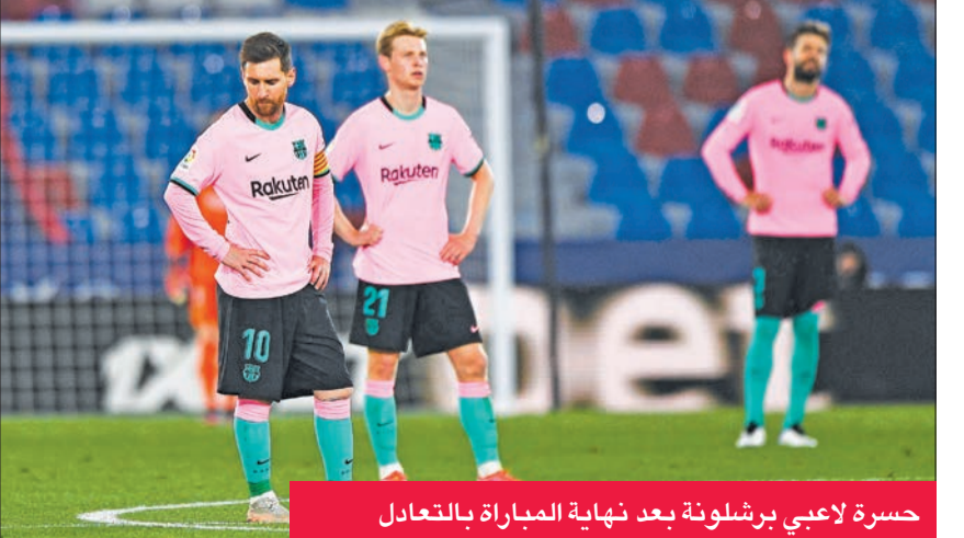
حسرة لاعبي برشلونة بعد نهاية المباراة بالتعادل

وسجل القائد الأرجنتيني ليو نيل ميسي (26) وبيدري (34) والفرنسي عثمان ديمبيلي (64) أهداف برشلونة، وغونزالو ميليرو (57) وخوسيه لويس موراليس (60) وسيرخيو ليون (84) أهداف ليفانتي. وكان برشلونة في طريقه إلى تحقيق فوز سهل عندما سطر