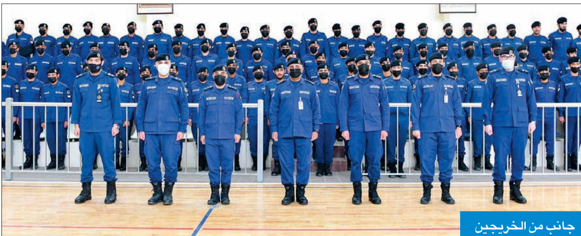
جانب من الخريجين