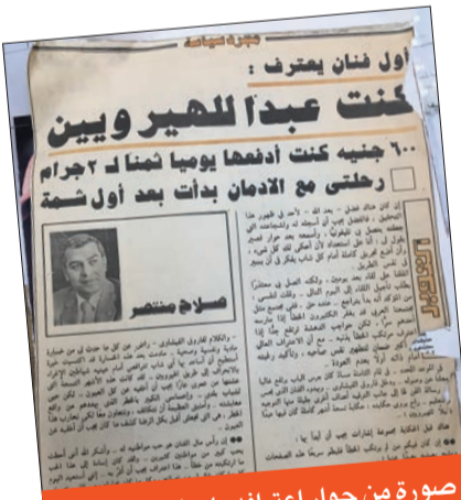
صورة من حوار اعترافه بإدمان الهيرويين

النجم المدمر هرب من برنامج العلاج إلى «الصومعة»