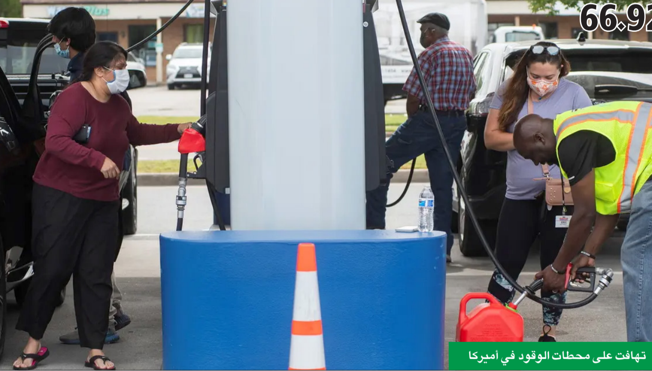
تهافتت على محطات الوقود في أميركا

البرميل الكويتي ينخفض 1.21 دولار ليلبغ 66.92