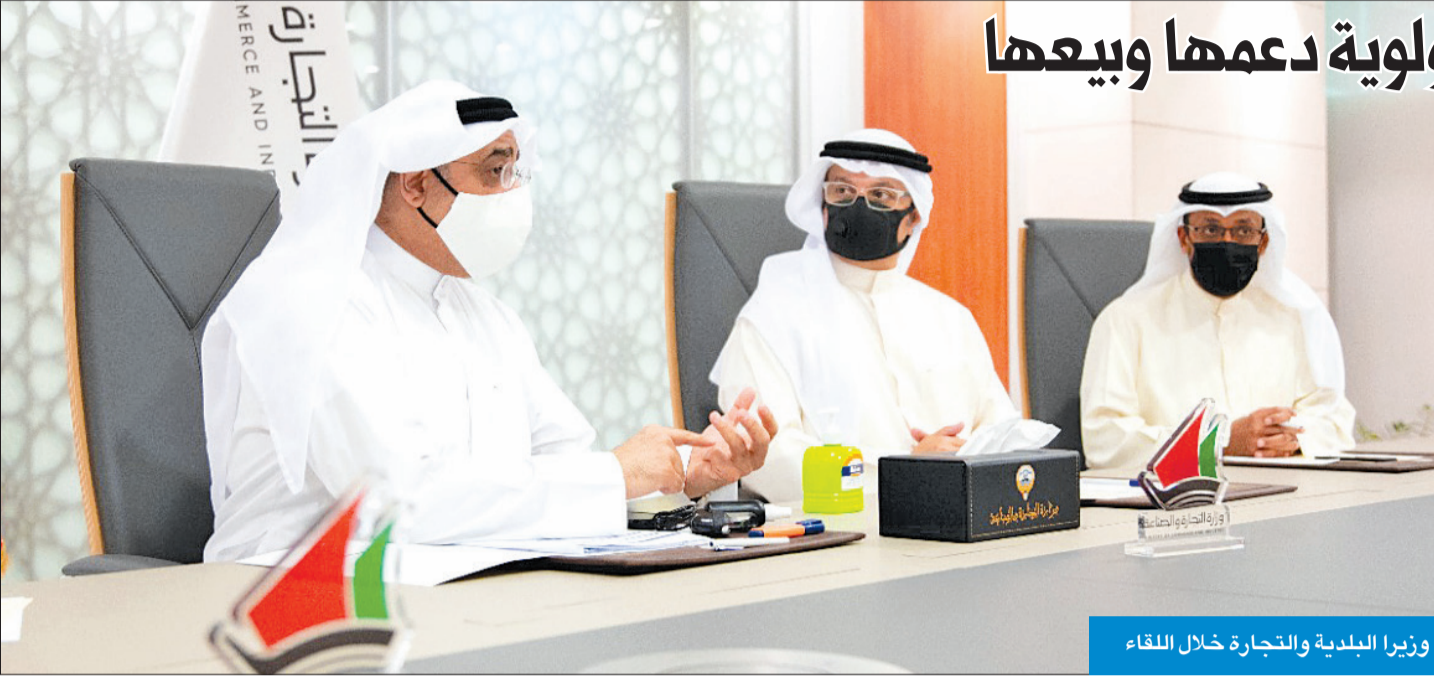
وزيرا البلدية والتجارة خلال اللقاء

بحث وزير الدولة لشؤون البلدية ووزير الدولة لشؤون الإسكان والتطوير العمراني شايح الشايح مع وزير التجارة والصناعة الدكتور عبدالله السلطان دعم المزارعين الكويتيين وتعزيز القطاع الزراعي بالبلاد وذلك في اجتماع عقد أمس الأول بحضور عدد من قيادات الجهات المعنية. وأوضحت «البلدية» في بيان صحفي أن الاجتماع الذي عقد في مقر وزارة التجارة والصناعة بحث سبل تعزيز دور القطاع الزراعي بالبلاد وإيجاد الحلول اللازمة للدفع بهذا القطاع الحيوي المهم نحو تحقيق المزيد من متطلبات الأمن الغذائي الداخلي.