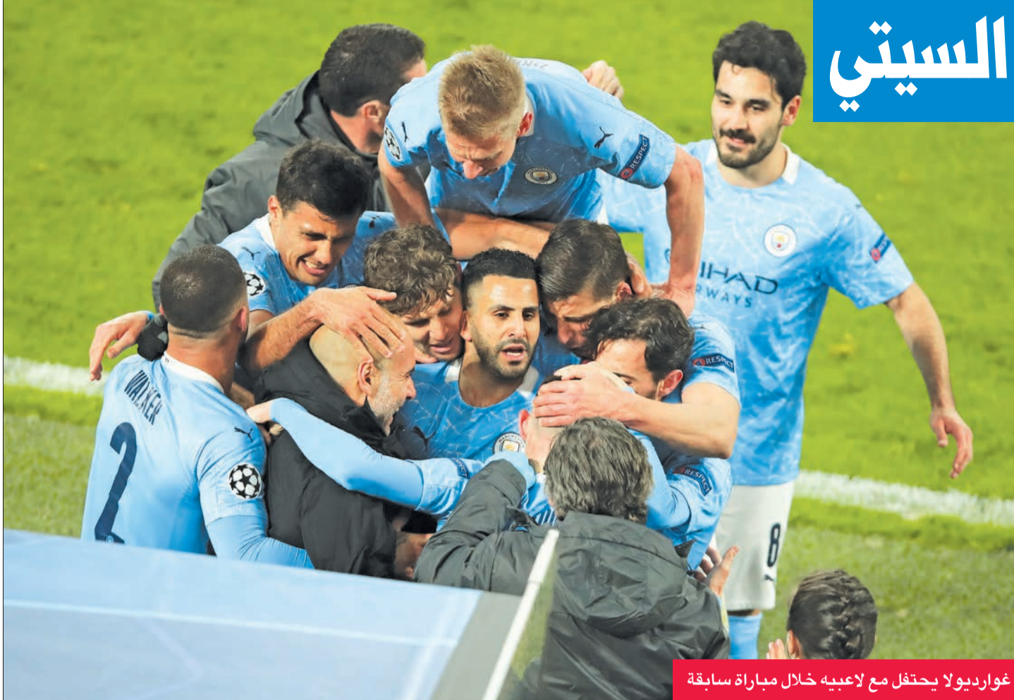
غوارديولا يحتفل مع لاعبيه خلال مباراة سابقة

لأنه مُني بخسارة ثقيلة في المراحل الأولى أمام ليدستر سيتي، بسقوطه على أرضه 5-2، ليتراجع إلى المركز الثاني عشر.