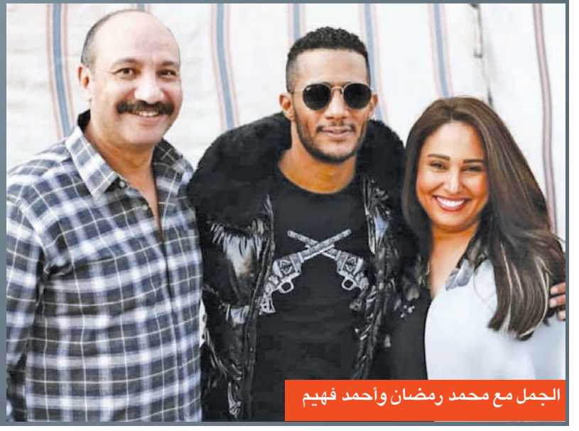
الجمل مع محمد رمضان وأحمد فهميم