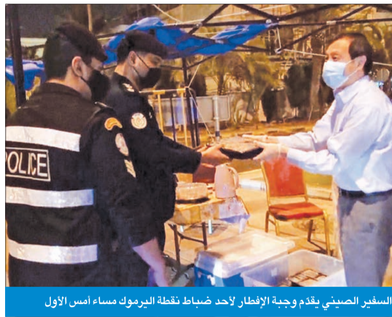
السفير الصيني يقدم وجبة الإفطار لأحد ضباط نقطة اليرموك مساء أمس الأول

الإفطار أقل ما يقدم تقديراً لأبطال الصفوف الأمامية، وذلك بالإنابة عن نفسي وبالنيابة عن سفارة الصين في الكويت، مستذكراً أن «الحنّة، وبمقدار ما تركته من الم أثر، فإنها أظهرت معادن الأصدقاء، وعمقت أواصر العلاقات الصينية الكويتية».