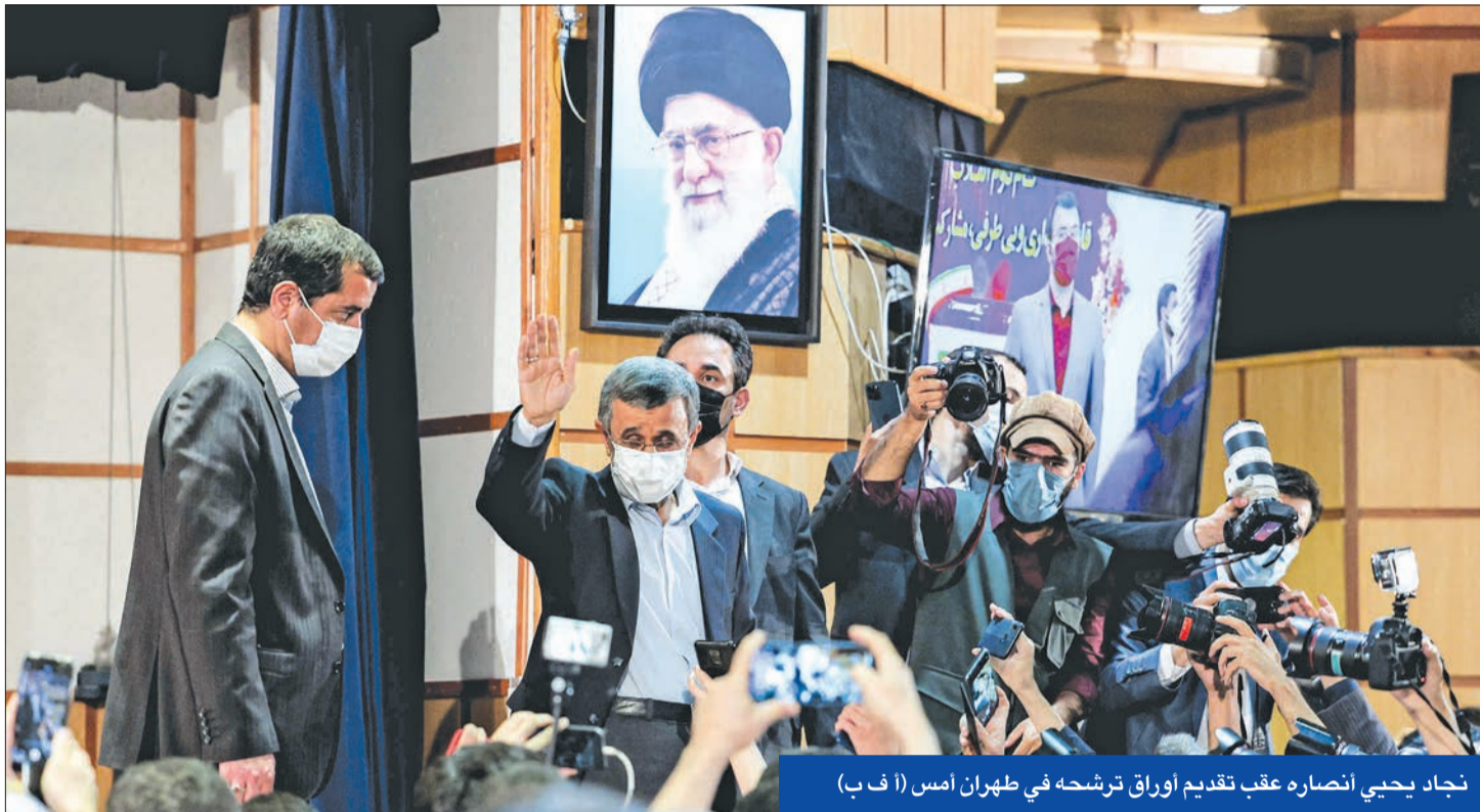
نجاد يحيي أنصاره عقب تقديم أوراق ترشحه في طهران أمس

كشفت الوكالة الدولية للطاقة الذرية أمس الأول عن رفع إيران تخصيب اليورانيوم من 60 إلى 63 بالمئة في منشأة نطنز، تزامناً مع تعثر محادثات فيينا بشأن إحياء الاتفاق النووي الذي انسحب منه الرئيس الأميركي السابق دونالد ترامب.