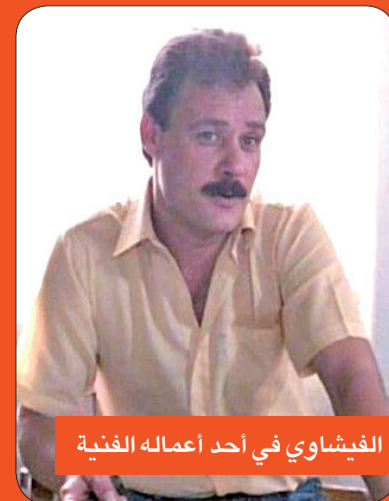
الفيشاوي في أحد أعماله الفنية

التقى فاروق الفيشاوي، في أكثر من عمل، الفنانة فردوس عبدالحمد، ومنها المسلسل الاجتماعي «ابناتي الأعداء» شكرياً (1979)، سيناريو عصام الجبلاطي وإخراج محمد فاضل، وشارك في بطولته نجم الكوميديا عبدالمنعم مديبولي ويحيى الفخراني وأثار الحكيم وصلاح السعدني، وحقق العمل نجاحاً كبيراً. وفي عام 1984، التقى فاروق وفردوس فجدداً مع المخرج محمد فاضل في مسلسل «ليلة القبض على فاطمة»، قصة الأديبة سكينة فؤاد، وواجه البطلان اختباراً صعباً، حيث عُرض المسلسل بعد