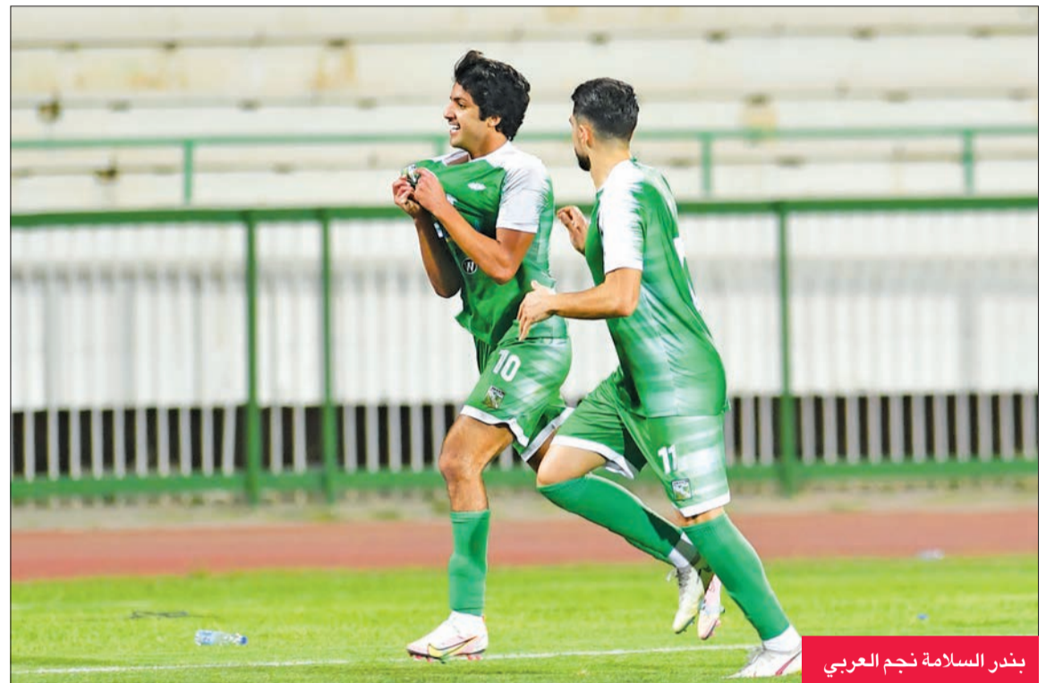
بندر السلامة نجم العربي

أما كاظمة فالمباراة بالنسبة له تحصيل حاصل.