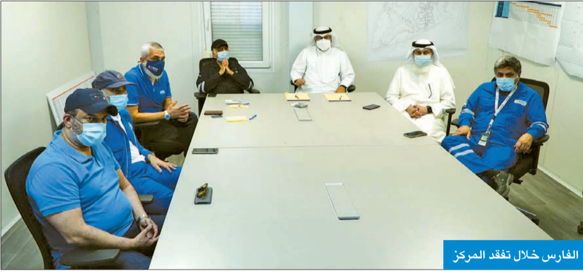
الفارس خلال تفقد المركز

وفي ختام الزيارة، توجه الفارس بالشكر للقائمين على هذا المشروع، مثمناً على الجهود الكبيرة التي يبذلونها لاستكمال إنشاء المركز بسرعة قياسية تمهيداً لبدء عمله خلال