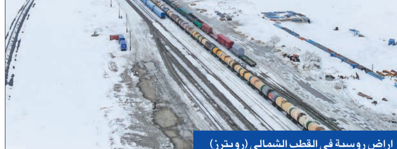
أراضٍ روسية في القطب الشمالي

مثل السويد وفنلندا، قرع طبول الردع الواضح والحاضر بشأن طموحاتها العسكرية في القطب الشمالي.