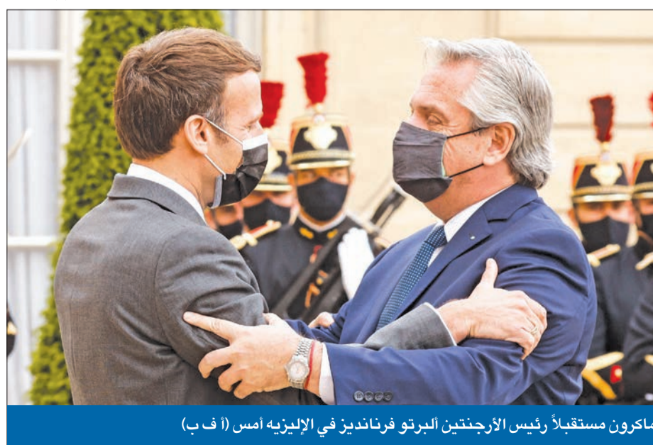
ماكرون مستقبلاً رئيس الأرجنتين البرتو فرنانديز في الإليزيه أمس

تنتظر وترقب نتائج زيارة ماكرون للخليج، وما قد ينتج عنها، وبطيبة الحال فإن هذه القوى تتضارب في قراءتها ورهاناتها، فرييس الجمهورية وفريقه يتمنى بقاء دعم الحريري المتمتع من المواقف الفرنسية وبعض الدول الأوروبية التي تساويه بجبران باسيل لجهة التعطيل. وبحسب المعلومات الفرنسية، لا تزال باريس تبحث مع الدول الأوروبية إمكانية فرض