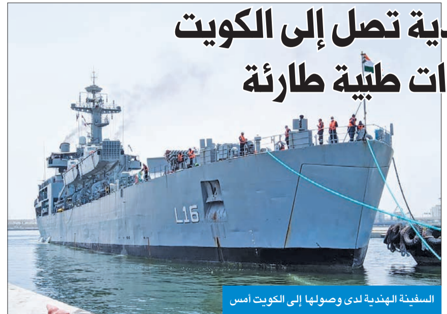
السفينة الهندية لدى وصولها إلى الكويت أمس