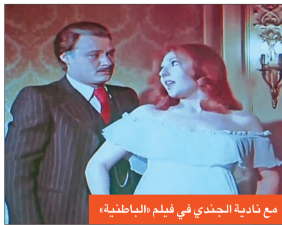
مع نادية الجندي في فيلم «الباطنية»