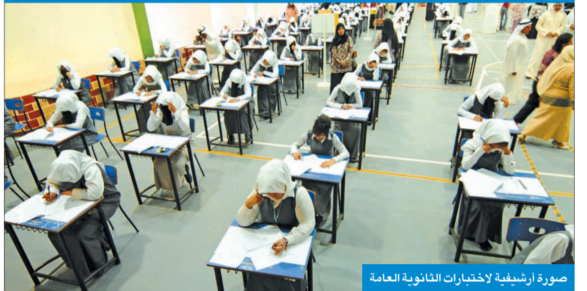
صورة أرشيفية لاختبارات الثانوية العامة

في تقريرها 42 بشأن تكليفها بحث ومناقشة الاختبارات الورقية لطلبة الصف الثاني عشر، في ظل جائحة كوفيد 19، والذي انتهت فيه إلى رفض إجراء الاختبارات، تبنت لجنة شؤون التعليم والثقافة والإرشاد البرلمانية رأي وزارتي التربية والصحة، فبينما تمسكت الأولى بالاختبارات الورقية، قالت «الصحة» إنها لاتزال في مرحلة التقييم، ومتى ما رأت عدم الوصول إلى الجاهزية المطلوبة فسترفع تقريرها بهذا الشأن، حرصا على سلامة الطلبة والقائمين على الاختبارات، والذي سيتم الانتهاء منه بعد عطلة عيد الفطر.