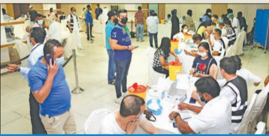
جانب من حملة التطعيم بجمع سيتي سنتر السالمانية أمس

وفي سياق تطعيمات «كورونا» أعلنت وزارة الصحة أمس تقديم نحو 30 ألف جرعة من لقاح «كوفيد - 19» للعاملين في 13 مجمعاً تجارياً في البلاد حتى الآن.