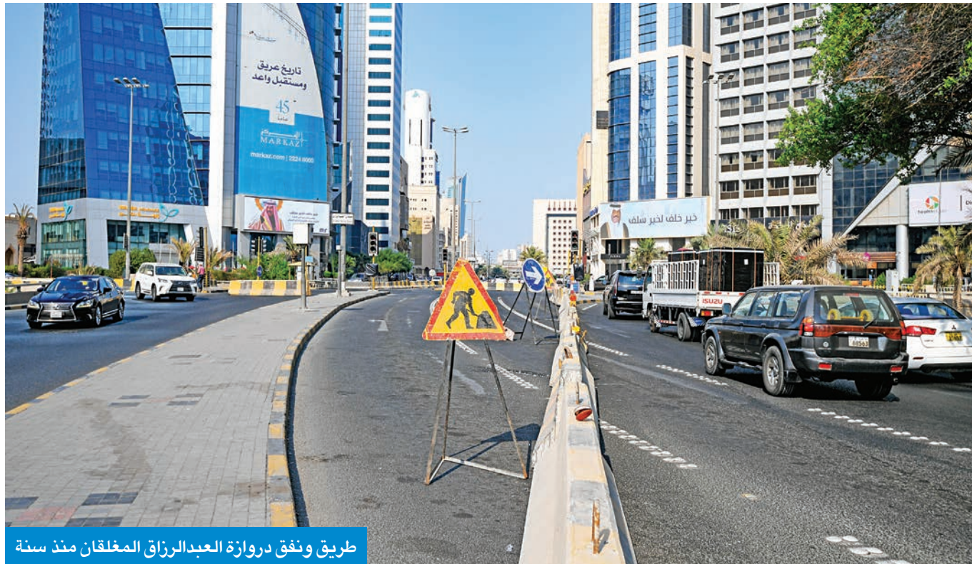
طريق ونفق دروازة العبدالرزاق المغلق منذ سنة

من معلم تراثي وتاريخي، تحولت دروازة العبدالرزاق إلى مثال صارخ على سوء انهيار التنسيق الحكومي، بعد مرور عام على إغلاقها نتيجة ظهور شروخ في جدران النفق، حتى بات الميدان في حالة يرثى لها. ولم تتمكن دروازة العبدالرزاق، التي صمدت أمام دبابات الغزو العراقي الغاشم، من الصمود في وجه الإهمال وسوء الإدارة والتنسيق الحكومي، لتصبح عالقة بين 6 جهات حكومية تتمثل في وزارة الأشغال العامة والهيئة العامة للطرق والنقل البري ووزارة الداخلية وشركة المرافق العمومية، وبلدية الكويت، ووزارة المالية، والتي تتقاذف مسؤولية صيانتها وإصلاحها، على خلفية سلسلة اجتماعات وكتب ومراسلات من أجل تخصيص ميزانية، لكن دون تحرك حقيقي على أرض الواقع. أما الطريق الذي يعلق الدروازه فحدث ولا حرج... فهو خير مثال يعكس مظهراً من مظاهر التنمية في البلاد هذه الأيام والتي باتت عجلتها يبطئها شديداً. ورغم أن طريق دروازة العبدالرزاق يعد مهماً جداً لأنه يقع في منطقة تعد مركزاً للأعمال، ويربط أهم مرافق مدينة الكويت ببعضها تبدأ من منطقة المباركية وأسواق البلوكات والطريق المؤدي إلى سوق الكويت للأوراق المالية، وشوارع أحمد الجابر المتجهة لمنطقة شرق، فإن إغلاقه من جهاته الأربع العام الماضي بسبب شروخ في طبقة الأسفلت السطحية أسفر عن أزمة ازدحامات خانقة لهذه المنطقة الحيوية، دون حلول سوى انتظار الفرج الذي يحرك المسؤولين للاتفاق إليه.