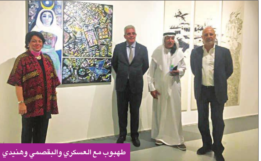
طهبوب مع العسكري والبقصي وهندي

أكثر من 100 لوحة لفنانين عرب قادمة من خارج الكويت نبيل الفيكاوي