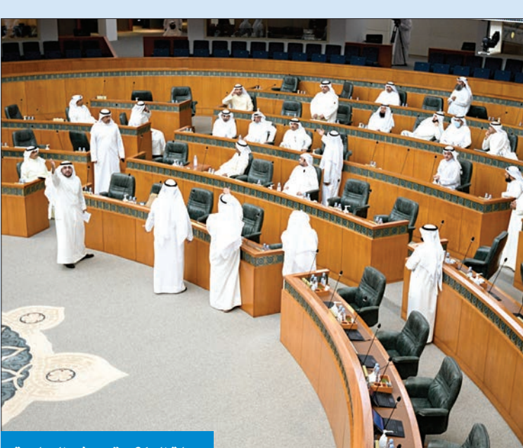
كتلة الـ 31 عقب رفع الجلسة

قبل التاسعة من صباح أمس، حضر النواب وغابت الحكومة، مما اضطر رئيس مجلس الأمة إلى رفع الجلسة نهائياً لعدم حضورها، ودار حديث بين النواب والرئيس، وهذا أبرز ما جاء في الجلسة التي رُفعت قبل افتتاحها.