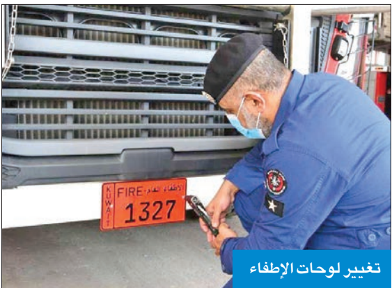
تغيير لوحات الإطفاء

أعلنت قوة الإطفاء العام، أمس، بدء تغيير اللوحات المرورية الجديدة، التي تميزت باللون الأحمر، وتحمل اسم «الإطفاء العام». وقالت القوة، في بيان، على حسابها الرسمي في «تويتر»، إن القرار الجديد يأتي تنفيذاً لإحدى استراتيجيات «الإطفاء» لتمييز اللوحات المرورية التابعة لها.