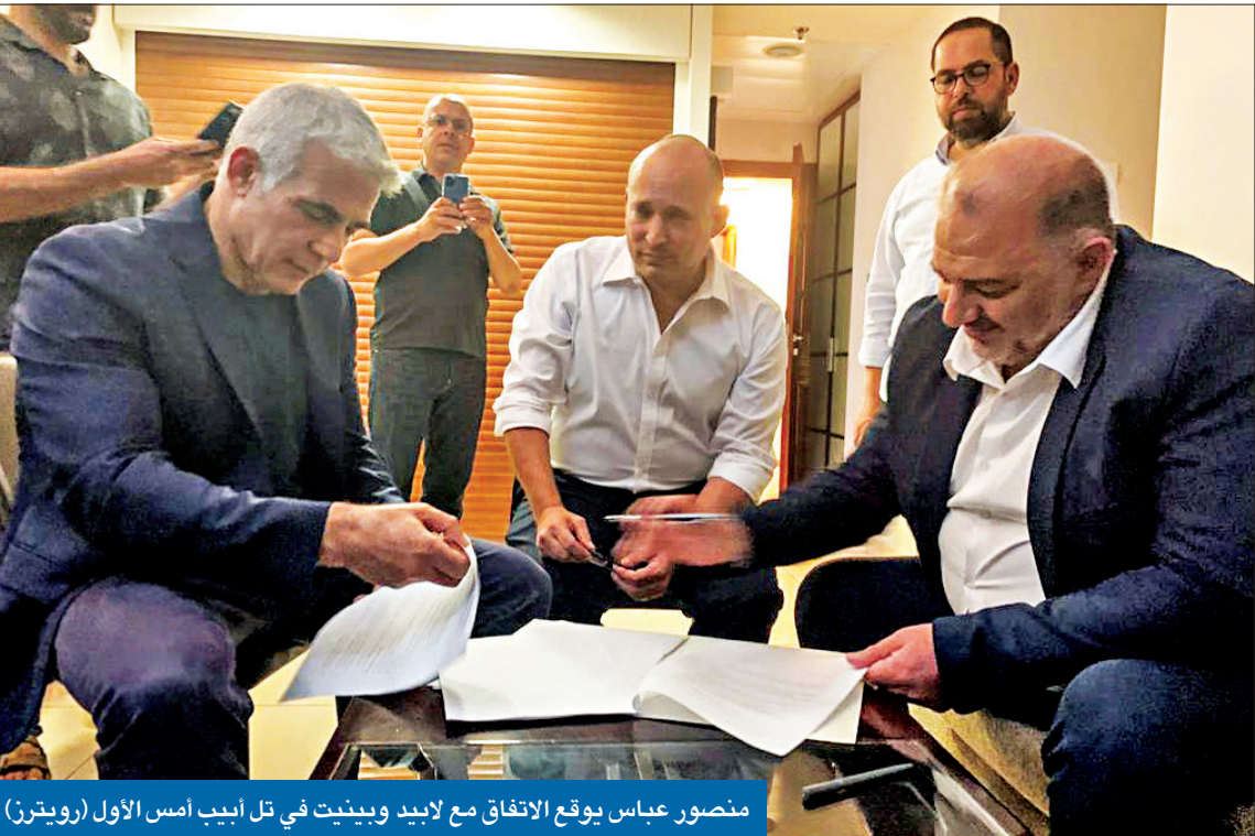
منصور عباس يوقع الاتفاق مع لايبند وبينيت في تل أبيب أمس الأول

عرب 48 يشاركون في ائتلاف حكومي للمرة الأولى