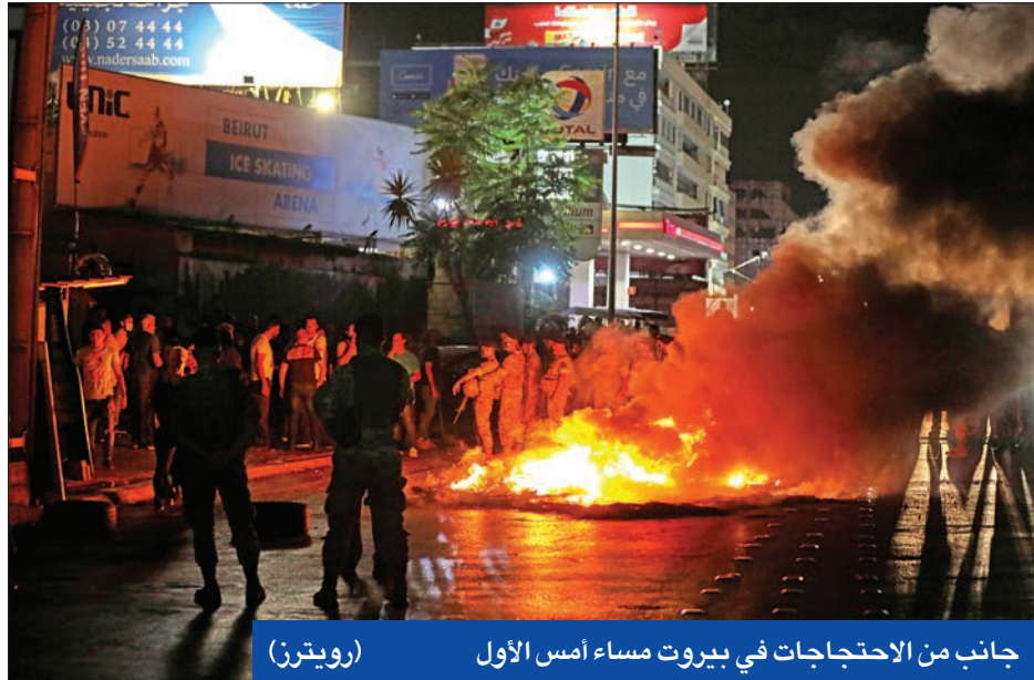
جانب من الاحتجاجات في بيروت مساء أمس الأول

● عودة الاحتجاجات تعيد «المرسوم 151» ● «المحكمة الدولية» تلغي محاكمة عياش