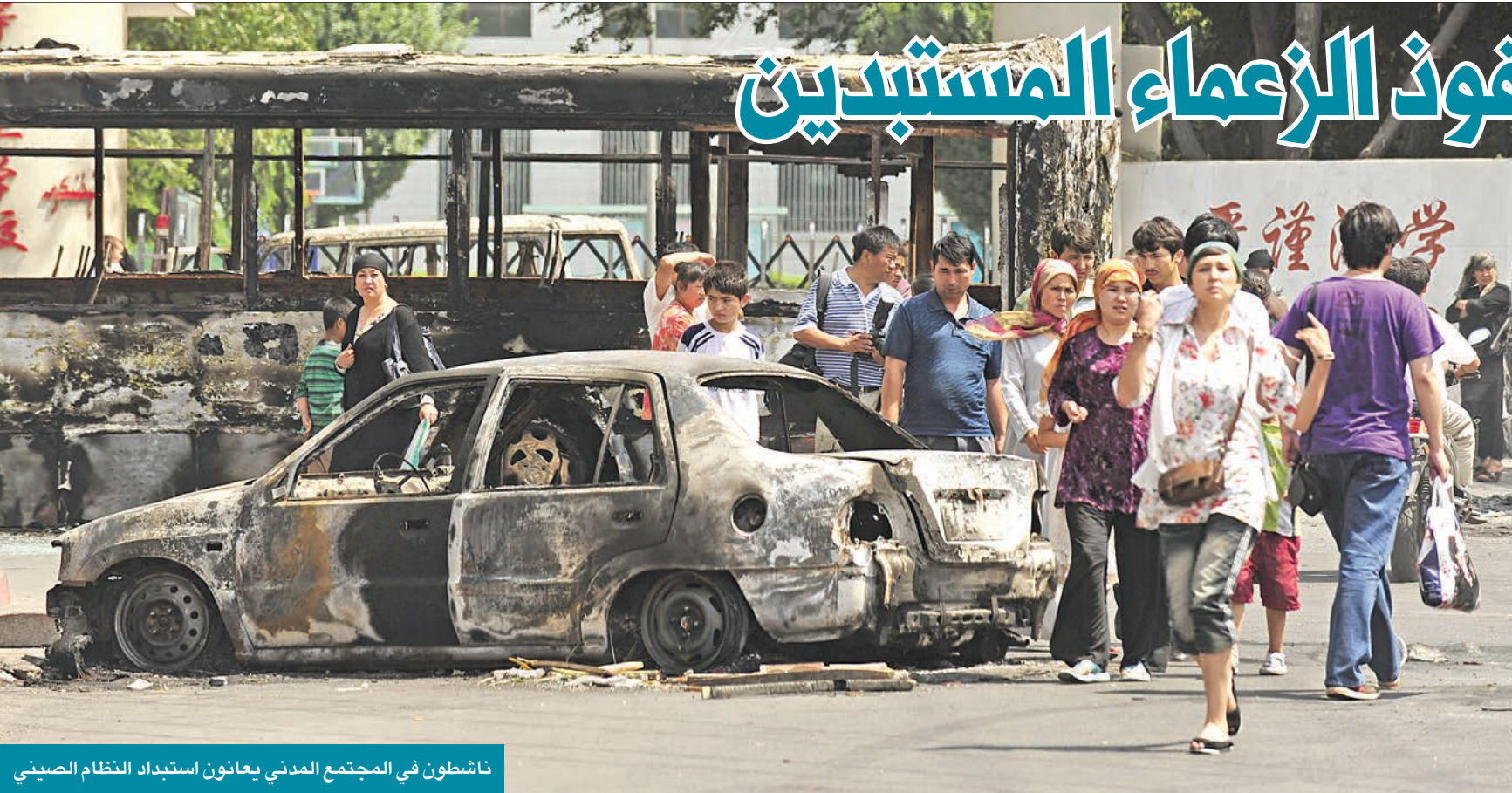
ناشطون في المجتمع المدني يعانون استبداد النظام الصيني

كريستوفر واكر وجيسيكا لودفيغ - فورين أفييرز