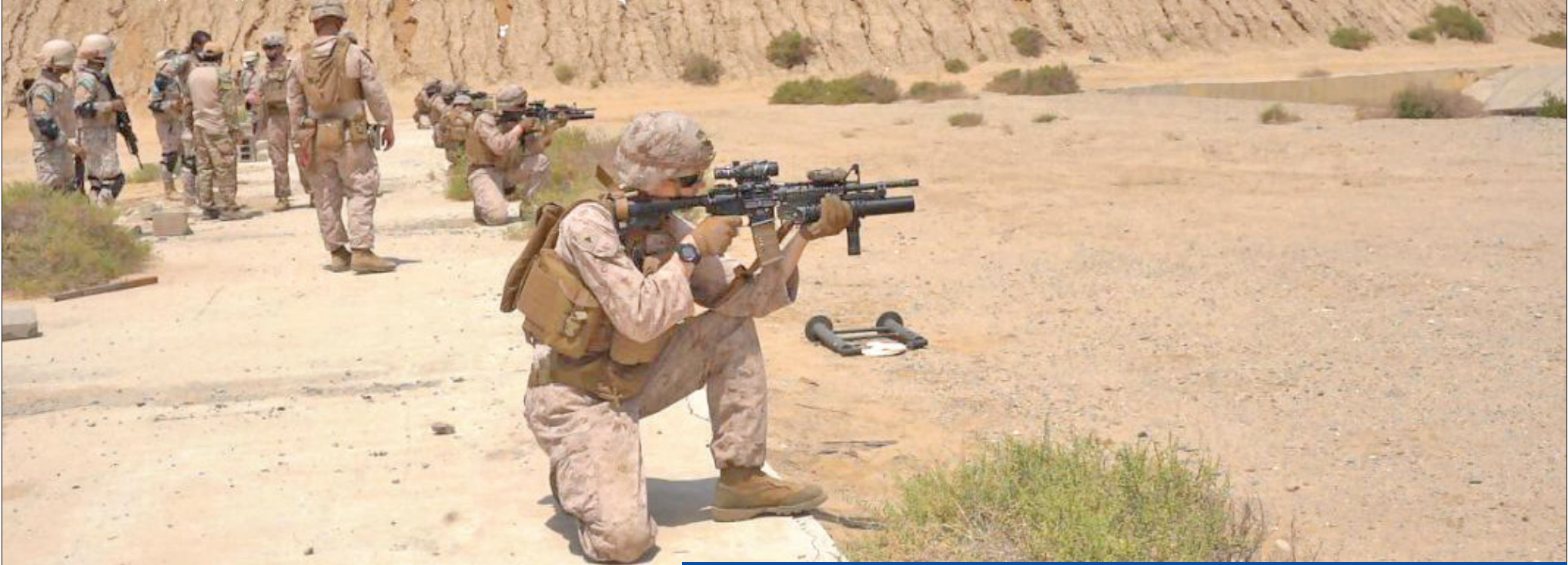
عناصر من مشاة البحرية السعودية والأميركية خلال تدريبات مشتركة في مدينة جدة أمس الأول

● بن سلمان وأوستن ينسقان لإنهاء «حرب اليمن» ● توتر بين هادي و«الجنوبي» في أبين