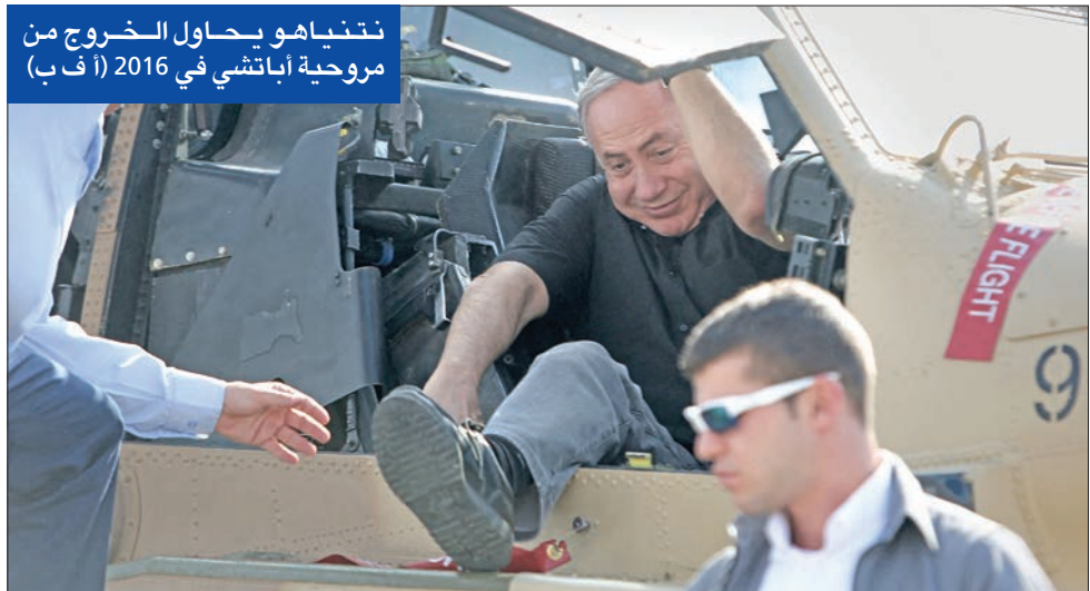
نتنياهو هو يحاول الخروج من مروحية إبان تسي في 2016

اتهم خصومه ببيع النقب للعرب... و«معسكر التغيير» يتهمه باستغلال رئيس «الكنيست»