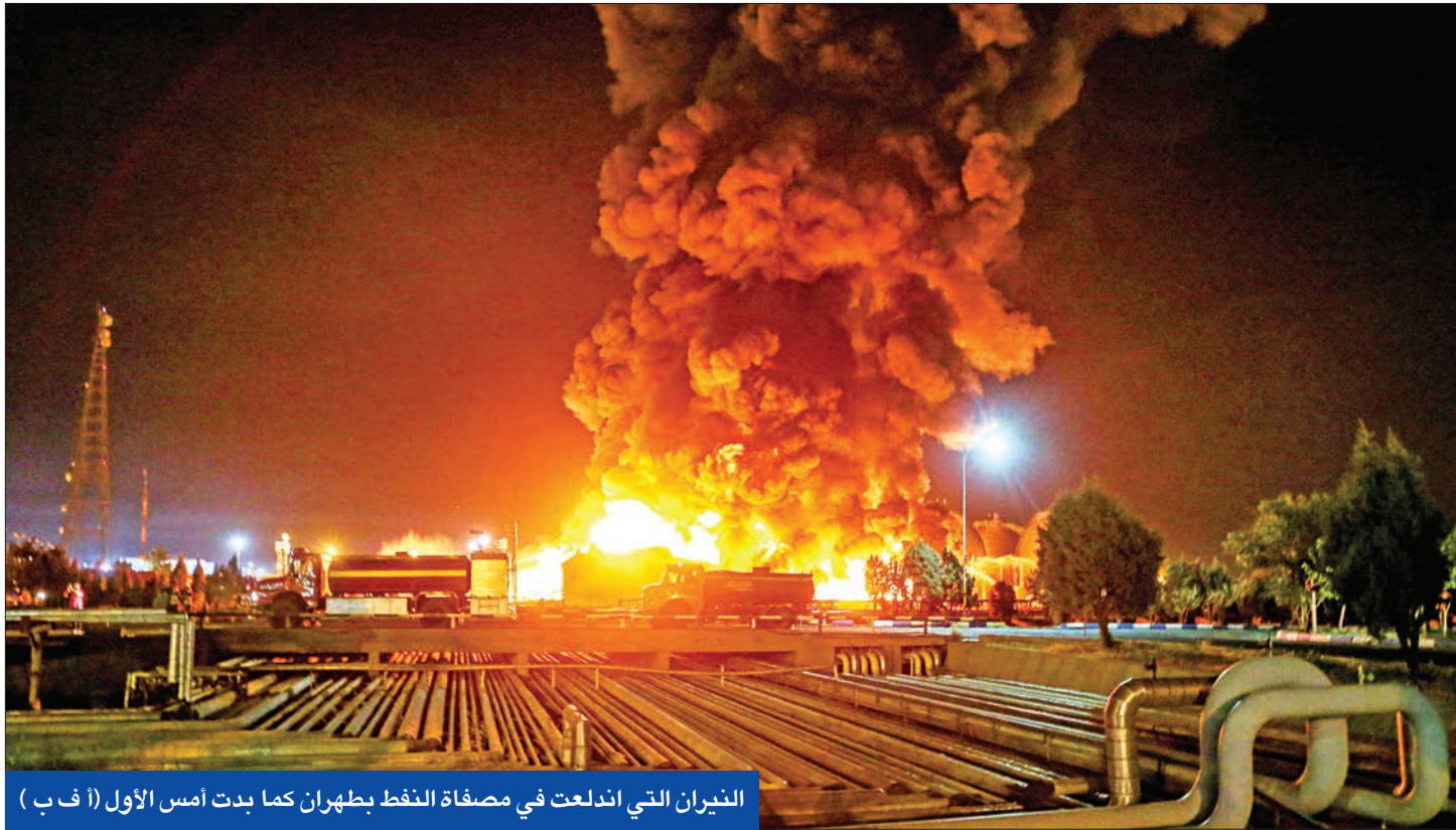
التيران التي اندلعت في مصفاة النفط بطهران كما بدت أمس الأول

● أوروبا تتوقع اتفاقاً في الجولة السادسة من مفاوضات فيينا ● ضربة إلكترونية لحملة همتي