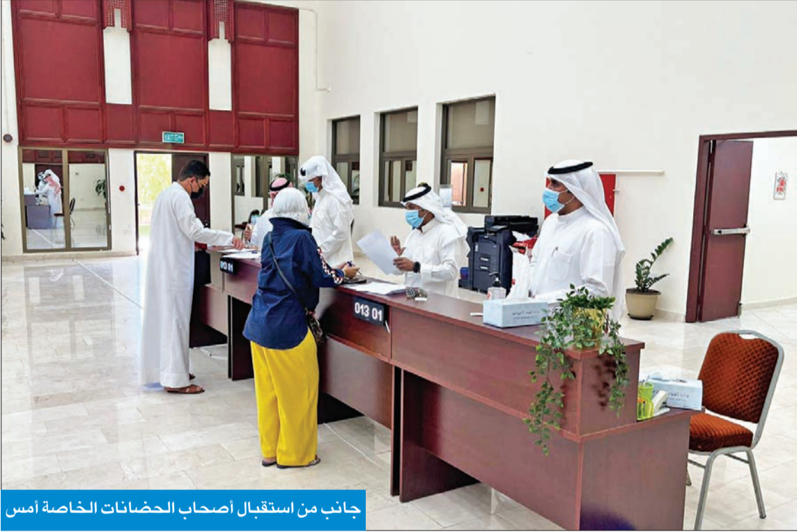
جانب من استقبال أصحاب الحضانات الخاصة أمس

● العازمي لـ الجريدة : سلمنا لأصحابها الدليل الاسترشادي الصحي الخاص بالعودة ● تنسيق مع «الصحة» لتنظيم حملة موسعة جديدة لتطعيم عمالة وموظفي الحضانات