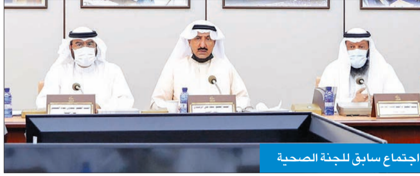
اجتماع سابق للجنة الصحّة

«سنرصد المخالفات في الأماكن العامة والتجمّعات وسيارات الأجرة»