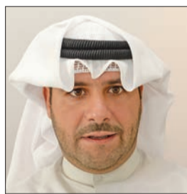
عبدالله ناصر صباح الأحمد