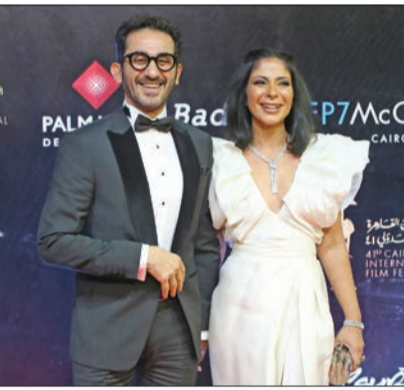
أحمد حلمي مع منى زكي

يستعد النجم أحمد حلمي لمسلسله الجديد، الذي وضع ضناعه اسماً مبدئياً له، وهو «النجيب»، عن قصة الأديب العالمي نجيب محفوظ، ولم يستقروا على الاسم النهائي للعمل حتى الآن. ومن المقرر إطلاق التصوير منتصف أكتوبر المقبل، بعد انتهاء حلمي من تصوير فيلمه الجديد، والذي تشاركه النجمة روبي أهدانه.