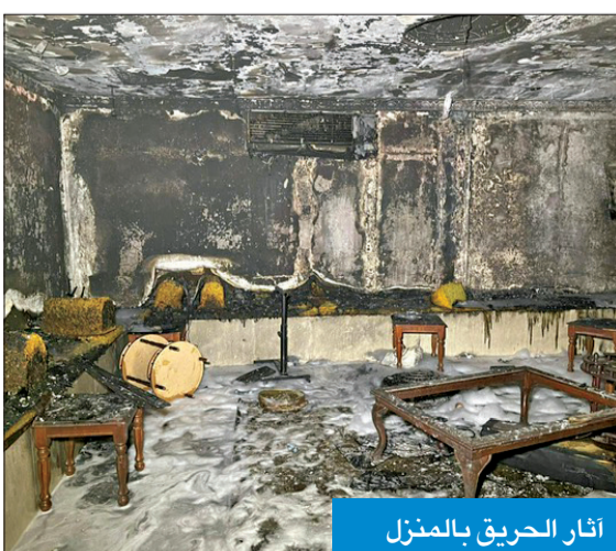
أثار الحريق بالمنزل

إخلاء بناية بالجهراء بسبب حادث مشابه في «بيت السلم»