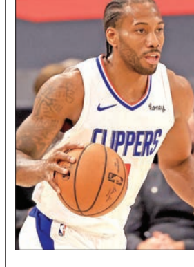
حسم لوس أنجلس كليبرز

حسم لوس أنجلس كليبرز، بقيادة كواهي لينارد، المباراة السابعة ضد دالاس مافريكس في الدور الأول من الأدوار الإقصائية "بلاي أوف" عن المنطقة الغربية، في الدوري الأميركي للمحترفين 126-111، بينما ضرب أتلانتا هوكس ونجمه الشاب تزاوي يونغ بقوة في المباراة الأولى من الدور نصف النهائي "الشرقية"، بفوز 128-124 على فيلادلفيا سفنتي سيكسرز. وأحرز لينارد 28 نقطة، و10 متابعات و9 تمريرات حاسمة ليقود كليبرز إلى نصف نهائي الغربية، حيث سيلقي يونغ جاز في المباراة الأولى اليوم. وفي مباراة هوكس وفيلادلفيا سفنتي سيكسرز كان إمبيد أفضل مسجل في اللقاء مع 39 نقطة و9 متابعات