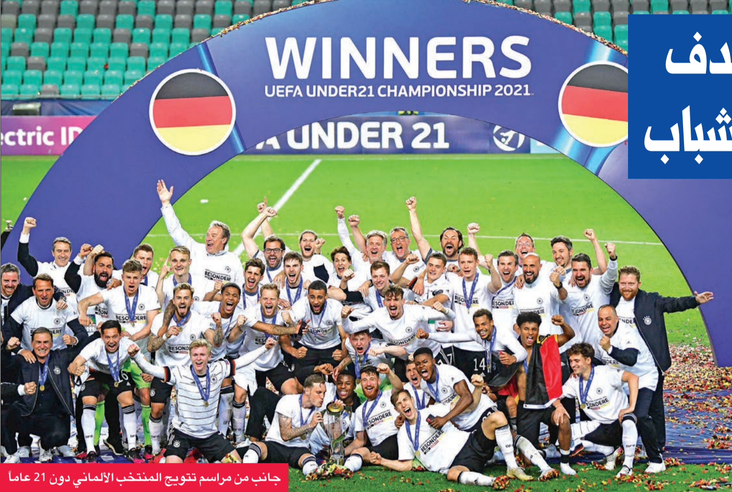
جانب من مراسم تتويج المنتخب الألماني دون 21 عاماً

البرتغال في الدقيقة 67، حيث تلقى تمريرة عرضية من الجهة اليمنى، ليسد من داخل المنطقة، لكن الكرة اصطدمت في الدفاع. وأضاعت ألمانيا أكثر من فرصة لتعزيز النتيجة خلال الخسارة، لينتهي اللقاء بفوز منتخب الماكينات 1 - صفر وتتويجه باللقب القاري للمرة الثالثة في تاريخه.