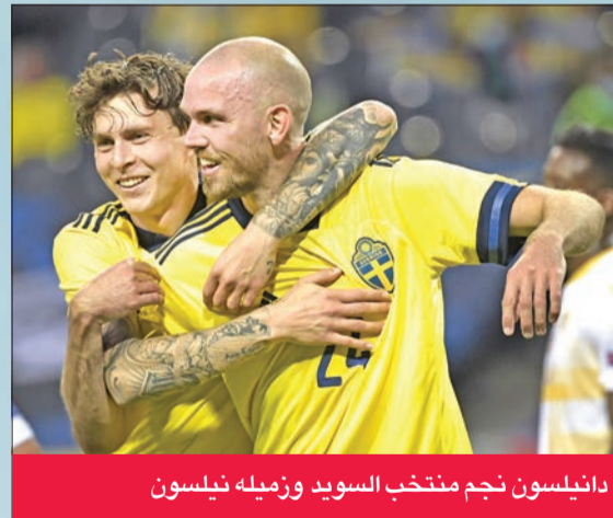
دانييلسون نجم منتخب السويد وزميله نيلسون

البنس أي كاي في مدينة هالمشتاد الجنوبية، حيث كان هدافاً تاريخياً للفريق.