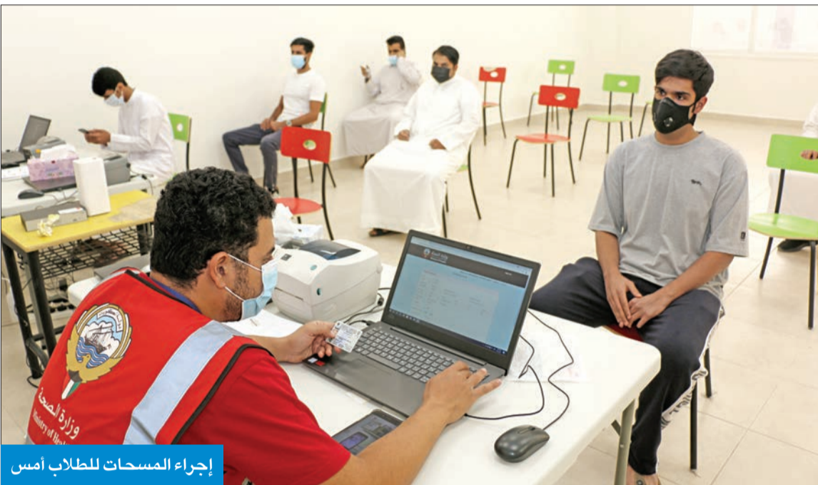
إجراء المسحات للطلاب أمس