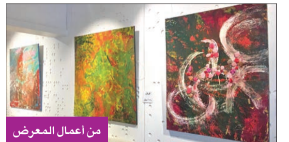
من أعمال المعرض