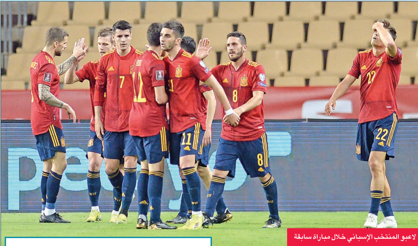
لاعبو المنتخب الإسباني خلال مباراة سابقة