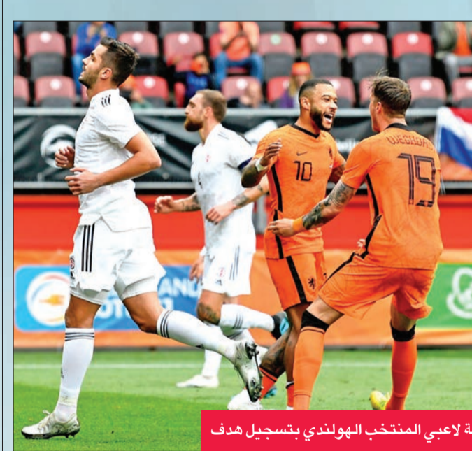
فرحة لاعبي المنتخب الهولندي بتسجيل هدف

وفي مباريات ودية تحضيرية أخرى، فازت الدنمارك على السويد 0-1، اسكتلندا على لوكسمبورغ بنتيجة ذاتها، فيما خسرت النرويج أمام اليونان 1-2.