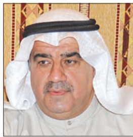
طلال المحمد الصباح