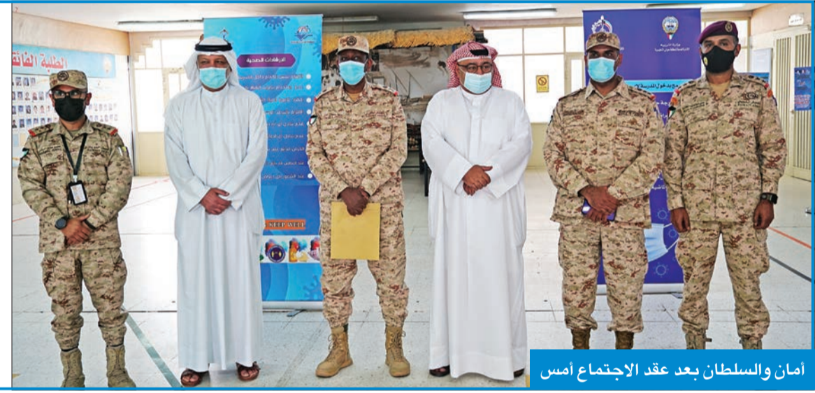
أمان والسلطان بعد عقد الاجتماع أمس

تم خلال الاجتماع مناقشة آخر الاستعدادات والتطورات لمهمة نقل وتوصيل الاختبارات الورقية للصف