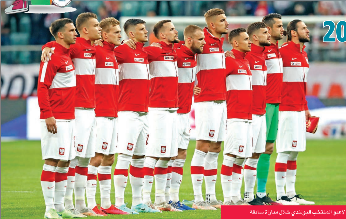
لاعبو المنتخب البولندي خلال مباراة سابقة

تخوض رحلتها المقبلة في البطولة القارية تحت إشراف المدرب الدائم الترحال باولو سوزا الذي عين بدلاً من بريز برزنتشيك بعد الخسارة مرتين