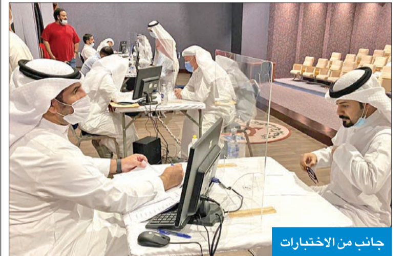
جانب من الاختبارات

بناء على تعليمات مدير الإدارة العامة للجمارك، المستشار جمال الجلاوي، المتعلقة بعقد اختبار للمخلصين الجمركيين الذي أتموا التسجيل يوم 18 مايو الماضي، انطلقت صباح أمس إجراءات اختبار المتقدمين التي تستمر حتى 10 الجاري، وكان التسجيل عن طريق النظام الجمركي الإلكتروني بالإدارة، ويتم تحديد موعد الاختبار للمتقدمين عبر الرسائل النصية (sms) يحدد فيها موعد ومكان الاختبار. وقال رئيس مكتب الشؤون الجمركية