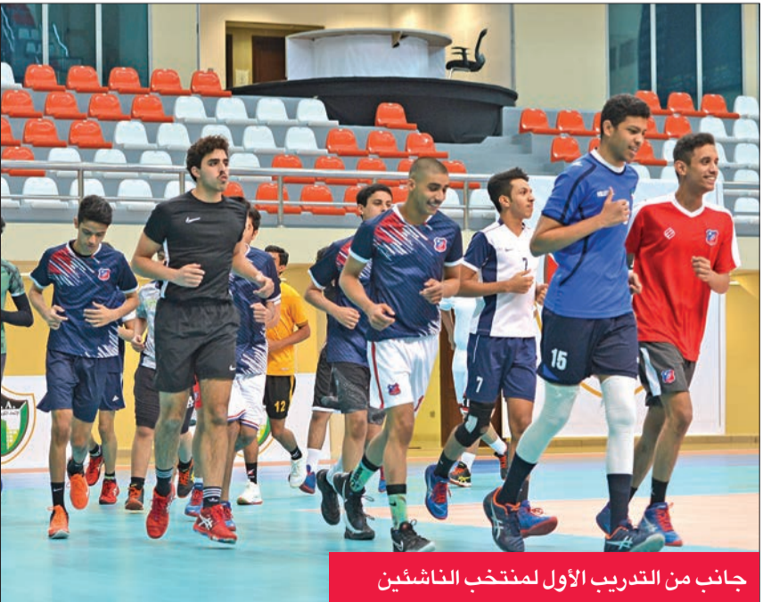
جانب من التدريب الأول لمنتخب الناشئين

على مخرجات المنتخب نظراً لوجود خامات مميزة جداً بين اللاعبين الصغار، ومؤكداً أنهم يقدمون مردوداً جيداً ويبدلون مجهوداً مضاعفاً؛ طمعاً في اغتنام الفرصة لإثبات أحيقتهم في تمثيل المنتخب.