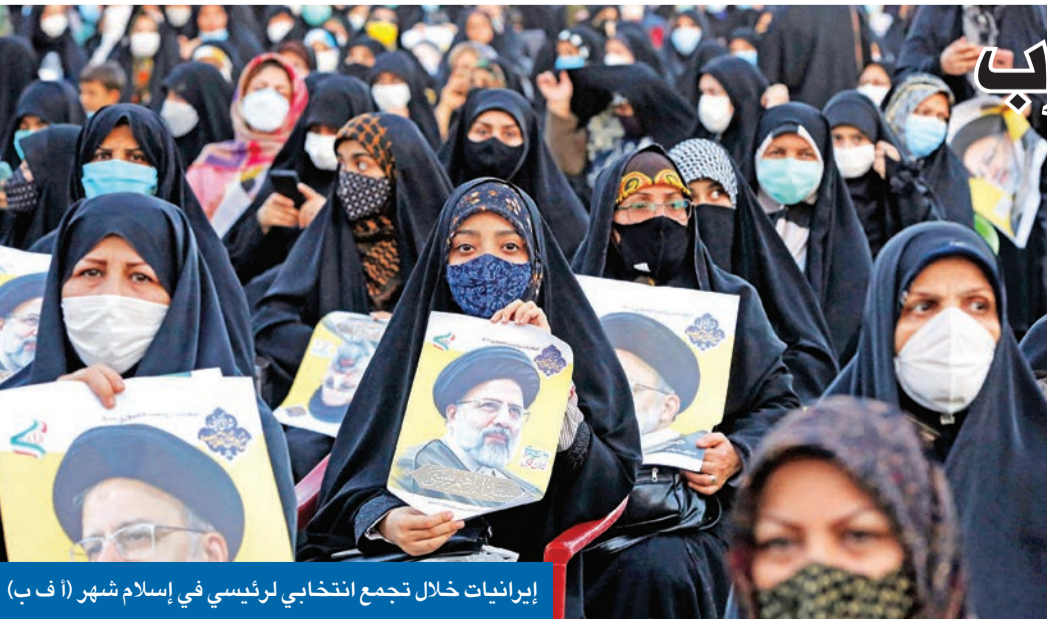
إيرانيات خلال تجمع انتخابي لرئيسي في إسلام شهر

مع اقتراب موعد الانتخابات الرئاسية الإيرانية المقررة 18 الجاري، وتزايد فرص فوز مرشح ينتمي إلى التيار الأصولي؛ يتساءل الجميع عن السياسة الخارجية، التي ستعتمدها الحكومة الإيرانية المقبلة، بعد 8 سنوات صاخبة من حكم المعتدلين الواسطيين، المتحالفين مع الإصلاحيين،