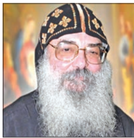
بيجول الأنا بيشوي