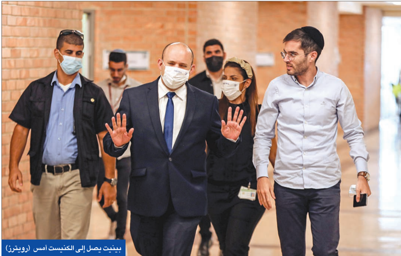
بينيت يصل إلى الكنيست أمس

تقرير عن تعهد لايبيد باستئناف مفاوضات السلام يختبر تماسك «معسكر التغيير»