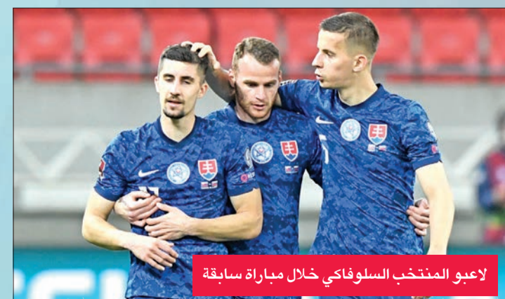
لاعبو المنتخب السلوفاكي خلال مباراة سابقة

ومن الأسماء المعروفة في تشكيلة المنتخب المكنى «سوكولي» (الصفور)، حارس مرمر نيوكاسل الإنكليزي مارتن