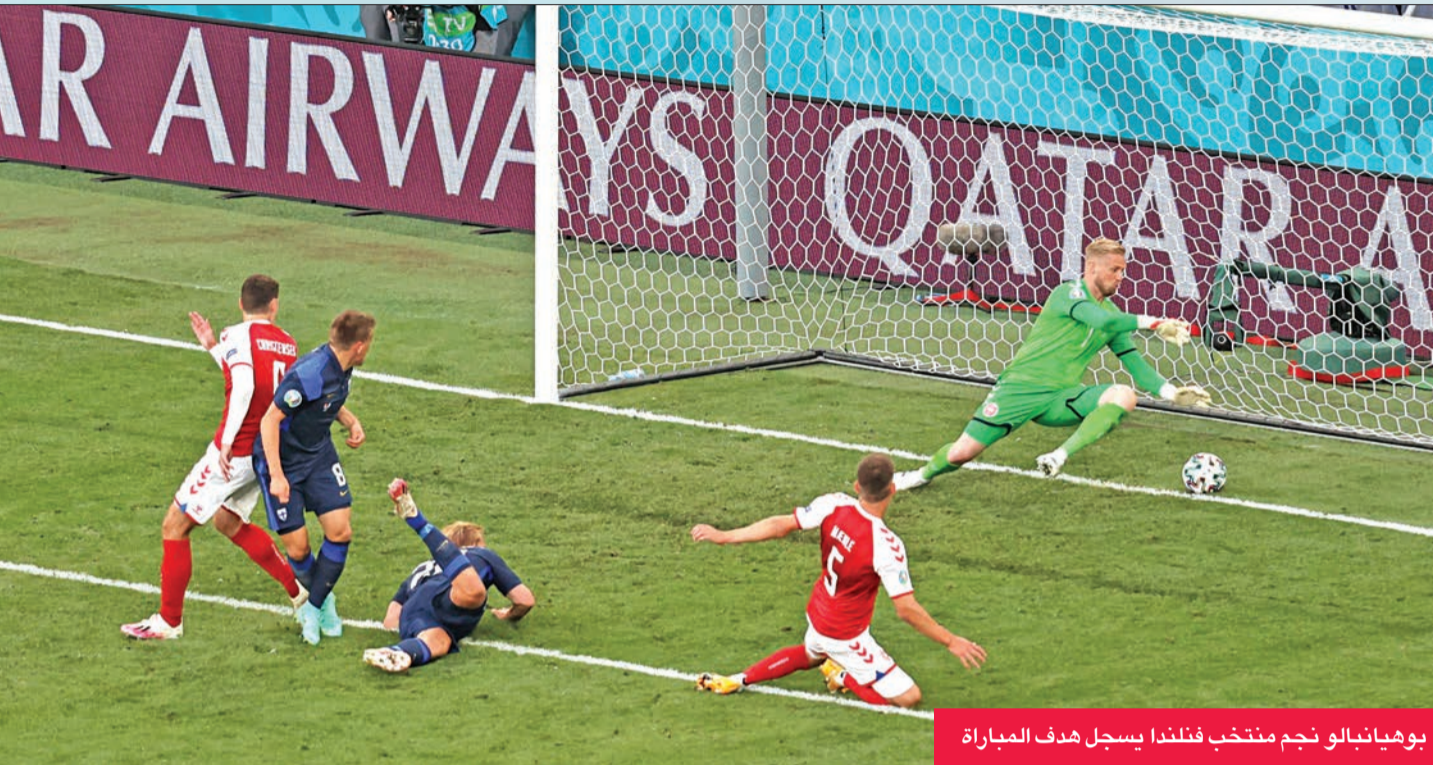
بوهيانالو نجم منتخب فنلندا يسجل هدف المباراة

فاز المنتخب الفنلندي على مضيفة الدنمارك 1- صفر أمس الأول في أول ظهور للفريق الفنلندي في كأس الأمم الأوروبية لكرة القدم.