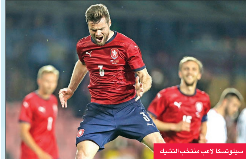
سيلونسكا لاعب منتخب التشيك

المجموعات، وذلك بسبب رفض الحكومة الاسكتلندية تخفيف قيودها الصارمة المتعلقة بجائحة فيروس كورونا للأشخاص المخالطين لحالة إيجابية.