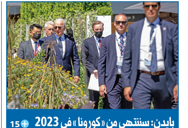
بايدن: سنتهي من «كورونا» في 2023

تجهه الأنظار اليوم إلى استاد «لا كارثوخا» بمدينة إسبيلية، حيث سيلعب المنتخب الإسباني مباراته الأولى في بطولة كأس أمم أوروبا