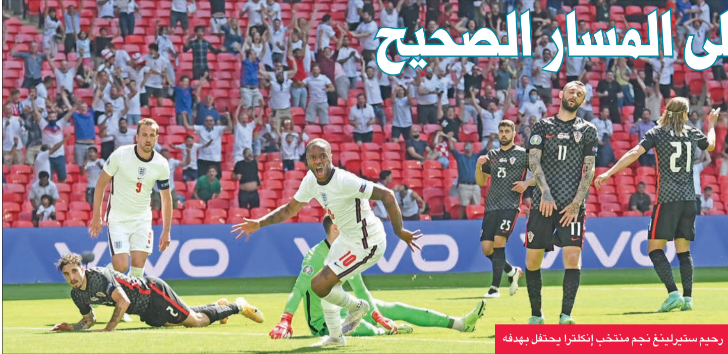
رحيم ستيرلينغ نجم منتخب إنكلترا يحتفل بهدفه

رغم جهود القائد لوكا موريتش والتبديلات التي أجراها المدرب زلاتكو داليتش، لتصبح بالتالي مطالبة بالتعويض في مباراتها الثانية المقفلة الجمعة المقبل ضد تشيكيا في غلاسكو.