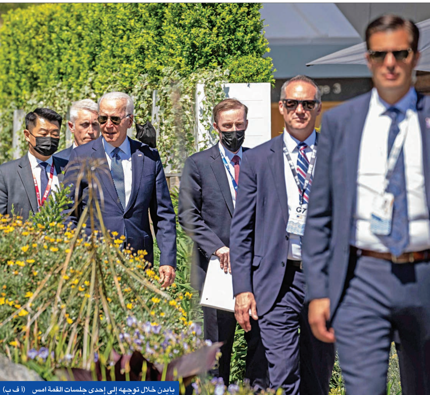
بايدن خلال توجهه إلى إحدى جلسات القمة امس

الصين: زمن سيطرة المجموعات الصغيرة على العالم ولي • بوتين يعرض على بايدن تبادل «قراصنة»