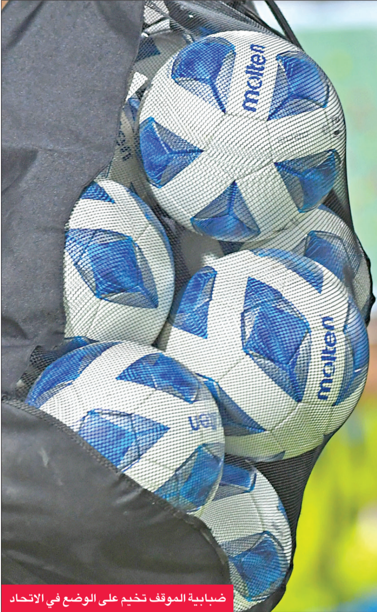
ضبابية الموقف تخيم على الوضع في الاتحاد

● حيات تحدد أسباب استقالتهما وتضع الحلول ● الأزرق يختتم تدريباته استعداداً للصين تايبيه