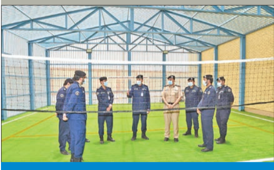
معرفي وقيادات القطاع في أحد المواقع المفتحة

تلك الاستراتيجية وخطط الوزارة لإعادة تأهيل النزلاء وتوفير سلوكهم تمهيدا لإعادة دمجهم في المجتمع، بعد انقضاء مدد الأحكام الصادرة بحقهم. وتهدف عملية التطوير إلى تحقيق الراحة النفسية للنزلاء وكسر الروتين اليومي وتهيئتهم نفسياً للعودة إلى الحياة الطبيعية، لافتة إلى أن قيادات قطاع المؤسسات الإصلاحية حريصون على تطبيق الاشتراطات الصحية والسلامة التي أقرتها السلطات الصحية في البلاد، حفاظاً على صحة وسلامة النزلاء.