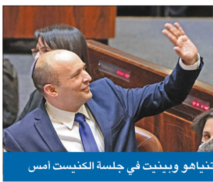
نتياهو وبينيت في جلسة الكنيست أمس

بعد 12 عاماً متواصلة في منصبه، طوت إسرائيل، صفحة رئيس الوزراء بنيامين نتياهو مع تصويت الكنيست لمصلحة منح الثقة لحكومة «اتحاد التغيير» التي سترأسها بالتناوب، زعيم حزب «يميننا» اليميني نفتالي بينيت، وزعيم حزب «هناك» مستقل، الوسطي يائير لابيد، على التوالي. وبعد جلسة