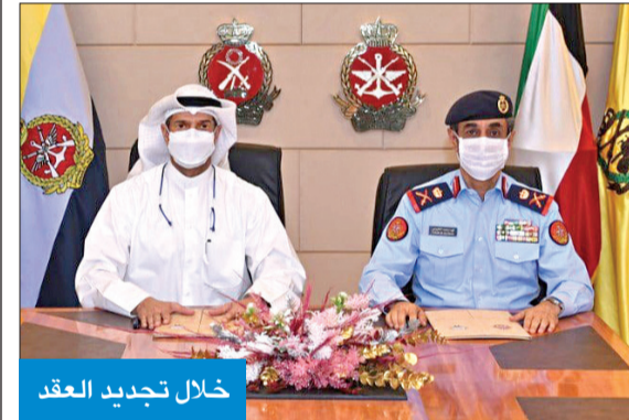
خلال تجديد العقد

أنتنا نتطلع للتعاون الدائم مع الجهات الرسمية الأخرى في البلد بما يخدم وطننا الحبيب وأبناءنا الطلبة.