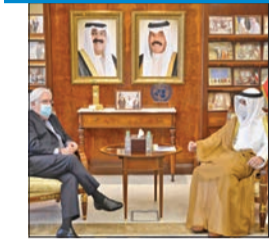
الناصر: ملتزمون بوحدة اليمن واستقراره