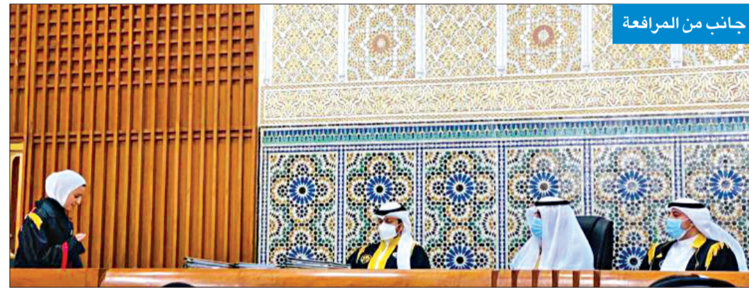
جانب من المرافعة

وأضافت: جاء القدر بها إلى العالم بدأ رحمة وقلباً كبيراً، نرح لها الطيبون من الإخوة والأصدقاء من اصقاع الأرض، يطبلون الرزق الحلال ويسهمون مع أبناء الوطن في نهضته على كافة المستويات، فكانوا قسماً لهم في كدهم ورغدهم سواء بسواء، لا فرق بينهم بسبب الدين أو الجنس أو العرق. وتابعت: «عاش الكويتيون وشركاؤهم في الحياة من عمال المنازل في تائف ورحمة ضمن روح الأسرة الواحدة، تحت سقف واحد بلا استنكار ولا احتقار، تلك هي الحقيقة، وكما أن