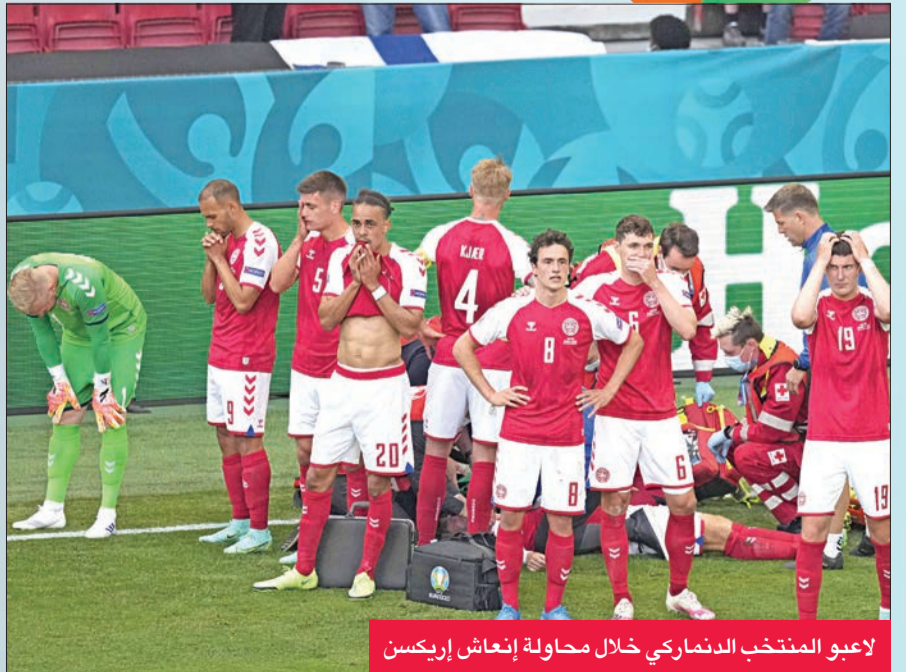
لاعبو المنتخب الدنماركي خلال محاولة إنعاش إريكسن

أكد طبيب القلب سانجاي شارما المتخصص في الطب الرياضي أن النجم الدنماركي كريستيان إريكسن محظوظ لكونه حيا بعد انهياره وسقوطه على الأرض مغشياً عليه خلال مباراة منتخب بلاده أمام فنلندا أمس الأول في مشهد مشوار الفريقين في يورو 2020. وانهار إريكسن (29 عاماً) داخل الملعب قبل دقائق من نهاية الشوط الأول، دون أي تدخل من أي لاعب آخر، وحاول الجهاز الطبي لمنتخب الدنمارك علاج اللاعب على مدار عشر دقائق قبل نقله إلى المستشفى. وقال شارما الذي سبق له العمل مع إريكسن في توتنهام الإنكليزي، إن اللاعب الدنماركي حالته الحظ في النجاة من سكتة قلبية ظاهرة. وأكد شارما الأستاذ بجامعة سان