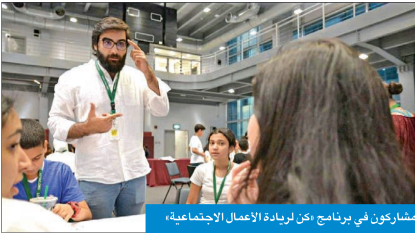
مشاركون في برنامج «كن لريادة الأعمال الاجتماعية»

● برعاية بنك الكويت الوطني و«زين» و«أجيليتي» وبالتعاون مع كلية بابسون الأميركية ● العمر: تدريب الطلبة وتهيئة البيئة الخصبه أمامهم لتنفيذ مشاريعهم الخاصة