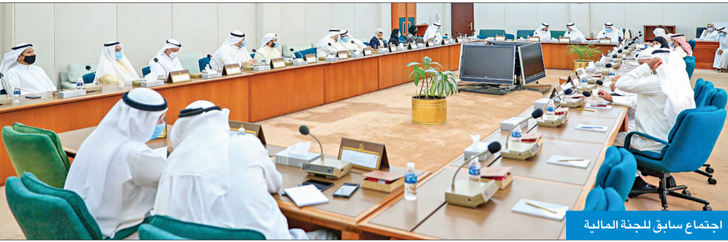
اجتماع سابق للجنة المالية

في تصريح له، قال النائب د. حمد المطر: «لقد بدأت المؤسسات الحكومية تطبيق ضرائب على المواطنين بشكل غير مباشر»، مضيفاً: «اليوم تآخرون دينارين بالفحص الفني للسيارات دون وجه حق، وغدا تستمرون في زيادة الرسوم على جميع الخدمات، لذا ساجوه حزمة أسئلة حول هذا الموضوع».