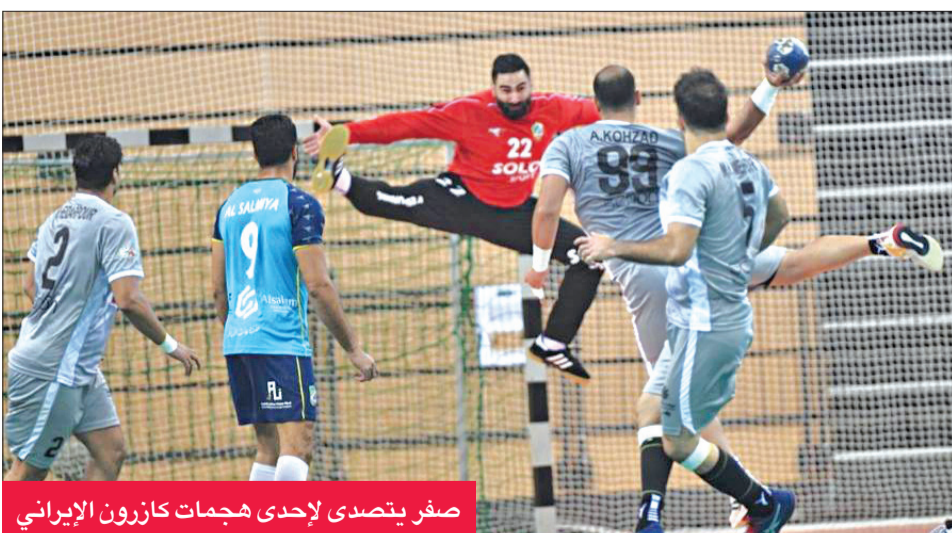
صفر يتصدى لإحدى هجمات كازرون الإيراني

اليوم مع نظيره أوزبك الأوزبكي ضمن الجولة الثالثة من البطولة.