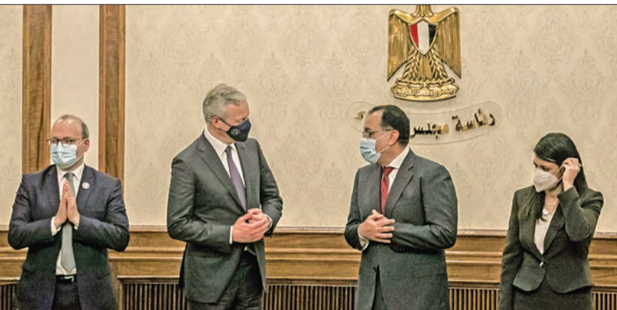
مباحثات اقتصادية بين الحكومة المصرية ووفد فرنسي في القاهرة امس

سياسي من الجامعة العربية. وقبل نحو أسبوعين من بدء إثيوبيا المراء الثاني المنفرد لخزان سد النهضة دون التوافق مع دولتي المصب، خاطبت على مجلس الأمن بالأمم المتحدة، لتسجيل اعتراضها على الخطوات الإثيوبية الأحادية، في خطوة هي الثانية من نوعها، ومن المتوقع أن يتقدم السودان بخطاب مماثل في ظل الاتفاق على تنسيق التحركات المصرية السودانية في هذا الملف. وأفادت مصادر مصرية مطلعة، «الجريدة»، بأن التحرك المصري يأتي في إطار خطة عمل تم الاتفاق عليها مع الجانب السوداني، تتضمن أساساً تكثيف التحركات خارج مظلة الاتحاد الأفريقي الذي أثبت فشله في التعاطي مع الأزمة.