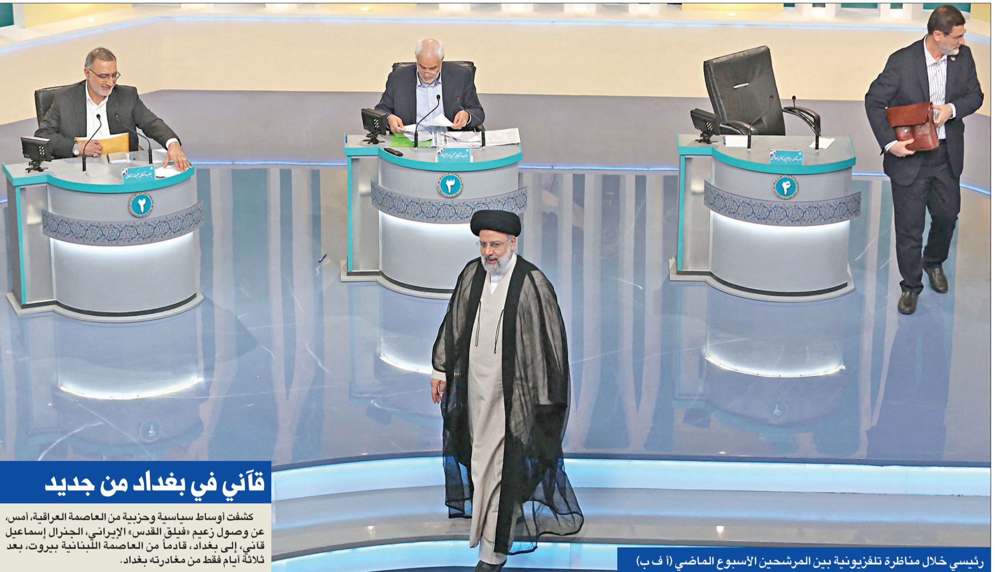
رئيسي خلال مناظرة تلفزيونية بين المرشحين الأسبوع الماضي

رئيسي يتعهد بمواصلة مفاوضات فيينا... وتوقعات غربية بسدّ «الفجوات» خلال أسابيع