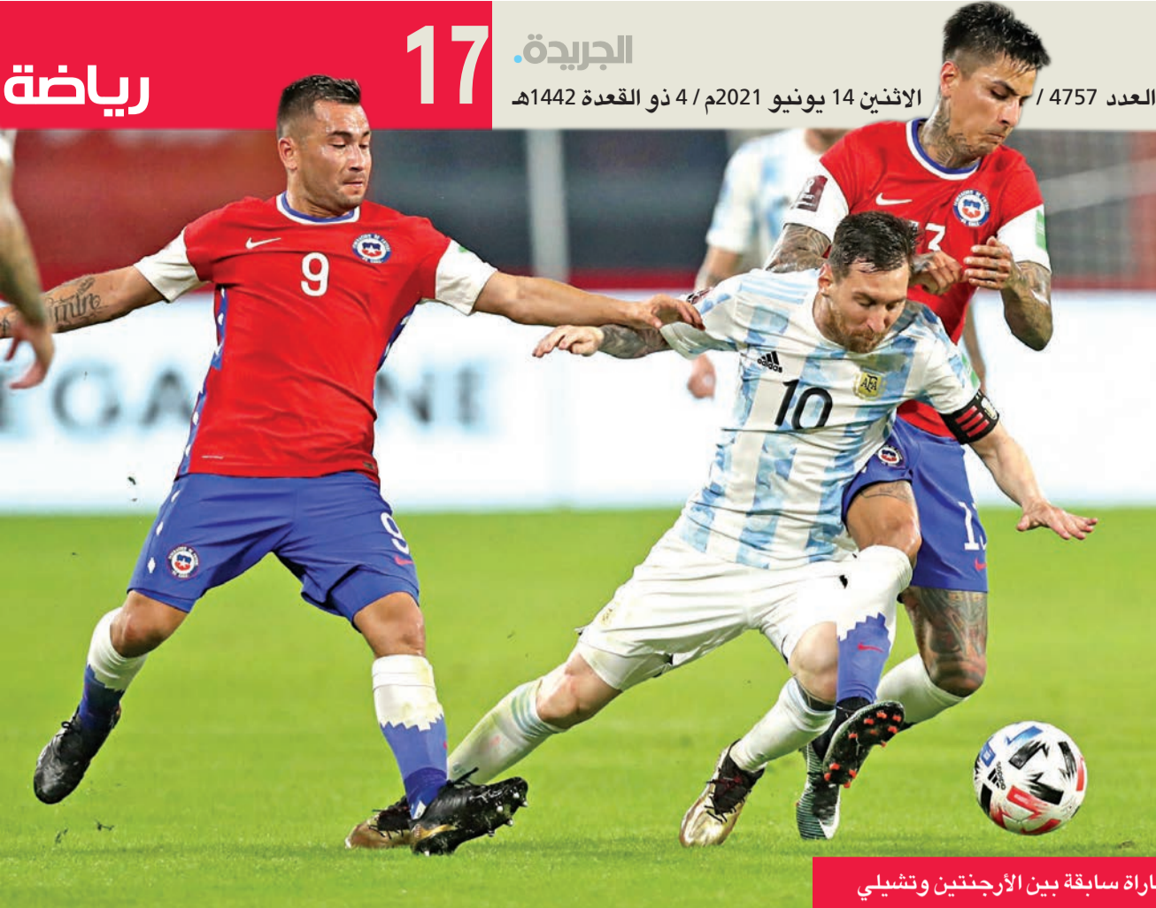
جانب من مباراة سابقة بين الأرجنتين وتشيلي