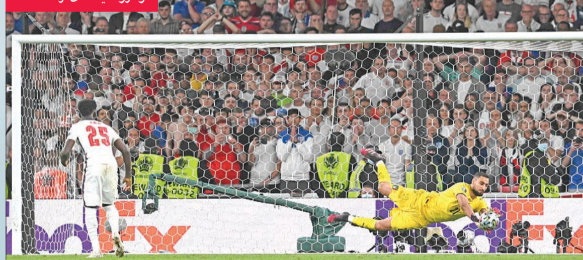
دوناروما يتصدى لركلة ساكا

عكس أداء دوناروما، أمس الأول، النضوج الذي وصل إليه، فبعدما ظل عاجزاً أمام هدف السبق للوك شو بعد دقيقتين من صافرة البداية، وقف مكتف اليدين مع مرور الدقائق باستثناء خروجه مرتين من مرماه بعد تجديد الوقت. جلس دوناروما بسبب ندرة الهجمات الإنكليزية (تسديدة واحدة على المرمى) في غرفة الانتظار واستخدم ورقة الصبر لحين حلول موعد ركلات الترجيح. وبلباس الحارس الواثق من نفسه ومع ابتسامة «قائلة» تبادل الحديث مع رفائقة قبل بداية الركلات الترجيحية، التي أثبتت أن الشكوك لم تساور الظليان كثيراً على قدرة حارس عربيهم برقع قدراته إلى مستوى الحدث، على الرغم من صغر سنه.