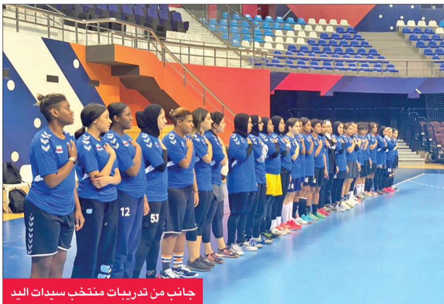
جانب من تدريبات منتخب سيدات اليد

الكويت لكرة اليد، وذلك بعد المساهمة الفعالة للجنة النسائية لسيدات اليد برئاسة د. الجازي المونس، وكذلك مشاركتهم في بطولة آسيا للمرة الأولى في تاريخهم، وهذا إنجاز يدعم الرياضة النسائية في الكويت، ونتمنى أن تكون المشاركة فعالة وإيجابية، وأن تظهر لاعبات الكويت بالشكل والمستوى اللائق، والاستفادة كذلك من الاحتكاك بمنتهيات قوية ومتطورة على الصعيد الآسيوي.