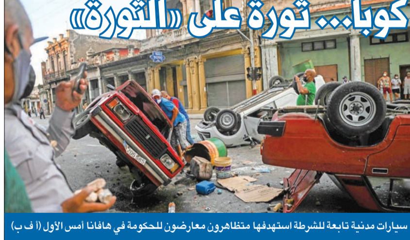
سيارات مدينة تابعة للشرطة استهدفتها مظاهرات معارضون للحكومة في هافانا أمس الأول

يرتفع منسوب الضغط الدولي على القوى السياسية اللبنانية، متخذاً أشكالاً ومضامين متعددة، خصوصاً على الصعيد السياسي، في سبيل تشكيل حكومة جديدة. ويفترض أن يكون هذا الأسبوع مفصلياً فيما يتعلق بالقرار، الذي سيتخذه