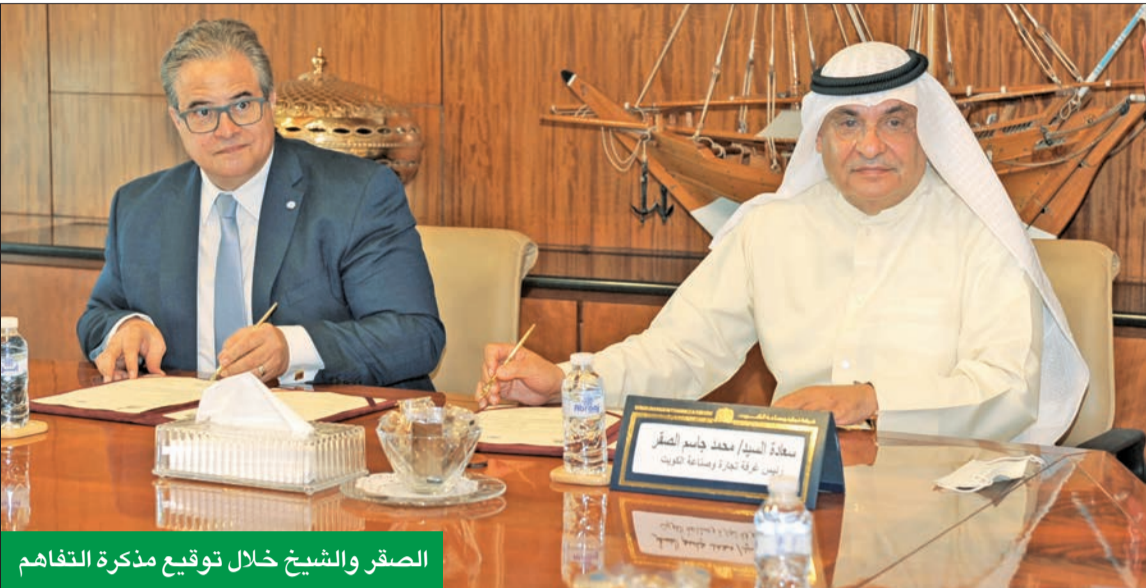
الصقر والشيخ خلال توقيع مذكرة التفاهم

نوبات افتراضية، وحلقات عمل نقاشية وغيرها من الفعاليات التي تشجع على مشاركة القطاع الخاص بأنشطة ومشاريع مستدامة اقتصادياً واجتماعياً وبيئياً، كذلك نشر الوعي المجتمعي بين رواد الأعمال في الكويت وتنمية المهارات والخبرات لتأمين الاتساق مع متطلبات سوق العمل وتعزيز القدرة التنافسية