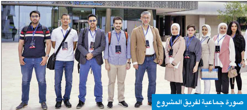
صورة جماعية لفريق المشروع

هذا النوع من المشاريع الفضائية الضخمة. وأضاف عبد الرحيم «أن هذا المشروع ينفذ بدعم من مؤسسة الكويت للتقدم العلمي، وبمشاركة مركز أبحاث أوروبي يعد من أكبر مراكز الأبحاث في مجال الإلكترونيات الدقيقة وتطوير تكنولوجيا الخلايا الشمسية في بلجيكا». من جانبها، ذكرت مديرة برنامج المشاريع الرائدة بإدارة البحوث -