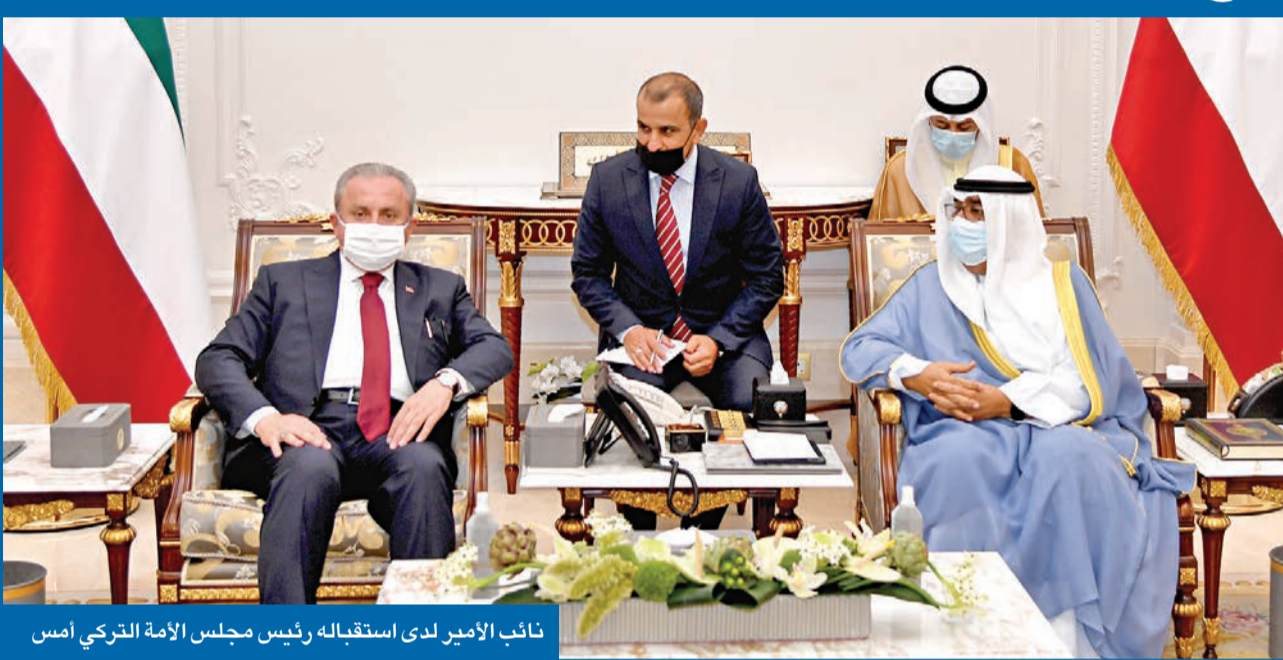
نائب الأمير لدى استقباله رئيس مجلس الأمة التركي أمس