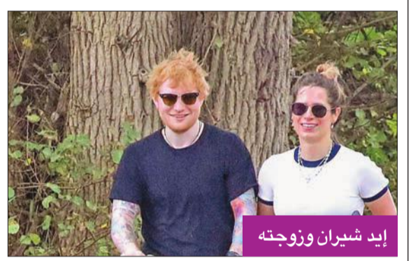
إيد شيران وزوجته

تعلم المغني البريطاني الشهير إيد شيران اللغة الإيطالية، حتى اقتنبا، بعد شراء منزل في إيطاليا، ولا يريد أن يشعر بالحرج أو أن يحرج السكان. وقام شيران، الذي تحتل أغانيه قائمة الأغاني الأكثر شهرة في العالم، بتعيين مدرس لهذا الهدف أثناء إقفال جاحته كورونا، مشيراً إلى أنه بات يشعر بثقة أكبر بشأن رحلاته حول العالم. وذكر شيران، في تصريح سابق: «رسمت في اللغتين الألمانية والفرنسية بالمدرسة، ولم أتعلم اللغات مطلقاً، وأمضيت السنوات الماضية في السفر حول العالم لتحدث الإنكليزية، وأشعر بالإحراج، لعدم القدرة على التواصل. الأمر يشبه مفتاحاً، تفتح الباب وفجأة يفتح لك العالم». وعلق: «كل مرة أذهب إلى منزلي بإيطاليا كان السكان يسألونني: «لم تتعلم اللغة بعد؟»، وأجيبهم: «سأفعل»، لهذا السبب درست اللغة ساعة في اليوم لمدة عشرة أشهر».