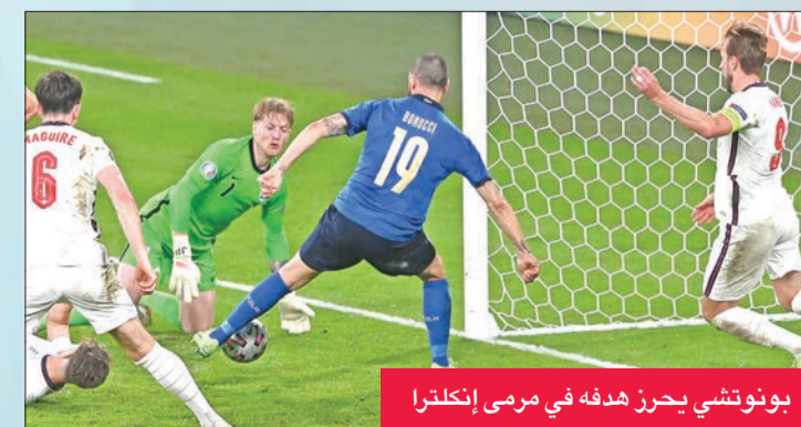
بونوتشي يحرز هدفه في مرمى إنكلترا

كما حقق بونوتشي رقماً قياسياً آخر، بعدما سجل ظهوره الثامن عشر مع منتخب إيطاليا في بطولات اليورو، ليصبح أكثر لاعبي المنتخب الأزرق تمثيلاً في البطولة، متفوقاً ببارق لقاء وحيد على الحارس السابق للمنتخب جيانلويجي بوفون، وكان أيضاً أحد اللاعبين الذين تمكنوا من التسجيل خلال ركلات الترجيح ضد إنكلترا، ليحصد دوراً بارزاً في فوز إيطاليا بلقب بطولة كأس الأمم الأوروبية للمرة الثانية.