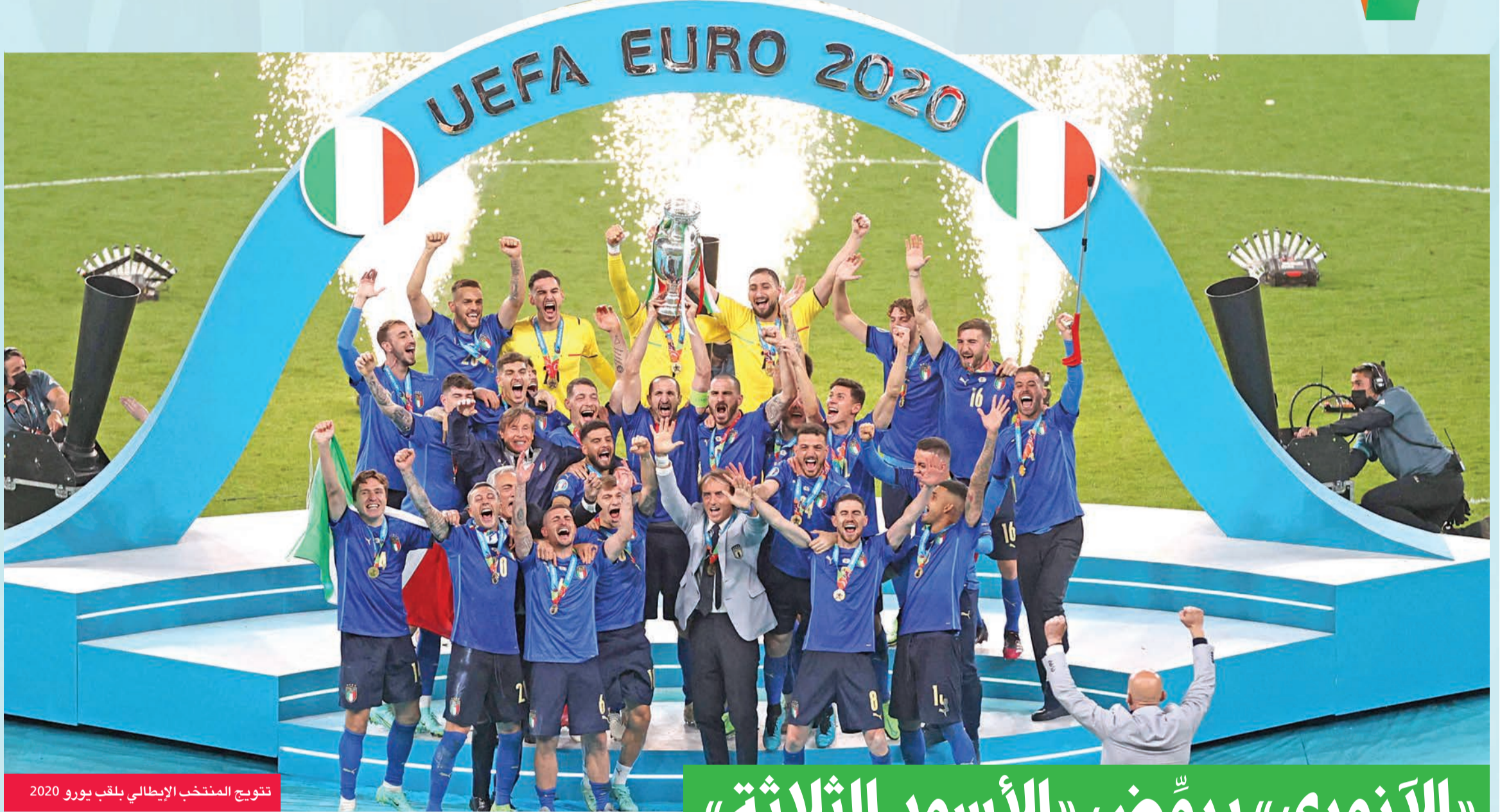
تتويج المنتخب الإيطالي بلقب يورو 2020