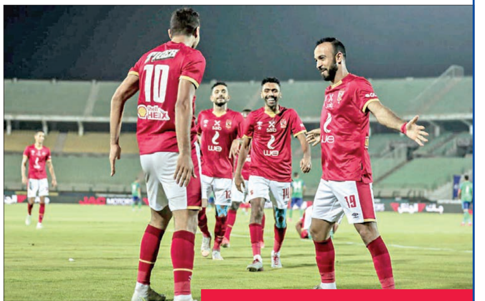
احتفال لاعبي الأهلي بالهدف الرابع في مرمى المقاصة