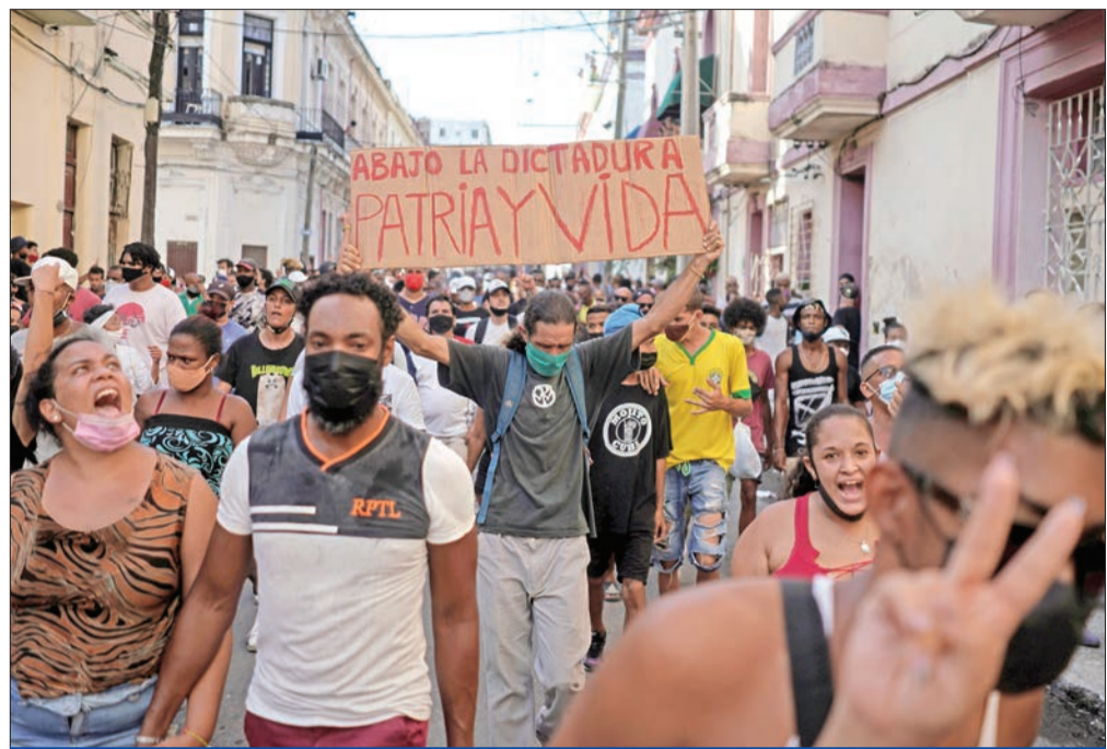
معارضون يرفع أحدهم لافتة كتب عليها «تسقط الدكتاتورية يعيش الوطن» في هافانا أمس الأول