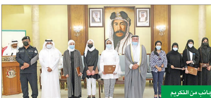
جانب من التكريم

البنك على رعايتها لهذا الحدث، متمنية لـ «التجاري» التوفيق والنجاح في مساعيه النبيلة وعمله الدؤوب لخدمة كل فئات المجتمع.