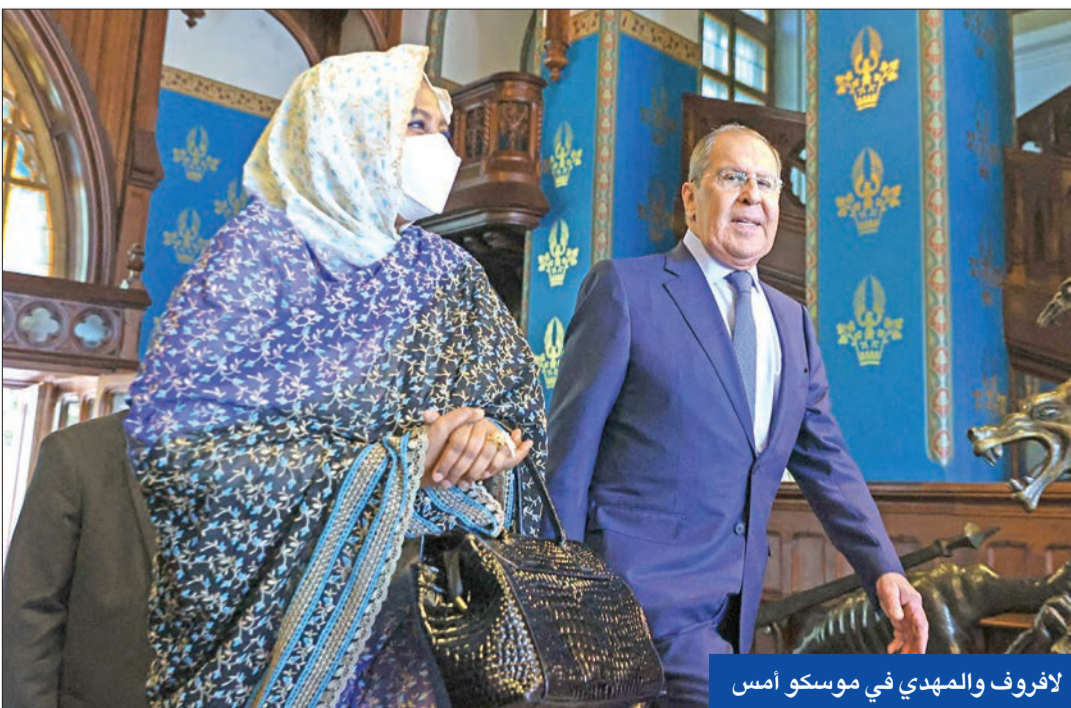
لافروف والمهدي في موسكو أمس

إثيوبيا تعلن عن اتفاقية تعاون عسكري مع موسكو