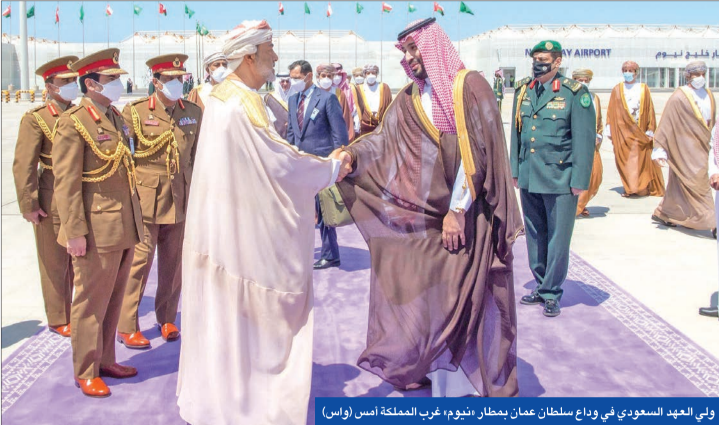
ولي العهد السعودي في وداع سلطان عمان بمطار «نيوم» غرب المملكة أمس (واس)

● بيان مشترك في ختام زيارة السلطان هيثم للمملكة يدعو إلى التعامل بجديّة مع «نووي» إيران وصواريخها ● تسريع افتتاح الطريق البرّي المباشر بين البلدين... وفريق عمل مشترك بين جهازَي الاستثمار