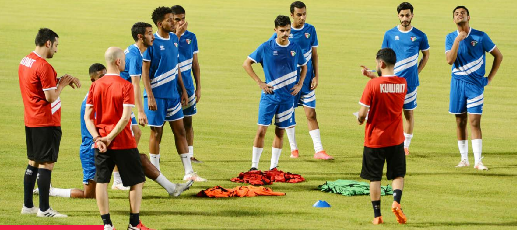
تدريبات الاولمبي في اليوم الأول