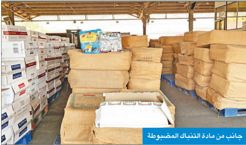
جانب من مادة التنباك المضبوطة