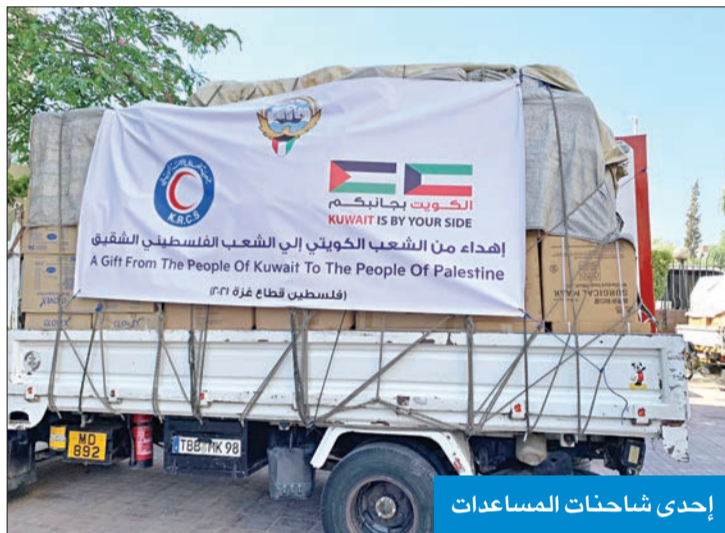
إحدى شاحنات المساعدات

كشفت شركة صناعات الغانم أن لديها على الصعيد المحلي، بالتعاون مع جمعية الهلال الأحمر، مجموعة من المبادرات المشتركة، ومنها تمويل صندوق خاص لتعليم الشباب غير الميسورين، بالتعاون مع الجامعة العربية المفتوحة، وذلك لتمكينهم من الارتقاء بتحصيلهم العلمي والحصول على فرص وظيفية تساعدهم على الاستقلال المادي وتأمين مستقبل مشرق، مما يساهم بصورة عامة في تقدم المجتمع ككل. وأوضحت أن رئيس مجلس إدارتها قتيبة الغانم يؤدي دوراً ناشطاً في دعم الشباب خارج الكويت أيضاً، فقد طالت أعماله عدة دول عربية، بما فيها فلسطين، حيث مكنت مساهماته المقدمة لجامعة بيرزيت من بناء مكتبة يوسف أحمد الغانم في الحرم الجامعي عام 1985، والتي