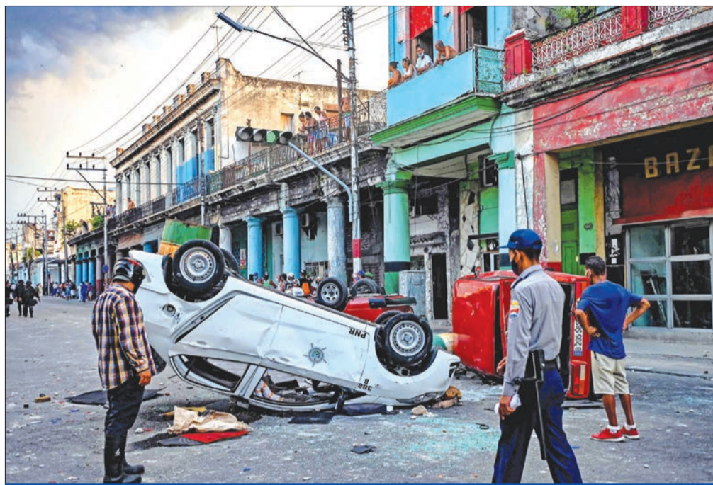
سيارات مدينة تابعة للشرطة هاجمها المتظاهرون المعارضون في هافانا

واشنطن تدعو النظام إلى الاستماع لشعبه وهافانا تتهمها بالسعي لإثارة اضطرابات اجتماعية