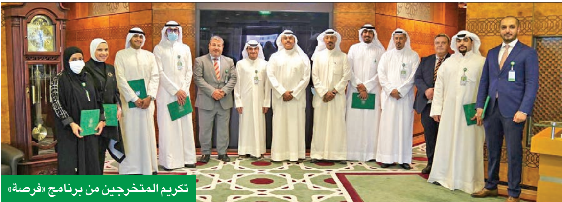
تكريم المتخرجين من برنامج «فرصة»

العمر: نحرص على تعزيز فكرة العقلية الرقمية المبتكرة لدى موظفينا