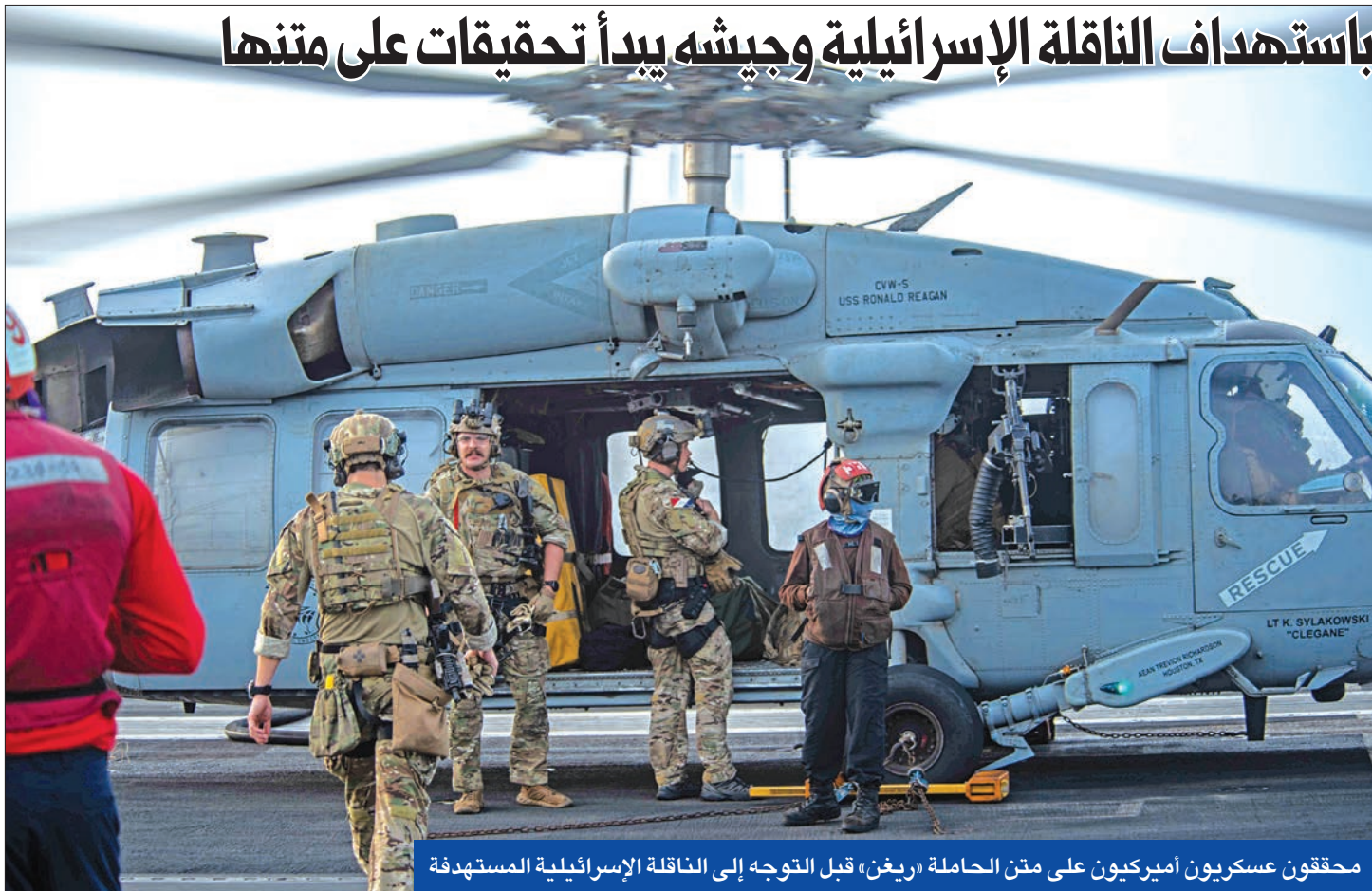
محققون عسكريون أميركيون على متن الحاملة «ريغن» قبل التوجه إلى الناقلات الإسرائيلية المستهدفة

مسؤول أميركي يتهم طهران باستهداف الناقلات الإسرائيلية وجيشه يبدأ تحقيقات على متنها