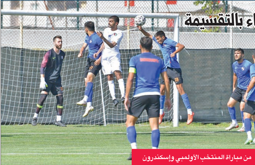
من مباراة المنتخب الأولمبي وإسكندرون