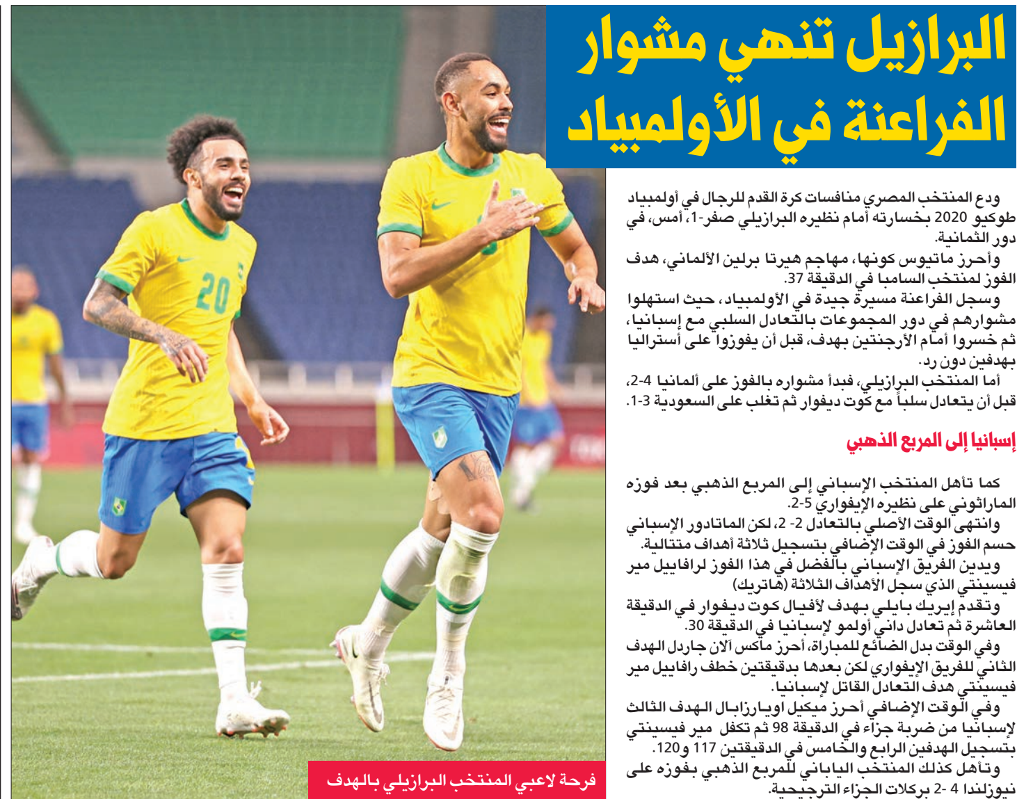
فرحة لاعبي المنتخب البرازيلي بالهدف

● حطمت بريطانيا الرقم العالمي في طريقها إلى إحراز ذهبية سباق المتابع المختلط 4 مرات 100م متنوعة في رياضة السباحة، أمس، أمام الصين وأستراليا، خلال الألعاب الأولمبية في طوكيو. وسجل الفريق البريطاني، الذي يضم كاتلين داوسون، آدم بيتي، جيمس غاي، وأنا هوكين، زمناً قياسياً قدره 3:37.58 دقائق، محطماً الرقم السابق المسجل باسم الصين العام الماضي في تشينغداو (3:38.95). ● وحل الفريق الصيني ثانياً، مسجلاً 3:38.86 د، فيما حصدت أستراليا البرونز بزمن 3:38.95 د. ● وأنهى الأميركيون السباق في المركز الخامس (3:40.58)، رغم تواجد كاليب دريسل المتوج بثلاث ذهبيات بطوكيو في المئة متر الأخيرة. وبذلك يخسر مسعاه إلى ست ميداليات في النسخة الحالية. ● أنهى المنتخب الفرنسي دور المجموعات من مسابقة كرة السلة للرجال في أولمبياد طوكيو، بفوز ثالث تواليًا، وجاء على حساب نظيره الإيراني 62-79، أمس، في المجموعة الأولى. ● وفي المجموعة الثانية، لحقت إيطاليا بأستراليا إلى ربع النهائي، بفوزها على نيجيريا 80-71 (الأربعاء 29-17 و 22-11 و 24-8)، بفضل جهود نيكولو ميلي (15 نقطة) ونيكو مانيون (14 نقطة) واكيلي بولونارا (13) وسيموني فوتنكيو (12). ● وعلى غرار فرنسا، أنهت أستراليا دور المجموعة بفوز ثالث تواليًا، وجاء على حساب ألمانيا 89-76 (الأربعاء 18-22 و 26-18