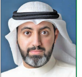
إعداد - د. فايز الفلزي مستشار قانوني مكتب أركان