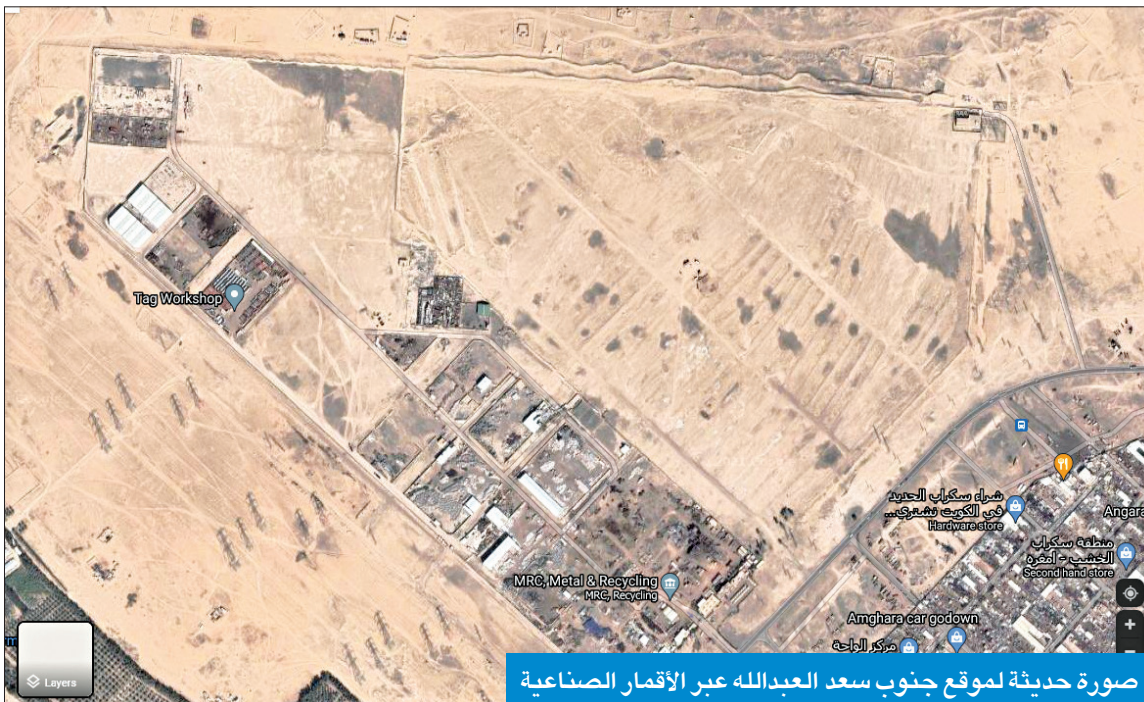
صورة حديثة لموقع جنوب سعد عبدالله عبر الأقمار الصناعية

المخصص لها في النعاج، لتتبقى عملية تنظيف بعض المعدات التي لا تحتاج إليها الشركة في الموقع الذي سيضم 25 وحدة سكنية. من جهتها، أكدت مصادر في بلدية الكويت أن الموقع لم يتم إخلاؤه رغم انتهاء الموعد النهائي للجهات المعنية للمشروع، مبينة أن البيات البلدية أنجزت العمل المطلوب منها، وما زالت تتابع الموقع عن كثب في حال احتاجت بعض الجهات إلى المساعدة. وأوضحت المصادر أن الموقع يحتاج إلى تنظيف شامل، إذ إن بعض الجهات تركت مخلفات فيه، تشتمل على البيات ومبان مؤقتة.