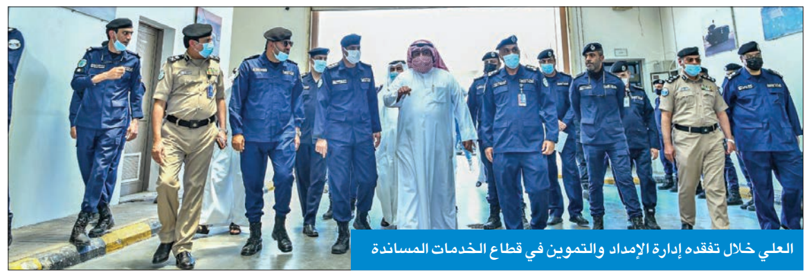
العلي خلال تفقده إدارة الإمداد والتموين في قطاع الخدمات المساندة

دعم قطاع شؤون الخدمات المساندة. واستمع العلي إلى إيحاءات حول آلية عمل الإدارة العامة للإمداد والتموين والخدمات التي تقدمها للأجهزة الأمنية، كما شاهد عرضاً مرئياً عن إنجازات الإدارة والتي تتواءم مع استراتيجية المؤسسة الأمنية التقنية والتكنولوجية.