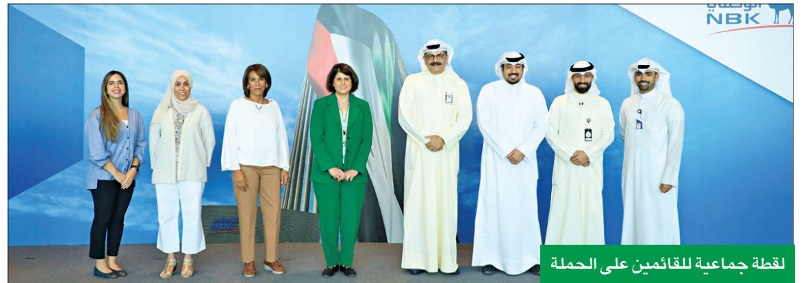
لقطة جماعية للقائمين على الحملة

بالتعاون مع وزارة الداخلية ومؤسسة «لويك» التطوعية