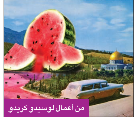
من أعمال لوسيدو كريدو

والتهريب من قبل الاحتلال. حدير بالذكر، أن مؤسسة لابا أطلقت سابقاً عملاً موسيقياً مشتركاً مع معهد إدوارد سعيد الوطني للموسيقى، ونشر الوعي الإنساني المطلوب من خلال فنهم.