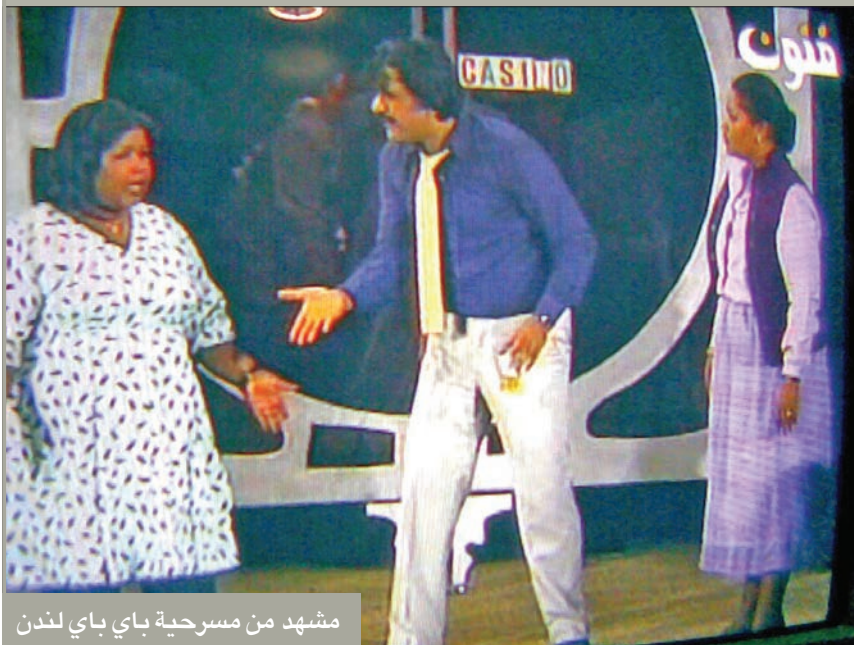
مشهد من مسرحية باي باي لندن