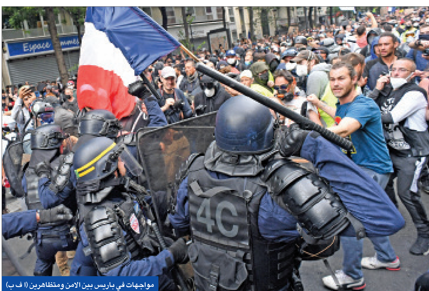
مواجهات في باريس بين الأمن ومتظاهرين (أ ب ف)

● الصين ترصد بؤرتي تفشٍ وتدرس منح المطعمين «جرعة ثالثة» وتفرض إغلاقات جزئية ● «الصحة العالمية» تحذّر من «متحورات أخطر» وتظاهرات بفرنسا ضد اللقاح الإلزامي