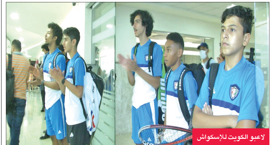
لاعبو الكويت للإسكواش

الكويتيين سواء في المباريات أو البطولات منذ سنتين نظراً للتوقف الذي نتج عن انتشار فيروس (كورونا المستجد - كوفيد 19). وأكد أن البطولة فرصة مهمة للاعبين من أجل استعادة لياقتهم التي تأثرت بطول فترة الغياب، مبيناً أن الوفد الكويتي يضم عشرة لاعبين من الفئات العمرية تحت 11 و13 و15 و17 عاماً. ويشارك في البطولة العربية المصرية الدولية المفتوحة للإسكواش (بالم هيلز) ناشئون وناشئات للفئات العمرية تحت 11 و13 و15 و17 عاماً فضلاً عن الرجال والسيدات من أكثر من 12 دولة عربية وأوروبية حيث وصل عدد اللاعبين المتنافسين في البطولة إلى 510 لاعبين ولاعبات. وتقام البطولة بنظام المجموعات على أن يكون هناك أربعة أو خمسة لاعبين ولاعبات في كل مجموعة حيث سيتأهل الأول من كل مجموعة إلى الدور الثاني الذي سيقام بنظام خروج المغلوب. (كوفا)