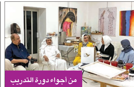
من أجواء دورة التدريب

عليكم بشفاء لا يغادر سقما، لمواصلة نشاطكم الإعلامي وعطائكم المعهود، ونحمد الله بعد أن تكملت عملياتكم بالنجاح». وشكر إويس كل الذين سألوا عنه أثناء هذه الفترة.