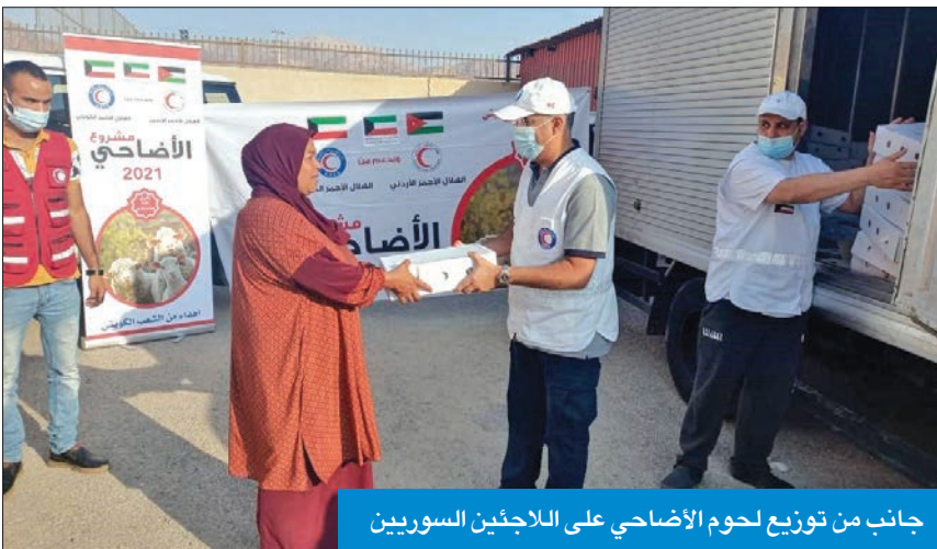
جانب من توزيع لحوم الأضاحي على اللاجئين السوريين

والماعز على 1600 أسرة مستهدفة في عدة محافظات بمنية.