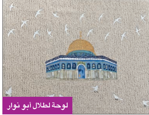
لوحة لطلال أبو نوار