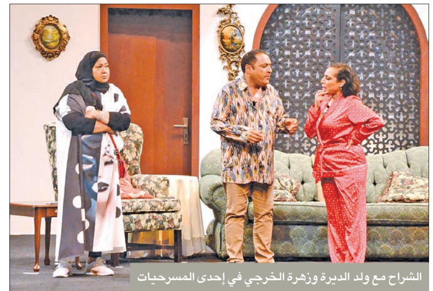
الشراح مع ولد الديرة وزهرة الخرجي في إحدى المسرحيات