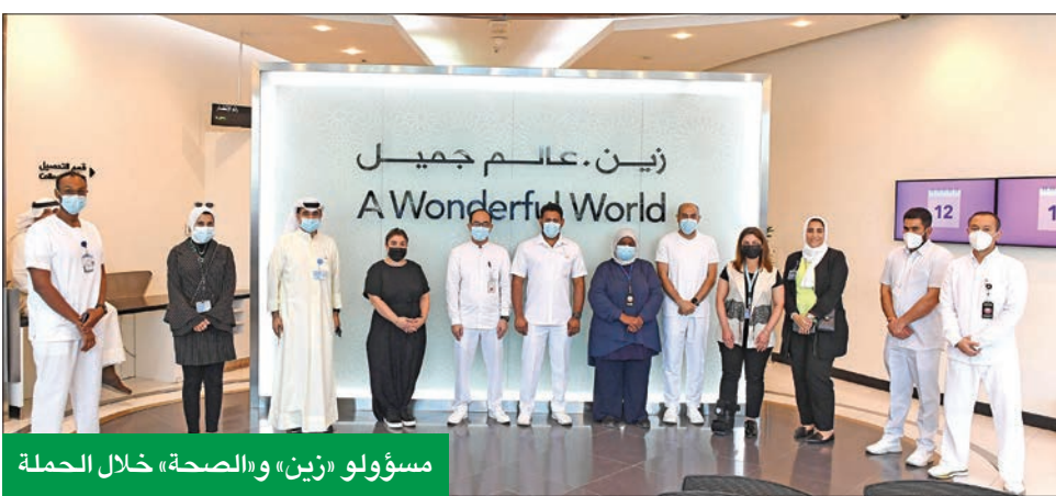
مسؤولو «زين» والصحة» خلال الحملة

على مدار العام في إطلاق المبادرات المجتمعية، وتبني البرامج الصحية والاجتماعية وغيرها، إلى الجانب التعامل مع هذه الأزمة بروح المشاركة الوطنية تحت مظلة استراتيجيتها للاستدامة والمسؤولية الاجتماعية، وبصفتها من كبرى الشركات الوطنية في القطاع الخاص، كشفت الشركة عن طبيعة المبادرات والأعمال التي من الممكن أن تساهم فيها المسؤولية الاجتماعية، وبتنفيذها في المحن والأزمات، وما يمكن أن تقدمه من مساندة حقيقية للقطاعات الحكومية، ومساعدتها في مواجهة هذه الجائحة.