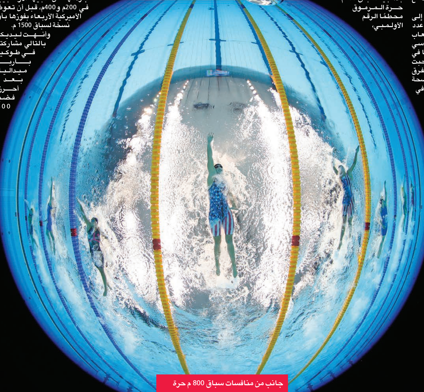
جانب من منافسات سباق 800 م حرة

من منافسات «أولمبياد طوكيو»، إثر إعلان غيابها عن مسابقتين أخريين في الجمباز، فيما واصل مواطنها كاليب دريسل، وكيتي ليدبيكي تألقهما في حوض السباحة، مضيفين ذهبية في العاصمة اليابانية.