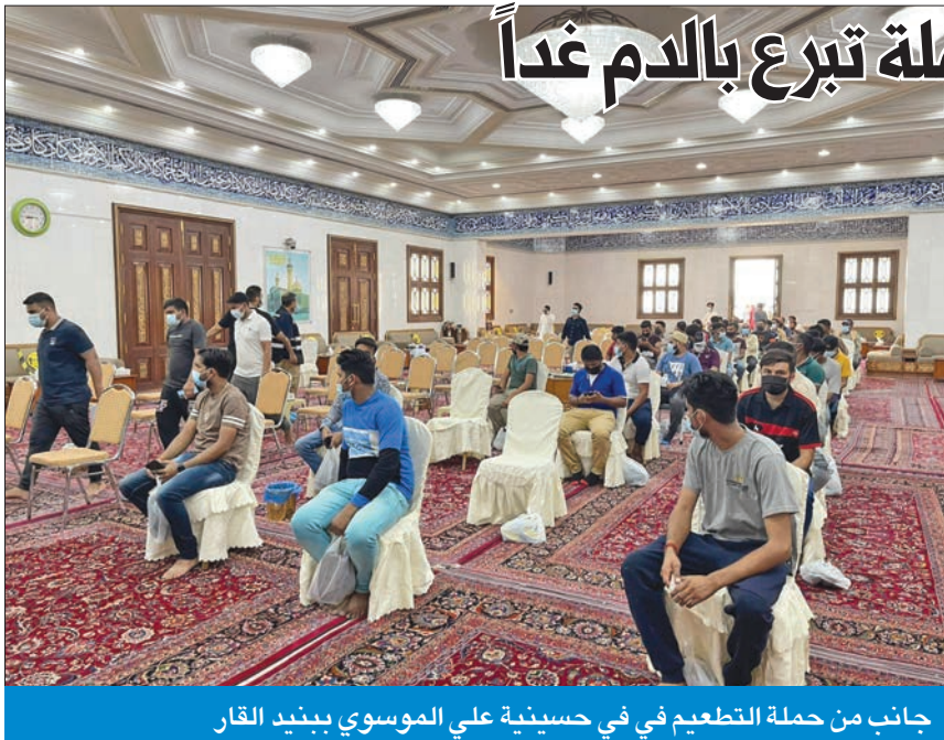
جانب من حملة التطعيم في في حسينية علي الموسوي ببينيد القار

نحو منصف للجميع في كل مكان، فسيستمر الفيروس في الانتشار والتحوّل، لذلك فإن منظمة الصحة العالمية تحت البلدان على تعزيز التغطية باللقاحات، وعلى التصدي للمعلومات المضللة والتردد في أخذ اللقاحات اللذين يمتنعان الناس من قبول اللقاحات.