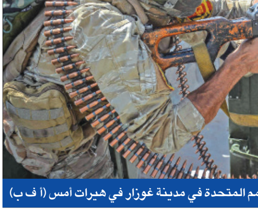
جندي أفغاني في حالة استعداد أمام مقر للأمم المتحدة في مدينة غوزار في هيرات أمس

تشيكيا توافق على مساعدة «الترجمين» ووصول 200 إلى أميركا