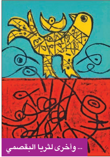
... وأخرى لثريا البقصي