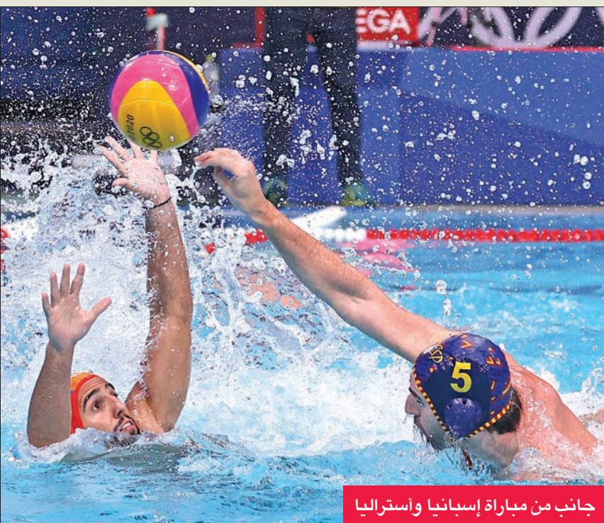
جانب من مباراة إسبانيا وأستراليا

أكد منتخب إسبانيا للرجال لكرة الماء أحقيته بصدارة المجموعة الثانية من منافسات أولمبياد طوكيو 2020 بفوز أكبر كبير على أستراليا 16-5.