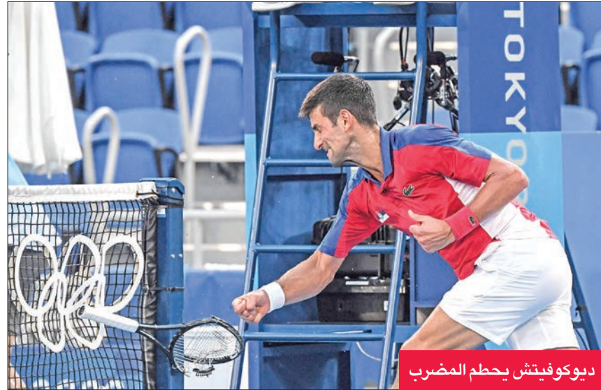
ديوكوفيتش يحطم المضرب

في أقل من 24 ساعة، خسر الصربي نوفاك ديوكوفيتش ثاني مبارياته في المنافسات الفردية بكرة المضرب، عندما سقط المصنف أول عالمياً أمام الإسباني بابلو كارينيو بوستا 4-6، 7-6 (8/6)، و 3-6، ليحز الأخير برونزية أولمبياد طوكيو السبت.