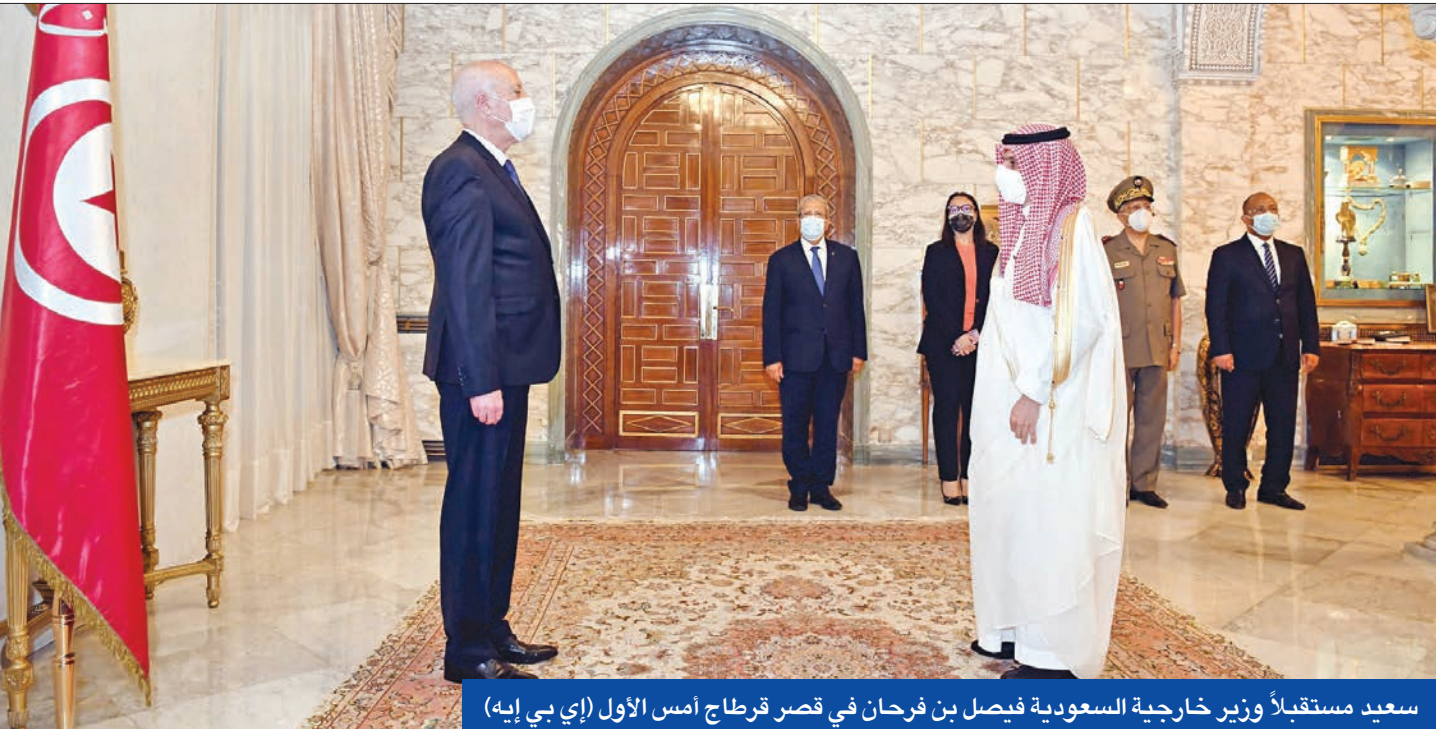
سعيد مستقبلاً وزير خارجية السعودية فيصل بن فرحان في قصر قرطاج أمس الأول

في حين أكد سعيد أنه لن يتحول إلى ديكتاتور جديد، محذراً من عواقب دعوة زعيم حركة «النهضة» راشد الغنوشي إلى النزول في الشارع، تشهد الحركة الإسلامية المحافظة انقسامات حول اللجوء إلى هذه الخطوة، والمسار السابق الذي أدى إلى الوضع الحالي.