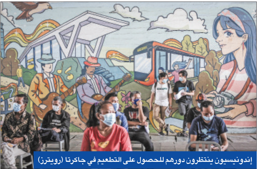
إندونيسيون ينتظرون دورهم للحصول على التطعيم في جاكرتا

وكشفت مذكرة رسمية أميركية أن سلالة "دلتا" معدية بالدرجة