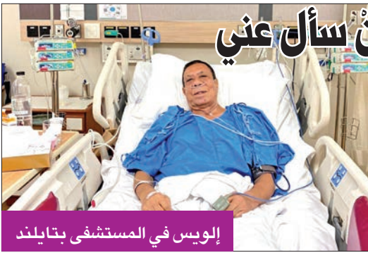
إويس في المستشفى بتابند

أجرى الإعلامي محمد إويس عملية جراحية في القلب، إثر انسداد بأحد الشرايين، بالمستشفى الأميركي في تابند، واستمرت العملية أكثر من 4 ساعات، بسبب دقتها. وقد تكلفت الجراحة بالنجاح.