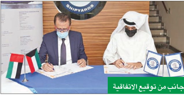
جانب من توقيع الاتفاقية

على تنفيذ اتفاقيات وعقود استراتيجة مع مؤسسة الموانئ، منها عقد لتشغيل وصيانة الرفعات الجسرية والرافعات الجسرية المتحركة والمعدات الأرضية بميناء الشويخ التابع لمؤسسة الموانئ مدته تصل إلى 36 شهراً، وقيمة تصل إلى حوالي 14 مليون دولار، إذ يتبقى من عمر العقد نحو عام. وتوقع أن الشركة تقوم بأعمال التنفيذ اللازمة لمشروع الدلائل الملاحية التابعة لمؤسسة الموانئ، والتي تتعلق بإصلاح وتشغيل وصيانة مع توريد وتركيب قطع غيار للعوامات والركائز البحرية، لافتاً إلى أن قيمة العقد تبلغ نحو 4 ملايين دولار، وعن المشاريع التي تم تنفيذها سابقاً لدى مؤسسة الموانئ، أفاد