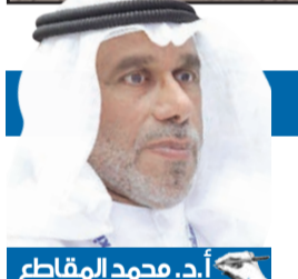
أ.د. محمد المقاطع

الذمة ودافع المال وقناص الأموال العامة وتلاشت القيم، ونجح الرائي وهيمن المزور، وأسرت مفاصل الدولة بيد خمسة أشخاص، وتشتت وتاهت التيارات والمجاميع السياسية وحلت مكانها الطائفية والقبلية، وجميعهم يسعى لنيل فئات رفات الوطن. نعم، تحرر البلد من الغزو، ولكن لم تحرر كثير من العقول التي تمثل غزواً داخلياً. إن الأمانة التي أوكلها الرعيل الأول لأجياله هي الحفاظ على الوطن، لا في الحدود فحسب بل في الكيان والوجود، ورغم كل ذلك يبقى الكويت وطن النهار الذي لن تغيب شمس، وتاريخه لن يُغييه ضعف أو فساد أو تامر دولي، وتحريره كان ولا يزال رمزاً للوجود بلا قيود أو حدود. وسيأتي اليوم، وهو قريب جداً، الذي يتم تحرير الوطن فيه من الفساد ورموزه وشخصياته، وسنساعد برؤيتهم خلف القضبان قريباً، واسترداد الأموال المنهوبة من قبلهم.