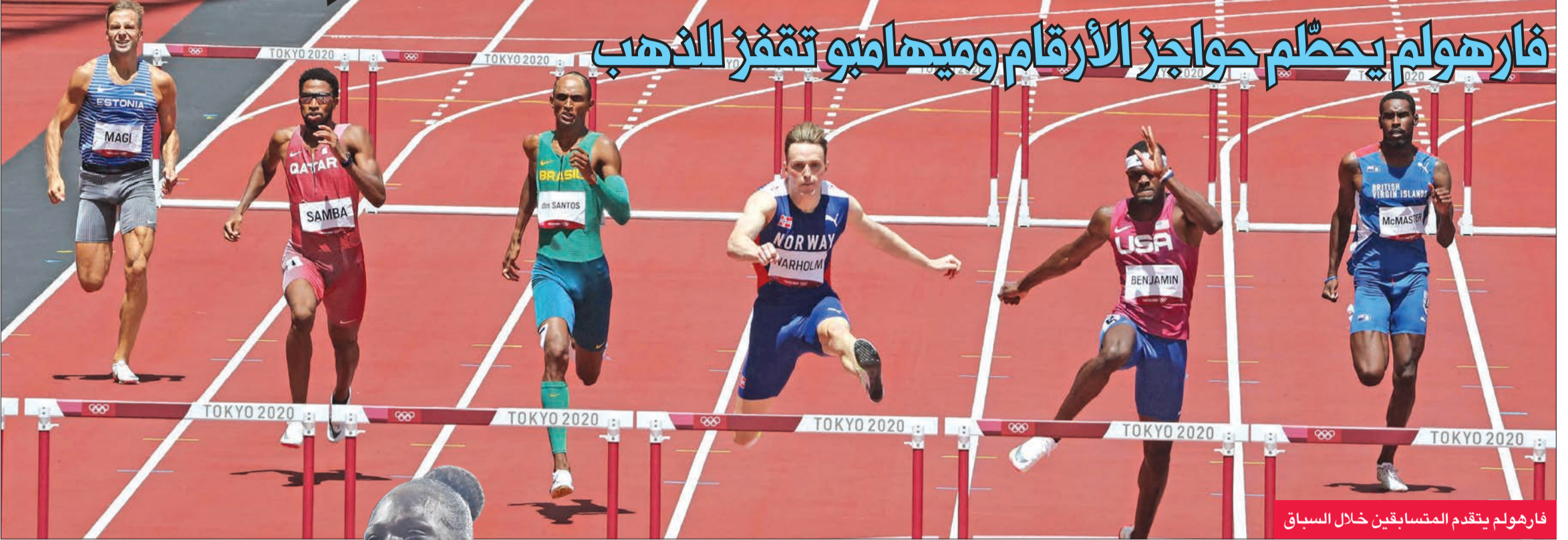
فار هولم يتقدم المتسابقين خلال السباق

فار هولم يحطم حواجز الأرقام وميهامبو تقفز للذهب