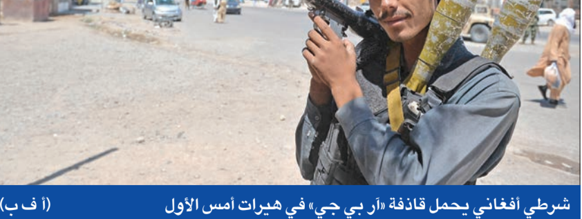
شرطي أفغاني يحمل قاذفة آر بي جي في هيرات أمس الأول

تهديد أو خطر على الدول «طالبان»، محمد نعيم إن علاقات الحركة مع روسيا والصين قديمة وقوية، وإن هناك تواصل مستمرا معها.