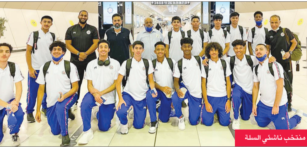
منتخب ناشئي السلة

تصفيتهم من قبل الجهاز الفني سيرافون الوفد إلى البحرين، تحسباً لظروف كورونا، وإمكانية استبدال لاعب مكان آخر في حال إصابة لاعب بالفيروس. ولفت إلى أن الاتحاد يتطلع إلى التأهل إلى نهائيات آسيا، لكن المنافسة ليست سهلة، نظراً لتوقف نشاط المراحل السنوية في البلاد منذ عام ونصف العام بسبب «كورونا»، في الوقت الذي كانت منافسات المراحل السنوية في بعض الدول الخليجية تعمل دون توقف، ما يمنحها الأفضلية على منتخبنا الوطني.