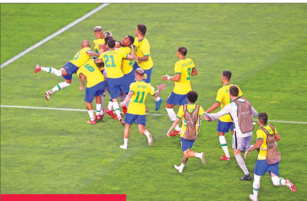
فرحة لاعبي البرازيل بعد التأهل للنهائي

1984 و 1988 و 2012 و ذهبية ريو، وستلعب المكسيك مع اليابان الجمعة مباراة الميدالية البرونزية.