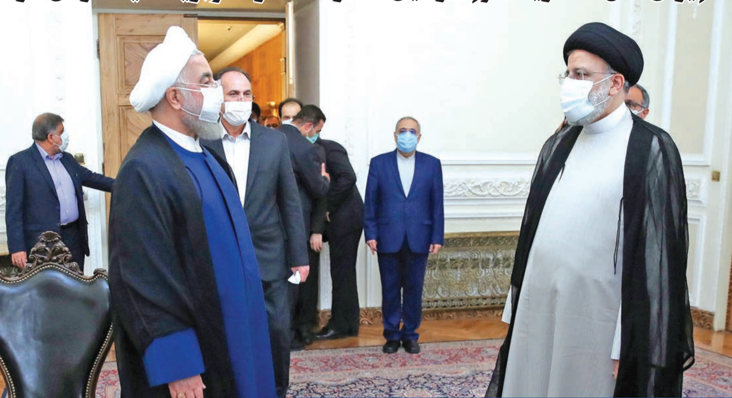
روحاني ورئيسي قبيل بدء مراسم التنصيب في طهران أمس

نصب المرشد الإيراني علي خامنئي، الأصولي المتشدد إبراهيم رئيسي رئيساً جديداً للبلاد، متوقفاً أن تكون إدارته «جهادية وحكيمة» وسط مواجهة الأعداء، في حين تصاعدت الانتقادات الدولية لحادث الاعتداء على ناقلة النفط الإسرائيلية قبالة عمان، بالتزامن مع تأكيد إسرائيل احتفاظها بحرية التحرك منفردة ضد طهران.