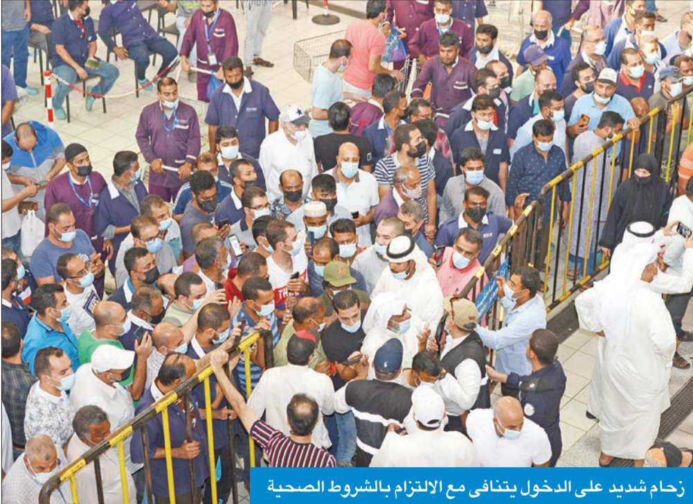
زحام شديد على الدخول يتنافى مع الالتزام بالشروط الصحية