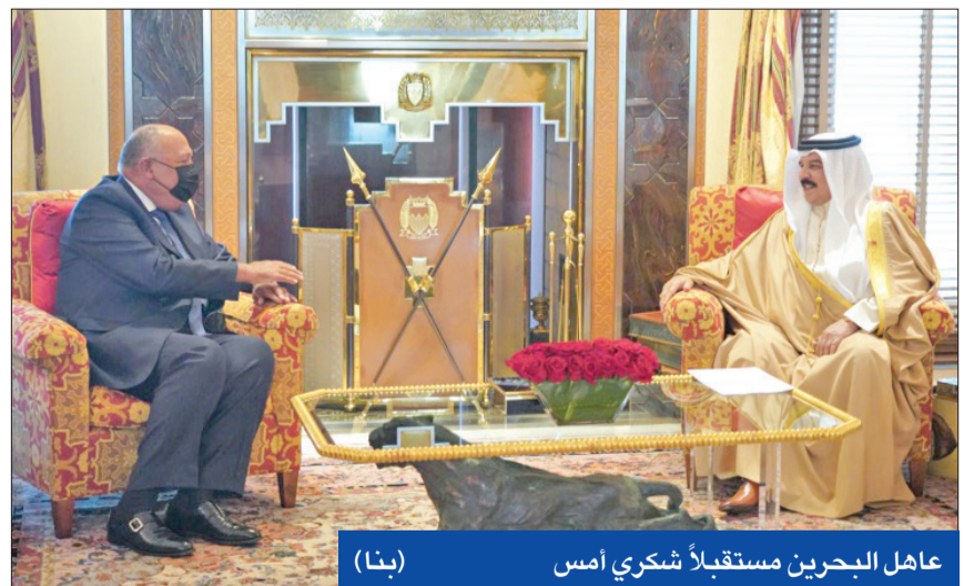
عاهل البحرين مستقبلاً شكري أمس

شكري في المنامة لتسليم رسالة السيسي • بحيرة السد العالي تستعد للفيضان