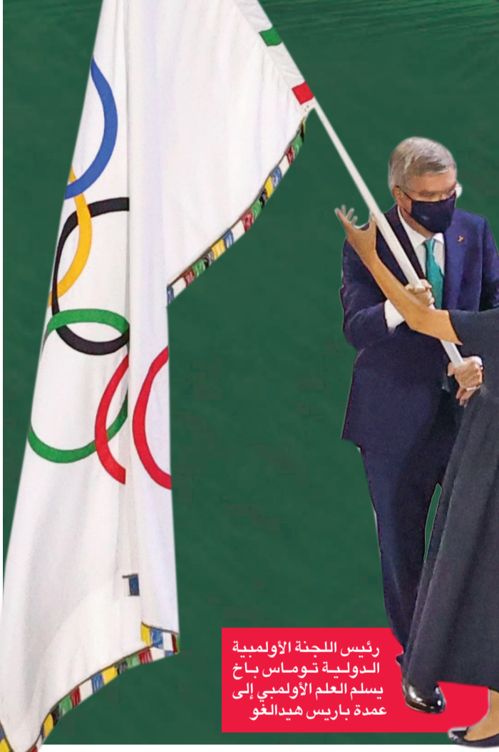
رئيس اللجنة الأولمبية الدولية توماس باخ يسلم العلم الأولمبي إلى عمدة باريس هيدالغو

مستوى توقعات أمتها، رغم نيلها شرف إيقاد المرحل الأولمبي، ومنلها الصربي نوناف ديوكوفيتش.