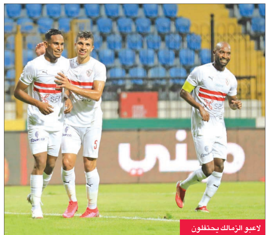
لاعبو الزمالك يحتفلون

وحافظ الأهلي على صدارة المسابقة بعدما اكتسح نظيره سيراميكاً كلوباتراً برباعية نظيفة في المواجهة المؤجلة بينهما من الجولة 23. وبلغت الأهلي سيراميكاً بهدف مبكر أحرزه ياسر إبراهيم في الدقيقة الرابعة من ضربة رأس، ثم ألغى