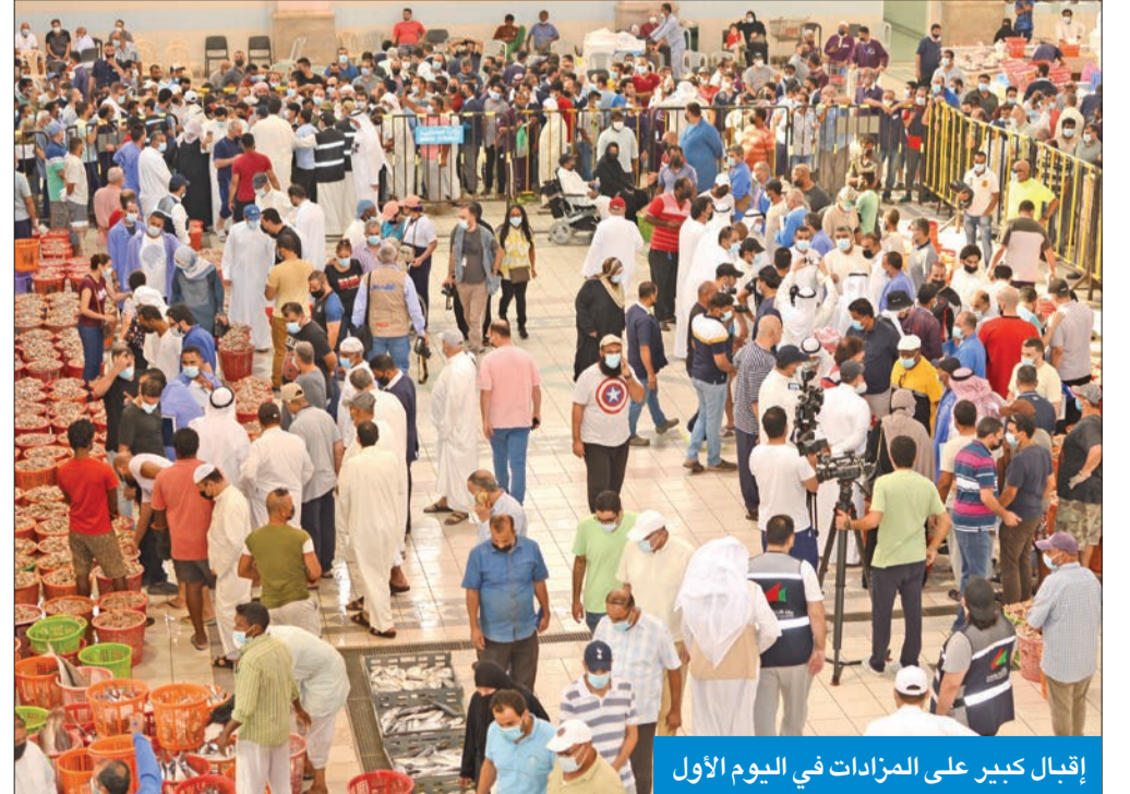
إقبال كبير على المزادات في اليوم الأول