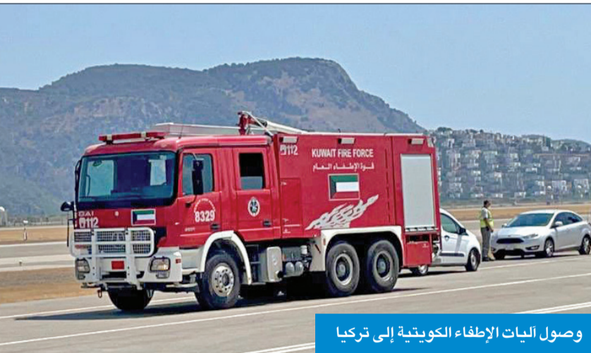
وصولليات الإطفاء الكويتية إلى تركيا

«الإطفاء»: إرسال فرقتين من 90 رجلاً و12 آلية لدعم البلدين