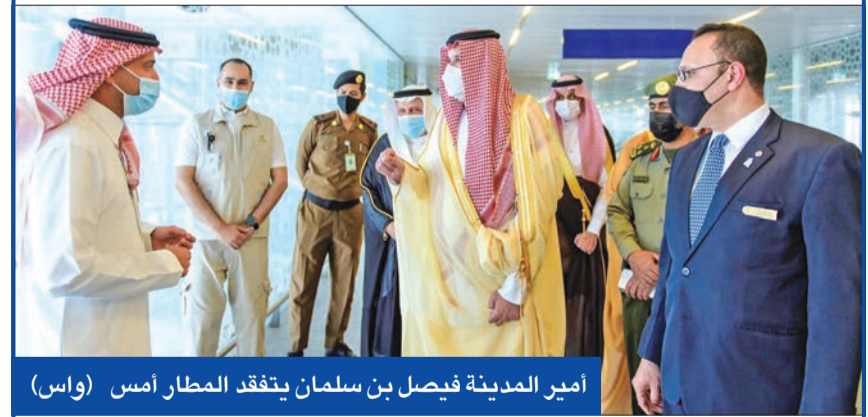
أمير المدينة فيصل بن سلمان يتفقد المطار أمس (واس)

«الحج» تبدأ استقبال طلبات العمرة للملحقين من اليوم