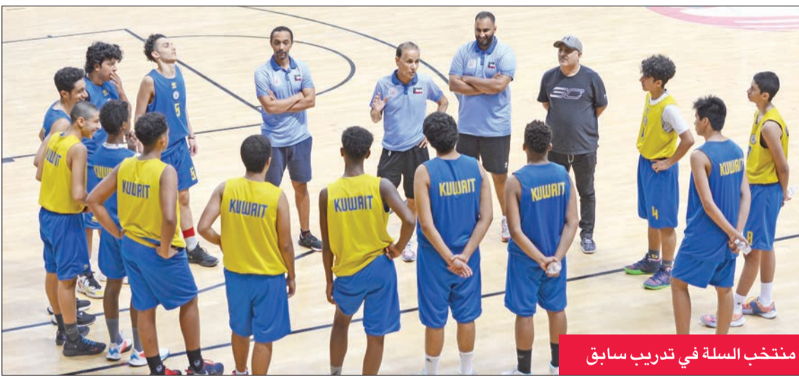
منتخب السلة في تدريب سابق

ولفت إلى أن للمدربين حساباتهم الخاصة غير أن مباريات الدور قبل النهائي تختلف اختلافاً كبيراً عن الدور التمهيدي، متوقفاً أن تحصل المفاجآت خلال الدور قبل النهائي.