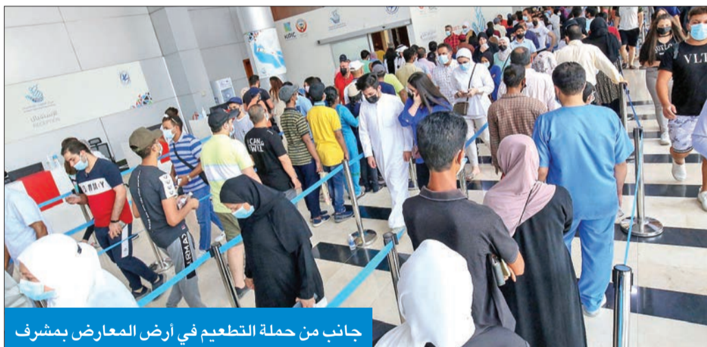
جانب من حملة التطعيم في أرض المعارض بمشرف