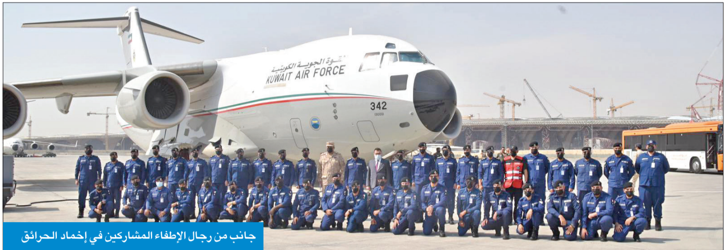
جانب من رجال الإطفاء المشاركين في إخماد الحرائق

السفارة الكويتية في أنقرة. وسيشارك الفريق الذي يضم 45 رجل إطفاء وست معدات مكافحة وإنقاذ في إطفاء الحرائق المتعددة في الغابات في تركيا من خلال خبرة قوة الإطفاء الكويتية في التعامل مع الحرائق ومكافحتها وكذلك في عمليات الإنقاذ.