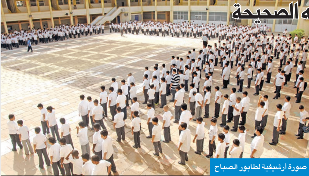
صورة أرشيفية لطابور الصباح

بينما تعمل الجهات المختصة في وزارة التربية على سرعة الانتهاء من التعديلات المطلوبة على خطتها الخاصة بعودة الدوام المدرسي منتصف سبتمبر المقبل، يترقب الميدان التربوي حسم آلية عودة الدوام، وإعلان اعتماد الخطة بشكل رسمي، لاسيما المعلمين والمعلمات الذين ينتظرون حسم هذه القرارات، للبدء في ترتيب أمورهم، ومعرفة طريقة الدوام وكيفية، والذي ينطلق في 12 سبتمبر المقبل، بحسب قرارات الوزارة.