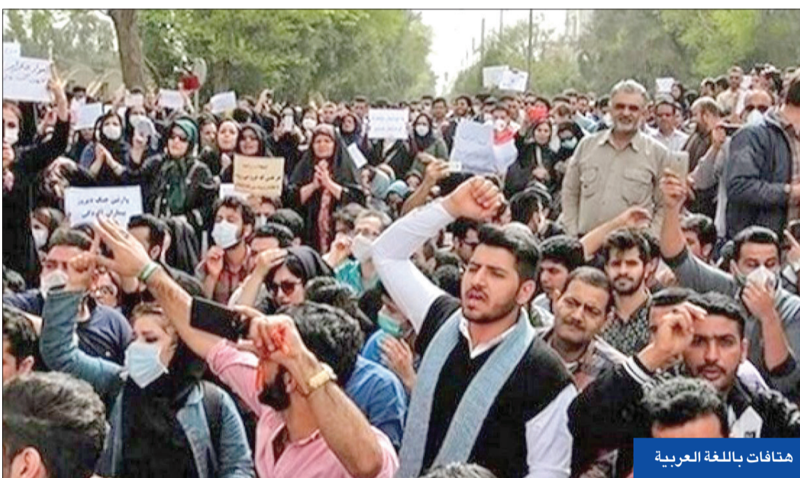
هتافات باللغة العربية

عاد الحكم العربي إلى عربستان بقيام الأسرة المشعشعية العربية في مدينة الحويزة عام 1436م مع تولي محمد بن فلاح بن هبة الله الحكم فيها. وتمتعت الدولة المشعشعية بجميع مظاهر الدولة، بعد بسط السيطرة التامة على كل الإقليم وامتلك عملتها الخاصة بها والتي كانت تسك داخل المدن الأحوازية. ولعل أهم المحطات إبان فترة حكم المشعشعيين في الأحواز تمثلت في معاهدة مراد الرابع عام 1639م بين الدولتين الفارسية والعثمانية حيث اعترفت هاتان الدولتان في المعاهدة باستقلال الدولة المشعشعية وانتهت هذه الإمارة بعد أن جهزت بريطانيا عام 1821م حملة قوية من بومباي الهند، وهاجمت مع حلفائها مقر الإمارة.