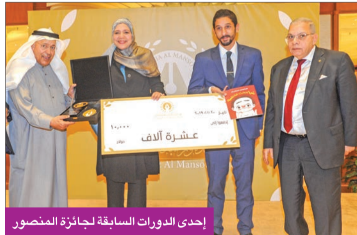
إحدى الدورات السابقة لجائزة المنصور