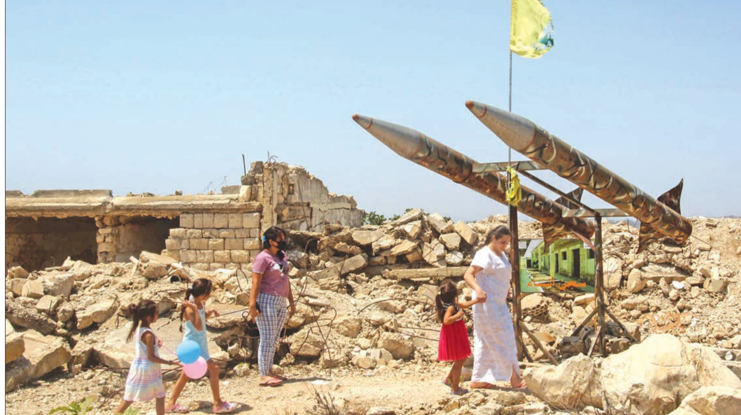
سيدة وأطفالها بمحيط انقاض مركز اعتقال تابع لـ«جيش جنوب لبنان» المنحل عند الشريط الحدودي مع إسرائيل أمس الأول

الرئيس الإيراني يعين نائباً والخلافات تؤخر حكومته • توقع أوروبي باستئناف مفاوضات فيينا في سبتمبر