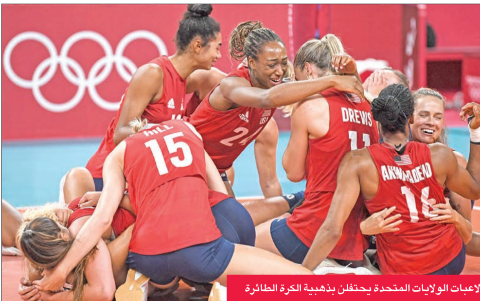
لاعبات الولايات المتحدة يحتفلن بذهبية الكرة الطائرة