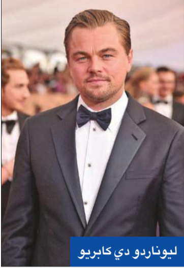
ليوناردو دي كابريو

حرص النجم العالمي ليوناردو دي كابريو، الذي يُعد من أكثر المشاهير المهتمين بالحياة البرية، على دعم السياحة البرية، خصوصاً في قارة إفريقيا، لدعم الحيوانات والمنتزهات التي تستخدم عائد تلك السياحة في تطوير وتنمية الحيوانات. وكتب دي كابريو في تعليق عبر حسابه الشخصي بدانستغرام: «توفر سياحة الحياة البرية دخلاً كبيراً للمساعدة في الحفاظ على المنتزهات في قارة إفريقيا، حيث تعيش الأنواع المعرضة للخطر مثل الفيلة والأسود ووحيد القرن والزرافات، وبعد أن تفشى فيروس كورونا في عام 2020، أغلق قطاع السياحة الدولية بأكمله في لحظة، ما كان له تأثير عميق على العديد من المجتمعات، وادي ذلك إلى إنشاء حملة PrintsForWildlife الصيف الماضي، والتي صُممت للمساعدة في جمع الأموال للمجتمعات الأكثر تضرراً».