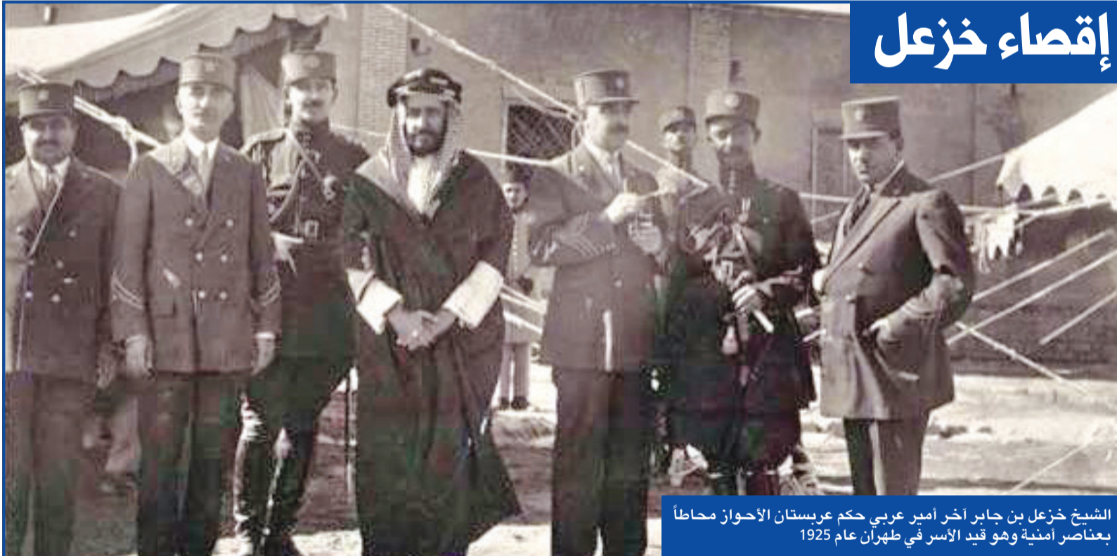
الشيخ خزعل بن جابر آخر أمير عربي حكم عربستان الأحواز محاطاً بعناصر امنية وهو قيد الأسر في طهران عام 1925

وأكثر من 80 في المئة من قيمة الصادرات في إيران، وهناك مقولة شهيرة للرئيس الإيراني الأسبق محمد خاتمي يقول فيها (إيران تحيا بخوزستان).