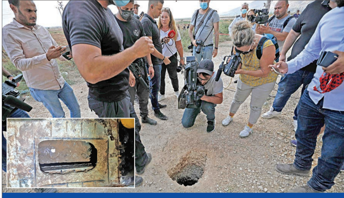
فتحة النفق الذي استخدمه الأسرى في عملية الفرار وفي الإطار صورة لمداخل النفق

وبنت وسائل إعلام إسرائيلية مقطع فيديو يظهر وصول المفتش العام للشرطة يعقوب شبتاي ووزير الأمن الداخلي عومير بارليف إلى فتحة النفق الذي هرب منه الأسرى الفلسطينيون من سجن جلبوع، للوقوف على آخر التطورات. وقال وزير الأمن الداخلي الإسرائيلي عومير بارليف، إن تخطيط عملية هرب الأسرى من سجن جلبوع كان دقيقاً، ويشبه في تلقيهم مساعدة من الخارج. وفيما ذكرت إذاعة الجيش أن السلطات ستباشر بنقل نحو 400 أسير من سجن جلبوع إلى سجون أخرى خلال الساعات المقبلة خوفاً من وجود من اتساقوا، طالبت هيئة شؤون الأسرى الفلسطينيين، المؤسسات الحقوقية والإنسانية واللجنة الدولية للصليب الأحمر، التوجه فوراً إلى سجن جلبوع والكشف عن مصير الأسرى الذين ينقلون إلى أماكن مجهولة، بعد حادث الفرار محذرة من أن تنضب