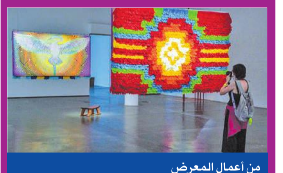
من أعمال المعرض

انطلق بينالي ساو باولو للفن المعاصر بدورته الرابعة والثلاثين السبت الماضي تحت شعار التنوع، مع فنانيين كثير من السكان الاصليين بينهم جايدر إسبيل، احتفالاً بالذكرى السنوية السبعين لانطلاق هذا الحدث الفني الكبير في البرازيل. وخلال الحدث، الذي يستمر حتى الخامس من ديسمبر المقبل، يمكن لزوار البينالي المقام في جناح في قلب متحده إيبيرابويرا، الرئة الخضراء للمدينة الكبرى الواقعة في جنوب شرق البرازيل، رؤية 1100 عمل من توقيع 91 فناً من العالم اجمع، بينهم 9 من السكان الاصليين. ويعد إرجائه العام الماضي بسبب جائحة كوفيد-19، سيكون هذا المعرض الجماعي الكبير الذي انطلق بتسخته الأولى سنة 1951، متاحاً مجاناً لكل شخص يحمل شهادة تلقيح ضد فيروس كورونا، ويقام البينالي هذه السنة تحت شعار «الدنيا غلام لكنى أغني» وهو عنوان مستوحى من بيت في قصيدة للشاعر ثياغو دي ميلو المتحدر من ولاية أماروناس شمال البرازيل.