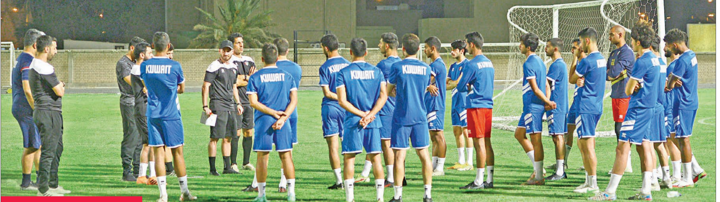
غوئزليس يوجه اللاعبين في التدريب الأخير

استعداداً لبطولة غرب آسيا وتصفيات كأس تحت 23