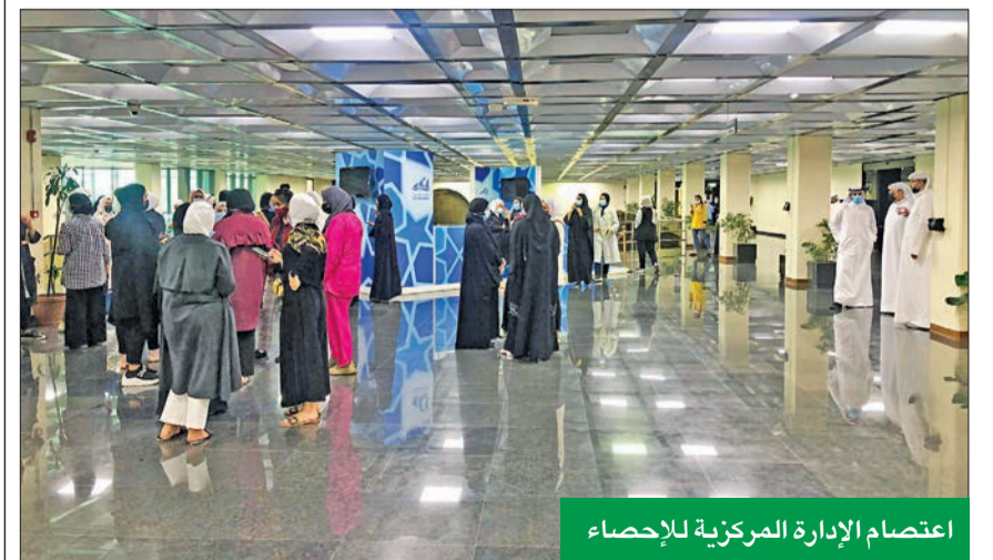
اعتصام الإدارة المركزية للإحصاء