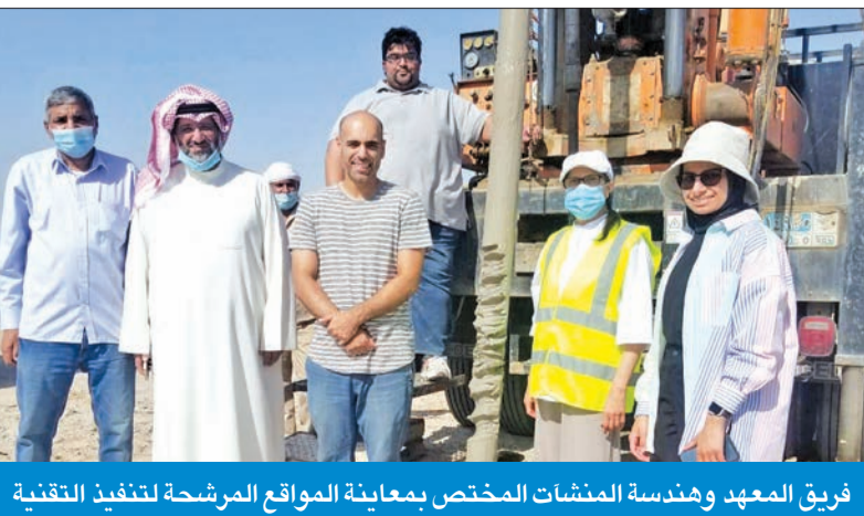
فريق المعهد وهندسة المنشآت المختص بمعاينة المواقع المرشحة لتنفيذ التقنية

الإنشائية بشتى أنواعها وما يرتبط بها من تكاليف تشغيلية قبل وبعد معالجة التربة أو ما يصاحبها من خدمات تشغيلية مكلفة قد ينتج عنها آثار بيئية ضارة. وأضاف أن تلك الزيارة تأتي بدعم من رئاسة الأركان العامة للجيش في وزارة الدفاع، ومشاركة فنية من الكوادر الهندسية التابعة لهندسة المنشآت العسكرية؛ في إطار السعي لتنفيذ مشاريع المخطط الهيكلي في جزيرة بوبيان؛ بغية دفع عجلة التنمية الاقتصادية وتحقيق أهداف التنمية المستدامة ورؤية «كويت جديدة 2035» ورفع مؤشر التنافسية العالمية للكويت