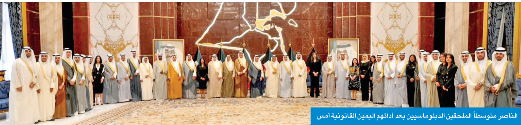
الناصر متوسطاً الملحقين الدبلوماسيين بعد أدائهم اليمين القانونية أمس

والتوفيق في خدمة الكويت وشعبها تحت ظل القيادة الحكيمة لصاحب السمو أمير البلاد الشيخ نواف الأحمد، وسمو ولي العهد الأمين الشيخ مشعل الأحمد. وتلقى وزير الخارجية مساء أمس اتصالاً هاتفياً من وزيرة خارجية السودان مريم الصادق المهدي، وتم خلال الاتصال بحث العلاقات الثنائية المثبتة التي تربط البلدين الشقيقين وعدد من الموضوعات محل الاهتمام المشترك.