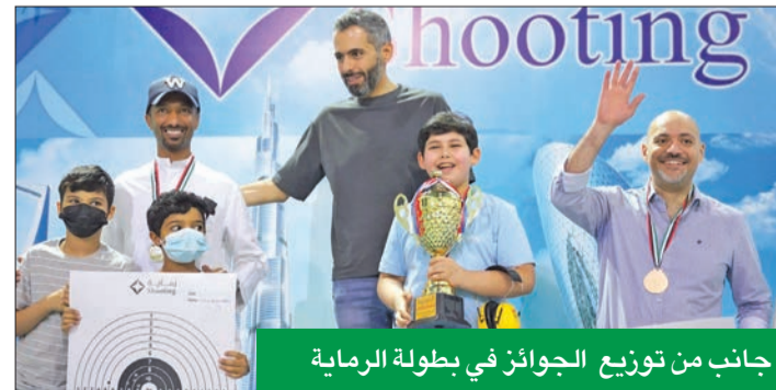
جانب من توزيع الجوائز في بطولة الرماية

المسابقة الثانية لهذا العام، بعد مسابقة بطولة «بي بي فوت» التي أقيمت في أغسطس الماضي، كما ستكون هناك مسابقات شهرية مستمرة بين الموظفين، وسيدقم بها العديد من الجوائز والمكافآت.