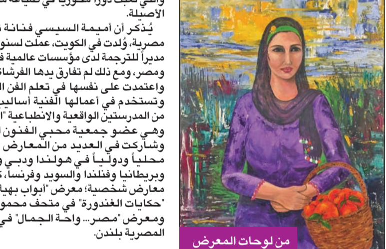
من لوحات المعرض