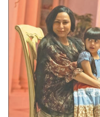
الخرجي في «سما عالية»