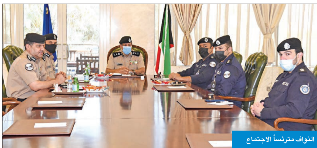
النواف مترئساً الاجتماع

ترأس اجتماعاً مع إدارة «العلاقات والإعلام» وشدد على تكثيف التوعية من المخدرات والاستهتار والقتل