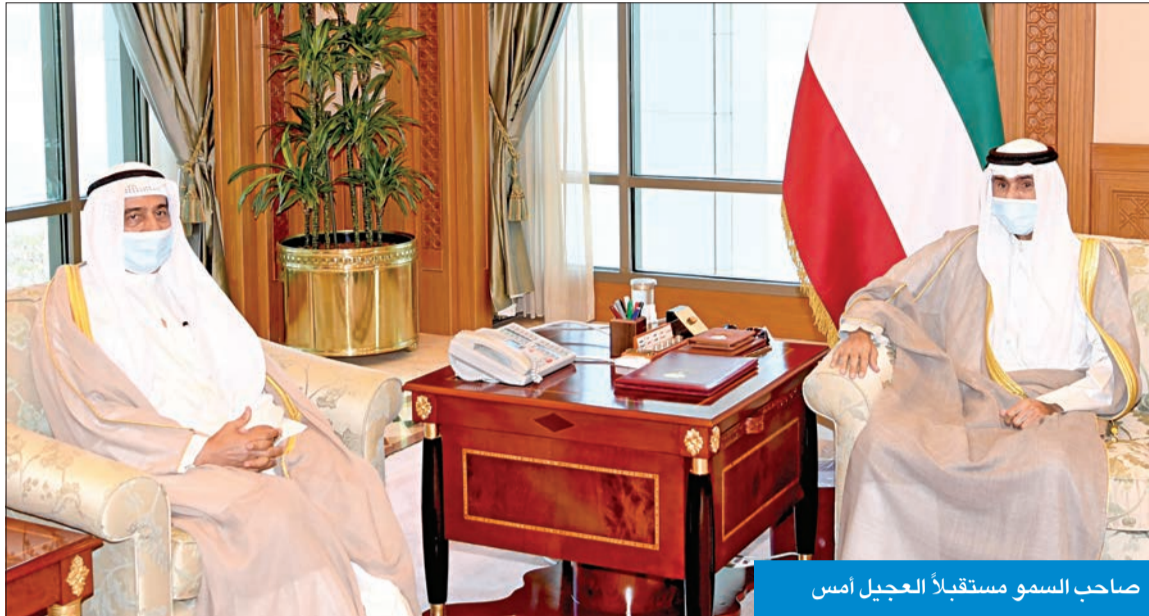
صاحب السمو مستقبلاً العجيل أمس

سموه عزى عون بوفاة رئيس المجلس الإسلامي الشيعي الأعلى