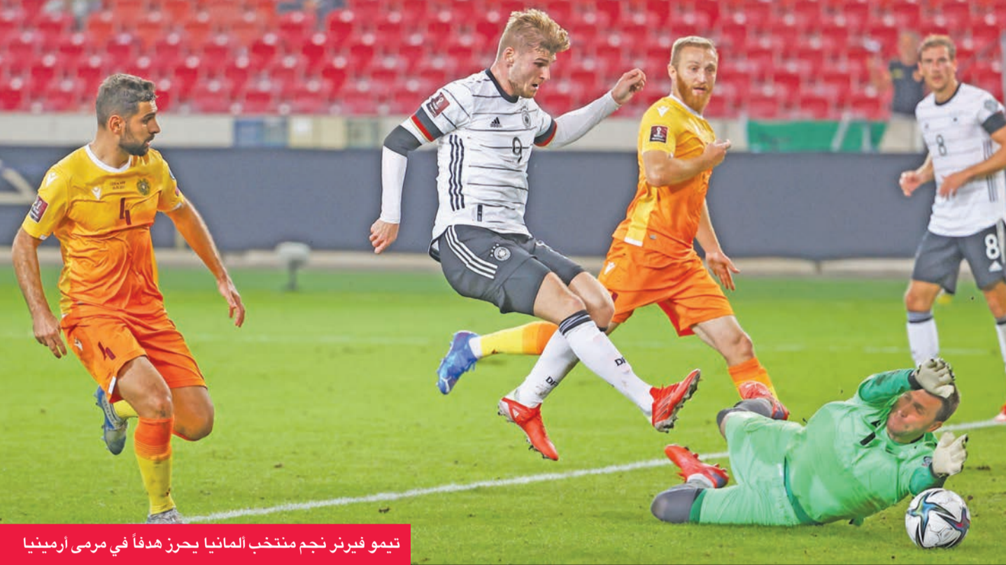
تيمو فيرنر نجم منتخب ألمانيا يحرز هدفاً في مرمى أرمينيا

من 5 مباريات، متقدماً على السويد التي تملك 9 نقاط من 3 مباريات، فيما تحتل كوسوفو المركز الثالث برصيد 4 نقاط متقدماً على اليونان الرابعة برصيد 3 نقاط، بينما تقبع جورجيا في المركز الخامس والاخير بنقطة واحدة.