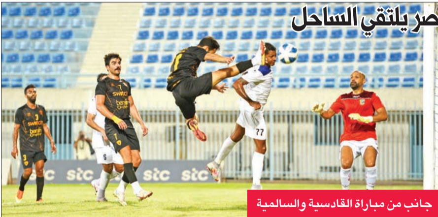
جانب من مباراة القادسية والسالمية

السماعي يواجه الفحيحيل اليوم... والنصر يلتقي الساحل