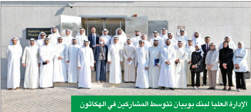
الإدارة العليا لبنك بويان تتوسط المشاركين في الهكاثون

ميدانا يسمح بتجديد وتحفيز الطاقة الإبداعية، وإظهار مواهب موظفينا، كما سنستمر في بذل كل الجهود الممكنة لتوفير فرص التطور الإبداعي واتاحتها لهم، مع تقديم الدعم والتوجيه الكافيين لكوادرننا البشرية. نعتقد أنهم قادرون على تطوير حلول مصرفية مبتكرة لعملائنا».