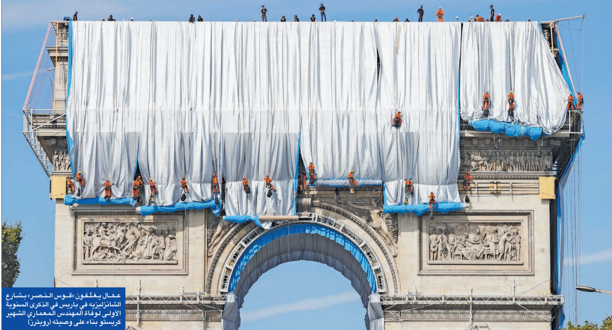
عمال يغلفون «قوس النصر» بشعار الشانزليزية في باريس في الذكرى السنوية الأولى لوفاة المهندس المعماري الشهير كريستو بناء على وصيته

الوطنية، مؤكدة «لن يذهب أي فرنسي إلى حقله في حروب ليست حروبنا». وفي ما يتعلق بالمؤسسات الأوروبية، وعدت بـ «إعادة السلطة إلى الأمم». وذكرت «سنعترف بحق كل دولة في تخليص مصلحتها الوطنية»، مؤكدة عزمها على «وضع حد للديكتاتورية التكنوقراطية المجنونة» التي تتهم المؤسسات الأوروبية بفرصها. وتطرقت المرشحتان لموضوع النساء، فأكدت هيدالغو أن انتخابات 2022 ستشكل «لقاء أول امرأة رئيسة للجمهورية مع الفرنسيات»، وأعدت بيان النساء سيحصلن «أخيرا على المساواة التامة والكاملة في الأجور كما في المسار المهني». من جهتها، تحدثت لوبن عن النساء في مواجهة انعدام الأمن، فتعهدت بتسديد العقوبات ضد المضايقات في الشارع، وبالنضال من أجل السماح للنساء بنيل حريتهن. وقالت «سنعيد فرض حرية النساء والفتيات في التنقل بدون التعرض لمضايقات أو تهديدات. في أي ساعة من النهار أو الليل، في أي حي كان».