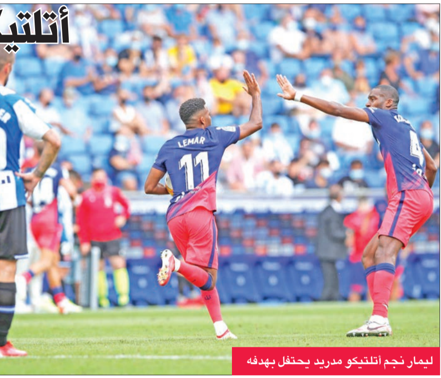
ليمار نجم أتليكو مدريد يحتفل بهدفه

ثم أخرج مهاجميه الأساسيين منتصف الشوط الثاني، واشترك بدلاً منهما البرتغالي جواو فيليكس، والبرازيلي ماتيو كوني المنقل إلى حديثاً من هرنا برلين الألماني، بعدما ساهم في فوز منتخب بلاده بالذهبية الأولمبية في طوكيو.