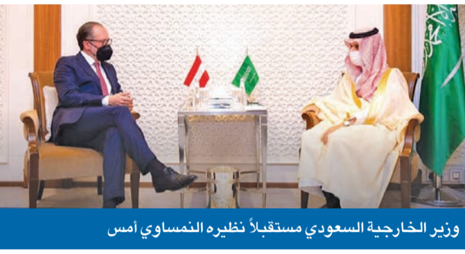
وزير الخارجية السعودي مستقبلاً نظيره النمساوي أمس

وفي وقت لم تجد لجنة حكومية أميركية أي دليل يفيد بأن المملكة مولت تنظيم «القاعدة» الإرهابي، الذي وفرت له حركة طالبان الأفغانية ملاذاً آمناً آنذاك، لم يعثر تقرير لجنة 11 سبتمبر على «أي دليل على أن الحكومة السعودية كمؤسسة، أو كبار مسؤوليها مؤلوا بشكل فردي الهجمات التي بدورها بالتنظيم». وبينما شدد خلال مؤتمر صحافي مشترك أمس مع نظيره النمساوي في الرياض، 02