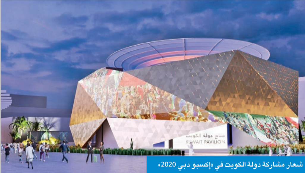
شعار مشاركة دولة الكويت في «إكسبو دبي 2020»

● تعكس الإرث الحضاري والثقافي... و250 جهة حكومية وخاصة تشارك بالمعرض ● جناحنا مستوحى من أبراج المياه ويمتد على مساحة 5500 م2 بارتفاع 24 متراً