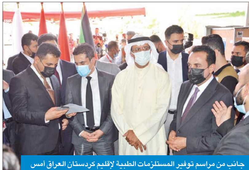
جانب من مراسم توفير المستلزمات الطبية لإقليم كردستان العراق أمس

أعلن قنصل الكويت العام في أربيل د. عمر الكندري توفير مستلزمات ومواد طبية ترزّن أكثر من 10 أطنان لمستشفيات إقليم كردستان العراق لمواجهة فيروس (كورونا). وقال الكندري لـ «كونا» أمس، إن هذه المواد تأتي ضمن حملة الكويت للشعب العراقي «الكويت بجانبكم» ومقدمة من الجمعية الكويتية للإغاثة لاحتياج هذه المرحلة الصحية، التي تمت بالعالم ترجمة لتوجيهات سمو أمير البلاد الشيخ نواف الأحمد. وعبر عن أمه أن تساهم المواد الطبية في معالجة أكبر عدد من المصابين بالجائحة، مشيراً إلى أنهم على علم بمدى حاجة الإقليم إلى تلك المساعدات وأكد المواصلة في تقديم الدعم الكويتي للشعب العراقي. بدوره، عبر وزير الصحة بإقليم كردستان العراق الدكتور سامان برزنجي في تصريح مماثل لـ «كونا» عن الشكر لدولة الكويت ومؤسساتها الإنسانية للمواصلة في تقديم الدعم لإقليم كردستان العراق. وأوضح أن هذه المساعدات التي هي عبارة عن معدات وأجهزة طبية تخصص مواد التخدير والتنفس الاصطناعي جداً ضرورية في الوقت الحالي، إذ تقوم الفرق الصحية بمواجهة فيروس «كورونا» والإصابات في تزايد مستمر.