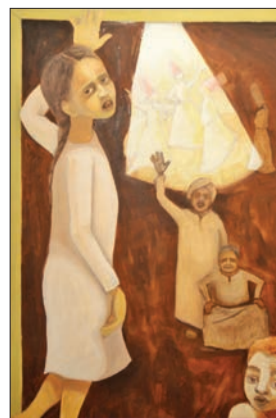
من الأعمال المعروضة

لتحويل قوانين النور إلى قوانين ظلام. كما أن "لوحات الكلام" تعبر عن اتجاه فني آخر ترصد خلاله أحاديث الأشياء ومجريات الحوار بين كل ما هو موجود على الأرض، بحيث يمكن للحيووان أو الجماد أو الزرع الأخضر أن يقول كلمة ما تنطق بها اللوحة.