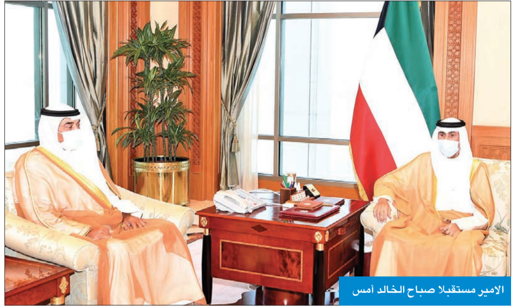
الأمير مستقبلاً صباح الخالد أمس

استقبل صاحب السمو أمير البلاد، الشيخ نواف الأحمد، بقصر السيف، صباح أمس، سمو ولي العهد الشيخ مشعل الأحمد، ونائب رئيس مجلس الوزراء سمو الشيخ خالد الجابر، ونائب رئيس مجلس الوزراء وزير العدل لشؤون تعزيز النزاهة عبدالله الرومي.