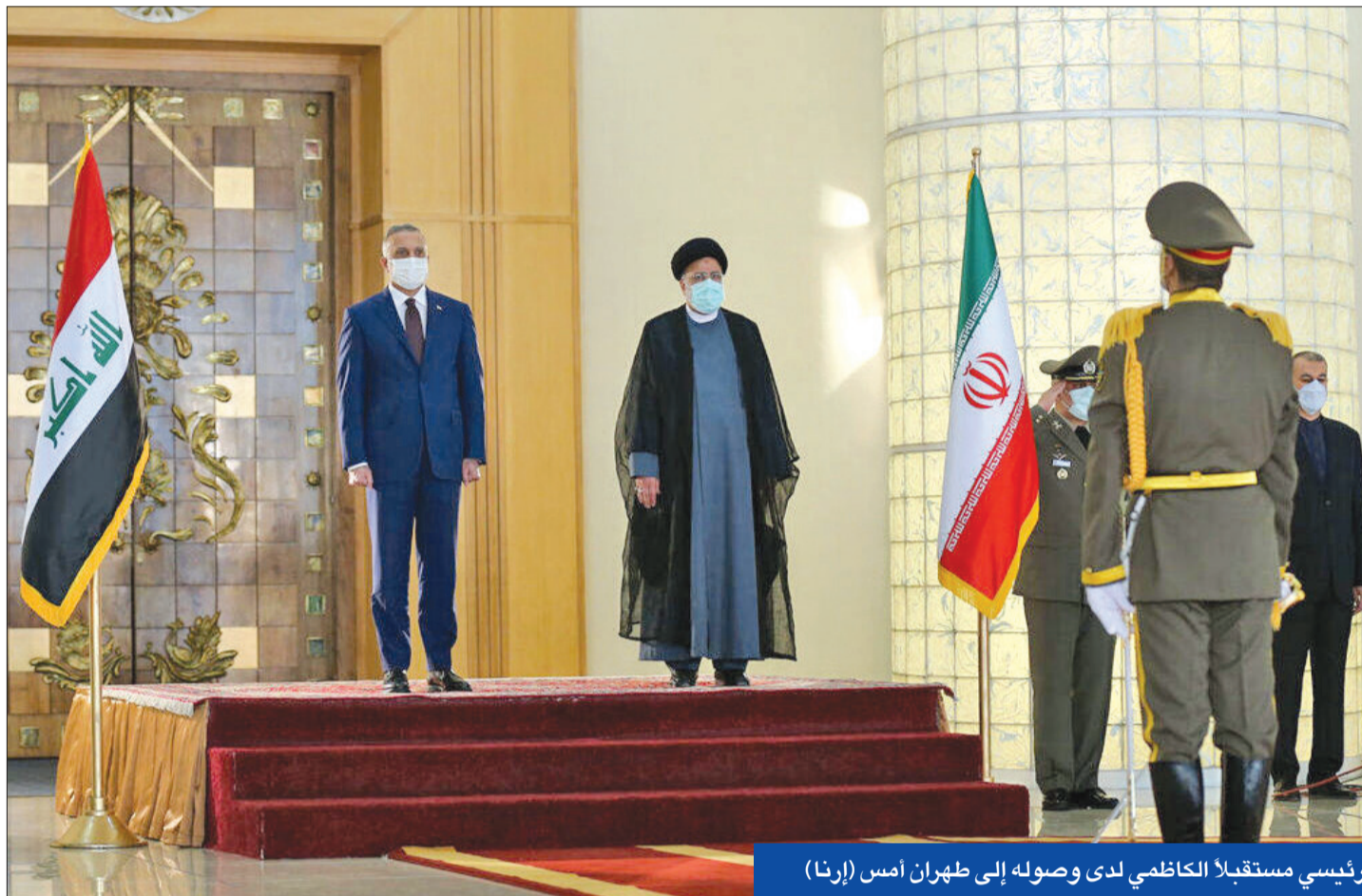
رئيسي مستقبلاً الكاظمي لدى وصوله إلى طهران أمس (إرنا)

«داعش»، لافتاً إلى أن «إيران» و«الرسالة» الشهير خلال الاستعراض الضيف العراقي حرس الشرف. وعقب مراسم الاستقبال عقد الكاظمي الوزراء مباحثات منفصلة مع المسؤولين الإيرانيين. وتناولت المباحثات العراقية الإيرانية جملة من الملفات الثنائية والإقليمية بهدف التنسيق الثنائي وتدعيم أمن المنطقة واستقرارها. وعلمت «الجريدة»، أمس الأول، من مصدر مطلع أن الكاظمي يسعى لاستكمال ما صفة بـ «صفقة إيرانية عراقية»، تمت خلف الكواليس وأثمرت عن المساهمة في تشكيل حكومة لبنان الجديدة، بهدف تسهيل عقد جولة رابعة من المباحثات بين طهران والسلام الوطني العراقي.