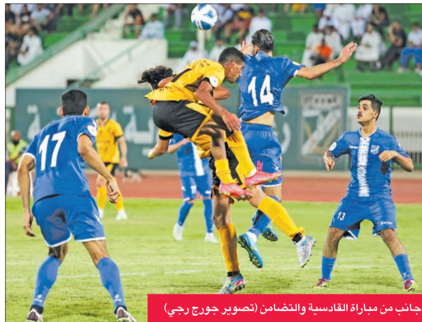
حانب من مباراة القادسية والتضامن

لحق فريقا القادسية وخيطان بركب الفرق التي حجزت بطاقات التأهل للدور ربع النهائي، ونجح خيطان في تجاوز الفحيحيل بهدفين مقابل هدف، إذ سيلتقي الفائز من مباراة الكويت والساحل. ويشق الأنفوس حقق بهدف من دون رد، سجله المحترف الجامايكي روماريو عند الدقيقة 116، ليضرب موعداً مع بركان في ربع نهائي البطولة.