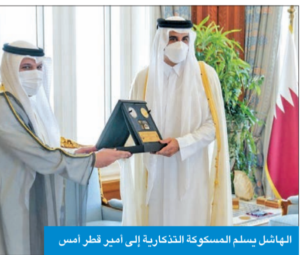
الهاشل يسلم المسكوكة التذكارية إلى أمير قطر أمس

استقبل أمير دولة قطر، الشيخ تميم بن حمد آل ثاني، محافظ بنك الكويت المركزي الدكتور محمد الهاشل، حيث نقل له تحيات صاحب السمو أمير البلاد الشيخ نواف الأحمد، وسمو ولي العهد الشيخ مشعل الأحمد، وندواتها الشقيقة وشعبها المزيد من التقدم والأزدهار، كما حمله أمير قطر تحياته لصاحب السمو أمير البلاد، وسمو ولي العهد، وتمنياته لدولة الكويت وشعبها بمزيد من التطور والنماء.