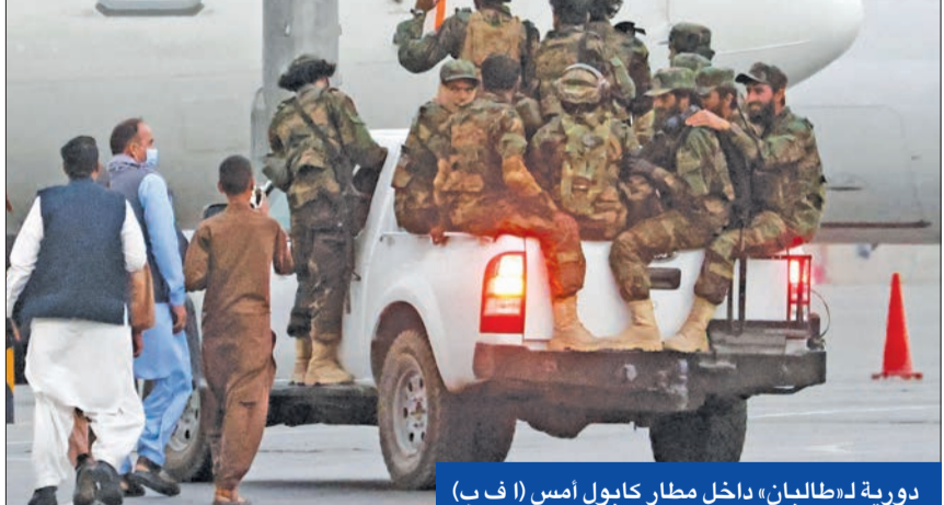
دورية لـ «طالبان» داخل مطار كابول أمس

ضمن الفصل بين الذكور والاناث في قاعات الدراسة. وأشار إلى أن الحركة «تريد تعيين مدرسات للطالبات، ولكن إذا كان ذلك غير ممكن فسيسمح للرجال بالتدريس للطالبات، طالما كانت الفصول تلزم بقواعد الشريعة، كما سيكون لزاما ارتداء زي موحد جديد». نقل مليارين من ناحية أخرى، ذكرت صحيفة «ول ستريت جورنال»، نقلاً عن مصادر مطلعة، أن الولايات المتحدة وأوزبكستان توصلتا إلى اتفاق لنقل مجموعة من طياري القوات الجوية الأفغانية وأقاربهم في نهاية صربيات جوية ضد الحركة. ولا يزال مصير الطائرات الـ 46 التي هبطت في مطار «ترميز»