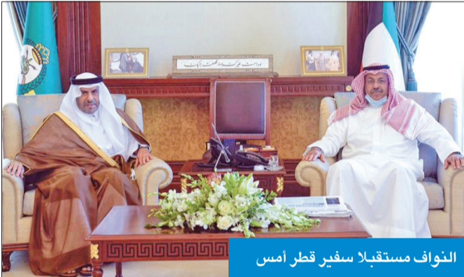
النواف مستقبلاً سفير قطر أمس

ورحب النواف بالسفير القطري، وبحث معه الموضوعات ذات الاهتمام المشترك، متمنياً له التوفيق والنجاح في مهامه الدبلوماسية.