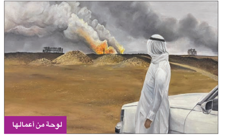
لوحة من أعمالها