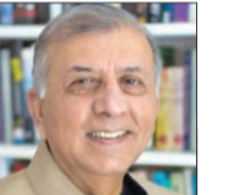
شجاع نواز *

الواقع يعوق رؤية عمران خان لبناء «باكستان الجديدة»