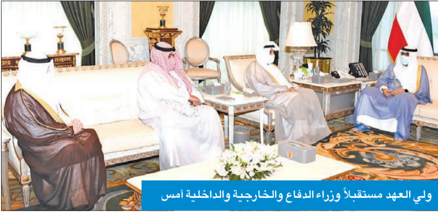
ولي العهد مستقبلاً وزراء الدفاع والخارجية والداخلية أمس

استقبل سمو ولي العهد، الشيخ مشعل الأحمد، بقصر السيف، صباح أمس، رئيس مجلس الوزراء سمو الشيخ خالد الجابر، ونائب رئيس مجلس الوزراء وزير العدل لشؤون تعزيز النزاهة عبدالله الرومي.