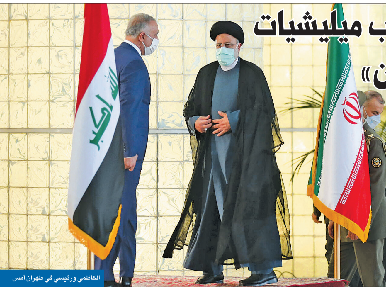
الكاظمي ورئيسي في طهران أمس

أطلقت أمس نسخة تجريبية من المرحلة الأولى للتطبيق الحكومي الموحد للخدمات الإلكترونية «سهل»، عبر المتاجر الرقمية للهواتف الذكية، تمهيداً لإطلاقه الرسمي بعد غد. وصرحت وزيرة الأشغال العامة وزيرة الدولة لشؤون الاتصالات وتكنولوجيا المعلومات د. رنا الفارس، بأن إطلاق هذه النسخة يهدف إلى 03