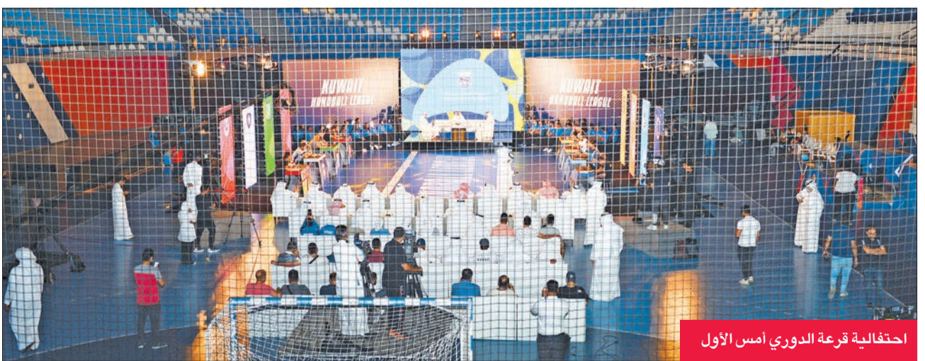
احتفالية قرعة الدوري أمس الأول

من جانبه شكر أمين سر اتحاد اليد قائد العدواني الحضور، وقال إن الاتحاد "يعمل وفق استراتيجيات متكاملة لتطوير اللعبة بشكل احترافي هدفها رفع مستوى الدوري المحلي وقيمتها السوقية، مبيحاً أن الاتحاد تعاقد مع شركة متخصصة في الجانب الرياضي والإعلامي، كذلك نعمل على تطوير العمل الإداري في الاتحاد، ولدينا خطة طويلة الأجل على مدار 4 سنوات للمنتخبات الوطنية".