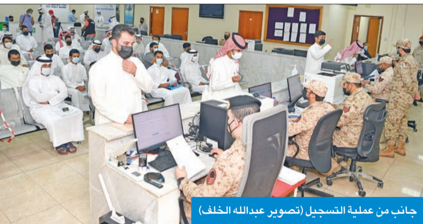
جانب من عملية التسجيل

العاشرة من صباح أمس، بدوره، قال المقدم فامر العتيبي من مديرية التعبئة العامة إن التسجيل في المرحلة الأولى يكون عن طريق الموقع الإلكتروني للهيئة، وبعدها يتم إرسال رسالة نصية لاستقبال المعاملة، ثم يجري الفحص الطبي، ثم تكون هناك مقابلة نهائية مع الملحقين، وبعدها يتم التحاقهم بالخدمة.