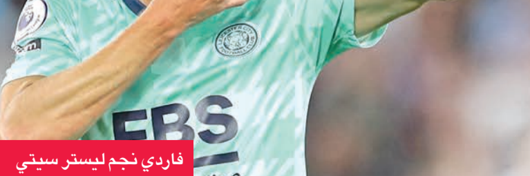
فاردني نجم ليستر سيتي

وفي المجموعة الثانية، يستضيف أندرهوفن الهولندي الذي خرج أيضاً من تصفيات دوري أبطال أوروبا ريال سوسيداد الإسباني، فيما يستضيف ضمن المجموعة ذاتها موناكو الفرنسي الذي فشل في حجز مقعده لدور المجموعات بدوري الأبطال شتورم غراتس النمساوي.