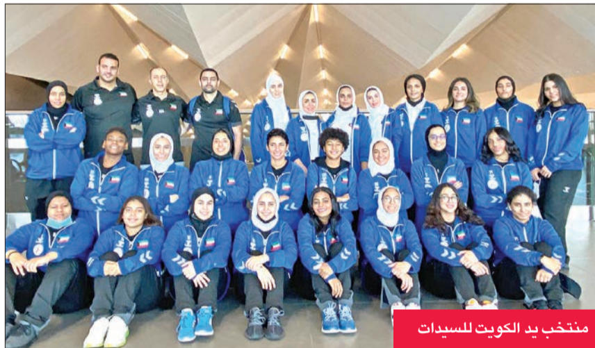
منتخب يد الكويت للسيدات

كوريا الجنوبية على منتخب أوزبكستان بنتيجة 4-19، كما تغلب منتخب كازاخستان على منافسه السنغافوري بنتيجة 3-18. وبذلك تصدرت كوريا فريق مجموعتها الأولى بفارق الأهداف عن كازاخستان، ولكل منهما نقطتان، بينما ظل منتخباً أوزبكستان وسنغافورة بدون رصيد.