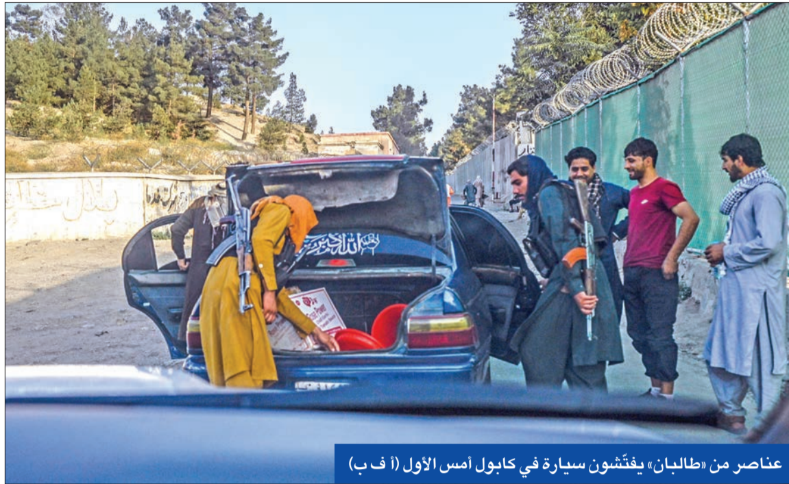
عناصر من «طالبان» يفتشون سيارة في كابل أمس الأول

● لافروف: موسكو لم تفرض أي شروط على الحركة ● رحلات جوية بين طهران وكابل