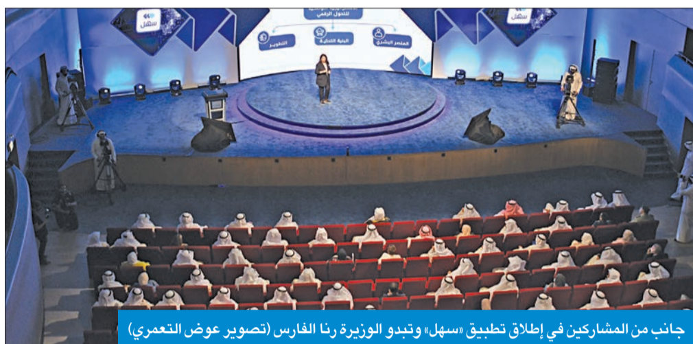
جانب من المشاركين في إطلاق تطبيق «سهل» وتبدو الوزيرة رنا الفارس

أكد نائب رئيس مجلس الوزراء وزير الدفاع، الشيخ حمد الجابر، أنه مع تحسن الوضع الصحي، أصبح لزاماً على قياديي الجهات الحكومية الدفع بالاتجاه نحو التحول الرقمي، معتبراً أنه لا بد من مواجهة بعض المعوقات، وأهمها القضاء على البيروقراطية.