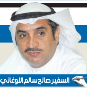
السفير صالح سالم اللوغاتبي