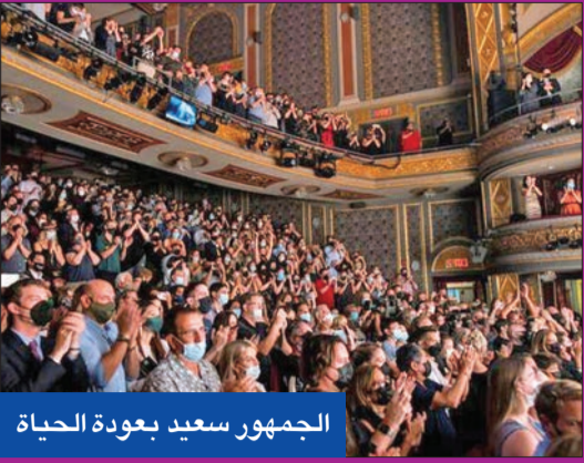
الجمهور سعيد بعودة الحياة

بدأت عروض المسرحيات الموسيقية "هاميلتون" و"الأسد الملك" (ليون كينج) و"التشهير" (ويكيد) و"شيكاغو"، أمام الجماهير، التي رحبت بالدموع والتصفيق الحار بعودة الحياة لمسارح برودواي، التي أغلقت أبوابها عندما انتشر الوباء في منتصف مارس 2020.