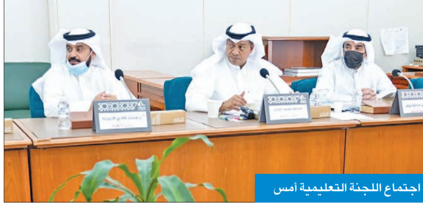
اجتماع اللجنة التعليمية أمس

الأسبوع المقبل إعلان قبول المفصولين بدرجة البكالوريوس لانخفاض معدلاتهم... بشرط