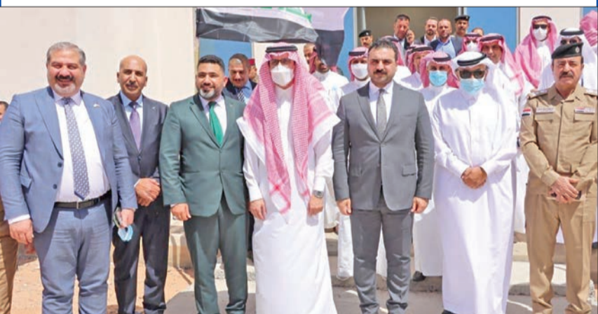
لقطة جماعية قبيل الاجتماع السعودي-العراقي بمنفذ «عرعر» أمس

الكويت تشارك بمؤتمر لاسترداد الأموال العراقية المنهوبة