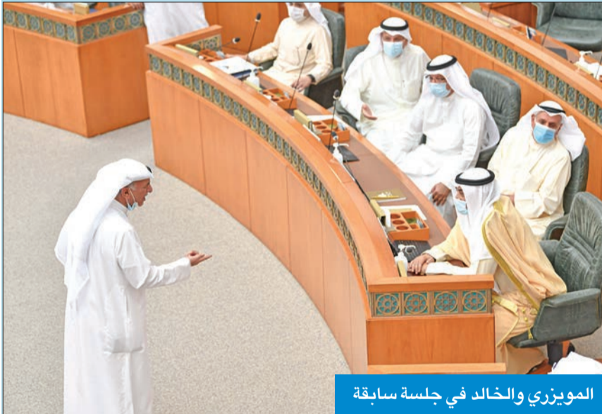
المويزري والخالد في جلسة سابقة

وجه النائب شعيب المويزري سؤالاً برلمانياً إلى رئيس مجلس الوزراء سمو الشيخ صباح الخالد، عن القرارات الصادرة من مجلس الوزراء المتعلقة بالتطعيم ضد فيروس كورونا المستجد. وقال المويزري، في سؤاله، «صدرت عدة قرارات من مجلس الوزراء ميزت بين المواطنين وقسمتهم بين مطعم وغير مطعم، ومنعت غير المطعمين من السفر ومن دخول بعض المصالح العامة والخاصة، وهذا مخالف لنصوص مواد الدستور، فما أسباب إصدار مثل هذه القرارات، على الرغم من علمكم المؤكد بان مواد الدستور تسمو على جميع القوانين، ومنها القانون رقم (8) لسنة 1969؟». وتسأل: «هل قام وزير الصحة أثناء اجتماعات مجلس الوزراء، بصفته الوزير المختص، بإبلاغكم بأن القرارات المطروحة للنقاش أثناء الاجتماعات المتعلقة بالتطعيم مخالفة للمبادئ الأساسية للقانون المذكور، وخصوصاً المواد 10 و27 و30، قبل صدور قراراتكم المتعلقة بالتطعيم؟»