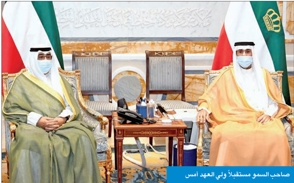
صاحب السمو مستقبلاً ولي العهد أمس

استقبل سمو أمير البلاد الشيخ نواف الأحمد، بقصر بيان صباح أمس، سمو ولي العهد الشيخ مشعل الأحمد. واستقبل سموه، رئيس مجلس الوزراء سمو الشيخ صباح الخالد. كما استقبل سمو ولي العهد الشيخ مشعل الأحمد، بقصر بيان صباح أمس، رئيس مجلس الوزراء سمو الشيخ صباح الخالد.