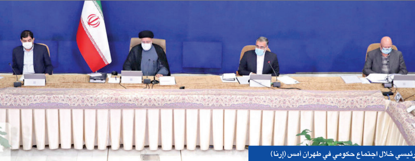
رئيسي خلال اجتماع حكومي في طهران أمس

واشنطن و«الأوروبي» يستعجلان عودة طهران لمفاوضات فيينا والمحادثات قد تستأنف خلال 3 أسابيع