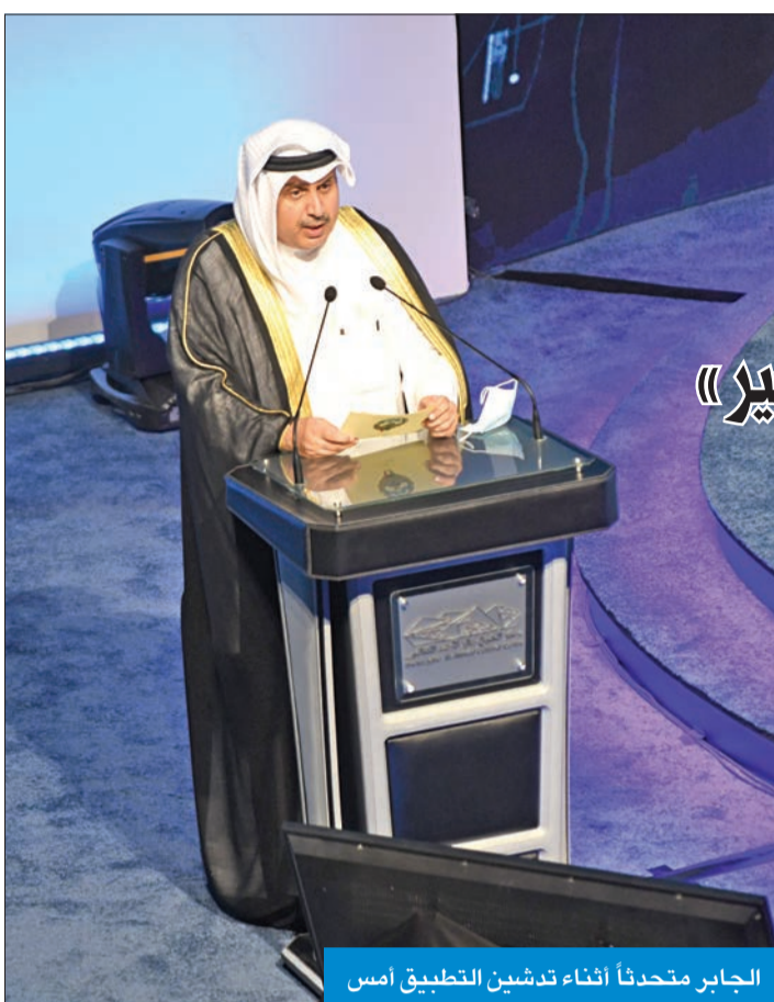
الجابر متحدثاً أثناء تدشين التطبيق أمس