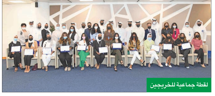
لقطة جماعية للخريجين

أجل ضمان الانسجام بين فرق العمل والمساهمة في نجاح البنك بشكل عام، معربة عن فخر ومولفينا بالمساهمة في تعزيزها والحفاظ عليها، ونسعى من خلال برامجنا التدريبية إلى تمكين الموظفين الجدد من اكتساب المهارات العملية المطلوبة، وترسيخ المبادئ والقيم التي نتجناها والتي تساهم في الحفاظ على نجاح البنك، وبنار الخريجين الجدد وننتقل إلى انضمامهم لرحلة تطور ونمو برقان وساهمهم في تحقيق نتائج رائعة.