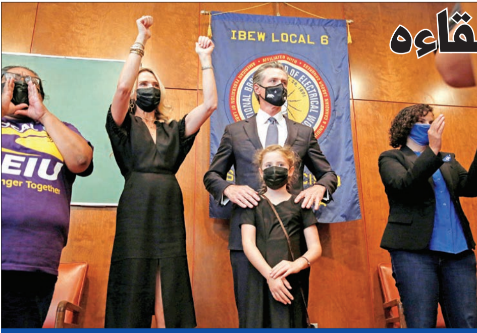
نيوسوم مع زوجته وابنتهما في سان فرانسيسكو أمس الأول

ترامب: المزاعم عن نيتي مهاجمة بكين «سخيفة»