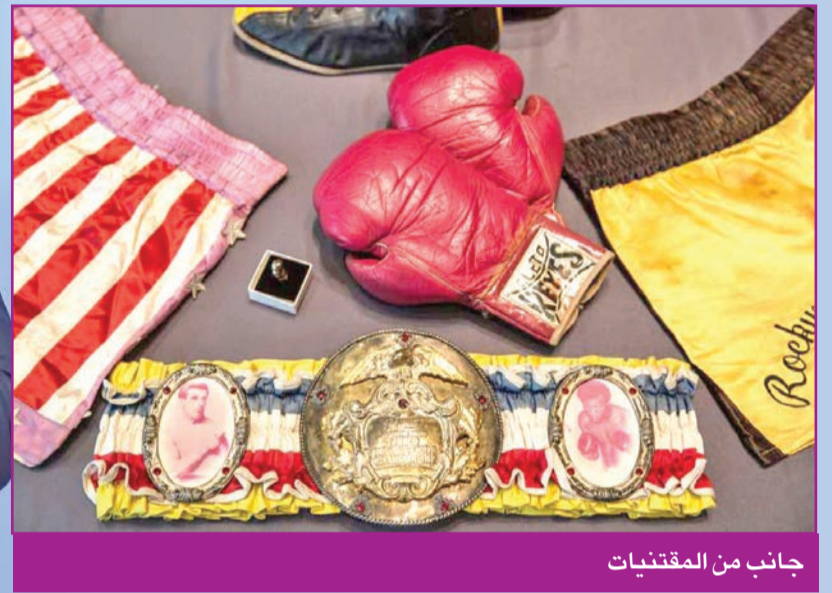
جانب من المقتنيات

وُلد ستالون في نيويورك عام 1946، ونال شهرة واسعة بسبب فيلم الملاكمة "روكي" الحائز جائزة الأوسكار عام 1976، وسرعان ما أصبح أحد أكبر نجوم أفلام الحركة في هوليوود.