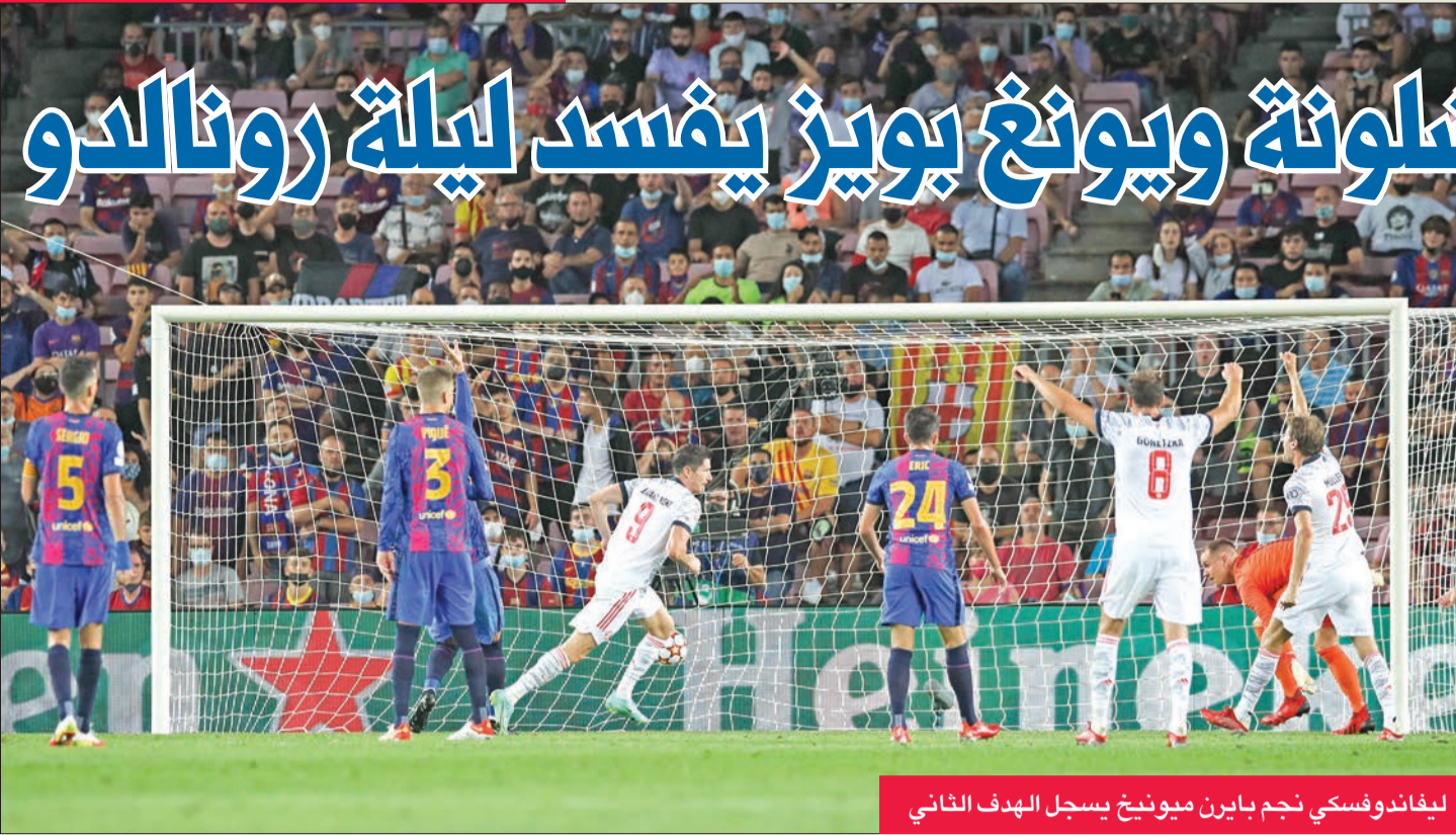
ليفاندوفسكي نجم بايرن ميونخ يسجل الهدف الثاني

متأخراً في المركز 15 من الدوري الإيطالي بعد تعادل وخسارتين في الجولات الثلاث الأولى كان آخرها خسارة أمام نابولي بنتيجة 2-1 السبت الماضي.