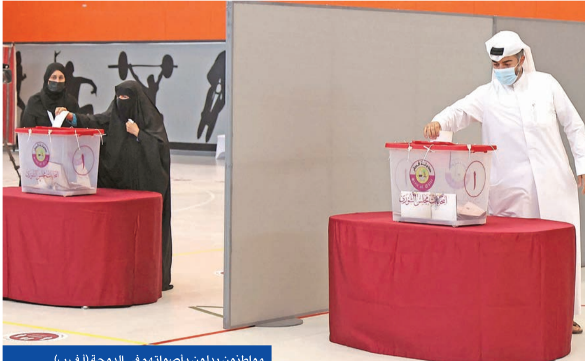
مواطنون يدلون بأصواتهم في الدوحة