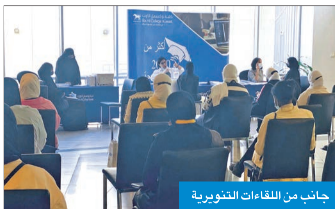
جانب من اللقاءات التوعوية

استقبلت كلية بوكسهل الكويت للبيئات طالباتها المستجدات للفصل الدراسي الثاني 2020-2021 من خلال لقاءات توعوية عدة على مدار أسبوع، تعرفت الطالبات خلالها على طبيعة الدراسة بالكلية والتخصصات والبرامج التي تقدمها، واللائح التي يتحتم عليهم الإلمام بها خلال فترة الدراسة، كما أتاحت للطالبات فرصة الحصول على كل المعلومات التي ترشدهن لتحقيق مسيرة تعليمية ناجحة.