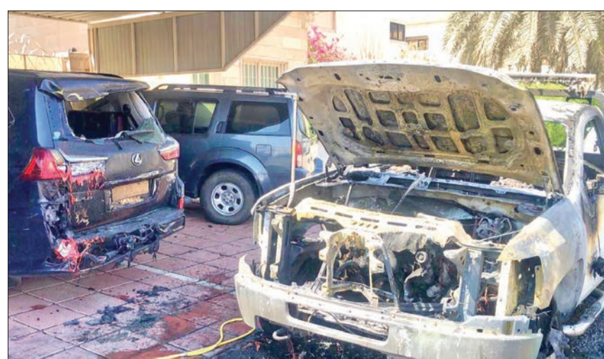
آثار الحريق في حادث الجابرية