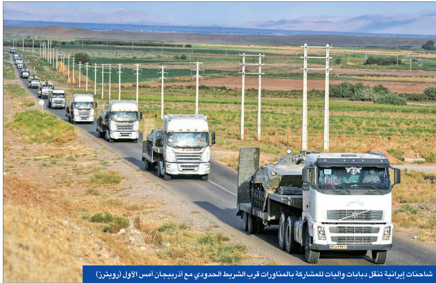
شاحنات إيرانية تنقل دبابات وآليات للمشاركة بالمانورات قرب الشريط الحدودي مع أذربيجان أمس الأول

مسؤولون إيرانيون: السفير في أذربيجان متساهل لـ «أسباب قومية» • نواب يهددون بقتل عليف