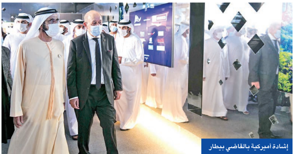
إشادة أميركية بالقاضي بيطار

بليكن إلى باريس لإجراء محادثات لكن حل «أزمة الغواصات» يحتاج وقتاً