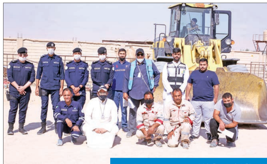
اللجنة الخماسية خلال مدهاتها حيازات الهجن