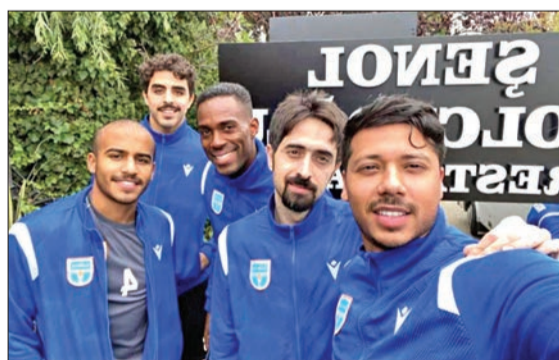
لاعب كاظمة خلال المعسكر التركي

تجريبية قوية مع فرق تركية من الصف الأول.