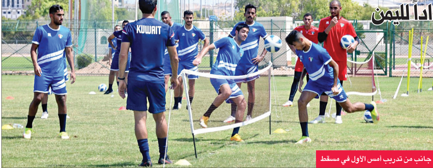
جانب من تدريب أمس الأول في مسقط