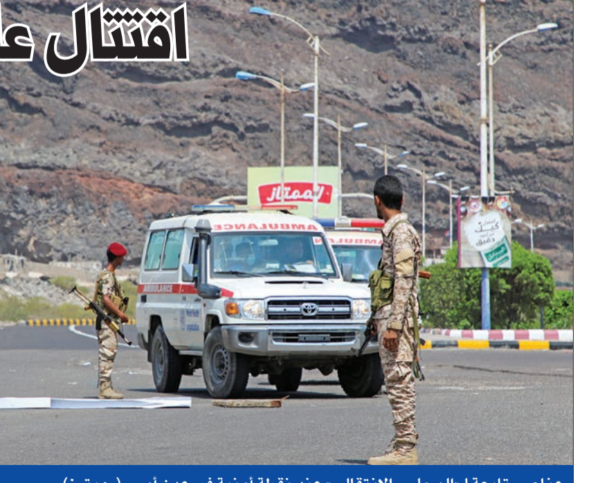
عناصر تابعة لـ «المجلس الانتقالي» عند نقطة أمنية في عدن أمس

سقط 4 قتلى و8 جرحى في مواجهات عسكرية اندلعت، أمس، في كريتر بالعاصمة اليمنية المؤقتة عدن، بين قوتين عسكريتين، واحدة تتبع المجلس الانتقالي الجنوبي، وأخرى للقيادي الجنوبي إمام النوبي وكلاهما مدعوم من «تحالف دعم الشرعية» بقيادة السعودية. وتفجرت اشتباكات مسلحة في عدة أحياء بمنطقة كريتر، القريبة من قصر معاشيق الرئيسي، مقر الحكومة النوبي المعترف بها دولياً، غداة محاصرة عناصر موالية للنوبي مركزاً للشرطة تديره قوات «المجلس الانتقالي»، عقب قيام قوات الأخير بحملة اعتقالات على خلفية