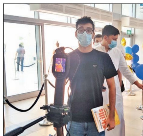
اليوم الدراسي الأول لطلبة «العربية المفتوحة»

التكنولوجيا المختلفة، بما يتفق مع خريطة الطريق التي صاغها مؤسس الجامعة الراحل الأمير طلال بن عبدالعزيز آل سعود، ليتابع مسيرتها رئيس مجلس أمناء الجامعة الأمير عبدالعزيز بن طلال آل سعود. وقال مساعد مدير الجامعة للشؤون الأكاديمية د. محمد السيد «تتواجد لمتابعة سير العملية التعليمية، والتي لمسنا الالتزام التام من أعضاء الهيئة التدريسية، وحرصهم على التواجد والالتزام في العودة الآمنة مع الطلبة الذين التزموا أيضاً مشكورين بكل التعليمات والإشتراطات التي تم تعميمها عليهم».