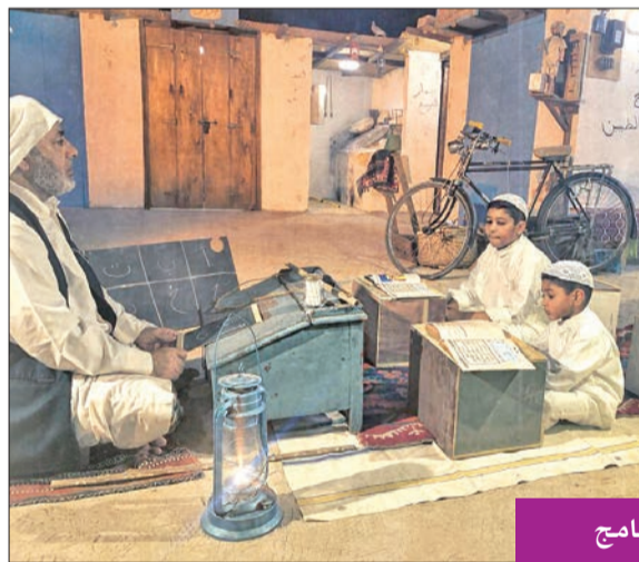
من أجواء البرنامج

كانت موجودة حينها، وعلى سبيل المثال تحدثنا عن تجهيز الأعراس سابقاً، وأيضاً تحدثنا عن المطبخ الكويتي، ورحلات الغوص ودور المرأة في الماضي، وطرق الصيد وغيرها من الأمور. ولغيت إلى أن البرنامج يعرض كل خميس في الساعة 8.30 مساءً على تلفزيون دولة الكويت وقناة "العربي". وأكد العوض أهمية التراث الذي يعد إحدى ركائز الهوية الوطنية، وأن الهدف من البرنامج هو تعريف الجيل الحالي بالعادات والتقاليد التي تمسك بالعادات والتقاليد الأصيلة، خصوصاً أن البرنامج يتضمن تنوعاً في العرود يجب أن يعرفها كل كويتي ومهتم بالتراث.