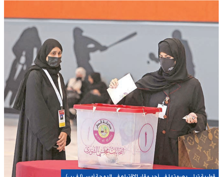
قطرية تدلي بصوتها في أحد مقر الاقتراع في الدوحة أمس

الشعب والحكومة. وكتب الفنان الغنائي القطري فهد الكبيسي: «شاركت اليوم وطني الحبيب عرسه الانتخابي الكبير، وسعيد بالتنظيم الجيد وسرعة الإجراءات، كل التوفيق لكل المرشحين، وأدام الله على قطر الخير والتقدم والأزدهار».