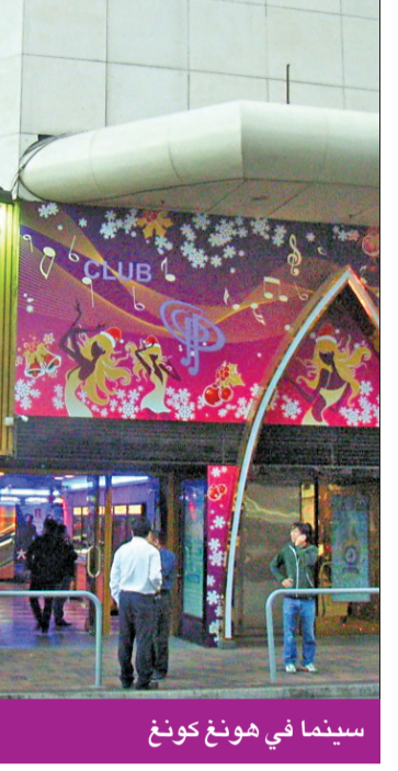
سينما في هونغ كونغ