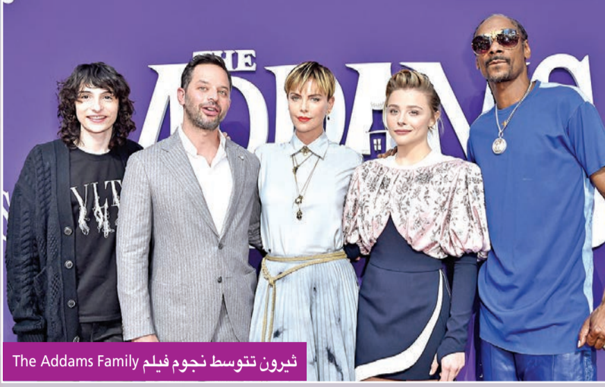
ثيرون تتوسط نجوم فيلم The Addams Family

تصدرت أعمال الرعب إيرادات السينما الأميركية لهذا الأسبوع، ومنها فيلمًا The Addams Family والذان احتلا المركزين الأول والثاني، في مقابل تراجع فيلم الحركة والإثارة "Shang-Chi and the Legend of the Ten Rings" الذي تصدر الإيرادات باكتساح خلال الأسابيع الأخيرة. واستطاع فيلم الحركة والمغامرة والخيال العلمي الجديد بسلسلة Venom، والذي يأتي بعنوان Let There Be Carnage تصدر إيرادات السينما في أميركا الشمالية في عطلة نهاية الأسبوع مسجلاً 90 مليوناً و100 ألف دولار. والفيلم من بطولة توم هاردي، وميشيل وليامز، ووودي هارلسون، وجيني سليت، وريز أحمد، ومارسيليا براجيو، وريد سكوت، وميشيل لي، وسكوت هينز، وماك براندت، وإخراج روبن فلايشر، وتأليف مجموعة متنوعة من الشخصيات، وهم: كيلي مارسيل، وسكوت روزنبرغ، وتود مكفارلين، وجيف بينكنر، وديفيد ميشليني. وجاء فيلم الرسوم المتحركة الجديد "The Addams Family 2" في المركز الثاني بإيرادات بلغت 18 مليوناً و7000 دولار. وتصدى لبطولة الفيلم النجمة العالمية تشارلينز ثيرون إلى جانب نجوم هوليوود أوسكار إسحق وكولي غرايس موريتز ونيك كرول والمغني سنوب دوغ، وفين وولفهارد، وبيت ميدلر، والسيسي فيشر واليسون جاني. ويأتي The Addams Family كفيلم رسوم متحركة ثلاثي الأبعاد، به كوميديا رعب وروح دعابة سوداء، على أساس العمل الذي يحمل نفس الاسم، وتم إنشاؤه بواسطة تشارلز آدامز، ومن إخراج كونراد فيرون وجريج تيرنان، وتم عرض الجزء الأول في الولايات المتحدة في 11 أكتوبر 2019. وفي المقابل تراجع فيلم المغامرات والحركة