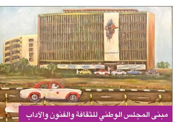
مبنى المجلس الوطني للثقافة والفنون والآداب