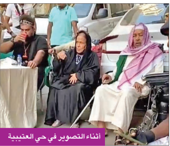
أثناء التصوير في حي العتيبة

انطلقت عملية تصوير مسلسل «بتوقيت مكة» في حي العتيبة بمدينة مكة المكرمة في المملكة العربية السعودية، ويضم العمل نجوماً كباراً من الطراز الرفيع، حيث استطاعت الشركة المنتجة