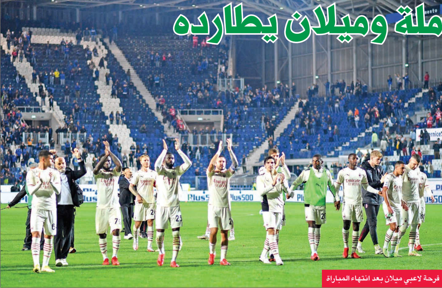
فرحة لاعبي ميلان بعد انتهاء المباراة

حقق نابولي المتصدر انتصاراً صعباً على فيورنتينا، بينما واصل ميلان ملاحقة نابولي بفوزه على أتالانتا، أمس الأول، في المرحلة السابعة من الدوري الإيطالي لكرة القدم.