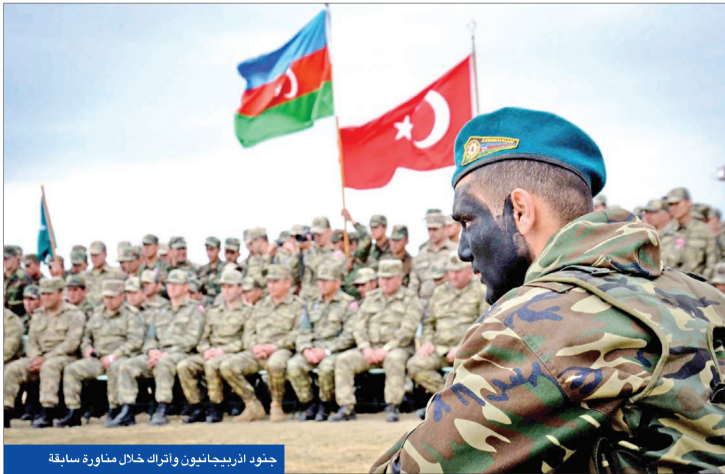
جنود أذربيجانيون واتراك خلال مناورة سابقة

النوية التي تستضيفها فيينا، والمتوقعة منذ يونيو الماضي. وفي وقت سابق، قال المتحدث باسم وزارة الخارجية الأمريكية، إن بلاده «تسعى إلى عودة متبادلة لمتابعة الاتفاق النووي»، لكنه شدد على أنه «إذا طلبت إيران المزيد أو عرض الأقل، فلن نتجج المحادثات».