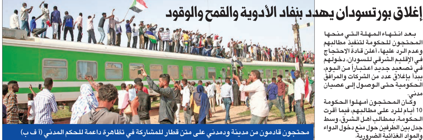
محتجون قادمون من مدينة ودمدني على متن قطار للمشاركة في تظاهرة داعمة للحكم المدني (أ ب)