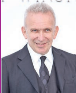
جان بول غوتيه

وينطلق المصمم الفرنسي العالمي، جان بول غوتيه، نحو أفاق جديدة، بعدما ضاق به عالم الأزياء، ولم يعد يرغب في أن يحصر نفسه فيه، ومن هذا المنطلق يتولى هذا الأسبوع تحضير معرض في باريس عن صعود قوة النساء في مجالي السينما والموضة. وقال المصمم (69 عاماً): لقد كنت دائماً نسوي التوجه، أردت أن أظهر تطور المرأة والرجل في السينما والأزياء، حيث اكتسبت المرأة المزيد من السلطة والحرية. ويتولى غوتيه الذي صمم أزياء لأفلام بيدرو المودوفار ولوك بيسون مهمة أمين المعرض الذي يحمل عنوان "سبنيه مود"، ويُفتتح في السينماتيك الفرنسية غداً. ويتناول المعرض موضوع تحرر المرأة من خلال صور وأزياء ومقتنيات من أفلام سينمائية، ويتضمن مواد تتعلق بعدد من النجمات، من أبرزهن مارلين مونرو وبريجيت باردو ومارلين ديتريش وكاترين دونوف وفاني أردان وسواهن. كذلك تشمل المجموعة شخصية السفاحة في فيلم تيتان لجوليا دوكورنو، الفائز بالسعفة الذهبية في مهرجان كان.