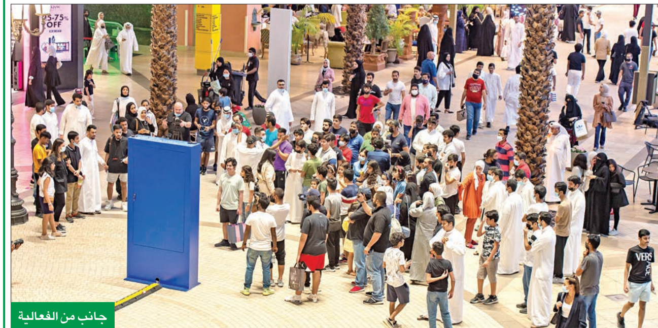
جانب من الفعالية