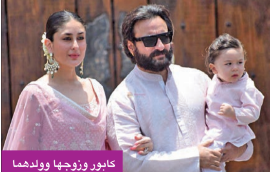
كابور وزوجها وولدهما

نشرت النجمة الهندية كارينا كابور، في صفحتها الخاصة على موقع إنستغرام، مقطعاً طريفاً من إعلان صورته. وكشفت كابور في الفيديو تفاصيل حياتها مع زوجها سيف علي خان وطفلهما واللحظات الطريفة التي تواجهها والمواقف العفوية المضحكة التي يعيشونها. والفيديو جزء من إعلان لأحد المنتجات صورته النجمة التي تمتلك قاعدة جماهيرية واسعة، ويواكب أخبار حياتها الملايين. وتعد كابور من أغنى النجمات في بوليوود، وزوجها صاحب مسيرة طويلة من الأعمال التمثيلية، وتقدر ثروته بالملايين، ولم يكن مستغرباً تقديمه لزوجه خاتماً باهظ الثمن عندما تزوجا عام 2012. ويصل سعر الخاتم، حسبما رجحت الصحف العالمية، إلى نحو 102 ألف دولار وحجرته الأساسية كبيرة جداً.