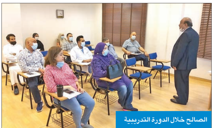
الصالح خلال الدورة التدريبية

كشف رئيس مجلس إدارة الحملة الوطنية للتوعية من مرض السرطان الوطني د. خالد الصالح عن تدريب 2046 ممرضاً وممرضة، و1164 طبيب رعاية أولية، حتى شهر سبتمبر الماضي. وقال الصالح في تصريح صحفي على هامش ختام الحملة من الدورة الـ 74 لتدريب الهيئة التمريضية بالتعاون مع إدارة الهيئة التمريضية بوزارة الصحة، إن حملة «كان» تعاونت أخيراً لتدريب عدد من الممرضين والممرضات في المستشفيات الأهلية، على العلامات الأولية للإصابة بالاورام، وذلك كجانب هام للتشخيص المبكر للأورام في مراحله الأولية، مما يساعد على رفع نسب الشفاء.