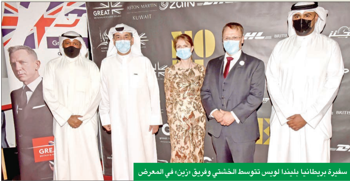
سفيرة بريطانيا بليندا لويس تتوسط الخشتي وفريق «زين» في المعرض

في دفع عجلة الاقتصاد الوطني، وتطوير الحركة الترفيهية في الدولة، فقد حرصت أن تكون داعما رئيسيا لهذا الحدث. وتُدرِك «زين» أهمية دور مؤسسات القطاع الخاص في تشجيع مثل هذه المبادرات التي تدفع من الحركة الترفيهية في الدولة، وتقدم البيئة المناسبة للشباب، خصوصا لكونها إحدى أكبر الشركات الوطنية الرائدة في القطاع الخاص.