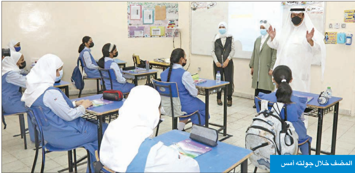
المصفي خلال جولته أمس

والفترات الزمنية بين الحصص حتى نهاية اليوم الدراسي. وأضاف السلطان، في نشرة عممها على مديري عموم المناطق التعليمية الست، أن مهام معلمي المواد غير الأساسية تتضمن أيضاً كل ما يكلف به من الإدارة المدرسية ويدخل في مصلحة العمل. كما أكد إعفاء معلمي المواد الدراسية الأساسية من المهام الإشرافية وكل ما سبق ذكره، وشدد على ضرورة التنسيق بين الإدارة المدرسية مع أقسام المواد العملية لتوزيع المهام بما يحقق العدالة والمساواة.