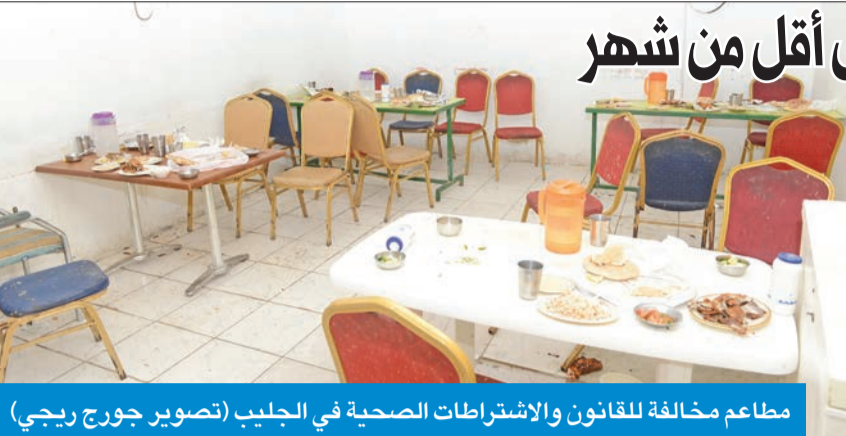
مطاعم مخالفة للقانون والإشراطات الصحية في الجليب

جزءاً منها، سواء على صعيد آلاف العمالة السائبة مخالفات قانوني الإقامة والعمل، الذين يرون فيها مخاباً آمناً وملاذاً لهم، بعيداً عن أعين الجهات الأمنية والحملات التفتيشية، أو على صعيد غياب النظافة، فضلاً عن حيرتات الصرف الصحي، إضافة إلى مئات الأنشطة التجارية من المطاعم التي تقدم أغذية فاسدة من كفلاتها بالقطاعين الأهلي والمنزلي.