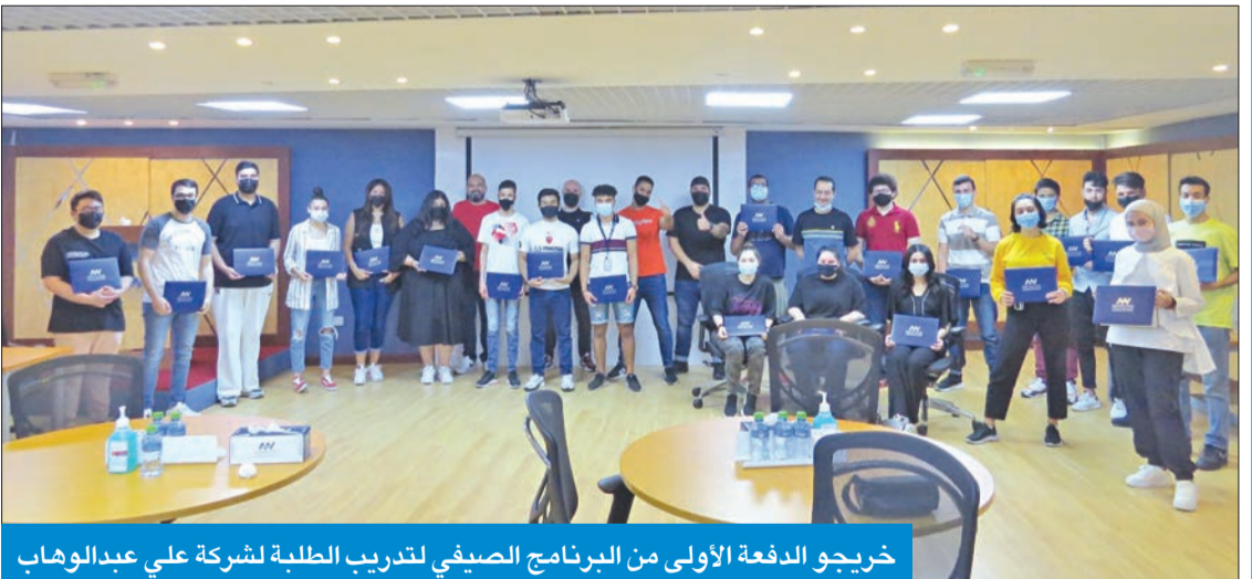
خريجوا الدفعة الأولى من البرنامج الصيفي لتدريب الطلبة لشركة علي عبد الوهاب