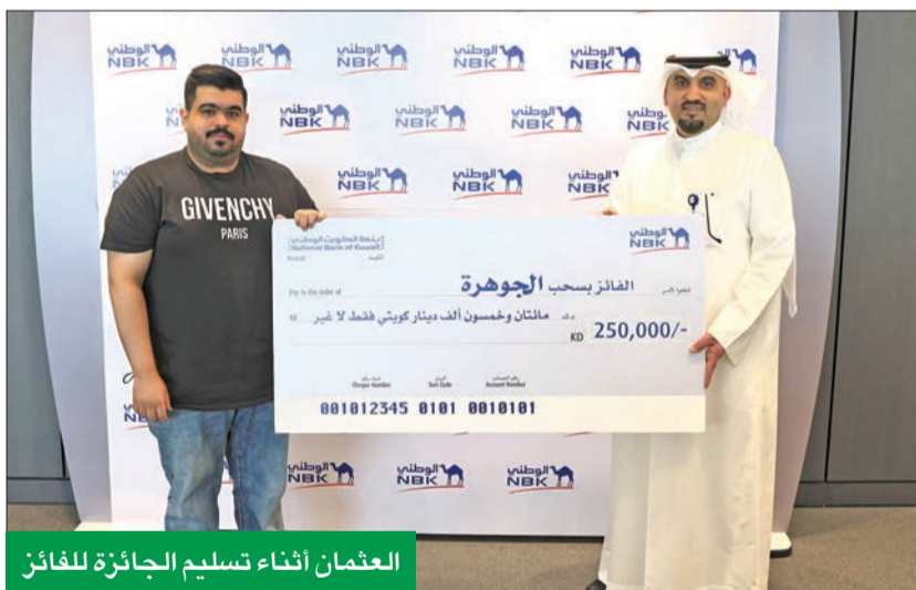
العثمان أثناء تسليم الجائزة للفائز

دينار شهرياً، والجائزة الكبرى بقيمة 250.000 دينار ربع سنوي، حيث إن كل 50 دينار يقوم العميل بإدائها في «الجوهرة» تمنحه فرصة ليكون الفائز التالي. وخلال خدمة الوطني عبر الإنترنت، وخدمة الوطني عبر الموبايل، أو من خلال زيارة أقرب فروع البنك. ويبلغ الحد الأدنى لفتح الحساب 400 دينار، والحد الأقصى للمبلغ الذي يمكن الاحتفاظ به لكل عميل هو 500.000 دينار. وفي حال عدم قيام العميل بعملية سحب نقدي أو تحويل من حساب الجوهرة خلال الفترة المطلوبة، فإن فرص الفوز تتضاعف مقابل كل 50 دينار في الحساب. ويقدم البنك منذ 2012 مكافآت لعملائه من خلال السحوبات الأسبوعية والشهرية وربع السنوية لحساب الجوهرة، بجوائز تبلغ قيمتها الإجمالية 2.200.000 دينار سنوياً.