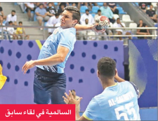
السالمية في لقاء سابق

يسعى فريقا العربي والسالمية للمحافظة على بدايتهما الناجحة في الدوري الممتاز لكرة اليد، عندما يلتقيان في 7:30 من مساء اليوم، ويسبقها في 5:30 مساءً مباراة أخرى لن تقل أهمية بين القادسية والقرين، ضمن الجولة الثانية من المسابقة، وتجرى المبارتان على صالة الشيخ سعد العبدالله بصباح السالم، وفي مباراة العربي والسالمية، يدخل الفريقان نتيجة فوز الأخضر الرابع على الفحيحيل، والسماوي الثالث على القادسية، في الجولة الافتتاحية، ويهدف واحد أيضاً هو الاستمرار على درب الانتصارات والمحافظة على سجلهما خالياً من الهزائم.