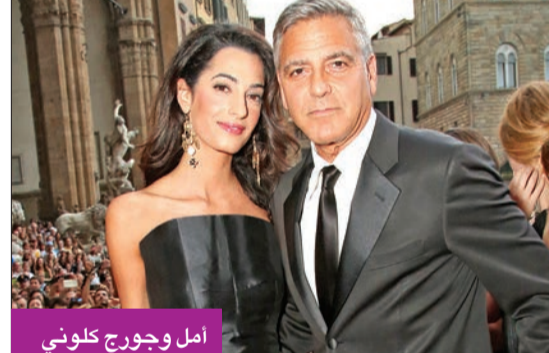
أمل وجورج كلوني

حضر النجم العالمي جورج كلوني وزوجته المحامية اللبانية الأصل أمل علم الدين كلوني العرض الأول لفيلم The Tender Bar لوس أنجلس. ونشرت صحيفة "ديلي ميل البريطانية" صور الحفل وقد تأنق النجم البالغ من العمر 60 عاماً ببذلة إلى جانب زوجته منذ 7 سنوات، أمل، التي تألقت بفستان جميل باللون الأبيض والأسود. وحضرت أيضاً الحفل النجمة العالمية جينيفر لوبيز، ونجم العمل بن أفليك الذي التقط الصور مع كلوني منتج ومخرج الفيلم هو يعتمد على مذكرات عام 2005 التي تحمل الاسم نفسه للمؤلف جيه آر مورينجر. وتدور قصة الفيلم حول صبي نشأ في لونغ أيلاند يحاول تقفي شخصية والده ونك بين الرعاية السكاري في حانة عمه تشارلي، فيما تكافح والدة الطفل لإيصال ابنها لمستقبل أفضل عبر مغادرة منزل والدها المتهدم.