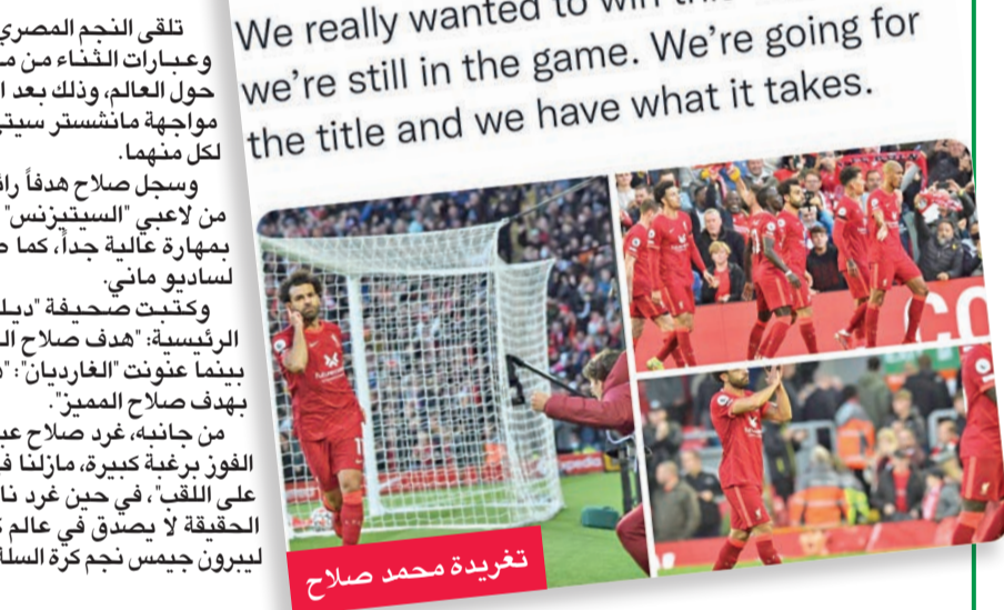
تغريدة محمد صلاح

تلقي النجم المصري محمد صلاح هالة من الإشادة وعبارات الثناء من مختلف الصحف والرياضيين حول العالم، وذلك بعد الأداء المميز الذي ظهر به خلال مواجهة مانشستر سيتي التي انتهت بالتعادل بهدفين لكل منهما. وسجل صلاح هدفاً رائعاً خلال المباراة راوغ فيه عدداً من لاعبي "السيتيزنس" قبل أن يودع الكرة في الشباك بمهارة عالية جداً، كما صنع النجم المصري هدفاً آخر لساديو ماني.