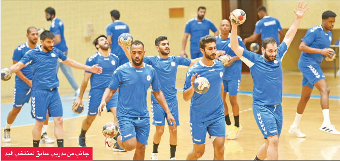
جانب من تدريب سابق لمنتخب اليد

للعبة واللجنة الأولمبية الكويتية ووزارة التربية، وسيكون العمل فيه على محورين؛ الأول تأهيل مدرسي ومدرسات التربية البدنية لتعليم وتدريب كرة اليد، والثاني وجود مراكز لتدريب كرة اليد بالمدارس، تحت إشراف الاتحاد الكويتي للعبة كجهة فنية.