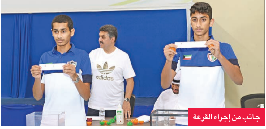
جانب من إجراء القرعة

أوقعت قرعة بطولة كأس الاتحاد لكرة الطائرة، التي جرت أمس الأول، في مقر الاتحاد بصباح السالم، الكويت حامل لقب النسختة الماضية على رأس المجموعة الثانية، وبجانبه أندية كاملة والساحل وبرقان والصليبيخات، بينما جاء فريق القادسية بطل الدوري في الموسم الماضي على رأس المجموعة الأولى، وضمت إلى جانبه العربي والجهراء والشباب والتضامن واليرموك، وستبدأ البطولة في 23 أكتوبر الجاري.