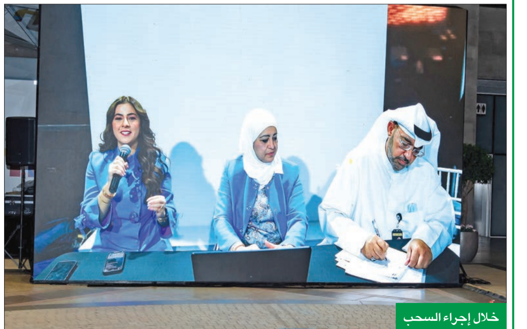
خلال إجراء السحب