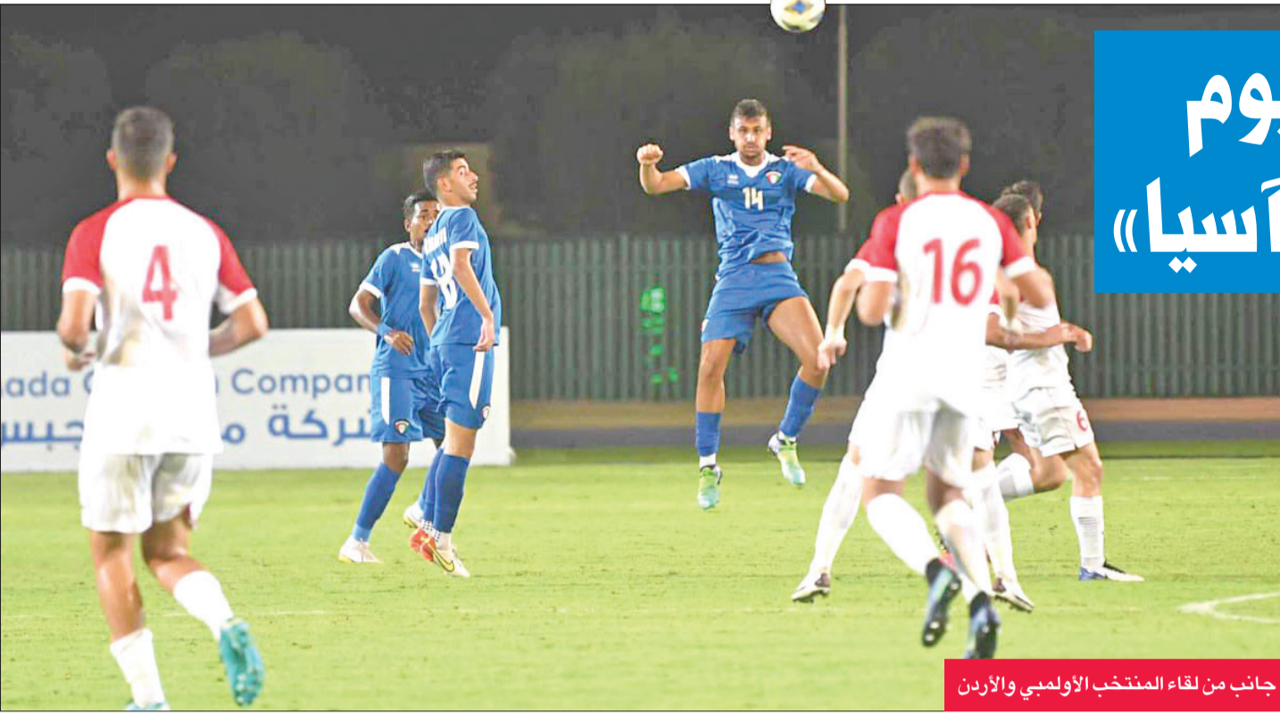
جانب من لقاء المنتخب الأولمبي والأردن