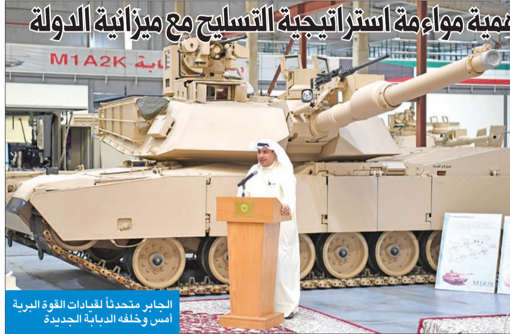
الجابر يتحدثاً لقيادات القوة البرية أمس وخلفه الدبابة الجديدة

فخورون بالكفاءات الوطنية والدبابة M1A2K تأتي في إطار خطة التحديث والتطوير الجارية