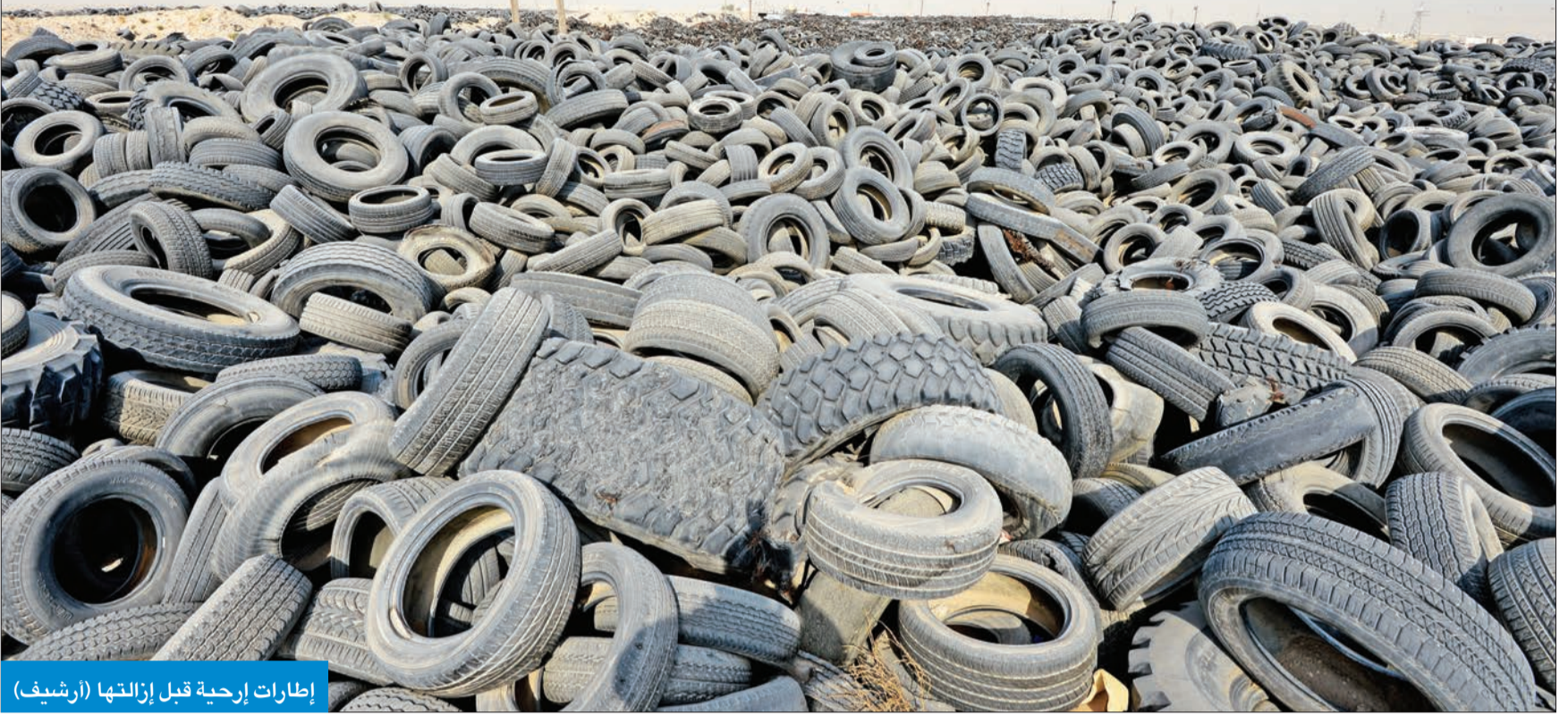
إطارات إرحية قبل إزالتها (أرشيف)

في موقع إرحية، مبيناً أنه تم تصميم الموقع هندسياً وبيئياً ليكون مشروعا متكاملًا يضم مواقع لتخزين الإطارات التالفة ومصانع لتدويرها وتقطيعها والاستفادة منها بدلا من ردمها أو تكديسها مما يشكل خطورة بفعل الحرائق أو غيرها من الحوادث.