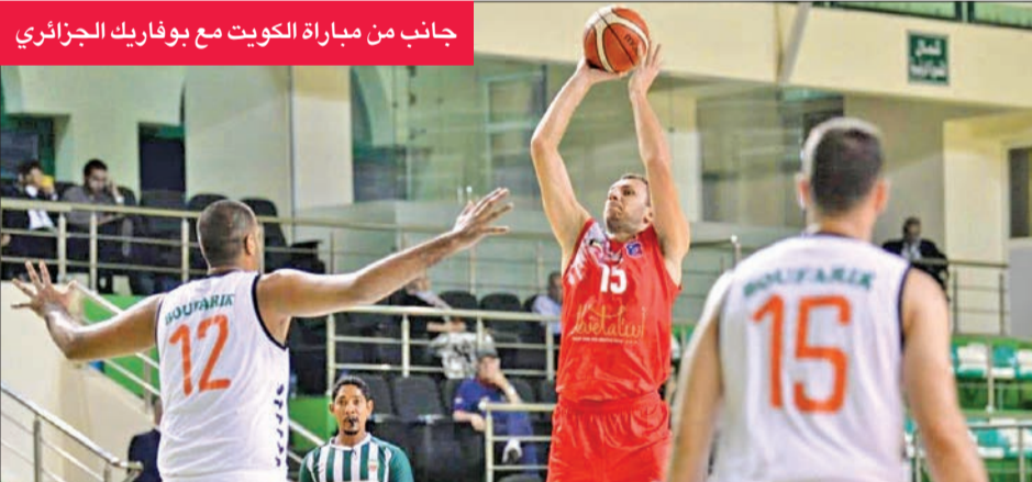
جانب من مباراة الكويت مع بوفاريك الجزائري

يخوض فريق الكويت في 8:30 مساءً اليوم منافسات الدور قبل النهائي للبطولة العربية للأندية لكرة السلة، عندما يلتقي فريق الزهراء التونسي، بينما يلتقي في الجانب الآخر فريقاً الاتحاد السكندري والأهلي المصري، وسيلتقي الفائزان غداً في المباراة النهائية، على أن يلتقي الفريقان الخاسران في مباراة تحديد المركزين الثالث والرابع قبل انطلاق المباراة النهائية.