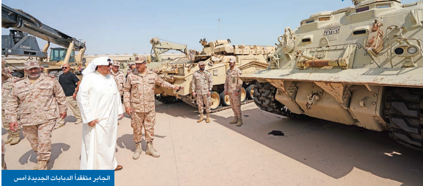
الجابر متفقد الدبابات الجديدة أمس