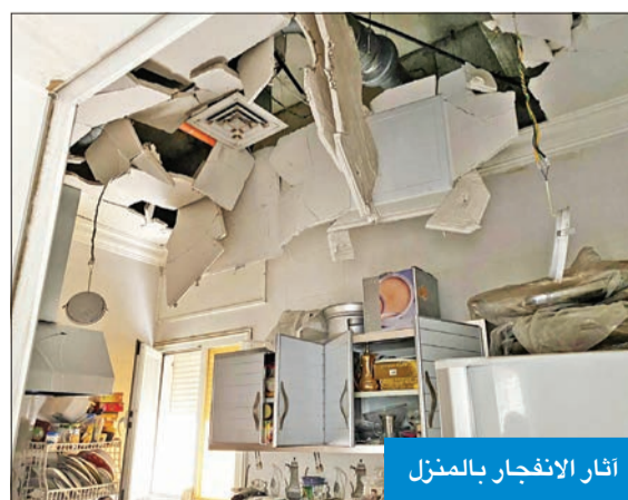
آثار الانفجار بالمنزل

وأضاف الغريب أنه تبين لرجال الإطفاء أن انفجاراً حدث في ثشة بالمنزل الثاني من المنزل نتيجة تسرب غاز الطبخ، وتبين حدوث انهيار بأجزاء من ديكور سقف الثشة، إضافة إلى خلع بعض الأبواب من شدة الانفجار.