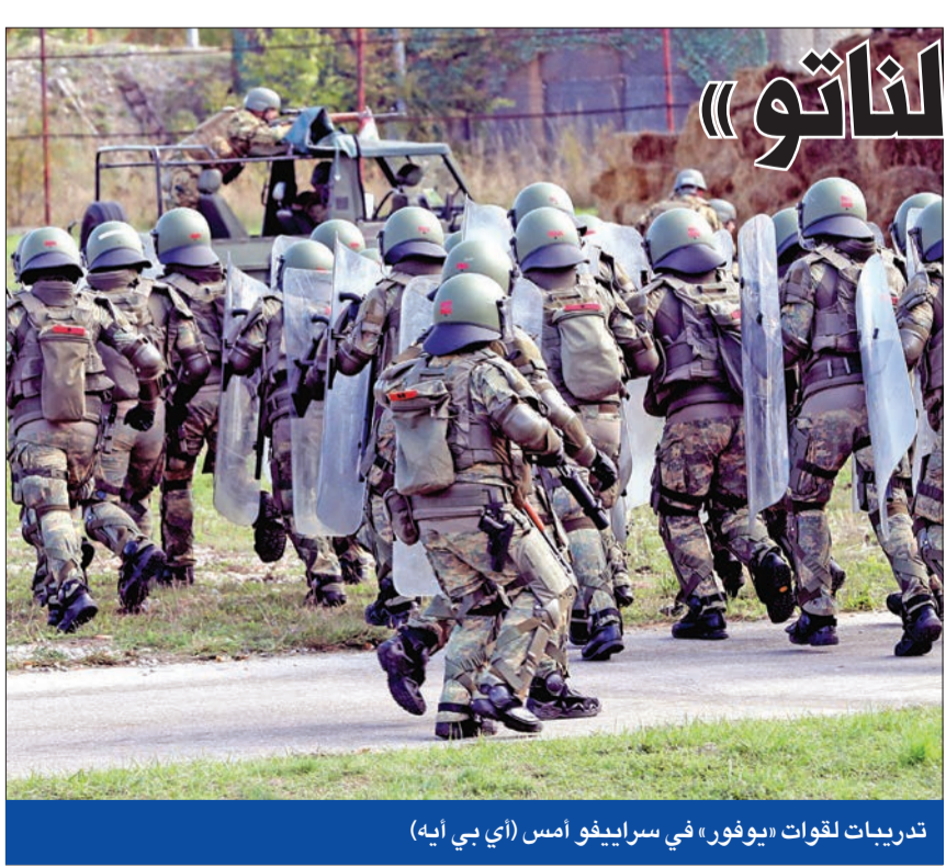
تدريبات لقوات «يوفور» في سراييفو أمس

حذّر الأمين العام لحلف شمال الأطلسي ينس ستولتنبرغ أمس، من أن الخلاف بين باريس «أوكوس» وبين الولايات المتحدة وأستراليا عقداً لشراء غوصات فرنسية تقليدية مقابل حصولها على غوصات تعمل بالطاقة النووية بتكنولوجيا أمريكية في إطار «أوكوس». وعلق ستولتنبرغ في المؤتمر الصحفي على هذه التطورات بالقول، «إنني أتفهم خيبة أمل فرنسا لكنني في الوقت نفسه على ثقة تامة من أن الحلفاء المعنيين سيجدون طريقاً للمضي قدماً». وأشار أيضاً إلى الاجتماع ناقش أيضاً الدروس التي يمكن استخلاصها من أنظار الحلف في أفغانستان على مدى عشرين عاماً، مضيفاً: «لقد بحثنا ضرورة قيام الناتو بدوره للمساعدة في الحفاظ على المكاسب التي تحققت في الحرب على الإرهاب في أفغانستان». وذكر أن الاجتماع كان يمثل