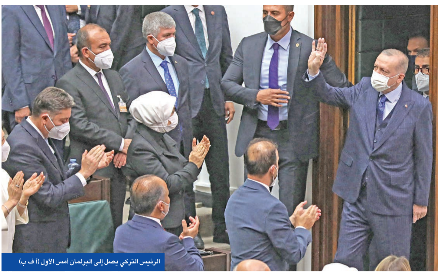
الرئيس التركي يصل إلى البرلمان أمس الأول

مع عودة التوترات في «المتوسط» بين تركيا من جهة وفرنسا واليونان وقبرص من جهة أخرى، رد وزير الخارجية التركي متأخراً عدة أيام بشكل لاذع على تصريح الرئيس الفرنسي إيمانويل ماكرون عن الجزائر، والذي تطرق فيه إلى الوجود العثماني.