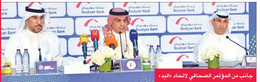
جانب من المؤتمر الصحافي لاتحاد «اليد»