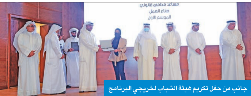
جانب من حفل تكريم هيئة الشباب لخريجي البرنامج

العمل المدرج في خطة الدولة الإنمائية، التي تعمل على إعداد برامج متكاملة لتنفيذها ضمن مشاريع السياسة الوطنية للشباب التي أقرها مجلس الوزراء في إطار إنجاز المشاريع والبرامج التي ترتبط برؤية «كويت جديدة 2035».