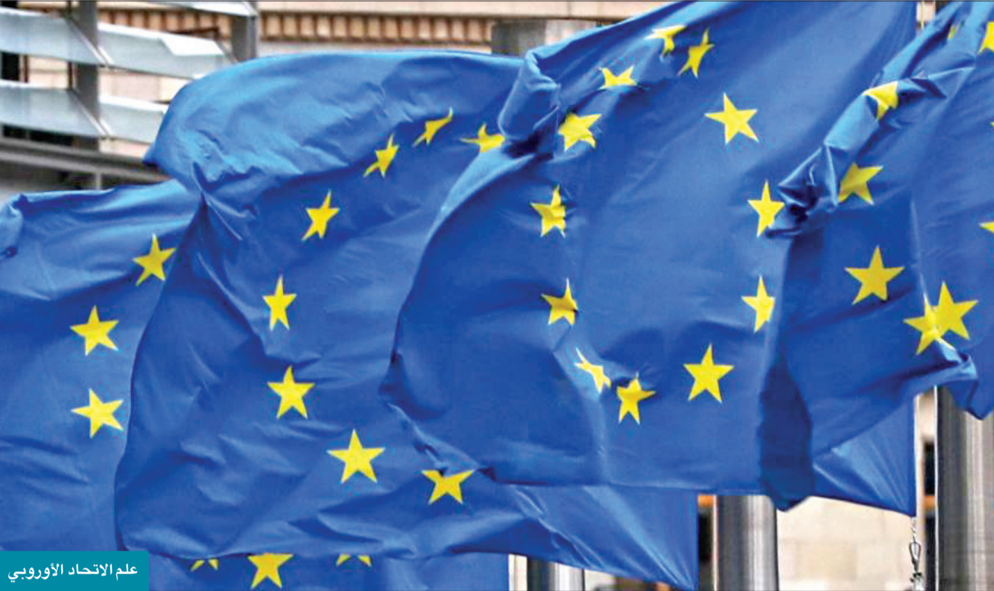
علم الاتحاد الأوروبي

شددت أحزاب اليمين المتطرف على الشؤون الوطنية حصراً، مما أدى إلى نشر الحذر وسط الناخبين.