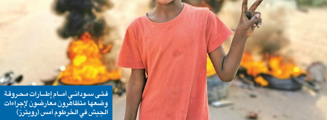
فتى سوداني أمام إضرابات محروقة وضعها متظاهرون معارضون لإجراءات الجيش في الخرطوم أمس

دخل السودان منعطفاً خطيراً، أعاد الأمور إلى المربع الذي كانت فيه عشية إطاحة الرئيس السابق عمر البشير عام 2019. وعقب أشهر من الخلافات بين مكونات المرحلة الانتقالية، قبض الجيش على السلطة بالكامل، وأعلن القائد العام للقوات المسلحة الفريق أول عبدالفتاح البرهان، أمس، حالة الطوارئ العامة في جميع أنحاء البلاد، وحل مجلسي السيادة والوزراء، اللذين انبثقا عن اتفاق بين الجيش والقوى المدنية لتقاسم إدارة مرحلة انتقالية تنتهي بإجراء