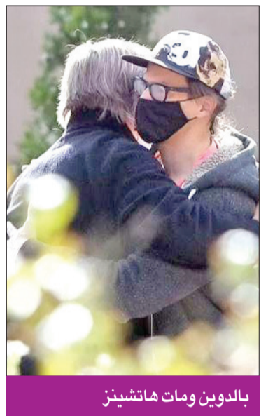
بالدوين ومات هاتشينز