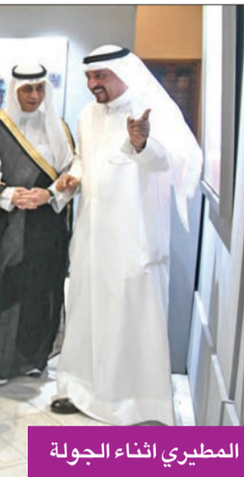
المطيري أثناء الجولة

انطلقت فعاليات بيت الموسيقى والمعرض الدائم للفنون التشكيلية في متحف الفن الحديث بجولة وزير الإعلام والثقافة وزير الدولة لشؤون الشباب عبدالرحمن المطيري شاهد خلالها الأعمال الفنية الإبداعية لفناني الكويت، وكان بصحبته قيادات المجلس الوطني للفنون والآداب وبقاعة من الفنانين والإعلاميين. وأقيمت الجولة كلمة الافتتاح القاها وزير الإعلام، قال فيها، إن الهدف من افتتاح بيت الموسيقى والمعرض الدائم للفنون التشكيلية المساهمة برفع الذائقة الفنية وإضاءة الساحة الثقافية بالإنتاج الفني الإبداعي وإبراز الطاقات البشرية في مجال الفنون، مؤكداً أن «بيت الموسيقى» و«المعرض» هما حاضنة للفن