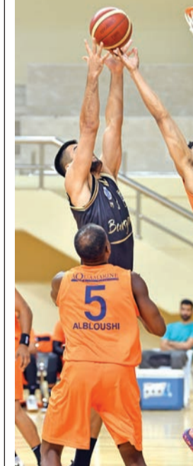
صراع تحت السلة

واصل الفريق الأول لكرة السلة بنادي الجهراء انطلاقته في الدوري الممتاز للعبة بتغلبه على القرين بنتيجة 90-78 في المباراة التي جمعتها، أمس الأول، على صالة الاتحاد بجمع الشيخ سعد العبدالله الرياضي ضمن منافسات الجولة الثانية من الدوري، التي شهدت فوزاً سهلاً لكاظمة على برقان بنتيجة 106-83.