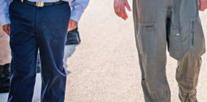
قائد سلاح الجو الإماراتي اللواء الركن إبراهيم ناصر العلوي يصل لإسرائيل في إطار تمرين «العلم الأزرق» أمس

تل أبيب تشن أول غارة على سوريّة بعد تفاهم بينت - بوتين