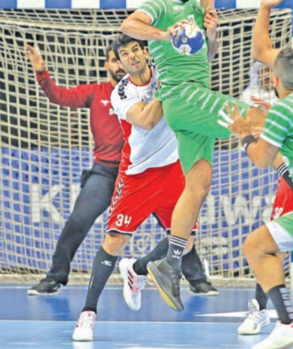
جانب من مباراة الكويت والعربي