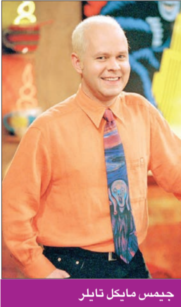
جيمس مايكل تايلر

رحل الممثل جيمس مايكل تايلر، الذي أدى دور مدير العقلي غانتر في المسلسل الشهير "Friends"، عن 59 عاماً، بعد أن خسر معركته مع السرطان بعد 3 سنوات من اكتشاف إصابته. وقال Warner Bros. TV، في بيان رئائه، إن "العالم عرفه بدور غانتر (الصديق السابع) في مسلسل Friends، لكن محبيه عرفوه ممثلاً وموسيقياً ومناصراً يذكي الوعي بمرض السرطان وزوجاً محباً". وشارك تايلر في نحو 150 حلقة من المسلسل الشهير على امتداد مواسمه العشرة، مؤدياً دور مدير مقهى "سنترال برك"، حيث عهد الأصدقاء على الاجتماع، ومغازلاً ريتشل (جينيفر أنيستون)، ومثل أيضاً في مسلسلات أخرى، منها "سكرايز" و"سابرينا ذي تينايدج ويتش" و"موردن ميوزيك".