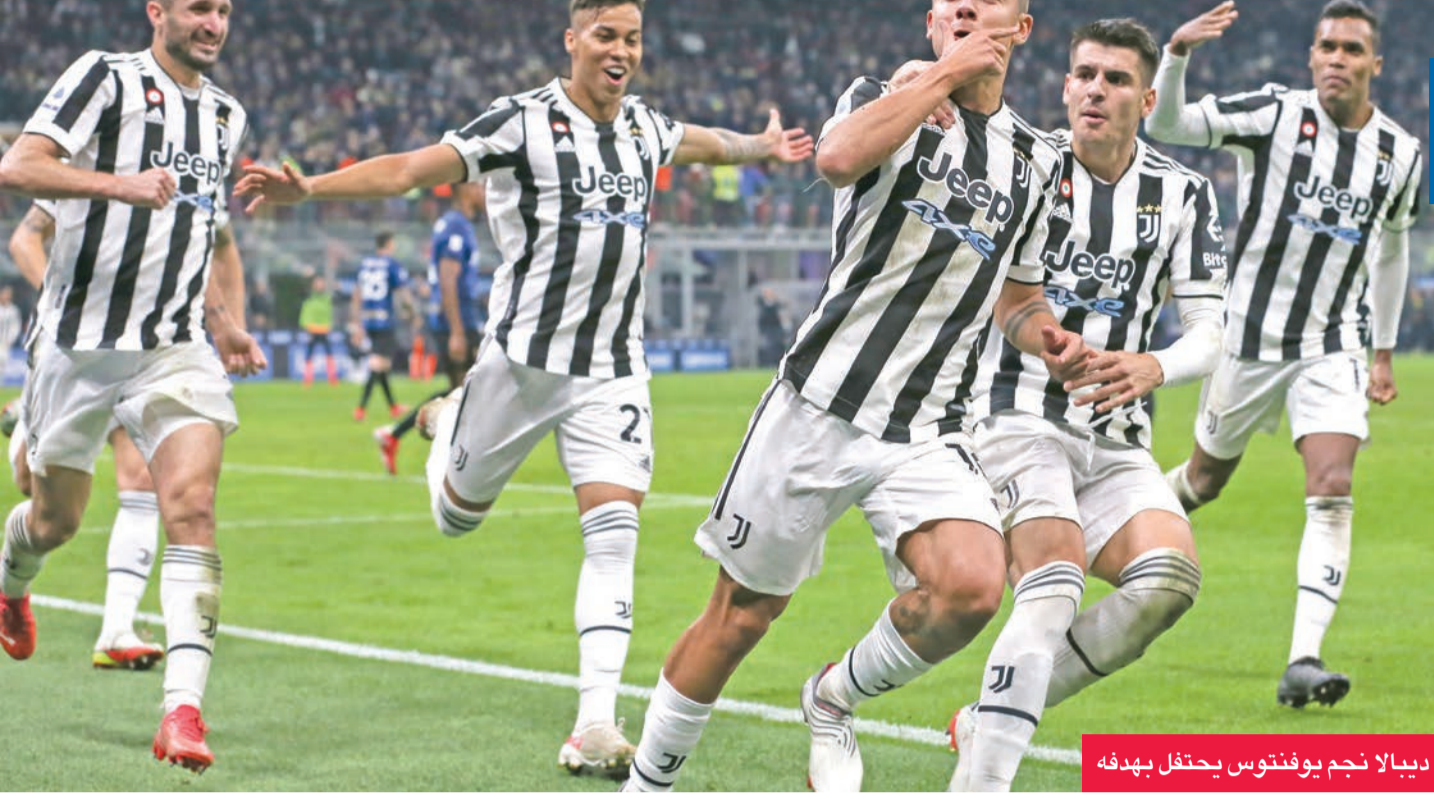
ديبالا نجم يوفنتوس يحتفل بهدفه

لتخطي تورينو للمرة السادسة توالياً على صعيدى الدوري وال كأس، لاسيما بعد استعادة نجمه المخضرم زلاتان إبراهيموفيتش الذي، وبعدهما أهدى بولونيا السبت هدف تقلص الفارق 1-2 بتسجيله بالخفا في مرعى فرقة، عاد وسجل هدف تأكيد الفوز 2-4 خارج الديار بهدف في الدقيقة 89.