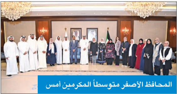
المحافظ الأصفر متوسطاً المكرمين أمس

أكد محافظ حولي علي الأصفر أهمية الدور الذي يقوم به القطاع الصحي في المحافظة على صحة المواطنين والمقيمين، وذلك خلال تكريمه مدير المنطقة الصحية بالمحافظة وعدد من مديري المستشفيات والكوادر الصحية فيها بديوان عام المحافظة أمس. وأشاد محافظ حولي بالجهود المخلصة التي قام بها القطاع الصحي خلال جائحة كورونا، والتي أزهقت العالم، مؤكداً على مد يد العون للقطاعات الصحية كافة في البلاد، وضرورة التعاون لإزالة كل المعوقات التي قد تعرقل مسيرتهم من أجل الحفاظ على صحة المجتمع.