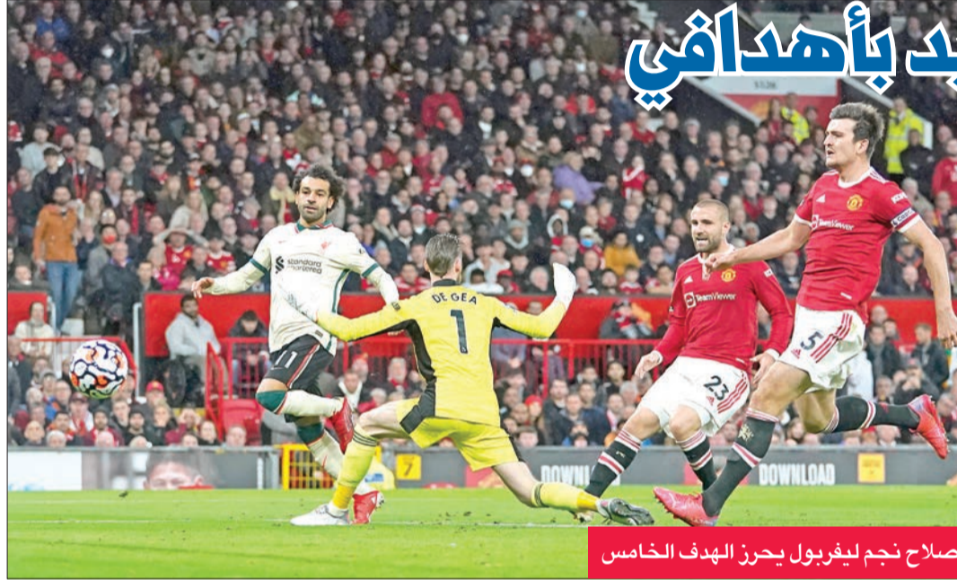
صلاح نجم لليفربول يحرز الهدف الخامس

مازال النرويجي أولي غونار سولشاير، مدرب فريق مانشستر يونايتد، مقتنعاً أنه الرجل المناسب في هذا المنصب، رغم الخسارة التاريخية التي تلقاها فرقة صفر 5- أمام ضيفه لليفربول، أمس الأول في قمة مباريات المرحلة التاسعة لبطولة الدوري الإنجليزي الممتاز لكرة القدم.