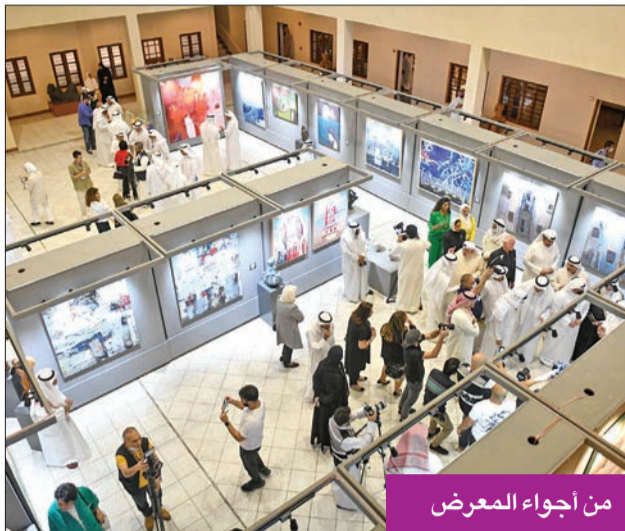
من أجواء المعرض