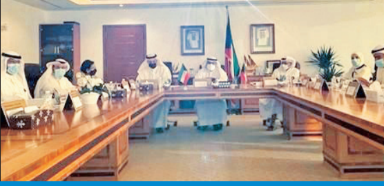
الفارس مترئسا اجتماع مجلس الجامعات الحكومية

بحث مجلس الجامعات الحكومية في اجتماعه السابع، الذي عقد أمس الأول، تقرير فريق عمل إعداد دراسة بخصوص تصنيف جامعة الكويت، والتقارير الأولى لأعمال المجلس التأسيسي لجامعة عبدالله السالم. وهنا وزير النفط وزير التعليم العالي، رئيس مجلس الجامعات الحكومية د. محمد الفارس، في تصريح صحفي، عقب رئاسته الاجتماع، منتسبي جامعة الكويت بمناسبة بداية العام الدراسي، وعودة الدراسة بنظامي التعليم الحضوري وعن بُعد، وفق الاشتراطات الصحية، بعد انقطاع دام نحو عام ونصف العام.