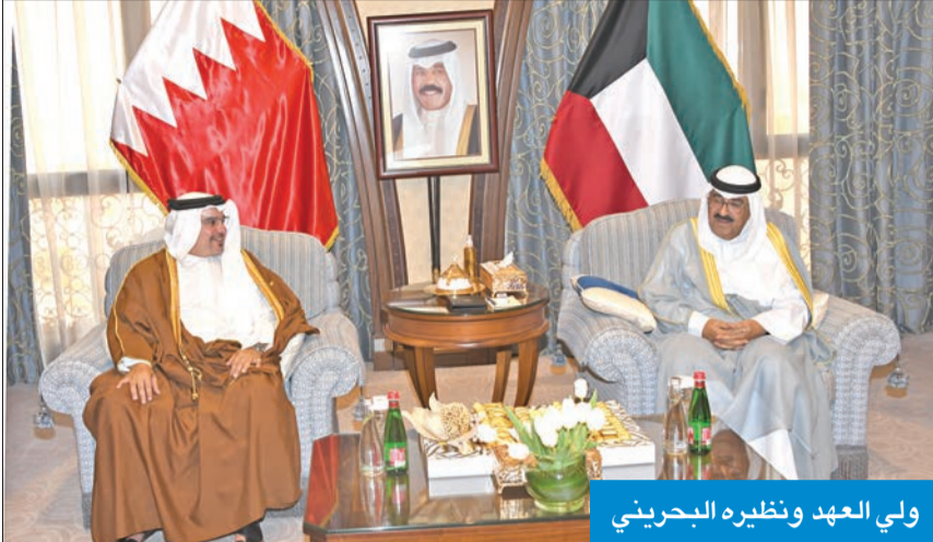
ولي العهد ونظيره البحريني