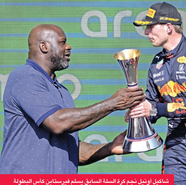
شاكيل أونيل نجم كرة السلة السابق يسلم فيرستابن كأس البطولة

تفوق سائق ريد بول الهولندي ماكس فيرستابن على بطل العالم سائق مرسيدس البريطاني لويس هاميلتون وابتعد في صدارة الترتيب العام، بعد فوزه بجائزة الولايات المتحدة الكبرى، الجولة السابعة عشرة من بطولة العالم للفورمولا واحد، أمس الأول، على حلبة الأميركتين في أوستن (تكساس).