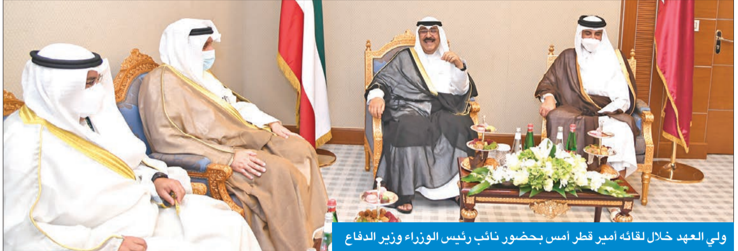
ولي العهد خلال لقائه أمير قطر أمس بحضور نائب رئيس الوزراء وزير الدفاع

المقبلة في إطار رؤية البلدين «الكويت 2035»، و«المملكة 2030»، ولتحقيق المزيد من التعاون على مختلف الصعد الاقتصادية والأمنية والثقافية والرياضية والاجتماعية، واستثمار قدراتهم، ومن ذلك توقيع الاتفاقية الملحة باتفاقيتي الصحة وموفور العافية وللشعب القطري الشقيق بمزيد من التقدم والأزدهار. وجرى خلال اللقاء استعراض العلاقات الأخوية الوطيدة بين البلدين وسبل دعمها وتعزيزها لما فيه مصلحة البلدين والشعبين الشقيقين، إضافة إلى مناقشة أبرز المستجدات على