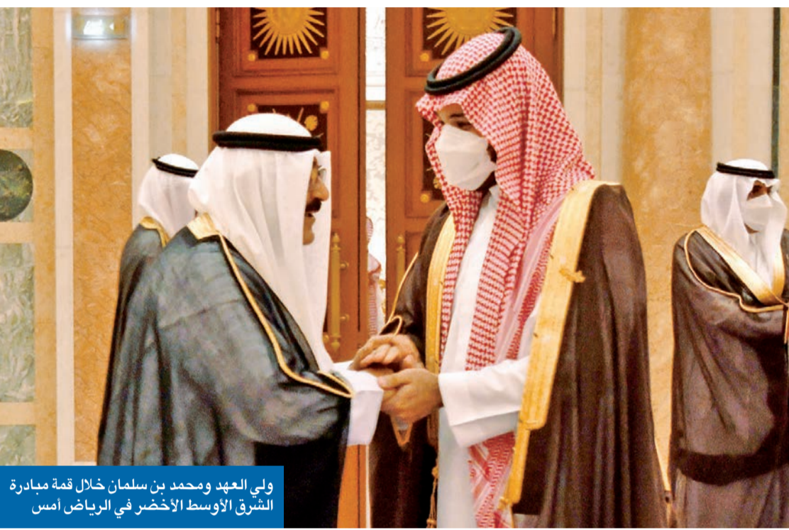
ولي العهد ومحمد بن سلمان خلال قمة مبادرة الشرق الأوسط الأخضر في الرياض أمس

أكد سمو ولي العهد الشيخ مشعل الأحمد أن «الكويت كانت ولا تزال في طليعة الدول الساعية إلى تحقيق الاستدامة البشرية والبيئية، وشريكة دائمة لكل ما من شأنه تنسيق الجهود الإقليمية والدولية في مكافحة التغير المناخي العالمي»، معلناً «دعم الكويت الكامل لجهود شقيقتها الكبرى السعودية وما طرحته من حزمة مبادرات لحماية البيئة وتبنتها بحسن إدارة هذا الملف الحيوي بإشراف صاحب السمو الملكي ولي العهد السعودي الأمير محمد بن سلمان، كما تؤكد التزامها بما يتفق عليه في ضوء إمكاناتها ومواردها، ولن تدخر جهداً أو دعماً أو امتثالاً لتحقيق التوصيات التي تتوصل إليها، قمة «مبادرة الشرق الأوسط الأخضر». وذكر سموه، في كلمة خلال افتتاح القمة بالعاصمة السعودية الرياض أمس، أن القمة التي ترأسها بن سلمان بحضور خليجي ودولي واسع، «تأتي في ظروف استثنائية، حيث تبرز حاجة العالم أجمع إلى خطط الاستدامة والاهتمام بالمناخ والبيئة والاقتصاد»، لافتاً إلى أنه «لم يعد يخفى على أحد أن استمرار التغير المناخي يقودنا إلى سلسلة من الكوارث بما في ذلك حرائق الغابات والفيضانات ودمار المحاصيل الزراعية والجفاف وشح المياه». وأضاف سموه أن دعوة السعودية لإطلاق هذه المبادرة «نابع من دورها المحوري المسؤول في المنطقة والعالم أجمع لإرساء